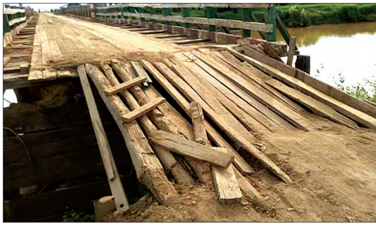
ကြုံတွေ့နေရသည့်အတွက် တာဝန်ရှိသူများအနေဖြင့် အမြန်ဆုံးပြုပြင်ပေးပါရန် ပြည်သူများမျှော်လင့်လျက် ရှိကြောင်း သိရသည်။ (မြို့နယ် ပြန်/ဆက်)

ထီးချိုင့်မြို့၏ အနောက်တောင်ဘက် ၆ မိုင်ခန့်အကွာ ဒိုးပင်ရွာနှင့် မိချောင်းအိုင်ရွာအနီး မဲဇာချောင်းကို ဖြတ်သန်းဖောက်လုပ် ထားသော မဲဇာချောင်းတံတားသည် ရေတိုက်စားမှုကြောင့် ချဉ်းကပ်လမ်းဝဲယာတွင် မြေများပြိုကျပြီး ခရီးသွားပြည်သူများ သွားလာရေးခက်ခဲနေကြောင်း သိရသည်။