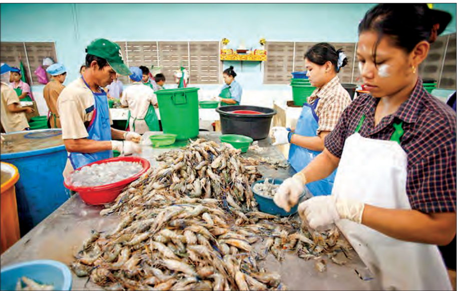
ထိုင်းနိုင်ငံရောက် ရွှေပြောင်းမြန်မာအလုပ်သမားများ အလုပ်လုပ်ကိုင်နေကြသည်ကိုတွေ့ရစဉ်။

သက်တော် ၈၈ နှစ်ရှိသော ထိုင်းနိုင်ငံဘုရင်ကြီး ဘူမိဘော အနုရာဒေချိ အောက်တိုဘာ ၂၀ ရက် ဒေသစံတော်ချိန် ညနေ ၃ နာရီ ၅၂ မိနစ်က နတ်ရွာစံ ကံတော်ကုန်ခဲ့သောကြောင့် ထိုင်းနိုင်ငံအတွင်း ရောက်ရှိနေကြသည့် ရွှေပြောင်းမြန်မာအလုပ်သမားများမှာ ထိုင်းနိုင်ငံ၏ နိုင်ငံရေးအခြေအနေနှင့် စီးပွားရေးအခြေအနေ မတည်ငြိမ်မှုများဖြစ်ပေါ်မည်ကို စိုးရိမ်လျက်ရှိပြီး ထိုင်းနိုင်ငံသုံးဘက် ငွေပေးနှုန်းများကျဆင်းမည်ကို စိုးရိမ်နေကြကြောင်း သိရသည်။ ဘုရင်ကြီးနတ်ရွာစံ ကံတော်ကုန်ခဲ့ပြီးနောက် ထိုင်းနိုင်ငံအတွင်း လာမည့်အနာဂတ်ကာလ၌ ဖြစ်ပေါ်လာမည့် အရေးကိစ္စရပ်များအတွက် ထိုင်းရောက် မြန်မာအလုပ်သမားများနှင့် အလုပ်သမားကူညီ စောင့်ရှောက်ရေးအဖွဲ့များ၏အမြင်နှင့် ခံစားသုံးသပ်ချက်များကို ဆက်သွယ် မေးမြန်း ဖြစ်ခဲ့သည်။