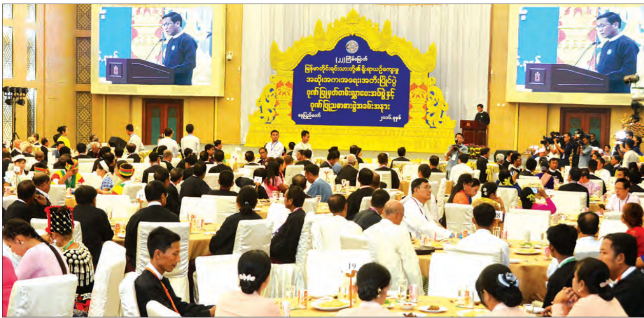
ဒုတိယသမ္မတ ဦးဟင်နရီဗန်ထီးယူ (၂၂) ကြိမ်မြောက် မြန်မာတိုင်းရင်းသားတို့၏ ရိုးရာယဉ်ကျေးမှု အဆို အက၊ အရေး၊ အတီးပြိုင်ပွဲ ဂုဏ်ပြုမှတ်တမ်းလွှာပေးအပ်ပွဲနှင့် ဂုဏ်ပြုညစာစားပွဲ အခမ်းအနားတွင် ဂုဏ်ပြုအမှာစကားပြောကြားစဉ်

အခမ်းအနားတွင် ဒုတိယသမ္မတ ဦးဟင်နရီဗန်ထီးယူက လူမျိုးတစ်မျိုး၏ နေထိုင်မှု၊ စားသောက်မှု၊ ဝတ်စားဆင်ယင်မှု၊ ပြုမူပြောဆိုမှု စသည့်လေ့ထုံးတမ်းများသည် ယင်းလူမျိုး၏ ယဉ်ကျေးမှုဖြစ်ပါကြောင်း၊ နိုင်ငံတစ်နိုင်ငံ၏ သမိုင်းကြောင်းရှည်လျားမှုနှင့် လူမျိုးတစ်မျိုး၏ ဂုဏ်သိက္ခာမြင့်မားမှုတို့ကို တိုင်းတာရာတွင် ယဉ်ကျေးမှုမျက်နှာစာသည် အရေးပါသည်ကဏ္ဍက ပါဝင်နေသည်ကို အားလုံးသိရှိပြီးဖြစ်ပါကြောင်း၊