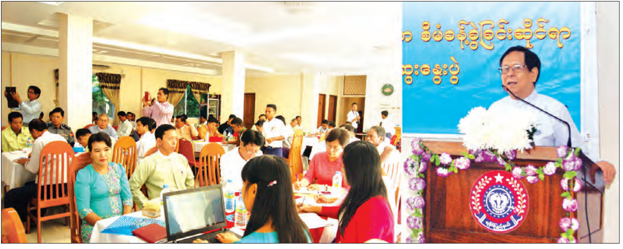
အမျိုးသားလွှတ်တော် ဒုတိယဥက္ကဋ္ဌ ဦးအေးသာအောင် ရေလုပ်ငန်းနှင့် သယံဇာတစီမံခန့်ခွဲရေး အလုပ်ရုံဆွေးနွေးပွဲ၌ အမှာစကားပြောကြားစဉ်

အဆိုပါအခမ်းအနားတွင် အမျိုး သားလွှတ်တော် ဒုတိယဥက္ကဋ္ဌ ဦးအေးသာအောင်က မြန်မာနိုင်ငံ ငါးလုပ်ငန်းအခြေအနေနှင့် ဖွံ့ဖြိုး တိုးတက်ရေးဆိုင်ရာ အချက်အလက်များ ကို ပြောကြားခဲ့ကြောင်း သိရသည်။ ဆက်လက်၍ ပြည်နယ်စိုက်ပျိုးရေး၊ မွေးမြူရေး၊ သစ်တောနှင့် သတ္တုတွင်း ဝန်ကြီးက ရေလုပ်ငန်းနှင့် သယံဇာတ၏ ရေအောက်မြေအောက် သဘာဝ သယံဇာတများ၏ ကောင်းကျိုး ဆိုးကျိုး များကို ပြောကြားကာ တက်ရောက်လာ သူများ၏မေးမြန်းချက်များကို ပြန်လည် ဖြေကြားခဲ့ကြောင်း သတင်းရရှိသည်။