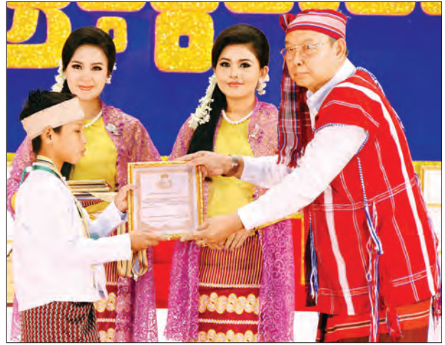
ပြည်ထောင်စု လွှတ်တော်နာယက၊ အမျိုးသားလွှတ်တော်ဥက္ကဋ္ဌ မန်းဝင်းခိုင်သန်း ခေတ်ဟောင်း/ကာလပေါ် အဆိုပြိုင်ပွဲ အခြေခံပညာအဆင့် (၁၅-၂၀)နှစ် (ကျား) ပထမဆုရ ရခိုင်ပြည်နယ်မှ မောင်ပြည့်စည်သူမြိုးအား ဂုဏ်ပြုဆုနှင့် ဂုဏ်ပြုမှတ်တမ်းလွှာ ပေးအပ်ချီးမြှင့်စဉ် (သတင်းစဉ်)

ကျေးမှု အဆို၊ အက၊ အရေး၊ အတီးပြိုင်ပွဲများကို စဉ်ဆက်မပြတ် ကျင်းပနေခြင်းသည် တိုင်းရင်းသားများ၏ ရိုးရာယဉ်ကျေးမှု အနုပညာများကို ထိန်းသိမ်းခြင်းအပြင် တိမ်မြုပ်ပျောက်ကွယ် မသွားသင့်သော အမွေအနှစ်များ စဉ်ဆက်မပြတ် ထွန်းကားပြန့်ပွားစေလိုသည့် ရည်ရွယ်ချက်များ ပါရှိသကဲ့သို့ ယခုပြိုင်ပွဲကြီးသည် လူမျိုးတစ်မျိုး၊ တိုင်းဒေသကြီးနှင့် ပြည်နယ်တစ်ခုအတွက် သက်သက်မဟုတ်ဘဲ ဒီနိုင်ငံ၊ ဒီဇရာ၊ ဒီမြေပေါ်ရှိ တိုင်းရင်းသားအားလုံး၏ ရိုးရာဓလေ့ထုံးစံများ၊ အနုပညာများကို အညီအမျှ ထွန်းကားစေရန် ရည်ရွယ်ကျင်းပနေခြင်း ဖြစ်ပါကြောင်း။