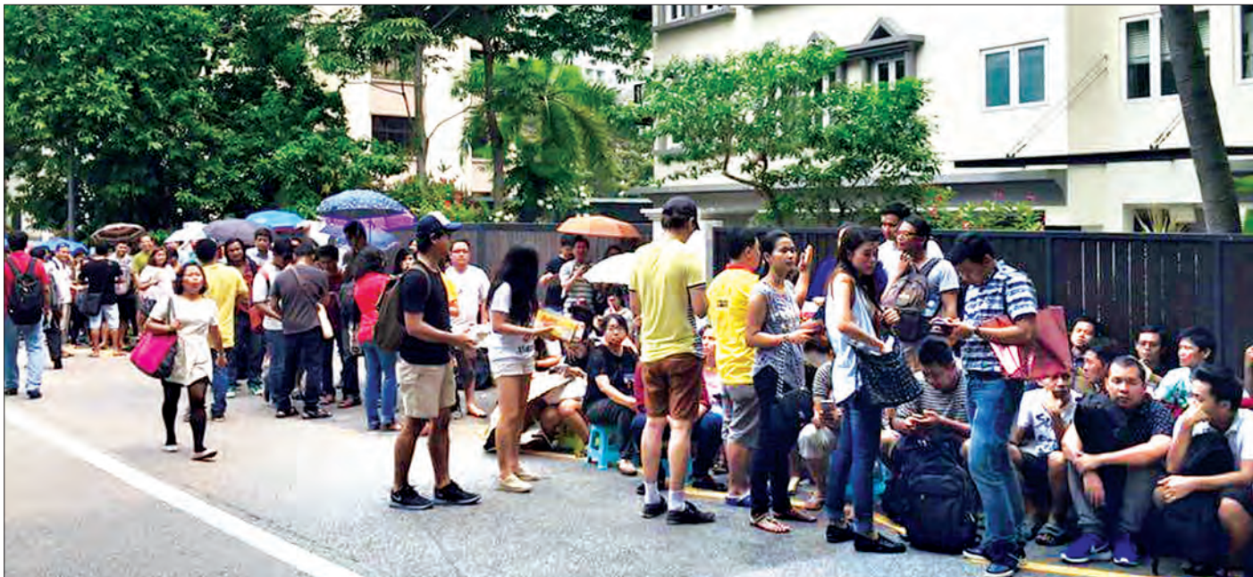
စင်ကာပူနိုင်ငံရှိ မြန်မာနိုင်ငံဆိုင်ရာသံရုံးရှေ့မှ မြန်မာအလုပ်သမားများကို အောက်တိုဘာ ၂၄ ရက်က တွေ့ရစဉ်

သတင်း-ခင်ရတနာ၊ ဓာတ်ပုံ - မေဦးမိုး၊ ရွှေမြန်မာဂျာနယ် နေပြည်တော် အောက်တိုဘာ ၂၅ ပြည်ပနိုင်ငံသို့ ယခင်ကတည်းက ရောက်ရှိအလုပ်လုပ်ကိုင်နေ သည့် အလုပ်သမားများ၊ ထိုင်နိုင်ငံ၌ နိုင်ငံတော်အစီအစဉ်ဖြင့် အထောက်အထား ထုတ်ပေးထားသည့် ယာယီနိုင်ငံကူး လက်မှတ်၊ မည်သူမည်ဝါဖြစ်ကြောင်း၊ သက်သေခံလက်မှတ် ကိုင်ဆောင်ထားသော အလုပ်သမားများနှင့် ပြည်ပနိုင်ငံများမှ ခွင့်ပြုပြန်လာကြောင်း ခိုင်မာသည့်အထောက်အထားပြနိုင် သည့် အလုပ်သမားများသည် ၂၀၁၇ ခုနှစ် ဇန်နဝါရီ ၁ ရက်တွင် စတင်ကျင့်သုံးမည့် Passport for Job အစီအစဉ်ဖြင့် သွားရောက်လုပ်ကိုင်ရမည့် သတ်မှတ်ချက်တွင် အကျုံးဝင်မှု မရှိကြောင်း အလုပ်သမား၊ လူဝင်မှုကြီးကြပ်ရေးနှင့် ပြည်သူ့ အင်အားဝန်ကြီးဌာနမှ သိရှိရသည်။ ပြည်ပနိုင်ငံများသို့ တရားဝင်သွားရောက်မည့် အလုပ် သမားအသစ်များမှာမူ ၂၀၁၇ ခုနှစ် ဇန်နဝါရီ ၁ ရက်မှစတင်ကာ ပြည်ထဲရေးဝန်ကြီးဌာနက ထုတ်ပေးသည့် နိုင်ငံကူးလက်မှတ် အမျိုးအစားများအနက်မှ အလုပ်အကိုင် နိုင်ငံကူးလက်မှတ် PJ (passport for Job) ဖြင့်သာ သွားရောက်လုပ်ကိုင်ရမည် ဖြစ်ကြောင်း သိရသည်။ စာမျက်နှာ ၁၁ ကော်လံ ၅