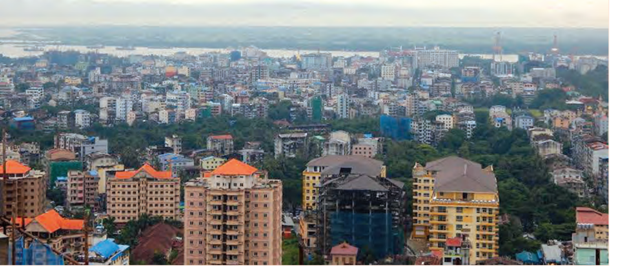
ရန်ကုန်မြို့မှ အိမ်ရာအဆောက်အအုံများ

အဆိုပါ အလုပ်ရုံဆွေးနွေးပွဲတွင် တိုင်းဒေသကြီးနှင့် ပြည်နယ်အသီးသီးမှ အိမ်ခြံ မြေလုပ်ငန်းရှင်များ၊ အကျိုးဆောင်များက အိမ်ခြံမြေအကျိုးဆောင်များ၏ အရည် အချင်းများ၊ တာဝန်များ၊ လုပ်ဆောင်မှုများ၊ အကျိုးခံစားခွင့်များ၊ တာဝန်ခံမှုများ၊ ပြည်သူများအတွက် အိမ်ခြံမြေဝန်ဆောင်မှုများကို မည်သည့်အတိုင်းအတာအထိ လုပ်ဆောင်ရမည်ဟူသည့်အချက်များ၊ အိမ်ခြံမြေအကျိုးဆောင်ခ သတ်မှတ်ချက်များ