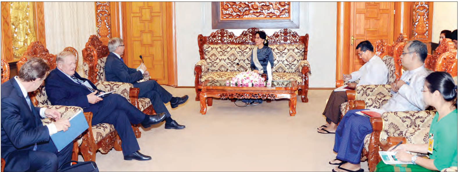
နိုင်ငံတော်၏အတိုင်ပင်ခံပုဂ္ဂိုလ် နိုင်ငံခြားရေးဝန်ကြီးဌာန ပြည်ထောင်စုဝန်ကြီး ဒေါ်အောင်ဆန်းစုကြည် နော်ဝေနိုင်ငံ ဝန်ကြီးချုပ်ဟောင်းနှင့် Oslo Center for Peace and Human Rights ဥက္ကဋ္ဌ Mr.Kjell Magne Bondevik အား လက်ခံတွေ့ဆုံစဉ်

နေပြည်တော် အောက်တိုဘာ ၂၅ နိုင်ငံတော်၏အတိုင်ပင်ခံပုဂ္ဂိုလ် နိုင်ငံခြားရေးဝန်ကြီးဌာန ပြည်ထောင်စုဝန်ကြီး ဒေါ်အောင်ဆန်းစုကြည်သည် နော်ဝေနိုင်ငံ ဝန်ကြီးချုပ်ဟောင်းနှင့် Oslo Center for Peace and Human Rights ဥက္ကဋ္ဌ Mr.Kjell Magne Bondevik ဦးဆောင်သည့် ကိုယ်စားလှယ်အဖွဲ့အား ယနေ့ နံနက် ၁၀ နာရီတွင်လည်းကောင်း၊ တရုတ်ပြည်သူ့သမ္မတနိုင်ငံ ပေကျင်းအခြေစိုက် အာရှအခြေခံ အဆောက်အအုံဆိုင်ရာ ရင်းနှီးမြုပ်နှံမှုဘဏ်ဥက္ကဋ္ဌ Mr. Liqun JIN ဦးဆောင်သော ကိုယ်စားလှယ်အဖွဲ့အား မွန်းလွဲ ၂ နာရီတွင်လည်းကောင်း နေပြည်တော်ရှိ နိုင်ငံခြားရေးဝန်ကြီးဌာန ပြည်ထောင်စုဝန်ကြီး၏ ဧည့်ခန်းမ၌ သီးခြားစီလက်ခံတွေ့ဆုံသည်။