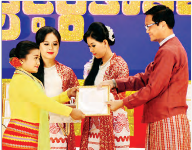
ဒုတိယသမ္မတ ဦးဟင်နရီပန်ထီးယူ မဟာဂီတ အဆိုပြိုင်ပွဲ ဝါသနာရှင်အဆင့် (ဒုတိယတန်း) (မ) စစ်ကိုင်းတိုင်းဒေသကြီးမှ ပထမဆုရ မောင်မာခြိမ်းအား ဂုဏ်ပြုဆုနှင့် ဂုဏ်ပြု မှတ်တမ်းလွှာများ ပေးအပ်ချီးမြှင့်စဉ် (သတင်းစဉ်)

ပြိုင်ပွဲကျင်းပရေး ဦးစီးကော်မတီဥက္ကဋ္ဌ ပြည်ထောင်စုဝန်ကြီး သူရဦးအောင်ကိုက အမျိုးဂုဏ်ဇာတိဂုဏ်အဆိုပြိုင်ပွဲ၏ အဆင့်အလိုက်ပြိုင်ပွဲများတွင် ပထမ၊ ဒုတိယ၊ တတိယနှင့် နှစ်သိမ့်ဆုရရှိခဲ့ကြသူများအား ဂုဏ်ပြုဆုနှင့် ဂုဏ်ပြုမှတ်တမ်းလွှာများကို