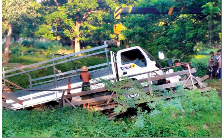
မန္တလေးမြို့၊ အောင်မြေသာစံမြို့နယ် ဒေါနဘွားရပ် ၁၅ လမ်း ၆၂ နှင့် ၆၅ လမ်းကြားရှိ ရေဆိုးပစ်မြောင်းတွင် လူကူးရန် တည်ဆောက်ထားသည့် သစ်သားတံတားပေါ်သို့ အောက်တိုဘာ ၂၅ ရက် ညနေပိုင်းက မော်တော်ယာဉ်တစ်စီး ဖြတ်ကျူးရာ တံတားကျိုးကျလျက်ရှိပုံကို အဆိုပါနေ့ ညနေပိုင်းက တွေ့ရစဉ်