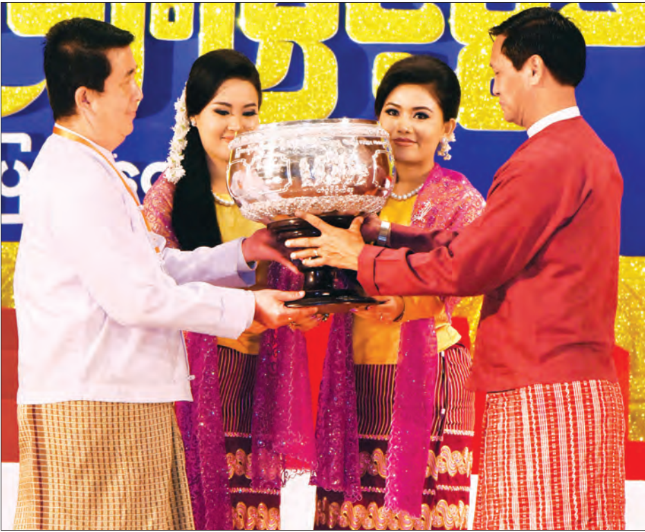
ပြိုင်ပွဲကျင်းပရေး ဦးစီးကော်မတီနာယက ဒုတိယသမ္မတ ဦးဟင်နရီပန်ထီးယူ ရန်ကုန်တိုင်းဒေသကြီးအဖွဲ့အား တံခွန်စိုက်ဆုဖလား ပေးအပ်ချီးမြှင့်စဉ် (သတင်းစဉ်)

တေးသီချင်း အဆိုပြိုင်ပွဲတွင် ပါဝင်သည့် သီချင်းအမျိုးအစားများထဲမှ အမျိုးဂုဏ် ဇာတိဂုဏ် ဖြင့်တင်ရေး