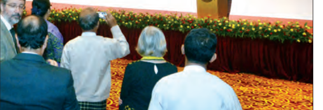
နိုင်ငံတော်၏အတိုင်ပင်ခံပုဂ္ဂိုလ် ဒေါ်အောင်ဆန်းစုကြည် (၇၁) ကြိမ်မြောက် ကုလသမဂ္ဂနေ့ အထိမ်းအမှတ် ဧည့်ခံပွဲတွင် အမှာစကားပြောကြားစဉ်

ပူးပေါင်းဆောင်ရွက်မှုများမြှင့်တင် အဖွဲ့ဝင်နိုင်ငံပေါင်း ၁၉၀ ကျော်နဲ့ဖွဲ့စည်းထားတဲ့ ကုလသမဂ္ဂမှာ သဘောထားမတူညီမှုတွေ ရှိနေမှာတော့ ဓမ္မတာပဲ ဖြစ်ပါတယ်။ ဒါပေမယ့်လည်း ကျွန်ုပ်တို့ဟာ