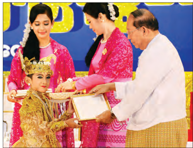
နိုင်ငံတော်အခြေခံဥပဒေဆိုင်ရာခုံရုံးဥက္ကဋ္ဌ ဦးမျိုးညွန့် အကပြိုင်ပွဲ အခြေခံပညာအဆင့် (၁၀-၁၅)နှစ် (ကျား) ပထမဆုရ မန္တလေးတိုင်းဒေသကြီးမှ မောင်ဟံသာဖြိုးအား ဂုဏ်ပြုဆုနှင့် ဂုဏ်ပြုမှတ်တမ်းလွှာများကို ပေးအပ်ချီးမြှင့်စဉ်

ယင်းနောက် အခမ်းအနားသို့ တက်ရောက်လာကြသူများအား ဂုဏ်ပြုညစာဖြင့် တည်ခင်းဧည့်ခံသည်။ (သတင်းစဉ်)