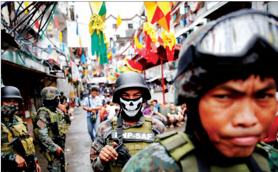
အဝေးတွင် အတည်ပြုခဲ့ကြောင်း ရဲဌာနကြားခဲ့သည်။ အဆိုပါ စီမံကိန်းကို ယခုရက်ပိုင်း အတွင်း စတင်ပြုလုပ်မည်ဖြစ်ကြောင်း ကားလိုင်က ပြောကြားခဲ့သော်လည်း အသေးစိတ်အချက်အလက်များကို ဖော်ပြခြင်းမပြုပေ။ (ချန်နယ်နယူးစ်အေရှယ်)

အသစ်ထုတ်ပြန်လိုက်သော ယင်းစီမံကိန်းကို အောက်တိုဘာ ၂၅ရက်က မြို့တော်မနီလာမြောက်ဘက် ရဲဌာနချုပ်တွင်ကျင်းပသော ရဲချုပ်အစည်း