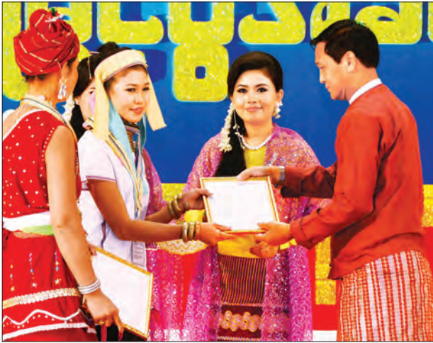
ဒုတိယသမ္မတ ဦးဟင်နရီပန်ထီးယူ တိုင်းရင်းသားရိုးရာ ယဉ်ကျေးမှုအဖွဲ့များကို ဂုဏ်ပြုဆု ပေးအပ်ချီးမြှင့်စဉ် (သတင်းစဉ်)