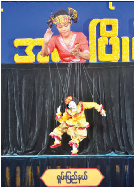
ဝါသနာရှင် (ဒုတိယတန်း) အမျိုးသမီးရုပ်သေးကြိုးဆွဲပြိုင်ပွဲဝင် ရှမ်းပြည်နယ်မှ မသဲအေးအေးနွယ် ယှဉ်ပြိုင်စဉ်

နေပြည်တော် အောက်တိုဘာ ၂၃ အဆို၊ အက၊ အရေး၊ အတီးပြိုင်ပွဲနောက်ဆုံးနေ့။ စင်မြိုင်ထက်နုတ်ပြာရောင်ကတ္တီပါနောက်ခံရေတွင် ဇော်ဂျီရုပ်က ငြိမ်သက်လျက်။ ပြိုင်ပွဲအစ တီးလုံးဖွင့်သည်နှင့်တစ်ပြိုင်နက် ဇော်ဂျီရုပ်ကသက်ဝင်လှုပ်ရှားလာသည်။ ဇော်ဂျီဆေးကြော်ဟန်၊ ဘယ်ညာခြေထိုးဟန်၊ ဇော်ဂျီကြိမ်လုံးထမ်းကဟန်၊ လေထဲဝဲပျံကဟန်တို့က ပရိသတ်အဖို့ အသက်ရှူများဖွယ်။ ရုပ်သေးကြိုးဆွဲမိန်းကလေး၏ကျွမ်းကျင်မှု၊ ပညာပါမှုများကို ပရိသတ်၏ အားပေးလက်ခုပ်သံများက ဖော်ပြနေသည်။ (၂၂)ကြိမ်မြောက် မြန်မာတိုင်းရင်းသားတို့၏ရိုးရာ ယဉ်ကျေးမှုအဆို၊ အက၊ အရေး၊ အတီးပြိုင်ပွဲ၏နောက်ဆုံးနေ့ ပြိုင်ပွဲများကို အောက်တိုဘာ ၂၃ ရက်က နေပြည်တော်ရေဆင်းတက္ကသိုလ်များနယ်မြေ၌ ကျင်းပခဲ့သည်။ ရုပ်သေးပြိုင်ပွဲကျင်းပရာ မွေးမြူရေးဆိုင်ရာ တက္ကသိုလ် (ဘွဲ့နှင့်သဘင်ခန်းမ) တွင် ပရိသတ်အားပေးမှုဖြင့် ပြိုင်ပွဲဝင်များ အကြိတ်အနယ် ယှဉ်ပြိုင်ခဲ့ကြသည်။