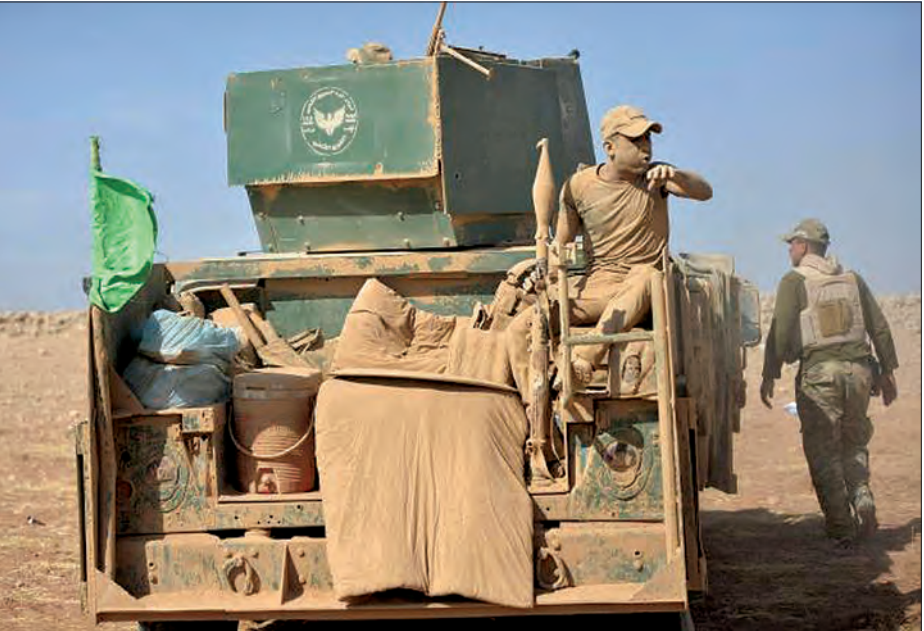
စီးနင်းတိုက်ခိုက်ခဲ့ရာ လူ ၃၅ ဦးမက သေဆုံးပြီး ၁၂၀ ဒဏ်ရာ ရရှိသွားကြောင်း ဆေးဘက်ဆိုင်ရာ သတင်းရင်းမြစ်များ (ဘီဘီစီ)

စစ်ပွဲမဖြစ်မီက အီရတ်နိုင်ငံ၏ အကြီးဆုံးခရစ်ယာန်မြို့ဖြစ်သည့် ကာကွတ်မှ မိုဆူးလ်သို့ ချဉ်းကပ်ရာ လမ်းတစ်လျှောက်တွင် အိုင်အက်စ်တို့က မြေမြှုပ်မိုင်းများ ထောင်ထားကြောင်း သိရသည်။