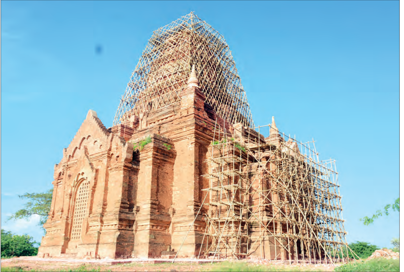
ငလျင်ဒဏ်သင့် ကုသဘုရား၌ ရှေးဦးထိန်းသိမ်းမှုအနေဖြင့် ငြိမ်းဆင်မှုလုပ်ငန်းများ ဆောင်ရွက်ထားစဉ်