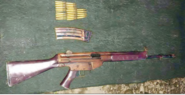
ပါးပိတ်ကျေးရွာမှ သိမ်းဆည်းရမိသည့် အိမ်အေ-၁၁ တစ်လက်၊ ကျည်အိမ်တစ်ခု၊ ယင်းကျည် ၂၅ တောင့်