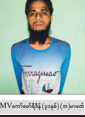
MV ကော်မော်ရီဒီနီ (၃၃နှစ်) (ဘ) မာမတ်