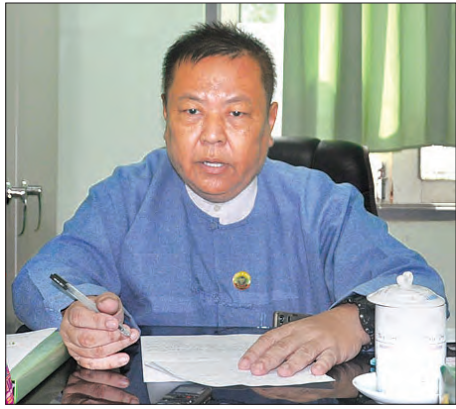
ပြောကြားသည်။ ထို့အပြင် ရခိုင်ပြည်နယ်သည် ကမ်းခြေဒေသများဖြစ်သည့် အတွက် ကမ်းဝေးကမ်းနီး ငါးဖမ်းစက်လှေများဖြင့် လုပ်ငန်း

ပြည်နယ်အတွင်း သဘာဝဘေးအန္တရာယ်ကျရောက်ပါက ကူညီကယ်ဆယ်ရေးလုပ်ငန်းများ အရန်သင့်ဆောင်ရွက်နိုင်ရန် အရေးပေါ်ကယ်ဆယ်ရေးအဖွဲ့များ ဖွဲ့ထားပြီး အဆိုပါအဖွဲ့တွင် ကြက်ခြေနီတပ်ဖွဲ့ဝင်များ၊ မီးသတ်တပ်ဖွဲ့ဝင်များ၊ တပ်မတော် သားများ၊ ရဲတပ်ဖွဲ့ဝင်များ၊ ကျန်းမာရေးဝန်ထမ်းများပါဝင် ကြောင်း သိရသည်။