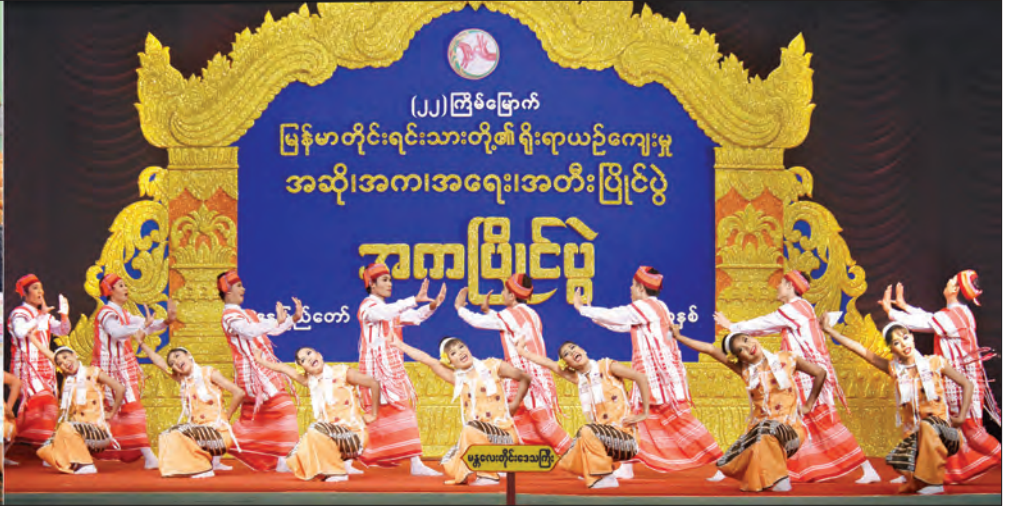
အမျိုးသားလွှတ်တော်ဥက္ကဋ္ဌ မန်းဝင်းခိုင်သန်း (၂၂) ကြိမ်မြောက် မြန်မာတိုင်းရင်းသားတို့၏ ရိုးရာယဉ်ကျေးမှု အဆို၊ အက၊ အရေး၊ အတီးပြိုင်ပွဲများ ကြည့်ရှုအားပေးစဉ် (သတင်းစဉ်)

နေပြည်တော် အောက်တိုဘာ ၂၃ အမျိုးသားလွှတ်တော်ဥက္ကဋ္ဌ မန်းဝင်းခိုင်သန်းသည် ယနေ့နံနက်ပိုင်းတွင် နေပြည်တော် ရေဆင်းတက္ကသိုလ်များ နယ်မြေသတ်မှတ်နေရာ အသီးသီး၌ ကျင်းပလျက်ရှိသည့် (၂၂) ကြိမ်မြောက် မြန်မာတိုင်းရင်းသားတို့၏ ရိုးရာယဉ်ကျေးမှု အဆို၊ အက၊ အရေး၊ အတီးပြိုင်ပွဲများကို ကြည့်ရှုအားပေးသည်။