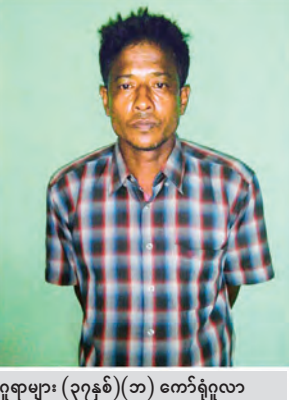
ဂူရာများ (၃၇နှစ်) (ဘ) ကော်ရီဂူလာ