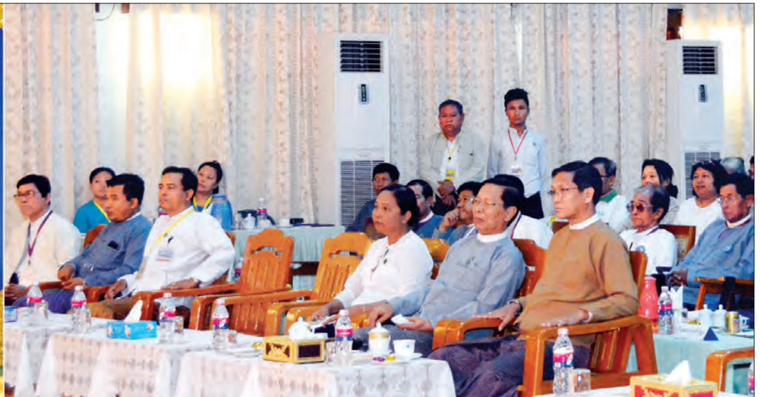
ဒုတိယသမ္မတ ဦးဟင်နရီဗန်ထီးယူ (၂၂)ကြိမ်မြောက် မြန်မာတိုင်းရင်းသားတို့၏ ရိုးရာယဉ်ကျေးမှု အဆို၊ အက၊ အရေး၊ အတီးပြိုင်ပွဲ ကြည့်ရှုအားပေးစဉ် (သတင်းစဉ်)