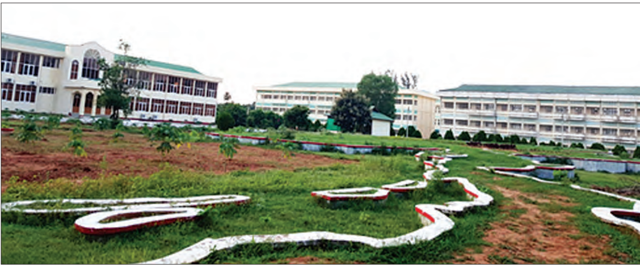
ပြည်ထောင်စုတိုင်းရင်းသားလူမျိုးများ ဖွံ့ဖြိုးရေးတက္ကသိုလ် စာသင်ဆောင်များ

နယ်စပ်ဒေသများအထိသွားရောက်၍ တိုင်းရင်းသားလူမျိုးပေါင်းစုံနှင့် ထိတွေ့ဆက်ဆံကာ တိုင်းရင်းသားစည်းလုံးညီညွတ်ရေးကို ခိုင်ခိုင်မာမာ တည်ဆောက်နိုင်ရေးအတွက်ဆိုလျှင် ပညာရေးဝန်ထမ်းများကသာ စည်းရုံးရေးမှူးကောင်းများ ဖြစ်လာနိုင်ကြောင်း၊ ကျောင်းတော်ကြီးမှ သင်ကြားပေးလိုက်သော ပညာရပ်များနှင့် မိမိတို့၏ရိုးရာယဉ်ကျေးမှု ဓလေ့ထုံးစံများ ပေါင်းစပ်၍ ပြောဆိုဆက်ဆံစည်းရုံးဆောင်ရွက်နိုင်ကြမည်ဖြစ်