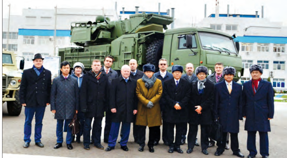
ဒုတိယတပ်မတော်ကာကွယ်ရေးဦးစီးချုပ် ကာကွယ်ရေးဦးစီးချုပ်(ကြည်း) ဒုတိယဗိုလ်ချုပ်မှူးကြီး စိုးဝင်းနှင့်အဖွဲ့ JSC “KBP” (Instrument Design Bureau) မှ တာဝန်ရှိသူများနှင့်အတူ စုပေါင်းမှတ်တမ်းတင်ဓာတ်ပုံရိုက်ကိုင်