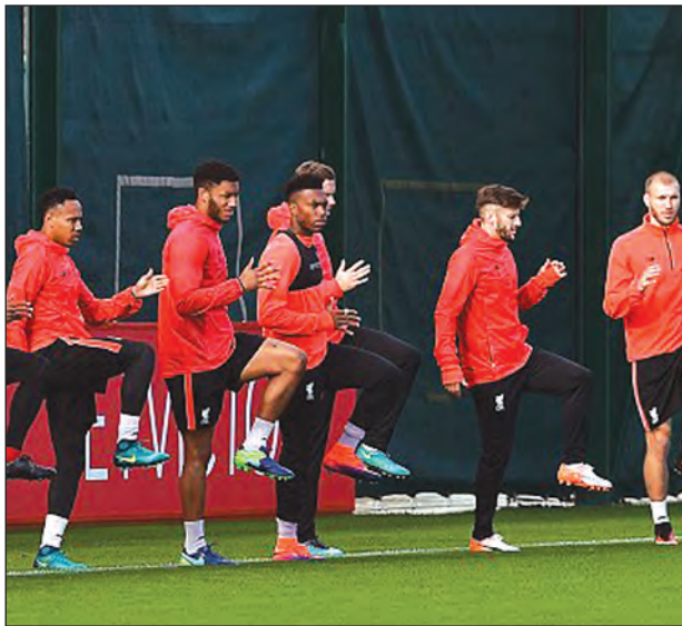
ကောင်းမြတ်သူ - စုစည်းသည်

လီဗာပူးအသင်းအနေနဲ့ မန်ယူနဲ့ ကစားခဲ့တဲ့ပွဲမှာ ဂိုးမရှိသရေကျခဲ့ပြီးနောက် အောင်မြင်တဲ့ အသင်းဖြစ်ဖို့ ကြိုးစားနေပြီလို့ နည်းပြဂျာဂျင်ကလော့ပ်က ဆိုပါတယ်။ လီဗာပူးအသင်းအနေနဲ့ ဒီနှစ်ရာသီမှာ ပရီမီယာလိဂ်ဖလားကို မျှော်မှန်းနိုင်တဲ့အသင်းဖြစ်အောင် ကြိုးစားပြင်ဆင်နေပြီလို့ ဆိုပါတယ်။ မန်ယူနဲ့ လီဗာပူးတို့ဟာ တနင်္လာနေ့ည က ယှဉ်ပြိုင်ကစားရာမှာ ဂိုးမရှိသရေနဲ့ အဆုံးသတ်ခဲ့ပါတယ်။ ဒီပွဲမှာ လီဗာပူး ကစားသမားတွေရဲ့ ခြေစွမ်းက ဒီနှစ်ရာသီမှာတော့ အဆိုးရွားဆုံးအနေအထားလို့ နည်းပြဂျာဂျင်ကလော့ပ်က ဝန်ခံပြောဆိုခဲ့တာပါ။ လီဗာပူးဟာ လာမယ့် စနေနေ့မှာ ဝက်စ်ဟတ္စင်ဖန်နဲ့ ကစားရမှာဖြစ်ပါတယ်။ ဒီပွဲမှာ အနီစီးမှာ ကစားမယ့်ပွဲဖြစ်တဲ့အတွက် လီဗာပူးတို့ နိုင်ခြေမျှားနေတယ်။ လီဗာပူးရဲ့ နောက်တန်းကစားသမားဟောင်း ဒန်နီရှယ် အဂ္ဂီကတော့ ဒီနှစ်ရာသီမှာ လီဗာပူးဖလားရဖို့ အလားအလာ များနေတယ်လို့ ဟောကိန်းထုတ်ပြောဆိုနေပါတယ်။ ယခုအခါမှာတော့ လီဗာပူးအသင်းကစားသမားတွေအားလုံး နိုင်ပွဲတွေ ပြန်ရနိုင်ဖို့ အပြင်းအထန်လေ့ကျင့်မှုတွေပြုလုပ်နေပြီလို့ ဆိုပါတယ်။