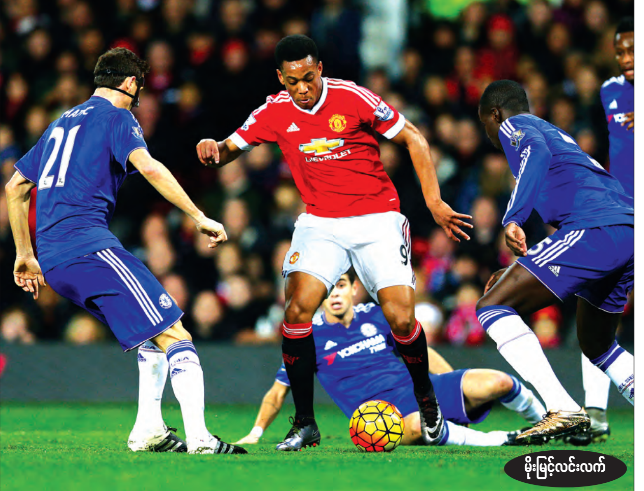
မိုးမြင့်လင်းလက်

ချယ်လ်ဆီးနှင့် မန်ယူ ခြေစွမ်းမပြည့်မီ ချယ်လ်ဆီးတို့ဟာ နောက်ဆုံးပိုင်းပွဲကစားခဲ့ရာမှာ သုံးပွဲနိုင်ပြီး နှစ်ပွဲရှုံးထားပါတယ်။ အာဆင်နယ်ကို သုံးပွဲပြတ်နဲ့ ရှုံးခဲ့သလို လီဗာပူးကိုလည်း နှစ်ပွဲတစ်ပွဲနဲ့ ရှုံးခဲ့တဲ့ ချယ်လ်ဆီးဟာ အခုပွဲ မန်ယူကို အိမ်ကွင်းမှာ ဘယ်လိုစည်းစိမ်မလဲကြည့်ရမှာဖြစ်ပါတယ်။ ချယ်လ်ဆီးတိုက်စစ်က ဂိုးသွင်းနိုင်စွမ်းရှိပေမယ့် ခံစစ်ပိုင်းမှာ အားနည်းချက်ရှိနေပါတယ်။ ကွင်းလယ်ကစားအားပိုင်းမှာလည်း လိုအပ်ချက်တွေရှိနေပေမယ့် မန်ယူကို ကောင်းကောင်းစိန်ခေါ်နိုင်တဲ့ ခြေစွမ်းရှိထားပါတယ်။ မန်ယူတို့ကတော့ ရလဒ်တွေ ဆိုးရွားနေတာမို့ ပွဲကျပ်အဖြစ် ကစားရပါလိမ့်မယ်။ လီဗာပူးနဲ့ စတုတ်ကို ဆက်တိုက်သရေပွဲတွေဖြစ်ထားတဲ့ မန်ယူဟာ တိုက်စစ်အနေအထားကို ပြုပြင်ပြောင်းလဲမှု ရပါလိမ့်မယ်။ နှစ်သင်းစလုံးအားထုတ်မှုတွေ စွမ်းဆောင်မှုအပိုင်းမှာ ကွာဟချက်နည်းတာမို့ သရေပွဲလည်း ဖြစ်သွားနိုင်ပါတယ်။ မန်စီးတီးနှင့် ဆောက်သမ်တန် အခုတလော သရေပွဲ၊ ရှုံးပွဲတွေနဲ့ ဆက်တိုက်ကြတဲ့ ဆောက်သမ်တန်ဟာ အခုပွဲမှာတော့ နိုင်ပွဲရအောင် ပြန်လည်ရုစေတာမှာ ဖြစ်ပါတယ်။ ခြေစွမ်းပိုင်းမှာ အားကောင်းတဲ့ မန်စီးတီးကို ကွင်းလယ်ရော တိုက်စစ်ပါ ဖိစီးစီးကစားနိုင်ပေမယ့် အဆုံးသတ်ပိုင်းမှာ အားနည်းနေပါတယ်။ ဆောက်သမ်တန်ရဲ့ နောက်ဆုံးလေးပွဲကစားခဲ့တဲ့ရလဒ်ကိုကြည့်ရင်တော့ ရှုံးပွဲမရှိခဲ့ပါဘူး။