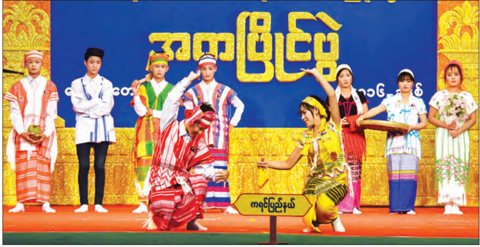
တိုင်းရင်းသားရိုးရာ၊ ကျေးလက်ရိုးရာအက(အလွတ်တန်း) ပြိုင်ပွဲ ကရင်ပြည်နယ်မှ ကရင်ရိုးရာဒုံးယမ်းအကဖြင့် ပြိုင်ပွဲဝင်စဉ်

အကပြိုင်ပွဲ၏ တိုင်းရင်းသားရိုးရာ၊ ကျေးလက်ရိုးရာအက (အလွတ်တန်း) ပြိုင်ပွဲကို မွေးမြူရေးဆိုင်ရာ ဆေးတက္ကသိုလ် ရွှေရတနာမိမိကျင်းပရာ ကချင်တိုင်းရင်းသားတို့က ရဝမ်းဂျိန်းဖော၊ လီဆူး၊ လချိတ်၊ လပေါ်နှင့် ဝိုင်ဝါတို့၏ ရိုးရာဓလေ့ထုံးတမ်းများ တေးသရုပ်ဖော်အကဖြင့် လည်းကောင်း၊ ကယားတိုင်းရင်းသားတို့က ရိုးရာပွဲတော်များတွင် ထင်ရှားသည့် ဖားစည်အကဖြင့် လည်းကောင်း၊ ကရင်တိုင်းရင်းသားတို့က ရိုးရာဓလေ့ထုံးတမ်းများ တေးသရုပ်ဖော်အကဖြင့် လည်းကောင်း၊ ချင်းတိုင်းရင်းသားတို့က စည်းလုံးခြင်းသည်ခွန်အားဟု အဓိပ္ပာယ်ရသည့် ရှုဆပ်အက သို့မဟုတ် နွေဦးရာသီရိုးရာအကဖြင့် လည်းကောင်း၊ မွန်တိုင်းရင်းသားတို့က ရိုးရာယဉ်ကျေးမှုအကဖြင့် လည်းကောင်း၊ ရခိုင်တိုင်းရင်းသားတို့က ရှေးရိုးရာ ရတု၊ ရကန်၊ အေးအိုင်၊ သာချင်းတို့ကို ဖွဲ့ဆိုထားသည့် စာဆိုအမွေ ထွန်းပြောင်လီအကဖြင့် လည်းကောင်း၊ ရှမ်းတိုင်းရင်းသားတို့က ရိုးရာအိုးစည်အကဖြင့် လည်းကောင်း၊ ရန်ကုန်တိုင်းဒေသကြီးက