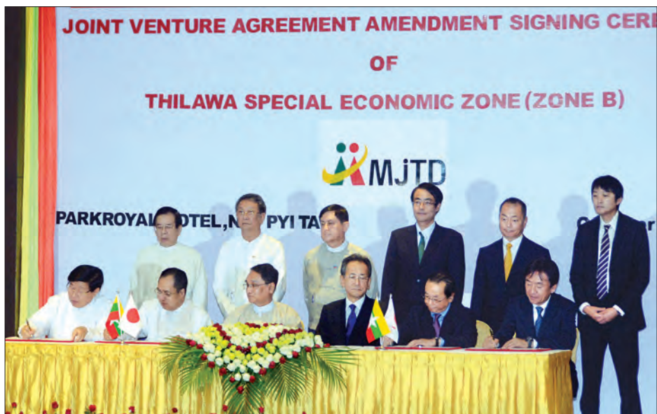
များ ပြောကြားကြသည်။ ထို့နောက် ပြည်ထောင်စုဝန်ကြီး ဒေါက်တာသန်းမြင့်နှင့် ဂျပန်သံအမတ်

ယင်းနောက် မြန်မာနိုင်ငံဆိုင်ရာ ဂျပန်နိုင်ငံသံအမတ်ကြီး မစ္စတာတာတိုဟိတိုနှင့် မြန်မာနိုင်ငံတော်ဗဟိုဘဏ် ဒုတိယဥက္ကဋ္ဌ၊ သီလဝါအထူးစီးပွားရေးစက်မှုဇုန်စီမံခန့်ခွဲမှု ကော်မတီဥက္ကဋ္ဌ ဦးဆက်အောင်တို့က နှုတ်ခွန်းဆက်စကား