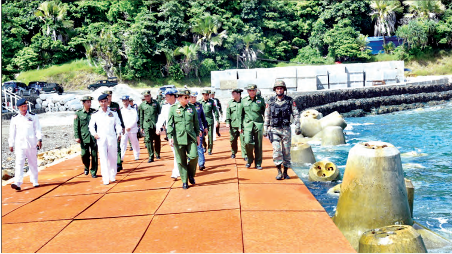
တပ်မတော် ကာကွယ်ရေးဦးစီးချုပ် ဗိုလ်ချုပ်မှူးကြီး မင်းအောင်လှိုင် ကိုကိုးကျွန်းဆိပ်ခံတံတား တည်ဆောက်နေမှုကို ကြည့်ရှုစစ်ဆေးစဉ်