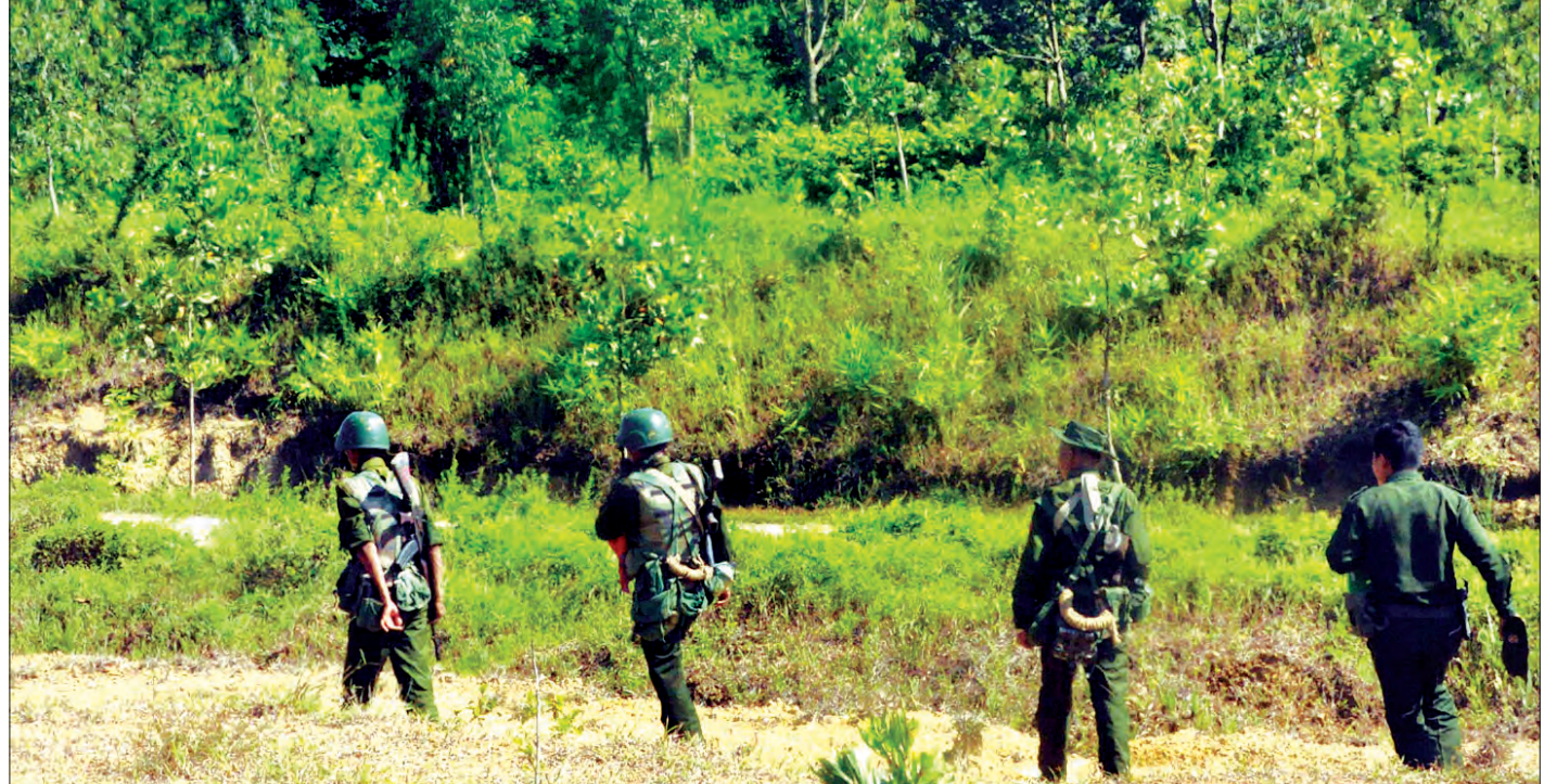
မောင်တောဒေသ၌ လုံခြုံရေးဆောင်ရွက်နေသည့် တပ်မတော်သားများကို အောက်တိုဘာ ၂၀ ရက်က တွေ့ရစဉ် ဓာတ်ပုံ-နေလင်း(သတင်းစဉ်)

အောင်စိုးမိုးကျော်-၂ အမြန်ရေယာဉ်နှစ်မြုပ်မှုနှင့် ပတ်သက်သည့် ရှင်းလင်းပွဲ အောက်တိုဘာ ၂၂ ရက်တွင် မုံရွာမြို့၌ တိုင်းဒေသကြီး အစိုးရ ဦးစီးပြုလုပ်မည် စာမျက်နှာ - ၅ အရှေ့အာဖရိကဒေသ ဂျပာတီ နိုင်ငံမှာ ဂျပန်နိုင်ငံက စစ် အခြေစိုက်စခန်း တည်ဆောက် ရန် ကြိုးပမ်းလျက်ရှိ စာမျက်နှာ - ၁၁