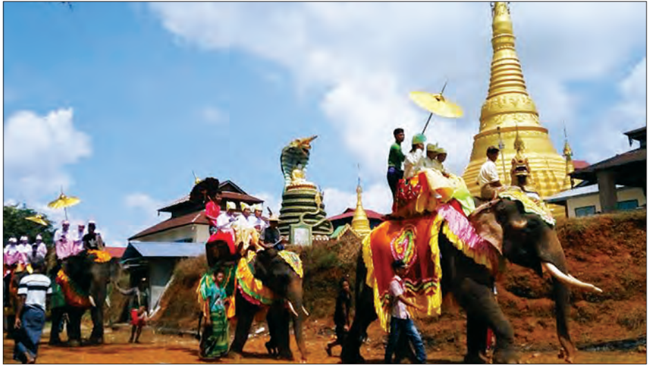
မွန်ပြည်နယ် သထုံမြို့နယ် ကတိုက်လေးကျေးရွာ အဘယမကျောင်းတိုက်၌ နှစ်စဉ်ကျင်းပဖြစ်သော စုပေါင်း ဘုံကထိန်နှင့် ရဟန်းခံရည်ပြုအလှူပွဲတော်ကို ကတိုက်ကလေးနှင့် ဓနကတိုက်ကျေးရွာနှစ်ရွာ စုပေါင်း၍ အောက်တိုဘာ ၂၀ ရက်က စည်ကားသိုက်မြိုက်စွာ ကျင်းပစဉ် ခွန်(ဝင်းပ)

ရန်ကုန် အောက်တိုဘာ ၂၀ ရွှေတိဂုံစေတီတော်ဂေါပကအဖွဲ့က ကြီးမှူးကျင်းပမည့် (၉၉) ကြိမ်မြောက် စေတီယင်္ဂဏ ပရိယတ္တိဓမ္မာနုဂ္ဂဟ စာလျှောက်မေးပွဲကို ၁၃၇၈ ခုနှစ် တန်ဆောင်မုန်းလပြည့်ကျော် ၁၂ ရက်မှ နတ်တော်လဆန်း ၃ ရက်အထိ (နိုဝင်ဘာ ၂၆ ရက်မှ ဒီဇင်ဘာ ၂ ရက်အထိ) ကျင်းပသွားမည်ဖြစ်ကြောင်း သိရသည်။ ဝင်ရောက် ဖြေဆိုကြမည့် ရဟန်းတော်များသည် စာလျှောက် မေးပွဲဝင်ခွင့် ပုံစံများကို ဂေါပကအဖွဲ့မှ ရုံးချိန်အတွင်းထုတ်ယူပြီး ၁၃၇၈ ခုနှစ် တန်ဆောင်မုန်းလပြည့်နေ့ (နိုဝင်ဘာ ၁၄ ရက်) ညနေ ၄ နာရီ နောက်ဆုံးထား၍ ပေးပို့ကြရမည်ဖြစ်သည်။ စာဖြေသည့်စာတော်များအား ပစ္စည်းလေးပါး ထောက်ပံ့ပျူဒါန လိုပါက ရွှေတိဂုံစေတီတော်ရင်ပြင်နှင့် ဂေါပကအဖွဲ့ရုံးတွင် အလှူခံဌာန များ ဖွင့်လှစ်ထားကြောင်းနှင့် ဖုန်း ၀၁-၃၈၃၅၁၂ နှင့် ၀၁-၃၇၅၇၆၇ တို့သို့ ဆက်သွယ်နိုင်ကြောင်း သိရသည်။ ကိုချစ်