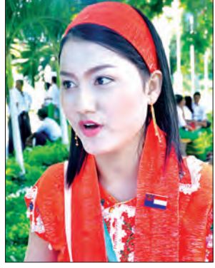
မလဝန်းထက်(ကရင်ပြည်နယ်)