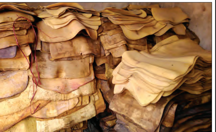
ရော်ဘာလုပ်ငန်းတစ်ခုမှ ထုတ်လုပ်ထားသော ရော်ဘာပြားကုန်ကြမ်းများ