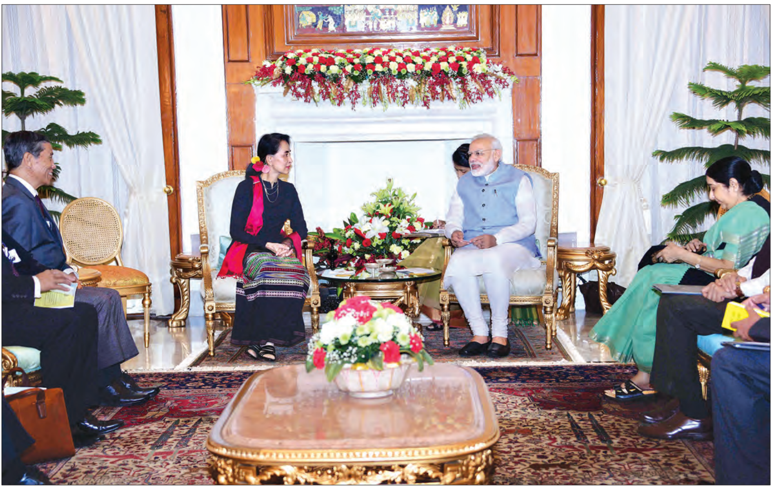
နိုင်ငံတော်၏အတိုင်ပင်ခံပုဂ္ဂိုလ် ဒေါ်အောင်ဆန်းစုကြည်နှင့် အိန္ဒိယနိုင်ငံဝန်ကြီးချုပ် မစ္စတာ နာရန်ဒရာမိုဒီတို့ တွေ့ဆုံဆွေးနွေးစဉ် (သတင်းစဉ်)

နယူးဒေလီ အောက်တိုဘာ ၁၉ နိုင်ငံတော်၏ အတိုင်ပင်ခံပုဂ္ဂိုလ် ဒေါ်အောင်ဆန်းစုကြည်နှင့် အိန္ဒိယနိုင်ငံ ဝန်ကြီးချုပ် မစ္စတာ နာရန်ဒရာမိုဒီတို့သည် ယနေ့ ဒေသစံတော်ချိန် မွန်းတည့် ၁၂ နာရီတွင် Hyderabad House ၌ တွေ့ဆုံသည်။ ထိုသို့ တွေ့ဆုံစဉ် စိုက်ပျိုးရေးကဏ္ဍ၊ နယ်စပ်ဒေသလုံခြုံရေးကဏ္ဍ၊ လူ့စွမ်းအား အရင်းအမြစ်ဖြင့်တင်ရေးကဏ္ဍ၊ နှစ်နိုင်ငံ အကြား ဆက်လက်ဆောင်ရွက်ရန်ရှိသည့် နယ်နိမိတ်ဆိုင်ရာကိစ္စရပ်များနှင့် နှစ်နိုင်ငံ အကျိုးတူ ပူးပေါင်းဆောင်ရွက်ရေး ဆိုင်ရာကိစ္စရပ်များကို ဆွေးနွေးကြသည်။ ဆက်လက်၍ အိန္ဒိယနိုင်ငံဝန်ကြီး ချုပ်က နိုင်ငံတော်၏အတိုင်ပင်ခံပုဂ္ဂိုလ် အား Hyderabad House ၌ အလုပ် သဘော နေ့လယ်စာစားပွဲဖြင့် တည်ခင်း ဧည့်ခံသည်။ နေ့လယ်စာစားပွဲတွင် နိုင်ငံတော်၏ အတိုင်ပင်ခံပုဂ္ဂိုလ်နှင့် အိန္ဒိယနိုင်ငံ ဝန်ကြီးချုပ်တို့သည် နှစ်နိုင်ငံပူးပေါင်း ဆောင်ရွက်ရေးဆိုင်ရာ ကိစ္စရပ်များကို ဆွေးနွေးကြသည်။ ထို့နောက် မြန်မာ-အိန္ဒိယနှစ်နိုင်ငံ နားလည်မှုစာချုပ်များ လဲလှယ်ပွဲကို ကျင်းပရာ နိုင်ငံတော်၏အတိုင်ပင်ခံ ပုဂ္ဂိုလ် ဒေါ်အောင်ဆန်းစုကြည်နှင့် အိန္ဒိယ စာမျက်နှာ ၃ ကော်လံ ၁ *