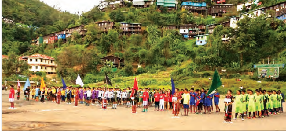
တိုအား အောက်တိုဘာ ၂၃ ရက်တွင် ဆုချီးမြှင့်ကြမည်ဖြစ်ကြောင်း သိရသည်။