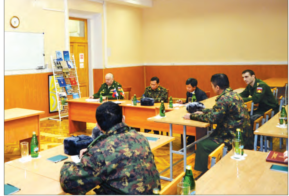
ဒုတိယတပ်မတော်ကာကွယ်ရေးဦးစီးချုပ် ဒုတိယပိုလ်ချုပ်မှူးကြီးစိုးဝင်းနှင့် ရုရှားဖက်ဒရေရှင်းနိုင်ငံ ကြည်းတပ်ဦးစီးချုပ် Col.Gen.Oleg L. Salyukov တို့ တွေ့ဆုံဆွေးနွေးစဉ်