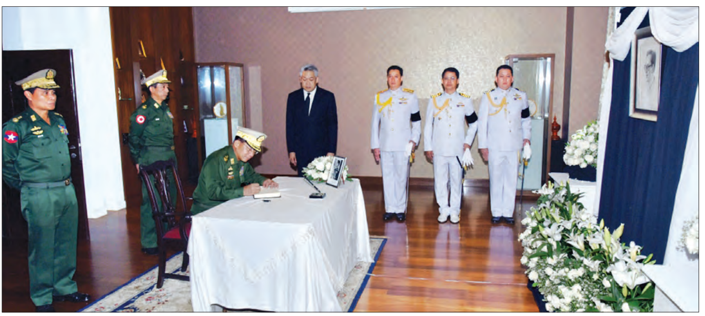
တပ်မတော်ကာကွယ်ရေးဦးစီးချုပ် ပိုလ်ချုပ်မှူးကြီး မင်းအောင်လှိုင် ထိုင်းဘုရင်မင်းမြတ် ဘူမိဘော အဒုရာဒက်ရုံ နတ်ရွာစံခြင်းအတွက် ဝမ်းနည်းကြောင်း စာအုပ်တွင် လက်မှတ်ရေးထိုးစဉ်

နေပြည်တော် အောက်တိုဘာ ၁၉ တပ်မတော်ကာကွယ်ရေးဦးစီးချုပ် ပိုလ်ချုပ်မှူးကြီး မင်းအောင်လှိုင်သည် ယနေ့ နံနက်ပိုင်းတွင် ရန်ကုန်မြို့ရှိ မြန်မာနိုင်ငံဆိုင်ရာ ထိုင်းနိုင်ငံသံရုံး၌ ထိုင်းဘုရင်မင်းမြတ် ဘူမိဘောအဒုရာဒက်ရုံ နတ်ရွာစံခြင်းအတွက် ဝမ်းနည်းကြောင်း စာအုပ်တွင် လက်မှတ်ရေးထိုးသည်။ တပ်မတော်ကာကွယ်ရေးဦးစီးချုပ်သည် သံရုံးဧည့်ခန်းမ၌ မြန်မာနိုင်ငံဆိုင်ရာ ထိုင်းနိုင်ငံသံအမတ်ကြီး၊ စစ်သံမှူးများနှင့် တာဝန်ရှိသူများအား ဝမ်းနည်းကြောင်း ပြောကြားခဲ့သည်။ (သတင်းစဉ်)