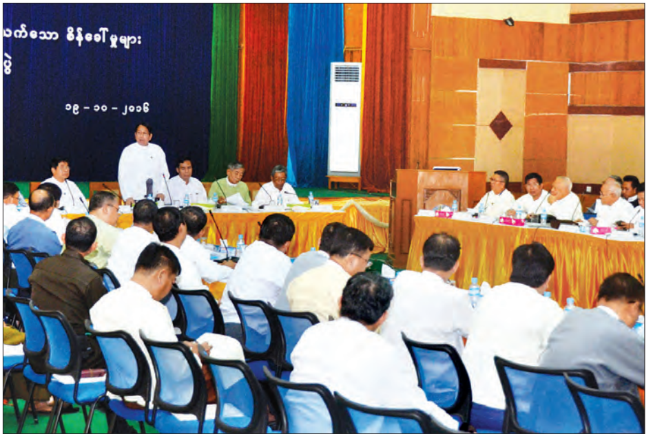
ပေးရန် ပြည်သူများ သိသင့်သည့်သတင်းများအား အချိန်နှင့်တစ်ပြေးညီ ထုတ်ပြန်ပေးရန်၊ တရားရုံးပရိဝုဏ်အတွင်းတွင် အမှုစွပ်စွဲသူနှင့် စွပ်စွဲခံရသူတို့ကို တွေ့ဆုံ မေးမြန်းခြင်း ပြုလုပ်လိုပါက ရုံးအကြီးအကဲ၏ ခွင့်ပြုချက်ရယူဆောင်ရွက်ရန်တို့ အပါအဝင်အချက်များဖြစ်သည်။ (သတင်းစဉ်)

နေပြည်တော် အောက်တိုဘာ ၁၉ သတင်းအချက်အလက် ရယူခြင်းနှင့် ပတ်သက်သော စိန်ခေါ်မှုများ အလုပ်ရုံဆွေးနွေးပွဲတွင် ပြည်ထောင်စုဝန်ကြီး ဒေါက်တာဖေမြင့်က သတင်းသမား တစ်ဦးအနေဖြင့် သူများမသိသေးသည်ကို သိအောင်လုပ်နိုင်လျှင် အောင်မြင်မှုပင်ဖြစ်ကြောင်း၊ ထို့ကြောင့် သတင်းသမားက သတင်းကို ရနိုင်သမျှစုဆောင်း မည်ဖြစ်ပြီး ပြည်သူ့ကို သတင်းပေးမည် ဖြစ်ကြောင်း၊ သတင်းသမားသည် သတင်းနှင့်ပတ်သက်၍ မည်သည့်အခါမှ မတင်းတိမ်ကြောင်း၊ မိမိတို့အစိုးရဌာန ဆိုင်ရာများအနေဖြင့်လည်း အများပြည်သူကို သတင်းအချက်အလက် များပေးရန် တာဝန်ရှိကြောင်း၊ သတင်းသမားများအနေဖြင့် မဏ္ဍိုင်သုံးရပ်ကို ထောက်ပြဝေဖန်နိုင်ရန် မိမိတို့၏ အားနည်းချက်များကိုလည်း ဖော်ထုတ်ရန် ကြိုးစားမည်ဖြစ်ကြောင်း၊ မိမိတို့၏ အားသာချက်မှာ အချက်အလက်များကို စုဆောင်းထားပြီး မိမိတို့ပြောလိုသည့် အချက်များ၊ ပေးလိုသည့် သတင်းစကားများကို မေးမြန်းချိန်တွင် ထည့်သွင်း ပြောဆိုနိုင်ခြင်းဖြစ်ကြောင်း ပြောကြားသည်။ အဆိုပါ အလုပ်ရုံဆွေးနွေးပွဲကို ယနေ့ နံနက်ပိုင်းမှ ညနေပိုင်းအထိ ပြန်ကြားရေးဝန်ကြီးဌာန စုပေါင်း အစည်းအဝေးခန်းမ၌ ကျင်းပစဉ် ပြည်ထောင်စုဝန်ကြီး ဒေါက်တာဖေမြင့်က အထက်ပါအတိုင်း ပြောကြားခဲ့ခြင်း ဖြစ်သည်။ အဆိုပါ အခမ်းအနားသို့ ပြည်ထောင်စုအစိုးရအဖွဲ့ရုံး၊ ပြည်ထောင်စု တရားလွှတ်တော်ချုပ်ရုံးနှင့် ဝန်ကြီးဌာနများမှ ပြောရေးဆိုခွင့်ရပုဂ္ဂိုလ်များ၊ တာဝန်ရှိသူများ၊ မြန်မာနိုင်ငံသတင်း မီဒီယာကောင်စီမှ ဒုတိယဥက္ကဋ္ဌများ၊ အတွင်းရေးမှူး၊ တွဲဖက်အတွင်းရေးမှူးများနှင့် ကောင်စီဝင်များ တက်ရောက်ကြသည်။ ယနေ့ပြုလုပ်သည့် အခမ်းအနားတွင် ရလဒ် ၂၁ ချက်ကို ထုတ်ပြန်ခဲ့သည်။ အဆိုပါ အချက်များမှာ ပြောရေးဆိုခွင့်