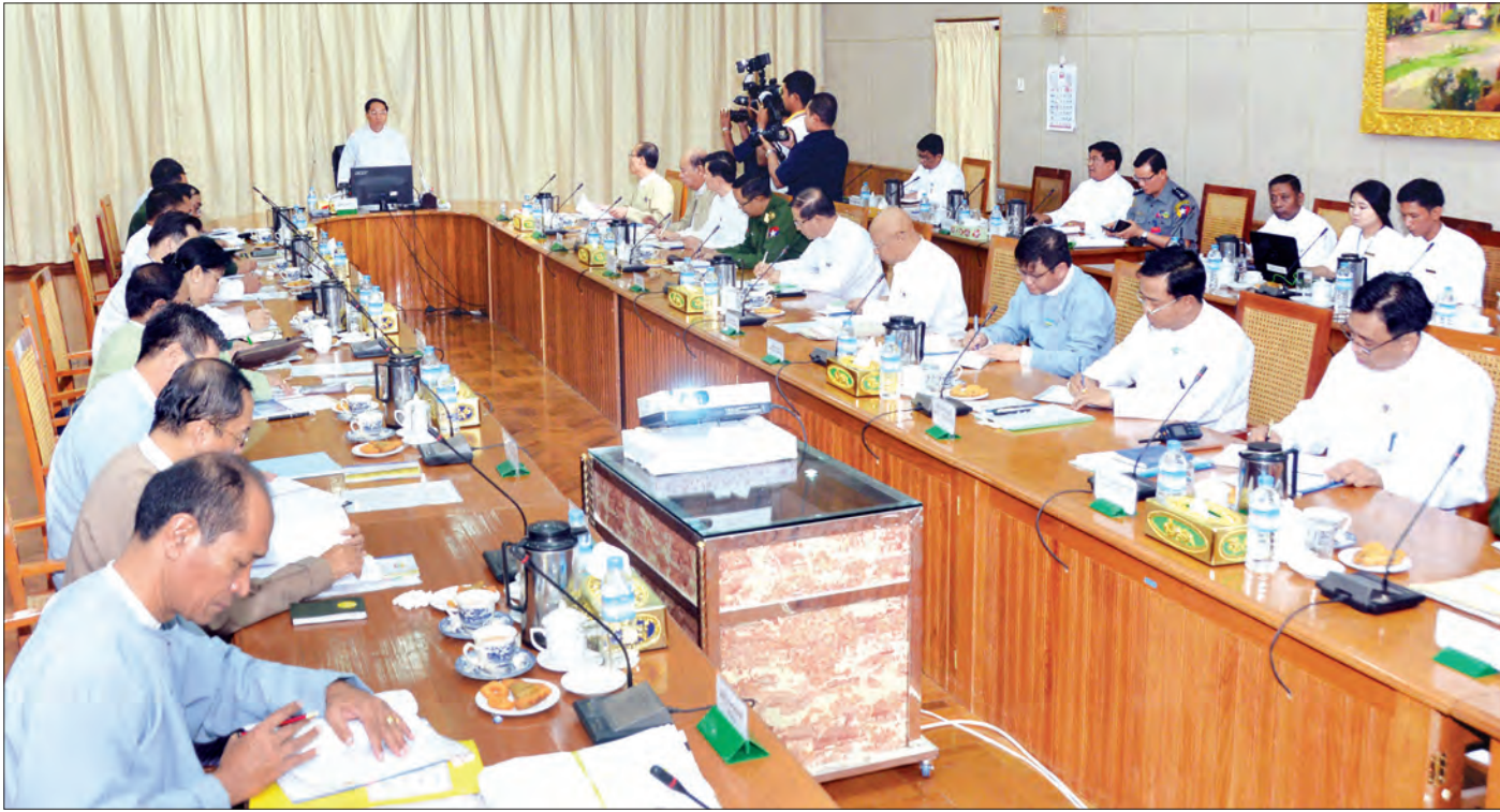
၂၀၁၇ ခုနှစ် (၆၉)နှစ်မြောက် လွတ်လပ်ရေးနေ့ ကျင်းပရေးပဟိုက်မတ် ပထမအကြိမ်ညှိနှိုင်းအစည်းအဝေးတွင် ပဟိုက်မတ်ဥက္ကဋ္ဌ ဒုတိယသမ္မတ ဦးမြင့်ဆွေ အမှာစကားပြောကြားစဉ် (သတင်းစဉ်)

နေပြည်တော် အောက်တိုဘာ ၁၉ ၂၀၁၇ ခုနှစ် (၆၉)နှစ်မြောက် လွတ်လပ်ရေးနေ့ ကျင်းပရေး ပဟိုက်မတ် ပထမအကြိမ် ညှိနှိုင်းအစည်းအဝေးကို ယနေ့ နံနက် ၉ နာရီခွဲက နေပြည်တော်ရှိ ပြည်ထောင်စုအစိုးရအဖွဲ့ ရုံးအစည်းအဝေးခန်းမ၌ ကျင်းပရာ ၂၀၁၇ ခုနှစ် (၆၉)နှစ် မြောက်လွတ်လပ်ရေးနေ့ကျင်းပရေး ပဟိုက်မတ်ဥက္ကဋ္ဌ ဒုတိယသမ္မတ ဦးမြင့်ဆွေ တက်ရောက်အမှာစကား ပြောကြား သည်။ အစည်းအဝေးသို့ ပညာရေးဝန်ကြီးဌာန ပြည်ထောင်စု ဝန်ကြီး ဒေါက်တာမျိုးသိမ်းကြီး၊ နေပြည်တော်ကောင်စီဥက္ကဋ္ဌ ဒေါက်တာမျိုးအောင်၊ ဆပ်ကော်မတီဥက္ကဋ္ဌများဖြစ်ကြသည့် ဒုတိယဝန်ကြီးများနှင့် တာဝန်ရှိသူများ တက်ရောက်ကြသည်။ အစည်းအဝေးတွင် ပဟိုက်မတ်ဥက္ကဋ္ဌ ဒုတိယသမ္မတ ဦးမြင့်ဆွေက ၂၀၁၇ ခုနှစ် (၆၉)နှစ်မြောက် လွတ်လပ်ရေးနေ့ အခမ်းအနားနှင့် ဆက်စပ်အခမ်းအနားများကို ကျင်းပမည့်အခါ နိုင်ငံရေးအနှစ်သာရ ပိုမိုပြည့်စုံစွာဖြင့် ကျင်းပနိုင်ရန်အတွက် ပြည်ထောင်စုငြိမ်းချမ်းရေးညီလာခံ (၂၀)ရာစုပင်လုံတွင် တွေ့ဆုံ ညှိနှိုင်းမှုများမှ ရရှိလာသည့် ဆုံးဖြတ်ချက်များနှင့်အညီ ဘုံသဘောတူညီချက်တစ်ခုဖြင့် အနာဂတ်တွင် စစ်မှန်သည့် ပြည်ထောင်စုကြီး တည်ဆောက်သွားနိုင်ရေး၊ ပြည်ထောင်စု မပြိုကွဲရေး၊ တိုင်းရင်းသား စည်းလုံးညီညွတ်မှု မပြိုကွဲရေးနှင့် အချုပ်အခြာအာဏာ တည်တံ့ခိုင်မြဲရေးအတွက် တိုင်းရင်းသား အားလုံး စုစည်းထိန်းသိမ်းကာကွယ်ရေး၊ ဒီမိုကရေစီဖက်ဒရယ် စာမျက်နှာ ၉ ကော်လံ ၅