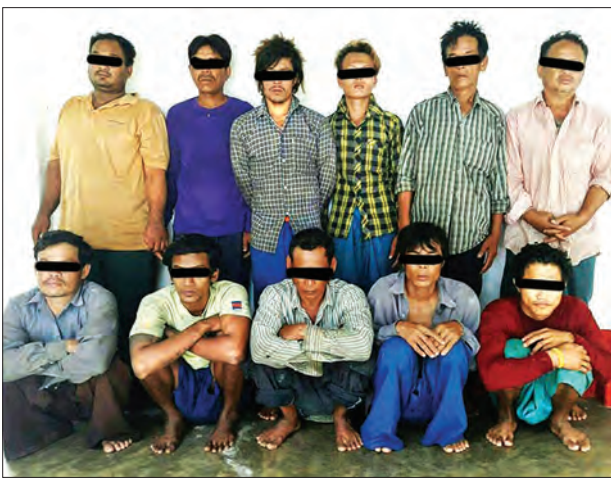
ထိုင်းငါးခိုးလှေတစ်စင်းကို ထိုင်းနိုင်ငံသား နှစ်ဦး၊ မြန်မာရေလုပ်သား ကိုးဦးတို့နှင့်အတူ ဖမ်းဆီးဖော်ထုတ်နိုင်ခဲ့ခြင်းဖြစ်သည်။ ဖြစ်စဉ်နှင့်စပ်လျဉ်း၍ ဖမ်းဆီးရမိသည့် ထိုင်းငါးခိုးလှေနှင့် လှေပေါ်ထိုင်းနိုင်ငံ သားများနှင့် မြန်မာရေလုပ်သားများကို ကျော့သောင်းခရိုင် ငါးလုပ်ငန်းဦးစီးဌာန သို့ အောက်တိုဘာ ၁၄ ရက်က လာရောက်လှည့်ပြောင်းပေးအပ်ခဲ့ပြီး သက်ဆိုင်ရာ မြို့နယ်ရဲတပ်ဖွဲ့နှင့် ငါးလုပ်ငန်းဦးစီးဌာနတို့က ငါးလုပ်ငန်းဥပဒေနှင့်အညီ ဆက်လက် အရေးယူဆောင်ရွက်လျက်ရှိကြောင်း သိရသည်။ ကျော်စိုး(ကျော့သောင်း)

ယင်းနေ့က ပင်လယ်ပြင်လုံခြုံရေးဆောင်ရွက်လျက်ရှိသည့် မြန်မာ့တပ်မတော် (ရေ) စစ်ရေယာဉ်က ကျော့သောင်းခရိုင် သံကျွန်းကြီးအနောက်တောင်ဘက် ၂၃ ဒသမ ၅ မိုင်ခန့်အကွာ လှေခင်းတန်းထိုင်စာတန်းနှင့် အင်္ဂလိပ်အက္ခရာ II ရေးထားပြီး မြန်မာ့ရေပြင်နက်ဖြစ်သည့် ပင်လယ်ရေပြင်အတွင်း တရားမဝင် ငါးခိုးဖမ်းနေသည့်