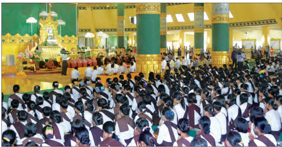
ဥပ္ပါတသန္တိစေတီတော်မြတ်ကြီး၏ အဋ္ဌမအကြိမ် အဘိဓမ္မာအခါတော်နေ့နှင့် (၈၂)ကြိမ်မြောက် အသံမစ် မဟာပဋ္ဌာန်းရွတ်ဖတ်ပူဇော်ပွဲ အောင်ပွဲမင်္ဂလာအခမ်းအနား ကျင်းပစဉ် (သတင်းစဉ်)

သတ်မှတ်ထားသော နေရာအသီးသီး၌ ကျင်းပသည်။ ရှေးဦးစွာ ဂေါပကအဖွဲ့ဝင်များ၊ ဘာသာရေးအသင်းအဖွဲ့များနှင့် ဝန်ထမ်းများက နံနက်အရုဏ်တွင် ရင်ပြင်တော်တောင်ဘက် ရှေးဟောင်းဗုဒ္ဓရုပ်ပွားတော်များ တန်ဆောင်း၌ ရွှေတိဂုံစေတီတော်မြတ်ကြီးအား ဆွမ်း၊ ဆီမီး၊ ပန်း၊ ရေချမ်းနှင့် သစ်သီးဆွမ်းများ ကပ်လှူကြသည်။