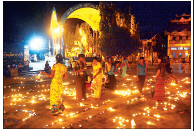
ပိုလီတထောင်စေတီတော်၌ သီတင်းကျွတ်လပြည့်ညက ဘုရားဖူးလာသူများ ဆီမီးထွန်းညှို့ပူဇော်နေစဉ်