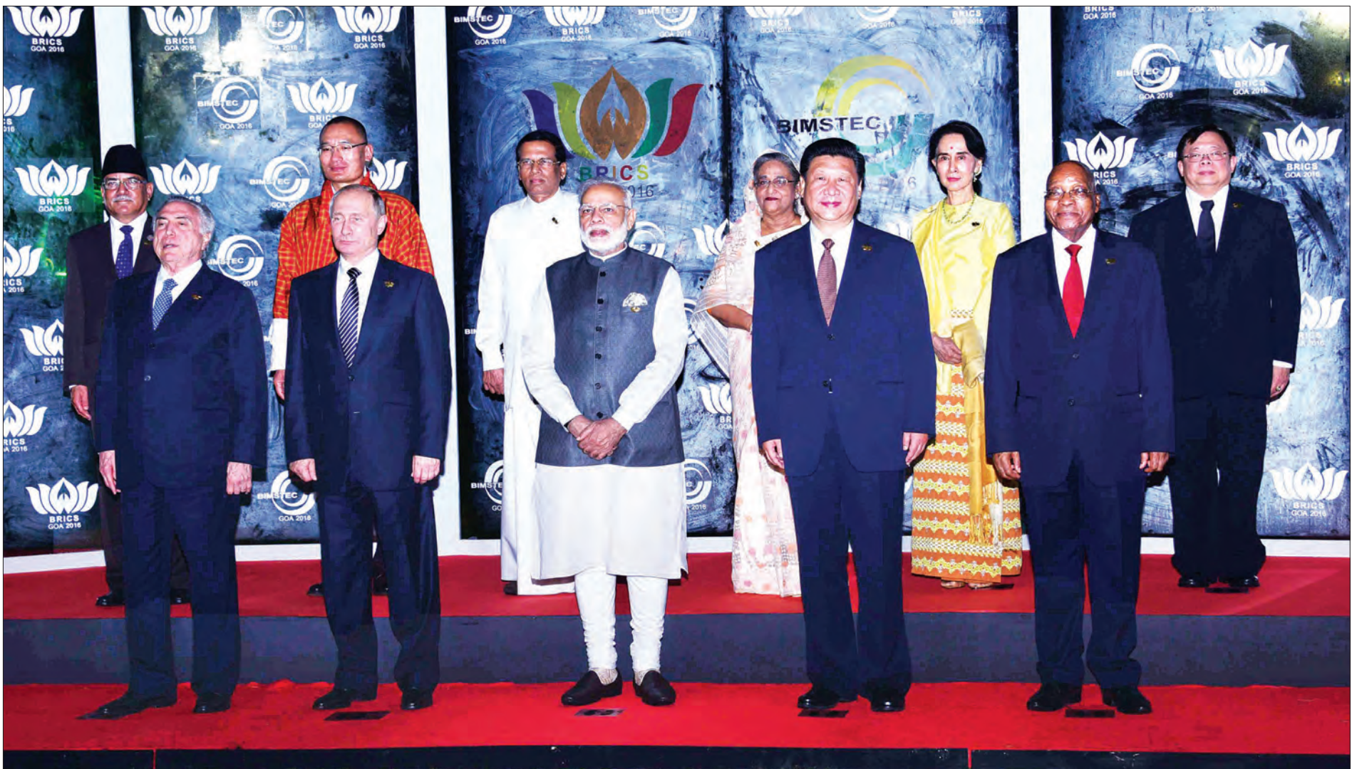
နိုင်ငံတော်၏အတိုင်ပင်ခံပုဂ္ဂိုလ် ဒေါ်အောင်ဆန်းစုကြည် BRICS and BIMSTEC Leader's Outreach Summit သို့ တက်ရောက်လာသည့် နိုင်ငံအကြီးအကဲများနှင့်အတူ စုပေါင်းမှတ်တမ်းတင်ဓာတ်ပုံရိုက်စဉ် (သတင်းစဉ်)

ပိုအာ အောက်တိုဘာ ၁၆ နိုင်ငံတော်၏အတိုင်ပင်ခံပုဂ္ဂိုလ် ဒေါ်အောင်ဆန်းစုကြည်သည် ယနေ့ ဒေသစံတော်ချိန် ညနေ ၄ နာရီတွင် Hotel Leela ၌ ကျင်းပသည့် ဘင်းမိစတက်ထိပ်သီးအစည်းအဝေး (BIMSTEC Retreat) သို့ တက်ရောက်သည်။ စာမျက်နှာ ၃ ကော်လံ ၄ *