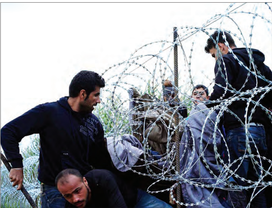
လမ်းကြောင်းဖြစ်တဲ့ ဟန်ဂေရီဟာ လူဦးရေ ၁၀ သန်းနီးပါး ရှိတဲ့ နိုင်ငံတစ်နိုင်ငံအနေနဲ့ နိုင်ငံနင်းတဲ့ အရေးအတွက်ပမာဏ ဖြစ်တဲ့ဒုက္ခသည် ၁၂၉၄ ဦးကိုလိုလှိုင်ပေးဖို့တောင်းဆို ခံခဲ့ရ ပါတယ်။

ဥပဒေပညာမရှိတဲ့ လက်ယာအုပ်စုနိုင်ငံရေး ပါတီများရဲ့ အရင်းရှင်ခေါင်းဆောင်တစ်ဦးဖြစ်တဲ့ မစ္စတာ အော်ဗန်ဟာ အမေရိကန်ဒေါ်လာ ၃၆ သန်းကို အစိုးရရန်ပုံငွေ အဖြစ် အသုံးပြုခဲ့ပြီး ဆန္ဒခံယူပွဲမှာ သိသာထင်ရှားတဲ့ နိုင်ငံရေး ဆိုင်ရာ အရင်းရှင်အစုအဝေး တစ်ရပ်အနေနဲ့ စွန့်စားခဲ့ပါတယ်။ ၎င်းဟာ အခြားသူတွေကို ဖယ်ရှားရှင်းလင်းတဲ့ မူဝါဒလမ်းစဉ်ကို ကျင့်သုံးနိုင်မယ့် အခွင့်အာဏာရရှိရေး ကြိုးပမ်းနေသူဖြစ်ပြီး ရည်ရွယ်ချက်တူ အစိုးရအဖွဲ့ကို ၎င်းကိုယ်တိုင်ပြင်ဆင်ခွင့်စွဲစည်းကာ နိုင်ငံ အသီးသီးမှာ အာဏာကြီးထွားလာအောင် ပြုလုပ်ဖို့ အပြင်း အထန် အင်အားစိုက်ထုတ်နေပါတယ်။ ဒီပန်းတိုင်ရောက်ဖို့ စွဲစည်းပုံအခြေခံဥပဒေဆိုင်ရာ လုပ်ပိုင်ခွင့်အာဏာကိုသုံးပြီး မဖြစ်မနေကြိုးစားသွားမယ်လို့ မစ္စတာ အော်ဗန်က ပြောဆို နေပါတယ်။ ဒီချဉ်းကပ်မှုကို မဲဆန္ဒရှင်တွေက ငြင်းဆန်ကောင်း ငြင်းဆန်နိုင်ပါတယ်။