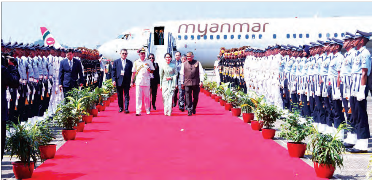
နိုင်ငံတော်၏အတိုင်ပင်ခံပုဂ္ဂိုလ် ဒေါ်အောင်ဆန်းစုကြည် ဂိုအာမြို့၊ ဒါဘိုလင်မြို့သို့ရောက်ရှိရာ အိန္ဒိယသမ္မတနိုင်ငံမှ Minister of state for Foreign Affairs Mr. V. K Singh နှင့် တာဝန်ရှိသူများက လေဆိပ်၌ ကြိုဆိုနှုတ်ဆက်ကြစဉ် (သတင်းစဉ်)

ယင်းနောက် နိုင်ငံတော်၏ အတိုင်ပင်ခံပုဂ္ဂိုလ်သည် Hotel Leela ၌ ဂိုအာပြည်နယ်ဝန်ကြီးချုပ်က BIMSTEC ခေါင်းဆောင်များအား တည်ခင်းဧည့်ခံသည့် နေ့လယ်စာစားပွဲသို့ တက်ရောက်သည်။ (သတင်းစဉ်)