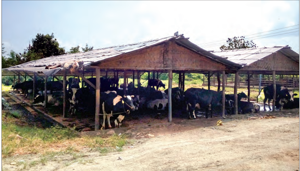
နို့စားနွားမွေးမြူရေးဖြစ်မြဲကို တွေ့ရစဉ်

ပါတယ်။ တရားမဝင် လမ်းကြောင်းကသွားတဲ့ အတွက်ဂိတ်ကြေးတွေ၊ ဆက်ကြေးတွေပေးရတယ်။ ငွေကျပ် ၁၅ သိန်းလောက်ရတဲ့နွားကို အရောင်း အဝယ်လုပ်တဲ့ပွဲစားက နှိမ်ဝယ်တော့ ငါးသိန်း ခြောက်သိန်းလောက်ပဲရတယ်။ တကယ်လို့သာ တရားဝင်ရောင်းမယ်ဆိုရင် ခရီးစရိတ်နဲ့ အခွန်အခ နှစ်သိန်းလောက်ကျရင် မွေးမြူသူတွေအတွက် မမြတ်ဘူးလား။ ရောင်းရတဲ့အခါမှာလည်း ကျီး လန်စာစားနဲ့၊ အဲဒီတော့မွေးမြူရေးက ဖြစ်ထွန်း