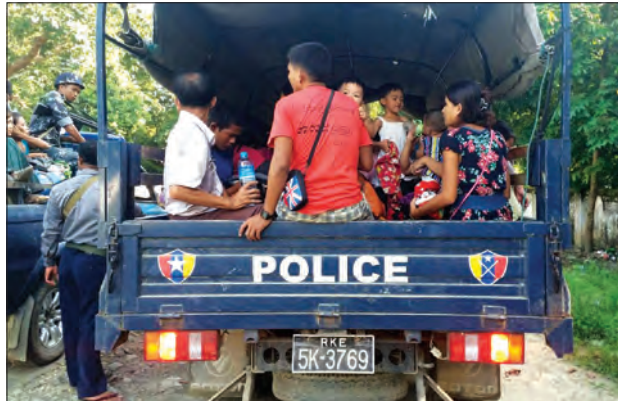
ညနေ ၆ နာရီ မိနစ် ၅၀ ခန့်တွင် မောင်တောမြို့သို့ ကူညီပို့ဆောင်ပေးခဲ့ကြောင်း သိရသည်။