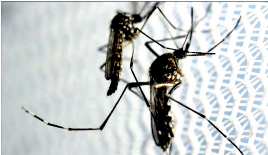
ဗီယက်နမ်ကျန်းမာရေးဝန်ကြီးက ကျန်းမာရေးဌာနများနှင့် ဒေသခံများ အား ရောဂါဖြစ်ပွားမှုကို အနီးကပ် စောင့်ကြည့်ရန်၊ နမူနာပုံစံယူ၍ စစ်ဆေး စမ်းသပ်ရန်၊ ခြင်း၊ ခြင်းသားပေါက်များကို နှိမ်နင်းရန်နှင့် ကိုယ်ဝန်ဆောင်အမျိုးသမီး များကို စောင့်ကြည့်ဂရုစိုက်ရန် တိုက် တွန်းမှာကြားကြောင်း သိရသည်။ (ဆင်ဟွာ)

ဟိုချီမင်း အောက်တိုဘာ ၁၆ ဗီယက်နမ်နိုင်ငံ ဟိုချီမင်းမြို့တော်၌ စနေနေ့က အမျိုးသမီးနှစ်ဦး ဇီကာ ပိုင်းရပ်စ်ကူးစက်ခံရကြောင်း တွေ့ရှိရပြီး နောက်တွင် နိုင်ငံအတွင်း ဇီကာဖြစ်ပွား သည့် လူ ခုနစ်ဦးမြောက်ရှိခဲ့ပြီ ဖြစ် ကြောင်း Ho Chi Minh City Pasteur တက္ကသိုလ်မှ သိရသည်။ မြို့တော်၏ ခရိုင်အမှတ် (၂)မှ အသက် ၂၂ နှစ်အရွယ် အမျိုးသမီးတစ်ဦး နှင့် ခရိုင်အမှတ် (၁၂)မှ အသက် ၄၃ နှစ် အရွယ် အမျိုးသမီးတစ်ဦးတို့တွင် ရောဂါ ဖြစ်ပွားကြောင်းတွေ့ရှိရပြီး ကယ်ဆယ်မှု ပြုလုပ်ထားကြောင်း သိရသည်။ ဇီကာပိုင်းရပ်စ် ကူးစက်ခံရသူ ခုနစ်ဦးအနက် လေးဦးမှာ မြို့တော် ဟိုချီမင်းမြို့ဖြစ်ပြီး တစ်ဦးမှာ တောင်ပိုင်း ဘင်ဒွိုင်ပြည်နယ်မှဖြစ်ကာ နှစ်ဦးမှာ အလယ်ပိုင်း ခန့်ဟွာပြည်နယ်နှင့် ဖူရန် ပြည်နယ်တို့မှ ဖြစ်သည်။