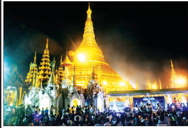
ရွှေတိဂုံစေတီတော်၌ သီတင်းကျွတ်လပြည့်ညက ဘုရားဖူးကုသိုလ်ယူ ပြည်သူများဖြင့် အေးချမ်းစည်ကားနေမှုကို တွေ့ရစဉ်