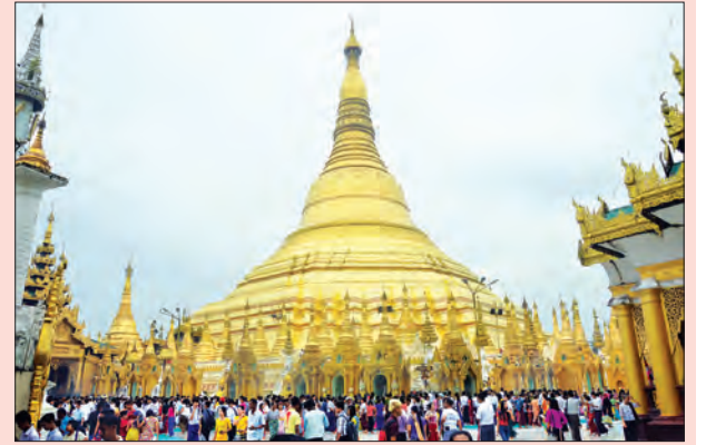
သတင်း၊ စာမျက်နှာ-၇