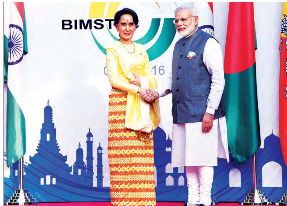
နိုင်ငံတော်၏အတိုင်ပင်ခံပုဂ္ဂိုလ် ဒေါ်အောင်ဆန်းစုကြည်အား အိန္ဒိယသမ္မတနိုင်ငံဝန်ကြီးချုပ် မစ္စတာ နာရန်ဒရာမိုဒီ ရင်းရင်းနှီးနှီးနှုတ်ဆက်စဉ် (သတင်းစဉ်)