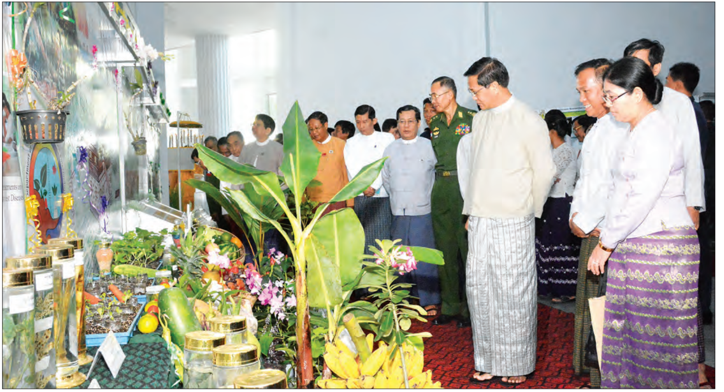
ဒုတိယသမ္မတ ဦးဟင်နရီပန်ထီးယူ ခင်းကျင်းပြသထားသည့် စိုက်ပျိုးရေးနှင့် မွေးမြူရေးတက္ကသိုလ်များ၏ ဘာသာရပ်အလိုက် ပြခန်းများ၊ ဝန်ကြီးဌာန ပြခန်းများကို လှည့်လည်ကြည့်ရှု အားပေးစဉ် (သတင်းစဉ်)