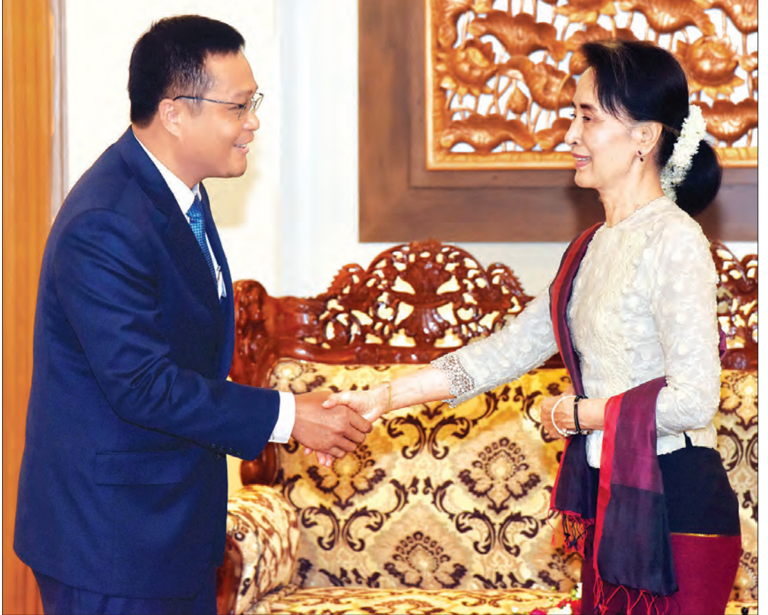
နိုင်ငံတော်၏အတိုင်ပင်ခံပုဂ္ဂိုလ် ဒေါ်အောင်ဆန်းစုကြည် ပြည်ထောင်စုသမ္မတမြန်မာနိုင်ငံတော်ဆိုင်ရာ ကမ္ဘောဒီးယားနိုင်ငံ သံအမတ်ကြီး မစ္စတာ ဆော့ချီအား ရင်းရင်းနှီးနှီးနှုတ်ဆက်စဉ် (သတင်းစဉ်)

နိုင်ငံတော်၏အတိုင်ပင်ခံပုဂ္ဂိုလ် နိုင်ငံခြားရေးဝန်ကြီးဌာန ပြည်ထောင်စုဝန်ကြီး ဒေါ်အောင်ဆန်းစုကြည်သည် ပြည်ထောင်စုသမ္မတ မြန်မာနိုင်ငံတော်ဆိုင်ရာ ကမ္ဘောဒီးယားနိုင်ငံ သံအမတ်ကြီး မစ္စတာ ဆော့ချီနှင့် ယနေ့နံနက် ၉ နာရီ ၄၅ မိနစ်တွင် နေပြည်တော်ရှိ နိုင်ငံခြားရေးဝန်ကြီးဌာန ဧည့်ခန်းမ၌ တွေ့ဆုံသည်။ တွေ့ဆုံစဉ် မြန်မာနှင့် ကမ္ဘောဒီးယားနိုင်ငံတို့ ဟိုတယ်နှင့်ခရီးသွားလာရေးကဏ္ဍ၊ ယဉ်ကျေးမှုကဏ္ဍ၊ ပို့ဆောင်ရေးကဏ္ဍ၊ ကုန်သွယ်ရေးကဏ္ဍများ၌ ပူးပေါင်းဆောင်ရွက်မှုတိုးမြှင့်ရေး ဆွေးနွေးကြသည်။ ထို့ပြင် နိုင်ငံတော်၏အတိုင်ပင်ခံပုဂ္ဂိုလ် နိုင်ငံခြားရေးဝန်ကြီးဌာန ပြည်ထောင်စုဝန်ကြီးသည် ပြည်ထောင်စုသမ္မတ မြန်မာနိုင်ငံတော်ဆိုင်ရာ အီဂျစ်အာရပ်သမ္မတနိုင်ငံ သံအမတ်ကြီး မစ္စတာ ခါလဒ်မိုဟာမက် အဗ္ဗဒဲလ်ရာမန် အဗ္ဗဒဲလ်ဆာလမ်နှင့်လည်း နံနက် ၁၀ နာရီတွင် နိုင်ငံခြားရေးဝန်ကြီးဌာန ဧည့်ခန်းမ၌ တွေ့ဆုံခဲ့သည်။ (သတင်းစဉ်)