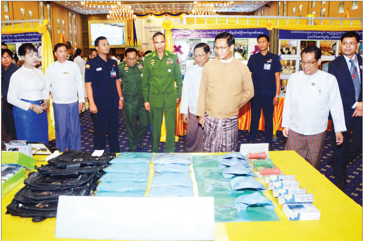
ဒုတိယသမ္မတ ဦးဟင်နရီဗန်ထီးယူ သဘာဝဘေးလျော့ပါးရေးအတွက် ဆောင်ရွက် ခဲ့မှု မှတ်တမ်းပြခန်းနှင့် အရေးပေါ်ကယ်ဆယ်ရေး အထောက်အကူပြုပစ္စည်းများ ကို ကြည့်ရှုစဉ် (သတင်းစဉ်)