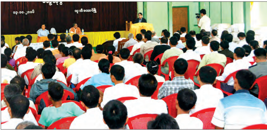
ပြည်ထောင်စုဝန်ကြီး ဒေါက်တာစေမြင့် ဒေသခံပြည်သူများနှင့် ဌာနဆိုင်ရာဝန်ထမ်းများအား ရှင်းလင်းပြောကြားစဉ်