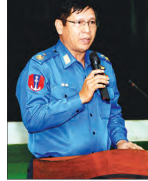
ဒုတိယဝန်ကြီး ဝိုလ်ချုပ်မြင့်နွယ် ရှင်းလင်းပြောကြားစဉ်