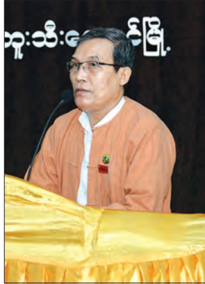
ပြည်နယ်ဝန်ကြီးချုပ် ဦးညီပု

ပြည်ထောင်စု ဝန်ကြီးများနှင့် အဖွဲ့သည် ဘူးသီးတောင်မြို့ပေါ်အနီးရပ်ကွက်၊ ကျေးရွာအုပ်စုရှိ အစ္စလာမ်ဘာသာဝင်များနှင့် မွန်းလွဲ ၁ နာရီ ၁၅ မိနစ်တွင် မြို့နယ်အထွေထွေအုပ်ချုပ်ရေးမှူးရုံး၌ တွေ့ဆုံခဲ့သည်။ (သတင်းစဉ်)