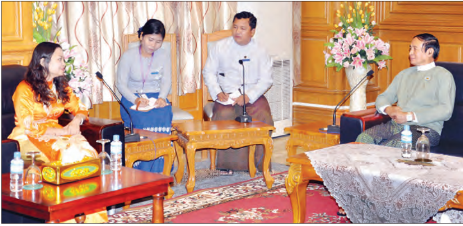
ပြည်သူ့လွှတ်တော်ဥက္ကဋ္ဌ ဦးဝင်းမြင့်နှင့် ဗီယက်နမ်နိုင်ငံ သံအမတ်ကြီး မစ္စ လုသိုဇွန်းတို့ ဆွေးနွေးစဉ်