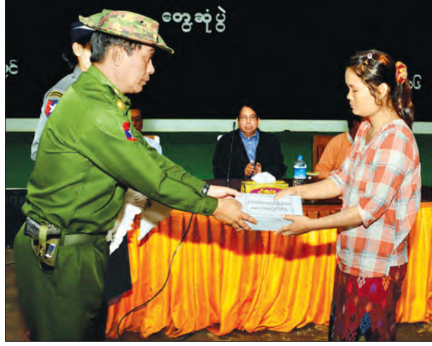
ဒုတိယဝန်ကြီး ဝိုလ်ချုပ်သန်းထွဋ် အောက်တိုဘာ ၉ ရက် ဖြစ်စဉ်တွင် ကျဆုံး၊ ဒဏ်ရာရရှိသည့် တပ်ဖွဲ့ဝင် မိသားစုဝင်များအား ထောက်ပံ့ငွေ ပေးအပ်စဉ်