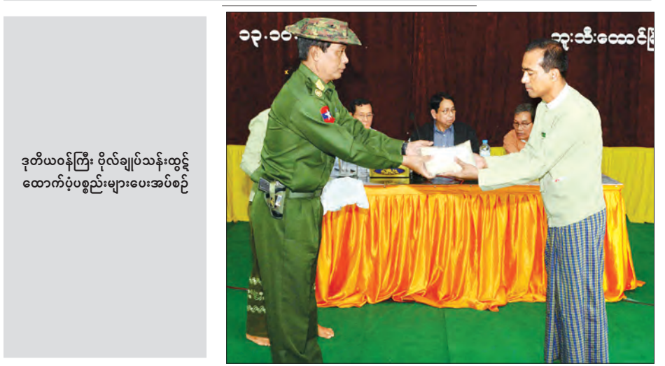
ဒုတိယဝန်ကြီး ဝိုလ်ချုပ်သန်းထွဋ် ထောက်ပံ့ပစ္စည်းများပေးအပ်စဉ်