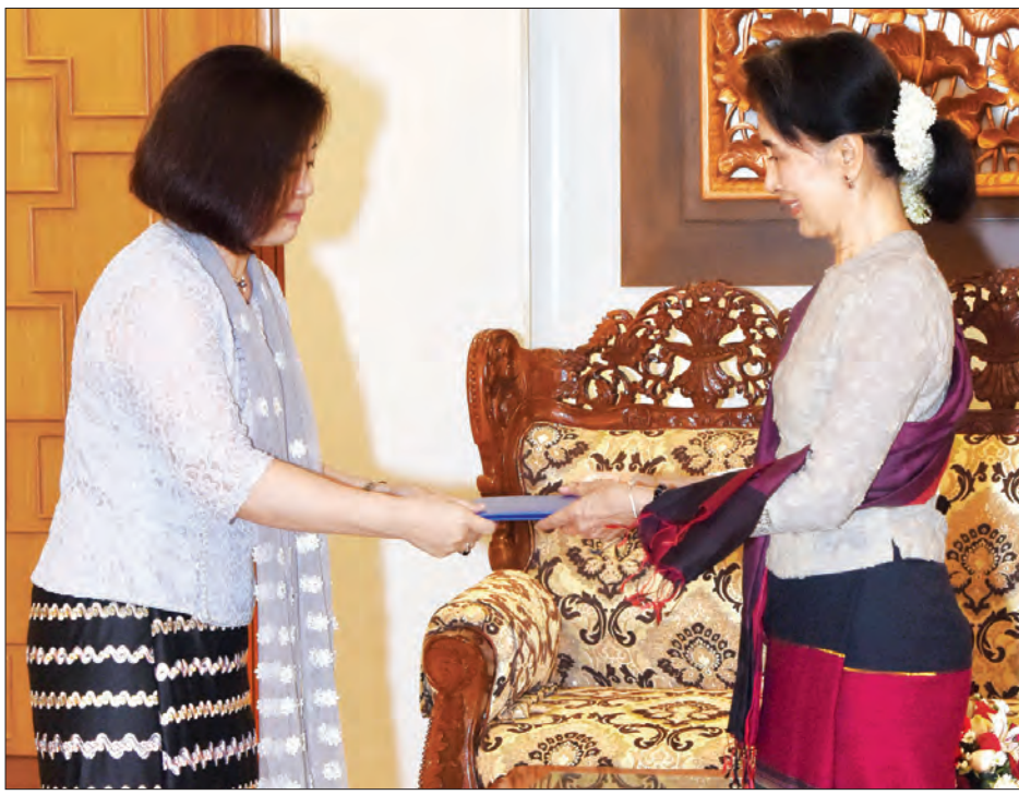
နိုင်ငံတော်၏အတိုင်ပင်ခံပုဂ္ဂိုလ် ဒေါ်အောင်ဆန်းစုကြည်အား ကုလသမဂ္ဂစားနပ်ရိက္ခာနှင့် စိုက်ပျိုးရေးအဖွဲ့ (FAO) ၏ မြန်မာနိုင်ငံဆိုင်ရာ ဌာနကော်မတီလှည့်လည် အစည်းအဝေးအစီအစဉ် Ms. Xiaojie Fan ၎င်း၏ ဌာနကော်မတီလှည့်လည် အစည်းအဝေးအစီအစဉ် ပေးအပ်စဉ် (သတင်းစဉ်)