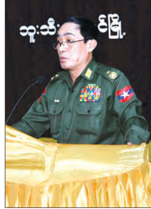
ဒုတိယဝန်ကြီး ဝိုလ်ချုပ်သန်းထွဋ်