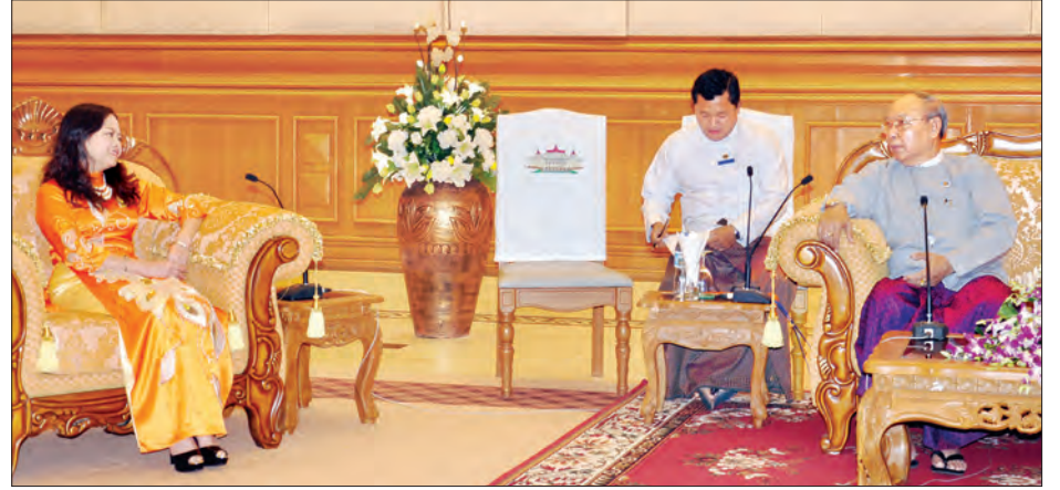
အမျိုးသားလွှတ်တော်ဥက္ကဋ္ဌ မန်းဝင်းခိုင်သန်းနှင့် ဗီယက်နမ်နိုင်ငံ သံအမတ်ကြီး မစ္စ လုသိုဇွန်းတို့ ဆွေးနွေးစဉ်

နေပြည်တော် အောက်တိုဘာ ၁၃ အမျိုးသားလွှတ်တော်ဥက္ကဋ္ဌ မန်းဝင်းခိုင်သန်းသည် ပြည်ထောင်စုသမ္မတ မြန်မာနိုင်ငံတော်ဆိုင်ရာ ဗီယက်နမ်နိုင်ငံ သံအမတ်ကြီး မစ္စ လုသိုဇွန်း အား ယနေ့ မွန်းလွဲ ၂ နာရီတွင် နေပြည်တော်ရှိ အမျိုးသားလွှတ်တော် ဧည့်ခန်းမဆောင်၌ လက်ခံတွေ့ဆုံသည်။ တွေ့ဆုံစဉ် နှစ်နိုင်ငံ ချစ်ကြည်ရင်းနှီးမှုတိုးမြှင့်ရေး၊ ပူးပေါင်းဆောင်ရွက်ရေးဆိုင်ရာ ကိစ္စရပ်များကို ဆွေးနွေးကြသည်။ တွေ့ဆုံပွဲသို့ အမျိုးသားလွှတ်တော် ဒုတိယဥက္ကဋ္ဌ ဦးအေးသာအောင်နှင့် အမျိုးသားလွှတ်တော်ရုံးမှ တာဝန်ရှိသူများ တက်ရောက်ကြသည်။ (သတင်းစဉ်)