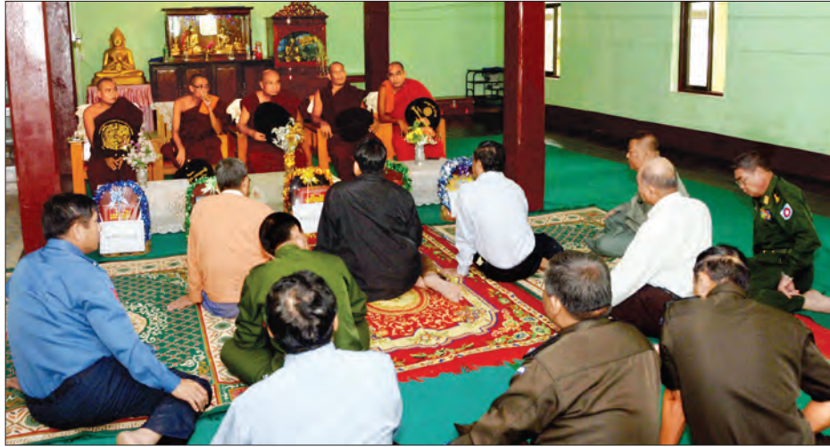
ဘူးသီးတောင်မြို့နယ် သံဃနာယကအဖွဲ့၊ ဥက္ကဋ္ဌနှင့် အဖွဲ့ဝင်ဆရာတော်ကြီးများထံမှ ပြည်ထောင်စုဝန်ကြီးများ၊ ပြည်နယ်ဝန်ကြီးချုပ်နှင့်အဖွဲ့၊ ဩဝါဒခံယူစဉ်

ဘူးသီးတောင်မြို့နယ် သံဃနာယကအဖွဲ့၊ ဥက္ကဋ္ဌနှင့်အဖွဲ့ဝင် ဆရာတော်ကြီးများအား ပြည်ထောင်စုဝန်ကြီးများ၊ ပြည်နယ်ဝန်ကြီးချုပ်နှင့်အဖွဲ့က ယနေ့နံနက် ၁၁ နာရီတွင် ဘူးသီးတောင်မြို့ရှိ အေးစေတီကျောင်း၌ သွားရောက်စူးမြော်ကြည့်၍ ဆရာတော်များထံမှ ဩဝါဒခံယူပြီး လှူဖွယ်ပစ္စည်းများ ဆက်ကပ်လှူဒါန်းသည်။