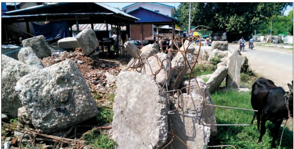
မှစွန့်ပစ်ပစ္စည်းများကို လမ်းနယ်တွင် ပရမ်းပတာ စုပုံထားသဖြင့် အမြန်ဖယ်ရှား ရှင်းလင်းပေးရန် လိုလားလျက်ရှိကြောင်း သိရသည်။ စစ်ကြည်(စလင်း)

မကွေးတိုင်းဒေသကြီး စလင်းမြို့ လူစည်ကားရာလမ်းနယ်တွင် ဆောက်လုပ်ဆဲကန်ထရိုက် အဆောက်အအုံမှ အန္တရာယ်ဖြစ်စေနိုင်သော ကျောက်တုံးကြီးများ(သစ်ချွန်ကြီးများပါ)အား လမ်းနံဘေးတွင် ပရမ်းပတာထိုးထိုးထောင်ထောင်စွန့်ပစ်စုပုံထားသဖြင့် မော်တော်ယာဉ်များနှင့် ခရီးသွားပြည်သူများက ထိခိုက်မည်ကို စိုးရိမ်နေကြသည်။ အဆိုပါလုပ်ငန်းမှာ မီးသတ်ရုံးအဆောက်အအုံအသစ်အား ကုမ္ပဏီတစ်ခုက တာဝန်ယူဆောင်ရွက်နေပြီး ကန်ထရိုက်ပါ စည်းကမ်းဖြစ်သော ပြည်သူအများအား စိတ်ပျိုငြင်ထိခိုက်စေနိုင်သောနေရာများအား အန္တရာယ်ရှိနယ်မြေသတ်ပေးအမှတ်အသားထောင်ထားခြင်းမရှိဘဲ အဆောက်အအုံဟောင်း