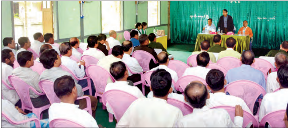
ပြည်ထောင်စုဝန်ကြီးနှင့်အဖွဲ့၊ ဘူးသီးတောင်မြို့ပေါ်အနီးရပ်ကွက်၊ ကျေးရွာအုပ်စုရှိ အစ္စလာမ်ဘာသာဝင်များနှင့်တွေ့ဆုံစဉ်