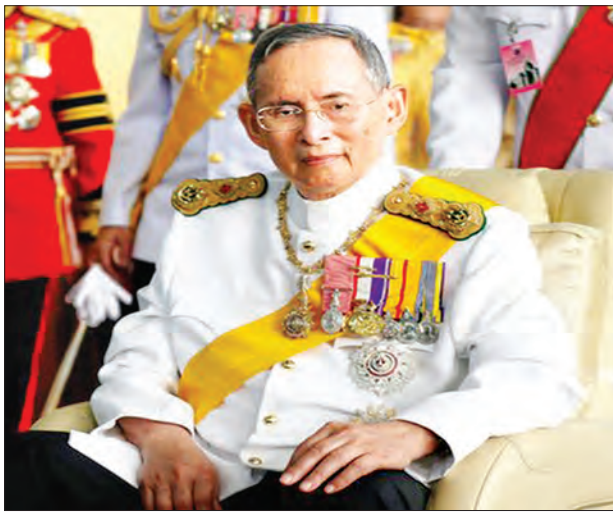
သရဖူဆောင်းမင်းသား အသက် ၆၃ နှစ် ထိုင်းနိုင်ငံ၏ ဘုရင်ဖြစ်လာမည်ဟု ရို မဟာဗာဂျီရာလောင်ကွမ်သည် ခန့်မှန်းရသည်။ (ရိုက်တာ)

ကမ္ဘာ့သက်တမ်းအရှည်ဆုံး တိုင်းပြည်ကို စိုးစံအုပ်ချုပ်ခဲ့သည့် ထိုင်းဘုရင်ဘူမိဘော အနုလျာဒက်ဂျီသည် အောက်တိုဘာ ၁၃ ရက် သက်တော် ၈၈ နှစ်အရွယ်တွင် ဆေးရုံ၌ ကံတော်ကုန်ခဲ့ကြောင်း သိရသည်။ နတ်ရွာစံရသည့် အကြောင်းရင်းကို တော်ဝင်နန်းတော်က အသေးစိတ်ဖော်ပြခြင်းမပြုပေ။ ဘုရင်ကြီးသည် ဆီရီရက်ဂျီဆေးရုံတွင် ငြိမ်းချမ်းစွာ နတ်ရွာစံသွားကြောင်း တော်ဝင်နန်းတော်က ပြောသည်။ ၎င်းသည် ဒေသစံတော်ချိန် ညနေ ၃ နာရီ ၅၂ မိနစ်တွင် ကွယ်လွန်အနိစ္စ ရောက်သွားကြောင်း သိရ သည်။ ၎င်း၏သားတော်လည်းဖြစ် အရိုက်အရာ ဆက်ခံမည့်သူလည်းဖြစ်သည့်