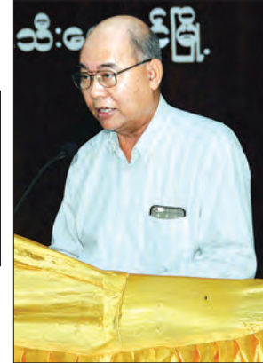
ဒုတိယဝန်ကြီး ဦးခင်မောင်တင်