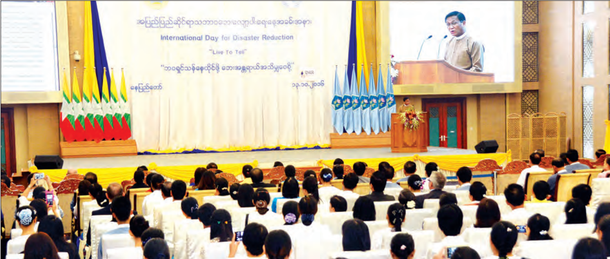
ဒုတိယသမ္မတ ဦးဟင်နရီစန်ထီးယူ အပြည်ပြည်ဆိုင်ရာသဘာဝဘေးလျော့ပါးရေးနေ့အခမ်းအနားတွင် အမှာစကားပြောကြားစဉ် (သတင်းစဉ်)