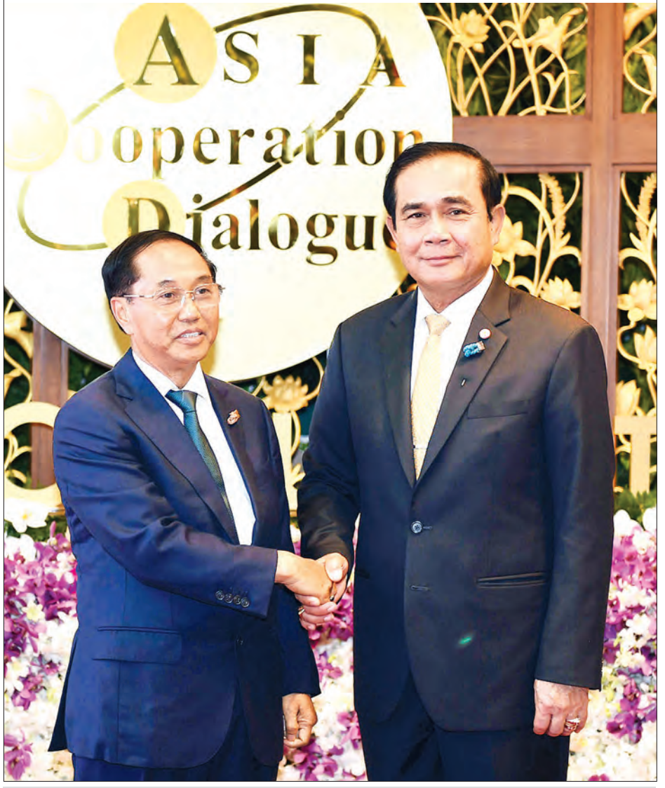
ဒုတိယသမ္မတ ဦးမြင့်ဆွေ အေစီဒီထိပ်သီးအစည်းအဝေးသို့တက်ရောက်လာရာ ထိုင်းနိုင်ငံဝန်ကြီးချုပ် ဝိုလ်ချုပ်ကြီး ပရာယုဒ်ချန်အိုချာ က ရင်းရင်းနှီးနှီးဆက်ဆံစဉ် (သတင်းစဉ်)

အစည်းအဝေးမှ ဗန်ကောက်ကြေညာ စာတမ်း၊ အာရှပူးပေါင်းဆောင်ရွက်ရေး ဆိုင်ရာ အေစီဒီအဖွဲ့၏ ရှေ့မျှော်မှန်းချက် ၂၀၃၀ နှင့် အဖွဲ့ဝင်နိုင်ငံများအကြား ဆက်သွယ်ချိတ်ဆက်မှုဖြင့် ဒေသတွင်း ဖွံ့ဖြိုးတိုးတက်မှုကိုရည်ရွယ်သော အေစီဒီ ကြေညာစာတမ်းတို့ကို ထုတ်ပြန်ခဲ့ပြီး အေစီဒီ ယာယီအတွင်းရေးမှူးချုပ်ရုံးအား အမြဲတမ်းရုံးအဖြစ် တိုးမြှင့်ဖွင့်လှစ်ရန် သဘောတူညီခဲ့သည်။ အာရှ ပူးပေါင်းဆောင်ရွက်ရေး ဆွေးနွေးပွဲ(အေစီဒီ)ကို ၂၀၀၂ ခုနှစ်တွင် ထိုင်းနိုင်ငံ ဟွာဟင်းမြို့၌ အရှေ့တောင် အာရှ အရေးအလယ်ပိုင်းနှင့် အရှေ့အာရှ နိုင်ငံများဖြင့် စတင်ဖွဲ့စည်းခဲ့ပြီး ယခုအခါ အဖွဲ့ဝင်နိုင်ငံပေါင်း၃၄နိုင်ငံ ပါဝင်လျက်ရှိ သည်။ အေစီဒီ ပူးပေါင်းဆောင်ရွက်မှုများ တွင် အာရှဒေသတွင်းအပြန်အလှန် ဖိုဆို အားထားမှု တိုးမြှင့်ခြင်းဖြင့် အာရှဒေသ ၏ ဘုံခွန်အားစုနှင့် အခွင့်အလမ်းများကို ပြသနိုင်ရေး၊ နိုင်ငံတကာဈေးကွက်တွင် အာရှစီးပွားရေးအသိုက်အဝန်း ထူထောင် ရေး၊ အာရှဒေသတွင်း ကုန်သွယ်ရေးနှင့် ငွေကြေးဈေးကွက်တိုးမြှင့်နိုင်ရေး၊ အာရှ နိုင်ငံများအကြား စီးပွားရေးဖွံ့ဖြိုး တိုးတက်မှုညီမျှစေရေးတို့ကို ရည်ရွယ်၍ နိုင်ငံပေါင်း ၁၈နိုင်ငံဖြင့် စတင်ဖွဲ့စည်းခဲ့ပြီး မြန်မာနိုင်ငံသည် စတင်တည်ထောင် ဖွဲ့စည်းချိန်ကပင် အဖွဲ့ဝင်နိုင်ငံ ဖြစ်ခဲ့ သည်။ အေစီဒီသည် စည်းကမ်းတော်များ တင်းကျပ်စွာချမှတ်ပြီး တရားဝင်ဖွဲ့စည်း ထားသည့် နိုင်ငံရေးဆိုင်ရာ အဖွဲ့အစည်း မျိုးမဟုတ်ဘဲ အဖွဲ့ဝင်နိုင်ငံများအကြား ဖွံ့ဖြိုးတိုးတက်ရေးအတွက် စီးပွားရေး၊ လူမှုရေးကိစ္စရပ်များကို လွတ်လပ်စွာ ဆွေးနွေးနိုင်ရေးအတွက် ရည်ရွယ် ဖွဲ့စည်းထားသည့် ဒေသတွင်း ပူးပေါင်း ဆောင်ရွက်မှုဆိုင်ရာ အဖွဲ့အစည်း ဖြစ် သည်။ အေစီဒီအဖွဲ့အနေဖြင့် နိုင်ငံခြားရေး