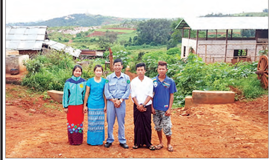
ပင်းတယမြို့နယ် သရက်ကုန်းကျေးရွာ၌ အမှတ်တရ

ရွာငုံမြို့နယ်ထဲကနေပြန်ထွက်လာကြတော့ နေအတော်စောင်းခဲ့ပြီဖြစ်၏။ အပြန်တွင် မြင်းကျွန်းဘက်မှ မပြန်တော့ဘဲ ဖြတ်လမ်းအတိုင်း မောင်းခဲ့ကြပြီး တောင်ပေါ်ကြီးရွာမှတစ်ဆင့် ပင်းတယမြို့သို့ ဖြတ်ဆင်းခဲ့ကြသည်။ တောင်ပေါ်ကြီးရွာဆိုသည့်အတိုင်း တောင်ပေါ်တွင် မြို့ကလေးတစ်မြို့ပမာသာသာယာယာရှိနေသော ရွာတစ်ရွာပါပေ။ ခေတ္တတည်းခိုရာနေရာသို့အရောက် နေဝင်ပြီးဖျေအချိန်မှာ လှမ်း၍တွေ့မြင်နေရသော ရွှေဥမင်သဘာဝလိုဏ်ဂူဘုရားများဆီသို့ ဦးခိုက်ဖူးမြော်လိုက်မိသည်။ နောက်တစ်နေ့နံနက်စောစောတွင် ပင်းတယမြို့ကို နှုတ်ဆက်ရင်း ပြန်လည်ထွက်ခွာခဲ့ကြပါသည်။ ပင်းတယမြို့၏အထင်ကရ ပုန်းတလုတ်ရေကန်ကြီးက တဖြည်းဖြည်း ဝေး၍ဝေး၍ ကျန်ခဲ့သည်။ ။