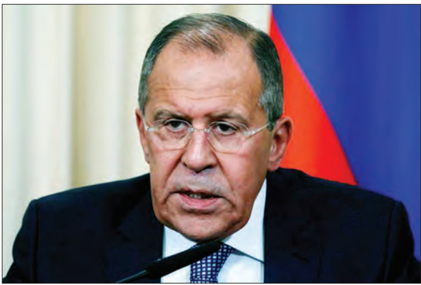
ဆက်ဆံရေးကို ပိုမိုဆိုးရွားစေခဲ့သည်။ အမေရိကန်-ရုရှားဆက်ဆံရေးယုံသွင်းလာခြင်း နှင့်ပတ်သက်ပြီး အိုဘားမားအစိုးရကို လက်ပံရောပက ပြစ်တင်လိုက်ကြောင်း

မော်စကို အောက်တိုဘာ ၁၀ မော်စကိုနှင့်ပတ်သက်ပြီး အမေရိကန် တို့၏ ရန်လိုမှု မြင့်တက်လာခြင်းကို ၎င်းအနေဖြင့် သတိပြုမိလာကြောင်း ရုရှားနိုင်ငံခြားရေးဝန်ကြီး ဆာဂျီလက်ပံ ရောပက အောက်တိုဘာ ၉ ရက်တွင် ပြောခဲ့သည်။ အမေရိကန်၏ ရန်လိုသော လုပ်ဆောင်မှုများက ရုရှား၏နိုင်ငံတော် လုံခြုံရေးကို ခြိမ်းခြောက်လျက်ရှိ ကြောင်း ၎င်းကဆက်လက် ပြောကြား ခဲ့သည်။ ရုရှားရုပ်မြင်နှင့် တွေ့ဆုံ အင်တာဗျူး မှုက အမေရိကန်နှင့် ရုရှားတို့၏ ရိုင်းစွဲ