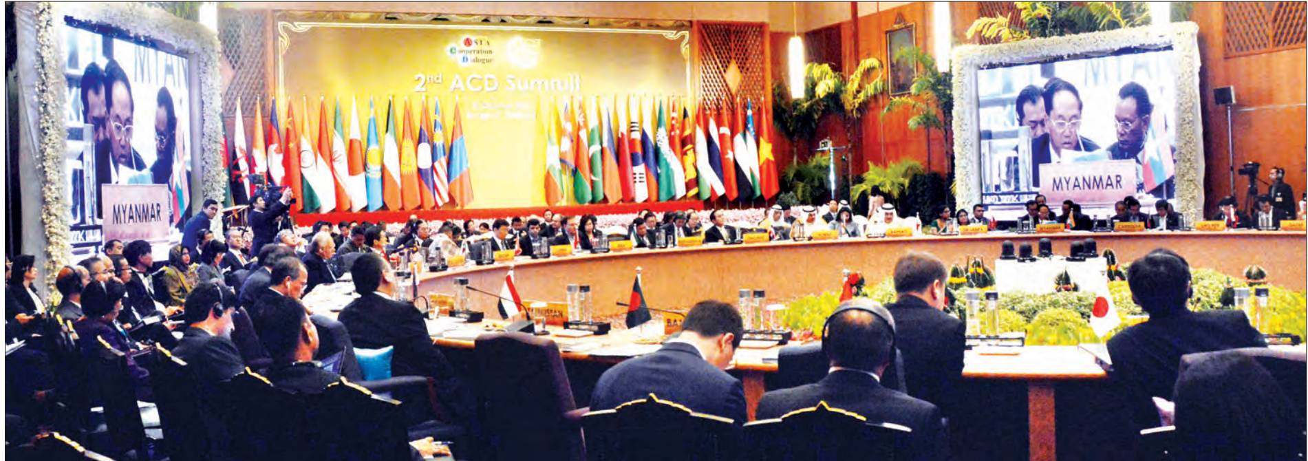
ဒုတိယသမ္မတ ဦးမြင့်ဆွေ ဒုတိယအကြိမ် အာရှပူးပေါင်းဆောင်ရွက်ရေးဆွေးနွေးပွဲ(အေစီဒီ) ထိပ်သီးအစည်းအဝေးတွင် မိန့်ခွန်းပြောကြားစဉ် (သတင်းစဉ်)