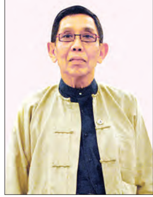
ပါမောက္ခ ဒေါက်တာ အောင်ထွန်းသက်

အမေရိကန်နိုင်ငံက မြန်မာနိုင်ငံအပေါ် စီးပွားရေးအရ ဒဏ်ခတ်ပိတ်ဆို့မှုများကို ဖြေလျှော့ပေးလိုက်သကဲ့သို့ အမည်ပျက်စာရင်းသွင်းကာ အရေးယူပိတ်ဆို့ထားသည့်အဖွဲ့အစည်းများ၊ စီးပွားရေး လုပ်ငန်းရှင်များကို ပြီးခဲ့သည့် အောက်တိုဘာ ၇ ရက်က ပယ်ဖျက်ပေးခဲ့သည်။ နိုင်ငံတော်၏အတိုင်ပင်ခံပုဂ္ဂိုလ် ဒေါ်အောင်ဆန်းစုကြည်နှင့် အမေရိကန်သမ္မတအိုဘားမားတို့ တွေ့ဆုံမှုအပြီး ထိုပယ်ဖျက်မှုကို အမေရိကန်သမ္မတက လက်မှတ်ရေးထိုးကာ တရားဝင်ထုတ်ပြန်လိုက်ခြင်းဖြစ်သည်။