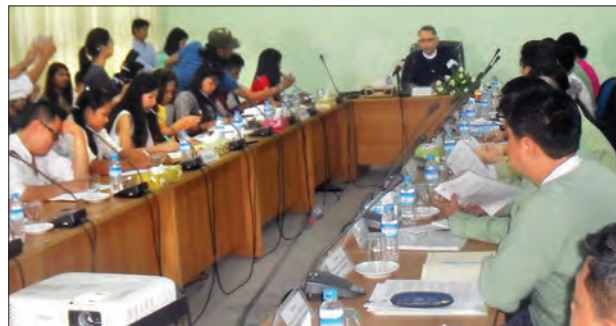
ရင်းနှီးမြှုပ်နှံမှုနှင့် ကုမ္ပဏီများညွှန်ကြားမှုဦးစီးဌာနရုံး၌ စာနယ်ဇင်းရှင်းလင်းပွဲပြုလုပ်စဉ်

အဆိုပါ(၁၈/၂၀၁၆)အစည်းအဝေးတွင် နိုင်ငံခြားရင်းနှီးမြှုပ်နှံမှုဥပဒေအရ နိုင်ငံခြားရင်းနှီးမြှုပ်နှံမှု လုပ်ငန်းအရေအတွက် ခုနစ်ခုခွင့်ပြုခဲ့ပြီး ရင်းနှီးမြှုပ်နှံမှုမဟာဏ အမေရိကန်ဒေါ်လာသန်းပေါင်း ၂၃၉ ဒသမ ၆၁၇ နှင့် ပြည်တွင်းလုပ်သားများအတွက် အလုပ်အကိုင် ၄၅၆၉ ခု ဖန်တီးပေးနိုင်ခဲ့ကြောင်း။