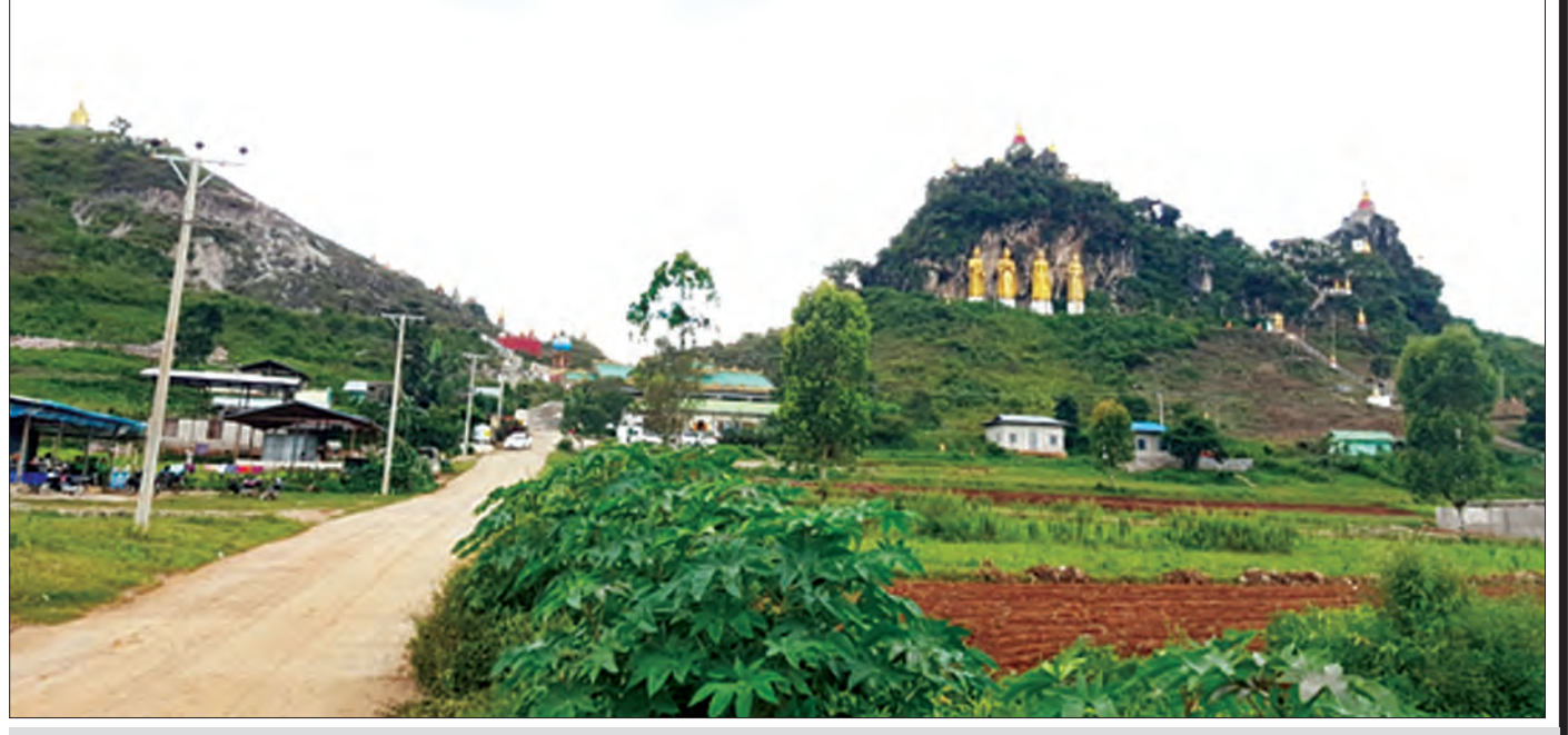
မြင်းကျွန်းနှင့် ရွာငုံအကြားရှိ မိန်းမရဲသခင်မတောင်

နေရာတွင် နိုင်ငံတော်၏အတိုင်ပင်ခံပုဂ္ဂိုလ် ဒေါ်အောင်ဆန်းစုကြည်ကို ဂုဏ်ပြုသောအားဖြင့် ငြိမ်းချမ်းရေးဥယျာဉ်တစ်ခု တည်ဆောက်လျက်ရှိသည်။ ဝိုင်းချုပ်အောင်ဆန်းရုပ်တုအပါအဝင် ရုပ်တုများကိုလည်း မှာယူထားပြီးဖြစ်ကြောင်း၊ နောင်တွင်ဒေသခံများ လာရောက်အပန်းဖြေနားနေနိုင်ရေး ကလေးကစားကွင်းများလည်း ပြုလုပ်ထားရှိသွားမည်ဖြစ်ကြောင်း သိရ၏။ ငြိမ်းချမ်းရေးဥယျာဉ်တွင် သစ်ပင်နှင့်