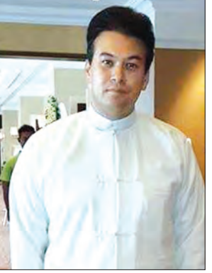
ဒေါက်တာ အောင်သူရ

မြန်မာနိုင်ငံအပေါ် ၁၉၉၇ ခုနှစ်ကတည်းက ချမှတ်ထားသည့် ဒဏ်ခတ်ပိတ်ဆို့မှုများကို ယခုကဲ့သို့ ဖြေလျှော့ပေးလိုက်ခြင်းဖြင့် ဖြစ်ပေါ်လာနိုင်သည့် နိုင်ငံ၏စီးပွားရေးအခြေအနေအနာဂတ်အလားအလာများနှင့်စပ်လျဉ်း၍ စီးပွားရေးပညာရှင်များ၏ သုံးသပ်ခန့်မှန်းချက်များကို ထုတ်နုတ်တင်ပြလိုက်ရပါသည်။