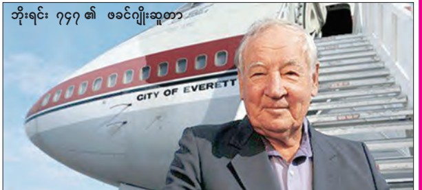
ဘိုးရင်း ၇၄၇ ၏ ဖခင်ဂျိုးဆူတာ

ဘိုးရင်း ၇၄၇ လေယာဉ်သည် လေယာဉ်တည်ဆောက်မှုနည်းပညာတွင် ပြောင်းလဲမှုဖြစ်စေခဲ့သည်။ ဘိုးရင်း ၇၄၇ လေယာဉ်၏ လေယာဉ်ဦးခန်းသည် ဘိုးရင်း ၇၄၇ ထက်စာလျှင် မြေပြင်မှ သုံးဆမြင့်မားသည်။ ဘိုးရင်း ၇၄၇ ၏ တရားဝင် လေယာဉ်ပြေးဆွဲမှုကို ၁၉၇၀