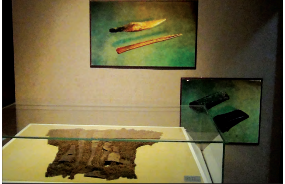
သံကွင်းများဖြင့် ချိတ်ဆက်ပြုလုပ်ထားသည့် ရှေးဟောင်းတိုက်ပွဲဝင်အင်္ကျီကို တာချန်းနယ်မြေ အိမ်ကောင်တီမြို့ရှိ ပြတိုက် တွင် တွေ့ရစဉ်

တရုတ်နိုင်ငံတွင် မြေယာကိစ္စရပ်များ အရေးပါလာမှု၊ စက်မှုဇုန်များပေါ်ထွန်းလာမှုနှင့် လူဦးရေတိုးပွားလာမှု အခြေအနေများအရ တာချန်းမြို့နယ်တွင်လည်း စိုက်ပျိုး၊ စာမျက်နှာ ၉ သို့