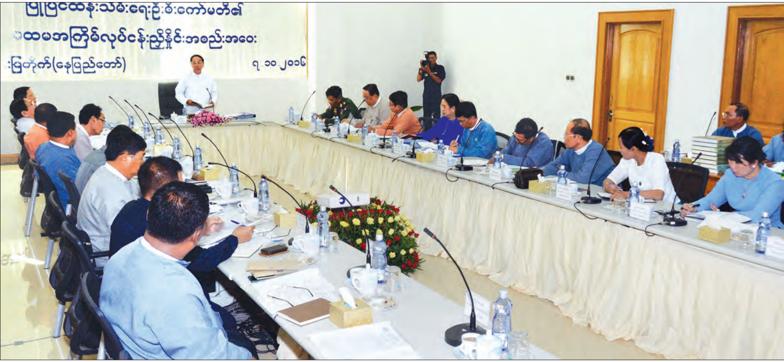
ဒုတိယသမ္မတ ဦးမြင့်ဆွေ ငလျင်ဒဏ်ကြောင့် ပျက်စီးသွားခဲ့သည့် ပုဂံ - ညောင်ဦးဒေသရှိ ရှေးဟောင်းဘုရား၊ စေတီပုထိုးများနှင့် သာသနိကအဆောက်အအုံများ ပြုပြင်ထိန်းသိမ်းရေးဦးစီးကော်မတီ၏ ပထမအကြိမ် လုပ်ငန်းညှိနှိုင်းအစည်းအဝေးတွင် အမှာစကားပြောကြားစဉ် (သတင်းစဉ်)

ဩဂုတ် ၂၄ ရက် ညနေပိုင်းက လှုပ်ခတ်ခဲ့သည့် ရစ်ချ်တာစကေး အင်အား ၆ ဒသမ ၈ အဆင့်ရှိ မြေငလျင် လှုပ်ခတ်မှုကြောင့် မန္တလေးတိုင်းဒေသကြီး၊ စစ်ကိုင်းတိုင်းဒေသကြီး၊ ရခိုင်ပြည်နယ်တို့၌ ထိခိုက်ပျက်စီးမှုများ ဖြစ်ပေါ်ခဲ့ပါကြောင်း။ ငလျင်ဒဏ်ကြောင့် ပုဂံဒေသ၌ ထိခိုက်ပျက်စီးမှု အများဆုံး ဖြစ်ပေါ်ခဲ့ပါကြောင်း။ ထိခိုက်ပျက်စီးမှုများကို ဩဂုတ် ၂၅ ရက်တွင် နိုင်ငံတော် သမ္မတက လှည့်လည်ကြည့်ရှုစစ်ဆေးခဲ့ပြီး လမ်းညွှန်ချက်ရစ်ချက် ချမှတ်ပေးခဲ့ပါကြောင်း။ အထူးသဖြင့် ထိခိုက်မှုများ ဆုံးရှုံးစွာ ဆက်လက်မဖြစ်ပေါ်အောင် အမိုးအကာ ပြုလုပ်ထားရန်၊ ထိခိုက်မှု မရှိသည့် ဘုရားပုထိုးစေတီများကို ဘုရားဖူး ဧည့်သည်များ ဝင်ရောက်ဖူးမြော်နိုင်အောင် စီစဉ်ဆောင်ရွက်ပေးရန် ပြန်လည်ပြုပြင် ထိန်းသိမ်းရေးလုပ်ငန်းများ ဆောင်