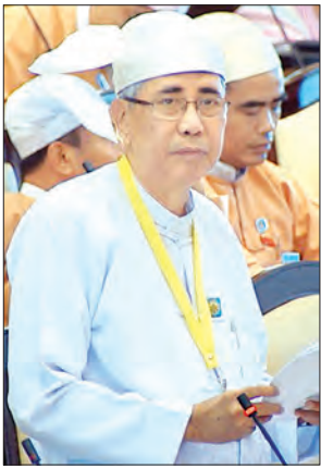
ဦးကျော်မျိုး ဒုတိယဝန်ကြီး

နေပြည်တော် အောက်တိုဘာ ၇ ကိုယ်စားလှယ်များအနေဖြင့် လွှတ်တော် အစည်းအဝေး ရပ်နားထားစဉ်တွင် ပြည်သူ့ဆန္ဒ၊ ပြည်သူ့ဘဝ၊ ပြည်သူ့စကားများကို သိရှိအောင်လေ့လာကြရန်၊ ပြည်သူ့အကျိုးစီးပွားကို မြှင့်မြှင့်မားမား ဖော်ဆောင်နိုင်ရေးအတွက် ကြိုးပမ်းဆောင်ရွက်ကြရန်၊ ဒေသခံ မဲဆန္ဒရှင် ပြည်သူများက ဆောင်ရွက်ပေးစေလိုသည့် အကျိုးပြုလုပ်ငန်းများကို သက်ဆိုင်ရာ အဖွဲ့အစည်းများနှင့် ပူးပေါင်းဆောင်ရွက်ကြရန် လွှတ်တော်ဥက္ကဋ္ဌ မန်းဝင်းခိုင်သန်းက မှာကြားသည်။