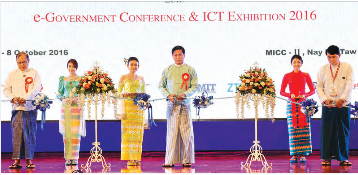
ဒုတိယသမ္မတ ဦးဟင်နရီဝန်ထီးယူနှင့် တာဝန်ရှိသူများ Myanmar e-Government ဆွေးနွေးပွဲနှင့် ICT ပြပွဲ (နေပြည်တော်) ဖွင့်ပွဲအခမ်းအနားကို ဖဲကြိုဖြတ် ဖွင့်လှစ်စဉ် (သတင်းစဉ်)

မြို့ကြီးများနှင့် ကျေးလက်ဒေသများတွင် ကွာဟနေသည့် Digital Divide ကို လျှော့ချနိုင်ရန် သက်သာသည့် ဈေးနှုန်းနှင့် အင်တာနက်သုံးစွဲခွင့်ရရှိနိုင်ရေးအတွက် ပို့ဆောင်ရေးနှင့် ဆက်သွယ်ရေးဝန်ကြီးဌာနနှင့် ပြည်တွင်းအင်တာနက်အော်ပရေတာများ Alliance for Affordable Internet (A4AI) ကဲ့သို့ နိုင်ငံတကာအဖွဲ့အစည်းများနှင့် ပူးပေါင်းပြီး ကြိုးပမ်းဆောင်ရွက်လျက်ရှိကြောင်းနှင့် ဝေးလံခေါင်ဖျားဒေသများအထိ တယ်လီဖုန်းဆက်သွယ်မှု