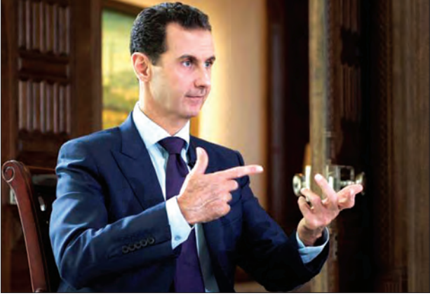
ဂျပန်ဘာ အောက်တိုဘာ ၇ အလက်ပိုကို တပ်စွဲထားသည့်သူပုန်များ အနေဖြင့် လက်နက်ချအညံ့ခံမည်ဆိုပါက ၎င်းတို့၏ မိသားစုဝင်များနှင့်အတူ ထွက်ခွာသွားခွင့်ပေးမည် ဖြစ်ကြောင်း

သမ္မတအာဆတ်က အယ်လ်အာဆတ်ကကြာသပတေးနေ့တွင် ပြောကြားခဲ့သည်။ ဆီးရီးယားမြို့တော် အလက်ပိုကို ကျူးကျော်တိုက်ခိုက်လာမှုကို နှိမ်နင်းလိုပြီး နိုင်ငံကို အပြည့်အဝပြန်လည် ထိန်းချုပ်နိုင်ရေးကို သမ္မတက အာရုံစိုက်ဆောင်ရွက်လျက် ရှိသည်။ ငါးနှစ်ကျော်ကြာအောင် ဖြစ်ပွားခဲ့သည့် ပြည်တွင်းစစ်အတွင်း အလက်ပိုရှိ သူပုန်တို့ထိန်းချုပ်ထားသည့် အရှေ့ပိုင်း နယ်မြေအတွင်းပိတ်မိနေသည့် ပြည်သူ ရာပေါင်းများစွာတို့သေဆုံးခဲ့ကာ အမေရိကန်က ကူညီထောက်ပံ့ပေးနေသည့် ငြိမ်းချမ်းရေးကြိုးပမ်းမှု ပျက်ပြယ်သွားပြီး နှစ်ပတ်အကြာတွင် သမ္မတ အာဆတ်က ထိုသို့ ပြောကြားခဲ့ခြင်းဖြစ်သည်။ မကြာသေးမီလများအတွင်း ဒါရာယာရှိ သူပုန်ထိန်းချုပ်ဒေသတွင်လည်း အစိုးရ၏ အလားတူလွတ်ငြိမ်းခွင့်ပေးရန် ကမ်းလှမ်းမှုကို တိုက်ခိုက်ရေးသမားများက လက်ခံခဲ့သည်။