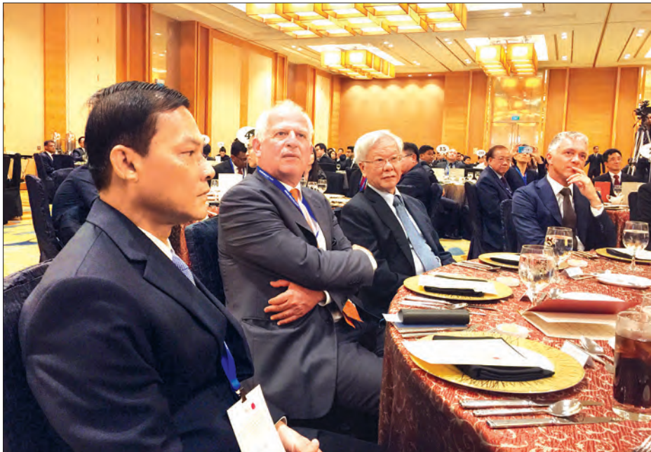
နှင့် နိုင်ငံတကာပူးပေါင်းဆောင်ရွက်မှုများလည်း ကောင်းမွန်ရန် လိုအပ်ပါကြောင်း၊ အဆိုပါမူဝါဒများအား စုံစမ်းလုံလောက်သည့် လူ့စွမ်းအားအရင်းအမြစ်နှင့် နည်းပညာကျွမ်းကျင်သူ

ပြည်ထောင်စုရှေ့နေချုပ် ဦးထွန်းထွန်းဦးသည် စင်ကာပူနိုင်ငံ၌ အောက်တိုဘာ ၅ ရက်တွင် ကျင်းပသည့် ရှေ့နေချုပ်များ တွေ့ဆုံဆွေးနွေးဟောပြောပွဲသို့ တက်ရောက်ခဲ့သည်။ (ယာဝု)