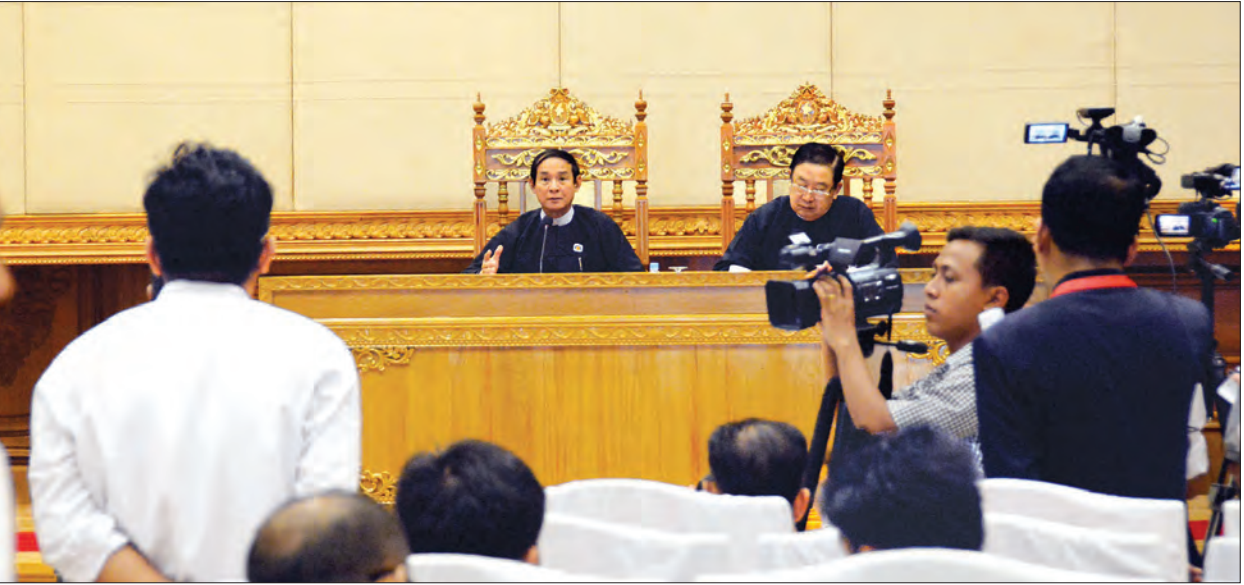
ဒုတိယအကြိမ် ပြည်သူ့လွှတ်တော် ဒုတိယပုံမှန်အစည်းအဝေး၏ လုပ်ငန်းဆောင်ရွက်ချက်ဆိုင်ရာများနှင့်စပ်လျဉ်း၍ သတင်းစာရှင်းလင်းပွဲ ပြုလုပ်စဉ် (သတင်းစဉ်)

မှတ်တမ်းတင်အဆို ကိုးခု၊ အတည်မပြု အဆိုနှစ်ခုနှင့် လွှတ်တော်တွင် ဆွေးနွေးရန် မသင့်ဟုကိုယ်စားလှယ်များက ဆုံးဖြတ်လိုက်သည့် အဆိုတစ်ခုတို့ ဖြစ်ပါကြောင်း။ ဥပဒေကြမ်းများအနေဖြင့် ပြည်သူ့လွှတ်တော်တွင် စတင်ဆွေးနွေးခဲ့သည့် ဥပဒေကြမ်း ငါးခုအပါအဝင် လက်ရှိ ဆောင်ရွက်ဆဲဥပဒေကြမ်း ၁၉ ခုရှိကာ အတည်ပြု ဆောင်ရွက်နိုင်ခဲ့သည့် ဥပဒေကြမ်း ၁၀ ခု ဖြစ်ပြီး လာမည့် လွှတ်တော်တွင် ဆက်လက်ဆွေးနွေး၍ ပြဋ္ဌာန်းနိုင်ရန်ကြိုးပမ်းမည့် ဥပဒေကြမ်းကိုးခု ကျန်ရှိပါကြောင်း၊ လွှတ်တော်အတွင်းရှိ တွေ့ဆုံမှုများအနေဖြင့် ပြည်တွင်းဧည့်သည်ဦးရေ ၂၇၄၀၊ ပြည်ပဧည့်သည်ဦးရေ ၃၂၇ ဦး တို့ဖြင့် တွေ့ဆုံမှုပေါင်း ၁၂၅ ကြိမ် ဆောင်ရွက်နိုင်ခဲ့ပါကြောင်း၊ လွှတ်တော်ပြင်ပ တွေ့ဆုံဆွေးနွေးနိုင်မှုအနေဖြင့် ပြည်တွင်းဧည့်သည် ဦးရေ ၁၈၀၇၁ ဦး၊ ပြည်ပဧည့်သည်ဦးရေ ၁၈၂၀ ဦးတို့ဖြင့် တွေ့ဆုံမှုပေါင်း ၂၀၂ ကြိမ် ဆောင်ရွက်နိုင်ခဲ့ပါကြောင်း၊ လေ့လာရေးခရီးအပါအဝင် ပြည်ပသို့ သွားရောက်တွေ့ဆုံဆွေးနွေးမှုအနေဖြင့် အကြိမ် ၂၀ ရှိခဲ့ပြီး လွှတ်တော်ကိုယ်စားလှယ် ၅၄ ဦးနှင့် ပြည်ပဧည့်သည်