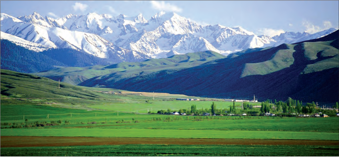
ရှင်းကျန့်-ဝီဂါဒေသ အနောက်မြောက်ဘက် တာချန်းစီရင်စုနယ်မြေရှိ သဘာဝရှမ်းအလှကို တွေ့ရစဉ်

တာချန်းစီရင်စု နယ်မြေအတွင်း တရုတ်နိုင်ငံ၌ ဒုတိယ အကြီးဆုံးမြက်ခင်းပြင်ဖြစ်သည့် လူလူစတက်မြက်ခင်းပြင် နှင့် သဘာဝကလက်ဆောင်ပေးသော ရှမ်းများတည်ရှိပြီး သန့်ရှင်းလတ်ဆတ်သော လေအေးများကိုလည်း ရှုမြင်ခွင့် ရရှိနေကြသည်။ ဒေသ၏တောင်ဘက်တွင် လူဂျီယန် ရေပူ စမ်းနှင့် ဝူဆူနီမီးတောင်၊ မြောက်ဘက်တွင် တက်ခီရှမ်းများ နှင့် ရှေးဟောင်းကျောက်ဆစ်အနုပညာ လက်ရာများလည်း ရှိနေသည်။ ထို့ပြင် သဘာဝအရင်းအမြစ်တစ်ခုဖြစ်သည့် ဓာတ်သတ္တုလည်း ကြွယ်ဝသေးသည်။ ဒေသ၏မြို့တော်မှာ “တာချန်း” ဖြစ်ပြီး မြို့ဧရိယာမှာ ၄၃၅၆ ဒေမ ၆ စတုရန်း ကီလိုမီတာ ကျယ်ဝန်းကာ ဟန်နှင့်ကာဏ်လူမျိုးများအပါ အဝင် တိုင်းရင်းသားမျိုးနွယ်စု ၂၅ စုမှ လူဦးရေစုစုပေါင်း တစ်သိန်းခန့်ခန့်သောင်းခန့် နေထိုင်လျက်ရှိသည်။ ယင်းမြို့နယ် မှာ တာဂျစ်ကစတန်နိုင်ငံနှင့် နယ်နိမိတ်ချင်း ထိစပ်လျက် ရှိသကဲ့သို့ ဘက်ကူဆိပ်ကမ်းတည်ရှိရာ ရေလက်ကြားသည် လည်း ရုရှားနှင့် အရှေ့အလယ်ပိုင်းနိုင်ငံများကို အဓိက ဆက်သွယ်ပေးထားသည်။