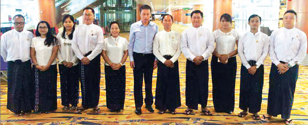
တရုတ်ပြည်သူ့သမ္မတနိုင်ငံ ကွန်မြူနစ်ပါတီ နိုင်ငံတကာဆက်ဆံရေးဌာန၏ ဖိတ်ကြားချက်အရ ၈၈ မျိုးဆက် (ငြိမ်းချမ်းရေးနှင့်ပွင့်လင်းလူ့အဖွဲ့အစည်း) မှ ဦးကိုကိုကြီး ဦးဆောင်သော အဖွဲ့ဝင် ၁၀ ဦးကို အောက်တိုဘာ ၅ ရက်က ရန်ကုန်မြို့မှ ကုမင်းမြို့သို့ လေကြောင်းခရီးဖြင့် ထွက်ခွာရန် ရန်ကုန်အပြည်ပြည်ဆိုင်ရာလေဆိပ်၌ တွေ့ရစဉ်။ (အဆိုပါအဖွဲ့သည် ယူနန်ပြည်နယ် ကုမင်း မနီစီ၊ ရွှေလီမြို့တို့၌ Local governance, ethnics affairs ကိစ္စရပ်များ လေ့လာမည်ဖြစ်ပြီး ရှန်ဟိုင်းစီးပွားရေးပြုပြင် ပြောင်းလဲမှုများနှင့်ပတ်သက်၍ ပေကျင်းမြို့၌ တရုတ်ကွန်မြူနစ်ပါတီ နိုင်ငံတကာရေးရာဝန်ကြီးဌာနမှ အကြီးအကဲများနှင့် တွေ့ဆုံကာ China foundation ၏ poverty alleviation သို့ သွားရောက် လေ့လာမည်ဖြစ်ကြောင်း၊ ခရီးစဉ်မှာ အောက်တိုဘာ ၁၂ ရက်အထိ တစ်ပတ်ကြာမြင့်မည်ဖြစ်ကြောင်း သိရသည်။) (သတင်းစဉ်)

(ပုံ) ထင်ကျော် နိုင်ငံတော်သမ္မတ ပြည်ထောင်စုသမ္မတမြန်မာနိုင်ငံတော်