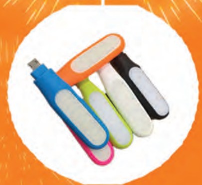
LED phone torch