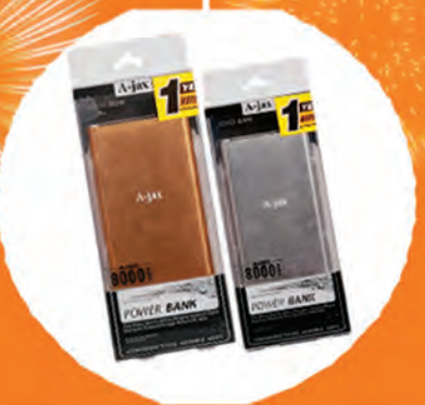
Power Bank (8,000 mAh)