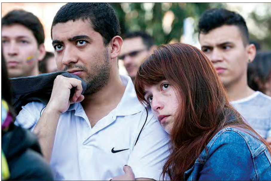
ဘိုကိုတာ၌ ငြိမ်းချမ်းရေးသဘောတူစာချုပ်ကို ထောက်ခံသူများက ဆန္ဒမဲရလဒ်ကို စောင့်ဆိုင်းနေကြစဉ်

အဲဒီအဖွဲ့ဟာ ပေါ်ထွက်လာတဲ့ ကန့်ကွက်မိအားလုံးနီးပါးက သာမန်အရပ်သားအဖြစ်နဲ့ ကိုလံဘီယာမှာ အခြေချနေထိုင် တော့မယ်လို့ တွေးထားတဲ့ သူပုန်တွေရဲ့အနာဂတ်ကို ဝေဝါး