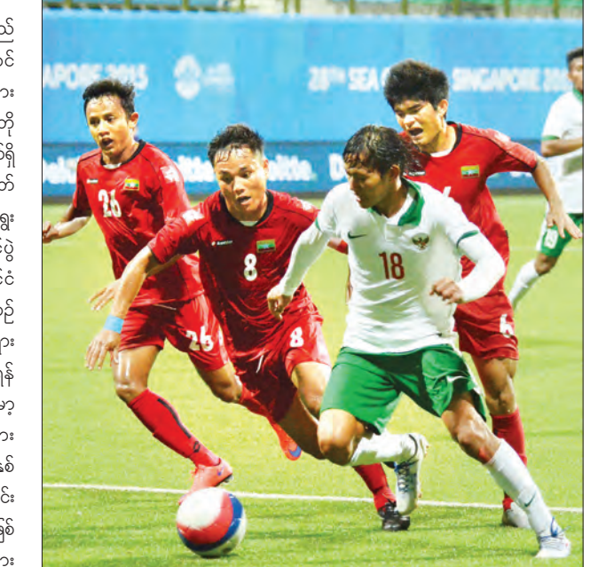
၂၀၁၅ ဆီးဂိမ်းတွင် မြန်မာယူ-၂၀ နှင့် အင်ဒိုနီးရှား ယူ-၂၀ အသင်းတို့ တွေ့ဆုံခဲ့စဉ်