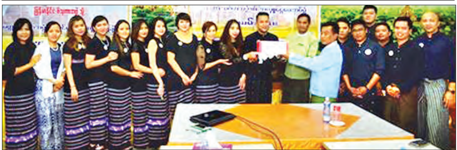
အောက်တိုဘာ ၅ ရက်က ပုဂံရှေးဟောင်းယဉ်ကျေးမှုဒေသရှိ ငလျင်ဒဏ်ကြောင့် ပြိုကျပျက်စီးသွားခဲ့သော စေတီပုထိုးများ ပြန်လည်ပြုပြင်မွမ်းမံရန်အတွက် မေတ္တာသင်္ဂဟ(ရန်ကုန်နှင့်မန္တလေး)အဖွဲ့က အလှူငွေကျပ် သိန်း၁၅၀နှင့် စေတီပုထိုးများအား မှတ်တမ်းတင်တိုင်းတာရန် လိုအပ်နေသော ဆိုနိုကင်မရာခြောက်လုံး ပေးအပ်လှူဒါန်းစဉ် ကျော်ဖြင့်သန်း(လမ်းမတော်)