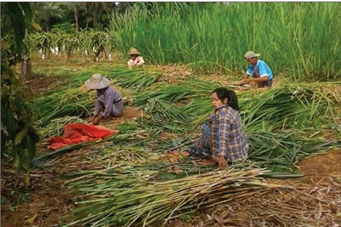
ဖြန့်ဝေပေးရန် ရိတ်သိမ်းထားသော နေပီယာမြက်များ

“လိုချင်တဲ့သူကတော့ ဖုန်းဆက် လိပ်စာပေးပြီး လှမ်းမှာကြတာပေါ့ဗျာ။ မှာရင်တော့ ရောက်အောင်ပို့ပေးလိုက်တာပါပဲ။ လောလောဆယ် ကုန်ကျတဲ့ လုပ်အားခတွေနဲ့ သယ်ပို့တွေကိုတော့ အိတ်စိုက်ပေါ့ဗျာ။ ပြီးမှ တချို့ကလည်း ဖုန်း