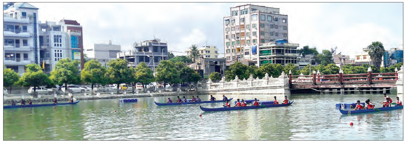
မန္တလေး နန်းမြို့ကျေးအတွင်း၌ ပြိုင်ပွဲဝင်လှေအသင်းများ လှေကျင်နေစဉ်