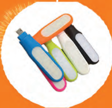
LED Phone torch