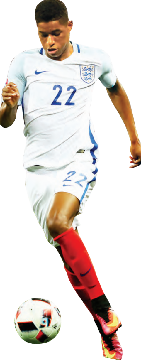
မန်နေဂျာအနေနဲ့ အင်အားအခင်းရဲ့အခြေအနေဟာ ဘယ်လို ရှိမလဲဆိုတာကိုတော့ ဆက်လက်စောင့်ကြည့်ရဦးမှာ ဖြစ်ပါတယ်။

ဒဏ်ရာပြဿနာများနဲ့ အင်အားအခင်း နိုင်ငံအသင်းမန်နေဂျာတိုင်း တွေ့ကြုံရတဲ့ ပြဿနာက တော့ နိုင်ငံကစားသမားကောင်းတိုင်းကို ခေါ်ယူလို့မရနိုင်ခြင်း ပါပဲ။ အခုလက်ရှိအင်အားအခင်းကို ကြည့်မယ်ဆိုရင်လည်း ဟယ်ရီကန်း၊ လုစ်ရှော့တို့ ကြုံခိုင်းမှု အကောင်းဆုံးမရှိသေး သလို လယ်လာနာ၊ နာသန်နီရယ်ကလိုင်တို့ကလည်း ဒဏ်ရာ ပြဿနာရှိနေခဲ့ပါတယ်။ ဒါ့အပြင် ဘတ်လန်၊ ဒရိုင်းဝါးတား တို့လည်း မပါဝင်နိုင်ပါဘူး။ လက်ရှိနေ့ကဆုံးသတင်းများအရ ဆိုရင်လည်း ရာဟီးစတားလင်းဟာ ဒဏ်ရာရရှိနေခဲ့တာ ကြောင့် ၂၃ ယောက်စာရင်းမှာထည့်သွင်းပြီးမှ တောင်ဆန်နဲ့ လည်း ပြောင်းလဲခဲ့ရပါတယ်။ ဒါကြောင့်လည်း လက်ရှိအင်အားအခင်းမှာ ယာယီ မန်နေဂျာ ဆောက်ဂိတ်ရဲ့ အင်အားအခင်းအခင်းအကျင့်ကတော့ စိတ်ဝင်စားစရာဖြစ်ပါတယ်။ ဒါတွေကြောင့်လည်း လာမည့် ပြိုင်ပွဲ လေးပွဲကိုကိုင်တွယ်ခွင့်ရရှိထားခဲ့တဲ့ အင်အား အသင်း