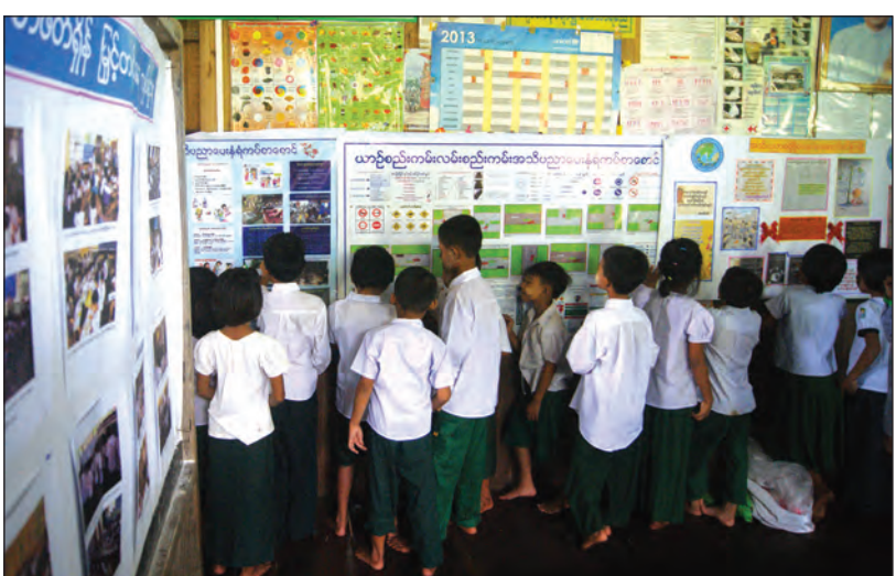
ချောင်းဆုံ အောက်တိုဘာ ၆ များမှ ကျောင်းသား ကျောင်းသူများ ကျောင်းစာအပြင် မွန်ပြည်နယ်၊ ချောင်းဆုံမြို့နယ်ရှိ အခြေခံပညာ ကျောင်း ပြင်ပအသိပညာ ဗဟုသုတများ ရရှိစေရန် ရည်ရွယ်ပြီး

ပြန်ကြားရေးနှင့် ပြည်သူ့ဆက်ဆံရေးဦးစီးဌာနမှ ဝန်ထမ်းများက ကျောင်းများသို့ သွားရောက်ပညာပေးဟောပြောခြင်းနှင့် နံရံကပ်စာစောင်၊ ဓာတ်ပုံများ ပြသခြင်းတို့ကို လစဉ် ကွင်းဆင်းဆောင်ရွက်လျက်ရှိရာ အောက်တိုဘာ ၄ ရက်တွင် ရွာလွတ်(အ.မ.က)နှင့် ရွာလွတ်(ရွာသစ်)(အမက)ကျောင်းများသို့ သွားရောက်ဆောင်ရွက်ပေးခဲ့ကြောင်း သိရသည်။