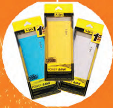
Power Bank (12,000 mAh)