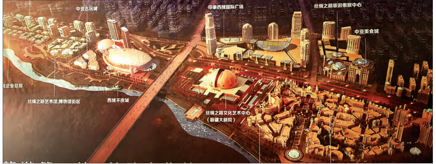
အရုံမျှချီမြို့လယ်မှ ဖြတ်သန်းဖောက်လုပ်ထားသော သမိုင်းဝင်ပိုးလမ်းမကြီးကို တွေ့ရစဉ်

ဒေသများအပြင် စီးပွားရေးအလားအလာများစွာရှိနေသည့် အရှေ့တောင်အာရှနှင့် တောင်အာရှဒေသများအထိ ပါဝင်လာသည်။ ထို့ပြင် ရေလမ်းကြောင်းကို အခြေပြုသည့် “ပင်လယ်ရေကြောင်းပိုးလမ်းမ” (Maritime Silk Road - MSR) ကိုလည်း တရုတ်နိုင်ငံ ဖူးကျန်ပြည်နယ် (Fujian Province) မှစတင်ကာ မလက္ကရာလက်ကြားကို ဖြတ်သန်းပြီး အာဖရိကအပူပိုင်းနှင့် မြေထဲပင်လယ်ကိုဖြတ်သန်း၍ အီတလီနိုင်ငံ ဗင်းနစ်မြို့သို့ ဦးတည်သော စီးပွားရေးလမ်းကြောင်းအဖြစ် အကောင်အထည်ဖော်လျက်ရှိနေသည်။