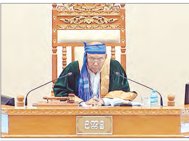
အမျိုးသားလွှတ်တော်ဥက္ကဋ္ဌ မန်းဝင်းခိုင်သန်း

ပြည်ထောင်စုဝန်ကြီး ဦးဝင်းခိုင်က ယနေ့ကျင်းပသည့် အမျိုးသားလွှတ်တော် ဒုတိယပုံမှန်အစည်းအဝေး ၄၄ ရက် မြောက်နေ့၌ ရခိုင်ပြည်နယ် မဲဆန္ဒနယ် အမှတ်(၁)မှ ဦးဝေစိန်အောင်၏ ရခိုင်ပြည်နယ် စစ်တွေမြို့ ဝါတိုချောင်းကူး တံတားတစ်စင်းကို ပြည်ထောင်စု/ပြည်နယ်အစိုးရ ရန်ပုံငွေမှ ၂၀၁၇-၂၀၁၈ ဘဏ္ဍာရေးနှစ်အတွင်း တည်ဆောက်