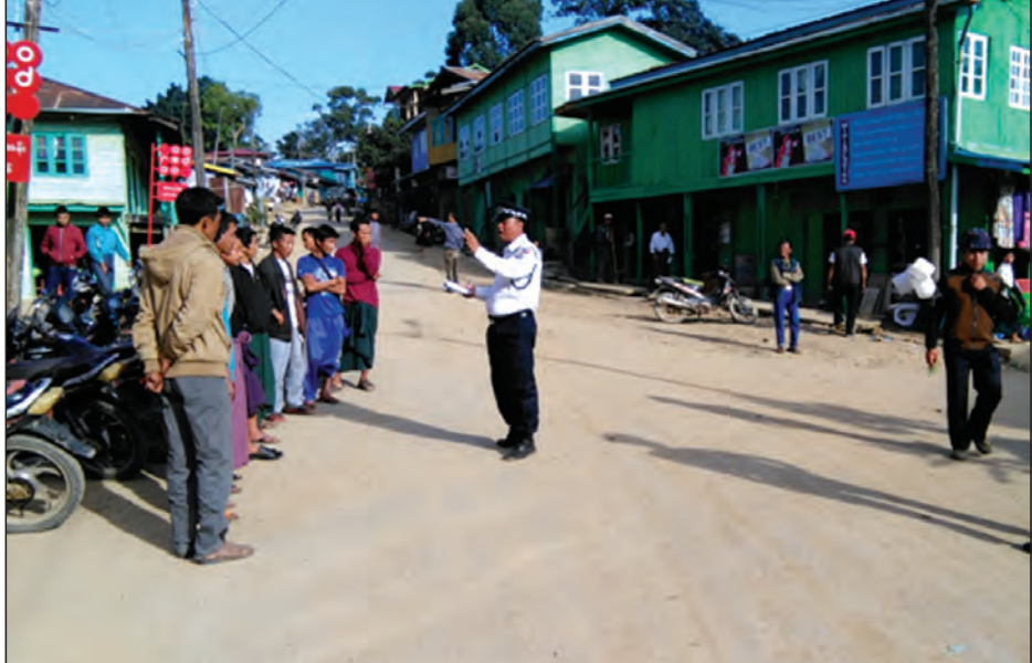
ဆိုင်ကယ်မောင်းနှင်သူများအား ရပ်တန့်ပြီး အသိပညာပေးနေစဉ်

ထန်တလန် အောက်တိုဘာ ၆ ချင်းပြည်နယ်ထန်တလန်မြို့တွင်အောက် တိုဘာ ၄ ရက်မှစ၍ ယာဉ်ထိန်းရဲများ ကို စတင်တာဝန်ချထားလျက်ကြောင်း နှင့် ယခုယာဉ်ထိန်းရဲများ တာဝန်ချထား ခြင်းမှာ ထန်တလန်မြို့၌ ပထမဆုံး အကြိမ် စတင်ထားရှိခြင်းဖြစ်ကြောင်း သိရသည်။