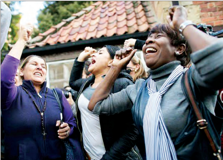
သဘောတူစာချုပ်ကို ကန့်ကွက်သူများက မဲအများစုဖြင့် အနိုင်ရရှိ၍ အောင်ပွဲခံနေကြစဉ်

စေခဲ့ပါတယ်။ နှစ်ဖက်စလုံးကတော့ တိုက်ချင်ခိုက်ချင်စိတ်တွေ ကုန်ခန်းနေကြသလိုပါပဲ။