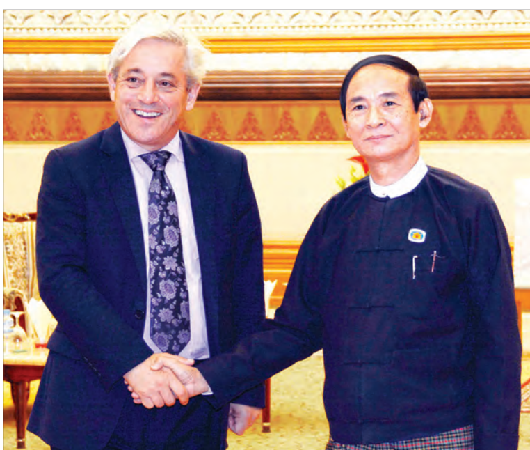
ပြည်သူ့လွှတ်တော် ဥက္ကဋ္ဌ ဦးဝင်းမြင့် ဗြိတိန်နိုင်ငံ အောက် လွှတ်တော် ဥက္ကဋ္ဌ Mr. John Bercow အား ရင်းရင်းနှီးနှီး နှုတ်ဆက်စဉ်