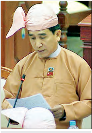
ဦးအောင်စိုး ယင်းမာပင်မဲဆန္ဒနယ်

စီမံကိန်း ဝန်ကြီးဌာနက ထုတ်ပြန်ခဲ့သည့် မြေအောက်ရေ သွန်းတိုက်မှုများကို ထိန်းသိမ်းရေးဥပဒေကြမ်း အတည်ပြုခြင်းအစီအစဉ်များ ထုတ်ပြန်ခဲ့ကြောင်း သိရသည်။