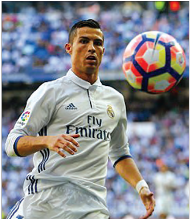
ကောင်းမြတ်သူ - စုစည်းသည်။

တောင်ပံတိုက်စစ်မှူး စီရော်နယ်ဒိုဟာ ဒီနှစ်ထဲမှာ ချန်ပီယံလိဂ်နဲ့ ဥရောပဖလားတွေကို ဆွတ်ခူးပေးနိုင်ခဲ့သူဖြစ်ပါတယ်။ သူဟာ ဇန်နဝါရီလမှာပေးမယ့် အကောင်းဆုံးဘောလုံးသမားဆု Ballon d'Or ဆုကိုလည်း စတုတ္ထအကြိမ်မြောက် ကိုင်မြှောက်နိုင်ဖို့ ရေပန်းစားနေပါတယ်။ အခုအချိန်မှာတော့ စီရော်နယ်ဒိုရဲ့ ခြေစွမ်းဟာ အကောင်းဆုံးအနေအထားမှာရှိနေပြီး အသက် ၄၀ အထိ ဘောလုံးကစားသွားမယ်လို့ ဆိုပါတယ်။ စီရော်နယ်ဒိုရဲ့ ဘောလုံးကစားတဲ့ သက်တမ်းဟာ ၁၄ နှစ်ရှိသွားပါပြီ။ သူ့ရဲ့ အောင်မြင်မှုတွေကတော့ ဆက်တိုက်ရရှိနေဆဲဖြစ်ပါတယ်။