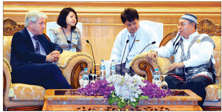
အမျိုးသားလွှတ်တော်ဥက္ကဋ္ဌ မန်းဝင်းခိုင်သန်း၊ ဗြိတိန်နိုင်ငံ အောက်လွှတ်တော်ဥက္ကဋ္ဌ Mr. John Bercow အား တွေ့ဆုံစဉ်

နေပြည်တော် အောက်တိုဘာ ၅ အမျိုးသားလွှတ်တော်ဥက္ကဋ္ဌ မန်းဝင်းခိုင်သန်းနှင့် ဗြိတိန်နိုင်ငံ အောက်လွှတ်တော်ဥက္ကဋ္ဌ Mr. John Bercow တို့သည် ယနေ့ မွန်းလွဲ ၁ နာရီတွင် နေပြည်တော်ရှိ အမျိုးသားလွှတ်တော် ဧည့်ခန်းမဆောင်၌ တွေ့ဆုံသည်။ တွေ့ဆုံစဉ် နှစ်နိုင်ငံလွှတ်တော်ချင်း ချစ်ကြည်ရင်းနှီးမှုတိုးမြှင့်ရေး၊ လွှတ်တော်ဖွံ့ဖြိုးတိုးတက်မှု အကူအညီပေးရေးကိစ္စရပ်များ ဆွေးနွေးခဲ့ကြသည်။ တွေ့ဆုံပွဲသို့ အမျိုးသားလွှတ်တော် ဒုတိယဥက္ကဋ္ဌ ဦးအေးသာအောင်နှင့် အမျိုးသားလွှတ်တော်ရုံးမှ တာဝန်ရှိသူများ တက်ရောက်ကြသည်။ (သတင်းစဉ်)