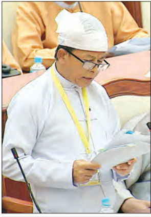
ဒေါက်တာ ထွန်းဝင်း ဒုတိယဝန်ကြီး

နေပြည်တော် အောက်တိုဘာ ၅ မြေအောက်ရေ သွန်းတိုက်မှုများကို ခန့်သတ်ခြင်းနှင့် ကန့်သတ်ခြင်းအစီအစဉ်များ ထုတ်ပြန်ခဲ့ကြောင်း သိရသည်။ မြေအောက်ရေ သွန်းတိုက်မှုများကို ထိန်းသိမ်းရေးနှင့် မြေအောက်ရေ သွန်းတိုက်မှုများကို ထိန်းသိမ်းရေးဥပဒေကြမ်း အတည်ပြုခြင်းအစီအစဉ်များ ထုတ်ပြန်ခဲ့ကြောင်း သိရသည်။