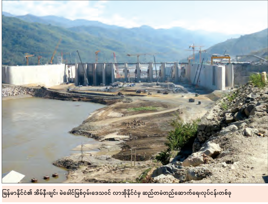
မြန်မာနိုင်ငံ၏ အိမ်နီးချင်း ဖဲခေါင်မြစ်ဝှမ်းဒေသဝင် လာအိုနိုင်ငံမှ ဆည်တစ်တည်ဆောက်ရေးလုပ်ငန်းတစ်ခု

စွမ်းအင်ထုတ်လုပ်မှုဆိုင်ရာ နည်းပညာများထဲတွင်ရေအားလျှပ်စစ်ထုတ်လုပ်ခြင်းသည် အရိုးရှင်းဆုံးသော နည်းပညာတစ်ရပ်ဖြစ်သည်။ ကမ္ဘာ့မြေပြင်ပေါ်သို့ ရွာချသောမိုးရေများသည် မြေပြင်ဆင်ခြေလျှော့တစ်လျှောက်စီးဆင်းပြီး မြစ်ချောင်းများထဲသို့စီးဝင်ကြကာ နောက်ဆုံး၌ ပင်လယ်နှင့် သမုဒ္ဒရာများထဲသို့ စီးဆင်းဝင်ရောက်ကြရသည်။ မြစ်ရေချောင်းရေများ စီးဆင်းလာရာလမ်းတစ်လျှောက်တွင် တောင်စောင်း၊ ချောက်ကမ်းပါးများရှိနေပါက ရေတံခွန်များအဖြစ် စီးဆင်းကြရသည်။ ဇောက်နှက်သောရေတံခွန်များ၌ စီးဆင်းသောရေပမာဏ အလွန်များပြားပြီး ရာသီမရွေး အလျဉ်မပြတ် စီးဆင်းနေသည့်အခါက ထိုနေရာမျိုး၌ ရေအားလျှပ်စစ်ထုတ်လုပ်သည့်နည်းစဉ်ဖြင့် လျှပ်စစ်ဓာတ်အား ပမာဏအများအပြားကို ထုတ်လုပ်ရယူနိုင်သည်။ အမြင့်မကုန်ဆင်းလာသော ဖိအားများသည်ရေထုက တာဘိုင်စက်များကို လှည့်ပေးခြင်းဖြင့် လျှပ်စစ်ဓာတ်အားထွက်ရှိလာသည်။