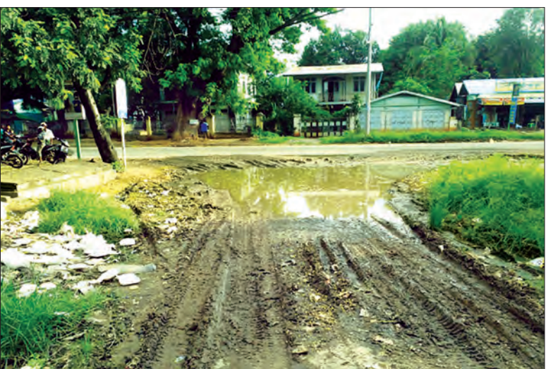
ဖြစ်၍ လမ်းသွားလမ်းလာကြသူများနှင့် နေအိမ်များ ကျန်းမာရေးအတွက်ပါ စိုးရိမ်ရပါသဖြင့် ရပ်ကွက်နေပြည်သူများက လမ်းနှင့်အမှိုက်ပုံအား ပြုပြင်ရှင်းလင်းပေးကြရန် ဆန္ဒရှိနေကြကြောင်း သိရသည်။ နေအောင်(ပြန်/ဆက်)

မန္တလေးတိုင်းဒေသကြီး ကျောက်ပန်းတောင်းမြို့၊ သီရိမင်္ဂလာရပ်ကွက် နှင်းဆီလမ်းထိပ်ရှိ ရေပွက်အိုင်ကြီးမှာ ကာလရှည်ကြာလာသည်နှင့်အမျှ အနံ့အသက်ဆိုးများ ပျံ့လွင့်လျက်ရှိပြီး အဆိုပါရေပွက်အိုင်ကြီးအနီးတွင် အမှိုက်များကိုပါ လာရောက်စွန့်ပစ်ထားသဖြင့် ပတ်ဝန်းကျင်နေပြည်သူများမှာ စိတ်အနှောင့်အယှက်ဖြစ်လျက်ရှိနေကြောင်း သိရသည်။ “ဒီပွက်အိုင်က မိုးဦးကတည်းက ရေပုပ်နေတာ ခုချိန်ထိပါ။ ဘယ်မှလည်း ရေစီးစရာမရှိဘူး။ ပွက်အိုင်ကလမ်းထိပ်မှာ လမ်းလုံးပြည့်ဖြစ်နေတော့ လမ်းသွားချင်တဲ့ လူတွေက ဘယ်လိုမှ သွားလို့လာလို့ကို မရဘူး။ ဒီကြားထဲ အိမ်တချို့က လမ်းသွားတဲ့သူတွေ ခြေနှင်းဖြစ်အောင် လုပ်သလိုလိုတာလိုလိုနဲ့ ပွက်အိုင်ဘေးမှာအမှိုက်တွေလာပုံကြတယ်။ ကြာတော့ အမှိုက်ပုံက လမ်းထိပ်ရောက်နေပြီ တဖြည်းဖြည်းနဲ့ အမှိုက်ပုံကြီးဖြစ်လာတော့မယ်။ ကားတစ်စီးလောက် ဖြတ်မောင်းသွားရင် အဲဒီပွက်အိုင်က ရေပုပ်အနံ့က ပတ်ဝန်းကျင်အထိပြန့်တယ်” ဟု အဆိုပါလမ်းတွင်နေထိုင်သူတစ်ဦးက ပြောသည်။ အဆိုပါပွက်အိုင်မှ အနံ့အသက်ဆိုးများထွက်လျက်ရှိသည့်အပြင် ပွက်အိုင်အနီးတွင် စွန့်ပစ်အမှိုက်များမှာ စုပုံနေပြီ