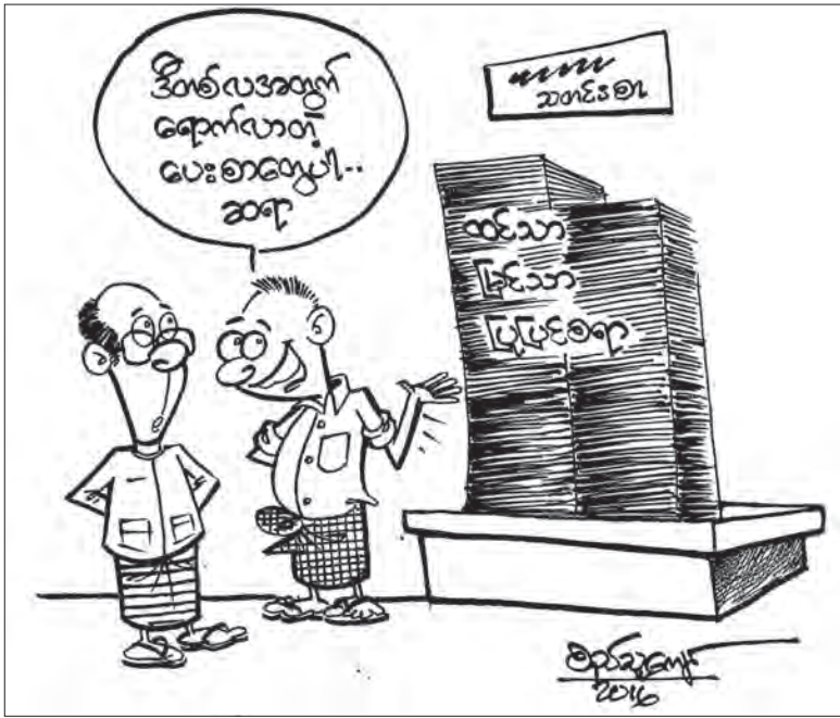
ထင်သာမြင်သာပြုပြင်ရေး

ထို့ကြောင့် အစိုးရ၏လွတ်လပ်၊ တက်ကြွသော နိုင်ငံခြားရေးပေါ်လစီဖြင့် ကမ္ဘာ့အလယ်တွင် နိုင်ငံရေးအရပ်တည်ရန် ကြိုးပမ်းနေသလို၊ ပွင့်လင်းမြင်သာသော၊ အဂတိကင်းစင်သော၊ လုပ်သားကိုင်သရိုသော စီးပွားရေးအခွင့်အလမ်းများကို ဖန်တီးပေးခြင်းဖြင့် နိုင်ငံတကာမှရင်းနှီးမြှုပ်နှံသူများစေ၊ ပြည်တွင်းလုပ်ငန်းရှင်များ၊ ပြည်သူများပါ ခံစားရရှိနိုင်မည့် လူမှုစီးပွားရေးရပ်ဝန်းတစ်ခု တည်ဆောက်နိုင်မည် ဖြစ်ပါသည်။ ။