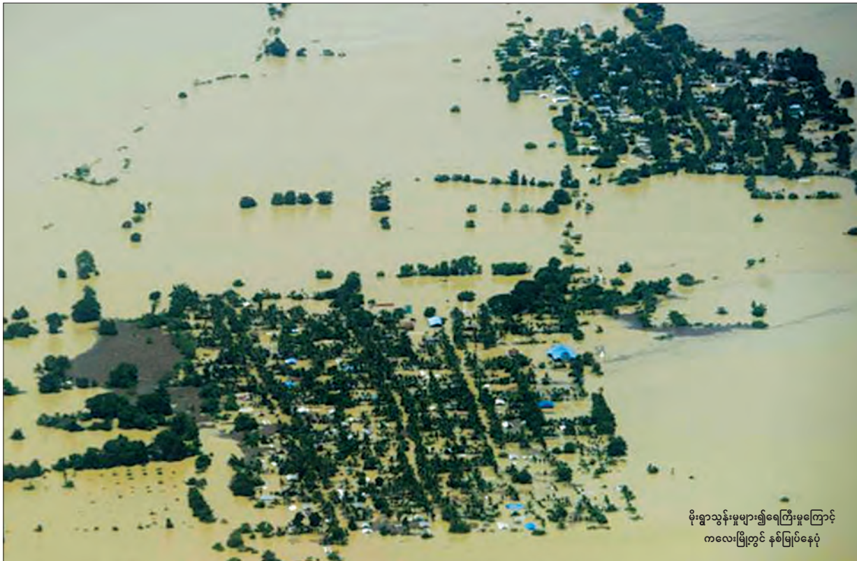
မိုးရွာသွန်းမှုများကြောင့် မြန်မာနိုင်ငံအပြင်အကျွန်းဒေသများတွင် ကလေးမြို့တွင် နစ်မြုပ်နေပုံ