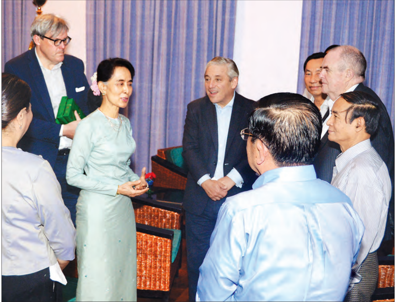
နိုင်ငံတော်၏အတိုင်ပင်ခံပုဂ္ဂိုလ် ဒေါ်အောင်ဆန်းစုကြည် ဗြိတိန်နိုင်ငံအောက်လွှတ်တော်ဥက္ကဋ္ဌ Mr. John Bercow အား ရင်းရင်းနှီးနှီး တွေ့ဆုံနှုတ်ဆက်စဉ်