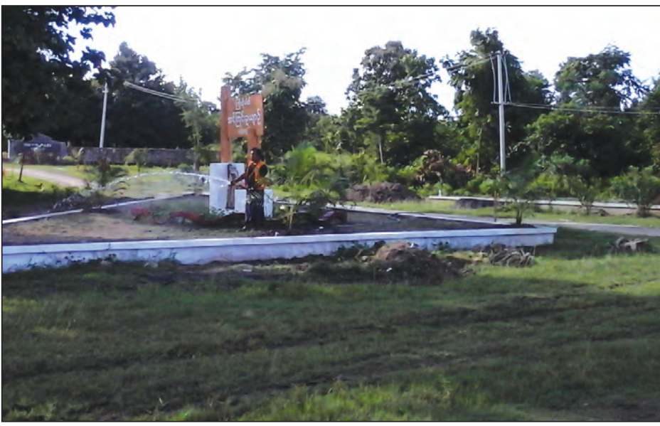
ကန့်ဘလူမြို့ အင်ကြင်းဥယျာဉ်ကို ယခင်က မြို့မမြို့ဖအဖွဲ့က ထိန်းသိမ်းစောင့်ရှောက်ခဲ့ရာမှ ယခုနှစ် ဇွန် ၈ ရက်က မြို့နယ်စည်ပင်သာယာရေးကော်မတီသို့ လွှဲပြောင်းပေးအပ်ခဲ့ပြီးနောက် ယခုကဲ့သို့ ပြည်သူများ အပန်းဖြေနိုင်သော နေရာဖြစ်လာရန် ဆောင်ရွက်ခြင်းဖြစ်ကြောင်း သိရသည်။

ဘလူမြို့နယ် စည်ပင်သာယာရေး ကော်မတီက အကောင်အထည်ဖော်ဆောင်ရွက်သွားမည်ဖြစ်ကြောင်း သိရသည်။ အင်ကြင်းဥယျာဉ်ကို အပန်းဖြေရာနေရာဖြစ်လာရန် မြို့နယ်စည်ပင်သာယာရေးကော်မတီက ၂၀၁၆-၂၀၁၇ ဘဏ္ဍာရေးနှစ်(သာမန်လုပ်ငန်း)ခွင့်ပြုရန်ပုံငွေ