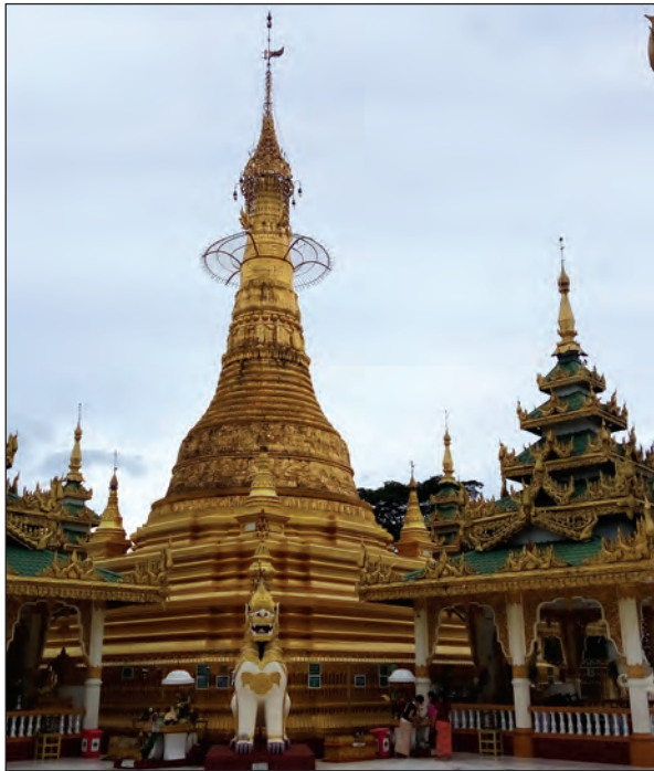
ရန်ကုန်မြို့၊ ဒဂုံမြို့နယ်ရှိ အိမ်တော်ရာစေတီ

မြန်မာနိုင်ငံတွင် ရွှေဆံတော်၊ ရွှေစည်းခုံစသည့်ဖြင့် ထင်ရှားသော ဘွဲ့မည်တူရှေးဟောင်းစေတီများ ရှိကြသည့်အနက် အိမ်တော်ရာစေတီနှစ်ဆူလည်း အပါအဝင်ဖြစ်ကာ တစ်ဆူက ရန်ကုန်မြို့တွင်တည်ရှိ၍ တစ်ဆူက မန္တလေးမြို့တွင် တည်ရှိသည်။ အိမ်တော်ရာစေတီနှစ်ဆူလုံးကို ကုန်းဘောင်ဆက် နဝမမြောက်ဘုရင် ပုဂံမင်း (ခရစ်နှစ် ၁၁၄၆-၁၁၅၃)က တည်ထားကိုးကွယ်ခဲ့သည်။