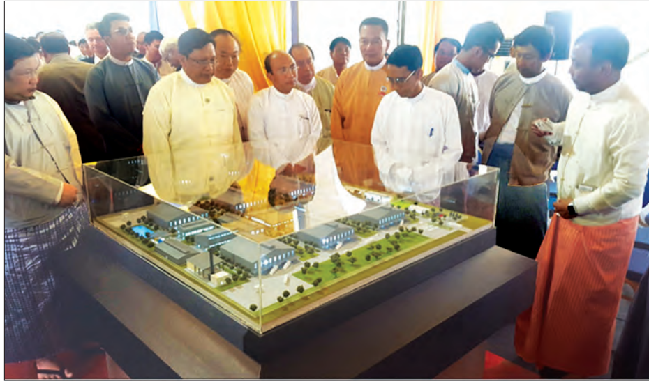
မြန်မာ့သြဘာအုပ်စုကုမ္ပဏီလီမိတက်၏ စိုက်ပျိုးရေးသွင်းအားစုစက်ရုံ ပုံစံငယ်ကို ကြည့်ရှုစဉ်

လက်ရှိ လယ်ယာလုပ်ငန်းခွင်များတွင် အသုံးပြုနေကြရသည့် စိုက်ပျိုးရေးသွင်းအားစုများကို ပြည်ပမှတင်သွင်းနေရမှုကြောင့် အရင်းအနှီးစရိတ်ကြီးမားခြင်းနှင့် နည်းလမ်းပေါင်းစုံဖြင့် ဝင်ရောက်လာပြီး မှတ်ပုံတင်ထားခြင်းမရှိသော အရည်အသွေး မပြည့်မီသည့် ပိုးသတ်ဆေး များကြောင့် တောင်သူလယ်သမားများ များစွာထိခိုက် နစ်နာနေကြရကြောင်း မြန်မာ့သြဘာအုပ်စု ကုမ္ပဏီလီမိတက်၏ စိုက်ပျိုးရေးသွင်းအားစု စက်ရုံပန္နက်တင် အခမ်းအနားတွင် စိုက်ပျိုးရေး၊ မွေးမြူရေးနှင့် ဆည်မြောင်းဝန်ကြီးဌာန ပြည်ထောင်စုဝန်ကြီး ဒေါက်တာအောင်သူက ပြောကြားသည်။