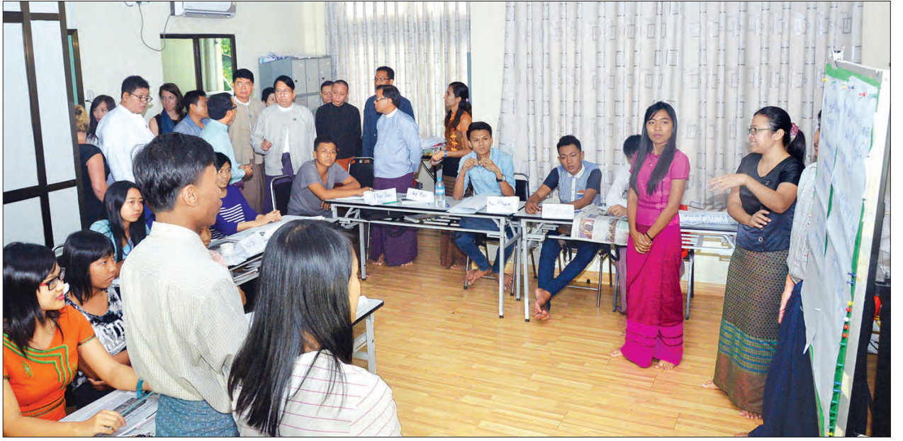
ပြည်ထောင်စုဝန်ကြီး ဒေါက်တာ ဖေမြင့် မြန်မာသတင်းပညာသိပ္ပံ (MJJ) သင်တန်း ခန်းမ၌ သင်ကြား သင်ယူမှုကို ကြည့်ရှုစဉ်

တွေ့ဆုံဆွေးနွေးပွဲသို့ ပြန်ကြားရေးဝန်ကြီးဌာန၊ မြန်မာသတင်းပညာသိပ္ပံ၊ ဆဲဗင်း ဒေသတင်းဂျာနယ်နှင့် Frontier မြန်မာမဂ္ဂဇင်းတို့မှ တာဝန်ရှိသူများ တက်ရောက် ကြသည်။ (သတင်းစဉ်)