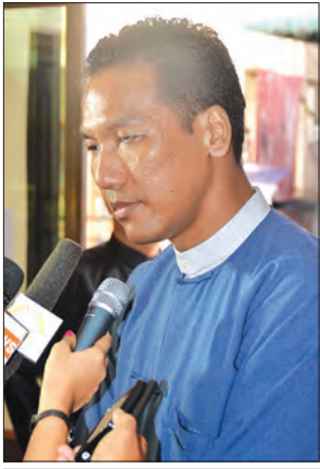
ဦးသောင်းစုငြိမ်း

ပြန်ကြားရေးဝန်ကြီးဌာနက အစ် ဂျစ်တယ် သတင်းစာကို ပြောင်းမယ်ဆို တဲ့ စိတ်ကူးရှိတာ သိရတဲ့အတွက် ကိုယ်တိုင်လည်း နိုင်ငံတကာအတွေ့ အကြုံတွေရှိတယ်။ ပြည်တွင်းမှာ လုပ်နေ တဲ့ အစ်ဂျစ်တယ်မီဒီယာအတွေ့အကြုံ တွေလည်းရှိတယ်။ ဒါတွေနဲ့ပူးပေါင်းပြီး ပြန်ကြားရေးဝန်ကြီးဌာနက အစ်ဂျစ်တယ် သတင်းစာကို ပြောင်းလဲတဲ့ အကူး အပြောင်းမှာ ဘယ်လိုမျိုးသင်တန်းတွေ ပေးလို့ရမလဲ၊ လူစွမ်းအားအရင်းအမြစ် မြှင့်တင်ရေး ဘယ်လိုပါဝင်လို့ရမလဲဆို