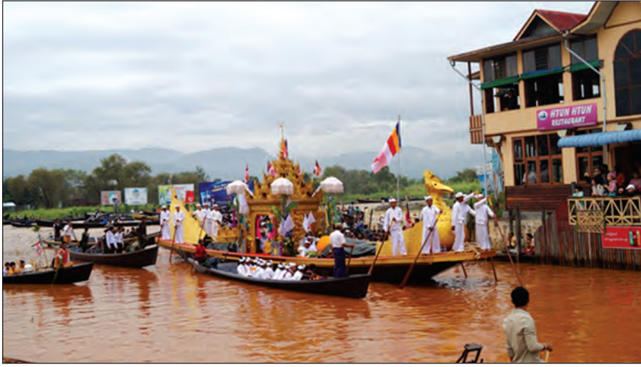
ညောင်ရွှေ အောက်တိုဘာ ၃ ရုပ်ရှင်တော်မြတ်လေးဆူသည် အင်းလေး ဖောင်တော်ဦးမြတ်စွာဘုရား ဒေသ ၂၁ ဌာနသို့ ဒေသစာရီအပူဇော် ခံရန်အတွက် ထာဝရသီတင်းသုံးရာ နန်းပန်းရွာရှိ ရတနာစံကျောင်းတော်မှ

ကျေးပေါ်ခုံကျေးရွာ စံကျောင်းတော်သို့ အောက်တိုဘာ ၂ ရက်က စတင်ကြွချီ အပူဇော်ခံခဲ့ကြောင်း သိရသည်။ ဒေသစာရီကြွချီ အပူဇော်ခံရန် အတွက် ဆင်းတုတော်များကို ရတနာစံကျောင်းပလ္လင်မှ ခေတ္တယာယီ သီတင်းသုံးတော်မူမည့် ကျေးပေါ်ခုံကျေးရွာ စံကျောင်းတော်သို့ အစဉ်အလာနှင့်အညီ ရွှေဝေါယာဉ်တော်ဖြင့် ရှမ်းပြည်နယ် ဝန်ကြီးများနှင့် တာဝန်ရှိသူများက ဦးဆောင်၍ ပင့်ဆောင်ခဲ့သည်။ ထို့နောက် ရွှေကရပိက်ဖောင်တော်ယာဉ်ဖြင့် ကျေးပေါ်ခုံစံကျောင်းသို့ စတင်ကြွချီ အပူဇော်ခံရာ ဒေသခံတိုင်းရင်းသားများက ရိုးရာဆွဲလှေကြီး ၂၃ စီးဖြင့် လှော်ခတ်ပင့်ဆောင် ပူဇော်ခဲ့ကြပြီး ဒေသစာရီကြွချီ အပူဇော်ခံပွဲသို့ အနယ်နယ် အရပ်ရပ်မှ ဘုရားဖူးလာပြည်သူများ စည်ကားသိုက်မြိုက်စွာ လာရောက်ဖူးမြော်ကြည့်ညိုလျက်ရှိကြကြောင်း သိရသည်။ (မြန်မာ့ ပြန်/ဆက်)