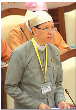
ဒေါက်တာမျိုးသိမ်းကြီး ပြည်ထောင်စုဝန်ကြီး

နေပြည်တော် အောက်တိုဘာ ၃ ဒုတိယအကြိမ် ပြည်သူ့လွှတ်တော် ဒုတိယပုံမှန်အစည်းအဝေး (၄၃)ရက် မြောက်နေ့ကို ယနေ့နံနက် ၁၀ နာရီတွင် နေပြည်တော်ရှိ လွှတ်တော်အဆောက်အအုံ ပြည်သူ့လွှတ်တော် အစည်းအဝေးခန်းမ၌ကျင်းပရာ မေးခွန်းသုံးခု မေးမြန်းဖြေကြားခြင်း၊ အစီရင်ခံစာတစ်ခုတင်သွင်းခြင်းနှင့် အဆိုတစ်ခုအား ဆွေးနွေးခြင်းတို့ဆောင်ရွက်ကြသည်။ စစ်ကိုင်းမဲဆန္ဒနယ်မှ ဦးခင်မောင် သိန်း၏ စစ်ကိုင်းနည်းပညာတက္ကသိုလ်အား တက္ကသိုလ်အဆင့်မီအောင် လိုအပ်ချက်များအား ဖြည့်ဆည်းပေးရန်၊ ဘွဲ့နှင်းသဘင်ခန်းမ တည်ဆောက်ခြင်းနှင့် သုံးထပ်ဆောင် ဆောက်လုပ်ခြင်းအား ပြီးစီးအောင် ဆက်လက်ဆောင်ရွက်ရန် အစီအစဉ် ရှိ၊ မရှိ မေးခွန်း။ အမရပူရ မဲဆန္ဒနယ်မှ ဦးစိုးမြင့်(ခ)ဦးအောင်ဇော်မြင့်၏ အမရပူရမြို့နယ်ရှိ အခြေခံပညာကျောင်းများနှင့် နိုင်ငံတစ်ဝန်းလုံးရှိ အခြေခံပညာကျောင်းများတွင် လိုအပ်လျက်ရှိသော ဆရာ၊ ဆရာမများနှင့် ဝန်ထမ်းခန့်ထားနိုင်ရေးအတွက် မည်ကဲ့သို့ စီမံဆောင်ရွက်နေကြောင်း သိလိုခြင်းမေးခွန်း။ သံဖြူဇရပ်မဲဆန္ဒနယ်မှ ဦးညက်ဟိန်း၏ မူလတန်းနှင့် မူလတန်းလွန်ကျောင်းများတွင် တွဲဖက်ပို့ချပေးသော မူကြိုတန်းများ၏ ကုန်ကျစရိတ်ကို ပညာရေးဝန်ကြီးဌာနအနေဖြင့် ကျခံပေးပါရန်နှင့် တရားဝင်ဝန်ထမ်းခန့်ထားပါက လည်း မူလကနဦးစေတနာလုပ်အားပေးဆရာ၊ ဆရာမများအား ရွေးချယ်ခန့်ထားပေးရန် အစီအစဉ် ရှိ၊ မရှိ မေးခွန်းများနှင့် စပ်လျဉ်း၍ ပညာရေးဝန်ကြီးဌာန ပြည်ထောင်စုဝန်ကြီး ဒေါက်တာမျိုးသိမ်းကြီးက နည်းပညာတက္ကသိုလ် (စစ်ကိုင်း) ရှိ သုံးထပ်စာသင်ကျောင်းဆောင်အား ပြီးစီးအောင် ဆက်လက်ဆောင်ရွက်ပေး