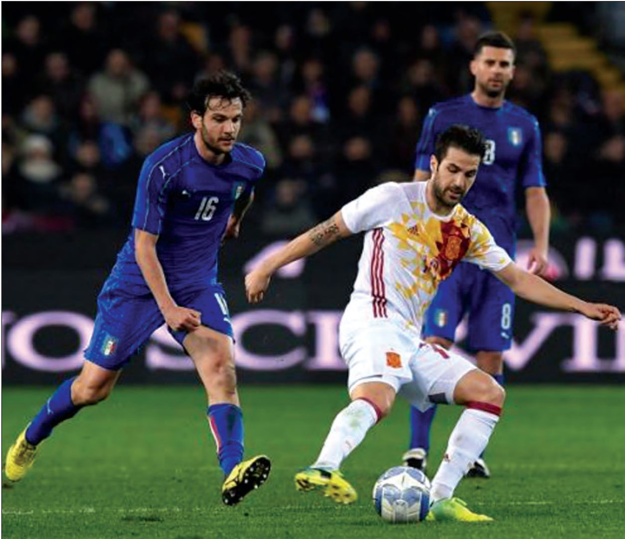
စွမ်းအားရှိတာမို့ အနိုင်ရလဒ်ဆိုတာ အိုက်စလန်တို့အတွက်ပဲ ဖြစ်ပါတယ်။

အုပ်စု(I)မှာတော့ အိုက်စလန်က တစ်ပွဲကစားပြီးချိန်မှာ တစ်မှတ်ရရှိထားသလို ဖင်လန်တို့ကလည်း တစ်မှတ်ရယူထားနိုင်ပါတယ်။ အိုက်စလန်ရဲ့ လက်ရှိကစားအားကိုကြည့်ရင် ဖင်လန်ထက် မြန်နှုန်းမြင့် ကစားနိုင်နေတာမို့ အခုပွဲမှာ ဖင်လန်တို့ မလွယ်ပါဘူး။ ဖင်လန်တို့ကတော့ နိုင်ပွဲတွေ ပျောက်ဆုံးနေဆဲရှိတာမို့ အခုပွဲမှာ အိုက်စလန်ကို အောင်နိုင်ဖို့ဆိုတာ မလွယ်ပါဘူး။ အိုက်စလန်ဟာ အနိုင်ရလဒ်ကို ဖော်ထုတ်နိုင်တဲ့