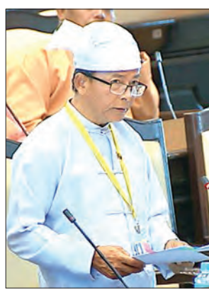
ဒေါက်တာထွန်းဝင်း ဒုတိယဝန်ကြီး

ခွင့်ပြုစေရယူအတွင်း ဆောင်ရွက်နိုင်ခြင်းမရှိသေးသည့် ဧရိယာများနှင့် ပတ်သက်၍ ၂၀၁၂ ခုနှစ် မြေလွတ်၊ မြေလပ်နှင့် မြေရိုင်းများ စီမံခန့်ခွဲရေးဥပဒေ၊ နည်းဥပဒေများနှင့်အညီ အသစ်ပြင်ဆင်စွဲစည်းမည့် ပြည်နယ်မြေလွတ်၊ မြေလပ်နှင့် မြေရိုင်းများ စီမံခန့်ခွဲရေးလုပ်ငန်းအဖွဲ့ ကြီးကြပ်ကွပ်ကဲမှုဖြင့် ကွင်းဆင်းစစ်ဆေး၍ ခွင့်ပြုစေရယူအတွင်းမှ ပယ်ဖျက်နိုင်ရန် ပတ်ကော်မတီသို့ တင်ပြဆောင်ရွက်စေမည်ဖြစ်ပြီး ပတ်ကော်မတီက မြေလွတ်၊ မြေလပ်နှင့် မြေရိုင်းခွင့်ပြုမိန့်အား တရားဝင်ပယ်ဖျက်နိုင်ရေး ဆောင်ရွက်သွားမည် ဖြစ်ပါကြောင်း ပြောကြားသည်။ ယနေ့ကျင်းပသည့် ဒုတိယအကြိမ် အမျိုးသားလွှတ်တော် ဒုတိယပုံမှန် အစည်းအဝေး ၄၁ ရက်မြောက်နေ့တွင် မွန်ပြည်နယ် မဲဆန္ဒနယ် အမှတ်(၈)မှ ဦးမျိုးဝင်း၏ “၂၀၁၂ ခုနှစ် မြေလွတ်၊ မြေလပ်နှင့် မြေရိုင်းများ စီမံခန့်ခွဲရေးဥပဒေပါ ပြဋ္ဌာန်းချက်များကို လိုက်နာဆောင်ရွက်ခြင်းမရှိသည့် အသင်းအဖွဲ့များနှင့် ထိုအသင်းအဖွဲ့များ ရယူပိုင်ဆိုင်ထားသည့် မြေယာများအပေါ် ဥပဒေနှင့်အညီ မည်ကဲ့သို့ ဆက်လက်အကောင်အထည်ဖော် ဆောင်ရွက်မည်ကို သိရှိလို