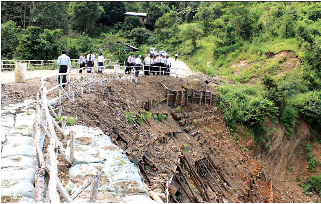
လုပ်ငန်းများကိုလည်း ဆောင်ရွက် ပြည်ထောင်စုဝန်ကြီး ဦးဝင်းခိုင်သည် ဌာနဆိုင်ရာတာဝန်ရှိသူများနှင့်အတူ အောက်တိုဘာ ၂ ရက် နံနက်ပိုင်းက ကြည့်ရှုစစ်ဆေးပြီး လမ်းအင်္ဂါရပ်နှင့်အညီ စံချိန်စံညွှန်းပြည့်မီအောင် တာဝန်ရှိသူများနှင့် တာဝန်ခံအင်ဂျင်နီယာကိုယ်တိုင် စောင့်ကြပ်ဆောင်ရွက်ရန် မှာကြားခဲ့ကြောင်း သိရသည်။ (အပေါ်ပုံ)

နေပြည်တော် အောက်တိုဘာ ၃ သံတွဲ-တောင်ကုတ်လမ်း ပြုပြင်ထိန်းသိမ်းရေးလုပ်ငန်းများ ဆောင်ရွက်လျက်ရှိပြီး အဆိုပါလမ်းပေါ်ရှိ ရွှေလှေတံတားကြီးသည် သဘာဝဘေးဒဏ်ကြောင့် သံတွဲဘက် ကမ်းကပ်ခုံရေတိုက်စားပျက်စီးမှုအား ပြန်လည်ပြုပြင် တည်ဆောက်လျက်ရှိသည်။ ထို့ပြင် အရှည် ၁၀၂ မိုင်ရှိ ပြည်ပန်းတောင်း-တောင်ကုတ်လမ်းကို ခရိုင်၊ အထူးအဖွဲ့နှင့် BOT အဖွဲ့တို့က အပိုင်းလိုက် လမ်းအဆင့်မြှင့်တင်ခြင်းနှင့် ပြုပြင်ထိန်းသိမ်းခြင်း လုပ်ငန်းများ ဆောင်ရွက်လျက်ရှိပြီး မိုင်တိုင်အမှတ် (၃၉/၇) နှင့် (၄၀/၀) ကြား ရေတိုက်စားပြီး လမ်းသားပြိုကျသည့်နေရာတွင်လည်း ကာကွယ်ထိန်းသိမ်းခြင်းလုပ်ငန်းများကို တစ်ပြိုင်တည်း ဆောင်ရွက်လျက်ရှိသည်။ ထို့အတူ ပြည်-အောင်လံ-ကိုးပင်လမ်းပိုင်းပြုပြင်ထိန်းသိမ်းခြင်း၊ ရိုးမမြတ်ကျော်လမ်းဖြစ်သည့် အရှည် ၉၆ မိုင် ၃ ဖာလုံရှိ ကိုးပင်-သာဂရလမ်း မိုင်တိုင်အမှတ် (၉၆/၂) တွင် စက်ယန္တရားများဖြင့် လမ်းချဲ့ခြင်း၊ ကျောက်ခင်းခြင်း