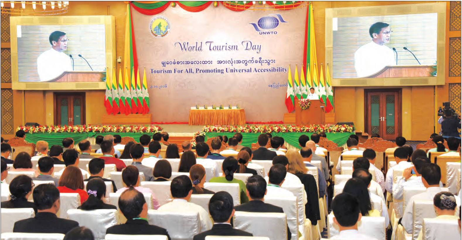
ဒုတိယသမ္မတ ဦးဟင်နရီပန်ထီးယူ နေပြည်တော်ရှိ မြန်မာအပြည်ပြည်ဆိုင်ရာ ကွန်ပင်ရှင်းပဟိုဌာန-၂ ၌ ကျင်းပသည့် ၂၀၁၆ ခုနှစ် ကမ္ဘာ့ခရီးသွားလုပ်ငန်းနေ့ အခမ်းအနားတွင် အမှာစကားပြောကြားစဉ် (သတင်းစဉ်)

နေပြည်တော် အောက်တိုဘာ ၃ ခရီးသွားလုပ်ငန်းတွင် ပါဝင်ပတ်သက် သည့်သူများအားလုံး တာဝန်ခံမှု၊ တာဝန် ယူမှုအပြည့်ဖြင့် လုပ်ဆောင်နေသမျှ ခရီးသွားလုပ်ငန်းသည် ဆက်လက်ဖွံ့ဖြိုး တိုးတက်နေမည်ဖြစ်ကြောင်း ဒုတိယ သမ္မတ ဦးဟင်နရီပန်ထီးယူက ယနေ့ နံနက် ၉ နာရီတွင် နေပြည်တော်ရှိ မြန်မာ အပြည်ပြည်ဆိုင်ရာ ကွန်ပင်ရှင်းပဟို ဌာန-၂ ၌ ကျင်းပသည့် ၂၀၁၆ ခုနှစ် ကမ္ဘာ့ ခရီးသွားလုပ်ငန်းနေ့ အခမ်းအနားတွင် ပြောကြားလိုက်သည်။ ထို့ပြင် ဒုတိယသမ္မတက ယခုအခါ ခရီးသွားလုပ်ငန်းသည် ကမ္ဘာ့အကြီးဆုံး နှင့် အဆက်မပြတ် အလျင်အမြန်ဖွံ့ဖြိုး နေသည့် စီးပွားရေးလုပ်ငန်းတစ်ခုအဖြစ် အားလုံးက အသိအမှတ်ပြုလာကြ ကြောင်း၊ ကမ္ဘာ့ခရီးသွားလုပ်ငန်းအဖွဲ့ချုပ် ၏ အဆိုအရ ခရီးသွားလုပ်ငန်း၏ အလုပ် အကိုင် ဖန်တီးပေးနိုင်မှုသည် ကမ္ဘာ့ အလုပ်အကိုင်များ၏ ၁၁ ပုံ ၁ ပုံ ရှိကြောင်း ခန့်မှန်းထားပြီး ခရီးသွားလုပ်ငန်းသည် အမျိုးသမီးများနှင့် လူငယ်များအတွက် အလုပ်အကိုင် အခွင့်အလမ်းများ ဖန်တီး ပေးနိုင်သည့် အဓိကလုပ်ငန်းတစ်ခုလည်း ဖြစ်ကြောင်း ဖော်ပြခဲ့သည်။ စာမျက်နှာ ၃ ကော်လံ ၁ *