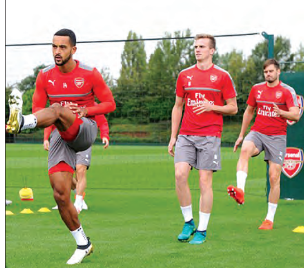
● ကောင်းမြတ်သူ - စုစည်းသည်။ ●

အာဆင်နယ်ရဲ့ ဒီနှစ်ရာသီတိုးတက်မှုကို ဆက်လက်ထိန်းထားနိုင်မယ်လို့ ကြည့်တဲ့အကြောင်း တိုက်စစ်မှူး ဝဲလ်ကော့သ်က အခိုင်အမာပြောဆိုလိုက်ပါတယ်။ “လက်ရှိအချိန်မှာ အာဆင်နယ်အသင်းရဲ့ ကစားပုံဟာ တိုးတက်လာတယ်။ ဒီအောင်မြင်မှုတွေကို ဆက်လက်ထိန်းထားရမယ်” လို့ ဝဲလ်ကော့သ်က အခိုင်အမာပြောဆိုခဲ့တာဖြစ်ပါတယ်။ အာဆင်နယ်ကစားသမားတွေဟာ ပိုပြီးကောင်းအောင် ကစားကြဖို့လို အပ်လာပြီး အထူးသဖြင့် စိတ်ပိုင်းဆိုင်ရာ ပြုပြင်ပြောင်းလဲမှုတွေ ပြုလုပ်ကြဖို့ ဝဲလ်ကော့သ်က တိုက်တွန်းပြောဆိုလိုက်ပါတယ်။ ဒီနှစ်ထဲမှာ အာဆင်နယ်အသင်းအနေနဲ့ ချယ်လ်ဆီးကို သုံးဂိုးပြတ်နဲ့ အနိုင်ရတဲ့ပွဲနှင့် ဘောဆယ်အသင်းကို နှစ်ဂိုးပြတ်နဲ့ အနိုင်ရတဲ့ ပွဲတွေဟာ အကောင်းဆုံး ခြေစွမ်းတွေပဲလို့ သူကဆိုပါတယ်။ ကျွန်တော်တို့ ကစားသမားတွေအနေနဲ့ လာမယ့်ပြိုင်ပွဲတွေမှာ စိတ်ဓာတ်ပိုင်းဆိုင်ရာ ပြုပြင်ပြောင်းလဲမှုတွေနဲ့ အကောင်းဆုံး ကစားကြမယ်လို့ ဝဲလ်ကော့သ်က ဆိုပါတယ်။