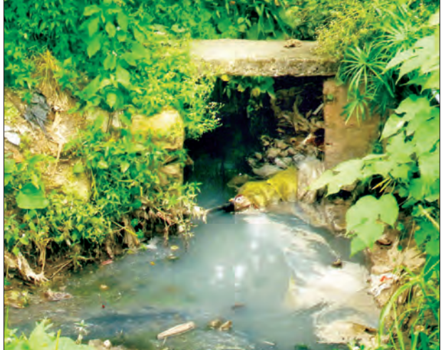
ပညာပေးဆောင်ရွက်ပေးစေလိုပြီး မိုးရာသီတွင် ရေလွှမ်းမိုးမှု မရှိစေရန် ဒေသခံပြည်သူများက မျှော်လင့်နေကြကြောင်း သိရသည်။ (၀၃၂)

မန္တလေးတိုင်းဒေသကြီး ပြင်ဦးလွင်ခရိုင် ပြင်ဦးလွင်မြို့နယ် ရပ်ကွက်ကြီး(၁)နှင့် ရပ်ကွက်ကြီး (၂) တို့ကို ဖြတ်သန်းစီးဆင်းနေသော ချောင်းသည် စည်းကမ်းမဲ့သုတေသန၊ မဆင်မခြင် အမှိုက်များစွန့်ပစ်နေမှုကြောင့်လည်းကောင်း၊ တချို့သော လူနေအိမ်များမှ ချောင်းအတွင်း ရေဆိုးများစွန့်ထုတ်နေမှုကြောင့်လည်းကောင်း ချောင်းသည် တဖြည်းဖြည်း ကျင်းမြောင်းတိမ်ကောလာရာ မိုးရာသီအချိန်၌ မိုးများသည့် အချိန်တိုင်း ရေစီးရေလာရေဆွဲအား မကောင်းတော့သည့်အတွက်ကြောင့် ပြင်ဦးလွင်မြို့ သုမင်္ဂလာဈေးတွင် ရေလွှမ်းမိုးမှုများ နှစ်စဉ်ဖြစ်ပေါ်ခဲ့ရသည်။ (ယာပုံ) ပြင်ဦးလွင်မြို့အနောက်ဘက်မှ စီးဆင်းလာသော ထောက်ပို့ချောင်း (ဒိုဘီချောင်း) နှင့် မြို့အလယ်မှ ဖြတ်သန်းစီးဆင်းနေသော ကန်တော်လေးရေကန် ရေဝေရေလဲသည့် ဂဲလောင်းချောင်း၊ ပြင်ဦးလွင်မြို့အရှေ့ဘက်မှ စီးဆင်းလာသော အဆိုပါချောင်းကို ဒေသခံပြည်သူများက ပြန်လည်တူးဖော်ရန် ဆန္ဒရှိနေကြပြီး ထောက်ပို့ချောင်း (ဒိုဘီချောင်း)၊ ဂဲလောင်းချောင်းတို့ပေါင်းဆုံ၍ အများပြည်သူများ အပန်းဖြေရာ ပွဲကောက်ရေတံခွန်သို့ စီးဆင်းသည့် ချောင်းဖြစ်သည်။ အဆိုပါချောင်းသည် ပြင်ဦးလွင်မြို့ ရပ်ကွက်ကြီး (၂) သုမင်္ဂလာဈေးဘေးမှ ဖြတ်သန်းစီးဆင်းနေသဖြင့် အမှိုက်များနှင့် အမြင်မသင့်တော်၍ မြို့ပြအင်္ဂါရပ်နှင့်အညီ သာယာလှပစည်းကမ်းရှိသော မြို့တစ်မြို့ဖြစ်လာအောင် ချောင်းအတွင်း အမှိုက်များကို မဆင်မခြင်စွန့်ပစ်သူများ၊ ချောင်းပတ်ဝန်းကျင်တွင် နေထိုင်ကြသူများအား အသိပညာပေးဆောင်ရွက်ပေးစေလိုပြီး မိုးရာသီတွင် ရေလွှမ်းမိုးမှု မရှိစေရန် ဒေသခံပြည်သူများက မျှော်လင့်နေကြကြောင်း သိရသည်။ (၀၃၂)