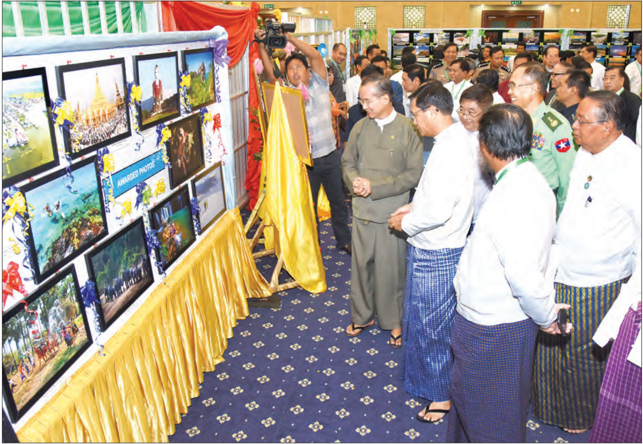
ဒုတိယသမ္မတ ဦးဟင်နရီပင်ထီးယူနှင့် တာဝန်ရှိသူများ ဆရာတော်ပုံများ၊ စာစီစာကုံးများနှင့် ခရီးသွားလုပ်ငန်း မှတ်တမ်းဓာတ်ပုံများကို လှည့်လည်ကြည့်ရှုစဉ် (သတင်းစဉ်)

ယင်းနောက် ပြည်ထောင်စုဝန်ကြီးများက ၂၀၁၆ ခုနှစ် ကမ္ဘာ့ခရီးသွား