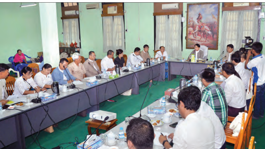
ကလေးစာပေပွဲတော်ကျင်းပရေး လုပ်ငန်းညှိနှိုင်းအစည်းအဝေး၌ ပြည်ထောင်စုဝန်ကြီး ဒေါက်တာ ဖေမြင့် အမှာစကားပြောကြားစဉ်

ရန်ကုန် အောက်တိုဘာ ၂ ကလေးစာပေပွဲတော် ကျင်းပနိုင်ရေးအတွက် သက်ဆိုင်ရာ တာဝန်ရှိသူများ၊ ကျွမ်းကျင်ပညာရှင်များ၊ စာပေပညာရှင်များ နှင့် ကလေးစာပေပွဲတော်ကို စိတ်ဝင်စားသူများအားလုံး ပူးပေါင်း ပါဝင်ဆွေးနွေးကြစေလိုကြောင်း၊ နေပြည်တော်၌ ကလေး စာပေပွဲတော်တစ်ခုကို ခမ်းခမ်းနားနား စတင်ကျင်းပရန် စီစဉ် ထားကြောင်း၊ ကလေးစာပေပွဲတော်တွင် ထပ်မံဆောင်ရွက် လိုသည့် အစီအစဉ်များ၊ စိတ်ကူးစိတ်သန်းများကို ယခုအစည်း အဝေးတွင် ပိုင်းဝန်းဆွေးနွေး အကြံပြုကြစေလိုကြောင်းဖြင့် ပြန်ကြားရေးဝန်ကြီးဌာန ပြည်ထောင်စုဝန်ကြီး ဒေါက်တာ ဖေမြင့်က ပြောသည်။ ရန်ကုန်မြို့၊ သိမ်ဖြူလမ်းရှိ ပုံနှိပ်ရေးနှင့် ထုတ်ဝေရေးဦးစီး ဌာန ဗဟိုပုံနှိပ်စက်ရုံ အစည်းအဝေးခန်းမ၌ ယနေ့မနန်းလွဲ ၁ နာရီတွင် ကျင်းပသည့် ကလေးစာပေပွဲတော် ကျင်းပရေး လုပ်ငန်းညှိနှိုင်းအစည်းအဝေးတွင် ပြည်ထောင်စုဝန်ကြီးက ထိုသို့ ပြောကြားခဲ့ခြင်းဖြစ်သည်။ ထို့နောက် ပြန်ကြားရေးနှင့် ပြည်သူ့ဆက်ဆံရေးဦးစီးဌာန ညွှန်ကြားရေးမှူးချုပ် ဦးမောင်ဖေနှင့် ညွှန်ကြားရေးမှူး(စီမံ) ဦးအေးကြွယ်တို့က ကလေးစာပေပွဲတော်ကျင်းပမည့် အစီအစဉ်