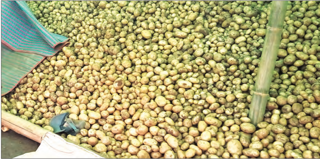
အလူးမျိုးကို ဓာတ်ခွဲခန်းများတည်ဆောက်၍ အသိအမှတ်ပြု အလူးမျိုးများကို တင်သွင်း များကို မျိုးစေ့ပဒေနှင့်အညီ တင်သွင်းခွင့်ပေး ထုတ်လုပ်ဖြန့်ဖြူးပေးရန်၊ ရေတိုစီမံကိန်းအဖြစ် စိုက်ပျိုးနိုင်ရန်၊ အသိအမှတ်ပြုထားသည့်မျိုးစေ့ ရန်တိုဖြစ်သည်။

အလူးမျိုးကောင်းမျိုးသန့်ရရှိနိုင်ရန် ရေရှည်စီမံကိန်းများအဖြစ် စိုက်ပျိုးရေးပညာရှင်များမှ ပိုင်းရပ်စီနှင့် ရောဂါပိုးမွှားများကင်းစင်သော