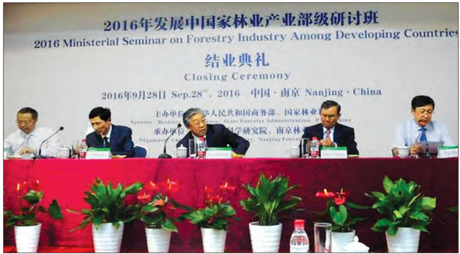
Wood Industry Co., Ltd. သို့ သွားရောက်၍ သစ်အခြေခံအထပ်သားများ ထုတ်လုပ်နေမှုအားလည်းကောင်း၊ Eco-sites အဖြစ် သဘာဝအခြေခံခရီးသွားလုပ်ငန်းပတ်ဝန်းကျင်လျက် ဝါးစိုက်ခင်းတည်ထောင်ထားမှုအားလည်းကောင်း၊ Anji Bamboo ExpoPark သို့ သွားရောက်၍ တရုတ်ပြည်သူ့သမ္မတနိုင်ငံအတွင်း ပေါက်ရောက်လျက်ရှိသည့် ဝါးမျိုးများနှင့် ဝါးအခြေခံလက်မှုအနုပညာလက်ရာများ ပြသထားမှုအားလည်းကောင်း၊ နန်နင်းမြို့ရှိ နန်နင်းသစ်တောတက္ကသိုလ်ပြခန်းနှင့် ကျောင်းဝင်းအတွင်းအား လည်းကောင်း လှည့်လည်လေ့လာခဲ့ကြသည်။ (သတင်းစဉ်)

များနှင့် သားရဲတိရစ္ဆာန်များ ကာကွယ်ထိန်းသိမ်းရေး၊ စိုက်ခင်းသစ်တောများအား သစ်အပြင် အခြားဘက်စုံအသုံးပြုနိုင်ရေးအတွက် စီစဉ်ဆောင်ရွက်နေမှု၊ မြေယာပိုင်ဆိုင်မှုနှင့်ပတ်သက်၍ ပြုပြင်ပြောင်းလဲခဲ့မှု၊ ဝါးအခြေခံ စက်မှုနှင့် ပညာနှင့် အသုံးချမှုများအား ဆွေးနွေးခဲ့ကြောင်း သိရသည်။ ဆွေးနွေးပွဲများအပြင် လေ့လာရေးခရီးစဉ်အဖြစ် ကွမ်ကျိုးမြို့ရှိ တရုတ်နိုင်ငံ အမျိုးသားဝါးသုတေသန ဗဟိုဌာနရှိ သုတေသနဓာတ်ခွဲခန်းအား လည်းကောင်း၊ West Lake ရေကန်အားခရီးသွားလုပ်ငန်းဖွံ့ဖြိုးတိုးတက်ရေးအတွက် စီစဉ်ဆောင်ရွက်ထားရှိမှုအား လည်းကောင်း၊ Zhejiang Yoyu Bamboo Industry Co., Ltd. သို့ သွားရောက်၍ ဝါးနှင့် ကြမ်းခင်း၊ ပရိဘောဂနှင့် အခြားအလှဆင်ပစ္စည်းများ ထုတ်လုပ်နေမှုအား လည်းကောင်း၊ Deqing Dehua