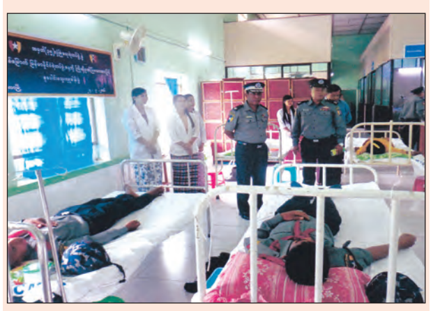
(၅)နှစ်မြောက် ရဲတပ်ဖွဲ့နေ့ကို ဂုဏ်ပြုသောအားဖြင့် မိတ္ထီလာမြို့အမှတ်(၃) လုံခြုံရေးရဲကွပ်ကဲမှုအဖွဲ့မှူးရုံး ကွပ်ကဲရေးမှူး ယာယီရဲမှူးချုပ်မြင့်တိုးနှင့် အမှတ်(၃၅) လုံခြုံရေးရဲတပ်ဖွဲ့မှူး ဒုတပ်ဖွဲ့မှူး ရဲမှူးမင်းသူတို့ ဦးဆောင်သော ရဲတပ်ဖွဲ့ဝင်နှင့် မိသားစုဝင် စုစုပေါင်း ၆၀ တို့ မိတ္ထီလာပြည်သူ့ဆေးရုံကြီး၌ စက်တင်ဘာနောက်ဆုံးပတ်အတွင်းက စုပေါင်းသွေးလှူဒါန်းစဉ် ကိုရဲ