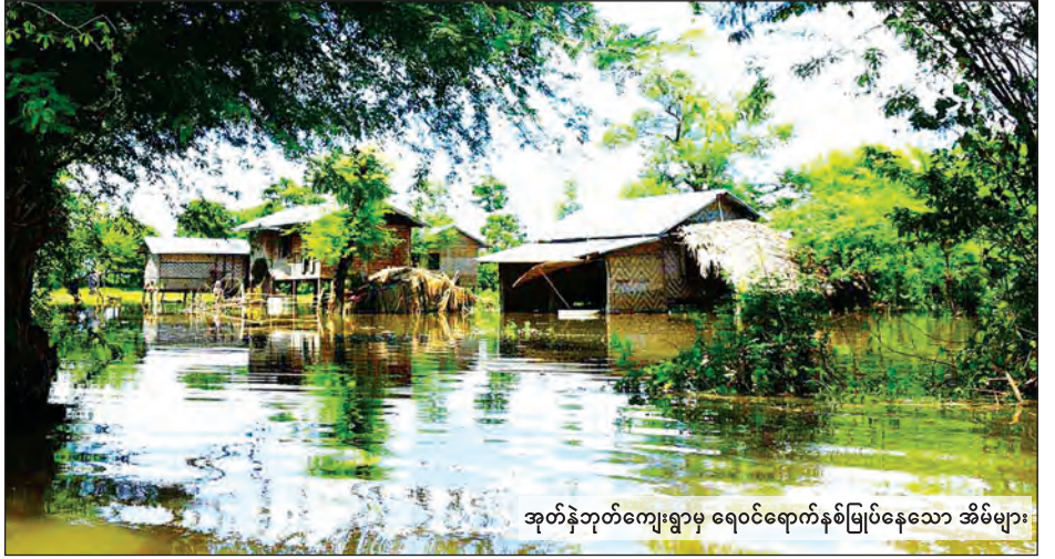
အုတ်နဲဘုတ်ကျေးရွာမှ ရေဝင်ရောက်နှစ်မြုပ်နေသော အိမ်များ

မန္တလေးတိုင်းဒေသကြီး မိတ္ထီလာမြို့နယ် ကျောက်ဖြူကုန်းကျေးရွာအုပ်စု အုတ်နဲဘုတ်ကျေးရွာတွင် ရက် ၁၀၀ စီမံချက်ကာလအတွင်း ၂၀၀၆-၂၀၀၇ ဘဏ္ဍာနှစ်ခွင့်ပြုငွေ ကျပ် ၈၅ သိန်းအကုန်အကျခံ၍ တူးဖော်ခဲ့သည့် မြေသားရေကန်မှာ မိတ္ထီလာမြောက်ကန်ရေအောက်နှစ်မြုပ်သွားသဖြင့် ကျေးရွာမှ ဒေသခံအချို့ သောက်သုံးရေအတွက် အခက်အခဲကြုံတွေ့နေကြောင်း သိရသည်။