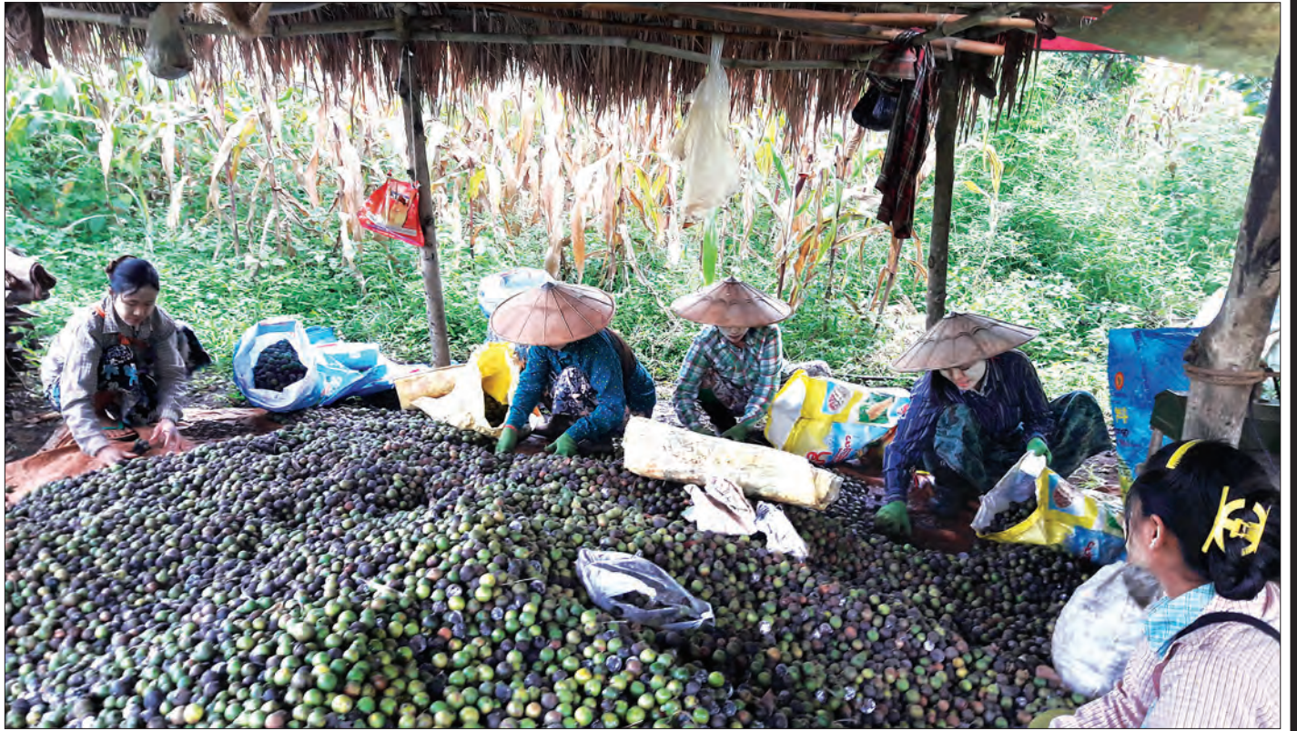
မက္ကဒေးမီးယားအသီးများကို ရွေးချယ်သန့်စင်နေကြသူများကို တွေ့ရစဉ်