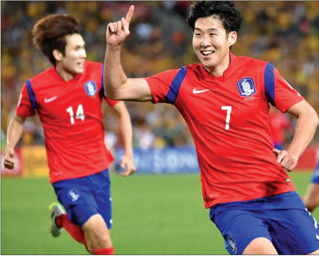
တောင်ကိုရီးယားအသင်း၏ တိုက်စစ်မှူး၊ Son Heung Min

အုပ်စု(B)မှာ နှစ်သင်းစလုံး နှစ်ပွဲကစားပြီး ချိန်မှာ တစ်မှတ်စီရရှိထားလို့အခြေအနေမကောင်း ပါဘူး။ ခံစစ်ပိုင်းအားနည်းတဲ့ တရုတ်အသင်းဟာ တိုက်စစ်မှူးကောင်းသာရှိတဲ့ ဆီးရီးယားကိုတော့ အနိုင်ရအောင် ကြိုးစားပါလိမ့်မယ်။ တရုတ်နဲ့ ဆီးရီးယားတို့ နောက်ဆုံးသုံးပွဲကစားခဲ့တဲ့ရလဒ် ကိုကြည့်ရင် တစ်ပွဲစီနိုင်ပြီး သရေတစ်ပွဲဖြစ်ထား ပါတယ်။ အခုပွဲမှာ တရုတ်တို့ နိုင်ပွဲရဖို့ များပေ မယ့် သရေပွဲလည်း ဖြစ်ပွားနိုင်ပါတယ်။