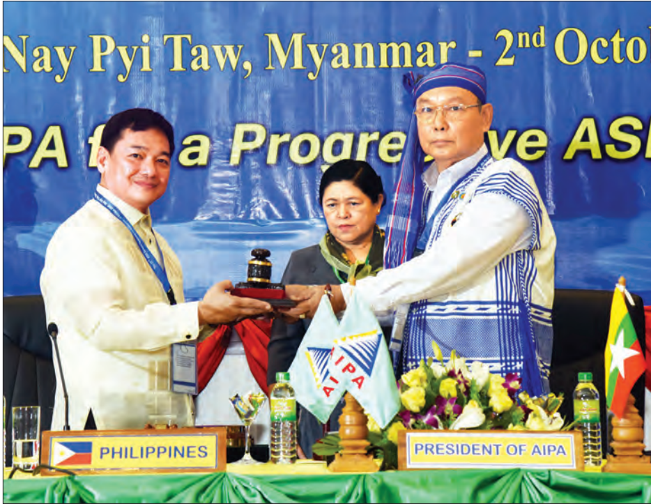
အာဆီယံပါလီမန်များ အထွေထွေညီလာခံတွင် မန်းဝင်းခိုင်သန်း ဖိလစ်ပိုင်နိုင်ငံ အောက်လွှတ်တော် ဒုတိယဥက္ကဋ္ဌ မစ္စတာ အဲရစ် ဆင်းဆန်းထံ အာဆီယံပါလီမန်များ အထွေထွေညီလာခံဥက္ကဋ္ဌရာထူး၊ အဆောင်အယောင်ဖြစ်သည့် တူနှင့် AIPA အလံတို့ကို လွှဲပြောင်းပေးအပ်စဉ် (သတင်းစဉ်)

◆ ရှေ့မှ အတွက် အာဆီယံလူမှုကာကွယ်ရေး ကြေညာစာတမ်းပါ လုပ်ငန်းအစီအစဉ် များ အကောင်အထည်ဖော် ဆောင်ရွက် ခြင်း စသည် အကြောင်းအရာများကို လည်း ဆွေးနွေးခဲ့ပါကြောင်း။ အမျိုးသမီး ပါလီမန်အမတ်များ အဖွဲ့၏ လုပ်ထုံးလုပ်နည်းစည်းများ ပြင်ဆင်ချက်အပေါ် ဆုံးဖြတ်ချက် မူကြမ်းကို စဉ်းစားဆွေးနွေးပြီး တစ်ည တစ်ညတည်း ချမှတ်နိုင်ခဲ့ပါကြောင်း။ ထိုလုပ်ထုံးလုပ်နည်းများ စည်းမျဉ်းများ သည် လွန်ခဲ့သည့် ၁၈ နှစ်က ချမှတ်ခဲ့ ခြင်းဖြစ်ပြီး အမျိုးသမီးကိုယ်စားလှယ်များ ၎င်းတို့၏ လုပ်ငန်းဆောင်တာများကို စွမ်းရည်မြှင့် ထိရောက်စွာဆောင်ရွက် နိုင်ရန်အတွက် ပြင်ဆင်ရေးဆွဲရန်လည်း လိုအပ်လျက်ရှိပါကြောင်း။