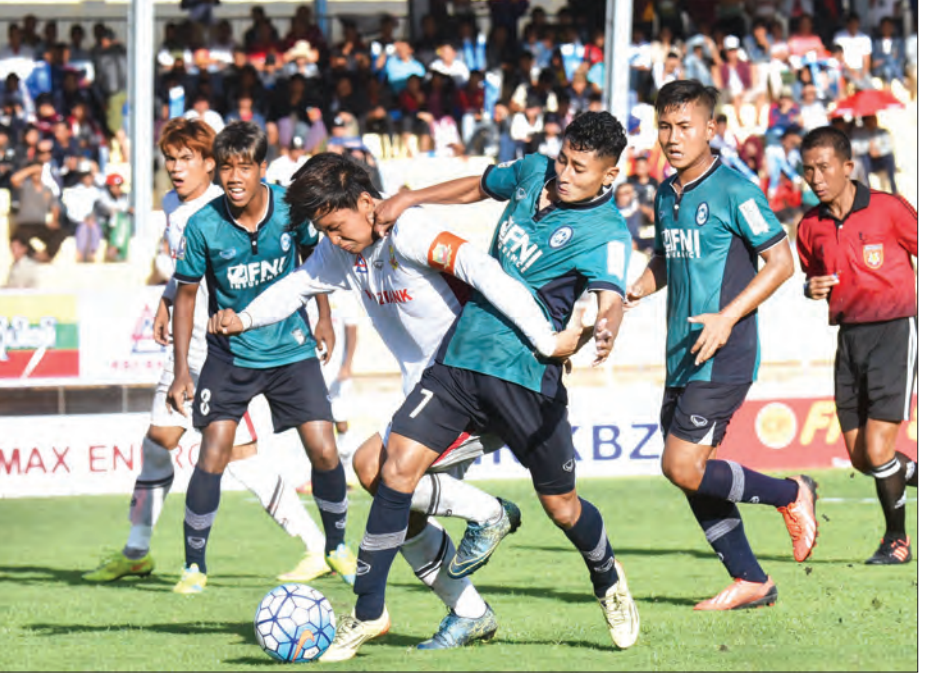
၂၀၁၆ ရာသီ MNL လူငယ်ပြိုင်ပွဲတွင်ချန်ပီယံဆုရခဲ့သည့် ရှမ်းယူနိုက်တက်နှင့် ဒုတိယဆုရ ရန်ကုန်တို့တွေ့ဆုံစဉ်

ရန်ကုန် အောက်တိုဘာ ၂ မြန်မာနိုင်ငံ တောလုံးအဖွဲ့ချုပ်သည် လူငယ်ကစားသမားများ ထွက်ပေါ်လာ စေရန်နှင့် ပွဲအတွေ့အကြုံ ရရှိစေရန် အတွက် ၂၀၁၇ ရာသီမှစတင်ကာ လူငယ် ပြိုင်ပွဲများ တိုးမြှင့်ကျင်းပမည်ဖြစ်သည်။ မြန်မာနိုင်ငံတောလုံးအဖွဲ့ချုပ်သည် ၂၀၁၆ ရာသီအထိ MNL လိဂ်ပြိုင်ပွဲနှင့် MNL -2 (ပထမတန်း)လိဂ်ပြိုင်ပွဲသာ ကျင်းပခဲ့ပြီး ယင်းအတန်းများတွင် လူငယ် ပြိုင်ပွဲတစ်ခုစီသာ ကျင်းပခဲ့ခြင်းဖြစ်သည်။ သို့သော် ၂၀၁၇ ရာသီမှစတင်ကာ ပြိုင်ပွဲ ကျင်းပသည့်ပုံစံ ပြောင်းလဲခဲ့ပြီး အတန်း တစ်ခုတွင် လူငယ်ပြိုင်ပွဲနှစ်ခုစီ ကျင်းပ ရမည်ဖြစ်သည်။ MNL လိဂ်တွင် လူငယ် ပြိုင်ပွဲများအဖြစ် ယူ - ၂၁ပြိုင်ပွဲနှင့် ယူ-၁၉ ပြိုင်ပွဲ၊ MNL-2 လိဂ်တွင် ယူ - ၂၀ ပြိုင်ပွဲ နှင့် စာမျက်နှာ ၅ ကော်လံ ၁ ၀