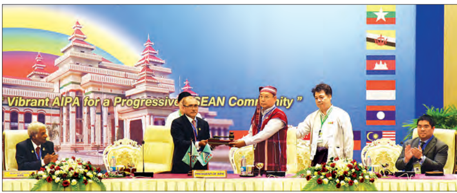
အာဆီယံပါလီမန်များညီလာခံဥက္ကဋ္ဌရာထူး၊ အဆောင်အယောင်ဖြစ်သည့် တူနှင့် AIPA အလံတို့ကို ပြည်ထောင်စုလွှတ်တော် နာယက၊ အမျိုးသားလွှတ်တော်ဥက္ကဋ္ဌ မန်းဝင်းခိုင်သန်းထံသို့ လွှဲပြောင်းပေးအပ်စဉ်

ညီလာခံ ကျင်းပပြီးစီးသည့် အချိန်မှစ၍ ယခု ၂၀၁၆ ခုနှစ်တွင် ကျင်းပသော (၃၇) ကြိမ်မြောက် အာဆီယံပါလီမန်များ အထွေထွေညီလာခံအထိ ဥက္ကဋ္ဌတာဝန်ကို ဆက်လက်ထမ်းဆောင်ရန် သဘောထားကြီးမူသည် အာဆီယံပါလီမန်များညီလာခံ၏ အောင်မြင်မှုအတွက် တန်ဖိုးကြီးမားသော လုပ်ဆောင်မှုတစ်ရပ်အဖြစ် မိမိတို့အားလုံးက အသိအမှတ်ပြုပါကြောင်း၊ အာဆီယံပါလီမန်များ ညီလာခံ၏ ဖွဲ့စည်းပုံစည်းမျဉ်းနှင့်အညီ နှစ်စဉ် အထွေထွေညီလာခံ ကျင်းပနိုင်ရေး