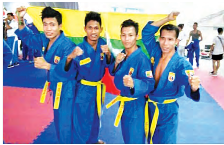
အမျိုးသားလေးယောက်တွဲ (လက်နက်ပါ) ရွှေတံဆိပ်ရရှိကြသည့် ပိုမိုနမံအားကစားသမားများ