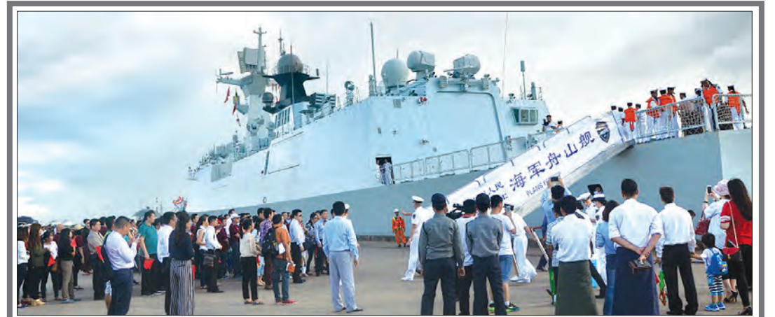
ချစ်ကြည်ရေးခရီးစဉ်အဖြစ် တရုတ်ရေတပ် ရေကြောင်းကာကွယ်ရေးအဖွဲ့မှ တိုက်ချင်းပစ် ဒုံးတင်စစ်ရေယာဉ် XIANG TAN နှင့် ZHOU SHAN စစ်ရေယာဉ်နှစ်စင်း ရန်ကုန်မြို့သို့လာရောက်ကမ်းသို့ ရောက်ရှိလာစဉ် သတင်းစာ- ၈