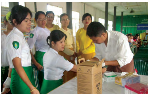
ကရင်ပြည်နယ် ဘားအံမြို့တွင် ပြည်နယ်မိခင်နှင့် ကလေးစောင့်ရှောက်မှုကြီးကြပ်ရေးအဖွဲ့နှင့် ပြည်နယ်ကျန်းမာရေးဦးစီးဌာနတို့ ပူးပေါင်း၍ HIV/AIDS နှင့် ဇီကာပိုင်းရပ်စ်အကြောင်း အသိပညာပေးဟောပြောပွဲကို စက်တင်ဘာ ၂၈ ရက်က ဘားအံမြို့ အမျိုးသမီးအိမ်တွင်းမူသက်မွေးလုပ်ငန်းပညာသင်တန်းကျောင်း၌ ကျင်းပပြီး ဆရာမများနှင့် သင်တန်းသူများအား HIV နှင့် အသိပေးဆောင်ရွက်ပေးခဲ့ပြီး ရှိ မရှိ စမ်းသပ်စစ်ဆေးလိုသူများအား အခမဲ့စမ်းသပ်စစ်ဆေးပေးစဉ်၊ ဘေးမျိုးမင်းသိန်း(ပြန်/ဆက်)

“၄၈။ ပြည်ထောင်စုဥပဒေဆိုင်ရာ အထောက်အကူပေးရေးအဖွဲ့သည် နည်းဥပဒေ၊ စည်းမျဉ်း၊ စည်းကမ်း၊ လုပ်ထုံးလုပ်နည်း၊ အမိန့်ကြော်ငြာစာ၊ အမိန့်နှင့်ညွှန်ကြားချက်များကို ထုတ်ပြန်နိုင်သည်။”