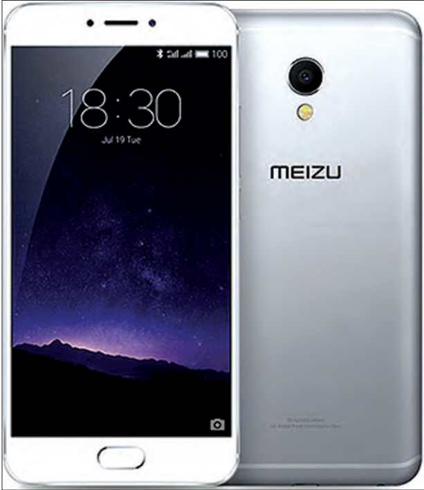
ရွှေရောင်နှစ်မျိုး၊ မီးခိုးရောင်နဲ့ ငွေရောင်တို့ကို ရရှိနိုင်မှာဖြစ်ပြီး ဈေးနှုန်းက ကျပ် ၃၄၀၀၀၀ ဝန်းကျင် ရှိပါတယ်။ သူရဗြီး

နိုင်ငံတကာဈေးကွက်မှာရော ပြည်တွင်းဈေးကွက်မှာပါ နာမည်ရစပြုနေတဲ့ Meizu ရဲ့ စမတ်ဖုန်းမော်ဒယ်သစ် MX6 ဟာ အရည်အသွေးမြင့် စွမ်းဆောင်ရည်မြင့်ဖုန်းတစ်လုံးဖြစ်ပြီး နိုင်ငံတကာဈေးကွက်မှာ ဇူလိုင်လအတွင်းက စပြန်ခဲ့ပါတယ်။ ပြည်တွင်းဈေးကွက်ကိုတော့ ပြီးခဲ့တဲ့လအတွင်းက ဝင်ရောက်ခဲ့တာဖြစ်ပါတယ်။ မျက်နှာပြင်အကျယ် ၅ ဒဿမ ၅ လက်မရှိလို့ အရွယ်အစားကြီးတဲ့ ဖုန်းတစ်လုံးဖြစ်ပြီး Screen Resolution က 1080x1920 pixels ရှိလို့ ရုပ်ထွက်ပိုင်းကောင်းမွန်ပါတယ်။ မိုဘိုင်းနက်ဝပ်အနေနဲ့ GSM နက်ဝက်ဖြစ်ပြီး ဆင်းကတ်နှစ်ကတ် ထည့်သုံးနိုင်ပါတယ်။ အင်တာနက်နက်ဝပ်ကတော့ 4G(LTE)ကို ထောက်ပံ့ပေးထားပါတယ်။ အန်းဒရွိုက်စားရှင်းက နောက်ဆုံးထွက် 6.0 Marshmallow ကို အသုံးပြုထားပြီး CPU က Deca-Core ဖြစ်လို့ ဈေးကွက်မှာတွေ့နေရတဲ့ Octa-Core တွေထက် ပိုမြန်ပြီး လက်ရှိအချိန်မှာ အမြန်ဆုံးဖုန်းလိုလည်း ဆိုနိုင်ပါတယ်။ RAM က 3GB နဲ့ 4GB ဗားရှင်းနှစ်မျိုးထွက်ထားပြီး အင်တာနယ်မင်မိုရီက 32GB ရှိပါတယ်။ အင်တာနယ်မင်မိုရီပါဝင်မှုက များပေမယ့် မင်မိုရီကတ်ကို ထပ်စိုက်သုံးလို့မရတာကတော့ ဒီဖုန်းရဲ့ အဓိကအားနည်းချက်ပဲဖြစ်ပါတယ်။ ကင်မရာပိုင်းမှာတော့ နောက်ကင်မရာက ၁၂ မဂ္ဂါပစ်ဗေလ်ရှိပြီး Dual LED Flash, HDR, Panorama လုပ်ဆောင်ချက်တွေ ပါဝင်သလို မီဒီယံကိုလည်း 2160 pixels အရည်အသွေးနဲ့ ရိုက်ကူးနိုင်ပါတယ်။ ရှေ့ကင်မရာကတော့ ၅ မဂ္ဂါပစ်ဗေလ်ရှိလို့ ဈေးကွက်ထဲက အသစ်ထွက်ဖုန်းတွေဟာ ၈ မဂ္ဂါပစ်ဗေလ်လောက် ရှိနေတာကြောင့် အနည်းငယ်နိမ့်နေတယ်လို့ ဆိုနိုင်ပါတယ်။ ဘက်ထရီပိုင်းမှာလည်း 3060 mAh Li-ion ဘက်ထရီပါဝင်လို့ စွမ်းရည်မြင့်ပါတယ်။ ကိုယ်ထည်အရောင်အနေနဲ့