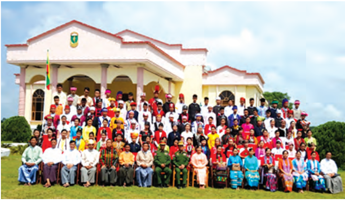
သင်တန်းဆင်းအခမ်းအနားအပြီး အမှတ်တရ စုပေါင်းဓာတ်ပုံရိုက်ကူးစဉ်

အရှေ့အိန္ဒိယ ရောက်လာကြလည်း လာပါရင်သွေး၊ ပန်းကလေးဟု နွေးထွေးဝမ်းသာ၊ ကြိုလင့်ပါသည် မေတ္တာနှုန်းက ပန်းရိပ်မြို့။ အနောက်အိန္ဒိယ ရောက်လာကြလည်း လာပါကိုယ်ပွား၊ သမီးသားဟု ဝမ်းပန်းပျူငှာ၊ ကြည်ဖြူပါသည် သစ္စာနှုန်းက ပန်းရိပ်မြို့။ တောင်နှင့်မြောက်က၊ ရောက်လာကြလည်း လာပါထာဝစဉ်၊ ကြိုမြင်တည် ဧည့်သည်များ သားရွှေဥဒယ် ကရုဏာလွှမ်းမည် ပန်းရိပ်မြို့။