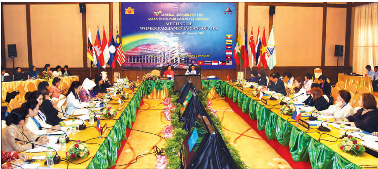
(၃၇)ကြိမ်မြောက် အာဆီယံပါလီမန်များညီလာခံ ဖွင့်ပွဲနေ့တွင် Committee on Women Parliamentarians of AIPA အစည်းအဝေးပွဲ ကျင်းပစဉ်

အလားတူ ညနေ ၃ နာရီတွင် အဆိုပါဟိုတယ် တနင်္သာရီခန်းမ၌ Committee on Organizational Matters အစည်းအဝေးပွဲကို ဆက်လက်ကျင်းပရာ ဥက္ကဋ္ဌ