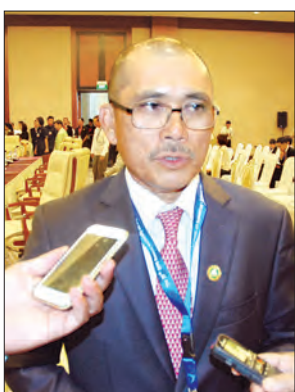
Datuk Seri Dr. Ronald Kiandee