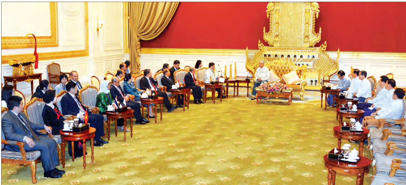
နိုင်ငံတော်သမ္မတ ဦးထင်ကျော် အာဆီယံနိုင်ငံများမှ လွှတ်တော်ဥက္ကဋ္ဌ၊ ဒုတိယဥက္ကဋ္ဌများနှင့် အာဆီယံပါလီမန်များ အစည်းအရုံး အတွင်းရေးမှူးချုပ်တို့အား လက်ခံတွေ့ဆုံစဉ် (သတင်းစဉ်)

ပြည်ထောင်စုသမ္မတ မြန်မာနိုင်ငံတော် နိုင်ငံတော်သမ္မတ ဦးထင်ကျော်သည် (၃၇)ကြိမ်မြောက် အာဆီယံပါလီမန်များညီလာခံသို့ တက်ရောက်လာကြသည့် အာဆီယံနိုင်ငံများမှ လွှတ်တော်ဥက္ကဋ္ဌ၊ ဒုတိယဥက္ကဋ္ဌများနှင့် အာဆီယံပါလီမန်များ အစည်းအရုံး အတွင်းရေးမှူးချုပ်တို့အား ယနေ့ ညနေ ၄ နာရီတွင် နေပြည်တော်ရှိ နိုင်ငံတော်သမ္မတ အိမ်တော် သံတမန်ဆောင်ရွက်ခန်းမ၌ လက်ခံတွေ့ဆုံသည်။