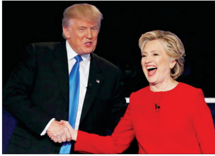
နာလန်ပြန်ထစ်စဖြစ်သည့်အပြင် နေမကောင်းခြင်းကြောင့် လူထုထောက်ခံမှုများလည်း အနည်းငယ် ကျဆင်းနေသည့်အကြောင်းများကြောင့် စကားစစ်ထိုးပွဲတွင် ဖိအားများဖြစ်ပေါ်ခဲ့သော်လည်း ၎င်း၏ကာလရှည်ကြာ ကြိုတင်ပြင်ဆင်မှုများကြောင့် ထရန်အား မိနစ် ၉၀ ကြာစကားစစ်ထိုးပွဲတွင် လက်ရည်မှုခဲ့သည်ဟု သုံးသပ်ရမည်ဖြစ်သည်။

မည်သို့ဆိုစေ အမေရိကန်သမ္မတဖြစ်လာရေး သူတင်ကိုယ်တင် အပြိုင်ကြဲကာ အနိုင်မခံအရှုံးမပေးဘဲ လှေခွက်ချည်း ကျန်အလံမလဲသည့် စိတ်ဓာတ်ဖြင့် တစ်ဖက်နှင့်တစ်ဖက် အက်စမ်းကြသည်မှာ ရင်ခုန်လှုပ်ရှားစရာကောင်းသလို အမေရိကန် ပြည်ထောင်စု၏ အနာဂတ်အရေးသည်လည်း ပဲ့ကိုင်ရှင်အပေါ်တွင် မူတည်နေလေသည်တကားဟု သုံးသပ်မိရင်း နိဂုံးကမ္မတ် အဆုံးသတ်လိုက်ရလေသတည်း။ ။ (ရိုက်တာ-၂၈-၉-၂၀၁၆)