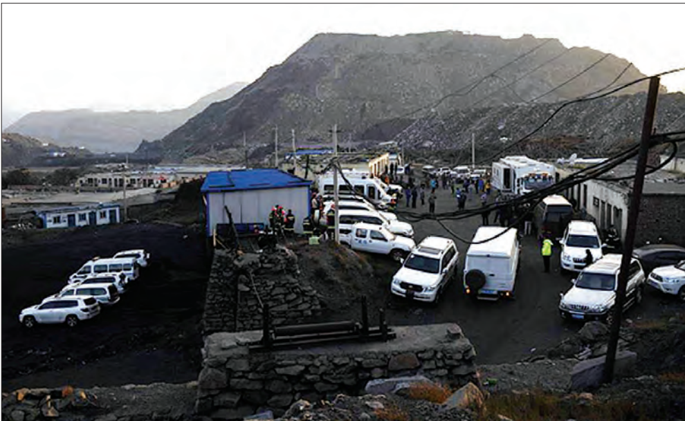
တရုတ်နိုင်ငံအနောက်မြောက်ပိုင်း နှင်းရှားဟေ့ကိုယ်ပိုင်အုပ်ချုပ်ခွင့်ရဒေသတွင် စက်တင်ဘာ ၂၇ ရက်ကကျောက်မီးသွေးတွင်းပေါက်ကွဲမှုကြောင့်သေဆုံးသူဦးရေမှာ ၁၈ ဦးထိမြင့်တက်လာခဲ့ပြီဖြစ်ကြောင်း ဒေသဆိုင်ရာ အာဏာပိုင်များက ပြောကြားခဲ့သည်။

ကယ်ဆယ်ရေးလုပ်ငန်းဆောင်ရွက်မှုများကို သက်ဆိုင်ရာမှတာဝန်ရှိသူများက လာရောက်စစ်ဆေးကာလိုအပ်သည်များ ညွှန်ကြားခဲ့ကြောင်း သိရသည်။ (ဆင်ဟွာ)