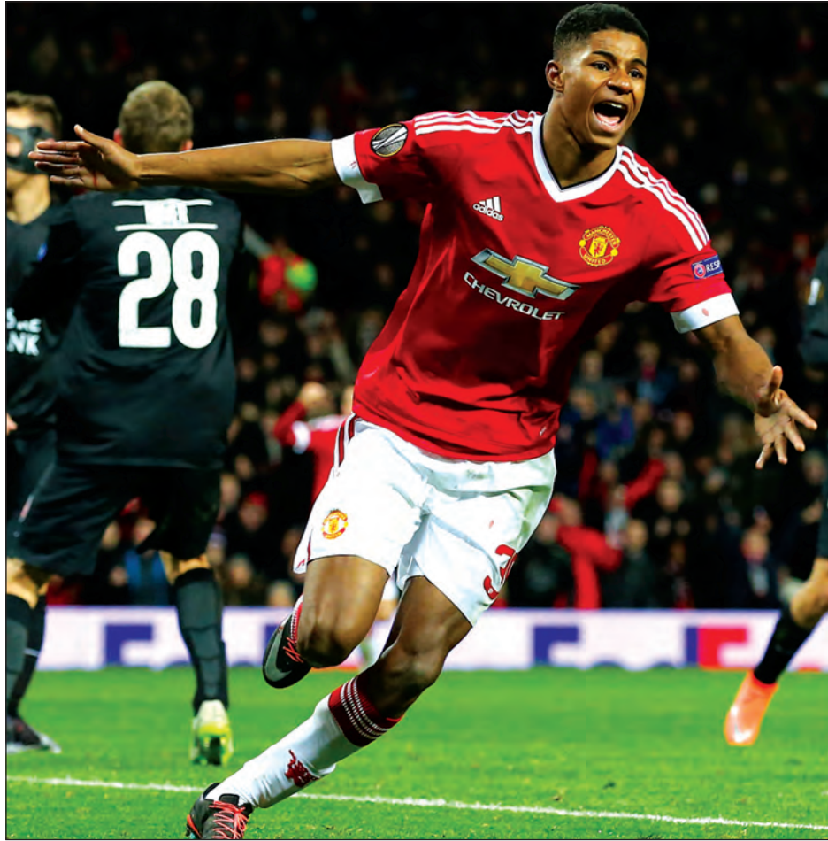
လစာနှစ်ဆတိုးပေးပြီး နောက်ထပ်ကာလရှည် စာချုပ်တစ်ရပ် ချုပ်ဆိုဖို့ စီစဉ်နေပြီဖြစ်ပါတယ်။ ငယ်မွေးခြံပေါက် လူငယ်ကစား သမားတွေအနက် ခြေစွမ်းထက်မြက်တဲ့ ကစားသမားတွေကို

မန်ယူဟာ ရပ်ရှိုဖိုဒ်ကို လက်လွတ်မဆုံးရှုံးရအောင် လုပ်ခ