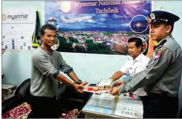
ပဲဟိုးလေဆိပ်တွင် စက်တင်ဘာ ၂၅ ရက်က မေ့ကျန်ခဲ့သောပစ္စည်းကာလတန်ခိုင်းငွေကျပ်သိန်းပေါင်း ၆၀ ကျော်ခန့်အား တာချီလိတ်လေကြောင်း ရဲတပ်ဖွဲ့နှင့် မြန်မာ့လေကြောင်းတာဝန်ခံတို့မှ ပိုင်ရှင်ဖြစ်သူ ဦးညီအောင်ထံသို့ ယင်းနေ့ ညနေပိုင်းက ပြန်လည်ပေးအပ်ခဲ့စဉ် မောင်ယဉ်ကျေး