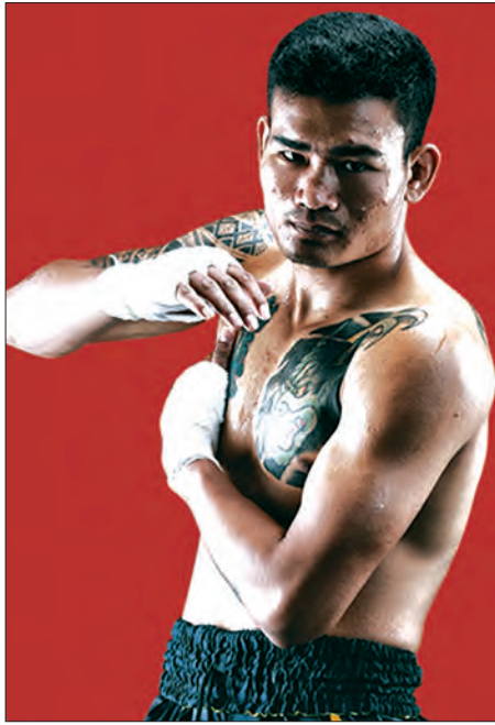
တူးတူး(နဂါးမာန်)