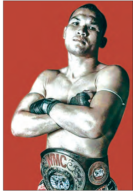
တန်ယွန်(ထိုင်း)