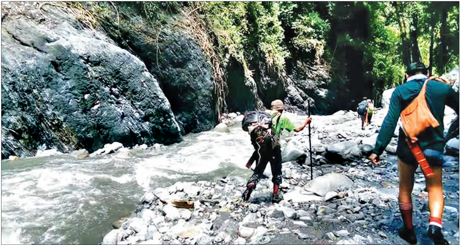
ချင်းတွင်းမြစ်ကြောင်းတစ်လျှောက် ရေမည်းလေ့လာစုံစမ်းရေးအဖွဲ့ ကွင်းဆင်းလေ့လာနေမှုကို တွေ့ရစဉ်

“စစ်ကိုင်းတိုင်းဒေသကြီး ဝန်ကြီးချုပ် ဒေါက်တာမြင့်နိုင်ရဲ့ တာဝန်ပေးချက်အရ ချင်းတွင်းမြစ်ရေမည်းတဲ့ ကိစ္စကို လေ့လာစုံစမ်းဖို့ အဖွဲ့ဝင်ရှစ်ဦးပါတဲ့ ရေမည်းလေ့လာစုံစမ်းရေးအဖွဲ့ဖွဲ့စည်းခဲ့ပါတယ်။ ရေမည်းလေ့လာစုံစမ်းရေးအဖွဲ့ စက်တင်ဘာ ၆ရက်မှာ ခန္တီးကိုရောက်ပြီး တာဝန်ရှိသူ ဒေသခံတွေနဲ့ ညှိနှိုင်းဆွေးနွေးချက်တွေအရ ရေမည်းတွေတာ စာမျက်နှာ ၃ ကော်လံ ၁ ○