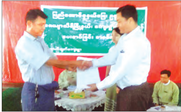
ပြုလုပ်ပေးခဲ့ပြီး စည်းကမ်းချက်ပါ အချက်အလက်များနှင့်တိုက်ဆိုင်စိစစ်၍ သတ်မှတ်စည်းကမ်းနှင့်ညီညွတ်သည့်ဒေသခံများအား မြေငှားဂရန်ရရှိရေး ဆောင်ရွက်ပေးခဲ့ကြောင်းနှင့် မြေငှားဂရန် ပေးအပ်ပွဲတွင် ဒေသခံ ၅၅ ဦးကို မြေငှားဂရန်များ လက်ဝယ်အရောက်ပေးအပ်ခဲ့ကြောင်း သိရသည်။