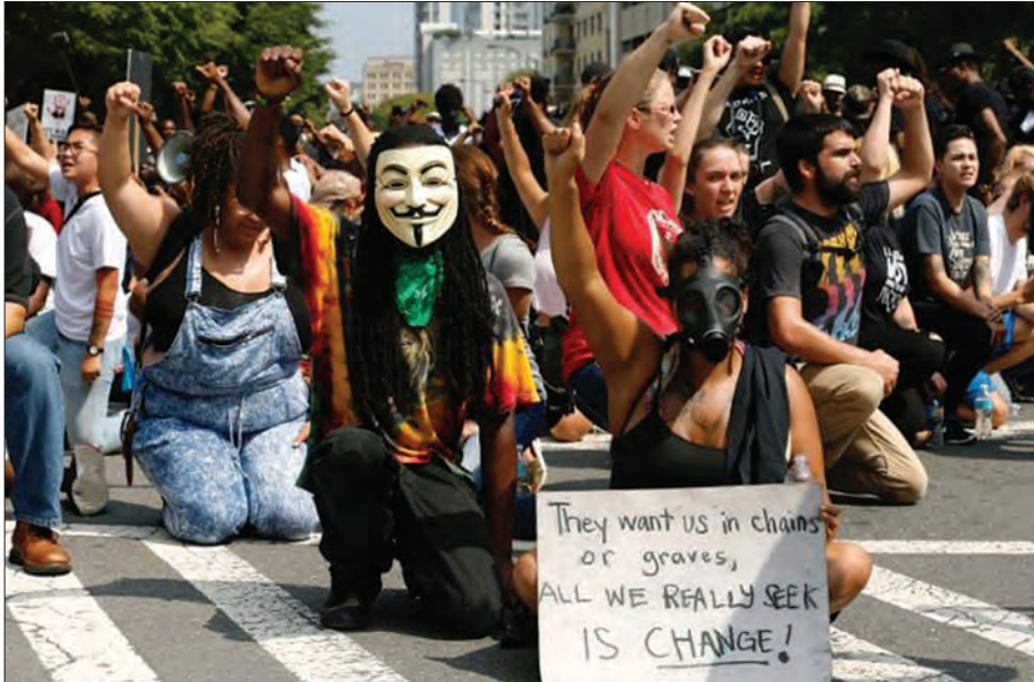
They want us in chains or graves, ALL WE REALLY SEEK IS CHANGE!