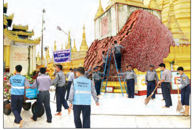
(၅၂)နှစ်မြောက် မြန်မာနိုင်ငံရဲတပ်ဖွဲ့နေ့ကို ကြိုဆိုဂုဏ်ပြုသောအားဖြင့် စက်တင်ဘာ ၂၅ ရက် နံနက် ၇ နာရီက ပဲခူးရွှေမော်ဓောဘုရားပေါ်တွင် ခရိုင်ရဲတပ်ဖွဲ့မှူး ဒုတိယရဲမှူးကြီးလှဦး ဦးဆောင်၍ ပဲခူးမြို့နယ်ရဲတပ်ဖွဲ့မှူး၊ ရဲမှူးတင်ထွေးနှင့် ရဲတပ်ဖွဲ့ဝင် ၂၀၀ က စုပေါင်းသန့်ရှင်းရေး ပြုလုပ်ဆောင်ရွက်စဉ် သန့်စင် (ပဲခူး)