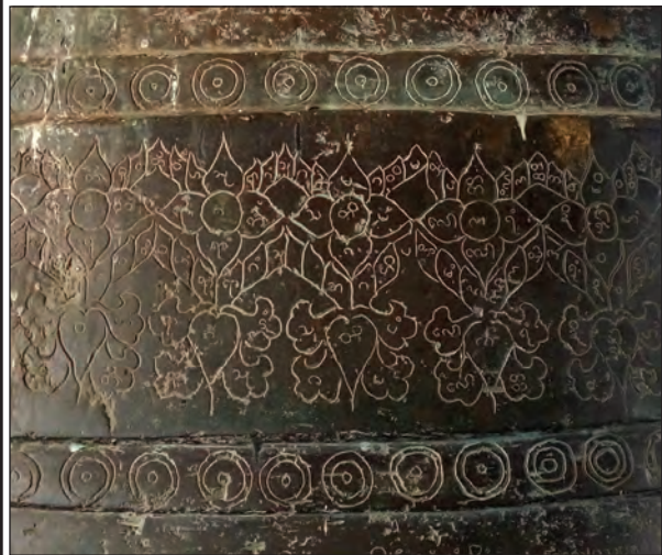
ခေါင်းလောင်းတစ်လုံးပေါ်တွင် ရေးထိုးထားသည့်ခေါင်းလောင်းစာများ

အလောင်းမင်းတရားဦးအောင်ဇေယျ(၁၇၅၃-၁၇၆၀)သည် မုဆိုးဖိုရွာကိုအခြေပြုလျက် အရှေ့ဘက်တွင် ရှမ်းပြည်နယ်၊ အနောက်ဘက်တွင် ရခိုင်ဒေသမပါ ချင်းပြည်နယ်၊ မြောက်ဘက်တွင် ကချင်ပြည်နယ်၊ တောင်ဘက်တွင် တနင်္သာရီကမ်းရိုးတန်းအဆုံးအထိ ကျယ်ပြန့်သောမြန်မာနိုင်ငံတော်ကို ထူထောင်ခဲ့သည်။ စစ်ကိုင်းတိုင်းဒေသကြီး၊ ရွှေဘိုမြို့၊ ရွှေချက်သိုစေတီတွင် ခေါင်းလောင်းနှစ်လုံးရှိရာ အလောင်း