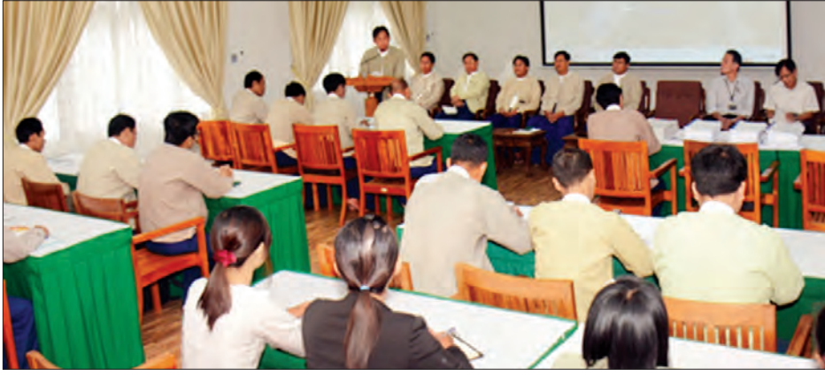
နေပြည်တော် စက်တင်ဘာ ၂၆

နိုင်ငံ့ဝန်ထမ်းများ၏ စီမံခန့်ခွဲမှုစွမ်းအား၊ သက်ဆိုင်ရာ ဘာသာရပ်များအလိုက် ကျွမ်းကျင်မှုစွမ်းအားနှင့် လုပ်ငန်းစွမ်းဆောင်မှု အရည်အသွေးများ ပိုမိုပြည့်ဝစေရေးတို့အတွက် စဉ်ဆက်မပြတ် လေ့လာသင်ယူမှုများ၊ နည်းပညာလက်ဆင့်ကမ်းမှုများကို စိုက်ပျိုးရေး၊ မွေးမြူရေးနှင့် ဆည်မြောင်းဝန်ကြီးဌာန အစည်းအဝေးခန်းမ၌ ကျင်းပသည့် “မြန်မာနိုင်ငံ၏ ရေရှည်တည်တံ့ခိုင်မြဲသော ရေအားလျှပ်စစ်ကဏ္ဍ ဖွံ့ဖြိုးတိုးတက်ရေး ဆွေးနွေးပွဲအခမ်းအနား” တွင် ဆည်မြောင်းနှင့် ရေအသုံးချမှု စီမံခန့်ခွဲရေးဦးစီးဌာန