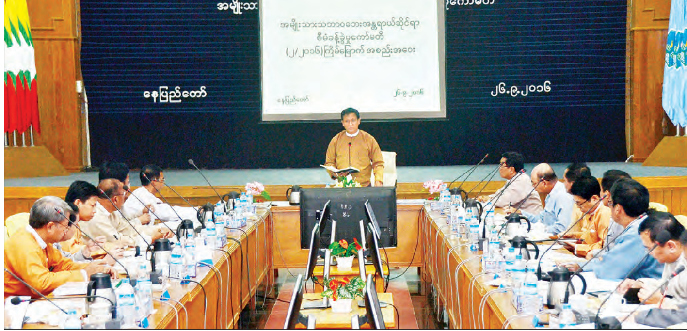
ဒုတိယသမ္မတ ဦးဟင်နရီပန်ထီးယူ အမျိုးသားသဘာဝဘေးအန္တရာယ်ဆိုင်ရာ စီမံခန့်ခွဲမှုကော်မတီလုပ်ငန်းညှိနှိုင်းအစည်းအဝေး၌ အမှာစကားပြောကြားစဉ် (သတင်းစဉ်)

နိုင်ငံတော်၏အတိုင်ပင်ခံပုဂ္ဂိုလ် ဒေါ်အောင်ဆန်းစုကြည် ကျန်းမာရေးစိုးရိမ်စရာမရှိကြောင်း နိုင်ငံတော်အတိုင်ပင်ခံရုံးမှ သတင်းထုတ်ပြန်ထား နေပြည်တော် စက်တင်ဘာ ၂၆ ပြတိုက်၊ အမေရိကန်ပြည်ထောင်စုခရီးစဉ်များမှ ယမန်နေ့ညက ပြန်လည်ရောက်ရှိလာသော နိုင်ငံတော်၏ အတိုင်ပင်ခံပုဂ္ဂိုလ် ဒေါ်အောင်ဆန်းစုကြည်၏ ကျန်းမာရေးအခြေအနေ စိုးရိမ်စရာ မရှိပါကြောင်း။ ကျွမ်းကျင်သူ ဆရာဝန်ကြီးများဖြင့် ကျန်းမာရေးစစ်ဆေးခဲ့ရာ အမေရိကန်ပြည်ထောင်စုခရီးစဉ်အတွင်း အစီအစဉ်များ များပြားလွန်းနေပြီး နားချိန်နည်းပါးသဖြင့် ပင်ပန်းနွမ်းနယ်ခြင်း၊ ခရီးစဉ်အတွင်း စားချိန်၊ သောက်ချိန် မမှန်သဖြင့် အစာအိမ်ရောင်ရမ်းခြင်းနှင့် ကွန်ပျူတာအကြည့်များသဖြင့် အရိုးကျိုးပေါင်းတက်ခြင်း စသည်တို့ တွေ့ရှိရကြောင်း။ ကျန်းမာရေးအခြေအနေမှာ အထူးစိုးရိမ်ဖွယ်ရာမရှိဘဲ ကောင်းမွန်လျက်ရှိပြီး အချိန်အနည်းငယ် အနားယူရန် လိုအပ်ကြောင်း သိရှိရသည်ဟု နိုင်ငံတော်အတိုင်ပင်ခံရုံးမှ သတင်းထုတ်ပြန်ထားသည်။ (သတင်းစဉ်)