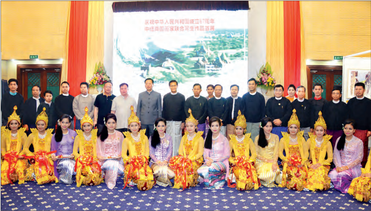
ဒုတိယသမ္မတ ဦးဟင်နရီဗန်ထီးယူ၊ တရုတ်သံအမတ်ကြီး မစ္စတာ ဟန်လျန်နှင့် တာဝန်ရှိသူများ (၆၇)နှစ်မြောက် တရုတ်ပြည်သူ့သမ္မတနိုင်ငံ တည်ထောင်သည့်နေ့ အထိမ်းအမှတ် ဧည့်ခံပွဲအခမ်းအနားတွင် စုပေါင်းမှတ်တမ်းတင်ဓာတ်ပုံရိုက်စဉ် (သတင်းစဉ်)

မြန်မာနိုင်ငံအနေဖြင့် ဒေသတွင်းနှင့် နိုင်ငံတကာမျက်နှာစာတွင် တရုတ်နိုင်ငံနှင့် အတူ ဒေသတွင်း တည်ငြိမ်အေးချမ်းရေးနှင့် လုံခြုံရေး ပိုမိုရရှိရန်အတွက် ပိုမိုနီးကပ်စွာ