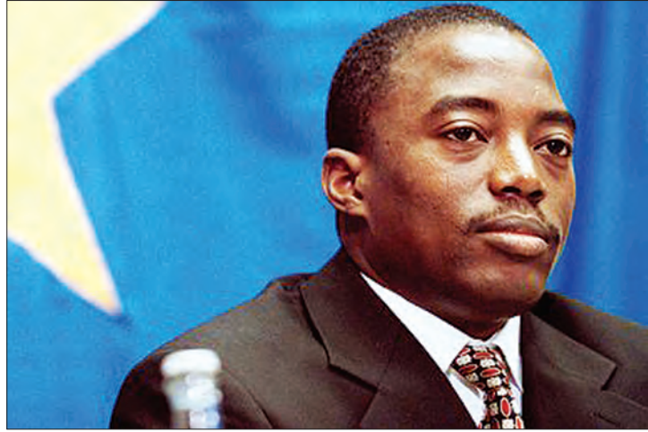
ကွန်ဂိုနိုင်ငံ၏ လက်ရှိသမ္မတ ဂျိုးဆက်ပ်ကဘီလာ

အာဏာလွှဲပြောင်းမှုတွင် ခိုင်ခိုင်မာမာနှင့် ဆက် လက်ရပ်တည်နေနိုင်ခဲ့သည်။ သို့သော် လတ်တလောတွင် ကွန်ဂိုနိုင်ငံ၏ အခြေအနေမှာ ငြိမ်သက်သော အခြေအနေ မဟုတ်သေးပေ။ တနင်္လာနေ့တွင် ဒီမိုကရေစီ ထောက်ခံသူ ၄၄ ဦးထက် မနည်းအသတ်ခံ ရခြင်းကို ကြည့်ခြင်းအားဖြင့် ကွန်ဂိုနိုင်ငံတွင် စစ်ပွဲများနှင့် ရက်စက်မှုများ ပိုမိုဖန်တီးနေလေ သလားဟု စဉ်းစားမိရင်းမည်သည့် သမ္မတမဆို ကောင်းမွန်သော နိုင်ငံရေးအဆုံးသတ်မှုမရှိ သည့် ကွန်ဂိုနိုင်ငံတွင် နောက်ထပ်ဘာတွေ ဆက်ဖြစ်လာဦးမလဲဆို သည်မှာ...။