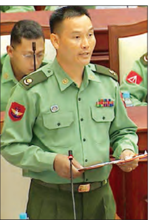
ပိုင်မျိုးအောင်ဇင်မင်း တပ်မတော်သားလွှတ်တော်ကိုယ်စားလှယ်

ကျေးကျွန်ခေတ်မှ ကျွန်ရှင်များက နှိပ်စက်မှု ပြုလုပ်သကဲ့သို့ လူ့အခွင့်အရေး ချိုးဖောက်မှုရှိကြောင်း အထင်အရှားတွေ့ရှိချက်အပေါ် လျစ်လျူရှု မျက်ကွယ်ပြုပြီး ကျေးရွာ၊ ရပ်ကွက်တစ်ခုအတွင်းဖြစ်ပွားသည့် သာမန်လူမှုရေးပြဿနာတစ်ခုကို ငွေကြေးဖြင့် ညှိနှိုင်းကျေအေးခြင်းမျိုး အသုံးပြု အဆုံးသတ်စေခြင်းသည် လူ့အခွင့်အရေးကော်မရှင်ဟူသည့် အခန်းကဏ္ဍကို မှေးမှိန်သေးသိမ်အောင် ဆောင်ရွက်သည်ဟု မြင်ပါကြောင်း။ ကော်မရှင်အနေဖြင့် ထိုသို့ဖြေရှင်းဆောင်ရွက်ခြင်းသည် နိုင်ငံအတွင်း လူ့အခွင့်အရေး ချိုးဖောက်မှုများကို ရှာဖွေဖော်ထုတ်တင်ပြရမည့်အစား ချိုးဖောက်မှုများကို အကာအကွယ်ပေးသည့် ခံကတုတ်အဖြစ် ဖွဲ့စည်းထားသည့် ကော်မရှင်မဟုတ်ဘဲ နေထိုင်ရာ တွေ့ရှိပါကြောင်း။ လူ့အခွင့်အရေးကော်မရှင်အနေဖြင့် လူ့အခွင့်အရေး ချိုးဖောက်မှုများကို ပေါ့ပေါ့တန်တန် သဘောထားလုပ်ဆောင်ခြင်းဖြစ်နေပါသဖြင့် ကမ္ဘာ့အလယ်တွင် ရက်ဖွယ်ရာပင်ဖြစ်ပါကြောင်း။ လူ့အခွင့်အရေးချိုးဖောက်မှု ကျူးလွန်သူများကို ဖော်ထုတ်ရမည့် အဖွဲ့အစည်းသည် ဖြစ်ပွားသည့်အမှု အတိမ်အနက်ကိုမကြည့်ဘဲ အမှုပိတ်သိမ်းနိုင်ရန်၊