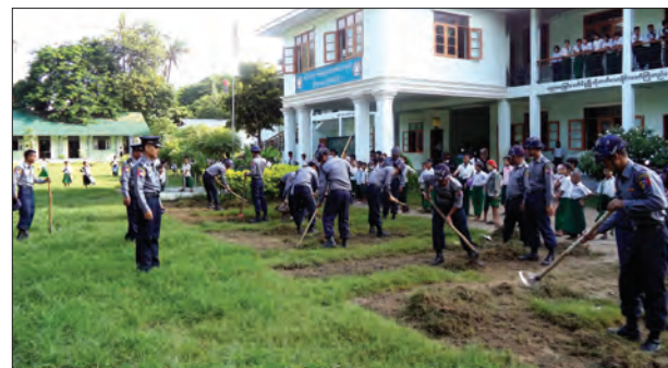
အမှတ်(၁၈)လုံခြုံရေးရဲတပ်ဖွဲ့ခွဲမှ (၅၂)နှစ်မြောက်မြန်မာနိုင်ငံရဲတပ်ဖွဲ့နေအားကြိုဆိုဂုဏ်ပြုသောအားဖြင့် စက်တင်ဘာလတတိယပတ်က တပ်ဖွဲ့ခွဲမှူး ယာယီဒုတိယရဲမှူးကြီးပေါ်ထွန်း ဦးစီး၍ တပ်ဖွဲ့ဝင် ၆၀ ဖြင့် နေပြည်တော်ကောင်စီနယ်မြေ ပုဗ္ဗသီရိမြို့နယ်ဖြတ်ခွဲကျေးရွာအမှတ် (၁၅)အခြေခံပညာအထက်တန်းကျောင်းသို့ သွားရောက်၍ ကျောင်းဝင်းအတွင်း သန့်ရှင်းသာယာလှပရေးအတွက် စုပေါင်းသန့်ရှင်းရေးပြုလုပ်ဆောင်ရွက်ခဲ့စဉ် (မြန်မာ့အလင်း)

ရန်ကုန် စက်တင်ဘာ ၂၆ ရန်ကုန်တိုင်းဒေသကြီးတွင် ယာဉ်တိုက်မှုနှင့် ယာဉ်မတော်တဆဖြစ်ပွားမှုအများဆုံးဖြစ်ပွားလျက်ရှိသော လိုင်သာယာမြို့နယ်တွင် စက်တင်ဘာ ၂၃ ရက်က စက်မှုဇုန်(၃) ယောမင်းကြီးလမ်းမပေါ်ရှိ ကိုကာကိုလာအချိုရည်စက်ရုံ၌ စက်ရုံယာဉ်မောင်းများနှင့် အလုပ်သမား ၁၀၆ ဦးအား အမှတ်(၆၈)ယာဉ်ထိန်းတပ်ဖွဲ့ စုမှူး ဒုတိယရဲမှူးငွေတင်နှင့် တပ်ဖွဲ့ဝင်တို့က ယာဉ်စည်းကမ်း၊ လမ်းစည်းကမ်းဆိုင်ရာများ၊ ဥပဒေသစိစစ်တားမြစ်ချက်နှင့် ပြစ်ဒဏ်များ၊ Alcohol Tester တိုင်းတာရေးယူမှုများနှင့်အတူ လက်ရှိဖြစ်ပွားနေသော ယာဉ်မတော်တဆမှုတို့ကို ပါဝါပိုင်ဖြင့် အသိပညာပေးဟောပြောခဲ့ပြီး လက်ကမ်းစာစောင်များ ဖြန့်ဝေပေးခဲ့ကြောင်း သိရသည်။ (၁၆၄)