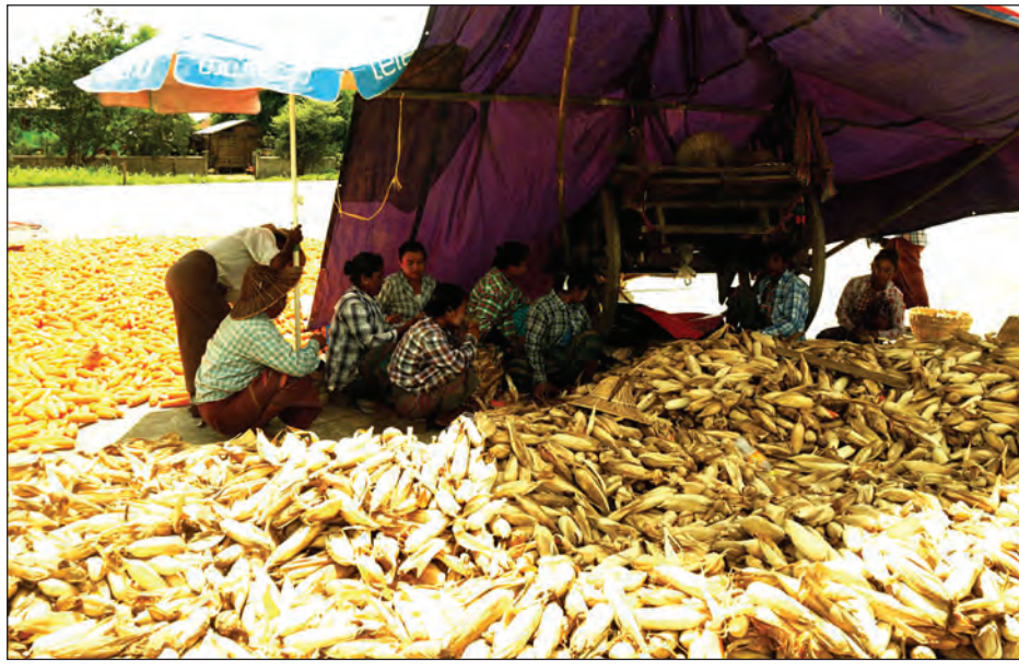
ပြောင်းစိုက်ခင်းတစ်ခုအတွင်း ရိတ်သိမ်းထားသောပြောင်းဖူးများ

နေပြည်တော် စက်တင်ဘာ ၂၆ နေပြည်တော်အတွင်းရှိ မြို့နယ်များတွင် ယခုနှစ် စိုက်ပျိုးခဲ့သော အစေ့ထုတ်ပြောင်းများ အထွက်နှုန်းကောင်းသော်လည်း ဝယ်ယူသူများအရှုံးပေါ်ကြောင်း စိုက်ပျိုးခဲ့သော တောင်သူများအနေဖြင့် စိုက်ပျိုးစရိတ်ပင်မရရှိဘဲ အရှုံးနှင့်ရင်ဆိုင်နေရကြောင်း ပုဗ္ဗသီရိမြို့နယ်အတွင်းမှ အစေ့ထုတ်ပြောင်းစိုက်ပျိုးသည့် တောင်သူများထံမှ သိရသည်။ “ကျွန်တော်တို့ရွာနဲ့အနီးပတ်ဝန်းကျင်ရွာတွေက အစေ့ထုတ်ပြောင်းကို အဓိကစိုက်ပျိုးကြတာပါ။ မနှစ်ကဆို ပြောင်းတစ်တင်းကို တစ်သောင်းကျပ်ဝန်းကျင်ရောင်းရတယ်။ ဒီနှစ်က ပြောင်းအထွက်နှုန်းကောင်းပေမယ့် တစ်တင်းကို ငါးထောင်ကျပ်၊ ခြောက်ထောင်ကျပ် ဝန်းကျင်လောက်ပဲ ဈေးရိတော့ စိုက်ပျိုးစရိတ် အရင်းတောင် ပြန်မရဘူး။ တစ်တင်းကို ခုနှစ်ထောင်ကျပ်လောက်ရမှ ကျွန်တော်တို့ရဲ့ ထွက်ရှိရဦးမယ်။ မြေဩဇာမျိုး၊ အလုပ်သမားခ အားလုံးကျော့ရလောက်ပဲရှိတယ်။ အစေ့ထုတ်ပြောင်းက မနှစ်ကထက် ထက်ဝက်နီးပါး ဝယ်ယူသူများ