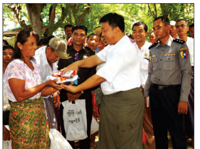
ပြောင်းရွှေ့အိမ်ထောင်စုတစ်စုအား ထောက်ပံ့ပစ္စည်းများ ပေးအပ်