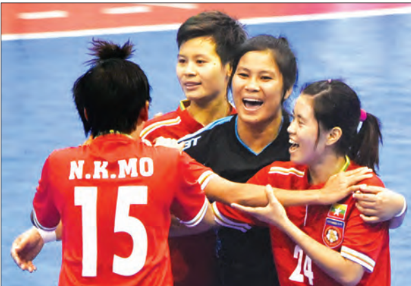
၂၀၁၆ အာဆီယံ ဖူဆယ်ကလပ်ပြိုင်ပွဲတွင် ဝင်ရောက်ယှဉ်ပြိုင်ခဲ့သော မြန်မာအမျိုးသမီး ဖူဆယ်အသင်း

သတင်း - ညီမြတ်သော်တာ ရန်ကုန် စက်တင်ဘာ ၂၆ မလေးရှားနိုင်ငံက အိမ်ရှင်အဖြစ် လက်ခံကျင်းပမည့် (၂၉)ကြိမ်မြောက်ဆီးဂိမ်းပြိုင်ပွဲတွင် ထည့်သွင်းကျင်းပမည့် ဖူဆယ်အားကစားနည်းတွင် မြန်မာအမျိုးသားအသင်းနှင့် အမျိုးသမီးအသင်း နှစ်သင်းစလုံးဖြင့် ဝင်ရောက်ယှဉ်ပြိုင်မည်ဖြစ်သည်။ မလေးရှားအိုလံပစ်ကော်မတီသည် ဆီးဂိမ်းပြိုင်ပွဲတွင် ဖူဆယ်အားကစားနည်းကို တောလုံးနှင့်အတူ ကျင်းပမည်ဖြစ်ပြီး အမျိုးသား၊ အမျိုးသမီးပြိုင်ပွဲ နှစ်ခုစလုံး ထည့်သွင်းကျင်းပမည်ဖြစ်သည်။ မြန်မာနိုင်ငံတော်လုံးအဖွဲ့ချုပ်သည် ဆီးဂိမ်းပြိုင်ပွဲ ယှဉ်ပြိုင်မည့် စာမျက်နှာ ၆ ကော်လံ ၁ *