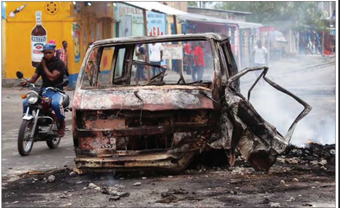
မငြိမ်သက်မှုများဖြစ်ပွားနေသည့် ကွန်ဂိုနိုင်ငံတစ်စိတ်တစ်ပိုင်းကို တွေ့ရစဉ်

ကောက်ပွဲဖြစ်ပေါ်ရေးနှင့် အတော်လေးအလှမ်းကွာ နေဆဲဖြစ်သော်လည်း ကဘီလာသည် ပထမ ရွေးကောက်ပွဲတွင် ထောက်ခံမဲ ၅၈ ဒသမ ၀၅ ရာခိုင်နှုန်းဖြင့် အနိုင်ရရှိခဲ့ပြီး အသွင်ကူးပြောင်း နိုင်ခဲ့သည်။ ထို့နောက် ငါးနှစ်အကြာ ၂၀၁၁ ခုနှစ် အရောက်တွင် ကဘီလာသည် နောက်ထပ် ရွေးကောက်ပွဲတစ်ခုကို ထပ်မံပြုလုပ်ခဲ့သည်။ ထို ရွေးကောက်ပွဲတွင်လည်း ၎င်းကပင် ထပ်မံအနိုင် ရရှိခဲ့ပြန်သည်။ သို့သော် ဒီတစ်ကြိမ်တွင် လိမ် လည်မှုပြုလုပ်သည် ဆိုကာ စွပ်စွဲခဲ့သည်။ ဖွဲ့စည်းပုံ အခြေခံဥပဒေအရ နောက်တစ်ကြိမ်ယှဉ်ပြိုင်ရန် တားမြစ်ခြင်းခံရသော ကဘီလာသည် ဒီမိုကရေစီ