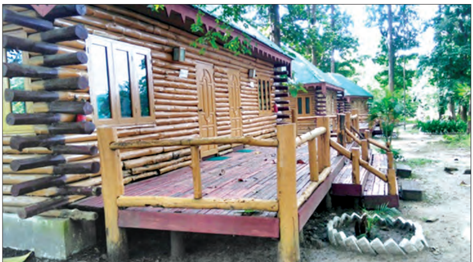
ဖိုးကျားဆင်စခန်းရှိ ခရီးသွားများ အပန်းဖြေအနားယူသည့် အဆောက်အအုံများကို တွေ့ရစဉ်

အနားယူရန် အဆောက်အအုံများကို လည်း တည်ဆောက်လျက်ရှိကြောင်း ၎င်းကပင် ဆက်၍ပြောသည်။ ယခင်က ဖိုးကျား ဆင်စခန်းမှာ ဆင်များအား ဆင်စားကျက်နှင့် ရေအခက်အခဲကြောင့် အိုင်ဝိုင်းကြီးသို့ ပြောင်းရွှေ့ခဲ့ပြီး လာရောက် လည်ပတ်သည့် ခရီးသည် များမှ ဆင်များနှင့် တွေ့မြင်ခွင့်မရခဲ့ ခြင်းများကြောင့် ဝေဖန်မှုများရှိခဲ့ပြီး နောင်ပိုင်းတွင် ဆင်များအား ဖိုးကျား ဆင်စခန်းသို့ ပြန်လည်ပြောင်းရွှေ့ထားခဲ့ ခြင်းဖြစ်ကြောင်း သိရသည်။ဆောင်းရာသီ နှင့် နွေရာသီ အပန်းဖြေကာလများတွင် ဧည့်သည်ဝင်ရောက်မှု ပိုမိုများပြားနိုင် မည်ဟု ခန့်မှန်းတွက်ချက်မှုများရှိပြီး ဆင်စခန်းဝန်းကျင်ရှိ စားသောက်ဆိုင် များကိုလည်း ဧည့်သည်များ စားသောက် နိုင်ရန် ပူးပေါင်း ဆောင်ရွက်မှုများရှိ နေသည်ကို မြင်တွေ့ခဲ့ရသည်။ ဖိုးကျား ဆင်စခန်းမှာ ရိုးမဖြတ်ကျော်ကားလမ်း နံဘေးတွင်ရှိသော်လည်း အိုင်ဝိုင်းကြီး ဆင်စခန်းမှာအတွင်းသို့ နှစ်မိုင်ခန့် တောင်ပေါ်လမ်းအတိုင်း ဆက်သွား ကြရပြီး အတက်အဆင်း မတ်စောက် သည့်အတွက် ဆောင်းနှင့် နွေရာသီ ကာလများ၌သာ သွားရောက်လည်ပတ် နိုင်မည်ဖြစ်ကြောင်း သိရသည်။ ကိုလွင် (ဆွာ)