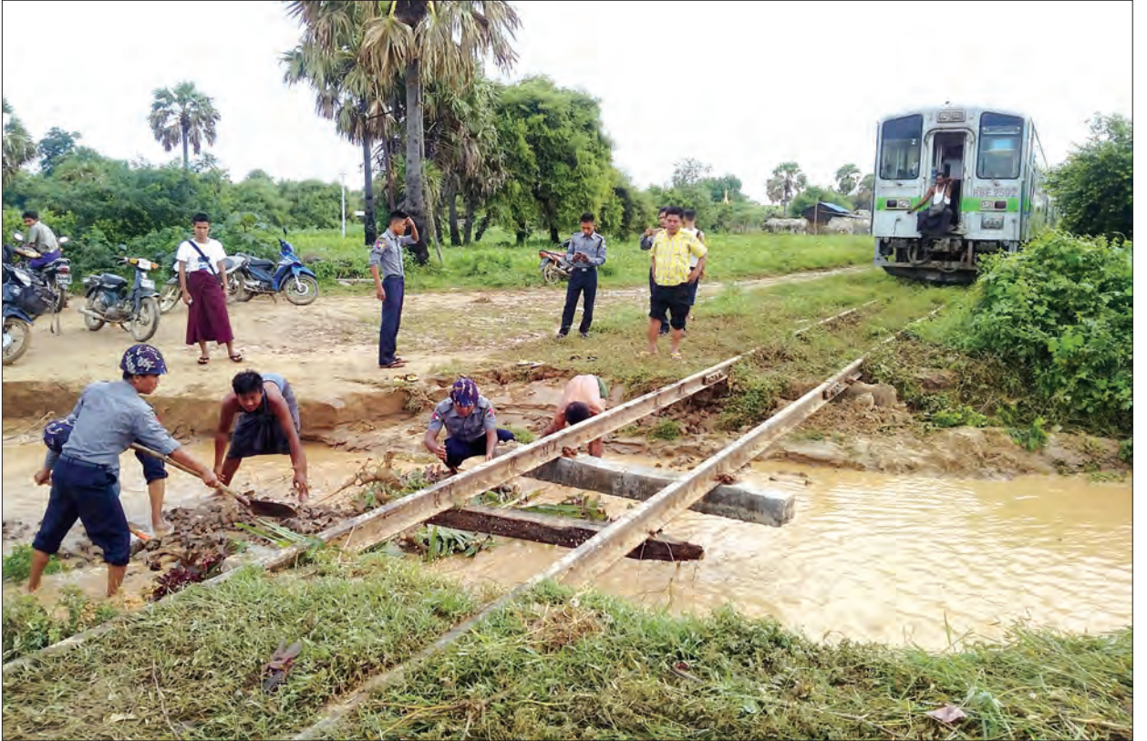
ညောင်ဦးမြို့နယ် ဇကုတန်းကျေးရွာဘူတာအဝင် မိုင်တိုင်အမှတ် ၄၀၆-၆ / ၇ ကြားရှိ ရထားသံလမ်းအောက်ခံမြေသား ချောင်းရေတိုက်စားမှုကို တွေ့ရစဉ်

နေပြည်တော် စက်တင်ဘာ ၂၆ မိုးလေဝသနှင့်လေပေဒဏ်ကြားမှူးဦးစီးဌာန ထုတ်ပြန်ချက်အရ ချင်းပြည်နယ်၌ နေရာစိပ်စိပ်၊ မန္တလေးတိုင်းဒေသကြီး၌ နေရာကျကျ၊ စစ်ကိုင်းတိုင်းဒေသကြီး၊ မကွေးတိုင်းဒေသကြီး၊ ကချင်ပြည်နယ်၊ ကယားပြည်နယ်နှင့် ရှမ်းပြည်နယ်တို့၌ နေရာကွက်ကွား၊ တနင်္သာရီတိုင်းဒေသကြီး၊ ပဲခူးတိုင်းဒေသကြီး၊ ဧရာဝတီတိုင်းဒေသကြီး၊ ရန်ကင်းတိုင်းဒေသကြီး၊ ကရင်ပြည်နယ်၊ မွန်ပြည်နယ်နှင့် ရခိုင်ပြည်နယ်တို့၌ နေရာအနှံ့အပြား မိုးထစ်ချွန်းရွာမည်ဖြစ်သည်။ (မြန်မာ့အလင်း)