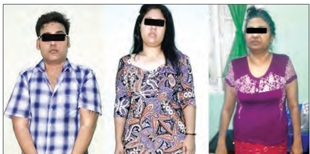
မြန်မာ့ကျေးလက်သမားတစ်ဦးနှင့် မိန်းကလေး (ခ) ဝိုက်ဇယ်၊ စုမန်လတ်၊ ဒေါ်တင်သူဇာ

မြန်မာနိုင်ငံ အမျိုးသားလူ့အခွင့် အရေးကော်မရှင်၏ ညှဉ်းပန်းနှိပ်စက်မှု နှင့် ပတ်သက်၍ လူမှုကွန်ရက်စာမျက်နှာ များတွင် မကျေနပ်မှုများ၊ ဝေဖန်သုံးမှား ပျံ့နှံ့လျက်ရှိသည့်အပြင် စက်တင်ဘာ ၂၁ ရက် မွန်းလွဲ ၁ နာရီက မြန်မာနိုင်ငံ အမျိုးသားလူ့အခွင့်အရေး ကော်မရှင်ရုံး ရှေ့တွင် စာတန်းများကပ်ခြင်းဖြင့် လူ့ အခွင့်အရေးကော်မရှင်၏ ညှဉ်းပန်းနှိပ်စက် မှုကို ကန့်ကွက်သည့် ကမ်ပိန်းတစ်ခုပြုလုပ် ခဲ့သည်။ ထို့ပြင် အမျိုးသမီးအဖွဲ့များ ကွန်