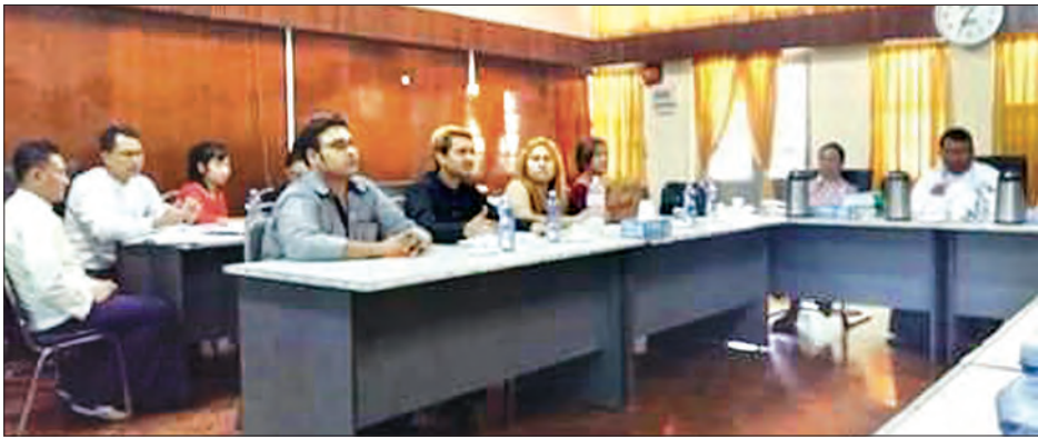
မြန်မာနိုင်ငံအမျိုးသားလူ့အခွင့်အရေးကော်မရှင်ရုံး၌ နှစ်ဦးနှစ်ဖက်မှ သက်ဆိုင်သူများအား ညှဉ်းပန်းနှိပ်စက်မှု

ရန်ကုန် စက်တင်ဘာ ၂၁ ရန်ကုန်တိုင်းဒေသကြီး ကျောက်တံတား မြို့နယ် အမှတ်(၉)ရပ်ကွက် လမ်း(၄၀) အထက်ရှိအင်းဝအုပ်ချုပ်ဆိုင်ပိုင်ရှင်နှင့် မိသားစုက အိမ်အကူမိန်းကလေးများကို ညှဉ်းပန်းနှိပ်စက်မှုဖြင့် ရန်ကုန်တိုင်း ဒေသကြီး လူမှုဝန်ထမ်းဦးစီးဌာနမှ ၁၉၉၃ ခုနှစ် ကလေးသူငယ်ကာကွယ် စောင့်ရှောက်ရေး ဥပဒေပုဒ်မ ၆၆ (ဃ) ဖြင့် တရားစွဲဆိုနိုင်ရန် ယနေ့ ညနေ ၃ နာရီတွင် ကျောက်တံတား မြို့မရဲစခန်း ၌ ထပ်မံတရားလို ပြုလုပ်အမှုဖွင့်လှစ် ခဲ့ကြောင်း သိရသည်။