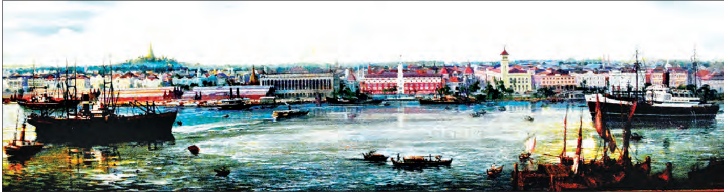
၁၉၁၅ ခုနှစ်ဝန်းကျင် အကောက်ခွန်ဦးစီးဌာနရုံးနှင့် ရန်ကုန်မြို့ရှုခင်း

ခေတ်စနစ်အပြိုင် ပေါ်ထွက် မြန်မာ့အကောက်ခွန်အနေဖြင့် ပြီးခဲ့သည့် ဘဏ္ဍာနှစ် များအတွင်း ကုန်သွယ်မှုခွန်များအဖြစ်ရရှိမှုမှာ ၂၀၁၀-၂၀၁၁ ခုနှစ်တွင် မြန်မာ့ငွေကျပ် ၂၉၃ ဘီလီယံ၊ ၂၀၁၁-၂၀၁၂ ဘဏ္ဍာ နှစ်တွင် ၁၅၈ ဘီလီယံ၊ ၂၀၁၂-၂၀၁၃ ဘဏ္ဍာနှစ်တွင် ၄၀၂ ဘီလီ ယံ၊ ၂၀၁၃-၂၀၁၄ ဘဏ္ဍာနှစ်တွင် ၄၁၂ ဘီလီယံ၊ ၂၀၁၄-၂၀၁၅ ဘဏ္ဍာနှစ်တွင် ၅၄၉ ဘီလီယံ၊ ၂၀၁၅-၂၀၁၆ ဘဏ္ဍာနှစ်တွင် ၅၁၄ ဘီလီယံနှင့် ယခုဘဏ္ဍာနှစ်တွင်လည်း ယခင်နှစ်နည်းတူ မျှော်မှန်းထားသော်လည်း ကုန်သွယ်စီးဆင်းမှုကို အထောက် အကူ ပြုမည့် ခေတ်စနစ်အပြိုင် ပေါ်ထွက်လာတော့မည့် မြန်မာ့ အကောက်ခွန်အွန်လိုင်းစနစ် (MACCS) လားရာကို စောင့် ကြည့်ရတော့မည်ဖြစ်ပါကြောင်း။