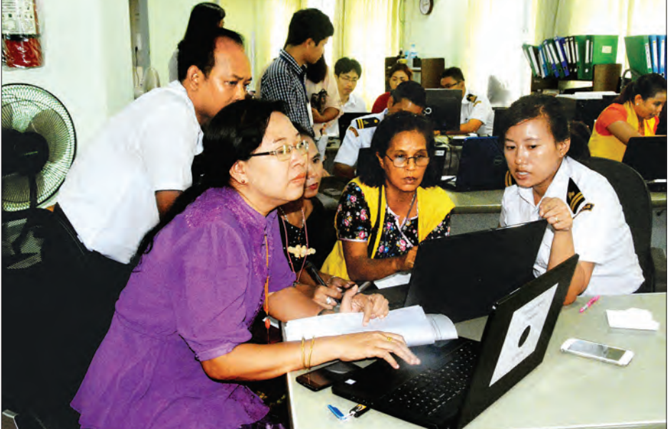
မြန်မာ့အကောက်ခွန်အွန်လိုင်းစနစ် User Registration Section ကိုတွေ့ရစဉ်