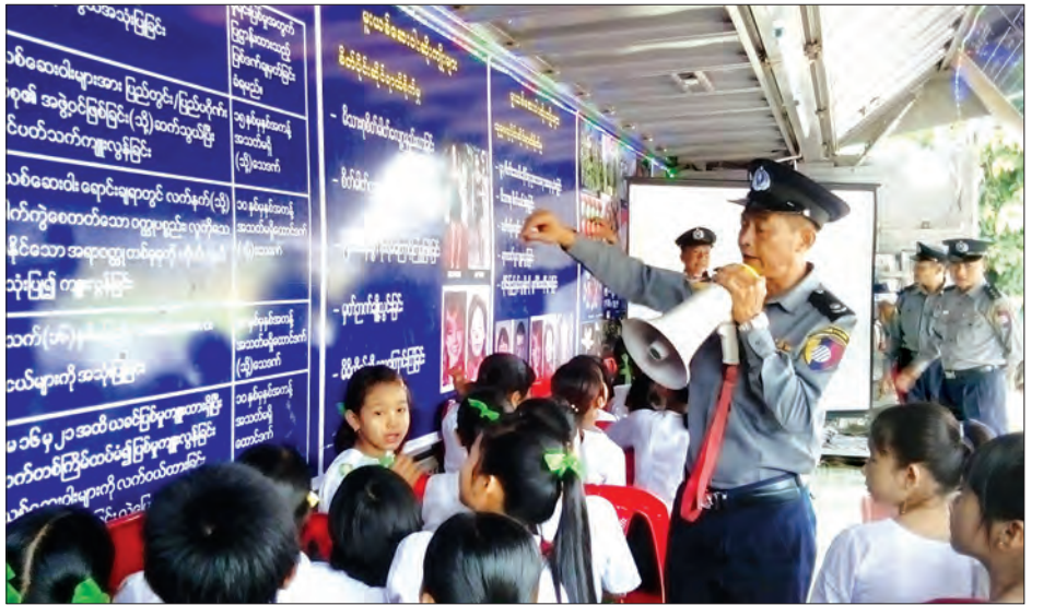
မှုခင်းပညာပေးပြခန်းယာဉ်သို့ လာရောက်လေ့လာကြသော ကျောင်းသား ကျောင်းသူများအား မြန်မာနိုင်ငံရဲတပ်ဖွဲ့ တာဝန်ရှိသူ တစ်ဦးက ရှင်းလင်းပြောပြစဉ်

ထိုကဲ့သို့ လုပ်ငန်းဆောင်ရွက်ရာတွင် ပြည်သူများ ပူးပေါင်း ဆောင်ရွက်မှ အောင်မြင်မည်ဖြစ်သဖြင့် ရဲတပ်ဖွဲ့ဝင်များအနေဖြင့်