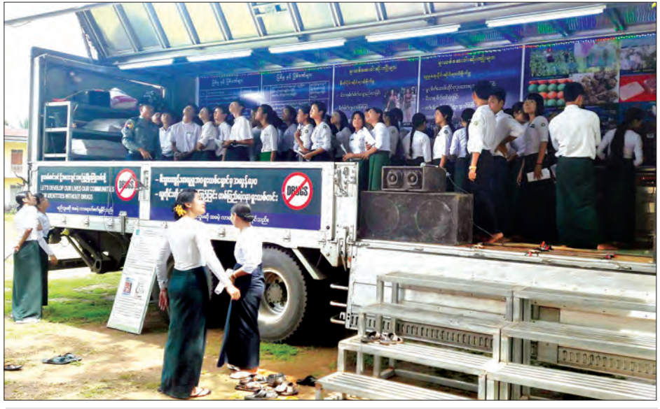
မှုခင်းပညာပေးပြခန်းယာဉ်သို့ လာရောက်လေ့လာကြသော ကျောင်းသား ကျောင်းသူများအား တွေ့ရစဉ်

ပြည်သူများကလည်း အသိပညာပေးလုပ်ငန်းများမှ ရရှိ သော အသိတရားဖြင့် ဥပဒေတောင်အတွင်း ကျင့်ကြံနေထိုင် ကြပြီး ဒေသအတွင်း တရားဥပဒေစိုးမိုးရေးနှင့် မှုခင်းလျော့နည်း ကျဆင်းရေးကို ရဲတပ်ဖွဲ့နှင့် ပြည်သူ ပူးပေါင်းဆောင်ရွက်ပါက အောင်မြင်မှုရရှိမှာ စကန်မလွဲတော့ပေ။