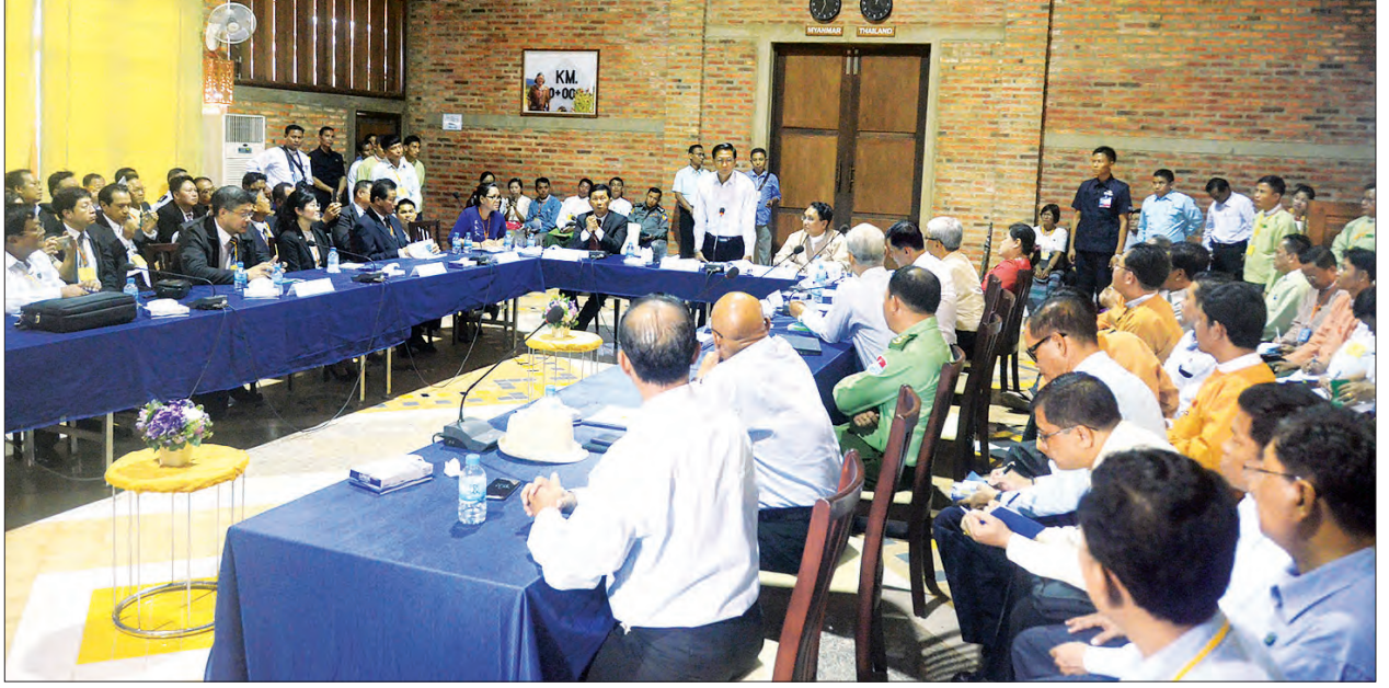
မြန်မာအထူးစီးပွားရေးဇုန် ပတ်ဝန်းကျင် ဥက္ကဋ္ဌ ဒုတိယသမ္မတ ဦးဟိန်နှင့် ထိုင်းအထူးစီးပွားရေးဇုန်စီမံခန့်ခွဲမှုကော်မတီဝင်များအား ဆွေးနွေးပြောကြားစဉ် (သတင်းစဉ်)

ထားဝယ် အထူးစီးပွားရေးဇုန် စီမံကိန်းအကောင်အထည်ဖော်နိုင်ရေးအတွက် မြန်မာနှင့် ထိုင်းနိုင်ငံတို့သည် ၂၀၀၈ ခုနှစ်တွင် နှစ်နိုင်ငံသဘောတူလက်မှတ်ရေးထိုးခဲ့ကြပြီး ၂၀၁၀ ပြည့်နှစ် နိုဝင်ဘာတွင် လုပ်ငန်းစတင်ရန် လက်မှတ်ရေးထိုးခဲ့ကာ