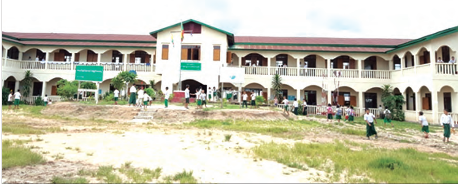
ကော့ကရိတ်မြို့နယ် ဝေါလေမြို့အခြေခံပညာအထက်တန်းကျောင်း

များ ရှိနေကြောင်း တွေ့ရသည်။ မြဝတီမှ ဝေါလေသို့ အသွား၊ လမ်းခရီး တစ်လျှောက် တွေ့မြင်ခဲ့ရသော ဖလူးကြီး၊ ဖလူး ကလေး၊ သေဘောဘိုး၊ ဆုံဆည်းမြိုင်၊ ဝေါလေ အစရှိသည့် မြို့ရွာကလေးများသည် တစ်ချိန်က သမိုင်းစာမျက်နှာများတွင် အလွန်ထင်ရှားကျော် ကြားခဲ့ကြဖူးသည်။ ထိုကျေးရွာများ၏ ပတ်ဝန်း ကျင်တွင် ဝိညာဉ်ပေါင်းများစွာ ရောယှက်၍ ပျံ့လွင့်ကောင်း ပျံ့လွင့်နေပါလိမ့်မည်။ တစ်နည်း ပြောရလျှင် မငြိမ်းချမ်းသော အတိတ်ကာလ၌ နှစ်ဦးနှစ်ဖက် အသက်ပေါင်းများစွာ စွန့်လွှတ် ပေးဆပ်ခဲ့ရသော နေရာဒေသများဖြစ်ခဲ့ကြသည်။ ယနေ့ကျွန်တော်တို့ကားကလေးစီး၍ သက်သောင့် သက်သာ သာသာယာယာ သွားနိုင်ဖို့အတွက်