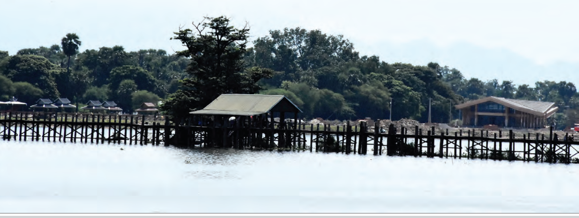
စီမံကိန်းနေရာမှ ဦးပိန်တံတားအား တွေ့ရစဉ်