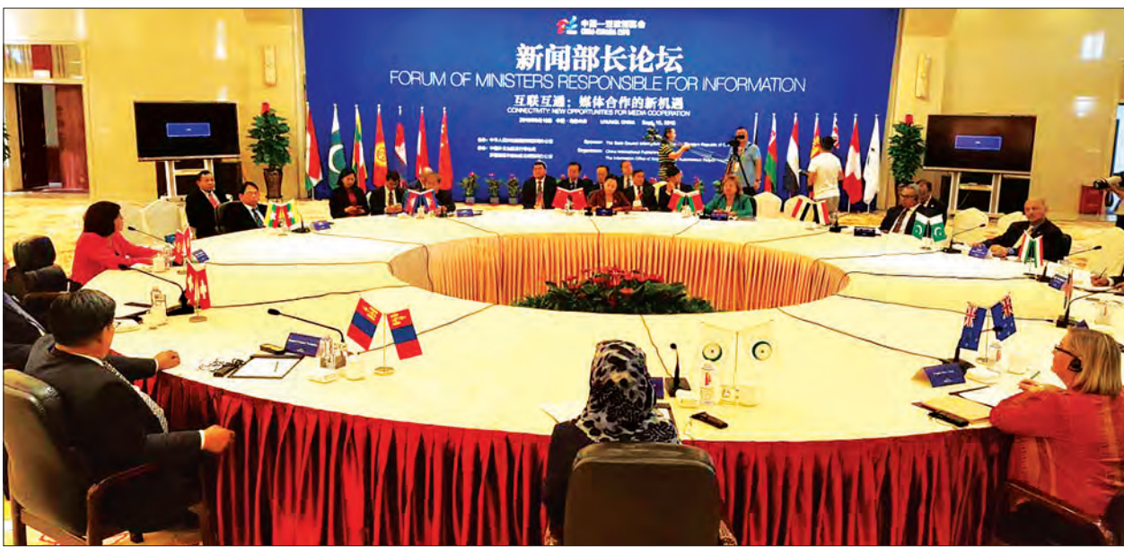
တတိယအကြိမ်မြောက် ပြန်ကြားရေးဝန်ကြီးများဆိုင်ရာဖိုရမ် ကျင်းပစဉ်

အဆိုပါဖိုရမ်၌ ရပ်ဝန်းတစ်ခုလမ်းကြောင်းတစ်ခုစီစီစဉ် (One Belt, One Road Initiative) ကို မီဒီယာနည်းလမ်းဖြင့် ပံ့ပိုးပေးနိုင်ရေး ဆောင်ရွက်ရာတွင် ဒေသတွင်းရှိ ပြည်သူ့အချင်းချင်း အပြန်အလှန် ဆက်သွယ်မှုနှင့် ယဉ်ကျေးမှုဖလှယ်ရေးဆိုင်ရာ မြှင့်တင်ရေးဆိုင်ရာ