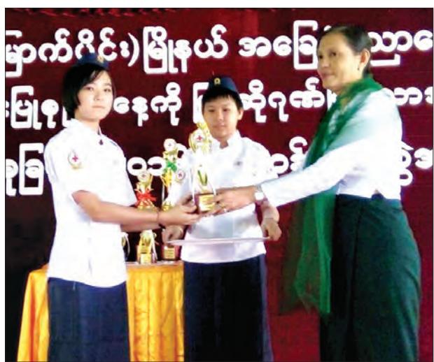
ကြက်ခြေနီရှေးဦးပြုစုခြင်းအတတ်ပညာသင်ကြားမှုတွင် ဆုရရှိခဲ့သည့် ကျောင်းသူတစ်ဦးဆုယူနေစဉ်

ရန်ကုန် စက်တင်ဘာ ၁၉ မြန်မာနိုင်ငံ ကြက်ခြေနီအသင်းနှင့် ပညာရေးဝန်ကြီးဌာနတို့၏ ပူးပေါင်းစီစဉ်မှုဖြင့် ပညာရေးဝန်ကြီးဌာနအောက်ရှိ အခြေခံပညာအထက်တန်းကျောင်းများ၏ ထူးချွန်ကင်းထောက်လူငယ်များအား ကြက်ခြေနီရှေးဦးပြုစုခြင်း အတတ်ပညာများကို ရန်ကုန်တိုင်းဒေသကြီး ဒဂုံမြို့သစ်(မြောက်ပိုင်း) မြို့နယ် (၃၆) ရပ်ကွက် အကမ(၁၂)၅ တစ်ပတ်ကြာ သင်ကြားပို့ချပေးခဲ့ကြောင်း သိရသည်။