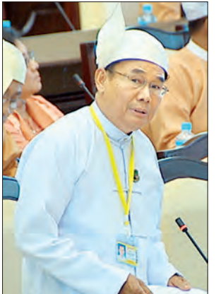
ဦးအုန်းဝင်း ပြည်ထောင်စုဝန်ကြီး

နေပြည်တော် စက်တင်ဘာ ၁၉ ချင်းပြည်နယ် တီးတိန်မြို့နယ်အတွင်းရှိ လေသာတောင် (ခေါ်) ကနေဒီတောင်တန်းဒေသအား ကွင်းဆင်းတိုင်းတာရေးဆောင်ရွက်ပြီး သဘာဝနယ်မြေစည်းနီမည့် အလားအလာများအပေါ် သုံးသပ်၍ အဆိုပြုသတ်မှတ်စွဲစည်းမည့် သဘာဝနယ်မြေများ အစီအစဉ်တွင် ထပ်မံထည့်သွင်း ဆောင်ရွက်သွားမည် ဖြစ်ကြောင်း သယံဇာတနှင့် သဘာဝပတ်ဝန်းကျင်ထိန်းသိမ်းရေး ဝန်ကြီးဌာန ပြည်ထောင်စုဝန်ကြီး ဦးအုန်းဝင်းက ဖြေကြားသည်။ ယနေ့ကျင်းပသည့် ဒုတိယအကြိမ် အမျိုးသားလွှတ်တော် ဒုတိယပုံမှန် အစည်းအဝေး ၃၄ ရက်မြောက်နေ့တွင် ချင်းပြည်နယ် မဲဆန္ဒနယ် အမှတ်(၆)မှ ဦးကျင့်ခင်ပေါင်၏ “ချင်းပြည်နယ် တီးတိန်မြို့နယ် လေသာတောင်တန်းကို သဘာဝဘေးမဲ့တောအဖြစ် သတ်မှတ်ပေးရန် အစီအစဉ် ရှိ/မရှိ” မေးခွန်းနှင့် စပ်လျဉ်း၍ ပြည်ထောင်စုဝန်ကြီးက ထိုသို့ ဖြေကြားခဲ့ခြင်းဖြစ်သည်။ ထို့ပြင် ပြည်ထောင်စုဝန်ကြီးက တီးတိန်မြို့နယ်ရှိ ကနေဒီတောင်(ခေါ်) လေသာတောင်၏ တောရိုင်းတိရစ္ဆာန်နှင့် ဇီဝမျိုးစုံမျိုးကွဲများ ရေရှည်တည်တံ့စေရန် ထိန်းသိမ်းကာကွယ်ရေးအတွက် တောရိုင်းတိရစ္ဆာန်နှင့် သဘာဝပတ်ဝန်းကျင် ကာကွယ်ရေးနှင့် သဘာဝနယ်မြေများ ထိန်းသိမ်းရေးဥပဒေအရ သဘာဝနယ်မြေ အမျိုးအစားတစ်ခုအဖြစ်သို့ သတ်မှတ်စွဲစည်းနိုင်ရေးအတွက် ယင်း