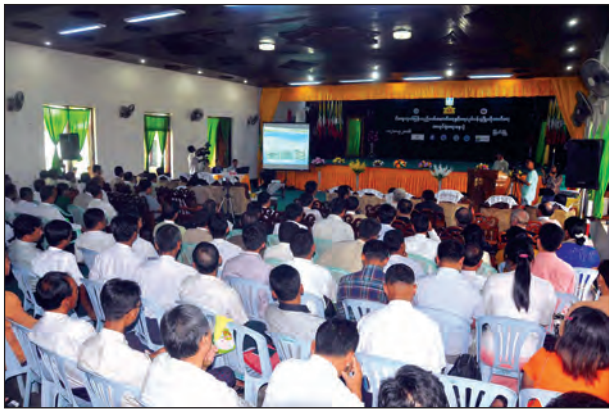
အခွင့်အလမ်းများ၊ ရေထွက်ပစ္စည်းဈေးကွက်သို့ တင်ပို့ခြင်းအခြေအနေများ၊ တိုင်းဒေသကြီးအတွင်း ငါးဈေးကွက်ဖော်ဆောင်ရေးဆိုင်ရာ အခွင့်အလမ်းနှင့် စိန်ခေါ်မှုများ၊ အလုပ်သမားဥပဒေနှင့် အလုပ်သမားရေးရာကဏ္ဍများ၊ ငါးလုပ်ငန်း ဈေးကွက်ဖော်ဆောင်မှုဆိုင်ရာ မဟာဗျူဟာများ၊ ရှေ့ဆက်လုပ်ဆောင်ရမည့် လုပ်ငန်းစဉ်များကို ဆွေးနွေးခဲ့ကြသည်။

ဆက်လက်၍ အမျိုးသားလွှတ်တော် စိုက်ပျိုးရေးနှင့်မွေးမြူရေးကော်မတီဥက္ကဋ္ဌ ဒေါက်တာခွန်ဝင်းသောင်က ရေလုပ်ငန်း ဥပဒေကြမ်းဆိုင်ရာများအကြောင်းကိုလည်းကောင်း၊ တိုင်းဒေသကြီး ငါးလုပ်ငန်းဦးစီးဌာနမှ ဒုတိယဦးစီးမှူး ဦးမြင့်ရွှေက တနင်္သာရီတိုင်းဒေသကြီးတွင် လက်ရှိရေလုပ်ငန်းဆောင်ရွက်နေမှုအခြေအနေများကိုလည်းကောင်း ဆွေးနွေးပြောကြားခဲ့ပြီး ဆွေးနွေးပွဲတက်ရောက်သူများက ရေလုပ်ငန်းဖွံ့ဖြိုးတိုးတက်ရေးနှင့်စိန်ခေါ်မှုများ၊ ငါးဈေးကွက်နှင့် နိုင်ငံတကာ အခြေအနေ