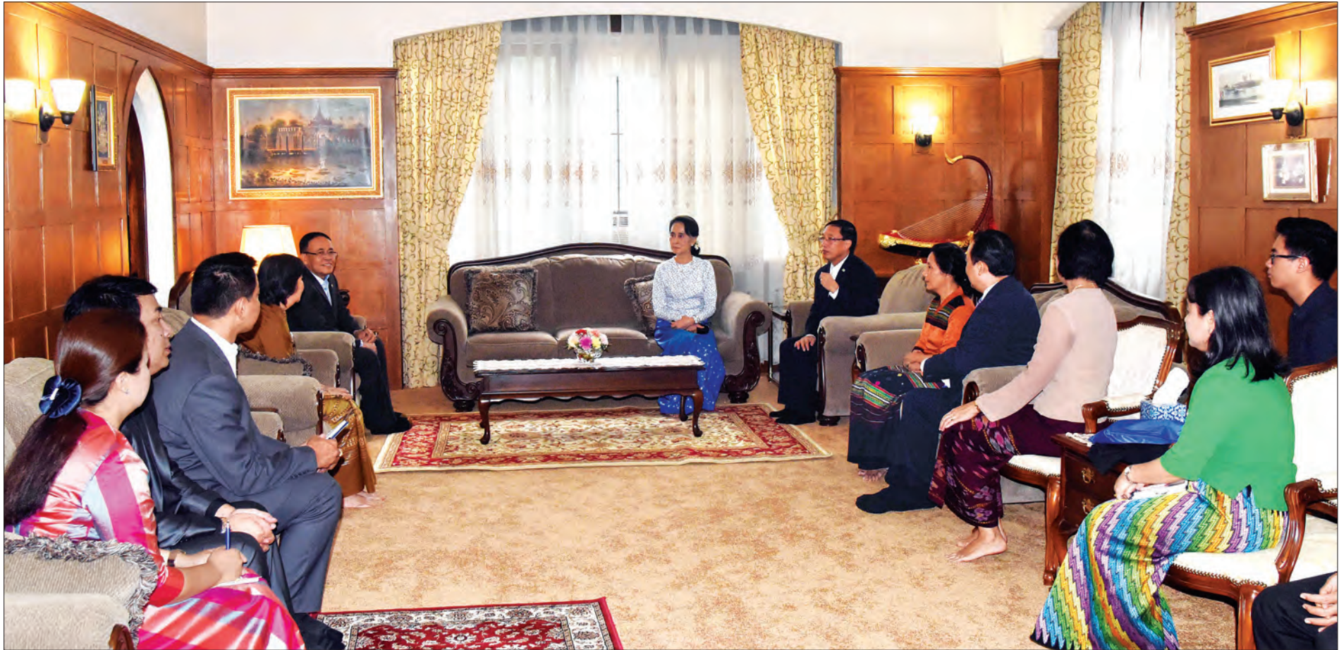
နိုင်ငံတော်၏ အတိုင်ပင်ခံပုဂ္ဂိုလ် ဒေါ်အောင်ဆန်းစုကြည် နယူးယောက်မြို့ရှိ ကုလသမဂ္ဂဆိုင်ရာ မြန်မာအမြဲတမ်းကိုယ်စားလှယ်အဖွဲ့ရုံးဝန်ထမ်းများနှင့် တွေ့ဆုံစဉ် (သတင်းစဉ်)

နယူးယောက် စက်တင်ဘာ ၁၉ နိုင်ငံတော်၏ အတိုင်ပင်ခံပုဂ္ဂိုလ် ဒေါ်အောင်ဆန်းစုကြည်သည် ယမန်နေ့ နံနက်ပိုင်းတွင် နယူးယောက်မြို့ရှိ ကုလသမဂ္ဂဆိုင်ရာ မြန်မာအမြဲတမ်းကိုယ်စားလှယ်နေအိမ်၌ မြန်မာအမြဲတမ်းကိုယ်စားလှယ်အဖွဲ့ရုံးဝန်ထမ်းများနှင့် ရင်းရင်းနှီးနှီးတွေ့ဆုံကာ ဝန်ထမ်းများ၏ လိုအပ်ချက်များကို မေးမြန်းဆွေးနွေးသည်။