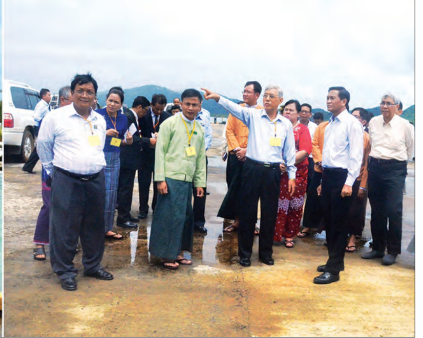
မြန်မာအထူးစီးပွားရေးဇုန် ဗဟိုအဖွဲ့ဥက္ကဋ္ဌ ဒုတိယသမ္မတ ဦးဟင်နရီပန်ထီးယူ လောင်းလုံးမြို့နယ် ပန်းတင်အင်းချောင်းတွင် တည်ဆောက်ထားသော Small Port ၏ လုပ်ငန်းဆောင်ရွက်မှုများကို ကြည့်ရှုစစ်ဆေးစဉ် (သတင်းစဉ်)