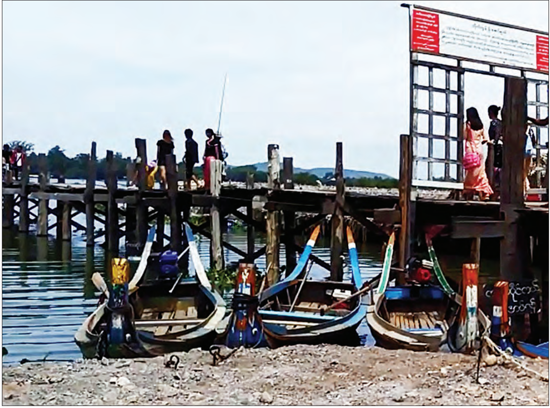
ဦးပိန်တံတားအောက်ခြေထိ လှည်းလမ်းကြောင်းဖောက်လုပ်ထားစဉ်

အဆိုပါ သမိုင်းဆိုင်ရာ အရေးကြီးသည့် စီမံကိန်းကို လက်လွှတ်ပယ်မလုပ်ဘဲ ပညာရှင် များ၏ အကြံပြုချက်များဖြင့် ဘက်ပေါင်းစုံမှ ပြင်ဆင်ဆောင်ရွက်ရခြင်းမှာ ၎င်းတို့၏ အစိုးရ သက်တမ်းအတွင်း “သမိုင်းယဉ်ကျေးမှုနယ် မြေကြီး ပုံမကျပန်းမကျဖြစ်ပြီး ကျန်ခဲ့မှာ မလို ချင်တဲ့အတွက်ဖြစ်တယ်” လို့ သယံဇာတနှင့် သဘာဝပတ်ဝန်းကျင် ထိန်းသိမ်းရေးဝန်ကြီးက သူ၏သဘောထားကို ပြောပြခဲ့ပါတယ်။ ။