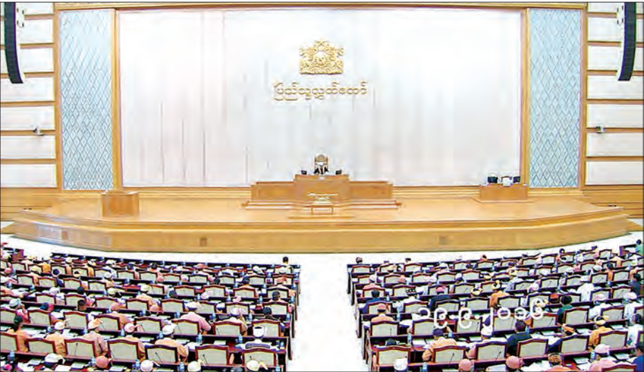
ပြည်သူ့လွှတ်တော် ဒုတိယပုံမှန်အစည်းအဝေး ၃၅ ရက်မြောက်နေ့ ကျင်းပစဉ် (သတင်းစဉ်)

ထားပြီး ရဲအက်ဥပဒေတွင် အာဏာမတည်သော မြို့၊ ကျေးရွာများ၏ ရပ်ရွာအေးချမ်းသာယာရေးနှင့် တရားဥပဒေစိုးမိုးရေး ဆောင်ရွက်ရာတွင်လည်း ရာဇသတ်ကြီးဥပဒေ၊ ရာဇဝတ်ကျင့်ထုံးဥပဒေ၊ အထူးနှင့် အထွေထွေဥပဒေများ၊ ဒေသန္တရဥပဒေများဖြင့် ဆောင်ရွက်လျက် ရှိပါကြောင်း။ ၁၉၄၅ ခုနှစ် ရဲအက်ဥပဒေ တစ်နိုင်ငံလုံးတွင် အာဏာတည်ရေးကိစ္စနှင့် စပ်လျဉ်း၍ ပြည်ထောင်စုရွေးချယ်ပုံရုံး၏ သဘောထားမှတ်ချက် တင်ပြတောင်းခံထားရှိပါကြောင်း၊ မြန်မာနိုင်ငံရဲတပ်ဖွဲ့ဥပဒေ (မူကြမ်း) အသစ် ပြင်ဆင်နိုင်ရေး ဆောင်ရွက်လျက်ရှိပြီး အတည်ပြုမပြဋ္ဌာန်းမီကာလအတွင်း ၁၉၄၅ ခုနှစ် ရဲအက်ဥပဒေ တစ်နိုင်ငံလုံး အာဏာတည်စေရေးအတွက် ၁၉၆၃ ခုနှစ် တရားဥပဒေများ အာဏာတည်စေခြင်းနှင့် ရပ်စဲစေခြင်းဥပဒေအရနိုင်ငံတော်သမ္မတပုံ အမိန့်ကြော်ငြာစာ ထုတ်ပြန်နိုင်ရေးအတွက် ပြည်ထဲရေးဝန်ကြီးဌာနမှ ဆောင်ရွက်လျက်ရှိကြောင်း ဖြေကြားသည်။ ဆက်လက်၍ မြန်မာနိုင်ငံရဲတပ်ဖွဲ့ဝင်များနှင့် ယာဉ်ထိန်းရဲတပ်ဖွဲ့ဝင်များသည် ပြည်သူများ ယာဉ်အန္တရာယ်နှင့် လမ်းအန္တရာယ်ကင်းရှင်းရေးအတွက် ယာဉ်စည်းကမ်း၊ လမ်းစည်းကမ်း ဖောက်ဖျက်သည့် ယာဉ်များကို စစ်ဆေးအရေးယူခြင်းနှင့် ယာဉ်စည်းကမ်း၊ လမ်းစည်းကမ်း