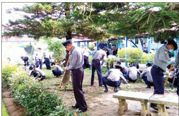
(၅၂)နှစ်မြောက် မြန်မာနိုင်ငံရဲတပ်ဖွဲ့နေ့ကို ကြိုဆိုဂုဏ်ပြုသောအားဖြင့် မြဝတီခရိုင်ရဲတပ်ဖွဲ့မှ ခရိုင်ရဲတပ်ဖွဲ့မှူး ဒုတိယရဲမှူးကြီးတင်မျိုးထူးဦးစီး၍ ရဲတပ်ဖွဲ့ဝင် ၆၃ ဦးတို့သည် မြဝတီခရိုင် ပြည်သူ့ဆေးရုံဝင်းအတွင်း၌ စုပေါင်းသန့်ရှင်းရေး လုပ်အားပေးဆောင်ရွက်ခဲ့စဉ်

အားတိုက် လှုပ်ရှားဆောင်ရွက်မှုတွေဟာ ကြီးမားတဲ့အခန်းကဏ္ဍက ပါဝင်နေတယ်ဆိုတာ ငြင်းလို့မရနိုင်ပါဘူး။ ၂၀၁၅ ရွေးကောက်ပွဲမှာ ထိုလူငယ်ထုမှ အင်အားအချို့ဟာ ရွေးချယ်တင်မြောက်ခံရပြီး တချို့မှာ အုပ်ချုပ်ရေးကဏ္ဍ၊ တချို့မှာ ဥပဒေပြုရေးကဏ္ဍများမှာ အသီးသီးတာဝန်ထမ်းဆောင်လျက်ရှိကြပါတယ်။ IPU က ရည်ညွှန်းထားတဲ့ ၂၀၃၀ ပြည့်နှစ်များမှာ ဒီလူငယ်ခေါင်းဆောင်အချို့ဟာ ဒီမိုကရေစီစနစ်ကို အားသစ်လောင်း၊ လက်ဆင့်ကမ်းသယ်ဆောင်သွားမယ့် မျိုးဆက်သစ်များဖြစ်ကြောင်းကိုလည်း မီးမောင်းထိုးပြလိုပါတယ်။ အမှန်အားဖြင့် အမျိုးသားဒီမိုကရေစီအဖွဲ့ချုပ်စတင်ဖွဲ့စည်းခဲ့တဲ့ ၁၉၈၈ ခုနှစ် စက်တင်ဘာကတည်းကစလို့ လူငယ်အင်အားစု မြောက်မြားစွာ ပါရှိခဲ့ပါတယ်။ ခေတ်၊ စနစ်အခြေအနေဖြတ်သန်းမှုအရ အင်အားပြုန်းတီးမှုရှိခဲ့သော်လည်း ကျန်ရှိနေတဲ့လူငယ်အင်အားစုများသည် ယခုအချိန်တွင် သက်လတ်ပိုင်းသို့ရောက်ရှိနေကြပြီဖြစ်ပါသည်။ ယနေ့မြန်မာ့လူဦးရေ အချိုးအစားအရ ကြီးမားများပြားသည့် လူငယ်အင်အားထုမှ လူငယ်များသည် ၂၀၃၀ ပြည့်နှစ်တွင်လည်း နိုင်ငံတာဝန်အသီးသီးကို ထမ်းဆောင်ကြရမည့် ထမ်းဆောင်နိုင်မည့်ပုဂ္ဂိုလ်များ ဖြစ်လာပါလိမ့်မည်။ ထို့အတူ ကျွန်ုပ်တို့ အမျိုးသားဒီမိုကရေစီအဖွဲ့ချုပ်အနေဖြင့်လည်း ဒီမိုကရေစီစနစ်ရှင်သန်ပြန်ပွားရေးတာဝန်ကို စဉ်ဆက်မပြတ်မျိုး ဆက်ချင်းဆက်ကာ လှုပ်ရှားဆောင်ရွက်နေသည့်အလျောက် ၂၀၃၀ပြည့်နှစ် အလွန်ကာလများဆီအထိ ဒီမိုကရေစီစနစ်ရှင်သန်အားကောင်းနေမည်ဖြစ်ကြောင်း တင်ပြအပ်ပါသည်။