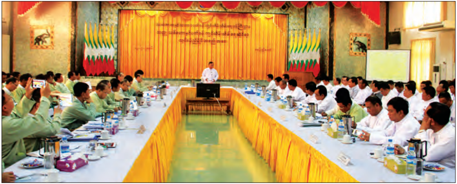
ကဏ္ဍ၊ ပတ်ဝန်းကျင်ထိန်းသိမ်းရေးကဏ္ဍတို့ကို တာဝန်ရှိသူများ အနေဖြင့် အခက်အခဲများအား ပွင့်ပွင့်လင်းလင်းဆွေးနွေးကြ စေလိုကြောင်းပြောကြားသည်။ အဆိုပါအခမ်းအနားသို့ သယံဇာတနှင့်သဘာဝပတ်ဝန်း ကျင် ထိန်းသိမ်းရေးဝန်ကြီးဌာနမှ အမြဲတမ်းအတွင်းဝန် ညွှန်ကြားရေးမှူးချုပ်များ၊ ဦးဆောင်ညွှန်ကြားရေးမှူးများ၊ တိုင်းဒေသကြီး/ပြည်နယ်များမှ တာဝန်ခံညွှန်ကြားရေးမှူးများ တက်ရောက်ဆွေးနွေးခဲ့ကြောင်းသိရသည်။ (သတင်းစဉ်)

လုပ်နည်းများနှင့်အညီ စိစစ်ခွင့်ပြုပေးလျက်ရှိပါကြောင်း၊ ပြင်ဆင်ပြင်ဆင်ခြင်းသည် သတ္တုတွင်းဥပဒေနှင့်အညီ တိုင်းဒေသ ကြီးနှင့် ပြည်နယ်အသီးသီးတွင် လုပ်ကွက်စိစစ်ချထားပေး ရေးအဖွဲ့များကို ဖွဲ့စည်းတာဝန်ပေးအပ်သွားမည်ဖြစ်ကြောင်း၊ သဘာဝသယံဇာတ အရင်းအမြစ်များကို တူးဖော်ထုတ်လုပ် ရာတွင် ကောင်းမွန်သောစီမံခန့်ခွဲမှုစနစ်ရှိပါက ဝင်ငွေအများ အပြားရရှိကာ နိုင်ငံ၏ စီးပွားရေးဖွံ့ဖြိုးမှုကိုအထောက်အကူပြု ပြီး ဆင်းရဲနွမ်းပါးမှုလျော့ကျစေမည်ဖြစ်ကြောင်း၊ စီမံခန့်ခွဲမှု အားနည်းပါက ယင်းအရင်းအမြစ်များသည် ဆင်းရဲနွမ်းပါးမှု၊ အကျင့်ပျက်ခြစားမှုနှင့်ပဋိပက္ခတို့ကိုဖြစ်ပွားစေမည်ဖြစ်ကြောင်း၊ မြန်မာ့သတ္တုတွင်းနည်းဥပဒေအသစ်ကို ထုတ်ပြန်နိုင်ရန် နိုင်ငံ တကာအဖွဲ့အစည်းများ၊ ပြည်တွင်းပြည်ပညာရှင်များ၊ လုပ်ငန်း ရှင်များ၊ အရပ်ဘက်အဖွဲ့အစည်းများ၊ သီးခြားအကြံပြုသူများ ၏ အကြံပြုချက်များနှင့်အတူ ဥပဒေ ရေးထုံးနှင့်အညီ မူကြမ်း ပြုစုပြီးထုတ်ပြန်တော့မည်ဖြစ်ကြောင်း၊ သတ္တုသတ္တု၊ သစ်တော