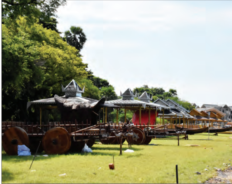
လေ့လာသူများ ကြည့်ရှုနိုင်ရန် ပြသထားသည့် မြန်မာ့ရိုးရာလက်မှုပညာပစ္စည်းများကို တွေ့ရစဉ်

“ဒီစီမံကိန်း တစ်ခုတည်းကြောင့်တော့ မဟုတ်ဘူး။ တောင်သမန်အင်းကို ပျက်စီးစေ တဲ့ အကြောင်းတရားတွေကတော့ အများကြီး ပဲ။ တောင်သမန်အင်းထဲကို ပတ်ဝန်းကျင်နား မှာရှိတဲ့ စက်မှုဇုန်ရေဆိုးတွေက ချောင်း တွေမှတစ်ဆင့် စီးဝင်နေတာ။ အင်းကိုပိတ်ပြီး ငါးမွေးကန်လုပ်ခဲ့တော့ ရေဝင်ရေလဲမရှိဘဲ ရေသေ ဖြစ်ပြီး ရေမသန့်တော့လို့ အခုဆို ငါးတွေသေတဲ့ အထိဖြစ်လာပြီ။ တောင်သမန်အင်းက ဒုက္ခမျိုးစုံ ရင်ဆိုင်နေရတယ်။ အမြန်စနစ်တကျ ထိန်းသိမ်း