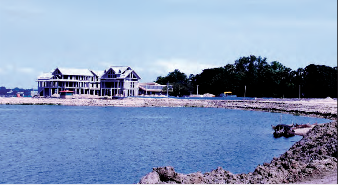
စီမံကိန်းအသစ်တွင် ဆောက်လုပ်ထားသည့် ဟိုတယ်များအား တွေ့ရစဉ်

ထို့ပြင် ရှေးဟောင်းယဉ်ကျေးမှုအမွေအနှစ် ဆိုင်ရာ ဥပဒေအရ ဦးပိန်တံတားနဲ့ ပေ ၁၂၀ အတွင်း မည်သည့် စီမံကိန်းမျှ ဆောင်ရွက်ခွင့်မပြု ထားကြောင်း ရှေးဟောင်းသုတေသနနှင့် အမျိုး သားပြတိုက်ဦးစီးဌာနမှ တာဝန်ရှိသူက ပြောပါ