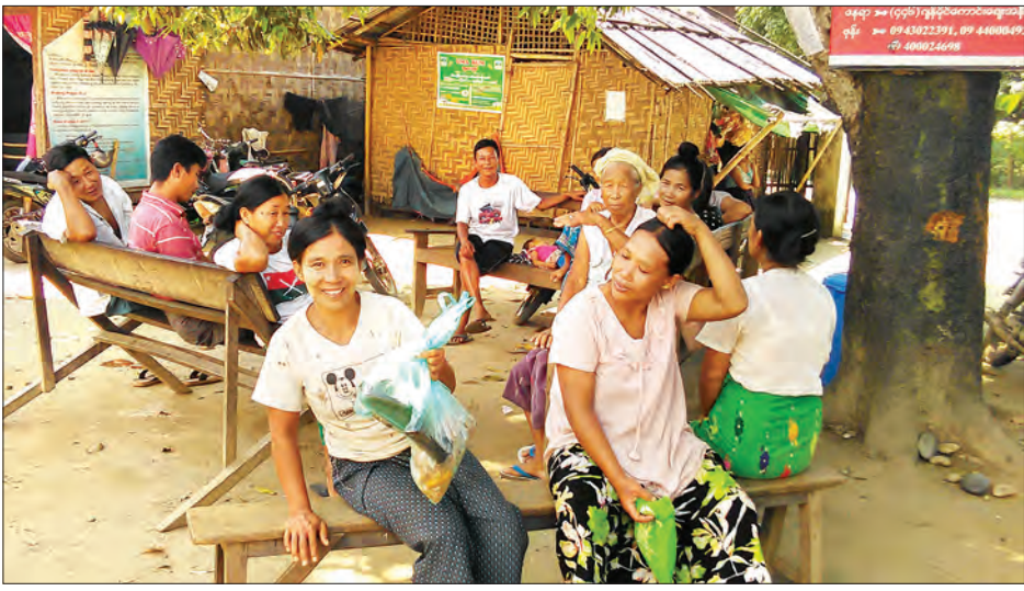
စိန်ပေါလ်စစ်ဘေးရှောင်စခန်းရှိ ပြည်သူများအား တွေ့ရစဉ်