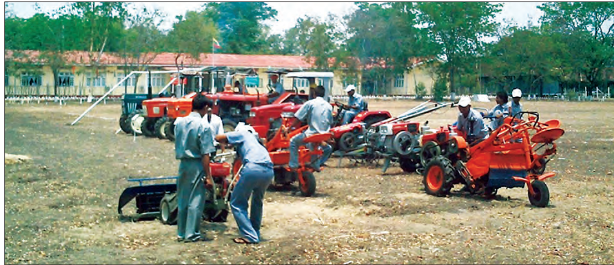
စက်မှုလယ်ယာဝဟိုသင်တန်းကျောင်း မိတ္ထီလာတွင် သင်တန်းသားများ လက်တွေ့သင်ယူနေစဉ်

နေပြည်တော် စက်တင်ဘာ ၁၈ မြန်မာနိုင်ငံတွင် လက်ရှိကျင့်သုံးလျက် ရှိသော သမားရိုးကျလယ်ယာစိုက်ပျိုး ရေးနည်းစနစ်မှ စက်မှုလယ်ယာစနစ် သို့ ကူးပြောင်းဆောင်ရွက်ခြင်းဖြင့် နိုင်ငံတော်၏ လယ်ယာကဏ္ဍဖွံ့ဖြိုး တိုးတက်စေရန်ရည်ရွယ်၍ စိုက်ပျိုးရေး၊ မွေးမြူရေးနှင့်ဆည်မြောင်းဝန်ကြီးဌာန စက်မှုလယ်ယာဦးစီးဌာနမှ တောင်သူ များ မိမိတို့ ပိုင်ဆိုင်အသုံးပြုလျက်ရှိ