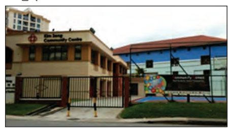
စင်ကာပူနိုင်ငံရှိ လူမှုအခြေပြုပဟိုဠာနဲ့

အရှေ့တောင်အာရှနဲ့ အာရှနိုင်ငံတစ်ချို့မှာ တည်ဆောက်ထားတဲ့ လူမှုအခြေပြုပဟိုဠာနဲ့ အဆောက်အအုံပုံစံများကို ဖော်ပြလိုက်ပါတယ်။