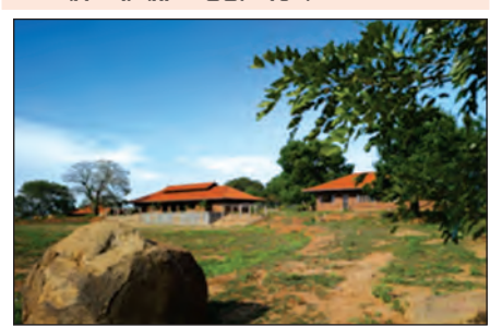
သီရိလင်္ကာနိုင်ငံရှိ လူမှုအခြေပြုပဟိုဠာနဲ့ သီရိလင်္ကာနိုင်ငံအရှေ့တောင်ပိုင်း တိစ္ဆမဟာရာမမြို့အပြင်မှာရှိတဲ့ ရွာသစ်ကလေးမှာ ၂၀၀၄ ခုနှစ်က ဆူနာမီဒဏ်ခံစားခဲ့

ကြရတဲ့ မိသားစု ၂၀၀၄ ခုအတွက် အဆောက်အအုံပုံစံပေါ်ဝင်တဲ့ လူမှုအခြေပြုပဟိုဠာနဲ့ ကို တည်ဆောက်ပေးထားပါတယ်။ ဒီနေရာက လူမှုအခြေပြုပဟိုဠာနဲ့အခြေခံသမာဏ မူကြိုကျောင်း၊ စာကြည့်တိုက်၊ ဆေးခန်း၊ အားကစားများဖြစ်တဲ့ ခရစ်ကက်နဲ့ ဘောလီဘောကစားနိုင်တဲ့ နေရာများ၊ ရေရှားပါးတဲ့ဒေသဖြစ်တဲ့အတွက် သောက်သုံးရေအဖြစ် မိုးရေကို စုဆောင်းမှုစနစ်နဲ့ မြေအောက်ရေလှောင်ကန်ကြီးနဲ့စနစ်ကိုလည်း ထည့်သွင်းဆောင်ရွက်ထားပါတယ်။ ဒီအဆောက်အအုံပုံစံကို တည်ဆောက်တဲ့နေရာမှာ ဒေသခံများကိုယ်တိုင် ဒီဇိုင်းရေးဆွဲရာတွင်လည်းကောင်း၊ တည်ဆောက်ရာတွင်လည်းကောင်း၊ ပေးအပ်ထားတဲ့အသုံးအဆောင်ပစ္စည်းများကို စီမံဆောင်ရွက်မှုများတွင်လည်းကောင်း ပါဝင်ဆောင်ရွက်ကြတာ တွေ့ရပါတယ်။ တည်ဆောက်ရာတွင် ဒေသထွက်ပစ္စည်းများကို အများစုသုံးစွဲခြင်းဖြင့် ကုန်ကျမှုစရိတ်သက်သာစွာနဲ့ တည်ဆောက်ခဲ့ပါတယ်။