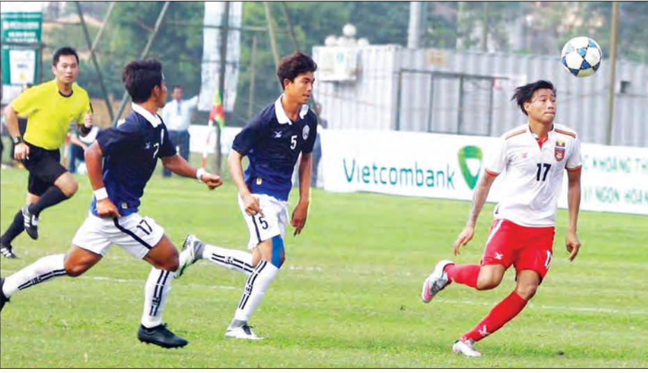
အာဆီယံ ယူ-၁၉ ဘောလုံးပြိုင်ပွဲ မြန်မာနှင့် ကမ္ဘောဒီးယား အသင်းယှဉ်ပြိုင်နေစဉ်