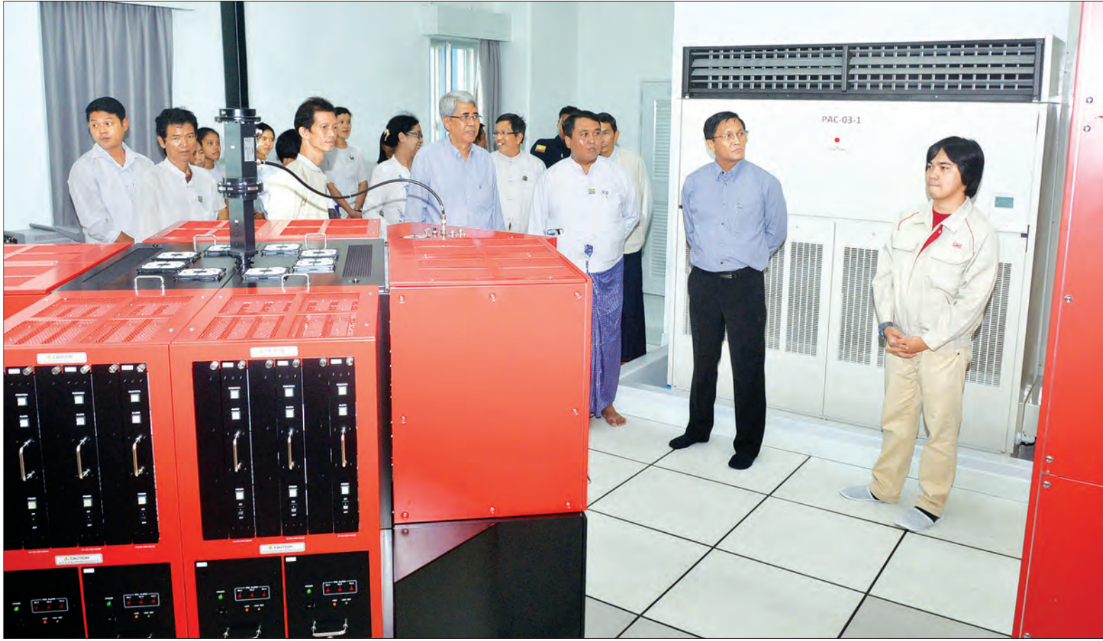
အမျိုးသားသဘာဝဘေးအန္တရာယ်ဆိုင်ရာ စီမံခန့်ခွဲမှုကော်မတီဥက္ကဋ္ဌ ဒုတိယသမ္မတ ဦးဟင်နရီဇန်ထီးယူ မိုးလေဝသခန့်မှန်းရေး ရေဒါတာဝါ၏ လုပ်ငန်းဆောင်ရွက်မှုကို ကြည့်ရှုစဉ် (သတင်းစဉ်)

ရန်ကုန် စက်တင်ဘာ ၁၈ အမျိုးသား သဘာဝဘေးအန္တရာယ် ဆိုင်ရာ စီမံခန့်ခွဲမှုကော်မတီဥက္ကဋ္ဌ ဒုတိယ သမ္မတ ဦးဟင်နရီဇန်ထီးယူသည် ယမန်နေ့ မွန်းလွဲပိုင်းတွင် ရန်ကုန်မြို့ မရမ်းကုန်းမြို့နယ် ကမ္ဘာ့အေးစေတီလမ်းရှိ မိုးလေဝသနှင့် ဇလဗေဒညွှန်ကြားမှု ဦးစီးဌာန၊ ကမ္ဘာ့အေးမိုးလေဝသစခန်း တွင် ဂျပန်နိုင်ငံ အပြည်ပြည်ဆိုင်ရာ ပူးပေါင်းဆောင်ရွက်ရေး အေဂျင်စီ (JICA)၏ အကူအညီဖြင့် ဆောင်ရွက် ခဲ့သည့် မိုးလေဝသခန့်မှန်းရေး ရေဒါ တာဝါသို့ သွားရောက်ကြည့်ရှုစစ်ဆေး သည်။ ဒုတိယသမ္မတ ဦးဟင်နရီဇန်ထီးယူ အား အစည်းအဝေးခန်းမ၌ မိုးလေဝသ နှင့် ဇလဗေဒညွှန်ကြားမှုဦးစီးဌာန ဒုတိယညွှန်ကြားရေးမှူးချုပ် ဒေါက်တာ ကျော်မိုးဦးက သဘာဝဘေးအန္တရာယ် ဆိုင်ရာ ရာသီဥတုစောင့်ကြည့်လေ့လာ ရေးလုပ်ငန်းများ အကောင်အထည်ဖော် ဆောင်ရွက်ခြင်းစီမံကိန်း (ရေဒါတည် ဆောက်ခြင်းစီမံကိန်း) ဆောင်ရွက်နေမှု၊ မိုးလေဝသ သတိပေးနိုးဆော်ချက်များ ကို အကဲခတ်အိမ်ခြေဒီယိုနှင့် ရုပ်သံလွှင့်လိုင်း များသတင်းစာများနှင့် လူမှုကွန်ရက်များ စာမျက်နှာ ၄ ကော်လံ ၁ *