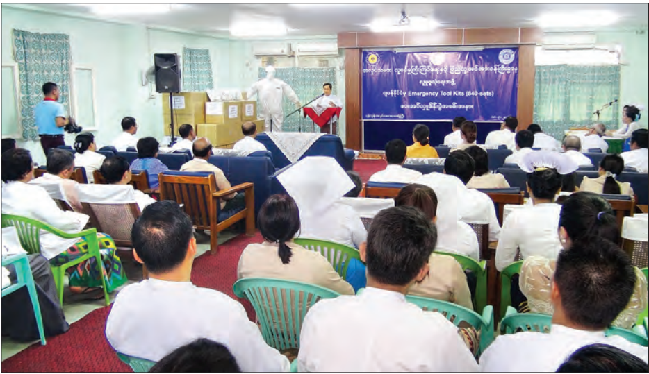
ပြည်ထောင်စုဝန်ကြီး ဦးသိန်းဆွေ ဆေးရုံသုံးကူးစက်ရောဂါ ကာကွယ်ရေးပစ္စည်းများ လှူဒါန်းပွဲအခမ်းအနား၌ အမှာစကားပြောကြားစဉ်

ထိုသို့ ဆေးကုသမှုဝန်ဆောင်မှုများ အဆင့်မြှင့်ရာတွင် လူမှုဖူလုံရေးအဖွဲ့သာမက ယခုကဲ့သို့ ပြည်တွင်း/ပြည်ပမှ အလှူရှင်များကလည်း ကူညီဖြည့်ဆည်းပေးလျက်ရှိပါကြောင်း၊ ဂျပန်နိုင်ငံ Medical Three Co., Ltd. နှင့် Diplomatic Skill Trainees Organization တို့ပူးပေါင်း၍ ယခုလို ကူးစက်ရောဂါကာကွယ်ပစ္စည်းများကို လာရောက်လှူဒါန်းသည့်အတွက် လူမှုဖူလုံရေးစီမံကိန်း အကောင်အထည်ဖော်ခြင်းနှင့် အာမခံအလုပ်သမားကျန်းမာရေးဝန်ဆောင်မှုပေးရာတွင် တစ်ထောင့်တစ်နေရာမှ အထောက်အပံ့အများကြီးပေးနိုင်မည်ဖြစ်၍ လူမှုဖူလုံရေးအဖွဲ့သို့ လာရောက်လှူဒါန်းသော အလှူရှင်များကိုလည်း အထူးကျေးဇူးတင်ရှိပါကြောင်း ပြောကြားသည်။ ထို့နောက် Diplomatic Skill