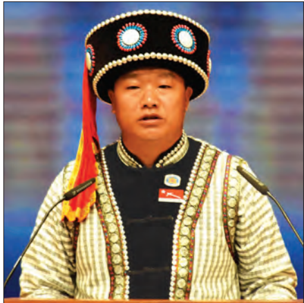
အပြည်ပြည်ဆိုင်ရာ ဒီမိုကရေစီနေ့အခမ်းအနားတွင် စာတမ်းကိုဖတ်ကြားတင်သွင်းခွင့်ရတဲ့အတွက် များစွာကျေးဇူး