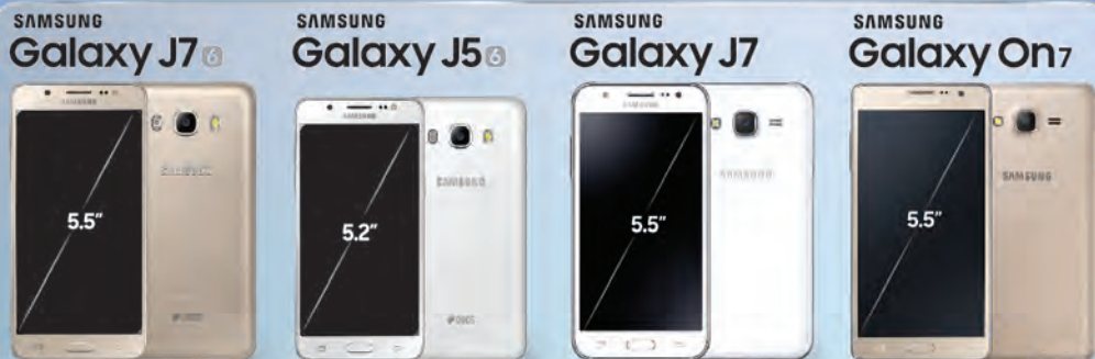
Galaxy J7(2016) , J5(2016) , J7 or On7 မည်သည့်ဖုန်း (၁)လုံး ဝယ်ယူသူမဆို အောက်ပါမေတ္တာလက်ဆောင်များ ရယူပါ...

စက်တင်ဘာလ (၁၂) ရက်နေ့မှ စတင်၍ ပစ္စည်းလက်ကျန်ရှိသည်အထိသာ