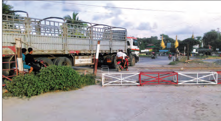
လမ်းစည်းကမ်းတကျဖြစ်အောင် ဂိတ်အပြည့်ဖွင့်ပေးဖို့လိုမယ်။ ဆိုင်ကယ်၊ စက်ဘီးတို့နဲ့ သွားတဲ့ ကျောင်းသားတွေလည်း နှစ်ဖက်ယာဉ်ကြော့က ခက်ခက်ခဲခဲသွားစရာမလိုတော့ဘူး”ဟု ဒေသခံ တစ်ဦးက ပြောသည်။

“စစ်ကိုင်း-မြစ်ငယ်ဖြတ်လမ်းကလည်း အခုဆို ပြီးသလောက် ရှိနေပါပြီ။ တိုးဂိတ်တွေကိုလည်း ဆောက်ပြီးလို့ ငွေကောက်နေတာ ကြာပြီ။ ဒီ ၁၂ မိုင်သံလမ်းကူးဂိတ်ကို တစ်ခြမ်းပဲ ဖွင့်ပေးထားတော့ လမ်းကပိတ်နေပြီး ယာဉ်ကြော့ကျပ်ကုန်တာပေါ့။ ဂိတ်သာအပြည့် ဖွင့်ပေးရင် ယာဉ်ကြော့ရှုပ်ထွေးမှုကို မြေလျှော့ရာလည်းရောက်မယ်။ ယာဉ်အန္တရာယ်လည်း ပိုကင်းရှင်းမယ်။ သူလမ်းနဲ့သူ အသွားအပြန်