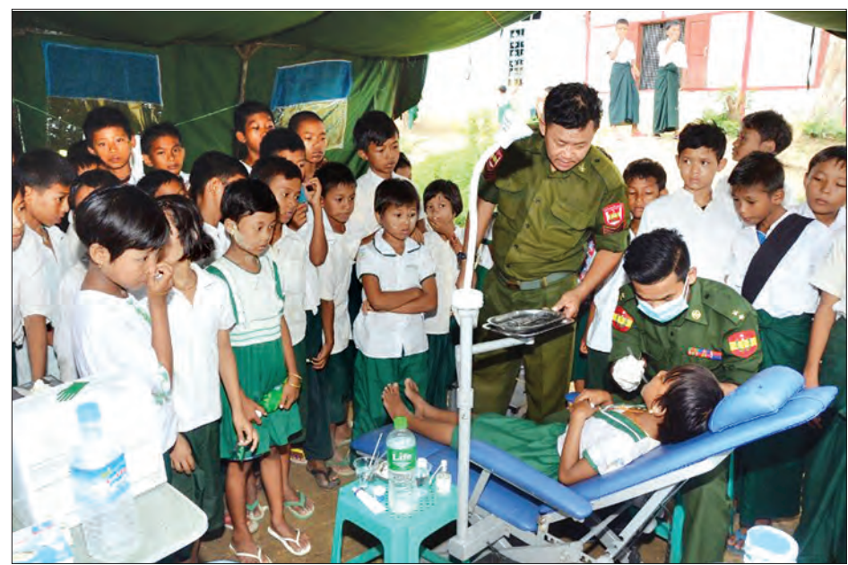
တပ်မတော် နယ်လှည့်အထူးကုဆေးအဖွဲ့က ကျောင်းသား ကျောင်းသူများအား ဆေးကုသပေးစဉ်