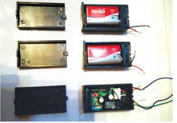
၁၀၇ မမ ဒုံးသီးနှင့် တပ်ဆင်ထားရှိသော အချိန်ထိန်းကိရိယာ၊ ဆားကစ်ပြားနှင့် ဓာတ်ခဲများပုံ (မြဝတီ)