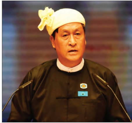
ဟာ မိမိတို့နိုင်ငံအတွက် အလွန်အရေးပါသော အလေးထား လုပ်ဆောင်ရမည့် လုပ်ငန်းစဉ်ဖြစ်ပါသည်။

ယနေ့ဒီမိုကရေစီနေ့မှာ “အားလုံးပူးပေါင်းပါဝင်စွာ ဒီမိုကရေစီ ၂၀၃၀ သို့” "Democracy 2030" ခေါင်းစဉ်ဖြင့် ကျင်းပသော အပြည်ပြည်ဆိုင်ရာ ဒီမိုကရေစီနေ့အခမ်းအနားသို့ တက်ရောက်လာကြတဲ့ လူကြီးမင်းများနှင့် ပါတီစုံအသီးသီးမှ ကိုယ်စားလှယ်များအားလုံးကို အထူးပင်လေးစားပါကြောင်း နှစ်မင်္ဂလာပါလို့ နှုတ်ခွန်းဆက်သကိရပြပါသည်။