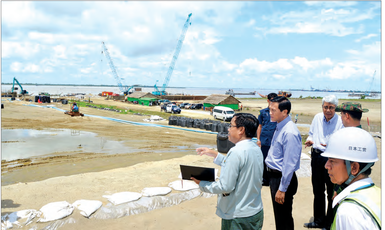
မြန်မာအထူးစီးပွားရေးဇုန် ဗဟိုအဖွဲ့ဥက္ကဋ္ဌ ဒုတိယသမ္မတ ဦးဟင်နရီဇန်ထီးယူ သီလဝါဆိပ်ကမ်းစီမံကိန်းကို ကြည့်ရှုစစ်ဆေးစဉ်