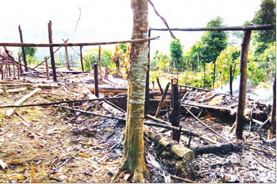
ပွိုင့် ၃၀၈ စခန်း ထိခိုက်ပျက်စီးမှုကို တွေ့ရစဉ်

အဆိုပါ နယ်မြေအတွင်း KIO/KIA လက်နက်ကိုင်အဖွဲ့သည် လယ်ယာစိုက်ပျိုးရေးလုပ်ငန်းများအား လုပ်ကိုင်ခွင့် မပြုခြင်း၊ ခြိမ်းခြောက်မောင်းထုတ်ခြင်း၊ မိုင်းထောင်ခြင်းများ ပြုလုပ်ဆောင်ရွက်လျက်ရှိသော်လည်း ဒေသခံတောင်သူလယ်သမားများအနေဖြင့် မိမိတို့မိရိုးဖလာ လယ်ယာစိုက်ပျိုးရေးလုပ်ငန်းများအား ဆက်လက်လုပ်ကိုင်ဆောင်ရွက်ခဲ့ရာ ၂၀၁၅ ခုနှစ်တွင် ခုနှစ်ကြိမ်၊ ၂၀၁၆ ခုနှစ်တွင်နှစ်ကြိမ် စုစုပေါင်းကြိမ်မိုင်းထောင် ဖောက်ခွဲမှုများပြုလုပ်ခဲ့သဖြင့် ကျေးရွာနေဒေသခံပြည်သူ လေးဦး သေဆုံးကာ ၁၀ ဦးဒဏ်ရာရရှိခဲ့သည်။ အဆိုပါပွဲတွင် ၃၀၈ စခန်းသည် ဆွတ်လျှံနယ်မြေအတွင်း တပ်စခန်းများ ဖွင့်လှစ်၍ ကာကွယ်စောင့်ရှောက်မှုပြုလုပ်ပေးရန် ရွာသူ၊ ရွာသားများက တိုင်းစစ်ဌာနချုပ်သို့ ဆန္ဒပြတင်ပြတောင်းခံခဲ့သောကြောင့် တပ်မတော်က လုံခြုံရေးအရ တာဝန်ယူဆောင်ရွက်ပေးသည့် စခန်းတစ်ခုဖြစ်သည်။ (မြဝတီ)