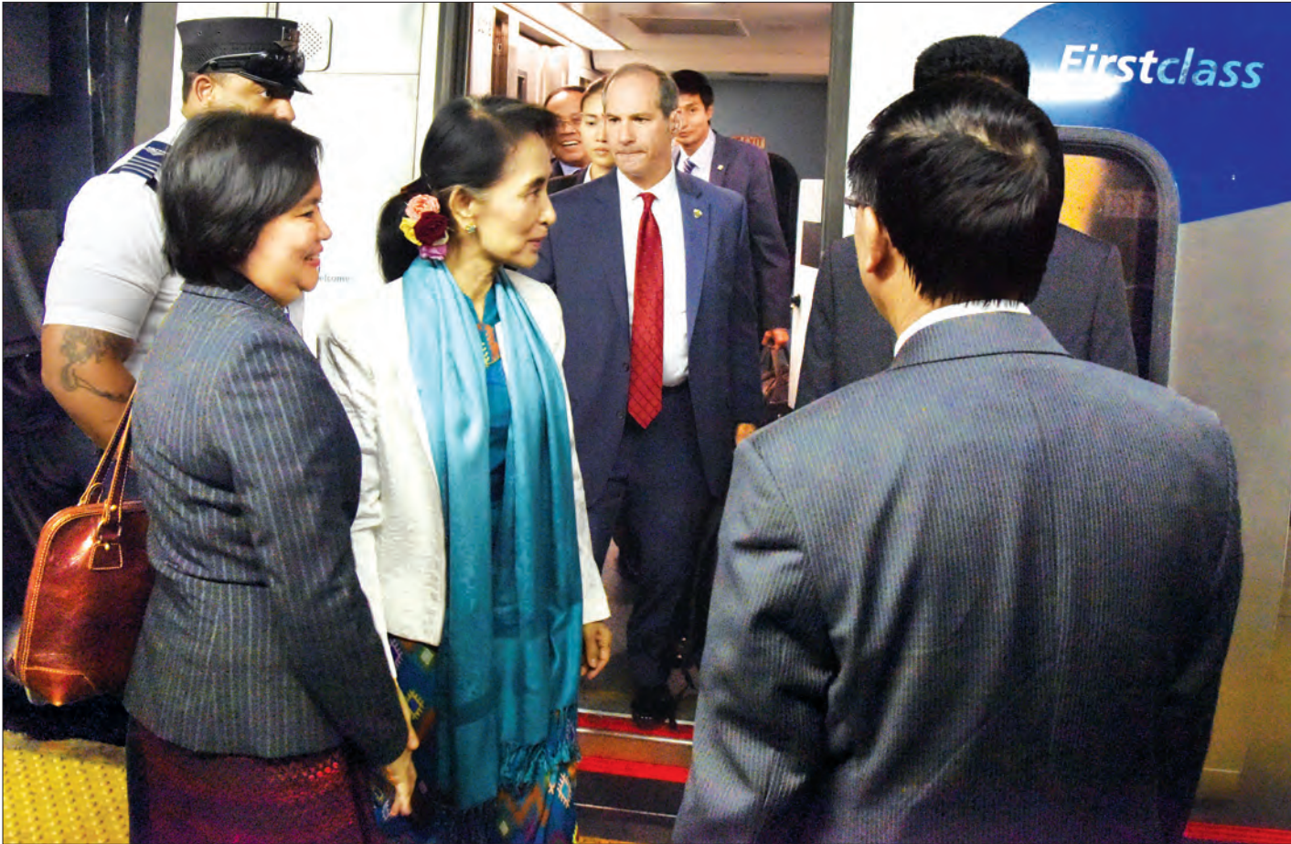
နိုင်ငံတော်၏ အတိုင်ပင်ခံပုဂ္ဂိုလ် ဒေါ်အောင်ဆန်းစုကြည်အား နယူးယောက်မြို့၊ Penn Station ၌ နယူးယောက်မြို့၊ ကုလသမဂ္ဂဆိုင်ရာ မြန်မာအမြဲတမ်းကိုယ်စားလှယ် သံအမတ်ကြီး ဦးဟောက်ခိုဆွမ်းနှင့် တာဝန်ရှိသူများက ကြိုဆိုနှုတ်ဆက်စဉ် (သတင်းစဉ်)

၁၃၇၈ ခုနှစ်၊ တော်သလင်းလပြည့်ကျော် ၂ ရက် ၂၀၁၆ ခုနှစ်၊ စက်တင်ဘာ ၁၈ ရက်၊ တနင်္ဂနွေနေ့၊ အတွဲ (၅၅)၊ အမှတ် (၃၄၉)