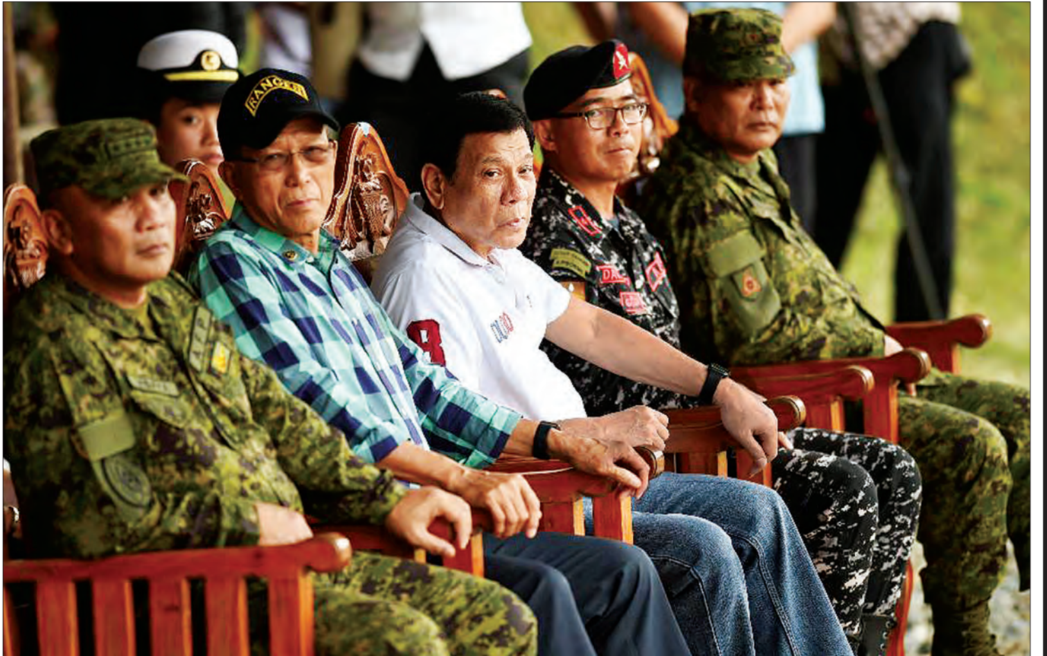
စက်တင်ဘာ ၁၅ ရက်နေ့က မနီလာမြောက်ပိုင်းရှိ လေ့ကျင့်ရေးစခန်း၌ သမ္မတ ဒူတက်တေးအား တွေ့ရစဉ်

နောက်တစ်နေ့မှာတော့ သမ္မတအိုဘားမား က အမေရိကန်ဟာ ပီယက်နမ်စစ်ပွဲအတွင်းမှာ