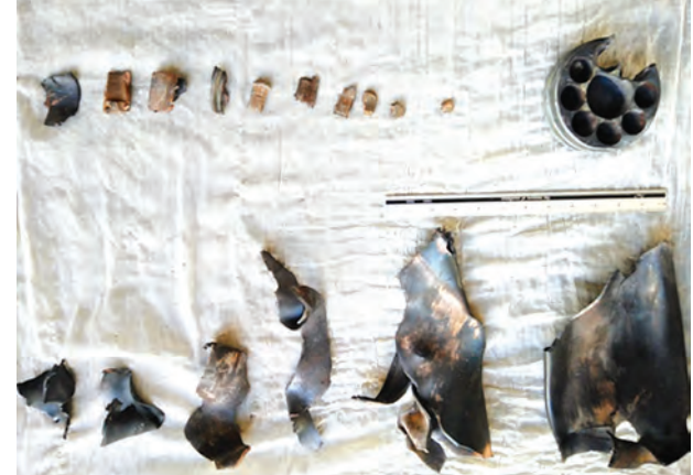
ဦးပယ်စောက်ချိန် နေအိမ်အရှေ့မြောက်ဘက် အမိုးထိပ်စွန်းပျက်စီးသည့် နေရာအနီး တစ်ဝိုက်၌ တွေ့ရှိရသည့် ဒုံးသီး သံကိုယ်ထည်အစများ (မြဝတီ)