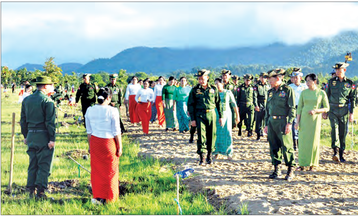
တပ်မတော်ကာကွယ်ရေးဦးစီးချုပ် ဝိုင်းချုပ်မှူးကြီး မင်းအောင်လှိုင်နှင့် အဖွဲ့ဝင်များ တပ်မတော်မိသားစုများစိုက်ပျိုးသည့် သစ်ပင်များအား လှည့်လည်ကြည့်ရှုစဉ်