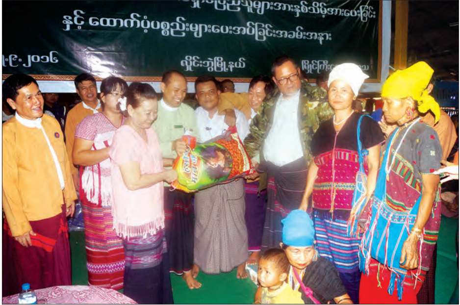
အနွေးထည်၊ ဦးထုပ်၊ စောင် အစရှိသည့် အဝတ်အထည်ကလေးကစားစရာအရုပ်များ၊ အားကစားပစ္စည်းများအား ထောက်ပံ့ပေးအပ်ခဲ့ကြောင်း သိရသည်။ စောမျိုးမင်းသိန်း(ပြန်/ဆက်)

မြိုင်ကြီးငူအထူးဒေသတွင် မဲသဝေါဒေသမှ ဒေသခံပြည်သူ အိမ်ထောင်စု ၆၇၅ စု လူဦးရေ ၃၈၇၄ ဦး ယာယီ စစ်ဘေးရှောင် ပြောင်းရွှေ့နေထိုင်လျက်ရှိရာ ပြည်နယ်အစိုးရအဖွဲ့၊ ပြည်နယ်ဝန်ကြီးချုပ် ဒေါ်နန်းခင်ထွေးမြင့်၊ ပြည်နယ်လွှတ်တော်ဥက္ကဋ္ဌဦးစောချစ်ခင်၊ ဒုတိယဥက္ကဋ္ဌ ဒေါ်နန်းသူဇာဝင်း၊ ပြည်နယ်ဝန်ကြီးများ၊ ပြည်နယ်အဆင့် ဌာနဆိုင်ရာ အကြီးအကဲများက နှစ်သိမ့်အားပေးစကားများ ပြောကြား၍ ပဲခူးလေး ၆၇၅ ပိဿာ၊ ဟင်းချိုမှုန့် တစ်ပေါင်ထုပ် ၆၇၅ ထုပ်၊ ငရုပ်သီးမှုန့် ၁၃၅ ပိဿာ၊ ကြော်ရည်ထုပ်ပန်းကန်နှင့် ခွက် ဂျပ်ပုံး ၅၀၊ ပဲနီ ၁၀၆၂၈ ဘူး၊ အာလူးကြော် ၁၀၆၂၂ ထုပ်၊ ရုပ်အင်္ကျီ