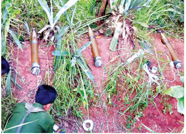
လောက်ကိုင်မြို့ရှိ ပစ်ခတ်ရန် ၁၀၇ မမ ဒုံးသီးလုံးတွဲအား လျှပ်စစ်ပိုင်ယာကြိုးဖြင့် သွယ်တန်းထားသည်ကို တွေ့ရစဉ် (မြဝတီ)

၂၂ လုံးတို့ကို လျှပ်စစ်ပိုင်ယာကြိုးများဖြင့် သွယ်တန်းထားကာ အင်ဂျင်တယ်အချိန်ထိန်းကိရိယာဖြင့် တပ်ဆင်ထားပြီး လောက်ကိုင်မြို့၏ အဓိကနေရာများအား တစ်ပြိုင်တည်း ပစ်ခတ်ရန် ချိန်ရွယ်ထားကြောင်း တွေ့ရှိရသည်။ အဆိုပါ ဖြစ်စဉ်ဖြစ်ပွားခဲ့သည့် ပတ်ဝန်းကျင်တစ်ဝိုက်အား နယ်မြေတပ်မတော် စစ်ကြောင်းများက နယ်မြေရှင်းလင်း ဆောင်ရွက်လျက်ရှိကြောင်း သတင်းရရှိသည်။ (မြဝတီ)