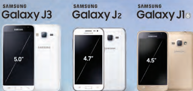
Galaxy J3 , J2 , J1(2016) မည်သည့်ဖုန်း (၁)လုံး ဝယ်ယူသူမဆို အောက်ပါ မေတ္တာလက်ဆောင်များ ရယူပါ...