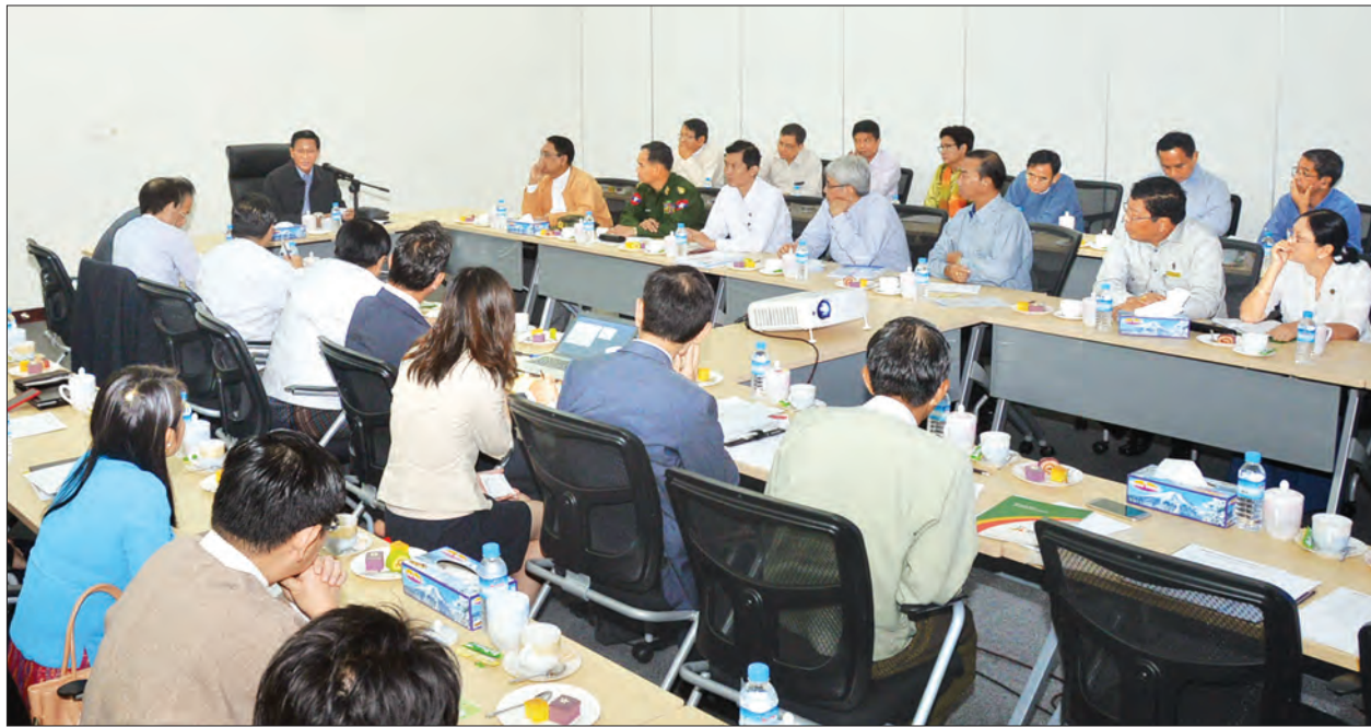
မြန်မာအထူးစီးပွားရေးဇုန် ပဟိုအဖွဲ့၊ ဥက္ကဋ္ဌ ဒုတိယသမ္မတ ဦးဟင်နရီဗိုလ်ထူး သီလဝါအထူးစီးပွားရေးဇုန် ရှင်းလင်းဆောင်တွင် တာဝန်ရှိသူများအားတွေ့ဆုံမှာကြားစဉ် (သတင်းစဉ်)