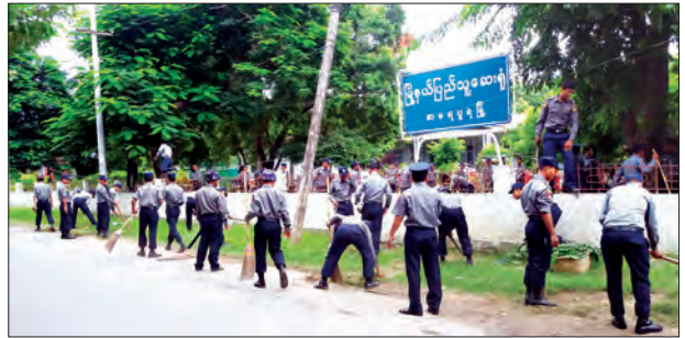
မြန်မာနိုင်ငံရဲတပ်ဖွဲ့နေ့ကို ဂုဏ်ပြုသောအားဖြင့် အမရပူရမြို့နယ် ခေတ္တမြို့နယ် ရဲတပ်ဖွဲ့မှူး၊ ရဲမှူး၊ ဝင်းဦး၊ ဒုတိယမြို့နယ်ရဲတပ်ဖွဲ့မှူး၊ ဒုတိယရဲမှူး၊ လှသူ၊ မြို့မရဲစခန်းမှူး၊ ဒုတိယရဲမှူး၊ မြင့်လွင်၊ မြစ်ငယ်နယ်မြေစခန်းမှူး၊ ရဲအုပ်အောင်မျိုးသန့်တို့ ဦးစီးသည့် တပ်ဖွဲ့ဝင်များ စက်တင်ဘာ ၁၇ ရက်က အမရပူရမြို့နယ် ပြည်သူ့ဆေးရုံကြီးအတွင်း အပြင်တို့၌ ပြည်သူ့အကျိုးပြုလုပ်ငန်းအဖြစ် ချွံနွယ်များအား ရှင်းလင်း၍ သန့်ရှင်းရေး ဆောင်ရွက်ခဲ့ခြင်းဖြစ်သည်။