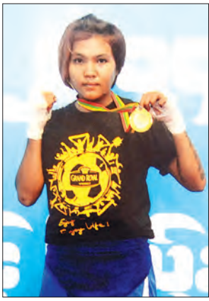
ရွှေစင်မင်း

ရန်ကုန် စက်တင်ဘာ ၁၇ အားကစားဝန်ကြီးဌာန မြန်မာနိုင်ငံရိုးရာလက်ဝှေ့အဖွဲ့ချုပ်က ကြီးမှူးပြီး မြန်မာမီဒီယာဂရု(ပ်)က စီစဉ်သည့် (၁၆)ကြိမ်မြောက် မျိုးဆက်သစ် မြန်မာ့ရိုးရာလက်ဝှေ့ပြိုင်ပွဲကို ယနေ့မနက် ၉ နာရီတွင် ရန်ကုန်မြို့၊ မင်္ဂလာတောင်ညွန့်မြို့နယ် သိမ်ဖြူရိုးရာလက်ဝှေ့အားကစားရုံ၌ ကျင်းပမည်ဖြစ်ရာ အထူးပွဲစဉ်များအဖြစ် ဩစတြေးလျနိုင်ငံသား တစ်ဦး ဝင်ရောက်ယှဉ်ပြိုင်ထိုးသတ်မည် ဖြစ်ပြီး မြန်မာအမျိုးသမီးလက်ဝှေ့ကျော်နှစ်ဦး ဝင်ရောက် ယှဉ်ပြိုင်ထိုးသတ်မည် တွဲဆိုင်းလည်းပါဝင်ကြောင်း သိရသည်။