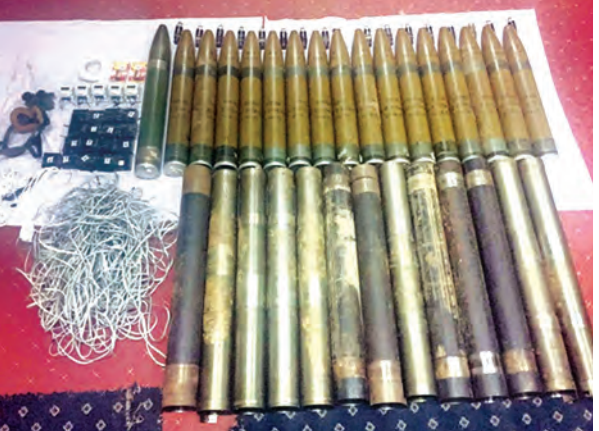
သိမ်းဆည်းရရှိသည့် ၁၀၇ မမ ဒုံးသီးများနှင့် ဆက်စပ်ပစ္စည်းများအား တွေ့ရစဉ် (မြဝတီ)