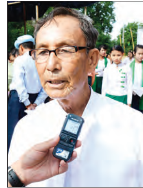
ဦးနိပွန်