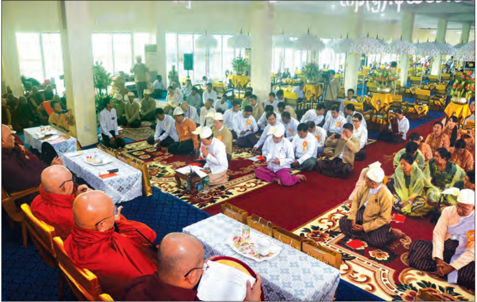
ဝန်ကြီးနှင့် အသင်းဥက္ကဋ္ဌတို့က လက်ခံယူကြပြီး ဂုဏ်ပြုဖတ်တမ်းလွှာ ပြန်လည်ပေးအပ်သည်။ အဘိဓမ္မာ(၇)ကျမ်း အာဂုံစာတော်ပြန်ဆိုပွဲကို ယနေ့မှ စက်တင်ဘာ ၁၁ ရက်အထိ ကျင်းပမည်ဖြစ်ပြီး သံဃာတော် ၁၆၈ ပါး၊ သီလရှင် အပါး ၁၂၀ နှင့် လူပုဂ္ဂိုလ် ၁၂၀ တို့ အာဂုံစာတော်ပြန်ဆိုပွဲကြိုတင်ပြုစုကြသည်။ (သတင်းစဉ်)

ထို့နောက် ဓမ္မဗိမာန်တော်ဆောက်လုပ်ရေးအတွက် အလှူရှင်များက အလှူငွေများကို ပေးအပ်လှူဒါန်းကြရာ ပြည်ထောင်စု