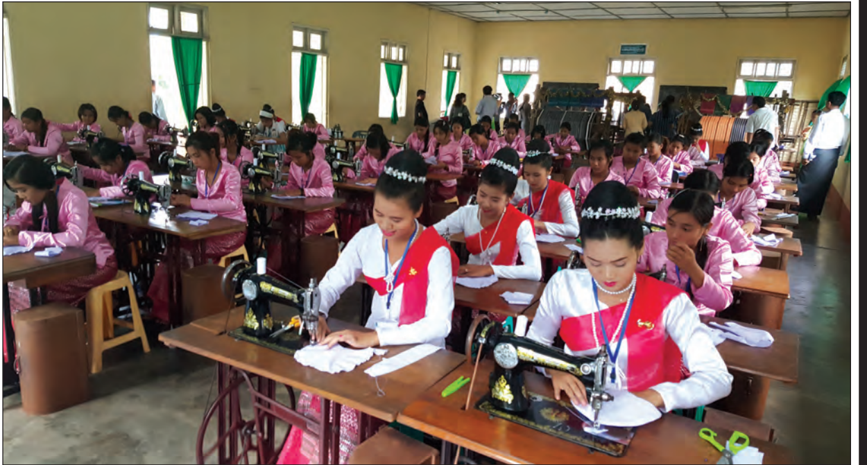
အမျိုးသမီးအိမ်တွင်းမှု သက်မွေးလုပ်ငန်း ပညာသင်တန်းကျောင်း(မုဒုံမြို့)

နယ်စပ်ရေးရာဝန်ကြီးဌာန ဒုတိယဝန်ကြီး ဝိုလ်ချုပ်သန်းထွဋ်၏ဖိတ်ကြားချက်အရ ဗီယက်နမ်ဆိုရှယ်လစ်သမ္မတနိုင်ငံ လူမျိုးစုရေးရာကော်မတီ (Committee for Ethnic Minorities Affairs)မှ ဒုတိယဥက္ကဋ္ဌ ဒုတိယဝန်ကြီး H.E Mr. Dinh Que Hai ဦးဆောင်သော ချစ်ကြည်ရေးကိုယ်စားလှယ်အဖွဲ့သည် ပြည်ထောင်စုသမ္မတမြန်မာနိုင်ငံတော်တွင် စက်တင်ဘာလ ၅ ရက်မှ ၁၀ ရက်အထိ လာရောက်လည်ပတ်ပြီး နေပြည်တော်၊ ရန်ကင်း၊ မော်လမြိုင်၊ ကျိုက္ခမီ၊ သံဖြူဇရပ်၊ မုဒုံ၊ ကျိုက်တုံနှင့် ပဲခူးမြို့များသို့ သွားရောက်ကြည့်ရှုလေ့လာခဲ့ကြသည်။ နယ်စပ်ရေးရာဝန်ကြီးဌာနနှင့် ဗီယက်နမ်ဆိုရှယ်လစ်သမ္မတနိုင်ငံ လူမျိုးစုရေးရာကော်မတီတို့အကြား ၂၀၀၀ ပြည့်နှစ် ဇူလိုင် ၂၈ ရက်နေ့က ချုပ်ဆိုခဲ့သော အကျိုးတူပူးပေါင်းဆောင်ရွက်ရေး သဘောတူစာချုပ်အရ နှစ်နိုင်ငံအကြား လူမျိုးစုရေးရာကော်မတီများတွင် သတင်းအချက်အလက်ဖလှယ်နိုင်ရေးအတွက် အပြန်အလှန်သွားရောက်ခဲ့ကြရာ ဗီယက်နမ်နိုင်ငံဘက်မှ ရှစ်ကြိမ်လာရောက်ခဲ့ပြီး မြန်မာနိုင်ငံဘက်မှ ခြောက်ကြိမ် သွားရောက်ခဲ့ပြီးဖြစ်သည်။