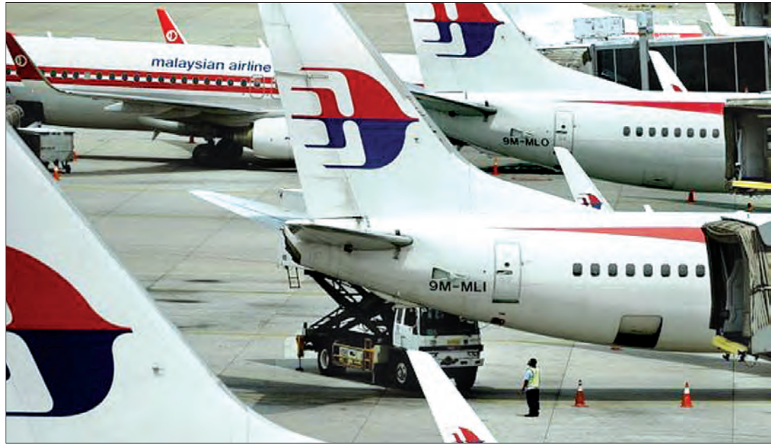
မလေးရှားလေကြောင်းလိုင်းမှ လေယာဉ်များကိုတွေ့ရစဉ်

အရေးတယူမလုပ်ဘဲ လျစ်လျူရှုခဲ့တယ်လို့ ပြောခဲ့တယ်။ လွန်ခဲ့တဲ့လကတော့ လေယာဉ် အပျက်အစီးအပိုင်းအစသုံးခုကို စစ်ဆေးခဲ့ပါ တယ်။ အကြီးဆုံးအပျက်အစီး အပိုင်းအစကိုတော့ တောင်အာဖရိက ဟိုတယ်လုပ်ငန်းရှင်တစ်ဦးက တွေ့ရှိခဲ့တာပဲဖြစ်ပါတယ်။ အဲဒီအပျက်အစီးဟာ ကြိုက်ပုံစံဖြစ်ပြီး သူ့ရဲ့မျက်နှာပြင်မှာ မလေးရှား လေကြောင်းလိုင်းရဲ့ အရောင်ဖြစ်တဲ့ အနီနဲ့အဖြူ ရောင်တို့ပါရှိတယ်။ စုံစမ်းစစ်ဆေးမှုတွေပြုလုပ်ဖို့ ဆိုပြီး အဲဒီအပျက်အစီးကို မလေးရှားကိုပို့ခဲ့ တယ်။ ဆွေမျိုးအချို့ကတော့ ရှာဖွေမှုပုံစံတွေ ကို မကျေနပ်ကြပါဘူး။ လေယာဉ်အပိုင်းအစ ထောင်ပေါင်းရာပေါင်းများစွာဟာ အိန္ဒိယသမုဒ္ဒရာ တစ်လျှောက် ဝေးလံလှတဲ့ကမ်းခြေတွေ သောင် တင်နေမှာကို သူတို့စိတ်ပူကြတယ်။ အဲဒီနေရာ တွေကိုသွားပြီး ရှာဖွေဖို့စီစဉ်ရတာလည်း မလွယ် ကူလှပါဘူး။ သူတို့စောဒကတက်ကြတာကတော့ အဲဒီနေရာတွေဟာသွားရောက်ဖို့ ဝေးကွာတာ မှန်ပေမယ့် ငါးဖမ်းသမားကဲ့သို့ ဒေသခံအချို့က တော့အပျက်အစီးတွေကို တွေ့ကောင်းတွေ့နိုင် တယ်။ သဲလွန်စတွေ ရှာတွေ့နိုင်တယ်ဆိုတဲ့ အချက်ပဲဖြစ်ပါတယ်။ အဲဒီတော့ သူတို့ကိုလေယာဉ် အပိုင်းအစတွေကို ဘယ်လိုရှာဖွေရမယ်။ တကယ်