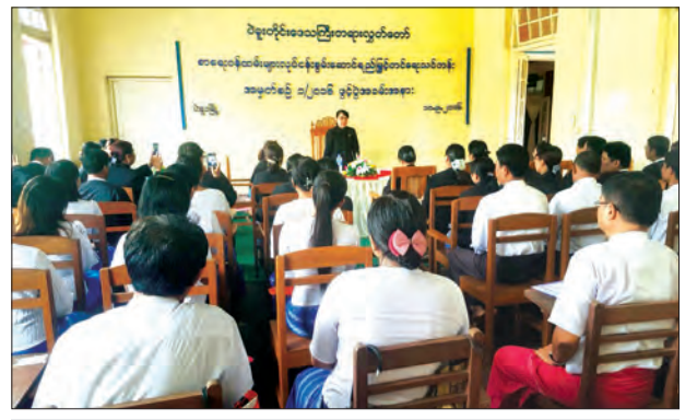
ပဲခူးတိုင်းဒေသကြီး တရားလွှတ်တော်နှင့် ခရိုင်အတွင်းရှိ မြို့နယ်တရားရုံးများမှ စာရေးဝန်ထမ်းများ လုပ်ငန်းစွမ်းဆောင်ရည်မြှင့်တင်ရေး သင်တန်းအမှတ်စဉ် (၁/၂၀၁၆) ဖွင့်ပွဲကို စက်တင်ဘာ ၁၀ ရက်က တိုင်းဒေသကြီးတရားလွှတ်တော် အစည်းအဝေးခန်းမ၌ကျင်းပရာ တိုင်းဒေသကြီးတရားလွှတ်တော်တရားသူကြီး ဒေါ်လွင်လွင်အေးကျော် တက်ရောက်အမှာစကားပြောကြားစဉ် သန့်စင်(ပဲခူး)

နေပြည်တော် စက်တင်ဘာ ၁၀ ပြည်သူ့လွှတ်တော်၊ စီးပွားရေးနှင့် ဘဏ္ဍာရေးဖွံ့ဖြိုးတိုးတက်ရေးကော်မတီဥက္ကဋ္ဌ ဦးခင်အေးသည် ဂျပန်နိုင်ငံအခြေစိုက် အာရှဒေသပတ်ဝန်းကျင် ကောင်းမွန်ရေး နည်းပညာပြန့်ပွားမှုအဖွဲ့မှ အမှုဆောင်ဒါရိုက်တာ Akio Kawakami နှင့်အဖွဲ့အား စက်တင်ဘာ ၉ ရက် မွန်းလွဲ ၂ နာရီ ၁၅ မိနစ်တွင် နေပြည်တော်ရှိ လွှတ်တော်အဆောက် အအုံရေးရာဆောင် အဆောင်အမှတ် (I-7) အစည်းအဝေးခန်းမ၌ တွေ့ဆုံသည်။ တွေ့ဆုံစဉ် ဂျပန်-မြန်မာသက်မွေးမှုပညာသင်တန်းကျောင်း (အောင်ဆန်း) စီမံကိန်းကို အမြန်ဆုံး အကောင်အထည်ဖော်နိုင်ရေးဆောင်ရွက်မှုများ၊ စီမံကိန်း နှင့်စပ်လျဉ်းပြီး လက်ရှိဆောင်ရွက်နေမှုအခြေအနေများနှင့် ဆက်လက်လုပ်ဆောင်ရမည့် စီမံကိန်းကိစ္စရပ်များကို ရင်းနှီးပွင့်လင်းစွာ ဆွေးနွေးခဲ့ကြသည်။ (သတင်းစဉ်)