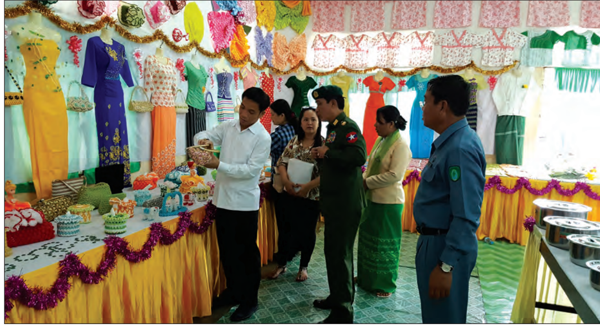
အမျိုးသမီးအိမ်တွင်းမှု သက်မွေးလုပ်ငန်း ပညာသင်တန်းကျောင်း(မုဒုံမြို့)

ဗီယက်နမ်ဆိုရှယ်လစ်သမ္မတနိုင်ငံ လူမျိုးစုရေးရာကော်မတီ (Committee for Ethnic Minorities Affairs)မှ ဒုတိယဥက္ကဋ္ဌ ဒုတိယဝန်ကြီး H.E Mr. Dinh Que Hai ဦးဆောင်သော ချစ်ကြည်ရေးကိုယ်စားလှယ်အဖွဲ့သည် စက်တင်ဘာ ၁၀ ရက် ညပိုင်းတွင် ဗီယက်နမ်နိုင်ငံသို့ ပြန်လည်ထွက်ခွာကြရာ နယ်စပ်ရေးရာဝန်ကြီးဌာန ဒုတိယဝန်ကြီးဝိုလ်ချုပ်သန်းထွဋ်နှင့် တာဝန်ရှိသူများက ရန်ကင်းပြည်ပြည်ဆိုင်ရာလေဆိပ်သို့ ပို့ဆောင်နှုတ်ဆက်ခဲ့ကြပါသည်။ မြန်မာ-ဗီယက်နမ် နှစ်နိုင်ငံချစ်ကြည်ရေးနိမိတ်ဆောင်ရေးအဖွဲ့မှ တိုင်းရင်းသားရေးရာဖွံ့ဖြိုးရေးလုပ်ငန်းများ၊ လူ့စွမ်းအားအရင်းအမြစ် ဖွံ့ဖြိုးရေးလုပ်ငန်းများ၊ တိုင်းရင်းသားယဉ်ကျေးမှု အပြန်အလှန်ဖလှယ်ရေးလုပ်ငန်းများကို အရှိန်အဟုန်ဖြင့် တိုးမြှင့်အကောင်အထည်ဖော်ဆောင်ရွက်ကြရန် နယ်စပ်ရေးရာဝန်ကြီးဌာနနှင့် ဗီယက်နမ်ဆိုရှယ်လစ်သမ္မတနိုင်ငံ လူမျိုးစုရေးရာကော်မတီ (Committee for Ethnic Minorities Affairs) တို့အကြား သဘောထားအမြင်ခြင်း တူညီကြပြီးဖြစ်သည်။ ရှေ့ဆက်လက်ဆောင်ရွက်ကြမည့် လုပ်ငန်းများကိုလည်း အလေးအနက်ထားကာ ဆောင်ရွက်ကြမည်ဖြစ်သည်။ ဤမည်သော တိုင်းရင်းသားရေးရာလုပ်ငန်းများက မြန်မာ-ဗီယက်နမ် နှစ်နိုင်ငံ ရင်းနှီးချစ်ကြည်ရေးကို များစွာအထောက်အကူပြုမည်ဟု အလေးအနက်ယုံကြည်မိပါကြောင်း။