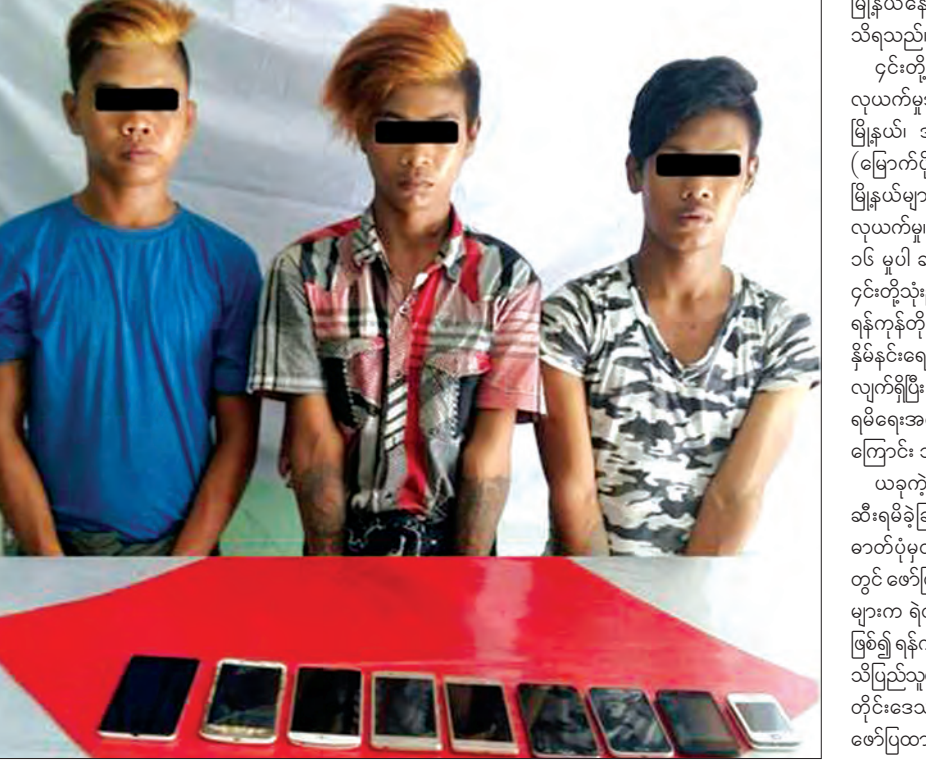
အဆိုပါ လုယက်မှုတွင် ဖမ်းမိသည့် အမှုများကို ဖော်ထုတ်ဖမ်းဆီးရမိခဲ့ခြင်းမှာ တာဝန်သိပြည်သူများက ၎င်းတို့၏ ဓာတ်ပုံမှတ်တမ်းများကို လူမှုကွန်ရက်စာမျက်နှာပေါ်တွင် ဖော်ပြပေးခြင်းနှင့် မြင်တွေ့သူ တာဝန်သိပြည်သူများက ရဲတပ်ဖွဲ့သို့ သတင်းများပေးပို့ခဲ့ခြင်းတို့ကြောင့် ဖြစ်၍ ရန်ကုန်တိုင်းဒေသကြီးရဲတပ်ဖွဲ့က အဆိုပါ တာဝန်သိပြည်သူများအား ကျေးဇူးတင်ရှိကြောင်းလည်း ရန်ကုန်တိုင်းဒေသကြီး ရဲတပ်ဖွဲ့၏ သတင်းထုတ်ပြန်ချက်တွင် ဖော်ပြထားသည်။

မြောက်ဥက္ကလာပမြို့နယ် (၄) ရပ်ကွက် သုဓမ္မာလမ်းမ ရှိ စည်းစိမ်ရှင်လက်ဖက်ရည်ဆိုင်၌ အဆိုပါ လူငယ်သုံးဦး ရောက်ရှိနေကြောင်း တာဝန်သိပြည်သူတစ်ဦး၏