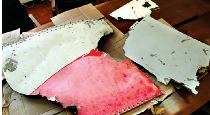
ပျောက်ဆုံးလေယာဉ် အပျက်အစီးများကို တွေ့ရစဉ်

ပြောခဲ့တယ်။ ဒါမှသာ ယုံကြည်လောက်တဲ့ သက်သေအထောက်အထား အသစ်တွေရရှိ ပြီး ရှာဖွေမှုတွေ ဆက်လုပ်နိုင်မှာပဲဖြစ်ပါတယ်။ “ရှာဖွေမှုတွေကို မထင်မရှားပြုလုပ်ခဲ့တယ်။ အဲဒီ အတွက်ကြောင့် ရှာဖွေမှုတွေရပ်တန့်လိုက်ဖို့ ဆုံးဖြတ်တဲ့အခါမှာ အခက်ကြုံလာတော့တာ ပါပဲ”လို့ ဂရစ်နသန်က ပြောပါတယ်။ သူဟာဒီခရီးစဉ်နဲ့ပတ်သက်ပြီး ခံစားမှု ပေါင်းစုံတွေ့နေတယ်လို့ ပြောပါတယ်။ လေယာဉ်ပျက်ကျတဲ့အထဲပါသွားတဲ့ လူတွေရဲ့ ဆွေမျိုးအချို့ကလည်း အခုလိုပဲစွပ်စွဲခဲ့ပါတယ်။ မလေးရှားအာဏာပိုင်တွေဟာ အာဖရိက ကမ်းရိုးတန်းတစ်လျှောက်မှာ သောင်တင်လာ တဲ့ သက်သေအထောက်အထားအသစ်တွေကို