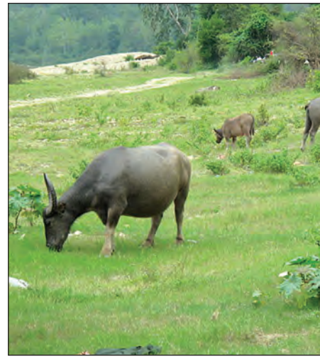
မြစ်ဆုံစီမံကိန်းရေယာအနီးမှ မွေးမြူရေးလုပ်ငန်းတစ်ခု (ဓာတ်ပုံ-ဝိကီပီးဒီးယား)

ဤနေရာတွင် မေမ-မလိခ မြစ်ဆုံစီမံကိန်းတွင် တည်ဆောက်မည့် ဧရာမမြစ်ဆုံတစ်ကြီးကို တရုတ်နိုင်ငံရှိဘက်က အိတ်တစ်ကြီးနှင့် နှိုင်းယှဉ်ကြည့်ရန် လိုအပ်မည်ဖြစ်သည်။ ကွာခြားချက်မှာ ဘက်ကီအိုတစ်ခုကို ပျိုးရေးအတွက်ဖြစ်ပြီး မြစ်ဆုံ