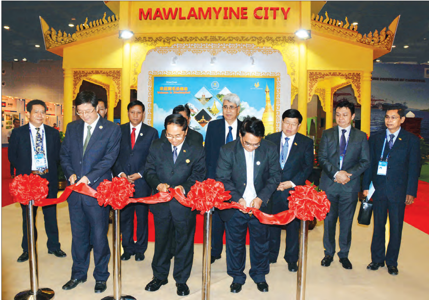
နန်နင်း စက်တင်ဘာ ၁၀

တရုတ်ပြည်သူ့သမ္မတနိုင်ငံ နန်နင်းမြို့၌ ရောက်ရှိနေသော ဒုတိယသမ္မတ ဦးမြင့်ဆွေသည် ယနေ့နံနက်ပိုင်းတွင် တရုတ်နိုင်ငံ ချင်းရှူးတောင်ရှိ ဗုဒ္ဓဘုရားကျောင်းသို့ သွားရောက်ဖူးမြော်ကြည်ညိုပြီး ကျောင်းထိုင်ဘုန်းတော်ကြီးအား ဂါရဝပြုကာ လှူဖွယ်ပစ္စည်းများ လှူဒါန်းသည်။