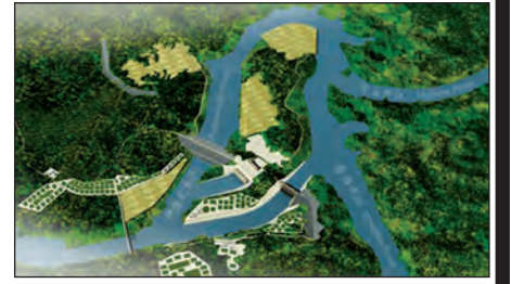
မြန်မာ့ဆည်ပုံစံကွန်ပျူတာဒီဇိုင်း

ကနဦးညှိနှိုင်းချက်များအရ မူလက မြစ်ဆုံရေအားလျှပ်စစ် စီမံကိန်းမှာ မီဂါဝပ် ၄၀၀၀ သာဖြစ်သော်လည်း ၂၀၀၉ ခုနှစ် စာချုပ်အရ မြစ်ဆုံတစ်ခုအမြင့်မှာ ပေ ၄၅၀ ကျော်ရှိပြီး တပ်ဆင်မည့်စက်အင်အားမှာ မီဂါဝပ် ၆၀၀၀ ဖြစ်လာခဲ့သည်။ တပ်ဆင်မည့်စက်အင်အားမှာ ၇၅၀ မီဂါဝပ်ဖြစ်ရာ ကမ္ဘာပေါ်တွင် အကြီးမားဆုံးသော ရေအားလျှပ်စစ်စက်ရုံဖြစ်သည့် တရုတ်နိုင်ငံ မြစ်ကျွန်းသုံးသွယ်ရေအားလျှပ်စစ်စက်ရုံ၌ တပ်ဆင်ထားသောစက်တစ်လုံးစီ၏ အင်အားထက်ပင် ၅၀ မီဂါဝပ်စီ ပိုမိုအင်အားကောင်းမည်သဘော ဖြစ်သည်။