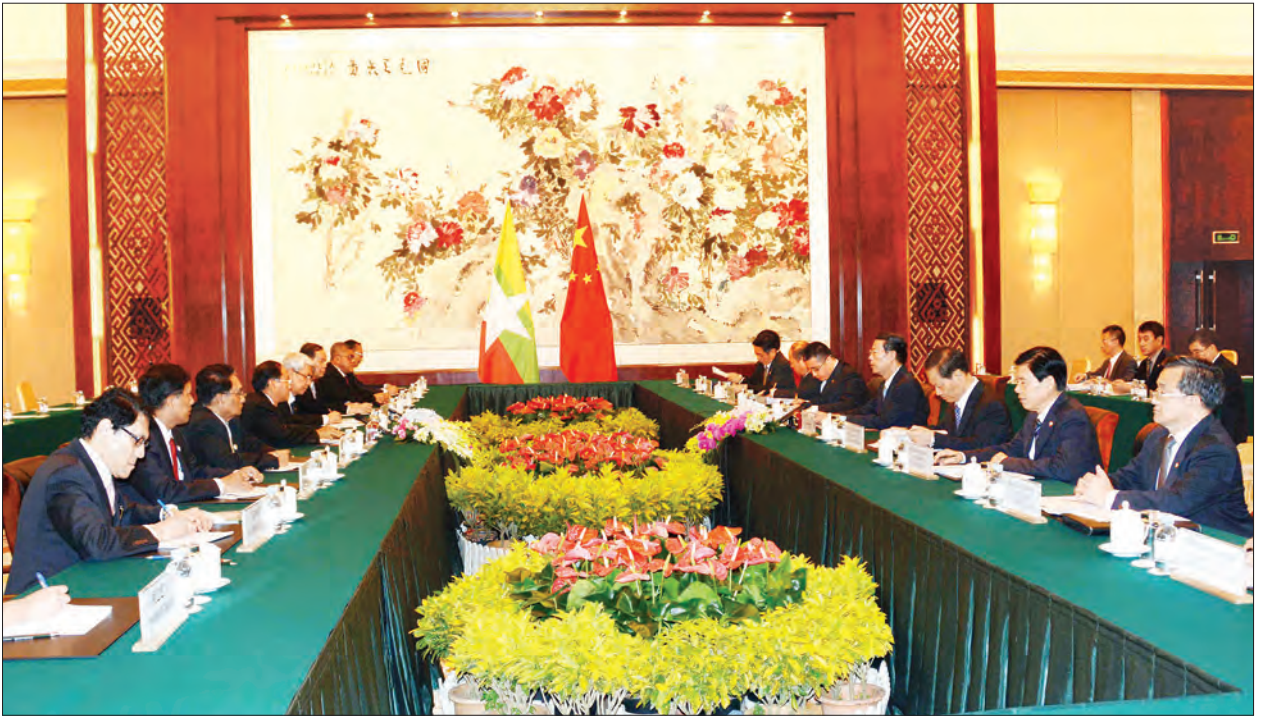
ဒုတိယသမ္မတ ဦးမြင့်ဆွေနှင့် တရုတ်ပြည်သူ့သမ္မတနိုင်ငံ ဒုတိယဝန်ကြီးချုပ် မစ္စတာ ကျန်းကောင်းလိတို့ လိယွမ်အစိုးရဌာနတွင် တွေ့ဆုံဆွေးနွေးစဉ်

သွားမည်ဖြစ်ကြောင်း မြန်မာနိုင်ငံတော် အစိုးရ၏ ပြည်တွင်းငြိမ်းချမ်းရေး ကြိုးပမ်း မှုများနှင့် ပြည်ထောင်စုငြိမ်းချမ်းရေး ညီလာခံ-(၂၀) ရာစုပင်လုံ အောင်မြင်စွာ ကျင်းပနိုင်ခဲ့ခြင်းတို့အတွက် တရုတ်နိုင်ငံ အနေဖြင့် ဝမ်းမြောက်ကြောင်းပြောကြား ရာ ဒုတိယသမ္မတကလည်း တရုတ်- အာဆီယံကုန်စည်ပြင်ပတွင် စီးပွားရေးနှင့် ရင်းနှီးမြှုပ်နှံမှု ထိပ်သီးအစည်းအဝေး သည် တစ်နှစ်ထက်တစ်နှစ် ပိုမိုတိုးတက် အောင်မြင်လာပါကြောင်း၊ မြန်မာနိုင်ငံ အနေဖြင့် ဆက်လက်၍ တက်ကြွစွာ ပူးပေါင်းပါဝင် ဆောင်ရွက်သွားမည် ဖြစ်ကြောင်း ပြန်လည်ပြောကြားပြီး နှစ်နိုင်ငံ ချစ်ကြည်ရင်းနှီးမှုတိုးမြှင့် ဖော်ဆောင်ရေးကိစ္စရပ်များကို ဆက် လက် ဆွေးနွေးခဲ့ကြသည်။ တွေ့ဆုံပွဲအပြီးတွင် ဒုတိယသမ္မတ သည် တရုတ်ပြည်သူ့သမ္မတနိုင်ငံ ဒုတိယ ဝန်ကြီးချုပ်က တည်ခင်းဆောင်ရွက်ခဲ့သည့် ဂုဏ်ပြုညစာစားပွဲသို့ တက်ရောက် ခဲ့သည်။ (သတင်းစဉ်)