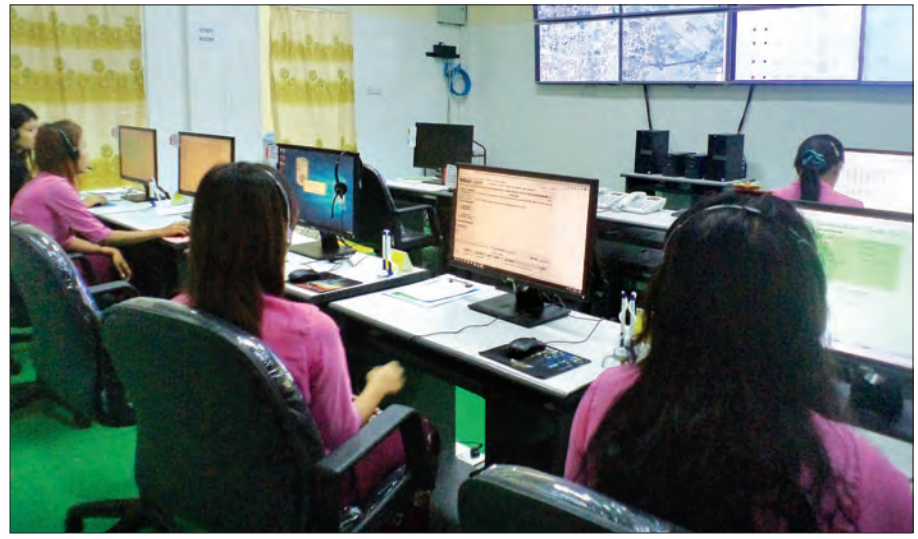
ရန်ကုန်- မန္တလေးအမြန်လမ်းမကြီးပေါ်၌ ယာဉ်မတော်တဆမှုကြောင့် ထိခိုက်ဒဏ်ရာရရှိမှုဖြစ်ပါက အရေးပေါ် အသက်ကယ်ဆယ်နိုင်မည့် အရေးပေါ်လူနာတင်ယာဉ်များအား ကွပ်ကဲထိန်းချုပ်သည့် Call Centre ၌ လုပ်ငန်းဆောင်ရွက်နေမှုကို တွေ့ရစဉ်

ရက်က စတင်ဆောင်ရွက်လျက်ရှိသည်။ “ဒီစနစ်ဖြစ်ပေါ်လာဖို့အတွက် မြန်မာနိုင်ငံအရေးပေါ်လူနာတင်ယာဉ်စနစ် ပေါ်ပေါက်ရေး အမျိုးသားအဆင့်