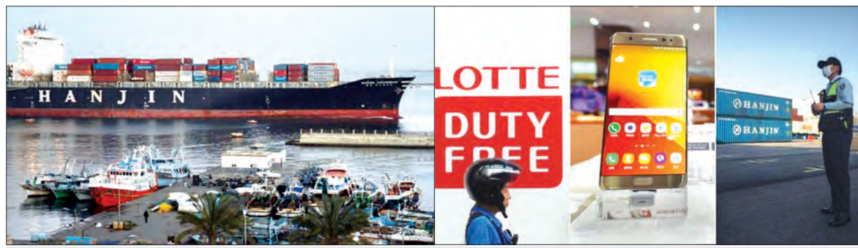
ကိုရီးယားကုမ္ပဏီအုပ်စုကြီး ချေးဘိုးက လုပ်ကိုင်ဆောင်ရွက်သည့် လုပ်ငန်းစုများ

မြင်နေတွေ့နေရတာကတော့ ချေးဘိုး (Chaebol) လို့ခေါ်တဲ့ ကိုရီးယားကုမ္ပဏီအုပ်စုကြီးတွေဟာ ခလုတ်တံသင်းများတွဲလမ်းကို ဖြတ်ကျော်နေရပုံပါပဲ။ တိတိကျကျပြောရရင် ကိုရီးယားသုတေသနကော်မရှင်ချုပ်ကိုင်ထားတဲ့ ချေးဘိုးကုမ္ပဏီအုပ်စုကြီးသုံးခုဟာ လက်ရှိမှာ အခက်အခဲတွေနဲ့ ရင်ဆိုင်နေရပါတယ်။ ဒီချေးဘိုး ကုမ္ပဏီအုပ်စုကြီးတွေကတော့ ဆမ်ဆောင်၊ လော့တီး (Lotte) နဲ့ ဟန်းဂျင် (Hanjin) သင်္ဘောလုပ်ငန်းတွေပါ။ အက်ပဲလ် (Apple) ဖုန်းနဲ့ပန်းချင်းယှဉ်ပြီး ဈေးကွက်ပြိုင်လှမယ်လို့ စီစဉ်ထားတဲ့ Galaxy Note 7 က မထင်မှတ်ထားတဲ့ ဘက်ထရီမီးလောင်တဲ့ကိစ္စ ရင်ဆိုင်ခဲ့ရပါတယ်။ ဟန်းဂျင်သင်္ဘောလုပ်ငန်းကလည်း ဒေဝါလီခံလုနီးနီးဖြစ်နေတာပါ။ ကြေးရှင်တွေက ဟန်းဂျင်သင်္ဘောလုပ်ငန်းပိုင်သင်္ဘောတွေ သိမ်းယူတာမျိုးမလုပ်နိုင်အောင် အခုလောလောဆယ်မှာ တရားရုံးက ဟန်းဂျင်ကားကွယ်ထားပေးတာပါ။