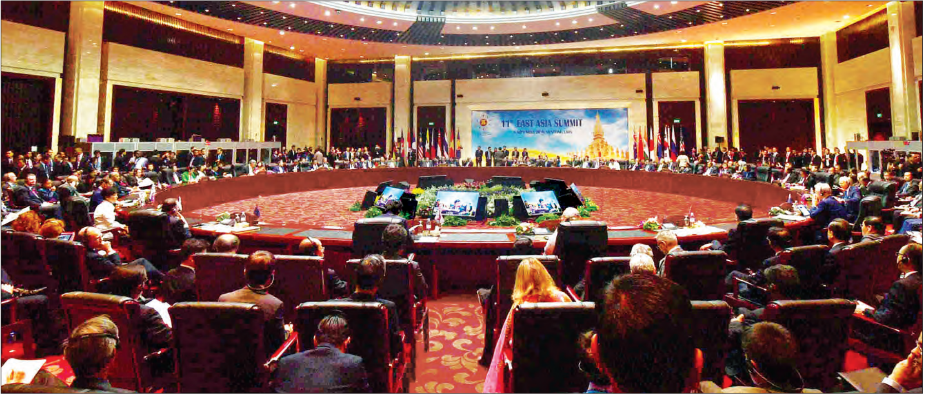
(၁၁)ကြိမ်မြောက် အရှေ့အာရှထိပ်သီးအစည်းအဝေး ကျင်းပစဉ်