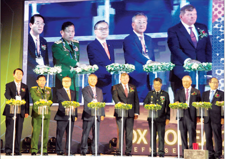
Defence Expo Korea 2016 ပြပွဲ ဖွင့်ပွဲအခမ်းအနား ကျင်းပစဉ်

ကျောခုံးမှ စနစ်မကျတဲ့ မန္တလေးဆိပ်ကမ်းမှာ အများကြီး စနစ်ကျလာမှာပါ။ သဲစုတဲ့နေရာ၊ ခရီးသည် ဆိပ်ကမ်းနေရာ၊ ကုန်တင်ကုန်ချဆိပ် စတဲ့ လုပ်ငန်းအုပ်စုအလိုက် နေရာသတ်သတ်မှတ်မှတ်ရှိလာမယ်။ လုပ်ငန်းလုပ်သူတွေလည်း အဆင်ပြေလာမယ်” ဟု ၎င်းက ပြောသည်။ အဆိုပါကော်မတီသည် ဆိပ်ကမ်းများတွင် လုပ်ငန်းသဘာဝအလိုက် နေရာချထားပေးမည်ဖြစ်၍ ကော်မတီတွင် လုပ်ငန်းတာဝန် ရှစ်ခုပါဝင်ပြီး ဆိပ်ကမ်းများ၊ ဆိပ်ခံများ၊ ဖွံ့ဖြိုးတိုးတက်ရေးနှင့် စီးပွားရေးဖွံ့ဖြိုးတိုးတက်ရေး အထောက်အကူ