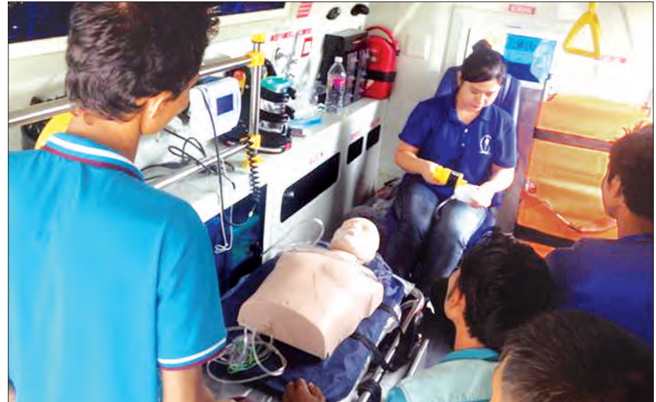
အရေးပေါ်လူနာတင်ယာဉ်ပေါ်၌ အသက်ကယ်ပြုစုကုသနည်း သင်ကြားပြသနေသည်ကို တွေ့ရစဉ်