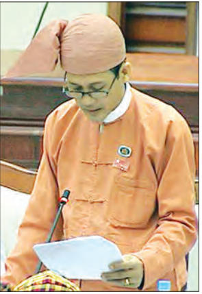
မိုးကောင်းမဲဆန္ဒနယ်မှ လွှတ်တော်ကိုယ်စားလှယ် ဦးဝင်းနိုင်

နိုင်ငံ၏ ဗဟိုအချက်အချာ အလယ်ဗဟိုတွင်ရှိသည့်အတွက် အထက်ဒေသများ ဖြစ်သည့် ကချင်၊ ရှမ်းစသည့်ဒေသများ၌ လည်းကောင်း၊ အောက်ပိုင်းဒေသများ ဖြစ်သည့် တနင်္သာရီတိုင်းဒေသကြီးနှင့် အခြားဒေသများသည် နေပြည်တော်သို့ လွယ်ကူချောမွေ့စွာ သွားလာနိုင်ပါကြောင်း၊ လက်ရှိအခြေအနေတွင် တိုင်းဒေသကြီးတရားလွှတ်တော်နှင့် ပြည်နယ်တရားလွှတ်တော်များ ရုံးထိုင်ရာဒေသ ဖြစ်သည့် မန္တလေးမြို့နှင့် ရန်ကုန်မြို့များတွင် ရုံးထိုင်စစ်ဆေးရန် အစီအစဉ်မရှိသေးပါကြောင်း ဖြေကြားသည်။ မိုးကောင်းမဲဆန္ဒနယ်မှ လွှတ်တော်ကိုယ်စားလှယ် ဦးဝင်းနိုင်၏ မြစ်ကြီးနား-မန္တလေးလမ်းပိုင်းတွင် စုန်/ဆန် ပြေးဆွဲလျက်ရှိသည့် မြန်မာ့မီးရထားမှ လူစီးတဲ့များအား ပိုမိုကောင်းမွန်သည့် တွဲဆိုင်များဖြင့် အစားထိုးပေးရန်နှင့် မီးရထားဝန်ထမ်းများအတွက် ပြည်သူ့ဆက်ဆံရေးသင်တန်းများ ဖွင့်လှစ်ပေးရန် အစီအစဉ်ရှိ/မရှိ မေးခွန်းနှင့်စပ်လျဉ်း၍ ပို့ဆောင်ရေးနှင့် ဆက်သွယ်ရေးဝန်ကြီးဌာနမှ ပြည်ထောင်စုဝန်ကြီး ဦးသန့်စင်မောင်က မြစ်ငယ်စက်ရုံမှ အသစ်တည်ဆောက်