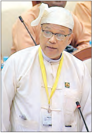
ပြည်ထောင်စုဝန်ကြီး ဦးသန့်စင်မောင်

နေပြည်တော် စက်တင်ဘာ ၈ ပြည်သူ့လွှတ်တော် ဒုတိယပုံမှန်အစည်းအဝေး ၂၉ ရက်မြောက်နေ့ကို ယနေ့နံနက် ၁၀ နာရီတွင်ကျင်းပရာ မေးခွန်းသုံးခု မေးမြန်းဖြေကြားခြင်း၊ ဥပဒေကြမ်းတစ်ခု တင်သွင်းခြင်းတို့ကို ဆောင်ရွက်ခဲ့ကြသည်။ အစည်းအဝေးတွင် ပုဇွန်တောင် မဲဆန္ဒနယ်မှ လွှတ်တော်ကိုယ်စားလှယ် ဦးမြင့်လွင်၏ ပြည်ထောင်စုတရား လွှတ်တော်ချုပ်သည် တရားမ ဒုတိယ အယူခံမှု/ ပြင်ဆင်မှု/ ရာဇဝတ် အယူခံမှု/ ပြင်ဆင်မှု (တစ်ပါးထိုင်) အမှုများကို အထက်မြန်မာပြည်အတွက် မန္တလေးမြို့နယ်လည်းကောင်း၊ အောက်မြန်မာပြည်အတွက် ရန်ကုန်မြို့နယ်လည်းကောင်း ရုံးထိုင်စစ်ဆေးပေးရန် အစီအစဉ်ရှိ/မရှိ မေးခွန်းနှင့်စပ်လျဉ်း၍ ပြည်ထောင်စုတရားလွှတ်တော်ချုပ် တရားမသူကြီး ဦးစိုးညွန့်က ပြည်ထောင်စုတရားစီရင်ရေးဥပဒေပုဒ်မ ၁၀ တွင် ပြည်ထောင်စုတရားလွှတ်တော်ချုပ်သည် နေပြည်တော်တွင် ရုံးထိုင်ရမည်ဟု ပြဋ္ဌာန်းထားပါကြောင်း၊ ပြည်ထောင်စုတရားလွှတ်တော်ချုပ်သည် နိုင်ငံတော်၏