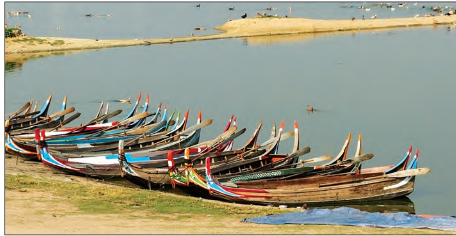
နေရာသီကာလတွင် သဲသောင်များပေါ်ထွန်းနေသော မင်းကွန်းမြို့အနီး ရောဂါပိုးပိုးပိုင်တစ်နေရာ

ချင်းတွင်းမြစ် လာရောက်ပေါင်းဆုံစီးဝင်ရာ နေရာမှစ၍ မြစ်ဝကျွန်းပေါ်ဒေသမရောက်မီ ဟင်္သာတမြို့အထိ မြစ် ကြောင်း တစ်လျှောက်မှာ ရောဂါပိုးပိုးပိုင်အောက်ပိုင်း ဒေသပင် ဖြစ်သည်။ ရောဂါပိုးပိုးပိုင်အောက်ပိုင်းဒေသ မြစ်ကမ်း ဘေးဝဲယာတွင် မြင်းခြံ၊ ပခုက္ကူ၊ ပုဂံ-ညောင်ဦး၊ ချောက်၊ ရေနံ ချောင်း၊ မင်းဘူး၊ မကွေး၊ သရက်၊ အောင်လံ၊ ပြည်၊ ပန်း တောင်း၊ ကြံခင်း၊ မြန်အောင် စသောမြို့ကြီးများ တည်ရှိကြ သည်။ ရောဂါပိုးပိုးပိုင်အောက်ပိုင်း မြစ်ကြောတစ်လျှောက်တွင် လက်ယာဘက်မှ ယောချောင်း၊ စလင်းချောင်း၊ မန်းချောင်း၊ မုန်းချောင်း၊ မင်းတုန်းချောင်း စသည်တို့ကလည်းကောင်း၊ လက်ဝဲဘက်မှ ယင်းချောင်း၊ ပင်းချောင်း၊ ဘွက်ကြီးချောင်း၊ မြောက်နဝင်းချောင်း၊ တောင်နဝင်းချောင်း စသည်တို့က