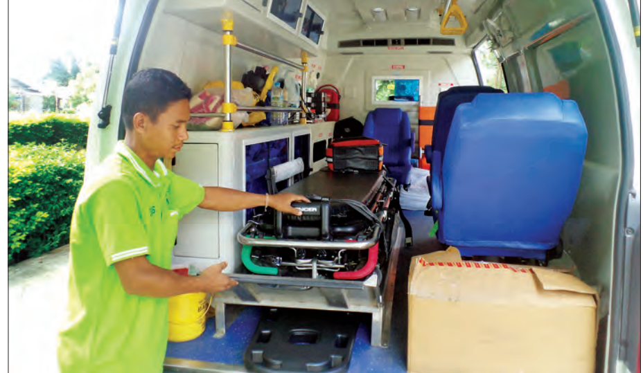
ရန်ကုန်- မန္တလေးအမြန်လမ်းမကြီးပေါ်၌ ယာဉ်မတော်တဆမှုကြောင့် ထိခိုက်ဒဏ်ရာရရှိမှုဖြစ်ပါက အရေးပေါ် အသက်ကယ်ဆယ်နိုင်မည့် အရေးပေါ်လူနာတင်ယာဉ်ကို တွေ့ရစဉ်

“၂၀၁၆ ခုနှစ် လလယ်ပိုင်းလောက်ကတည်းက Call Centre မှာ တာဝန်ထမ်းဆောင်ခဲ့ပါတယ်။ အဲဒီမှာ အနှောင့်အယှက်ပေးတဲ့ Call တွေကို အများဆုံးဖြေရှင်းနေရပါတယ်။ အရေးပေါ်ကိစ္စတွေဖြစ်တဲ့အတွက် အနှောင့်အယှက်ပေးတဲ့ Call တွေ မခေါ်ဆိုသင့်ပါဘူး။ ကျွန်မတို့ အဖွဲ့အနေနဲ့ မှန်ကန်တဲ့သတင်းတွေကို မြန်မြန်ဆန်ဆန်ဖြစ်စေမှာ အရေးကြီးပါတယ်။”