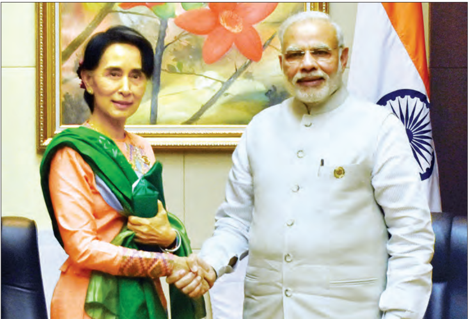
နိုင်ငံတော်၏အတိုင်ပင်ခံပုဂ္ဂိုလ် ဒေါ်အောင်ဆန်းစုကြည် အိန္ဒိယနိုင်ငံဝန်ကြီးချုပ် မစ္စတာ နာရင်ဒရာမိုဒီအား ရင်းရင်းနှီးနှီးနှုတ်ဆက်စဉ် (သတင်းစဉ်)

များ ပိတ်ပွဲအခမ်းအနားနှင့် ၂၀၁၇ ခုနှစ် အာဆီယံအလှည့်ကျ ဥက္ကဋ္ဌတာဝန်ထမ်းဆောင်မည့် ဖိလစ်ပိုင်သမ္မတနိုင်ငံသို့ အာဆီယံဥက္ကဋ္ဌ တာဝန်လွှဲပြောင်းပေးအပ်ခြင်း အခမ်းအနားများ ဆက်လက်ကျင်းပခဲ့ကြောင်း သိရသည်။ (သတင်းစဉ်)