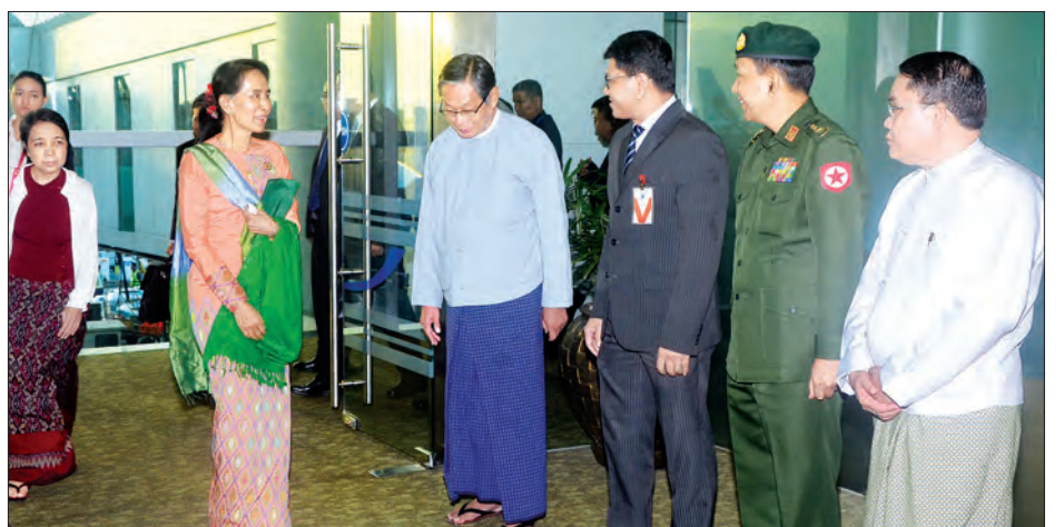
နိုင်ငံတော်၏အတိုင်ပင်ခံပုဂ္ဂိုလ် ဒေါ်အောင်ဆန်းစုကြည် ရန်ကုန်မြို့သို့ ပြန်လည်ရောက်ရှိရာ ပြည်ထောင်စုဝန်ကြီး ဦးကျော်တင့်ဆွေ၊ ရန်ကုန်တိုင်းဒေသကြီး ဝန်ကြီးများနှင့် တာဝန်ရှိသူများက ကြိုဆိုနှုတ်ဆက်ကြစဉ် (သတင်းစဉ်)

ထို့နောက် နိုင်ငံတော်၏ အတိုင်ပင်ခံပုဂ္ဂိုလ်သည် ညနေ ၅ နာရီခွဲတွင် ရန်ကုန်မြို့သို့ ပြန်လည်ရောက်ရှိရာ နိုင်ငံတော် အတိုင်ပင်ခံရုံးဝန်ကြီးဌာန ပြည်ထောင်စုဝန်ကြီး ဦးကျော်တင့်ဆွေ၊ ရန်ကုန်တိုင်းဒေသကြီး ဝန်ကြီးများ၊ မြန်မာနိုင်ငံဆိုင်ရာ လာအို သံရုံးယာယီတာဝန်ခံနှင့် နိုင်ငံခြားရေးဝန်ကြီးဌာနမှ တာဝန်ရှိသူများက ရန်ကုန်အပြည်ပြည်ဆိုင်ရာလေဆိပ်၌ ကြိုဆိုနှုတ်ဆက်ကြသည်။