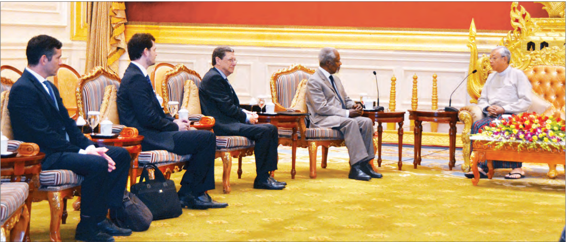
နိုင်ငံတော်သမ္မတ ဦးထင်ကျော် ကုလသမဂ္ဂအတွင်းရေးမှူးချုပ်ဟောင်း ရခိုင်ပြည်နယ်ဆိုင်ရာ အကြံပေးကော်မရှင်ဥက္ကဋ္ဌ မစ္စတာ ကိုဖီအာနန်အား လက်ခံတွေ့ဆုံစဉ် (သတင်းစဉ်)

မစ္စတာ ကိုဖီအာနန်၏ ကျွမ်းကျင်သည့်ခေါင်းဆောင်မှုဖြင့် ပြဿနာကို ချဉ်းကပ်ဖြေရှင်းနိုင်မည်ဟု ယုံကြည်