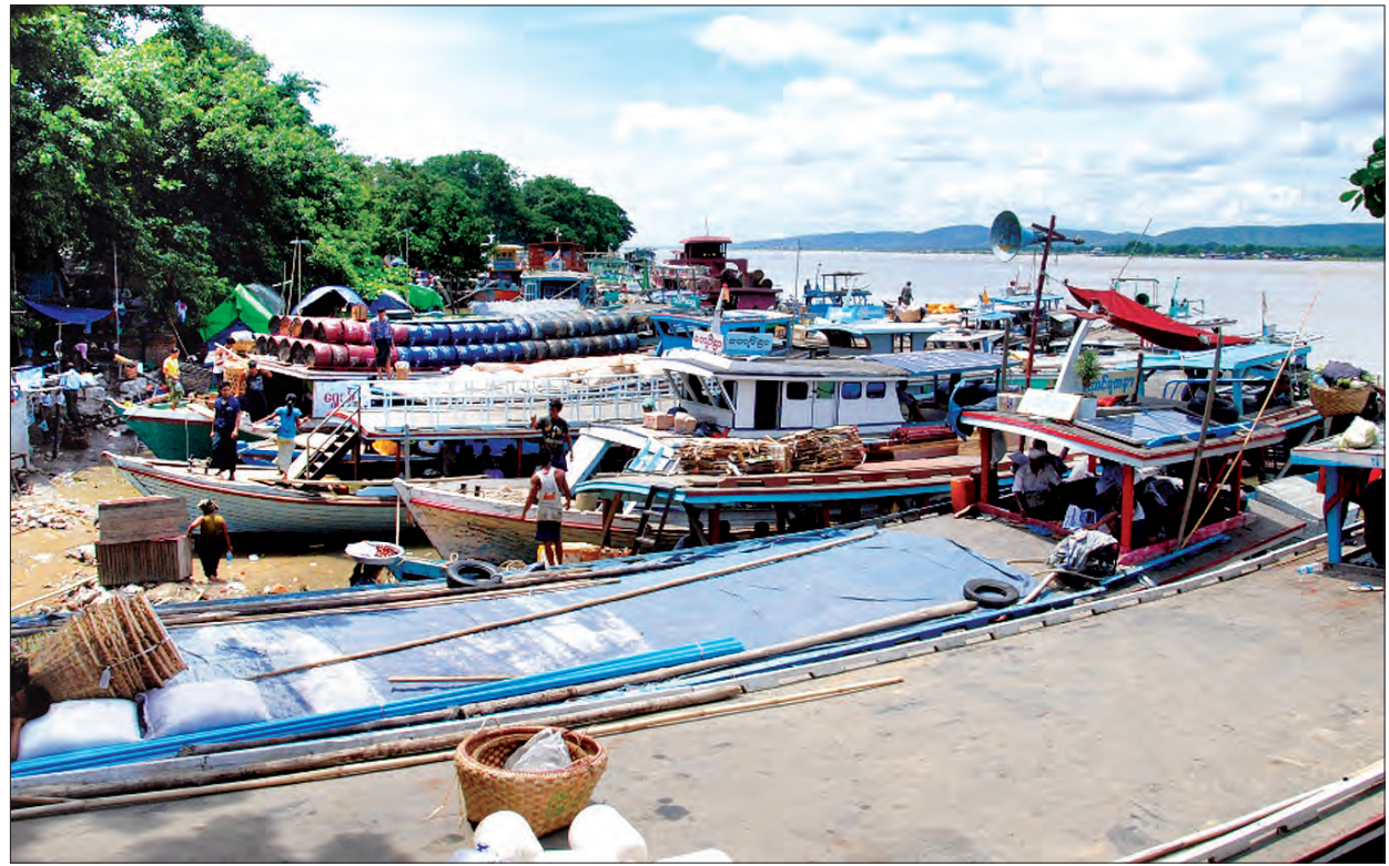
မန္တလေးမြို့၊ ဧရာဝတီမြစ် ဆိပ်ကမ်းတစ်နေရာကို တွေ့ရစဉ်