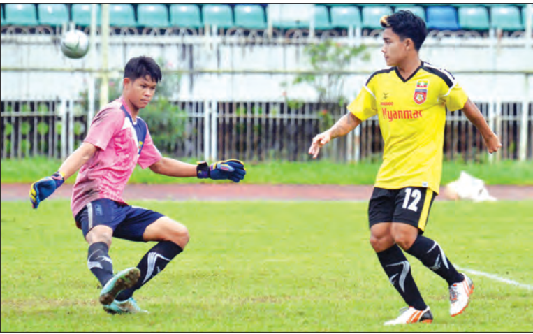
မြန်မာယူ-၁၉ အသင်း ပြိုင်ပွဲမတိုင်မီ လေ့ကျင့်နေစဉ်

ရန်ကုန် စက်တင်ဘာ ၈ ဗီယက်နမ်နိုင်ငံ၌ ကျင်းပမည့် ၂၀၁၆ အာဆီယံ ယူ-၁၉ ဘောလုံးပြိုင်ပွဲယှဉ်ပြိုင်ရန် မြန်မာ ယူ-၁၉ အသင်း သည် အပြီးသတ်ကစားသမား ၂၃ ဦး ရွေးချယ်လိုက်ပြီဖြစ်သည်။ ယင်းပြိုင်ပွဲကို စက်တင်ဘာ ၁၁ ရက်မှ ၂၄ ရက်အထိ ဟန့်ဗွန်းမြို့၌ ကျင်းပမည် ဖြစ်ပြီး မြန်မာအသင်း သည် အုပ်စု(ခ)တွင် လက်ရှိချန်ပီယံ ထိုင်း၊ ဩစတြေးလျ၊ လာအို၊ ကမ္ဘောဒီးယား၊ အင်ဒိုနီးရှားအသင်း တို့နှင့်အတူ ပါဝင်လျက်ရှိသည်။ အုပ်စု (က)တွင် အိမ်ရှင် ဗီယက်နမ်၊ မလေးရှား၊ တီမော၊ စင်ကာပူနှင့် ဖိလစ်ပိုင်အသင်းတို့ ပါဝင်လျက်ရှိသည်။ အုပ်စုပွဲစဉ်များကို စက်တင်ဘာ ၁၁ ရက်မှ ၂၀ ရက်အထိ ကျင်းပ မည်ဖြစ်ပြီး ဆီမီးဖိုင်နယ်ပွဲစဉ်များကို စက်တင်ဘာ ၂၂ ရက် တတိယနေရာလှည့်နှင့် ဗိုလ်လှည့်ကို စက်တင်ဘာ ၂၄ ရက်တွင် ကျင်းပမည်ဖြစ်သည်။ မြန်မာအသင်းသည် အုပ်စုကျပ်အတွင်း ကျရောက်နေသလို ခြောက်သင်း ပါဝင်သည့် အုပ်စုဖြစ်သော ကြောင့် အုပ်စုပွဲများကို တစ်ရက်ခြားတစ်ပွဲ ကစားရမည်ဖြစ်သည်။ မြန်မာယူ-၁၉ အသင်းသည် အုပ်စုပွဲများအဖြစ် စက်တင်ဘာ ၁၂ ရက်တွင် အင်ဒိုနီးရှား၊ စက်တင်ဘာ ၁၄ ရက်တွင် ဩစတြေးလျ၊ စက်တင်ဘာ ၁၆ ရက်တွင် လာအိုအသင်း၊ စက်တင်ဘာ ၁၈ ရက်တွင် ကမ္ဘောဒီးယား စာမျက်နှာ ၅ ကော်လံ ၆ ❖