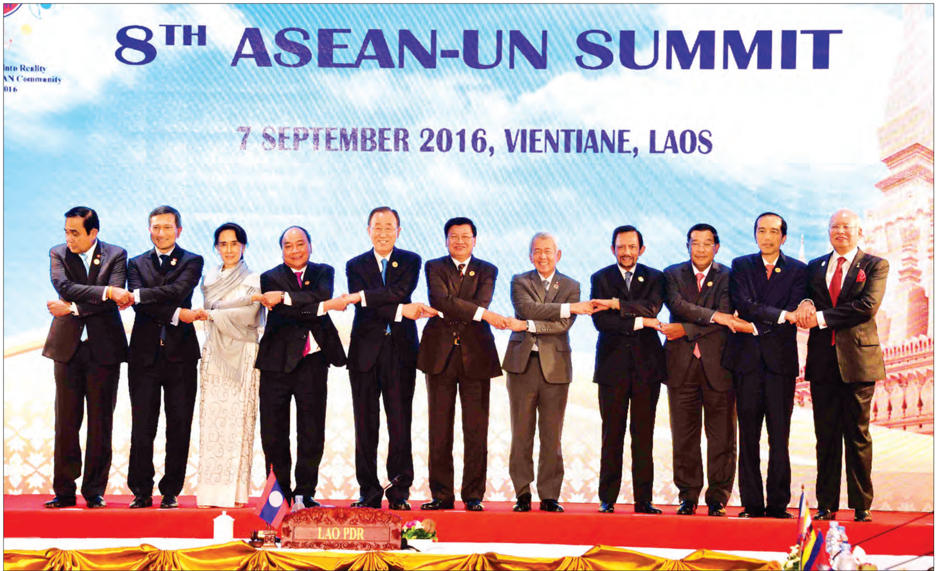
(၈)ကြိမ်မြောက် အာဆီယံ-ကုလသမဂ္ဂ ထိပ်သီးအစည်းအဝေးတွင် ကုလသမဂ္ဂအတွင်းရေးမှူးချုပ်၊ အာဆီယံနိုင်ငံများနှင့် ဆွေးနွေးဖက်နိုင်ငံများမှ နိုင်ငံကြီးအကဲများ စုပေါင်းမှတ်တမ်းတင်ဓာတ်ပုံရိုက်စဉ်