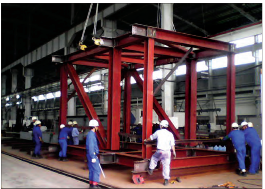
အားလုံး မြန်မာနိုင်ငံက ထုတ်လုပ်တဲ့ သံမဏိသံပေါင်တွေနဲ့ တည်ဆောက်နိုင်ပါပြီ။ အဆင့်မြင့်တံတားတွေအတွက်ပါ

“လွန်ခဲ့တဲ့ဝါးနှစ်က တင်ဒါခေါ်ရင် တရုတ်နိုင်ငံ ကုမ္ပဏီတွေက တင်ဒါအောင်တာများတယ်။ တရုတ်က ထုတ်လုပ်တဲ့