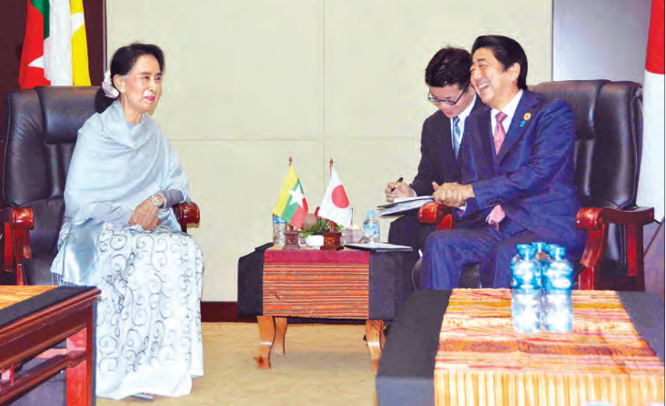
နိုင်ငံတော်၏အတိုင်ပင်ခံပုဂ္ဂိုလ် ဒေါ်အောင်ဆန်းစုကြည်နှင့် ဂျပန်နိုင်ငံဝန်ကြီးချုပ် H.E.Mr. Shinzo Abe တို့ တွေ့ဆုံဆွေးနွေးစဉ်

ပင်ခံပုဂ္ဂိုလ်နှင့် ဂျပန်နိုင်ငံဝန်ကြီးချုပ် H.E.Mr. Shinzo Abe တို့ တွေ့ဆုံစဉ် မြန်မာနိုင်ငံ၏ စိုက်ပျိုးရေးကဏ္ဍနှင့် ဆင်းရဲနွမ်းပါးမှု တိုက်ဖျက်ရေးကဏ္ဍများတွင် ဂျပန်နိုင်ငံက အကူအညီအထောက်အပံ့များ ပေးအပ်မည့်အခြေအနေ၊ ဂျပန်နိုင်ငံ၏ အကူအညီအထောက်အပံ့ဖြင့် မြန်မာနိုင်ငံအတွင်းရှိ တိုင်းဒေသကြီးနှင့် ပြည်နယ်များတွင် ဖွံ့ဖြိုးရေးလုပ်ငန်းများ ဆောင်ရွက်မည့်အခြေအနေ၊ လျှပ်စစ်နှင့် စွမ်းအင်ကဏ္ဍ တိုးတက်ရေးအတွက် ပူးပေါင်းဆောင်ရွက်မည့် အခြေအနေများကို ဆွေးနွေးကြသည့်အပြင် ဂျပန်နိုင်ငံဝန်ကြီးချုပ်က မြန်မာနိုင်ငံ၏ ပြုပြင်ပြောင်းလဲရေး၊ ဖွံ့ဖြိုးတိုးတက်ရေးလုပ်ငန်းစဉ်များနှင့် ပြည်ထောင်စု