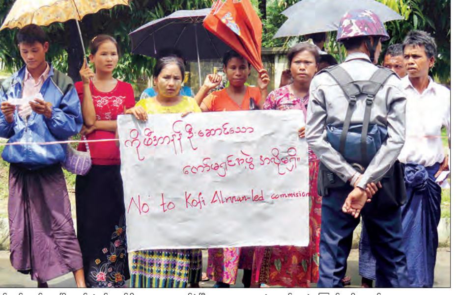
တစ်ဆင့် စစ်တွေမြို့ မင်းဂံရပ်ကွက်ရှိ သွားရောက်ခဲ့ပြီး ဒေသခံများ၏ ခွဲကြောင်း သိရသည်။ ရခိုင်တိုင်းရင်းသား ဒုက္ခသည်စခန်းသို့ အခက်အခဲများကို တွေ့ဆုံမေးမြန်း မြတ်ဝေ

ဦးဆောင်ထွန်းဝေက “ကိုဖီအာနန် ဦးဆောင်တဲ့ ကော်မရှင်အဖွဲ့ကို လက်မခံလို့ ဆန္ဒဖော်ထုတ်တာပါ။ မစ္စတာ ကိုဖီအာနန်ကို ပုဂ္ဂိုလ်ရေးအရ လေးစားတန်ဖိုးထားပေးမယ့် ပြည်တွင်းပြဿနာကို ပြည်ပကလာရောက် ဖြေရှင်းပေးတာကို ကျွန်တော်တို့အနေနဲ့ လက်မခံနိုင်ပါဘူး။ မစ္စတာ ကိုဖီအာနန်မဟုတ်ဘဲ တခြားနိုင်ငံခြားသားတစ်ယောက်ဆိုရင်လည်း အခုလိုပဲ ရခိုင်ဒေသခံတွေအနေနဲ့ ဆန္ဒဖော်ထုတ်သွားမှာပါ” ဟု ပြောသည်။ စက်တင်ဘာ ၇ ရက် နံနက်ပိုင်းတွင် မစ္စတာ ကိုဖီအာနန် ဦးဆောင်သော အဖွဲ့သည် စစ်တွေမြို့ရှိ အစ္စလာမိဘာသာဝင်များနေထိုင်ရာ အောင်မင်္ဂလာရပ်ကွက်နှင့် သက္ကပြင်ကျေးရွာတို့သို့ သွားရောက်ပြီး ဘာသာရေးခေါင်းဆောင်များ၊ ရုပ်မိရပ်ဖွဲ့များနှင့် တွေ့ဆုံခဲ့သည်။ ယင်းမှ