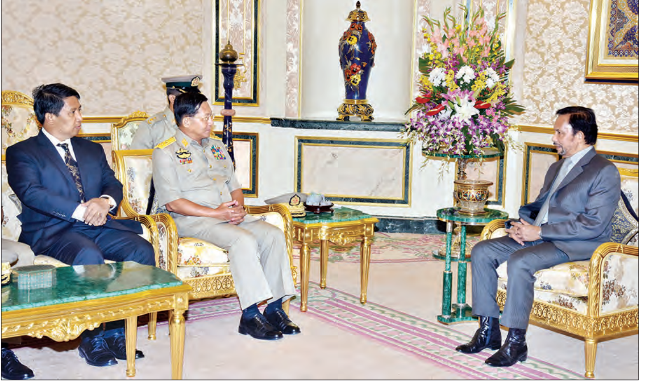
တပ်မတော် ကာကွယ်ရေးဦးစီးချုပ် ဗိုလ်ချုပ်မှူးကြီး မင်းအောင်လှိုင် ဘရူနိုင်းဒါရုဆလမ်နိုင်ငံ ဘုရင့်နန်းတော်၌ ဘရူနိုင်းဘုရင်နှင့် တွေ့ဆုံစဉ် (မြဝတီ)