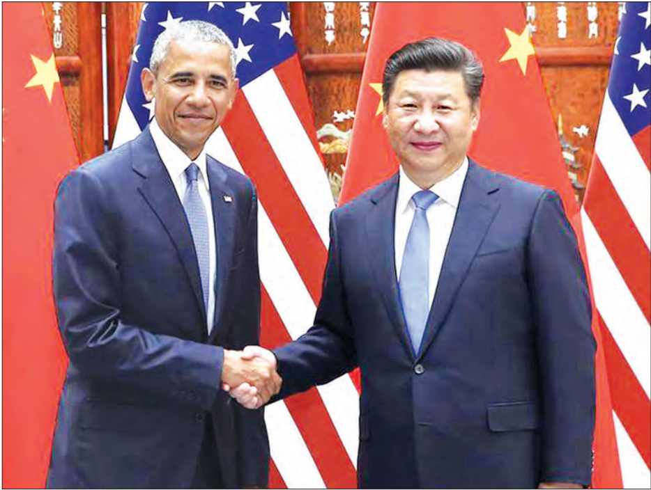
အမေရိကန်သမ္မတ ဘားရက်အိုဘားမား (ညာဘက်) နှင့် တရုတ်သမ္မတ ရှီကျင့်ဖျင် (ဘယ်ဘက်) တို့သည် ပေကျင်းမြို့တွင် တွေ့ဆုံဆွေးနွေးခဲ့ကြသည်။

ပေကျင်း၊ စက်တင်ဘာ ၃ တရုတ်သမ္မတ ရှီကျင့်ဖျင်သည် စက်တင်ဘာ ၃ ရက်က အမေရိကန်သမ္မတ ဘားရက်အိုဘားမားနှင့်တွေ့ဆုံပြီး အမေရိကန်ပြည်ထောင်စုနှင့် ဆက်လက်ပူးပေါင်းဆောင်ရွက်မည့် ကိစ္စရပ်များကို ဆွေးနွေးခဲ့ကြသည်။ တရုတ်နိုင်ငံသည် ဖန်လုံအိမ်သဘာဝဓာတ်ငွေ့လျှော့ချရေး ပါရီသဘောတူညီချက်ကို သဘောတူခဲ့သည်။ တရုတ်နိုင်ငံအနေဖြင့် ၇၅-၂၀ ထိပ်သီးအစည်းအဝေးကို အိမ်ရှင်အဖြစ် လက်ခံကျင်းပရန် ပြင်ဆင်နေစဉ် ထိုသဘောတူညီချက်ကို ထုတ်ပြန်ကြေညာခဲ့ခြင်းဖြစ်သည်။