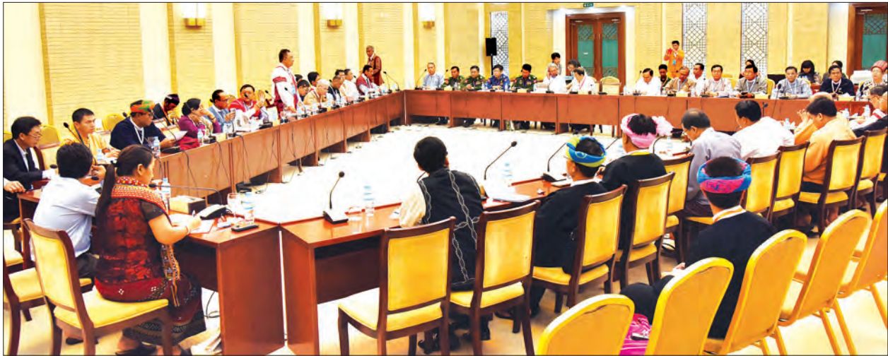
သတင်းစာရှင်းလင်းပွဲအပြီး ပြည်ထောင်စုငြိမ်းချမ်းရေးညီလာခံ-(၂၁)ရာစု ပင်လုံကျင်းပရေး ပူးတွဲကော်မတီ၏ တတိယအကြိမ်အစည်းအဝေးကို ဆက်လက်ကျင်းပစဉ်

ပြည်ထောင်စုငြိမ်းချမ်းရေးညီလာခံ-(၂၁)ရာစုပင်လုံနှင့်စပ်လျဉ်းသည့် သတင်းစာရှင်းလင်းပွဲကို ယနေ့မုန်းလွဲပိုင်းတွင် နေပြည်တော်ရှိ မြန်မာအပြည်ပြည်ဆိုင်ရာ ကွန်ဗင်းရှင်း ဗဟိုဌာန၌ ကျင်းပသည်။