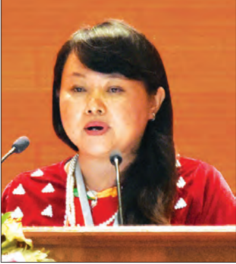
လွှေးအေးနန်း

ပြန်လည်ထူထောင်ရေးလုပ်ငန်းများ ဆောင်ရွက်ပေးရာ တွင် ကျန်းမာရေးစောင့်ရှောက်မှုလုပ်ငန်း၊ ပညာရေးမြှင့်တင်မှု လုပ်ငန်း၊ လူဝင်မှုကြီးကြပ်ရေးလုပ်ငန်းများ၊ အသက်မွေး ဝမ်းကျောင်းလုပ်ငန်းများ ပြန်လည်ထူထောင်ပေးခြင်းနှင့် အတတ်ပညာများ လေ့ကျင့်သင်ကြားပေးခြင်း၊ စစ်ပွဲနှင့် မြေမြှုပ် မိုင်းများကြောင့် ထိခိုက်ဒဏ်ရာရ ကိုယ်လက်အင်္ဂါ စွန့်လွှတ် ရသူများ၊ ကူးစက်ရောဂါသည်နှင့် နာတာရှည်ရောဂါသည်များ အား စောင့်ရှောက်ပေးခြင်း၊ လူကုန်ကူးမှုနှင့် မူးယစ်ဆေးဝါး တိုက်ဖျက်ရေး အမေ့လူသစ်ဆောင်မူ မခံရစေရန် ကာကွယ် ပေးခြင်း၊ အခြေခံအဆောက်အအုံများ တည်ဆောက်ပေးခြင်း။