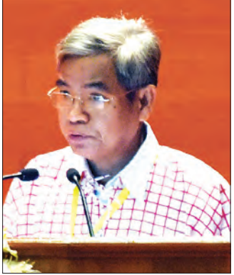
နိုင်ချမ်းတွဲ