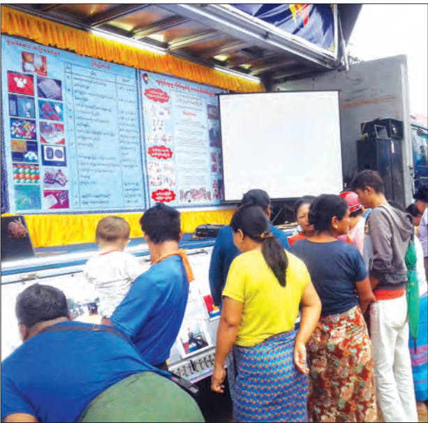
စက်တင်ဘာ ၁ ရက်က လားရှိုးမြို့နယ်အစွဲအဝေးပြေးယာဉ်ရပ်နားစခန်းတွင် ရဲတပ်ဖွဲ့က အသိပညာပေးမော်တော်ယာဉ်ဖြင့် မှုခင်းလျော့နည်းကျဆင်းရေး အသိပညာပေး လှုပ်ရှားမှုများပြုသရာ ဒေသပိုင်သူများ ကြည့်ရှုလေ့လာကြစဉ် မမ(လားရှိုး)