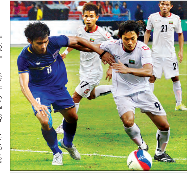
စင်ကာပူနိုင်ငံ၌ ကျင်းပခဲ့သည့် (၂၀)ကြိမ်မြောက် ဆီးဂိမ်းပြိုင်ပွဲတွင် မြန်မာအသင်း ယှဉ်ပြိုင်နေစဉ်

လက်ခံကျင်းပခဲ့သည့် ၂၀၁၃ ဆီးဂိမ်းပြိုင်ပွဲတွင် အုပ်စုအဆင့်မှ ထွက်ခဲ့ရသော်လည်း အုပ်ချုပ်သူ ဦးသန်းတိုးအောင်၊ နည်းပြချုပ် ဦးကြည်လွင်တို့ ပူးပေါင်းကိုင်တွယ်ခဲ့သည့် ၂၀၁၅ စင်ကာပူဆီးဂိမ်းပြိုင်ပွဲတွင် ပြိုင်ပွဲတစ်လျှောက် အံ့အားသင့်စွမ်းစွမ်းဆောင်မှုများ နှင့်အတူ ငွေတံဆိပ်ရယူနိုင်ခဲ့သည်။ ဆီးဂိမ်းအမျိုးသားဘောလုံးပြိုင်ပွဲတွင် ရွှေပါးစု၊ ငွေလေးစု၊ ကြေးလေးစုဖြင့် တတိယအဆင့်မြင့်ဆုံးအသင်းအဖြစ် ရပ်တည်နေသော်လည်း ရွှေတံဆိပ်ရယူနိုင်ခြင်း မရှိသည့်မှာ နှစ်ပေါင်း ၄၀ ကျော်နေပြီဖြစ်သည်။ မြန်မာဘောလုံးအသင်းသည် ၁၉၇၃ ပြိုင်ပွဲတွင် ဗိုလ်စွဲပြီးနောက်ပိုင်း ရွှေတံဆိပ်နှင့် ဝေးကွာလျက်ရှိပြီး ၁၉၉၃၊ ၂၀၀၇၊ ၂၀၁၅ ပြိုင်ပွဲတို့တွင် ဗိုလ်လုပွဲသို့ ပြန်လည်တက်လှမ်းနိုင်ခဲ့သော်လည်း ထိုင်းအသင်းကို သုံးကြိမ်စလုံးရှုံးကာ ငွေဆုဖြင့်သာ ကျေနပ်ခဲ့ရသည်။ ယူ-၂၀ ကမ္ဘာ့ဖလားပြိုင်ပွဲ ယှဉ်ပြိုင်ခွင့်ရခဲ့သည့် စကားသမားအများစု ပါဝင် လာမည့် မြန်မာယူ-၂၂ အသင်းကို နည်းပြချုပ်ဦးကြည်လွင်က (၂၉) ကြိမ်မြောက် ဆီးဂိမ်းပြိုင်ပွဲတွင် အောင်မြင်မှုရရှိအောင် စွမ်းဆောင်ပေးနိုင်မလားဆိုတာ စောင့်ကြည့် ရမည်ဖြစ်သည်။ သတင်း- ညိုမြတ်သော်တာ