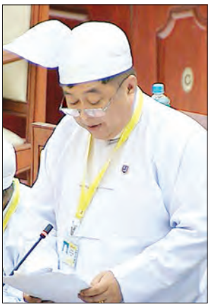
ပြည်ထောင်စုဝန်ကြီး ဦးဖေဇင်ထွန်း

နေပြည်တော် စက်တင်ဘာ ၂ ဒုတိယအကြိမ်ပြည်သူ့လွှတ်တော် ဒုတိယပုံမှန်အစည်းအဝေး ၂၅ ရက်မြောက်နေ့ကို ယနေ့ နံနက်ပိုင်းတွင် ဆက်လက်ကျင်းပရာ သာစည်မဲဆန္ဒနယ်မှ လွှတ်တော်ကိုယ်စားလှယ် ဦးသန်းစိုး၏ မြို့နယ်စာရင်းစစ်ရုံးများတွင် မြို့နယ်စာရင်းစစ်အရာရှိအဆင့်ကို လက်ထောက်ညွှန်ကြားရေးမှူးအဆင့်သို့ တိုးမြှင့်သတ်မှတ်ပေးရန် အစီအစဉ် ရှိ မရှိ မေးခွန်းအား ပြည်ထောင်စုစာရင်းစစ်ချုပ် ဦးမော်သန်းက ယင်းသို့ တိုးမြှင့်ပေးရန် မဖြစ်နိုင်သေးပါကြောင်း ဖြေကြားသည်။ နိုင်ငံတော်၏ ဘဏ္ဍာရန်ပုံငွေကို လိုငွေပြတ်ကျက်မှု ညီမျှခြေတတ်ကျက်သို့ ရောက်စေရန် ဦးတည်ဆောင်ရွက်နေပြီး ကုန်ကျစရိတ်များကို မြို့ခြံရွာတာနေသည့်အတွက်ကြောင့် လည်းကောင်း၊ ပြည်ထောင်စုအဆင့်တွင်ပင် ဝန်ကြီးဌာနများအချို့ ပေါင်းစပ်ခြင်းအပြင် များပြားသော အလုပ်ဝတ္တရားများကိုပင် ဒုတိယဝန်ကြီးများ မခန့်အပ်တော့ဘဲ ကျစ်လျစ်သိပ်သည်းစွာဖြင့် နိုင်ငံတော်ဘဏ္ဍာရန်ပုံငွေအနည်းဆုံးဖြင့် အကောင်းဆုံးလုပ်ငန်းစွမ်းဆောင်ရည် ရရှိစေရန် ဆောင်ရွက်နေသည့် အတွက်ကြောင့်