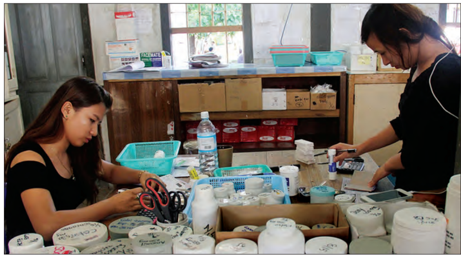
ရောဂါကိုသက်သာအောင် အေအာတီ ဆေးဝါးများ ပုံမှန်သောက်သုံးခြင်းဖြင့် လူကောင်းပကတိကဲ့သို့ သွားလာလှုပ်ရှား နိုင်သည်။ ယခင်က မြန်မာနိုင်ငံတွင် အေအာတီဆေးဝါးကို ဖြစ်ပွားသူလူနာ၏ ထက်ဝက်ခန့်ကိုသာ ဆေးဝါးလုံလောက် စွာပေးနိုင်ခဲ့ကြောင်း၊ ယခုအခါ ဆေးရုံ ကြီးတိုင်းတွင် လူနာများအား အေအာတီ ဆေးဝါးများ အလုံအလောက်ပေးနိုင်ပြီ ဖြစ်ကြောင်း သိရသည်။ သတင်း-မြင့်မောင်စိုး၊ ဓာတ်ပုံ-တင်စိုး(မြန်မာ့အလင်း)

အပ်ဘဲ ဆေးဝါးကုသမှုခံယူနိုင်မည် ဖြစ်ကြောင်း သိရသည်။ အေအာတီဆေးဝါးသည် HIV/AIDS ပိုးကို ရောဂါကူးစက်ရသူ လူနာ၏ကိုယ်ခန္ဓာအတွင်း ပိုးအရေ အတွက်ကို လျော့နည်းသွားအောင် သောက်သုံးရသည့် ဆေးဝါးဖြစ်ကြောင်း၊ စတင်သောက်သုံးချိန်မှ နေ့စဉ်သောက် သုံးရသည့် ဆေးဝါးဖြစ်ကြောင်း၊ ဆေးဝါးကို နေ့စဉ်ပုံမှန်သောက်သုံး ပါက လူကောင်းပကတိကဲ့သို့ သွားလာ လှုပ်ရှားနိုင်ကြောင်း၊ မြန်မာနိုင်ငံတွင် အေအာတီဆေးဝါး ပုံမှန်ပေးနိုင်မှု ကြောင့် ရောဂါဖြစ်ပွားမှုနှုန်းလျော့နည်း လာကြောင်း သိရသည်။ ခုခံအားကျရောဂါဖြစ်သည့် HIV/AIDS ရောဂါသည် ပျောက်ကင်းသွား အောင် ကုသနိုင်စွမ်းမရှိသော်လည်း