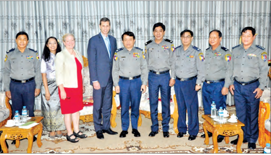
မြန်မာနိုင်ငံရဲတပ်ဖွဲ့၊ ရဲချုပ် ရဲချုပ် ဇော်ဝင်းနှင့် အမေရိကန်ပြည်ထောင်စု ဒုတိယလက်ထောက် နိုင်ငံခြားရေးဝန်ကြီး Mr. James Walsh နှင့် ကိုယ်စားလှယ်အဖွဲ့တို့ မှတ်တမ်းတင်ဓာတ်ပုံရိုက်စဉ်

တွေ့ဆုံစဉ် မြန်မာနိုင်ငံ မူးယစ်ဆေးဝါး တားဆီးနှိမ်နင်းရေးဆိုင်ရာ ဆောင်ရွက်မှုများတွင် ဆေးစွဲသူများအား ကုသရေး၊ တရားဥပဒေစိုးမိုးရေးနှင့် စုံစမ်းစစ်ဆေးမှုများ ထိရောက်စွာဆောင်ရွက်နိုင်ရေးအတွက် နည်းပညာလိုအပ်ချက်များ၊ ဘိန်းစိုက်ဒေသများတွင် အစားထိုးသီးနှံများ စိုက်ပျိုးမှုတိုးတက်ဆောင်ရွက်နိုင်ရေးတို့နှင့်စပ်လျဉ်း၍ လည်းကောင်း၊ လူကုန်ကူးမှု တားဆီးနှိမ်နင်းရေးတွင် မြန်မာနိုင်ငံ၏ ကြိုးပမ်းဆောင်ရွက်နေမှုများ၊ တစ်ဖက်နိုင်ငံများ၏ ငါးဖမ်းလုပ်ငန်းများနှင့် အခြားကုန်ထုတ်လုပ်ငန်းများတွင် လုပ်အားခေါင်းပုံဖြတ်ခံရမှုများအား အမေရိကန်နိုင်ငံ၏ ကုန်သွယ်မှု ဥပဒေပြဋ္ဌာန်းချက်များနှင့်အညီ တားဆီးနှိမ်နင်းရေးကဏ္ဍတွင် ပူးပေါင်းဆောင်ရွက်ရေး၊ နိုင်ငံခြားကျော်ပွားရေးများသည် နယ်စပ်ဒေသတွင် ဖြစ်ပေါ်လျက်ရှိရာ အဆိုပါနယ်စပ်များရှိ လက်နက်ကိုင်