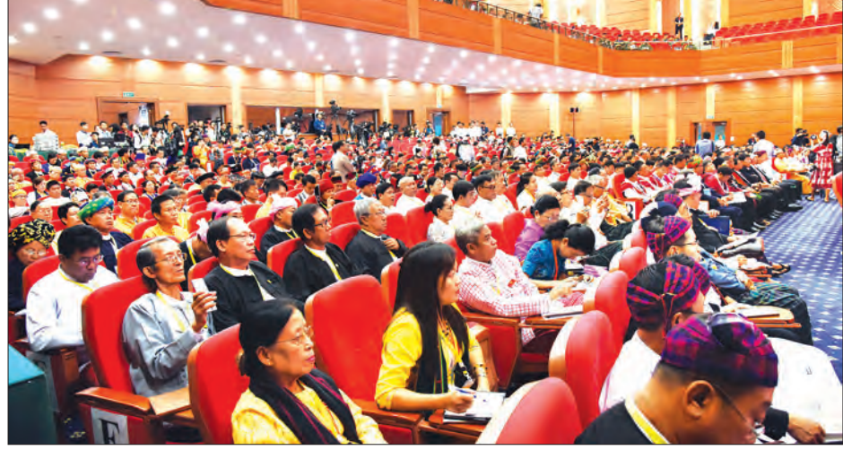
ပြည်ထောင်စုငြိမ်းချမ်းရေးညီလာခံ-(၂၁)ရာစုပင်လုံ တတိယနေ့အစည်းအဝေး တက်ရောက်လာသူများအား တွေ့ရစဉ်

လုံခြုံရေးကဏ္ဍ ပြုပြင်ပြောင်းလဲရေးသည် ပဋိပက္ခအလွန် တိုင်းပြည်တည်ဆောက်ရေးအတွက် အရေးကြီးသည့်အတွက် ငြိမ်းချမ်းရေးလုပ်ငန်းစဉ်များတွင် လုံခြုံရေးကဏ္ဍ ပြုပြင် ပြောင်းလဲရေးတို့ကို ဆွေးနွေးညှိနှိုင်းကြရမည်ဖြစ်ကြောင်း၊ လုံခြုံရေးကဏ္ဍ ပြုပြင်ပြောင်းလဲရေးတွင် အမျိုးသားလုံခြုံရေး မူဝါဒနှင့် မဟာဗျူဟာ ချမှတ်ဖော်ဆောင်ရေး၊ လုံခြုံရေးဆိုင်ရာ