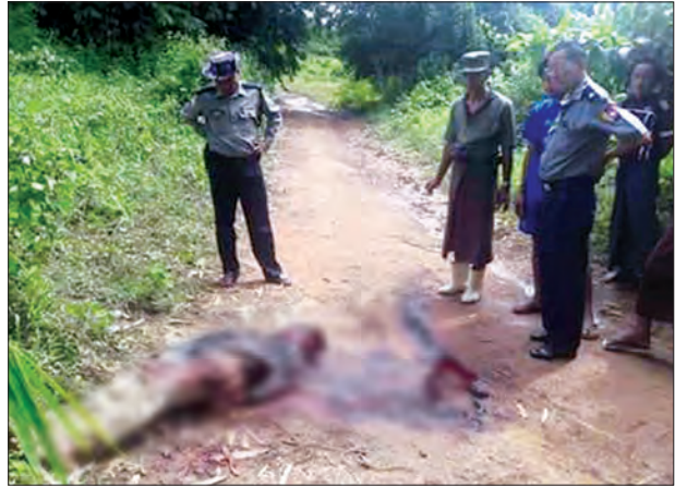
သေဆုံးသူအား တာဝန်ရှိသူများ စစ်ဆေးနေစဉ်