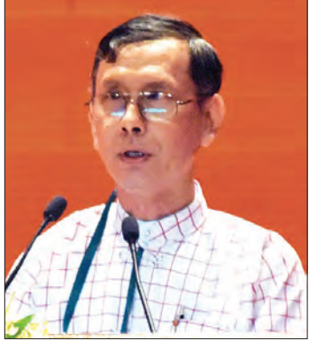
နိုင်ငံရေးကြည်