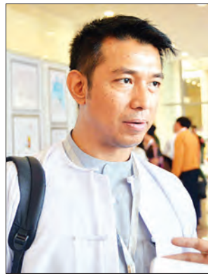
ဦးမင်းဇော်ဦး

တစ်ခုလောက်ပဲဖြစ်ပါတယ်။ ဒါပေမယ့် ပြည်နယ်အသီးသီးကနေ ပြီးတော့ ပြောချင်တဲ့စကားတွေ၊ ပါတီအသီးသီးကနေ ပြောချင် တဲ့စကားတွေကို ဒီနေရာမှာ ပြောလိုက်နိုင်တယ်။ အဲဒီလိုပြော လိုက်နိုင်တဲ့အတွက် လူအများရဲ့ဆန္ဒကို အစိုးရသိသွားမယ်။ ပြည်သူတွေသိသွားမယ်။ အဲဒါကြောင့်မို့ ပြည်သူတွေက အကဲဖြတ်လို့ ရနိုင်တယ်။ ဒါပေမယ့် ဒီညီလာခံတစ်ခုတည်း နဲ့တော့ မပြီးဆုံးနိုင်သေးဘူး။ ညီလာခံတွေ ဆက်တိုက်ဆက်တိုက် အမြဲလုပ်ရဦးမှာ ဖြစ်ပါတယ်။ အဲဒါကြောင့်မို့ ပြည်တွင်းစစ်ကြီးကို အဆုံးသတ်ဖို့လိုတယ်။ ပြီးမှပဲ နိုင်ငံရေးပြဿနာကို စားပွဲခေါ်မှာ ဘယ်လိုဖြေရှင်းရမလဲဆိုတဲ့အနေအထားကို ကျွန်မတို့ ကြိုးစား နေဆဲ ဖြစ်ပါတယ်။ အားလုံးပါဝင်ရေးအတွက်လည်း ကျွန်မတို့ နေ့စဉ်တိုက်တွန်းနေတယ်။