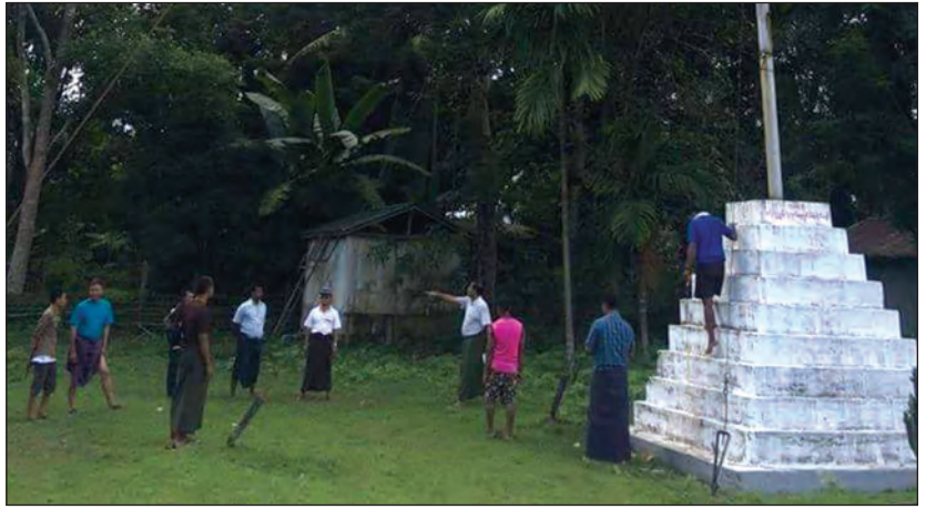
မတီကိုလည်း ရပ်မိရပ်ဖများ၊ ပရဟိတအဖွဲ့ဝင်များနှင့် ဖြင့် ဩဂုတ် ၂၃ ရက်က ဖွဲ့စည်းထားခဲ့ပြီးဖြစ်ကြောင်း စိတ်ပါဝင်စားသူများ ပါဝင်သော ကော်မတီဝင် ၂၄ ဦး သိရသည်။ (ခရိုင် ပြန်/ဆက်)

အဆိုပါသမိုင်းဝင် BIA မော်ကွန်းကျောက်တိုင်သည် တနင်္သာရီတိုင်းဒေသကြီး ထားဝယ်မြို့နှင့် ထိုင်းနိုင်ငံ ကန်ချန်ဘူရီမြို့ကြား ဆက်သွယ်ထားသော နိုင်ငံတကာ ဆက်သွယ်ရေးလမ်းမကြီး အလယ်တွင်ရှိကြောင်း သိရသည်။ သမိုင်းဝင် BIA မော်ကွန်းကျောက်တိုင်ကို မူလအတိုင်းထားရှိပြီး ကျောက်တိုင်၏ ပတ်လည်တွင် ကွန်ကရစ်ရောင်ပြင် တည်ဆောက်ခြင်း၊ ကမ္ဘာကျောက်စာတိုင်ကို စိုက်ထူခြင်းနှင့် ပြတိုက်တည်ဆောက်ခြင်းတို့ကို ပြုလုပ်သွားမည်ဖြစ်ကြောင်းနှင့် သမိုင်းဝင် BIA မော်ကွန်း ကျောက်တိုင်နှင့် ပြတိုက်တည်ဆောက်ရေး ကော်