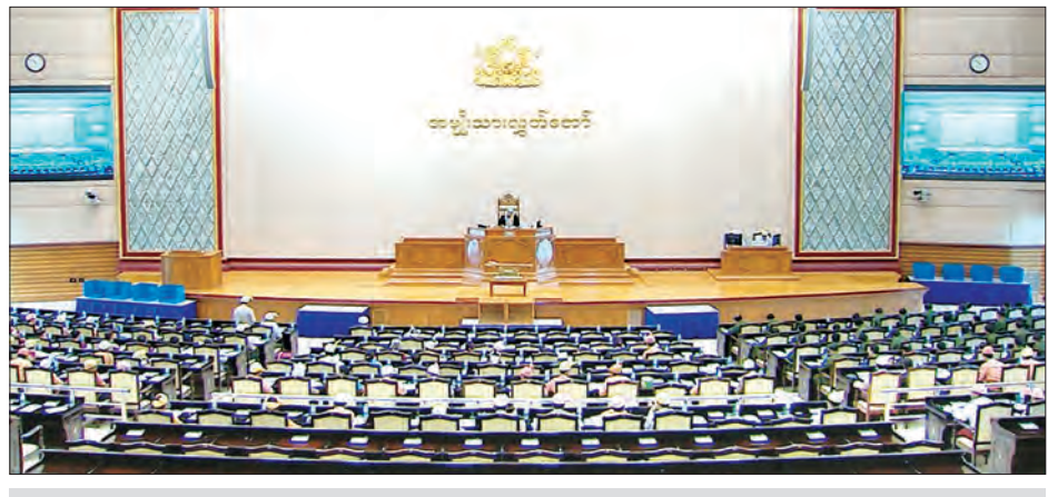
အမျိုးသားလွှတ်တော်အစည်းအဝေး ၂၅ ရက်မြောက်နေ့ ကျင်းပစဉ်

များသည် တည်ငြိမ်အေးချမ်းပြီး ဖွံ့ဖြိုးတိုးတက်မှုရှိနေပါကြောင်း၊ ကုလသမဂ္ဂအတွင်းရေးမှူးချုပ်ဟောင်း ဦးသန့်က တိုင်းပြည် အုပ်ချုပ်ရေးစနစ်များအနက် ဒီမိုကရေစီစနစ်သည် အခက်ဆုံးဖြစ်ကြောင်း၊ ဒီမိုကရေစီ အောင်မြင်ရန် ပြည်သူပြည်သားတို့၏ အသိဉာဏ်ပညာနှင့် ဆင်ခြင်တုံတရား လုံလောက်အောင် ရှိကြရမည်ဖြစ်ကြောင်း၊ အသိဉာဏ်ပညာကင်းမဲ့သောနိုင်ငံတွင် ဒီမိုကရေစီစနစ်သည် ဗရုတ်သုတ်ခက်သာ ဖြစ်စေလိမ့်မည်ဖြစ်ကြောင်း၊ ထို့ကြောင့် မဲဆန္ဒရှင်တိုင်း ပညာတတ်ကြရမည်ဖြစ်ကြောင်း၊ ဆင်ခြင်တုံတရားကို သုံးနိုင်ကြရမည်ဖြစ်ကြောင်း၊ ပညာသည် နိုင်ငံရေးအခြေခံအစစ်ဖြစ်ကြောင်း ဆိုထားပါကြောင်း၊ ထို့ကြောင့် ပညာရေးအတွက် လိုအပ်ချက်များစွာ ရှိနေသေးသည့် တိုင်းရင်းသားမျိုးနွယ်စုများအတွက် စာမတတ်သူ ပပျောက်ရေးလုပ်ငန်းစဉ်ကို အထူးကိစ္စရပ်အနေဖြင့် ဆောင်ရွက်သင့်ပြီဖြစ်ပါကြောင်း ဆွေးနွေးသည်။ အမျိုးသားလွှတ်တော် ဒုတိယပုံမှန်အစည်းအဝေး ၂၅ ရက်မြောက်နေ့ကို ရပ်နားလိုက်သည်။ (သတင်းစဉ်)