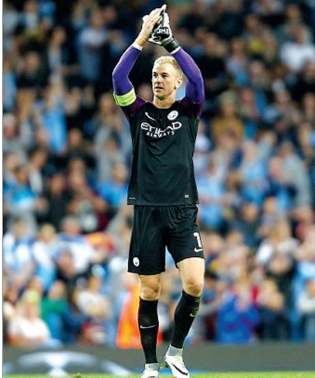
ကောင်းမြတ်သူ - စုစည်းသည်

မန်စီးစီးအသင်းမှာ နံပါတ်တစ်ဂိုးသမားနေရာကို စွန့်လွှတ်ခဲ့ရသော်လည်း ဂိုးသမား ဂျိုးဟတ်ကို အင်္ဂလန်နည်းပြသစ်ဖြစ်လာတဲ့ ဆန်အလာဒိုက်စ်ကတော့ နံပါတ် တစ်နေရာမှာဆက်ထားဖို့ အတည်ပြုပြောဆိုလိုက်ပါတယ်။ အသက် ၂၉ နှစ်ရွယ်ရှိတဲ့ ဂျိုးဟတ်ဟာ လာမယ့် သီတင်းပတ်မှာ မန်စီးစီးအသင်း ကနေ ထွက်ခွာသွားဖွယ်ရှိနေပါတယ်။ အင်္ဂလန်နည်းပြ ဆန်အလာဒိုက်စ်ကတော့ လာမယ့်စက်တင်ဘာလမှာ ဆလိုပေးနီးယားနဲ့ ကစားမယ့် ကမ္ဘာ့ဖလားခြေစစ်ပွဲမှာ ဂျိုးဟတ်ကို အင်္ဂလန်အသင်းရဲ့ နံပါတ်တစ်ဂိုးသမားအဖြစ် ဆက်လက်ရွေးချယ်လိမ့် မယ်လို့ ဆိုပါတယ်။ ဂျိုးဟတ်ဟာ ကမ္ဘာ့အကောင်းဆုံး ဂိုးသမားတစ်ဦးအဖြစ် ဆက် လက်အစွမ်းပြနေဆဲဖြစ်ပါတယ်။ အင်္ဂလန်အသင်းနဲ့အတူ ပွဲပေါင်း ၆၃ ပွဲပါဝင်ကစားခဲ့ သူလည်းဖြစ်ပါတယ်။ သူဟာ ၂၀၀၈ ခုနှစ်ကစပြီး အင်္ဂလန်အသင်းမှာ ပါဝင်ကစားခဲ့ ပါတယ်။ ရွန်းနေပြီးရင် ဂျိုးဟတ်ဟာ အင်္ဂလန်အသင်းမှာ ပွဲအများဆုံး ပါဝင်ကစား ခဲ့သူဖြစ်ပါတယ်။