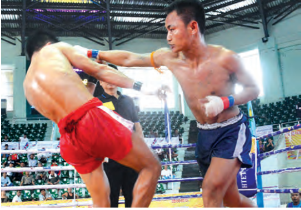
ထယ်ကြီး(ရန်ကုန်) နှင့် ထရိုင်း(ကရင်)တို့ ယှဉ်ပြိုင်ထိုးသတ်စဉ်

ရန်ကုန် ဩဂုတ် ၂၉ မြန်မာနိုင်ငံ ရိုးရာလက်ဝှေ့အဖွဲ့ချုပ်က စီစဉ်ကျင်းပသည့် (၁၄)ကြိမ်မြောက် တိုင်းဒေသကြီးနှင့် ပြည်နယ်ရိုးရာ လက်ဝှေ့ပြိုင်ပွဲ ဆီမီးဒုတိယနေ့ပွဲစဉ်များ ကို ယနေ့မနက် ၉ နာရီတွင် သီမံမြို့ရိုးရာ လက်ဝှေ့အားကစားရုံ၌ ယှဉ်ပြိုင် ထိုးသတ်ရာ (က) အဆင့် ၅၅ ကီလိုတန်း ငါးချီပွဲတွင် ထယ်ကြီး(ရန်ကုန်)က ထရိုင်း(ကရင်ပြည်နယ်)ကို အလဲထိုးဖြင့် အနိုင်ယူကာ ပိုလ်လှပွဲသို့ တက်ရောက် သွားပြီဖြစ်သည်။