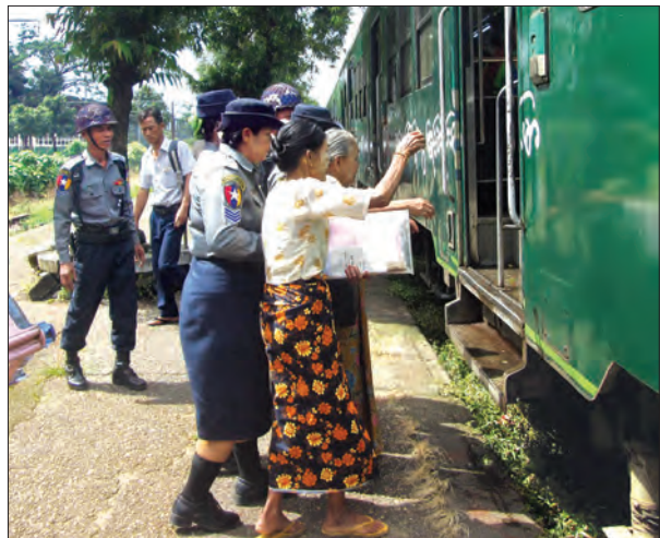
ရထားရဲတပ်ဖွဲ့ဝင်များက သက်ကြီး ရထားစီးခရီးသည်များအား ကူညီဆောင်ရွက်ပေးစဉ်

ယင်းသို့ ဆောင်ရွက်မှုသည် မေ ၁ ရက်မှစတင်၍ ရထားရဲတပ်ဖွဲ့ဝင်များ အနေဖြင့် မိမိတို့အပိုင်နယ်မြေများအတွင်း လုံခြုံရေး၊ တရားဥပဒေစိုးမိုးရေးနှင့် မှုခင်းကျဆင်းရေးကဏ္ဍများကို အရှိန်မြှင့် တင်ဆောင်ရွက်ရာတွင် တစ်ခုအပါအဝင် ဖြစ်သည်။