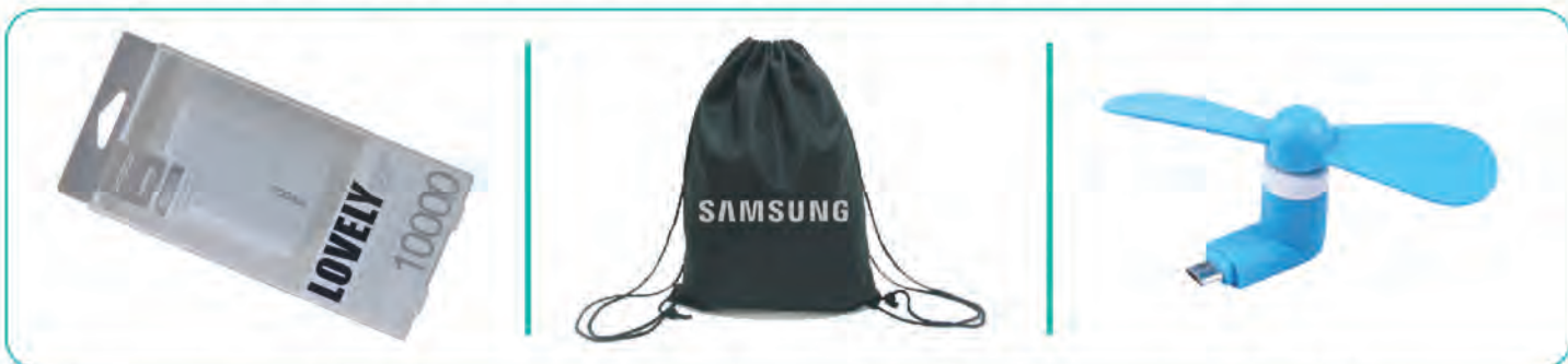
Proda powerbank 10,000 mAh

ကျပ် ၅၀၀,၀၀၀ မှ ၂၀၀,၀၀၀ အတွင်း ဝယ်ယူသူတိုင်းအတွက်