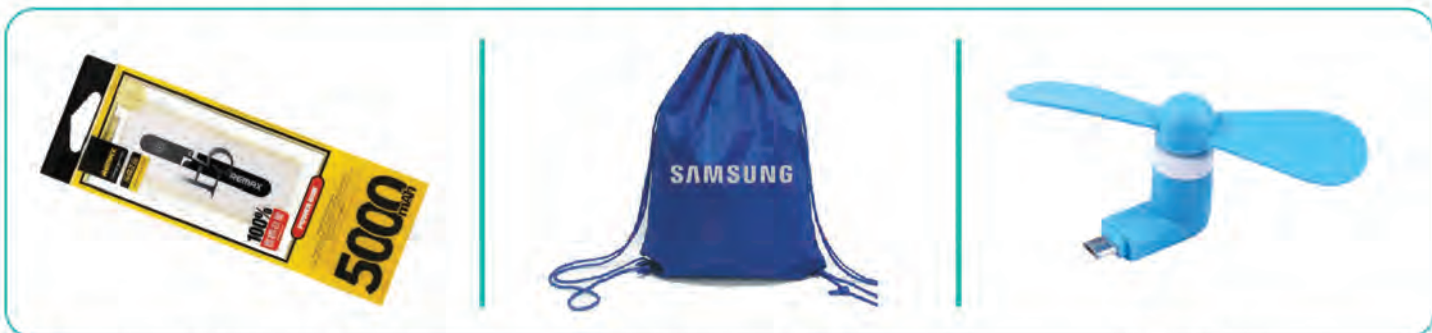
Remax Powerbank 5,000 mAh