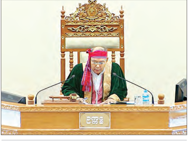
အမျိုးသားလွှတ်တော်ဥက္ကဋ္ဌ မန်းဝင်းခိုင်သန်း

နေပြည်တော် ဩဂုတ် ၂၉ ယနေ့ကျင်းပသည့် ဒုတိယအကြိမ် အမျိုးသားလွှတ်တော် ဒုတိယပုံမှန် အစည်းအဝေး ၂၂ ရက်မြောက်နေ့တွင် အမျိုးသားလွှတ်တော်ဥက္ကဋ္ဌက “သက်ကြီးရွယ်အိုများဆိုင်ရာ ဥပဒေကြမ်း”ကို တစ်ပိုဒ်ချင်းစီအလိုက် လွှတ်တော်၏ အဆုံးအဖြတ်ရယူ၍ ပြင်ဆင်ထားသည့်အတိုင်း အတည်ပြုခဲ့သည်။ အမျိုးသားလွှတ်တော်ဥပဒေကြမ်းကော်မတီဝင် ဒေါ်လှဇော် (ခ) ဒေါ်အုန်းကြည်က “သက်ကြီးရွယ်အိုများဆိုင်ရာ ဥပဒေကြမ်း”နှင့်စပ်လျဉ်း၍ လေ့လာတွေ့ရှိချက်နှင့် သဘောထားမှတ်ချက်များ ပါဝင်သော ကော်မတီ၏အစီရင်ခံစာကို ဖတ်ကြားရင်းလင်းပြီး လူမှုဝန်ထမ်း၊ ကယ်ဆယ်ရေးနှင့် ပြန်လည်နေရာချထားရေးဝန်ကြီးဌာန ပြည်ထောင်စုဝန်ကြီး ဒေါက်တာဝင်းမြတ်အေးက အတည်ပြုပေးရန် အဆိုတင်သွင်းသည့်အတွက် လွှတ်တော်၏အဆုံးအဖြတ်ဖြင့် ယင်း ဥပဒေကို ပြင်ဆင်ထားသည့်အတိုင်း အတည်ပြုခဲ့ခြင်းဖြစ်သည်။ ဧရာဝတီတိုင်းဒေသကြီး မဲဆန္ဒနယ် အမှတ်(၅)မှ ဦးမောင်မောင်အုန်း၏ “ဧရာဝတီတိုင်းဒေသကြီး ဟင်္သာတခရိုင် အတွင်းရှိ ရေလျှော်စက်များနှင့် ရေကာတာများတွင် အရေးပေါ် ရေပိုလွှဲစနစ်များ ရှိ/မရှိ၊ တာတံခံများ ခိုင်ခံ့မှုကို ပြည်တွင်း ပြည်ပ ပညာရှင်များနှင့် ပူးပေါင်းစစ်ဆေးမှု ရှိ/မရှိ၊ ငွေကျပ် ၂၀ ဘီလီယံ ကို အရေးပေါ်ကြိုတင်ပြင်ဆင် စီမံဆောင်ရွက်မှု လုပ်ငန်းစဉ်များတွင် မည်သည့်အတိုင်းအတာအထိ အသုံးပြု