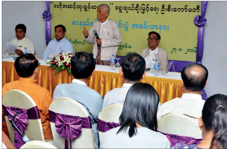
ရန်ကုန် ဩဂုတ် ၂၉