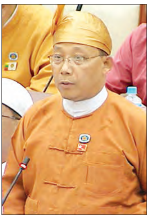
အောင်မြေသာစံ မဲဆန္ဒနယ်မှ ဒေါက်တာလှမိုး

နေပြည်တော် ဩဂုတ် ၂၉ ဒုတိယအကြိမ် ပြည်သူ့လွှတ်တော် ဒုတိယပုံမှန်အစည်းအဝေး ၂၂ ရက်မြောက်နေ့ကို ယနေ့နံနက်ပိုင်းတွင် ဆက်လက်ကျင်းပရာ ရခိုင်ပြည်နယ် ဝန်ထမ်းများနှင့် ပြည်သူ့ဝန်ထမ်းများအား ချေးငွေပေးရန် အစီအစဉ် ရှိမရှိ မေးခွန်းနှင့်စပ်လျဉ်း၍ စိုက်ပျိုးရေး၊ မွေးမြူရေးနှင့် ဆည်မြောင်းဝန်ကြီးဌာန ဒုတိယဝန်ကြီး ဒေါက်တာထွန်းဝင်းက ဝန်ကြီးချုပ်နှင့် မကြီးဝန်ကြီးချုပ်များအား တောင်းဆိုခဲ့ပြီး ဝန်ကြီးချုပ်က အတည်ပြုပေးခဲ့သည်။