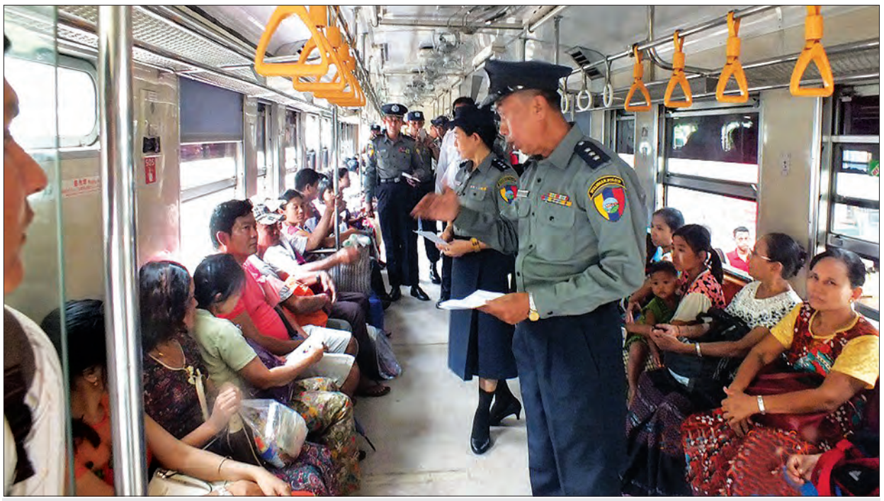
ရထားရဲတပ်ဖွဲ့တာဝန်ရှိသူများက ရန်ကုန်မြို့ပတ်ရထားစီးခရီးသည်များအား လုံခြုံမှုနှင့် မှုခင်းလျော့နည်းကျဆင်းရန် ပညာပေးဟောပြောစဉ်

ရန်ကုန်မြို့ပတ်နှင့် ဆင်ခြေဖုံး ရထားလမ်းပိုင်းတွင် ဘူတာပေါင်း ၅၅ ဘူတာရှိပြီး တွဲဆိုင် ၂၃ ဆိုင်းဖြင့် နေ့စဉ် အခေါက်ရေ ၂၅၅ ခေါက်ပြေးဆွဲလျက်ရှိရာ တစ်နေ့လျှင်