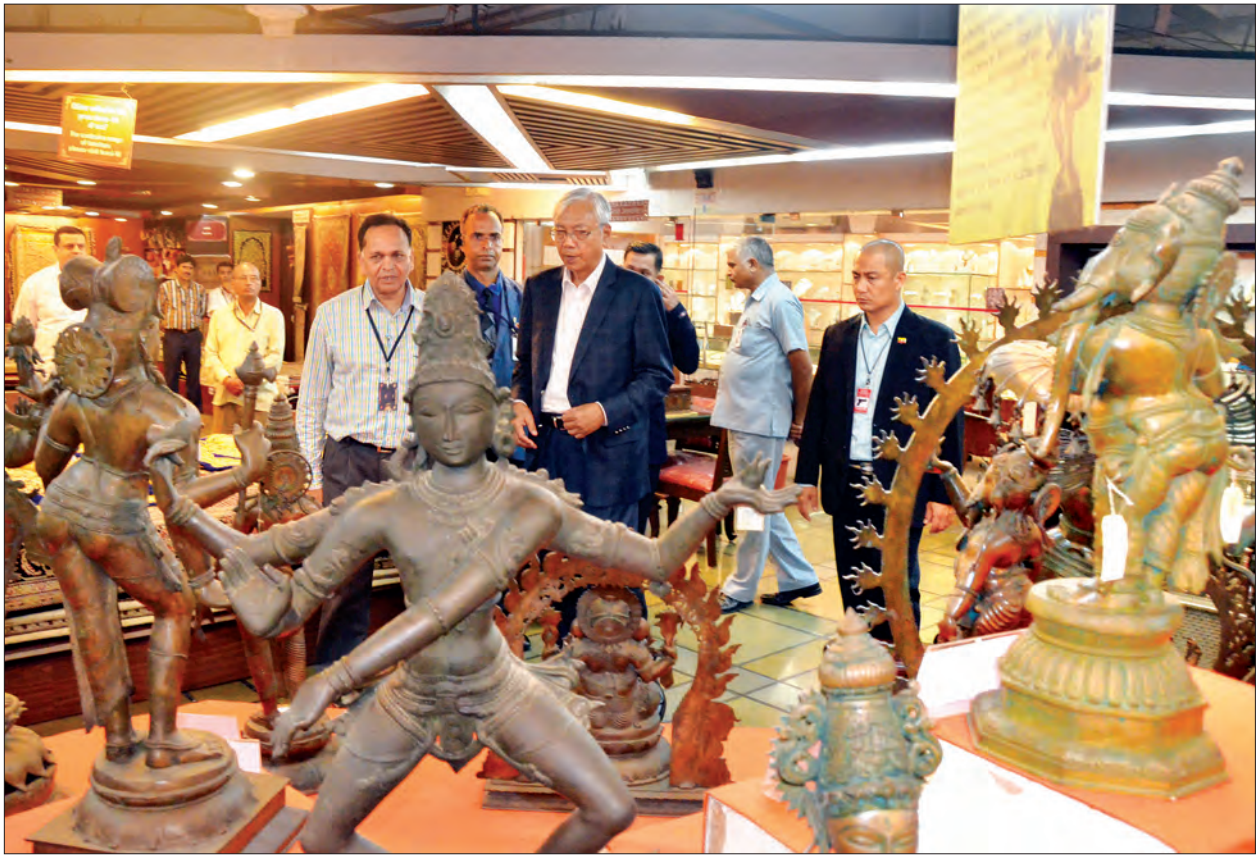
နိုင်ငံတော်သမ္မတ ဦးထင်ကျော်နှင့်အဖွဲ့ဝင်များ နယူးဒေလီမြို့ရှိ အိမ်တွင်းလက်မှု ပစ္စည်းပြခန်း၌ ကြည့်ရှုလေ့လာကြစဉ် (သတင်းစဉ်)

ဂုဏ်ပြုညစာစားပွဲတွင် နှစ်နိုင်ငံသမ္မတများက နှုတ်ခွန်းဆက်စကားပြောကြားကြ သည်။ (သတင်းစဉ်)