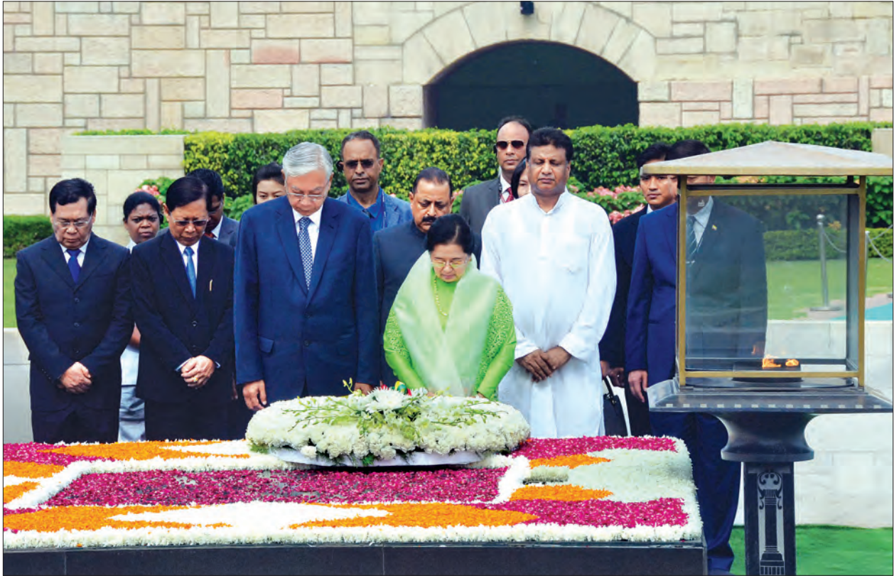
နိုင်ငံတော်သမ္မတ ဦးထင်ကျော်နှင့် ဇနီးဒေါ်စုစုလွင်တို့ မဟတ္တမဂန္တီ ဝိမာန်၌ ပန်းခွေချအလေးပြုကြစဉ် (သတင်းစဉ်)

ထို့နောက် မြန်မာ-အိန္ဒိယ နှစ်နိုင်ငံ သဘောတူစာချုပ်လဲလှယ်ပွဲကို ကျင်းပရာ နိုင်ငံတော်သမ္မတ ဦးထင်ကျော်နှင့် ဝန်ကြီးချုပ် မစ္စတာ နာရန်ဒရာမိုဒီတို့ ရှေ့မှောက်၌ မြန်မာနိုင်ငံရှိ သုံးနိုင်ငံအဝေးပြေးလမ်းမကြီး၏ တမူး- ကျီကုန်း-ကလေးဝ လမ်းပိုင်းရှိ