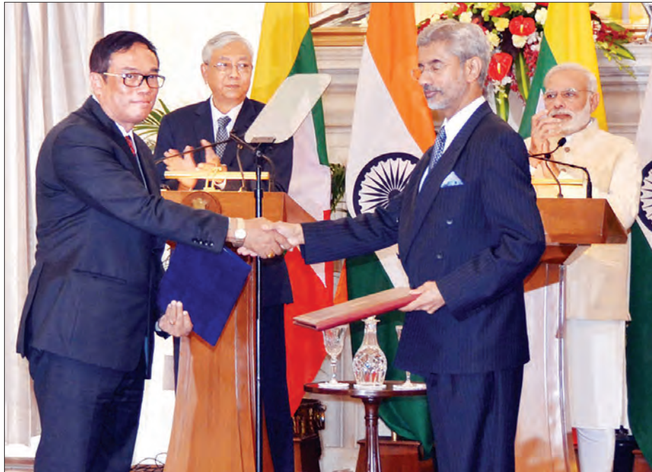
ဆောက်လုပ်ရေးဝန်ကြီးဌာန အမြဲတမ်းအတွင်းဝန် ဦးကျော်လင်းနှင့် အိန္ဒိယနိုင်ငံ နိုင်ငံခြားရေးဝန်ကြီးဌာန အတွင်းဝန် မစ္စတာ ဂျိုင်းရှန်ကာတို့ နားလည်မှု စာချုပ်လွှာ လဲလှယ်စဉ် (သတင်းစဉ်)