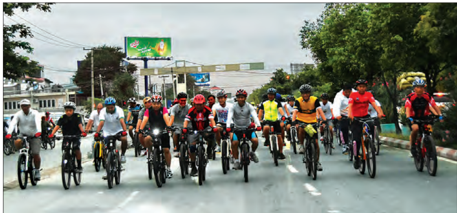
ကျန်းမာရေးနှင့် အားကစားဝန်ကြီးဌာန၏ စီစဉ်မှုဖြင့် မြန်မာနိုင်ငံစက်ဘီးစီးအဖွဲ့ချုပ်နှင့် မန္တလေးတိုင်းဒေသကြီး အားကစားနှင့်ကာယပညာဦးစီးဌာနတို့ကြီးမှူး၍ လစဉ်နောက်ဆုံးပတ် တနင်္ဂနွေနေ့တိုင်း ကျင်းပလျက်ရှိသော တတိယအကြိမ်လူထုစုပေါင်း စက်ဘီးစီးနင်းပွဲကို ဩဂုတ် ၂၈ ရက် နံနက်ပိုင်းက မန္တလေးမြို့၊ ကျီးတောင်ဘက် ၂၆ လမ်းနှင့် ၇၃ လမ်းဆုံ မင်္ဂလာတန်းထိပ်စုရပ်နေရာ၌ ကျင်းပရာ မန္တလေးတိုင်းဒေသကြီး ဝန်ကြီးချုပ်ဒေါက်တာဇော်မြင့်မောင်က စက်ဘီးစီးအားကစားဝါသနာရှင်ပြည်သူများ၊ စက်ဘီးစီးအသင်းအဖွဲ့ဝင်များနှင့်အတူ စုပေါင်းစက်ဘီးစီးနင်းပွဲကို ပျော်ရွှင်စွာ ပါဝင်ဆင်နွှဲကြစဉ်။ တင်မောင်(မန်းကိုယ်ပွား)

ထို့နောက် တက်ရောက်လာသူများက ကွမ်းစားသုံးမှုကြောင့် နောက်ဆက်တွဲ ဆိုးကျိုးများနှင့်ပတ်သက်၍ မေးမြန်းကြရာ ဟောပြောဆွေးနွေးသူများက ပြန်လည်ဆွေးနွေးခဲ့ကြကြောင်း သိရသည်။ (သတင်းစဉ်)