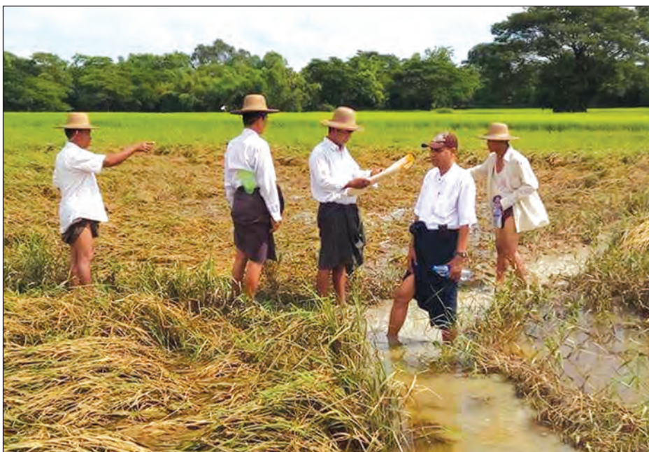
ဒါးကချောင်းရေဝင်ရောက်၍ ပျက်စီးခဲ့သော မိုးစပါးစိုက်ခင်းတစ်ခင်း နစ်မြုပ်ခဲ့ကာ ယခုအခါ ရေများပြန်လည် ကျဆင်းချိန်တွင် ပြန်ပေါ်ဧက ၂၉၃ ဧက၊ ထိခိုက်ဧက ၁၃၂၇၇ ဧကနှင့် ပျက်စီးဧက ၅၃၈ ဒဿမ ၃၄၅ သန်း ရှိခဲ့ကြောင်း သိရ သည်။ နေဝင်းမြင့်(ပြန်/ဆက်)

ကျပျော် ဩဂုတ် ၂၉ ဧရာဝတီတိုင်းဒေသကြီး ကျပျော်မြို့နယ် အတွင်း ချောင်းရေဝင်ရောက်ခဲ့မှုကြောင့် ပျက်စီးခဲ့သော မိုးစပါးစိုက်လယ်မြေ အများစုတွင် စပါးပြန်လည်စိုက်ပျိုးမည့် အစား မတ်ပဲကိုသာ ရာသီစောင့်၍ စိုက်ပျိုးသွားရန် တောင်သူအများစုက ဆန္ဒရှိနေကြကြောင်း သိရသည်။ မြစ်ရေဝင်၍ ပျက်စီးခဲ့သော မိုးစပါးစိုက်လယ်မြေများတွင် စပါးပြန်လည်စိုက်ပျိုးပါက ရာသီမမီနိုင်ခြင်းနှင့် အောင်ရေ ရရှိရန် ခက်ခဲခြင်းတို့ ကြုံတွေ့နိုင်သောကြောင့် ဒေသခံတောင်သူများအနေဖြင့် စပါးပြန်စိုက်ပျိုးမည့်အစား ဆောင်းသီးနှံ ဖြစ်သော မတ်ပဲကိုသာ ရာသီစောင့်၍ စိုက်ပျိုးသွားကြရန် ပိုမိုအားသန်နေကြခြင်းဖြစ်ကြောင်း ဒေသခံတောင်သူ တစ်ဦးက ပြောသည်။ ကျပျော်မြို့နယ်အတွင်း ပြီးခဲ့သည့် ရက်များက မိုးသည်းထန်စွာရွာသွန်းပြီး ဒါးကချောင်းရေ မြင့်တက်ခဲ့မှုကြောင့် မြို့ပေါ်ရပ်ကွက်နှစ်ခုနှင့် ကျေးရွာ ၀၃ ရွာမှ တောင်သူ ၃၉၄၄ ဦးတို့၏ မိုးစပါးစိုက်ဧက ၁၆၃၂၁ ဧကတွင် ရေဝင်ရောက်