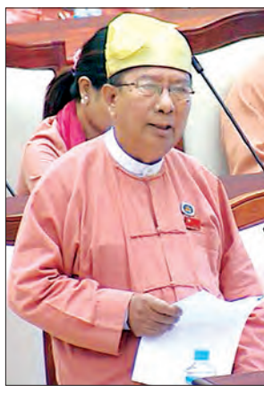
ဝေါမဲဆန္ဒနယ်မှ လွှတ်တော်ကိုယ်စားလှယ် ဦးတင်ထွေး

အတွင်းရုံး ကိုယ်စားပြုရေးရာနှင့် နတ်မော် ကျေးရွာတို့ရှိ ချောင်းကမ်းပါးပြိုကျနေမှုမှ ကာကွယ်ရန်အတွက် ၂၀၁၆-၂၀၁၇ ဘဏ္ဍာရေးနှစ် ပြည်နယ်အစိုးရ ရန်ပုံငွေပိုမိုထည့်သွင်းခြင်း မရှိသေးပါ။ ချောင်းကမ်းပါးပြိုကျနေမှုမှ ကာကွယ်ရန်အတွက် ၂၀၁၆-၂၀၁၇ ဘဏ္ဍာရေးနှစ် ပြည်နယ်အစိုးရ ရန်ပုံငွေပိုမိုထည့်သွင်းခြင်း မရှိသေးပါ။