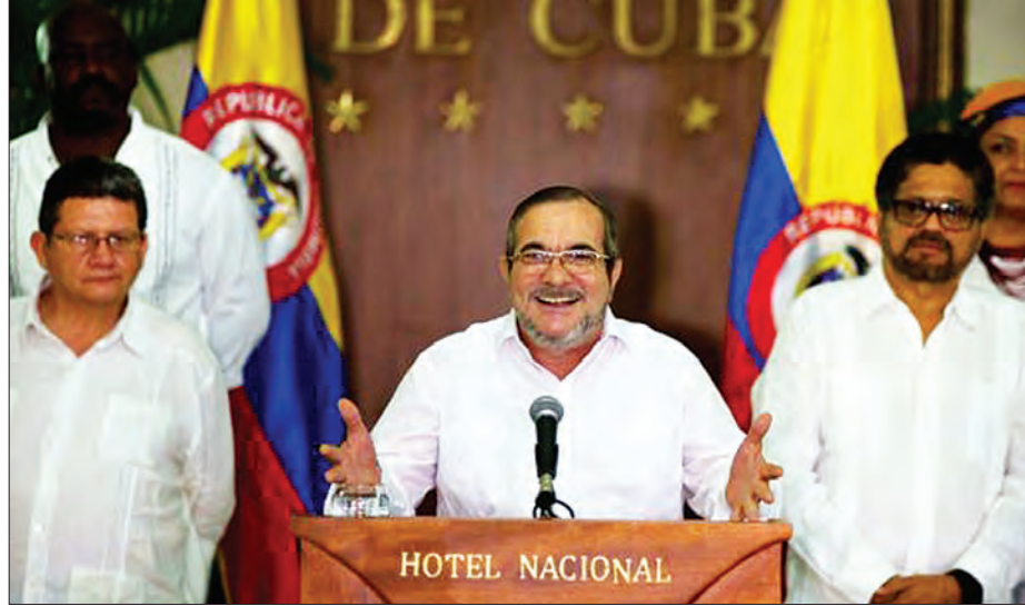
ဟာဟားနား၌ FARC အဖွဲ့ခေါင်းဆောင် ရိုဒရီဂိုလန်ဒိုနို အပစ်အခတ်ရပ်စဲမှုစတင်ကြောင်း ကြေညာနေစဉ်

ဟာဟားနား၊ ဩဂုတ် ၂၉ - ကိုလံဘီယာ၌ အစိုးရအဖွဲ့နှင့် လက်ဝဲသမားများဖြစ်သည့် အဓိကအတိုက်အခံအုပ်စုများအကြား ကမ္ဘာ့အရှည်ကြာဆုံးသော ပုန်ကန်ထကြွမှုကြီးတစ်ခု အဆုံးသတ်တော့မည့် အပစ်အခတ်ရပ်စဲရေးစာချုပ်သည် အကျိုးသက်ရောက်မှု ရှိလာခဲ့ပြီဖြစ်သည်။