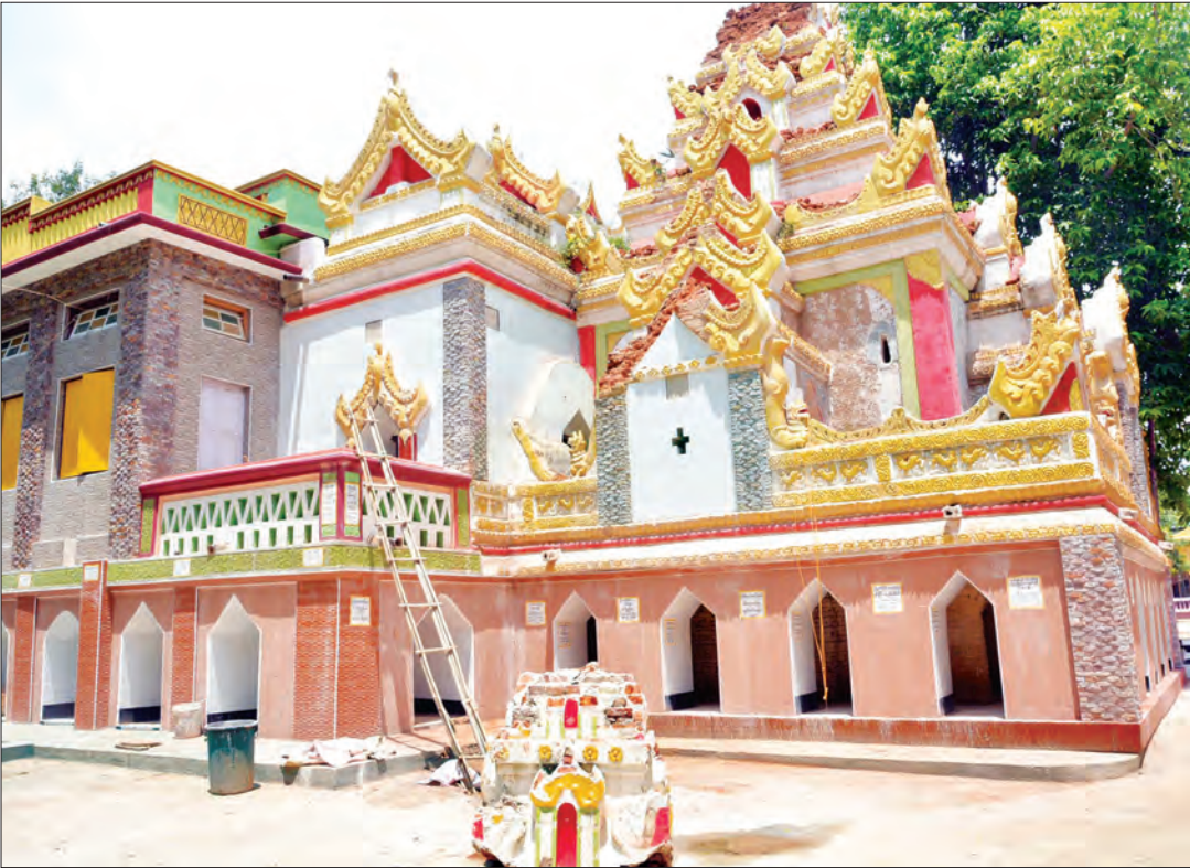
သရက္ခန်ဘုရားကိန်းဝပ်သည့် ဂန္ဓကုဋ်တိုက် ပြာသာဒ်ဆောင်ထိပ်ပိုင်း ပြတ်ကျနေသည်ကို တွေ့ရစဉ်