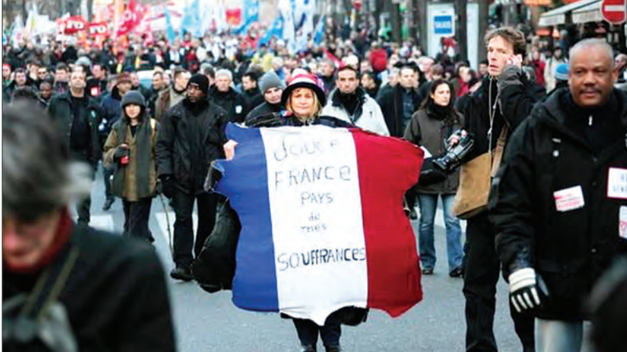
၂၀၀၈ ခုနှစ် စီးပွားရေးအကျပ်အတည်းကြုံတွေ့စဉ်ကာလက ပြည်သူများ။

သူ့မဲဆွယ်စည်းရုံးစဉ်ကာလက ကတိပေးခဲ့တဲ့ အလုပ်ပိုလုပ်ရင် ဝင်ငွေပိုရရမယ်ဆိုတဲ့ကတိကိုလည်း ဖြည့်စွမ်းမပေးနိုင်ခဲ့ပါဘူး။ စီးပွားရေးတိုးတက်မှုနှုန်းနည်းကွေးတာကို လည်းမဖြေရှင်းနိုင်ခဲ့ပါဘူး။ ပြင်သစ်မှာ အလုပ်လက်မဲ့ပမာဏတွေ ပိုပြီး မြင့်တက်လာခဲ့ပါတယ်။ ဒါပေမယ့်လည်း မစ္စတာဆာကိုဇီကတော့ သူ့သမ္မတအဖြစ် တာဝန်ယူစဉ်ကာလတုန်းက စီးပွားရေးဖွံ့ဖြိုးတိုးတက်အောင် အကောင်းဆုံးဆောင်ရွက်ပေးခဲ့ပေမယ့် ၂၀၀၈ ခုနှစ် ကမ္ဘာ့စီးပွားရေးအကျပ်အတည်းနဲ့ ရင်ဆိုင်ခဲ့ရတာကြောင့် ရလဒ်ကောင်းတွေမရခဲ့တာပါလို့ တုံ့ပြန်ဖြေရှင်းခဲ့ပါတယ်။