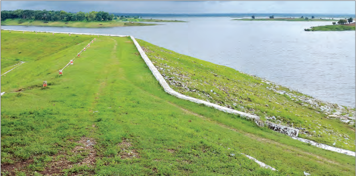
နေပြည်တော်ကောင်စီနယ်မြေ တပ်ကုန်းမြို့နယ်ရှိ ဆင်သေဆည်ကို ဩဂုတ် ၂၈ ရက်က တွေ့ရစဉ်