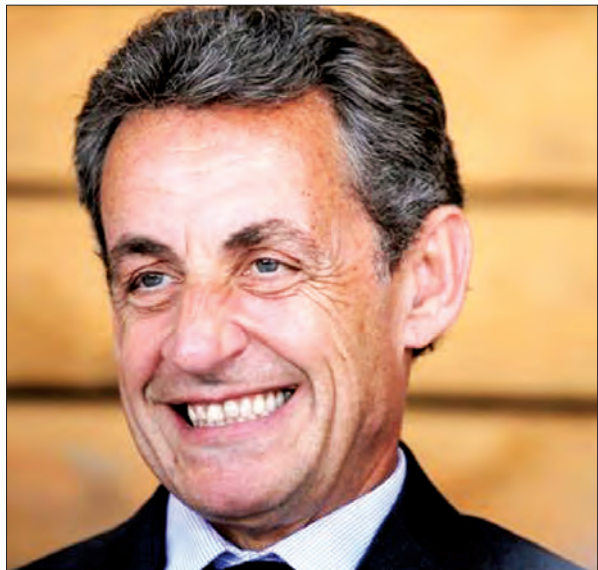
ပြင်သစ်သမ္မတဟောင်း နီကိုလပ်စ်ဆာကိုဇီ

ပထမဦးဆုံးအကြိမ်အနေနဲ့ ပြင်သစ်နိုင်ငံရဲ့ပါတီကြီးဟာ သမ္မတဟောင်းအဖြစ် ဝင်ရောက်ယှဉ်ပြိုင်မယ့်ပုဂ္ဂိုလ်ကို ပွင့်ပွင့်လင်းလင်းနဲ့ရွေးချယ်နိုင်ဖို့ ကျင်းပပေးလိုက်တာပဲ ဖြစ်ပါတယ်။ ရွေးကောက်ပွဲ မှတ်ပုံတင်စာရင်းမှာ ပေးသွင်းထားတဲ့ လူတွေဟာ ယူရို ၁ ဒသမ ၇၂ ပေါင်ပေးပြီး မဲပေးနိုင်မှာပဲ ဖြစ်ပါတယ်။ နိုဝင်ဘာ ၂၀ ရက်နဲ့ ၂၇ ရက်တို့မှာ ကျင်းပမယ့် မဲပေးပွဲမှာ လူပေါင်း ၃ သန်း သို့မဟုတ် ၄ သန်းလောက် မဲပေးနိုင်ကြမယ်လို့ ယူဆရတယ်။ ဆာကိုဇီဟာ သူ့ပါတီအတွင်းမှာ အဓိကလူကြိုက်များတဲ့ လူလိုလည်း ပြောလိုမရသေးပါဘူး။ လတ်တလော ပြင်သစ်တွေ့သဘောကျ နှစ်ခြိုက်နေတဲ့ နိုင်ငံရေးသမားကတော့ ဝန်ကြီးချုပ်ဟောင်းလည်း ဖြစ်ခဲ့ဖူးပြီး ဘော်ဒိုး မြို့တော်ဝန်လည်းဖြစ်တဲ့ အလန်ဂျူပီပဲ ဖြစ်ပါတယ်။ သူဟာ မစ္စတာဆာကိုဇီသမ္မတအဖြစ် တာဝန်ထမ်းဆောင်စဉ်အခါက နိုင်ငံခြားရေး ဝန်ကြီးအဖြစ် တာဝန်ယူခဲ့သူလည်းဖြစ်ပါတယ်။