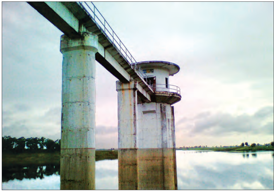
ဆင်သေဆည် ရေထိန်းမျှော်စင်ကို တွေ့ရစဉ်

“ကျွန်တော်တို့ တပ်ကုန်းမြို့နယ် မှာရှိတဲ့ ဆင်သေဆည်ကျိုးတယ်ဆိုတာ လုံးဝမဟုတ်ပါဘူး။ ရေဖောက်ချတယ် ဆိုတာလည်း မဟုတ်ပါဘူး။ ဆည်ရေ ပြည့်ဖို့တောင် ၁၈ ပေကျော် လိုနေသေး ပါတယ်။ ဆည်ကျိုးတယ်ဆိုတာ ကောလာ ဟလပဲ ဖြစ်ပါတယ်။ ကျွန်တော်တို့ ဆည်မြောင်းဦးစီးဌာနက တာဝန်ရှိသူ တွေကလည်း ဆည်ခံနိုင်ရည် ရှိ မရှိ အမြဲစစ်ဆေးနေပါတယ်။ အနောက်ရိုးမ ရေပိုရေလွှဲစေရမှာ မိုးရွာသွန်းမှုတွေ များပြီး ဆင်သေချောင်းထဲ ရေတွေ