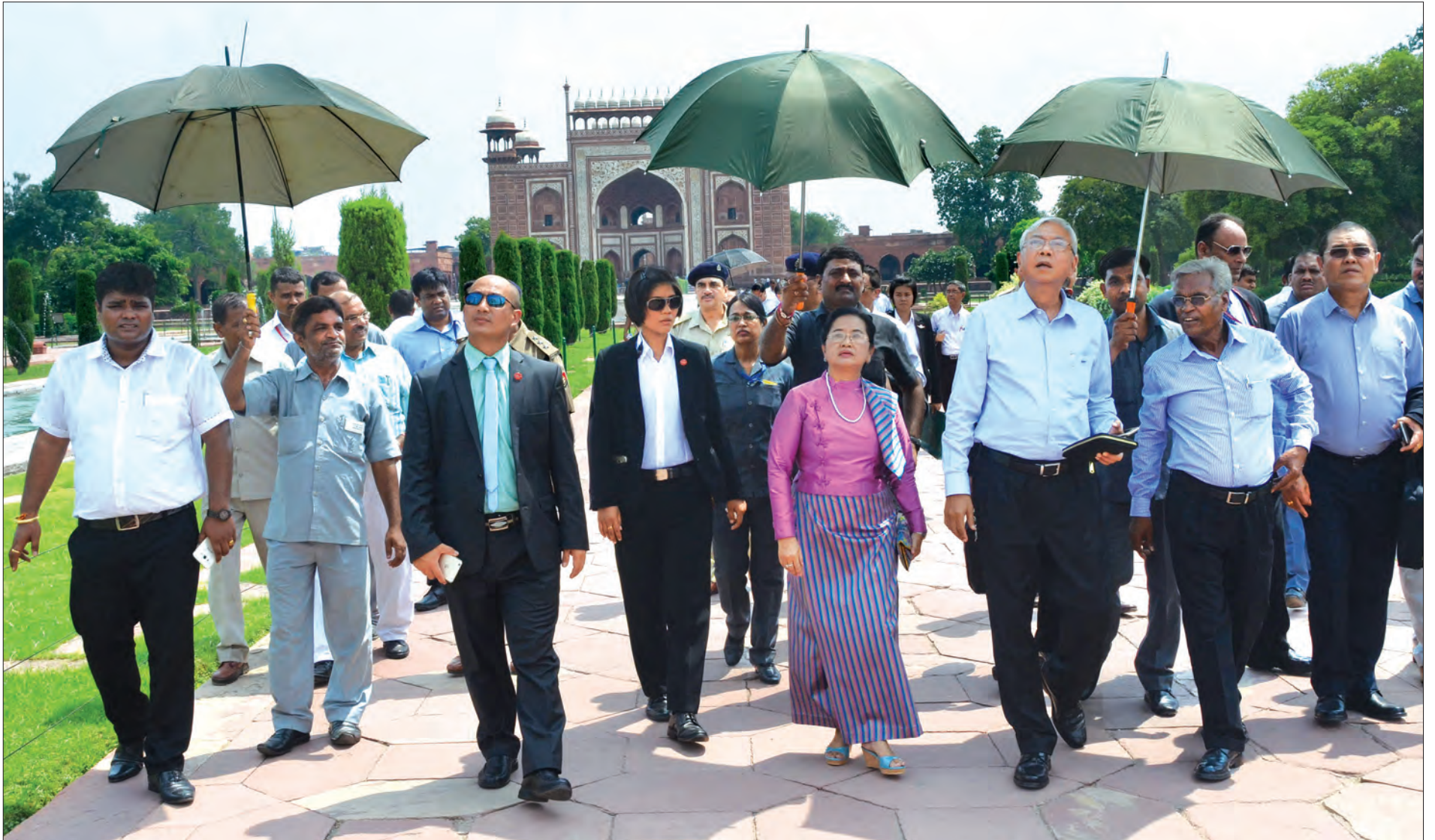
နိုင်ငံတော်သမ္မတ ဦးထင်ကျော်နှင့်ဇနီး ဒေါ်စုစုလွင်နှင့် အဖွဲ့ဝင်များ အိန္ဒိယနိုင်ငံ အဂရာမြို့ရှိ တာဂျီမဟာသို့ လေ့လာကြစဉ် (သတင်းစဉ်)