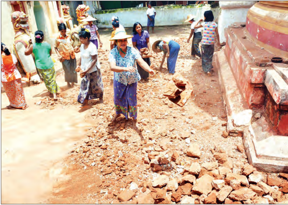
ငလျင်ဒဏ်ကြောင့် အပျက်အစီးများကို ဒေသခံများ ရှင်းလင်းနေစဉ်

“ပခုက္ကူမြို့ရဲ့ တန်ခိုးကြီးဘုရား ငါးဆူ ရွှေမဋ္ဌဘုရားက စိန်ဖူးတော် အထက်ပစ္စယံကနေ ပြတ်ကျသွား တယ်။ သမိုင်းဝင် ရွှေတန်တင့်ဘုရားကြီး ကလည်း စိန်ဖူးတော်ကြီး ယိုင်သွားတယ်။ နောက်ပြီး သရက္ခဘုရားကြီး စိန်ဖူး တော်အုပ်ထားတဲ့ မှန်ပေါင်းချောင် အက်ကွဲသွားတယ်။ ရွှေတန်တင့်ဘုရား မှာရှိတဲ့ ခြင်္သေ့ရုပ်ကြီးလည်း ဦးခေါင်းပိုင်း ပျက်စီးသွားတယ်” ဟု ၎င်းက ပြောသည်။