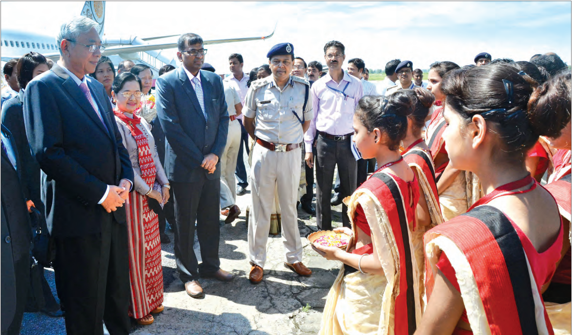
နိုင်ငံတော်သမ္မတ ဦးထင်ကျော်နှင့်ဇနီး ဒေါ်စုစုလွင် အိန္ဒိယသမ္မတနိုင်ငံ ဂယာလေဆိပ်သို့ ရောက်ရှိကြစဉ်