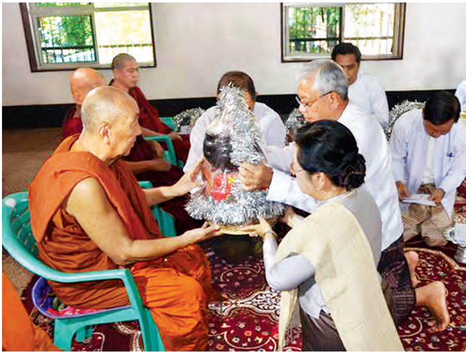
နိုင်ငံတော်သမ္မတ ဦးထင်ကျော်နှင့်ဇနီး ဒေါ်စုစုလွင်တို့ ပုဒ္ဒဂယာ မြန်မာဘုန်းတော်ကြီးကျောင်း၌ ဆရာတော်ထံ ဝါဆိုသင်္ကန်းနှင့် လှူဖွယ်ပစ္စည်းများ ဆက်ကပ်လှူဒါန်းစဉ် (သတင်းစဉ်)