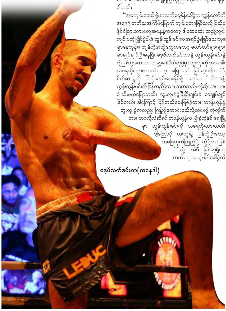
ဒေဝလက်ဒပ်ဟာ(ကနေဒါ)

မြန်မာ့ရိုးရာလက်ဝှေ့ပရိသတ်ပြည်သူတွေက ပွဲအပေါ်စိတ်ကျေနပ်မှုမရသလို ဒေဝလက်ဒပ်ဟာအနေနဲ့လည်း တူးတူးကို အလဲမထိုးနိုင်ခဲ့လို့ စိတ်ကျေနပ်ပုံ မရပါဘူး . . .