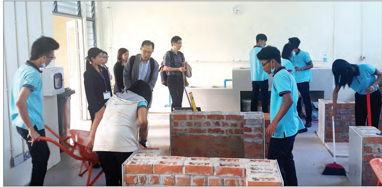
ကျွမ်းကျင်မှုသင်တန်းကျောင်းတစ်ခုတွင် လူငယ်များ ကျွမ်းကျင်မှုအတတ်ပညာများ သင်ကြားနေစဉ်

လုပ်သားဈေးကွက်နဲ့ကိုက်ညီတဲ့ ကျွမ်းကျင်မှု စံသတ်မှတ်ချက်တွေကို ရေးဆွဲပြဋ္ဌာန်းနိုင်ဖို့ မြန်မာနိုင်ငံလုပ်သားများ ကျွမ်းကျင်မှုစံသတ်မှတ်ပြဋ္ဌာန်းရေးအဖွဲ့ကို ၂၀၀၇ ခုနှစ်ကတည်းက ဖွဲ့စည်းထားပြီး အလုပ်အကိုင်တွေအပေါ် ကျွမ်းကျင်မှုစံနှုန်းတွေကို ခွဲခြားသတ်မှတ်ပေးဖို့ အလုပ်အကိုင် ကျွမ်းကျင်မှုတွေအတွက် အသေးစိတ် တိကျတဲ့ပုံစံတွေ ချမှတ်ဖို့ ကျွမ်းကျင်မှုတိုးတက်ရေးကို ညှိနှိုင်းဖို့နဲ့ ဦးစားပေးလုပ်ရမှာတွေ