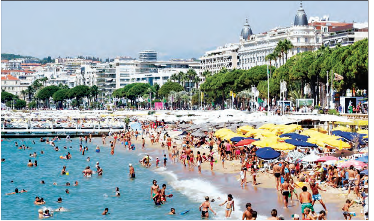
အလယ်ပိုင်းတို့တွင် ပြုလုပ်ခဲ့ကြောင်း သိရသည်။ ယင်းဒေသများတွင် အပူချိန်မြင့်မားမှုဖြစ်ပေါ်နိုင်သောကြောင့် လည်းကောင်း၊ ယင်းဒေသရှိ ပြည်သူများမှာ အခြားဒေသရှိ လူများလောက် အပူချိန်ကို ခံနိုင်မှု မရှိခြင်းတို့ကြောင့်လည်းကောင်း သတိပေးမှုထုတ်ပြန်ခြင်းဖြစ်ကြောင်း သက်ဆိုင်ရာ အာဏာပိုင်များက ဆိုကြသည်။ မြို့တော်ပါရီ အနီးဝန်းကျင်ဒေသများတွင် အပူချိန်မှ အမြင့်အဆင့်သို့ ရောက်ရှိခဲ့ရာ သက်ဆိုင်ရာ အာဏာပိုင်များက အရေးပေါ်တယ်လီဖုန်းလိုင်းများကို

အပူလှိုင်းလိမ္မော်ရောင်အဆင့် သတိပေးမှုများကို နိုင်ငံမြောက်ပိုင်းနှင့်