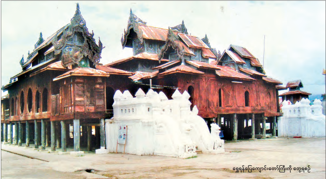
ရွှေရန်ပြေကျောင်းတော်ကြီးကို တွေ့ရစဉ်

ရှမ်းပြည်နယ်တောင်ပိုင်း ညောင်ရွှေစော်ဘွားကြီးဆာစောအုံက ဘာသာ၊ သာသနာ မှားမှီနည်းနမ်းမည်စိုး၍ ညောင်ရွှေစော်ဘွားကြီးစောအုံနှင့် စေတနာရှင် အလှူရှင်များက ညောင်ရွှေမြို့နယ် တီလောစခန်းကြီးကျေးရွာအုပ်စု ရွာတော်(ခေါ်) ရွှေရန်ပြေရွာဦးတွင် ၁၂၅၀ ပြည့်နှစ် ပထမဆုံးလဆန်း ၅ ရက်တွင် ရွှေရန်ပြေဥဒ္ဒိယစေတီတော်ကြီးကို ဉာဏ်တော်အမြင့်မှာ ထီးတော်အပါအဝင် ၈၁ ပေရှိ ရွှေရန်ပြေစေတီတော်ကြီးကို တည်တော်မူခဲ့သည်။