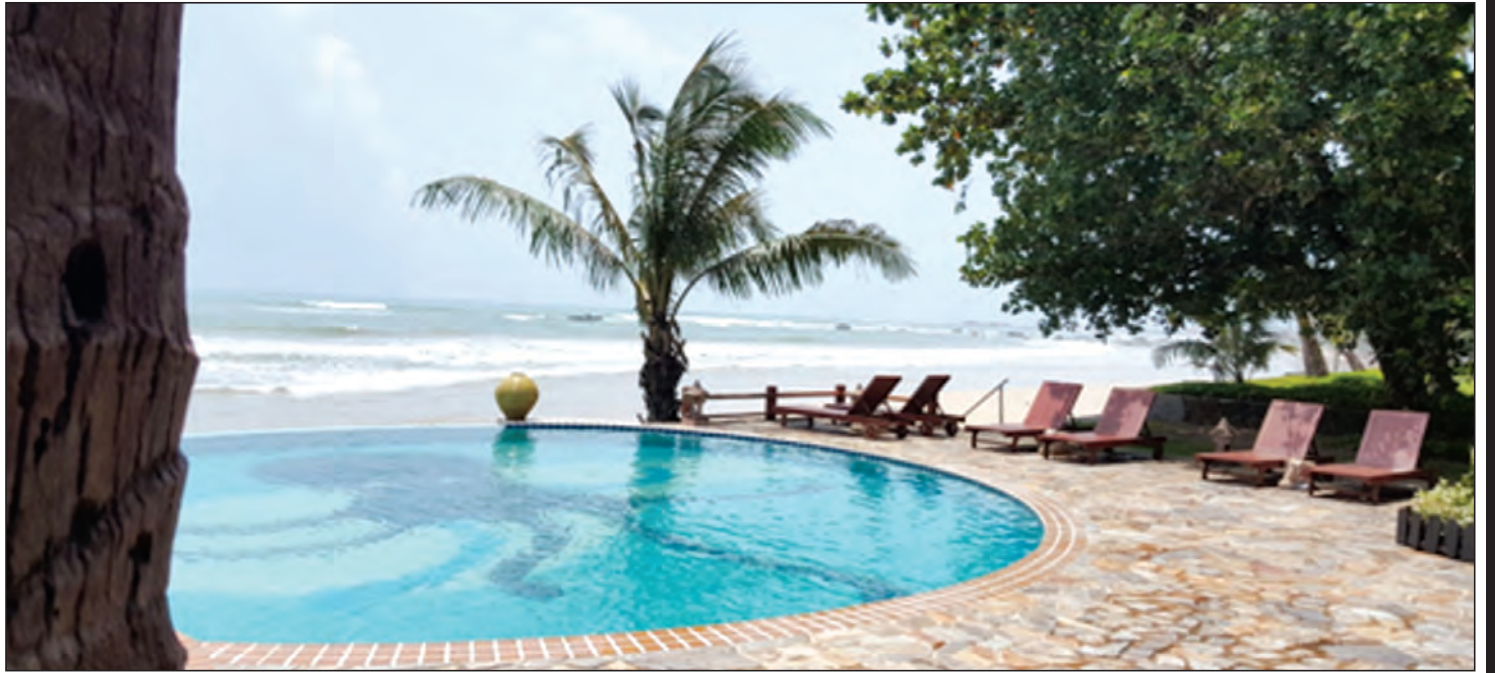
ရခိုင်ဒေသ၏ သာယာလှပသော ငပလီကမ်းခြေတစ်နေရာ

အနောက်တက်ယွန်းယွန်းအရပ်ဒေသများကနေ ရောက်ရှိလာတတ်သောကြောင့် အနောက်နွား ဟု ခေါ်ကြသလားတော့ မပြောတတ်ပါ။ အနီ အနောက်နွားတစ်ကောင်ကို ကျပ်လေးရာ၊ လေးရာငါးဆယ်နှင့် ဝယ်လိုရသောခေတ်၌ ကျွန်တော်လူဖြစ်ခဲ့သည်ဟုလည်း ပြောနိုင်ပါ သည်။ လှည်းယဉ်(ရွာမှာတော့ လှည်းယဉ်ကို မောင်းလှည်းဟုလည်း ခေါ်တတ်ကြ၏)မောင်း ရန်ဝါသနာပါသော ကျောင်းဆရာ ကျွန်တော် အဖေကိုယ်တိုင် အနောက်နွားတစ်ကောင်ကို ထိုဈေးနှင့် ဝယ်ခဲ့ဖူးသည်ကိုလည်း အမှတ်ရနေမိ ၏။ အဖြူရောင်နွားကလေးမို့ စံပယ်ဟု အမည် ပေးခဲ့ကြသည်။