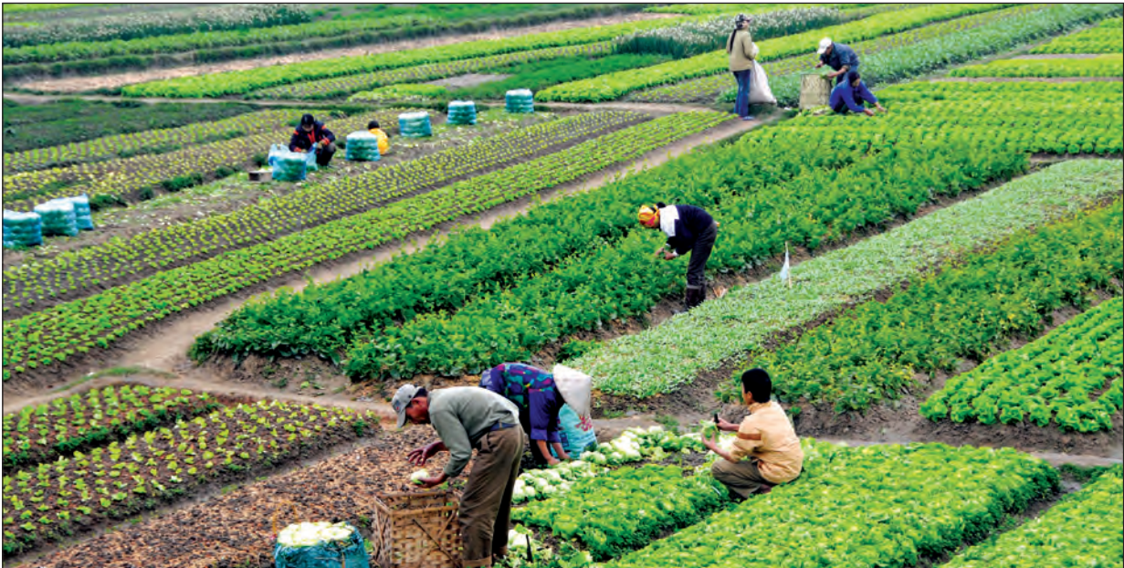
ပန်းဂေါ်ဖီနှင့် ဟင်းသီးဟင်းရွက်စိုက်ခင်း

ကျွန်တော်တို့ ဟဲဟိုးမြို့မဈေးအတွင်းမှ ပြန်ထွက်လာခဲ့ကြသည်။ နံနက် ၁၀ နာရီခန့် ရှိပြီဖြစ်သော်လည်း ရာသီဥတုက မိုးအုံ့နေသဖြင့် အေးမြခြေခံစားရသည်။