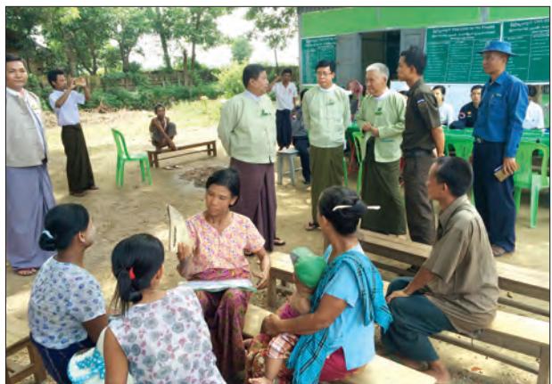
မြေငှားဂရန်လျှောက်ထားသူများအား မြေငှားဂရန်စာချုပ်များ ထုတ်ပေးခဲ့ကြောင်း သိရသည်။ (မြန်မာ့အလင်း)

အခမ်းအနားသို့ နေပြည်တော်ကောင်စီအတွင်းရေးမှူး၊ နေပြည်တော် အုပ်ချုပ် ရေးမှူး၊ ဒုတိယညွှန်ကြားရေးမှူးချုပ် ဦးမြင့်အောင်၊ ခရိုင်အုပ်ချုပ်ရေးမှူး၊ ဦးအေး သောင်း၊ မြို့နယ်အုပ်ချုပ်ရေးမှူး၊ ဦးတင်နွယ်၊ ဌာနဆိုင်ရာတာဝန်ရှိသူများနှင့် မြေငှား ဂရန်လျှောက်ထားသူများ တက်ရောက်ခဲ့ပြီး စည်းကမ်းချက်နှင့် ကိုက်ညီသော