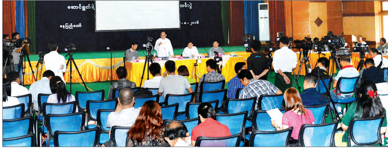
အစိုးရသစ်၏ ပထမရက် ၁၀၀ ကာလအတွင်း ဆောင်ရွက်ခဲ့မှုများနှင့်ပတ်သက်သည့် ပဉ္စမအကြိမ် သတင်းစာရှင်းလင်းပွဲကို ယမန်နေ့က ကျင်းပစဉ်

ကာကွယ်ဆေးထိုးနှံရန် သွားရောက်သည့် ဆရာမမှာ အသက်နှင့် ရင်းပြီးသွားခဲ့ ရပါကြောင်း၊ လမ်းမရှိဘဲ လမ်းကိုဖော်ပြီး သွားခဲ့ရပြီး ဆေးအထိုးမခံသည့် ကလေးများ