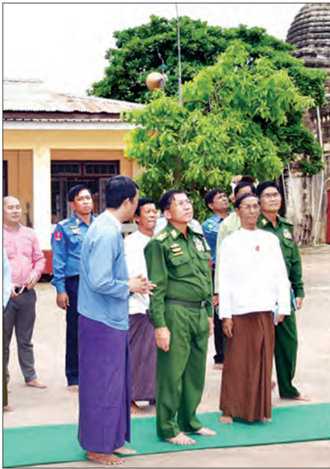
တပ်မတော်ကာကွယ်ရေးဦးစီးချုပ် ဝိုလ်ချုပ်မှူးကြီး မင်းအောင်လှိုင် လျှင်ဒဏ်ကြောင့် အာနန္ဒာဘုရား၌ ပျက်စီးမှုများအား လှည့်လည်ကြည့်ရှုစဉ်

ထို့နောက် Gate Way ကုမ္ပဏီမှ ငွေကျပ် သိန်း ၄၀၀၀၊ KBZ အနာဂတ် အလင်းတန်းမြန်မာ ဖောင်ဒေးရှင်းမှ