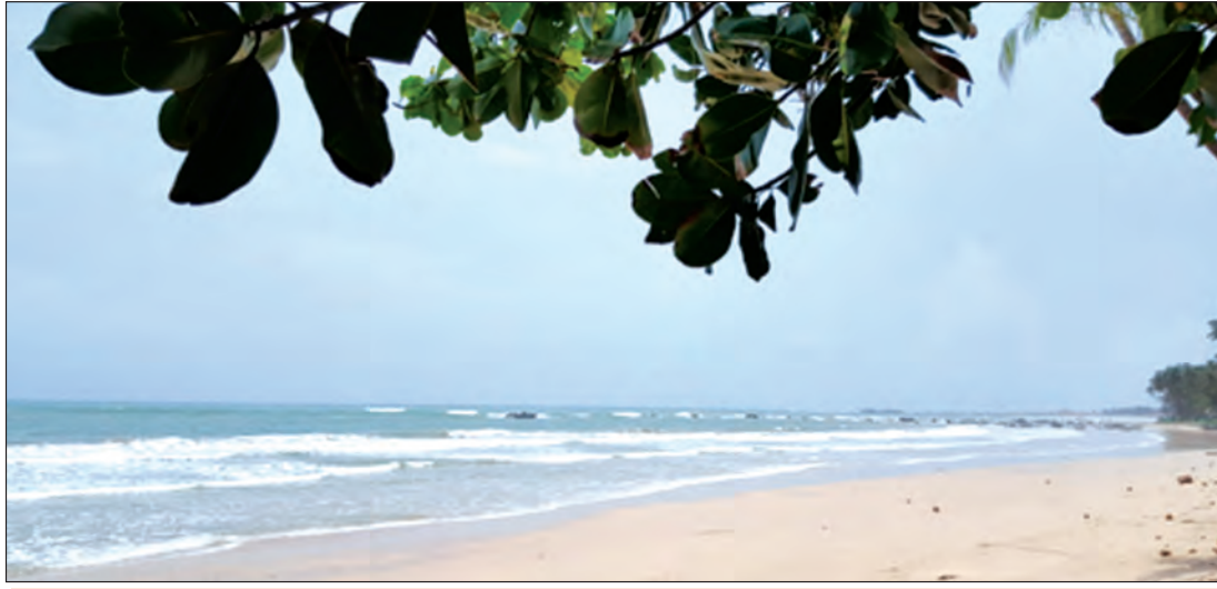
ရခိုင်ဒေသ၏ သာယာလှပသော ငပလီကမ်းခြေတစ်နေရာ