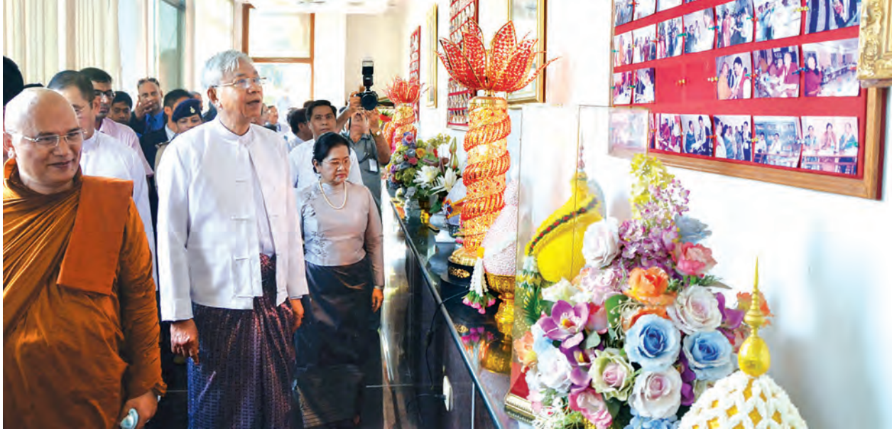
နိုင်ငံတော်သမ္မတ ဦးထင်ကျော်နှင့်ဇနီး ဒေါ်စုစုလွင်တို့ ပုဒ္ဓမြခန်းကို ကြည့်ရှုလေ့လာကြစဉ် (သတင်းစဉ်)

လှူဒါန်းသည်။ ဆက်လက်၍ နိုင်ငံတော်သမ္မတနှင့်ဇနီးတို့သည် စေတီတော်အထက်ပစ္စယာရှိ ပုဒ္ဓရုပ်ပွားတော်မြတ်အား ဖူးမြော်ကြည်ညိုပြီး ပန်း၊ ရေချမ်း၊ ဆီမီးတို့ကို ကပ်လှူပူဇော်သည်။ ထို့နောက် နိုင်ငံတော်သမ္မတနှင့်ဇနီးနှင့်အဖွဲ့သည် သတ္တသတ္တာဟ ခုနစ်ဌာနသို့ လှည့်လည်ဖူးမြော်ကြည်ညိုကာ ဆဋ္ဌမသတ္တာဟဖြစ်သည့် မုဗ္ဗလိန္ဒာအိုင်၌ ငါးစာကျွေးကြပြီး ပုဒ္ဓမြခန်းကို ကြည့်ရှုလေ့လာသည်။ ကုန်းဘောင်ခေတ် မင်းတုန်းမင်းသည် မဟာဗောဓိစေတီတော်ကို နောက်ဆုံး ပြုပြင်ခဲ့သည့်မင်းဖြစ်သည်။ ၁၈၇၁ ခုနှစ်တွင် မင်းတုန်းမင်းသည် မြောင်လှမြို့စားဝန်ထောက် သီရိမဟာဇေယျသူ ဦးဆောင်သည်ကိုယ်စားလှယ်အဖွဲ့ကို စေလွှတ်ပြီး ပုဒ္ဒဂယာစေတီတော်ကို ပြုပြင်ခွင့်ရရှိရန် အိန္ဒိယအစိုးရထံ မေတ္တာရပ်ခံခဲ့သည်။ မင်းတုန်းမင်းသည် ၁၈၇၇ခုနှစ်တွင် စေတီတော်အားပြုပြင်ခဲ့ပြီး မင်းတုန်းမင်းနတ်ရွာစံပြီးနောက် သီပေါမင်းက ဆက်လက်ဆောင်ရွက်ခဲ့ကြောင်း သိရသည်။ မင်းတုန်းမင်းကြီးသည် မဟာဗောဓိစေတီတော်သာမက အရံစေတီတော် လေးဆူကိုလည်း တည်ထားခဲ့သည်။ ယင်းနောက် နိုင်ငံတော်သမ္မတနှင့်အဖွဲ့သည် ဂယာမြို့ရှိ မင်းတုန်းမင်းကျောက်စာကို သွားရောက်ကြည့်ရှုလေ့လာသည်။ ထို့နောက် ဂျပန်ဘုရား (Daijokyo Buddhist Temple) အား သွားရောက်ဖူးမြော်ကြည်ညိုခဲ့ကြသည်။ (သတင်းစဉ်)