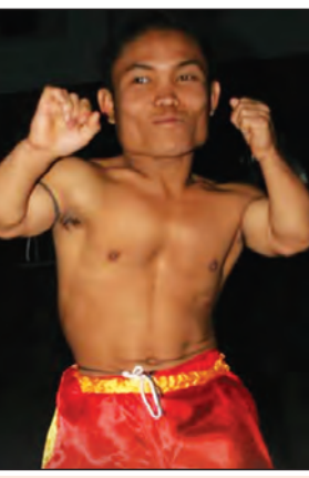
အာကာသမောင်(တောင်ကလေး)

နိုင်ငံတစ်ဝန်း ရိုးရာလက်ဝှေ့အမွေကိုဆက်ခံမယ့် ရွက်ပုန်းသီးမျိုးဆက်သစ်များ(သို့မဟုတ်)ကန့်လန့်ကာနောက်ကွယ်မှ ပုန်းလှိမ့်နေရတဲ့ မျိုးဆက်သစ်လက်ဝှေ့လူစွမ်းကောင်းများ စွမ်းရည် ပြသခွင့်နှင့်အတူ ပေါ်ထွက်ခွင့်ရကြတော့မှာဖြစ်ပါတယ်။ တကယ်တော့ ရိုးရာလက်ဝှေ့ဟာ အခြားအားကစားနည်းများနှင့်မတူ တစ်မူကွဲပြားနေတာကတော့ မျိုးဆက်သစ်ပြဿနာ ဖြစ်ပါတယ်။