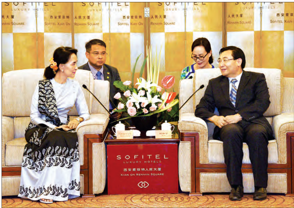
နိုင်ငံတော်၏အတိုင်ပင်ခံပုဂ္ဂိုလ် ဒေါ်အောင်ဆန်းစုကြည် ရှန်ရှီပြည်နယ် အုပ်ချုပ်ရေးမှူး Mr. Hu Heping နှင့် တွေ့ဆုံ ဆွေးနွေးစဉ် (သတင်းစဉ်)

* ရှေ့မှ ထိုနောက် နိုင်ငံတော်၏ အတိုင်ပင်ခံ ပုဂ္ဂိုလ်နှင့်အဖွဲ့သည် ခေတ္တတည်းခိုမည့် ဆိုဗီတယ်ဟိုတယ် (Sofitel Legend People's Grand) သို့ ရောက်ရှိကြသည်။