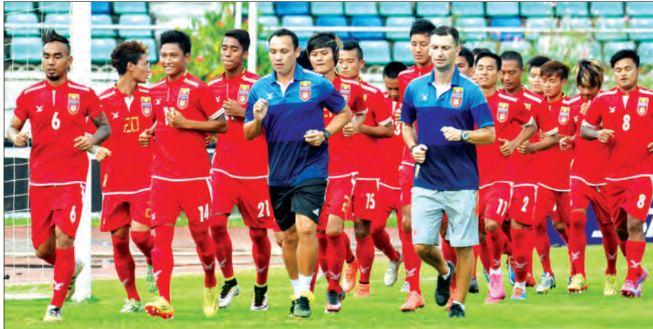
မြန်မာ့လက်ရွေးစင်အသင်း လေးနိုင်ငံစီတင်ပို့ပြိုင်ပွဲမတိုင်မီက လေ့ကျင့်နေစဉ်

အိမ်ရှင်အဖြစ် လက်ခံကျင်းပမည့် ၂၀၁၆ အာဆီယံဆုဇုကိုးဖလား ပြိုင်ပွဲတွင် အောင်မြင်မှုရရှိရေး လေ့ကျင့်ပြင်ဆင် နေသည့် မြန်မာ့လက်ရွေးစင်အသင်း သည် ပြိုင်ပွဲမတိုင်မီ ဥရောပ ငါးနိုင်ငံ၌ သွားရောက်လေ့ကျင့်မည်ဖြစ်သည်။ မြန်မာ့လက်ရွေးစင် အသင်း၏ ဥရောပလေ့ကျင့်ရေး ခရီးစဉ်မှာ စက်တင်ဘာ ၁၀ ရက်တွင် စတင်မည်ဖြစ် ပြီး အောက်တိုဘာ ၁၅ ရက်တွင် ပြန်လည်ရောက်ရှိမည်ဖြစ်ကာ ရက် ပေါင်း ၃၀ ကျော်ကြာမြင့်မည်ဖြစ်သည်။ စာမျက်နှာ ၁၄ ကော်လံ ၅ *