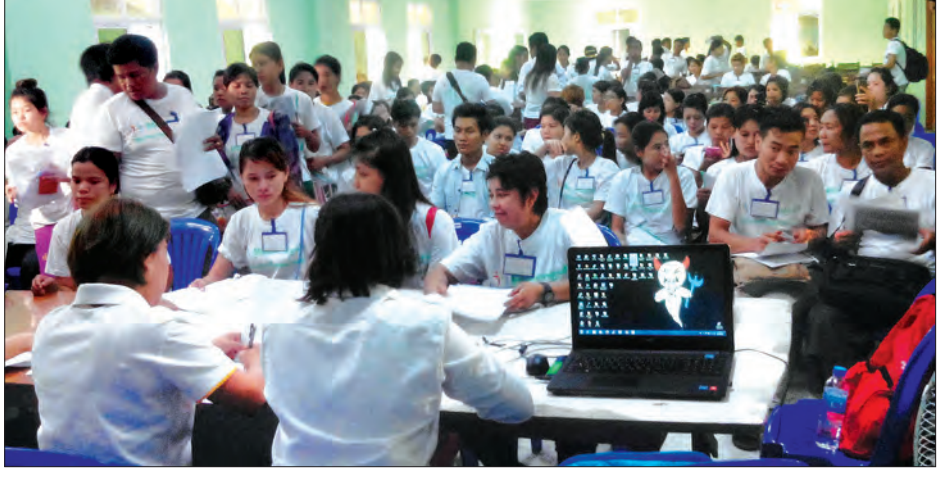
ထိုင်းနိုင်ငံသို့ သွားရောက်အလုပ်လုပ်ကိုင်ကြမည့် မြန်မာရွှေ့ပြောင်းအလုပ်သမားများ စာရင်းသွင်းနေစဉ်

သာ ကုန်ကျတော့မည်ဖြစ်၍ ငွေကျပ် တစ်သိန်းခွဲကျော်ဖြင့် သွားရောက် အလုပ်လုပ်ကိုင်နိုင်တော့မည် ဖြစ်ကြောင်း သိရသည်။ ယခင်က အလုပ်သမားအေဂျင်စီသို့ ပေးသွင်းရသည့် ဝန်ဆောင်ခမှာ ငွေကျပ်တစ်သိန်းခွဲ ဝန်ကြီးဌာနက သတ်မှတ်ထားသော်လည်း အမှန်တကယ် ငွေကျပ်နှစ်သိန်းမှ သုံးသိန်းကျန်ကျနေပြီး ထိုင်းဘက်ခြမ်းတွင်လည်း ဘတ်ငွေ