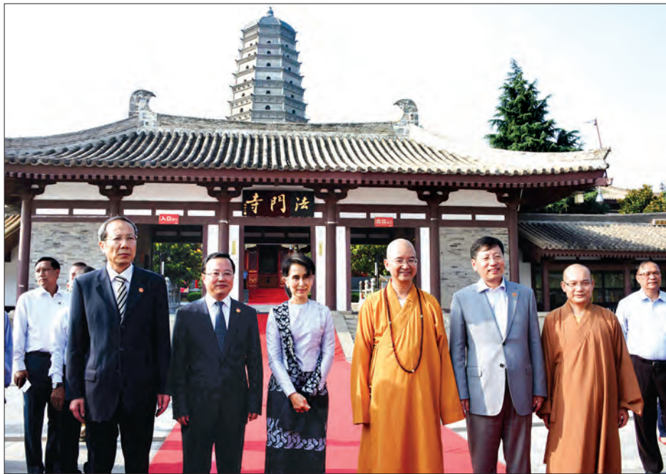
နိုင်ငံတော်၏အတိုင်ပင်ခံပုဂ္ဂိုလ် ဒေါ်အောင်ဆန်းစုကြည်နှင့်အဖွဲ့ ဖာမန်ကျောင်းတော်ရှေ့၌ ဘုန်းတော်ကြီးများနှင့်အတူ မှတ်တမ်းတင် ဓာတ်ပုံရိုက်စဉ် (သတင်းစဉ်)