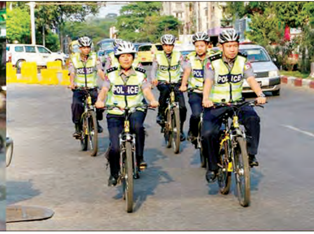
ရဲတပ်ဖွဲ့ဝင်များ ကင်းလှည့်စောင့်ရှောက်ခြင်းနှင့် လှည့်ကင်း/ရပ်ကင်းများ ဆောင်ရွက်စဉ်

ကမ်းပြိုကာကွယ်ရေးလုပ်ငန်း ၃၆ ခုအနက် ၁၀၀ ရာခိုင်နှုန်း ပြီးစီးပြီးလုပ်ငန်း ၂၈ ခု၊ ၆၅ ရာခိုင်နှုန်း ပြီးစီးသည့် လုပ်ငန်းတစ်ခု၊ ၆၀ ရာခိုင်နှုန်း ပြီးစီးသည့်လုပ်ငန်းနှစ်ခု၊ ၅၅ ရာခိုင်နှုန်း ပြီးစီးသည့်လုပ်ငန်း နှစ်ခု၊ ၅၀ ရာခိုင်နှုန်း ပြီးစီးသည့် လုပ်ငန်းနှစ်ခုတို့