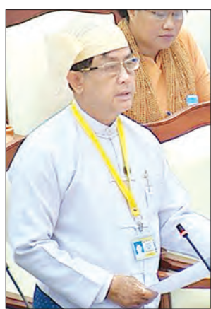
ဒုတိယဝန်ကြီး ဦးမောင်မောင်ဝင်း

ဖြစ်ရာ ၂၀၁၆ ခုနှစ် မတ်လ ၃၀ ရက်နေ့ရှိ ငွေလဲလှယ်နှုန်းဖြင့် တွက်ချက်၍ ညီမျှသည့် အမေရိကန်ဒေါ်လာတန်ဖိုးများဖြင့် ဖော်ပြထားခြင်းဖြစ်ပါကြောင်း၊ အချက်အလက်အပြည့်အစုံအား ပြည်သူ့လွှတ်တော်သို့ အသေးစိတ်တင်ပြထား ပြီးဖြစ်ပါကြောင်း ဖြေကြားသည်။ ဒုတိယဝန်ကြီးက ချေးငွေများ၏ သက်တမ်းအား ဆိုင်းငံ့ကာလအပါအဝင် ချေးငွေသက်တမ်းဖြင့် ပြုစုထားခြင်း ဖြစ်ကြောင်း၊ ဆိုင်းငံ့ကာလအတွင်းတွင် ချေးငွေထုတ်ယူသုံးစွဲသည့် ပမာဏအပေါ် ကျသင့်အတိုးကိုသာ ပေးဆပ်ရကာ ဆိုင်းငံ့ကာလ ကုန်ဆုံးသည့်အခါ ကျသင့်အတိုးအပြင် အရင်းကိုပါ အရစ်ကျစတင် ပေးဆပ်ရပါကြောင်း၊ အရင်း နောက်ဆုံးအရစ် ပေးချေပြီးသည့်အခါမှာသာ ၎င်းချေးငွေနှင့်ပတ်သက်၍ သက်ဆိုင်ရာ ချေးငွေပေးသည့် နိုင်ငံ/ အဖွဲ့အစည်းများနှင့် ချေးငွေစာရင်း ရှင်းလင်းမှု ပြီးပြတ်မည်ဖြစ်ကြောင်း ဖြေကြားသည်။ ပြည်ထောင်စုအဆင့် ဗဟိုအဖွဲ့အစည်းများ၊ ပြည်ထောင်စုဝန်ကြီးဌာနများ/ဦးစီးဌာနများသည် ဘဏ္ဍာရေးနှစ်အလိုက် ရအသုံးခန့်မှန်းခြေငွေစာရင်း