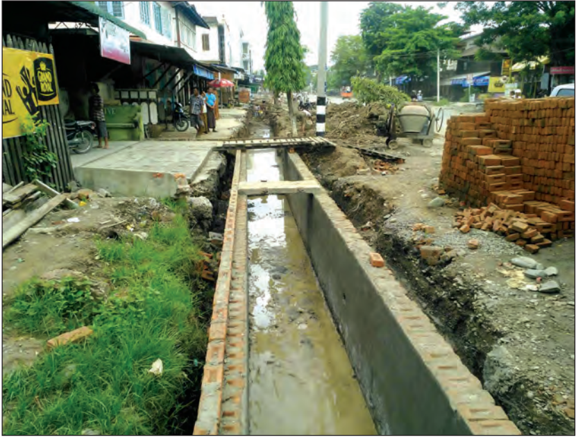
အဆိုပါရေမြောင်းတူးဖော်သည့်လုပ်ငန်းများ ပြီးစီး ပါက တာဝန်ရပ်ကွက် ဝိုလ်ချုပ်လမ်းမတစ်လျှောက် တွင် ရေလျှံမှုများ မရှိနိုင်တော့ဘဲ ပြည်သူများအတွက် လည်း သွားလာရေး အဆင်ပြေချောမွေ့စေမည်ဖြစ်

ယခင်က မြောင်းပိတ်ဆို့နေခြင်းကြောင့် မိုးရွာချိန် တွင် ကတ္တရာလမ်းမကြီးတစ်လျှောက် ရေများလျှံတက် စီးဆင်းလျက်ရှိသဖြင့် ရပ်ကွက်နှင့် မြို့ကို အကျဉ်းတန် စေခဲ့သည့်အပြင် ခရီးသွားပြည်သူများလည်း စိတ်ဒုက္ခ ရောက်ခဲ့ရကြောင်း၊ ထို့ကြောင့် လမ်းမပေါ်ရေလျှံမှုမှ ကင်းဝေးစေရန်အတွက် လမ်းဘေးမြောင်းကို တိုးချဲ့တူး ဖော်ခြင်းဖြစ်ပြီး ခရိုင်နှင့် မြို့နယ်စီမံခန့်ခွဲမှုကော်မတီ များက ကြီးကြပ်မတည်၍ လွှတ်တော်ရန်ပုံငွေ ပြည်သူ့ ဆောက်လုပ်ရေးလုပ်ငန်း လမ်းဦးစီးဌာန ရန်ပုံငွေနှင့် မြို့နယ်စည်ပင်သာယာရေးကော်မတီ ရန်ပုံငွေများဖြင့် တူးဖော်ခြင်းဖြစ်ကြောင်း သိရသည်။ လုပ်ငန်းဆောင် ရွက်မှုများကို တိုင်းဒေသကြီး လမ်းပန်းဆက်သွယ် ရေးဝန်ကြီးက ဩဂုတ် ၁၃ ရက်တွင် လာရောက် ကြည့်ရှုစစ်ဆေးခဲ့သည်။