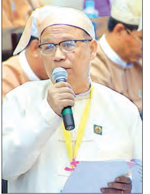
ပြည်ထောင်စုဝန်ကြီး ဦးသန်းစင်မောင် ဖြေကြားစဉ်

ပြီးစီးခဲ့သဖြင့် DVB-T2 ရုပ်သံထပ်ဆင့်လွှင့်စက်ရုံ ၁၄၄ ရုံမှ ဒီဂျစ်တယ်စနစ်ဖြင့် ထုတ်လွှင့်နိုင်ပြီဖြစ်ရာ တိုင်းရင်းသားရုပ်သံလိုင်း အစီအစဉ်များလည်း ထည့်သွင်းထုတ်လွှင့်လျက်ရှိပါကြောင်း၊ ထို့အတူ FM လွှင့်စက်ရုံ ၇၈ ရုံကိုလည်း တတိယအဆင့်တွင် အပြီးတည်ဆောက်နိုင်ခဲ့ပြီး ထုတ်လွှင့်လျက်ရှိပါကြောင်း ဖြေကြားသည်။ ဆက်လက်၍ ပြည်ထောင်စုဝန်ကြီးက ယခုလက်ရှိအချိန်တွင် နာဂကိုယ်ပိုင် အုပ်ချုပ်ခွင့်ရဒေသတွင် DVB-T2 ရုပ်သံထပ်ဆင့်လွှင့်စက်ရုံ တည်ဆောက်ထားရှိခြင်းမရှိသေးပါကြောင်း၊ လာမည့် ၂၀၁၉-၂၀၂၀ ဘဏ္ဍာရေးနှစ်တွင် တည်ဆောက်ရန် လျာထားပါကြောင်း၊ ထို့ကြောင့် DVB-T2 ရုပ်သံထပ်ဆင့်လွှင့်စက်ရုံ တည်ဆောက်ပြီးစီးသည့်အချိန်