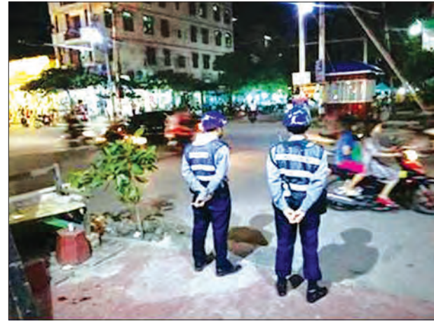
ရဲတပ်ဖွဲ့ဝင်များ ကင်းလှည့်စောင့်ရှောက်ခြင်းနှင့် လှည့်ကင်း/ရပ်ကင်းများ ဆောင်ရွက်စဉ်

နိုင်ငံရေးတက်ကြွလှုပ်ရှားသူများ၊ နိုင်ငံရေးဆက်နွယ်ပြီး အမှုရင်ဆိုင်နေကြရသူ များ၏အမှုများအား တရားရုံးများတွင် ရုပ်သိမ်းခြင်း/ပိတ်သိမ်းခြင်းတွင် အုပ်ချုပ် ရေးအဖွဲ့အဆင့်ဆင့်၊ ဥပဒေရုံးအဆင့်ဆင့်၊ တရားရုံးအဖွဲ့အစည်းအဆင့်ဆင့်တို့နှင့် ပူးပေါင်းဆောင်ရွက်ခဲ့ရာ ရုပ်သိမ်း/ပိတ်သိမ်းအမှုပေါင်း ၂၇၄ မှုနှင့် အမှုရင်ဆိုင်နေ ရသူ ၄၅၇ ဦးတို့အား ပြီးပြတ်အောင် ဆောင်ရွက်နိုင်ခဲ့ပါကြောင်း။