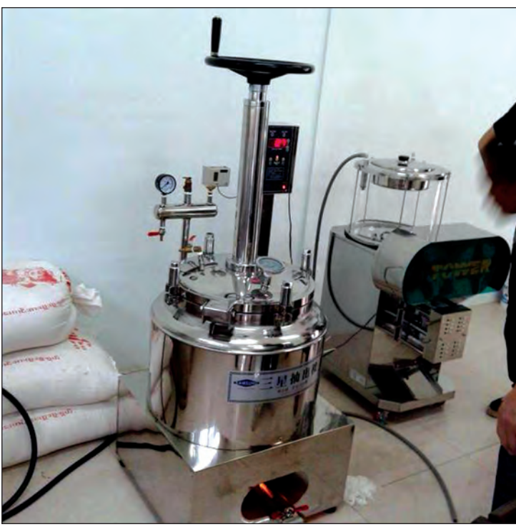
အစားအသောက်နည်းပညာသင်တန်းပို့ချရာတွင် အသုံးပြုသည့် ကိရိယာများ

University နှင့် Hanoi University of Science and Technology၊ မြန်မာနိုင်ငံမှ ရေဆင်း စိုက်ပျိုးရေးတက္ကသိုလ်နှင့် ရန်ကုန်တက္ကသိုလ်တို့ ဖြစ်ကြပါသည်။ ကိုရီးယားနိုင်ငံ ကွန်ဂျူးအမျိုးသားတက္ကသိုလ်တွင် အစားအစာနှင့် သိပ္ပံနည်းပညာဌာနမှ နှစ်အလိုက် သင်ကြားပေးနေသော ဘာသာရပ်များမှာ ပထမနှစ်တွင် အစားအစာသိပ္ပံဆိုင်ရာ အခြေခံသဘောတရားများ၊ အစားအစာ အဏုဇီဝဗေဒ၊ အစားအစာ ဩဂျစ် ဓာတုဗေဒ၊ အစားအစာသိပ္ပံနှင့် စက်မှုလုပ်ငန်းစသည့် ဘာသာရပ်များနှင့် အထောက်အကူပြု ဘာသာရပ်များ သင်ကြားပြီး ဒုတိယနှစ်တွင် အစားအစာ ဓာတုဗေဒ၊ အစားအစာ ပြုပြင်ထုတ်လုပ်ခြင်း၊ အစားအစာ ရူပဗေဒ၊ အချဉ်ဖောက်ခြင်းနည်းပညာ၊ နံစားသီးနှံ ပြုပြင်ထုတ်လုပ်ခြင်း၊ အင်ဂျင်နီယာဘာသာ၊ ဇီဝဓာတုဗေဒနှင့် အထောက်အကူပြု ဘာသာရပ်များ သင်ကြားပေးပါသည်။ တတိယနှစ်တွင် အစားအစာ ဇီဝနည်းပညာ၊ အင်ဇိုင်းများ အသုံးချနည်းပညာ၊ အစားအစာအရည်အသွေး ထိန်းချုပ်ခြင်း၊ အစားအစာဆိုင်ရာ အင်ဂျင်နီယာဘာသာရပ်နှင့် အထောက်အကူပြု ဘာသာရပ်များ သင်ကြားပေးပါသည်။ နောက်ဆုံးနှစ်တွင် အစားအစာသန့်ရှင်းရေး၊ အစားအစာ ကြာရှည်ထားခံရန် ပြုလုပ်ခြင်း၊ အစားအစာများ စစ်ဆေးနည်း ဓာတ်ခွဲခန်းဘာသာ၊ စားသုံးနိုင်သော ဆီနှင့် အဆီများ၊ အစားအစာ ဘေးကင်းလုံခြုံရေး စီမံခန့်ခွဲခြင်းပညာ၊ အစားအစာများ စနစ်တကျ ထုပ်ပိုးပြုပြင်ခြင်းနှင့် အထောက်အကူပြု စာတွေ့ လက်တွေ့ ဓာတ်ခွဲခန်းများနှင့် ကွင်းဆင်းလေ့လာခြင်းဘာသာရပ်များ သင်ကြားပေးပါသည်။ ရေဆင်းစိုက်ပျိုးရေးတက္ကသိုလ်တွင် ဂျပန်နိုင်ငံ JICA-TCP အစီအစဉ်အရလည်းကောင်း၊