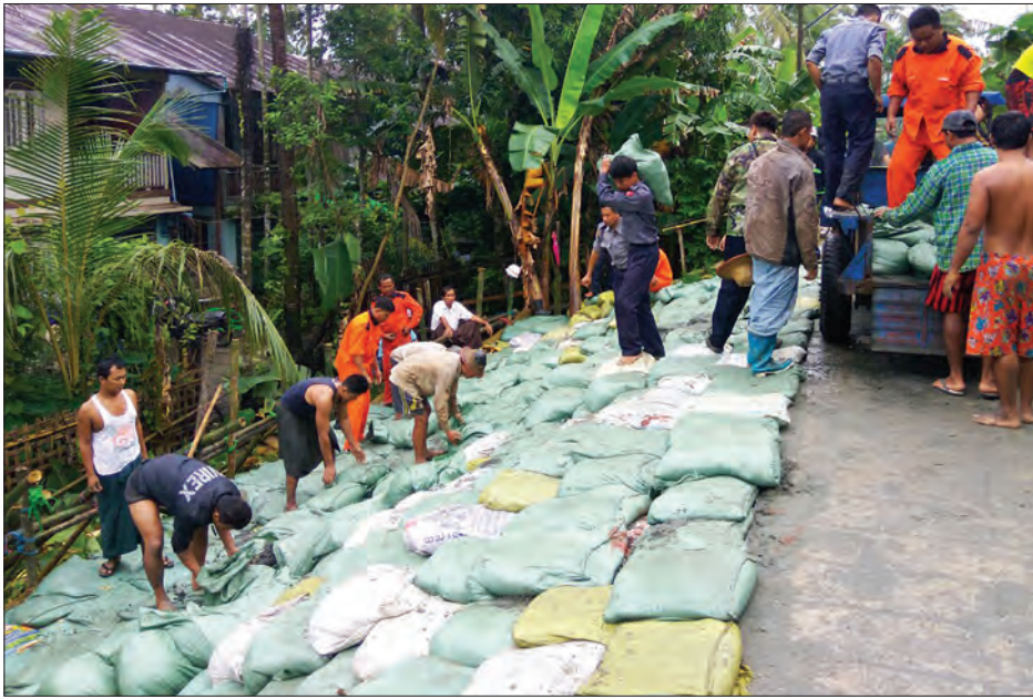
ကန်ကြီးထောင့် ဩဂုတ် ၁၆ ပုသိမ်ခရိုင် ကန်ကြီးထောင့်မြို့နယ် အမှတ်(၁)ရပ်ကွက်ရှိ ပဒေါင်းပိုင်းလမ်း တာသည် ဒါးကမြစ်ရေတိုးလာမှု ကြောင့် ဩဂုတ် ၁၃ ရက် နံနက်က တာအမြင့် ၁၂ ပေ၊ အရှည်ပေ ၄၀ ခန့်ရှိ မြေသားများတစ်ပေခွဲခန့် နိမ့်ကျသွားခဲ့ ကြောင်းသိရသည်။ အဆိုပါနေရာသို့ မြို့နယ်ရဲမှူးနှင့် နန်းထိုက် (ပြန်/ဆက်)

ရဲတပ်ဖွဲ့ဝင်များ၊ မြို့နယ်မီးသတ်ဦးစီးနှင့် တပ်ဖွဲ့ဝင်များ၊ ဒေသခံပြည်သူများ စုပေါင်း၍ ဝါးကတုတ်ရိုက်ခြင်း၊ ဂန်ရိုက်ခြင်း၊ သဲအိတ်များချခြင်း၊ တာဖို့ခြင်းတို့ကို အချိန်မီကာကွယ် ဆောင်ရွက်နိုင်ခဲ့ကြောင်း သိရသည်။ ဆက်လက်၍ မြို့မစည်ပင်သာယာ ဈေးထိပ်ရှိ တာကိုလည်း သဲအိတ်များ ဖြင့်တာဖို့ခြင်း၊ သဲစက်လှေများမှ သဲများကို စုပ်တင်ပြီးအဆင်သင့်သဲ အိတ်များထည့်၍ အရန်ထားရှိခြင်းတို့ကို လည်းဆောင်ရွက်ပေးခဲ့ကြောင်း သိရ သည်။