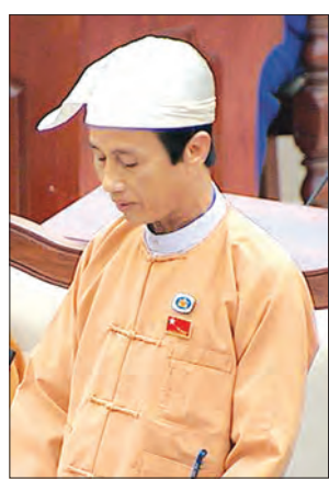
လှိုင်ဘွဲ့ မဲဆန္ဒနယ်မှ လွှတ်တော်ကိုယ်စားလှယ် ဦးခင်ချို

ဌာနများသည် မိမိတို့ရယူထားသည့် ချေးငွေ၏ စည်းကမ်းချက်များအပေါ် မူတည်၍လည်းကောင်း၊ ထုတ်ယူသုံးစွဲသည့် ချေးငွေပမာဏအပေါ် မူတည်၍လည်းကောင်း၊ အရင်းအတိုးပေးဆပ်ရမည့် အချိန်ဇယားများကို ရေးဆွဲပြီး ဘတ်ဂျက်အချိန်မီလျာထားခြင်း၊ အချိန်မီပေးဆပ်ခြင်းတို့ ဆောင်ရွက်ရပါကြောင်း ဒုတိယဝန်ကြီးက ဖြေကြားသည်။ စီမံကိန်းနှင့် ဘဏ္ဍာရေးဝန်ကြီးဌာန၊ ငွေတိုက်ဦးစီးဌာနတွင် ပြည်တွင်း/ပြည်ပကြေးမြီများကို စီမံခန့်ခွဲနိုင်ရန် ကြေးမြီစီမံခန့်ခွဲမှုဌာနခွဲကို ဖွဲ့စည်းထားရှိပြီး ၎င်းဌာနခွဲအနေဖြင့် နိုင်ငံတော်၏ အာမခံချက်ဖြင့် ရယူထားသည့် ပြည်ပချေးငွေများအပေါ် ပြည်ပချေးငွေပေးအပ်သည့် ခြိမ်းခြောက်မှု/အဖွဲ့အစည်းအလိုက်၊ ချေးငွေသုံးစွဲသည့်ဌာန/ အဖွဲ့အစည်းအလိုက် မှတ်တမ်းများထားရှိခြင်း၊ ချေးငွေတစ်ခုချင်းအလိုက် အရင်း/ အတိုး ပေးဆပ်ရမည့် အချိန်ဇယားများ ရေးဆွဲထားရှိခြင်း၊ ထိုအချိန်ဇယားများအပေါ် မူတည်၍ သက်ဆိုင်ရာဌာနများ၏ ဘတ်ဂျက်လျာထားမှု၊ ပြန်လည်ပေးဆပ်မှုတို့ကို ပေါင်းစပ်ညှိနှိုင်း ကြီးကြပ်ကွပ်ကဲခြင်း၊