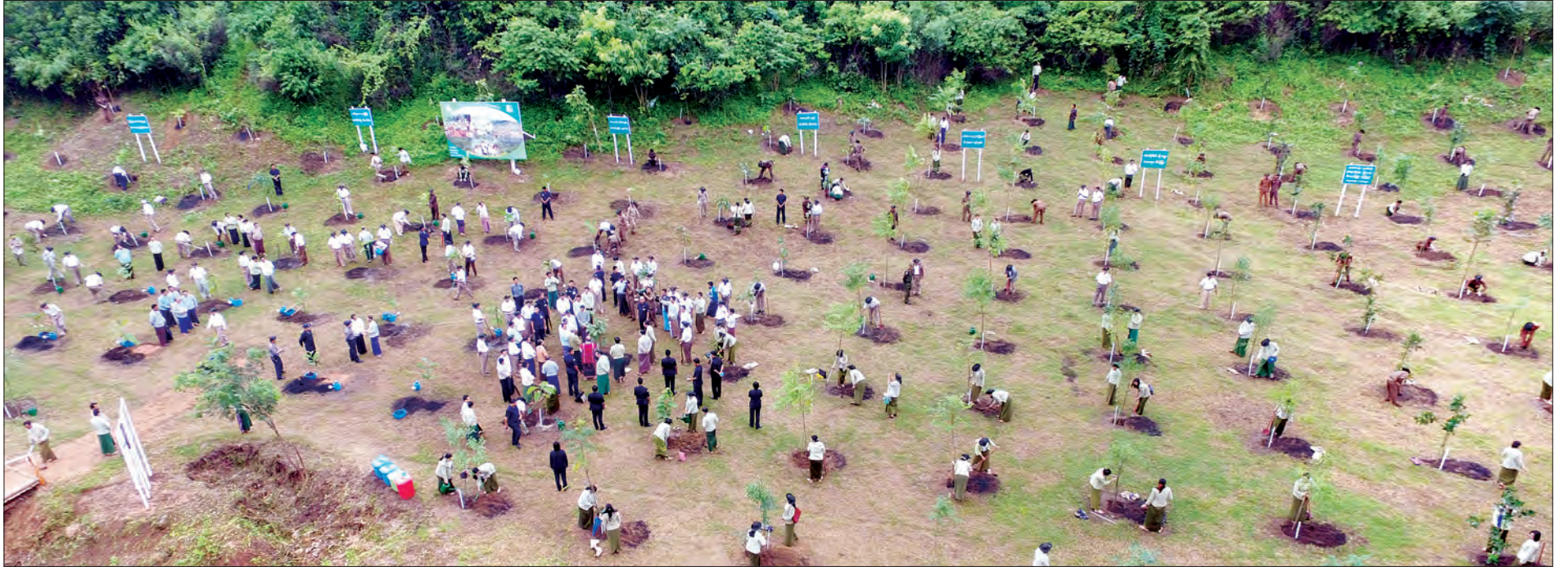
အမျိုးသားပတ်ဝန်းကျင် စီမံကိန်းဦးစီးဌာနမှ သစ်ပင်စိုက်ပျိုးပွဲကျင်းပစဉ်

* ရှေ့မှ ၂၀၁၆ ခုနှစ် မိုးရာသီတွင် သစ်ပင်စိုက်ပျိုးပွဲများကို နေပြည်တော်ကောင်စီ နယ်မြေ တိုင်းဒေသကြီးနှင့် ပြည်နယ်များတွင် အကြိမ်ရေ ၅၀၀ ကျော် ပြုလုပ်ခဲ့ပြီး ပြည်သူ့လူထု အင်အား ၁၂၀၀၀၀ ခန့် တက်ရောက်ကာ အပင်ပေါင်း ၃၅၀၀၀၀ ခန့်ကိုလည်း စိုက်ပျိုးခဲ့ပြီးဖြစ်သည်။