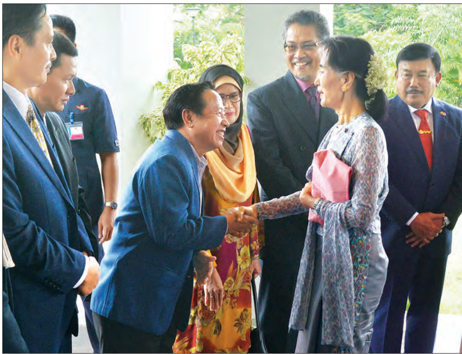
နိုင်ငံတော်၏အတိုင်ပင်ခံပုဂ္ဂိုလ်၊ နိုင်ငံခြားရေးဝန်ကြီးဌာန ပြည်ထောင်စုဝန်ကြီး ဒေါ်အောင်ဆန်းစုကြည် (၄၉)နှစ်မြောက် အာဆီယံနေ့အထိမ်းအမှတ်အဖြစ် တည်ခင်းစဉ်သည် နေ့လယ်စာစားပွဲသို့ တက်ရောက်လာကြသော အာဆီယံနိုင်ငံများမှ သံတမန်များအား ရင်းနှီးနှီးနှီးနှုတ်ဆက်စဉ် (သတင်းစဉ်)

အဆိုပါအခမ်းအနားသို့ စီမံကိန်းနှင့်ဘဏ္ဍာရေးဝန်ကြီးဌာန ပြည်ထောင်စုဝန်ကြီး၊ သာသနာရေးနှင့်ယဉ်ကျေးမှုဝန်ကြီးဌာန ပြည်ထောင်စုဝန်ကြီးနှင့်ဇနီး၊ နိုင်ငံခြားရေးဝန်ကြီးဌာန ဒုတိယဝန်ကြီးနှင့်ဇနီး၊ မြန်မာနိုင်ငံဆိုင်ရာ အာဆီယံ သံအမတ်ကြီးများနှင့်ဇနီးများ၊ အာဆီယံအသိုက်အဝန်း မဏ္ဍိုင်သုံးရပ်ဆိုင်ရာ ဝန်ကြီးဌာနများမှ အမြဲတမ်းအတွင်းဝန်များနှင့် တာဝန်ရှိသူများ တက်ရောက်ကြသည်။ (သတင်းစဉ်)