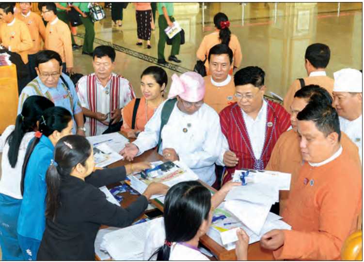
လွှတ်တော် တက်ရောက် လာသည့် အမျိုးသားလွှတ်တော်ကိုယ်စားလှယ်များ လက်မှတ် ရေးထိုးကြစဉ်

ကျောက်ရှာဖွေသူများနှင့် ပတ်သက်ပြီး ကုမ္ပဏီလုပ်ငန်းရှင်များ ရင်ဆိုင်ကြုံတွေ့နေရသောပြဿနာများကို မည်ကဲ့သို့ စီစဉ်ဆောင်ရွက်ပေးမည်ကို သိလိုကြောင်း” မေးခွန်းနှင့်စပ်လျဉ်း၍ စီမံကိန်းနှင့် ဘဏ္ဍာရေးဝန်ကြီးဌာန ဒုတိယဝန်ကြီး ဦးမောင်မောင်ဝင်းက ဖားကန့်ဒေသတွင် ရေမဆေးကျောက်ရှာဖွေသူများကို တားဆီးထိန်းချုပ်နိုင်ရေးအတွက် တရားဥပဒေစိုးမိုးရေးရရှိရန် ဦးစွာဆောင်ရွက်သင့်ပါကြောင်း၊ တရားဥပဒေစိုးမိုးပြီး အုပ်ချုပ်မှုအာဏာ သက်ရောက်မှသာ ရေမဆေးကျောက်ရှာဖွေသူများ၏ နှောင့်ယှက်မှုများကို တာကွယ်တားဆီးနိုင်ပြီး ကုမ္ပဏီများက တရားဝင်လုပ်ကိုင်ခွင့်ရ ကျောက်စိမ်းလုပ်ကွက်များကို ဥပဒေနှင့်အညီ စနစ်တကျတူးဖော်နိုင်ကြမည်ဖြစ်ပါကြောင်း၊ ဒေသအတွင်း တရားဥပဒေစိုးမိုးမှုရရှိနိုင်ရန်အတွက် တပ်မတော်နှင့် မြန်မာနိုင်ငံ ရဲတပ်ဖွဲ့က နယ်မြေစိုးမိုးရေးလုပ်ငန်းများကို လည်းကောင်း၊ ကချင်ပြည်နယ်အစိုးရအဖွဲ့နှင့် အထွေထွေအုပ်ချုပ်ရေးဦးစီးဌာနတို့က အုပ်ချုပ်ရေးလုပ်ငန်းများကို လည်းကောင်း ညှိနှိုင်းပေါင်းစပ်ဆောင်ရွက်သွားရမည်အပြင် ကျောက်စိမ်းတူးဖော်ခွင့်ရ ကုမ္ပဏီများ၊ ဒေသခံအုပ်ချုပ်ရေးအဖွဲ့များနှင့် ပြည်သူလူထု ပါဝင်ဆောင်ရွက်ရန် လိုအပ်ပါကြောင်း ဖြေကြားသည်။