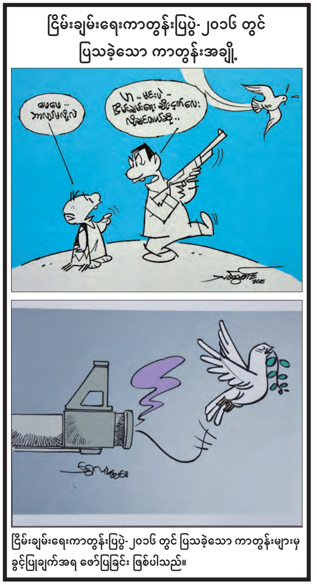
ငြိမ်းချမ်းရေးကာတွန်းပြပွဲ- ၂၀၁၆ တွင် ပြသခဲ့သော ကာတွန်းများမှ ခွင့်ပြုချက်အရ ဖော်ပြခြင်း ဖြစ်ပါသည်။ တိုင်းဒေသကြီး/ပြည်နယ်အလိုက် မိုးကြီးနိုင်မည့်အခြေအနေ နေပြည်တော် ဩဂုတ် ၁၅ မိုးလေဝသနှင့်ဇလဗေဒဌာနကြားမှ မိုးဦးစီးဌာနထုတ်ပြန်ချက်အရ မွန်ပြည်နယ်နှင့် ဧရာဝတီတိုင်းဒေသကြီးတို့၌ နေရာအနှံ့အပြားမိုးထစ်ချရန်ရွာပြီး ဒေသအလိုက် လည်းကောင်း၊ တနင်္သာရီ၊ ပဲခူး၊ ရန်ကုန်တိုင်းဒေသကြီးနှင့် ကရင်၊ ရခိုင်ပြည်နယ်တို့၌ နေရာကွက်၍ လည်းကောင်း မိုးကြီးနိုင်သည်။ (မြန်မာ့အလင်း)