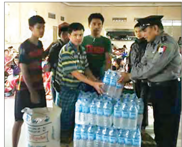
ပုသိမ်မြို့မရဲစခန်းမှူး ဒုရဲမှူး မျိုးသူ ဦးစီးတပ်ဖွဲ့ဝင်များက ၎င်းတို့၏ လစာများထဲမှ စုဆောင်းငွေများဖြင့် ပုသိမ်မြို့ စတုဘုမ္မိကဘုန်းကြီးကျောင်း၊ ထန်းကုန်းလေး ဘုန်းကြီးကျောင်းနှင့် အလက(၅)ကျောင်းများတွင်နေထိုင်သော ရေဘေးသင့် အိမ်ထောင်စု ၁၈၉ စုအတွက် ဆန်လေးအိတ်၊ ရေသန့်ကတ် ၁၀၀ တို့အား ဩဂုတ် ၁၄ ရက်က ထောက်ပံ့လှူဒါန်းစဉ် ကိုရဲ