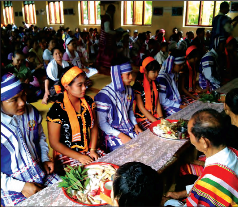
ပညာ အတတ်ပညာမြင့်မားသော လူမျိုးအဖြစ် အစဉ်တည်တံ့စေရန် စသည့် ရည်ရွယ်ချက်များဖြင့် နှစ်စဉ် ကျင်းပလျက်ရှိကြောင်း သိရသည်။ (မြို့နယ် ပြန်/ဆက်)