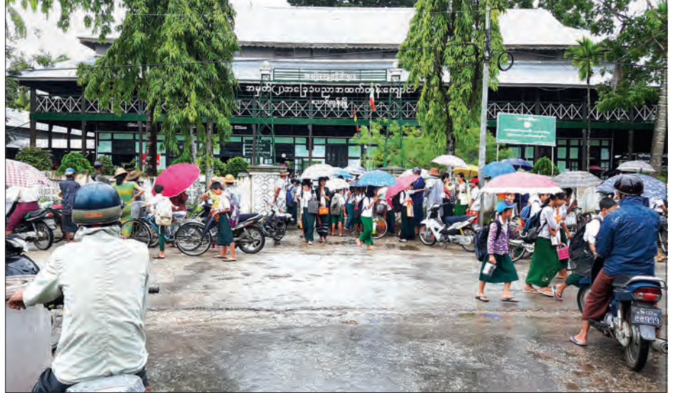
ညောင်တုန်းမြို့နယ်၌ ဧရာဝတီမြစ်ရေ ပြန်လည်ကျဆင်းသွားပြီဖြစ်၍ ဩဂုတ် ၁၄ ရက်ကစတင်၍ ခေတ္တပိတ်ထားခဲ့သော စာသင်ကျောင်းများ ပြန်ဖွင့်သဖြင့် ကျောင်းသား ကျောင်းသူများ ပျော်ရွှင်စွာ ကျောင်းတက်နေသည်ကို တွေ့ရစဉ်