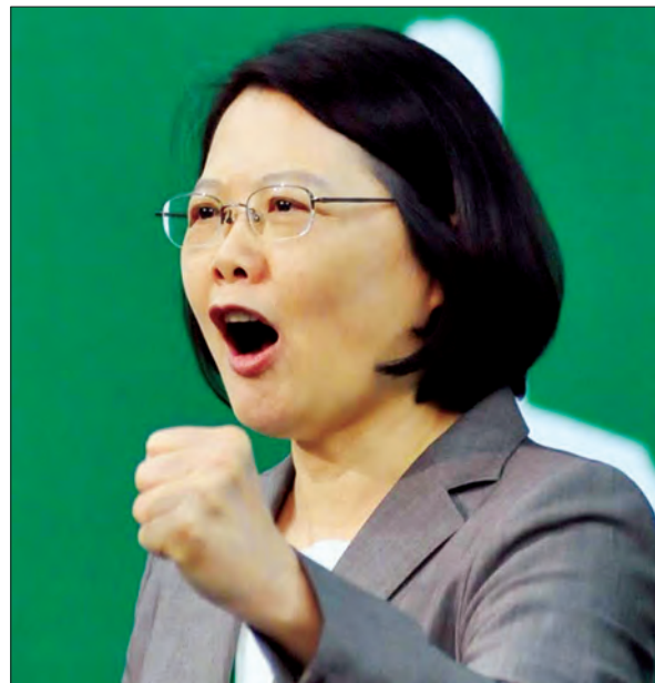
ထိုင်ဝမ်သမ္မတ ဆိုင်အင်ဝမ်

အေးစက်ကြာရှည်တဲ့နေ့ရာသီ နေ့ရာသီကာလဟာ ထိုင်ဝမ်အရှေ့ပိုင်းမှာ ကမ္ဘာလှည့်ခရီးသွားဝင်ရောက်မှုနှုန်း အများဆုံးအချိန်ကာလဖြစ်ပါတယ်။ ဒါပေမယ့် ၂၀၁၆ ခုနှစ်ရဲ့ နေ့ရာသီကတော့ အားလပ်ရက်ကို မှီခိုပြီး အသက်မွေးဝမ်းကျောင်း လုပ်ကိုင်သူတွေအတွက် အေးစက် မှုန်ပိုင်းလိုနေပါတယ်။ ပြည်မကြီးကနေ ထိုင်ဝမ်ကို ခရီးသွားလာရောက်မှုဟာ မေလနဲ့ ဇွန်လတွေမှာ ယခင်နှစ်နဲ့ယှဉ်ရင် ခရီးသွား ၈၀၀၀၀ ကျော်အထိ ထိုးကျခဲ့တယ်လို့ ထိုင်ဝမ်ခရီးသွားအေဂျင်စီကဆိုပါတယ်။ ဘုရင်မဦးခေါင်းပုံသဏ္ဍာန်ကျောက်ဆောင်ရှိတဲ့ Geopark ဥယျာဉ်မှာ မနှစ်က