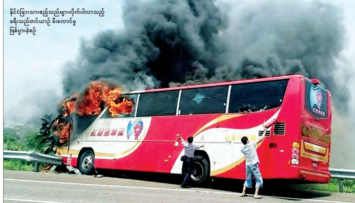
နိုင်ငံခြားသားဧည့်သည်များလိုက်ပါလာသည့် ခရီးသည်တင်ယာဉ် မီးလောင်မှု ဖြစ်ပွားခဲ့စဉ်

ဟိုတယ်တွေနဲ့ ခရီးသွားအေဂျင်စီတွေ လောက်သာ ဒီပြဿနာကို ခံစားကြရတာ မဟုတ်ပါဘူး။ ဟိုတယ်သုံး အဝေးပြေး ယာဉ်လိုင်းကုမ္ပဏီတွေ၊ ခရီးသွားဧည့်လမ်း ညွှန်တွေ၊ ဈေးဆိုင်တွေနဲ့ စားသောက် ဆိုင်ပိုင်ရှင်တွေအားလုံးလည်း ဒုက္ခတွေ့နေကြရပါတယ်။ ယခုနှစ်ထဲမှာ ဝင်ငွေရရှိမှု ၇၀ ရာခိုင်နှုန်းလောက်လျော့ကျသွားကြောင်းကို ဥယျာဉ်အတွင်းမှာရှိတဲ့ ရောင်းချ သူတစ်ဦးက ပြောပြခဲ့ပါတယ်။