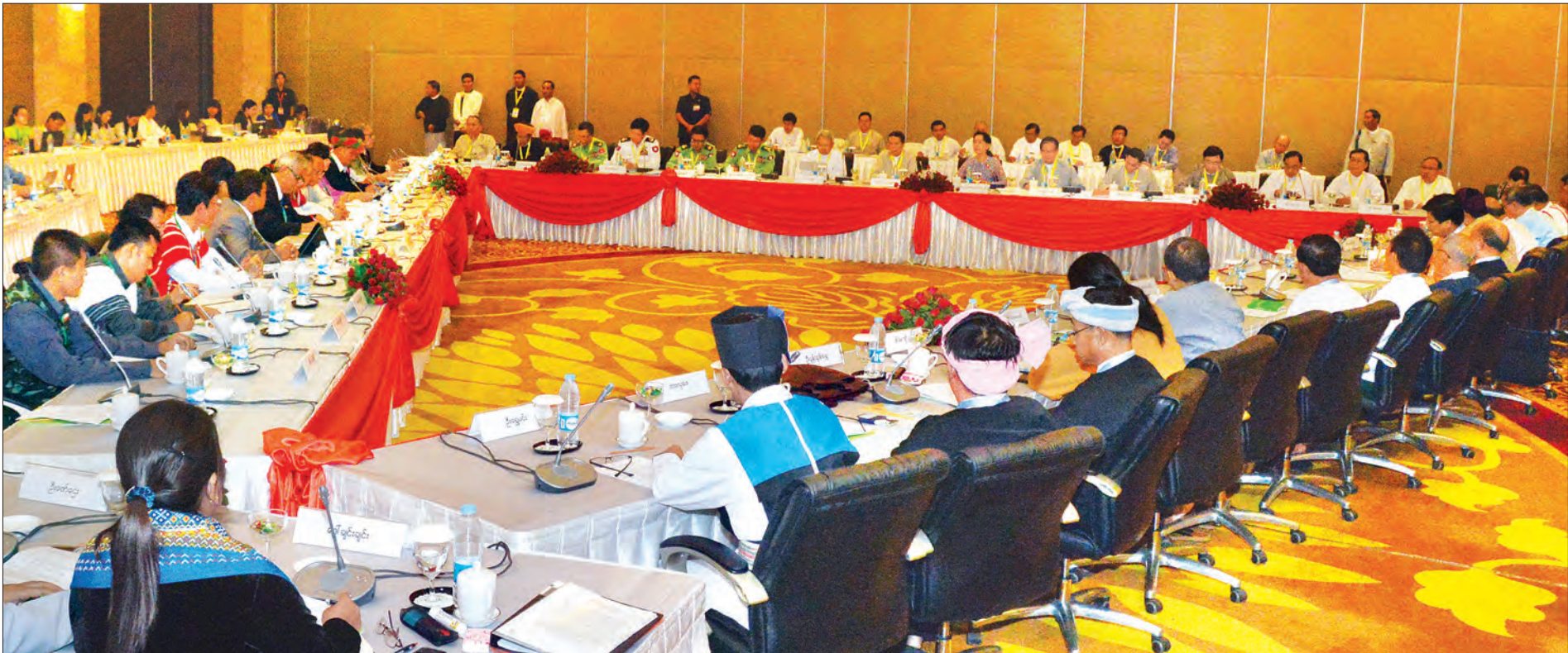
နေပြည်တော် ဩဂုတ် ၁၅

မိမိတို့နိုင်ငံအတွက် ငြိမ်းချမ်းရေးသည် အဓိကအရေးကြီးပါကြောင်း၊ မိမိတို့နိုင်ငံတွင် နိုင်ငံငြိမ်းချမ်းရေးမရရှိခြင်းမှာ မိမိတို့ ပြည်ထောင်စုသားများအားလုံး၏ ရုပ်ပိုင်းဆိုင်ရာလိုအပ်ချက်၊ စိတ်ပိုင်းဆိုင်ရာလိုအပ်ချက်များကို မဖြည့်ဆည်းနိုင်ခြင်းကြောင့် ဖြစ်ပါကြောင်း ပြည်ထောင်စုငြိမ်းချမ်းရေးဆွေးနွေးမှုပူးတွဲကော်မတီဥက္ကဋ္ဌ နိုင်ငံတော်အတိုင်ပင်ခံပုဂ္ဂိုလ် ဒေါ်အောင်ဆန်းစုကြည်က ပြည်ထောင်စုငြိမ်းချမ်းရေးဆွေးနွေးမှု ပူးတွဲကော်မတီ (UPDJC) အစည်းအဝေးတွင် ပြောကြားခဲ့သည်။ (အပေါ်ပုံ)