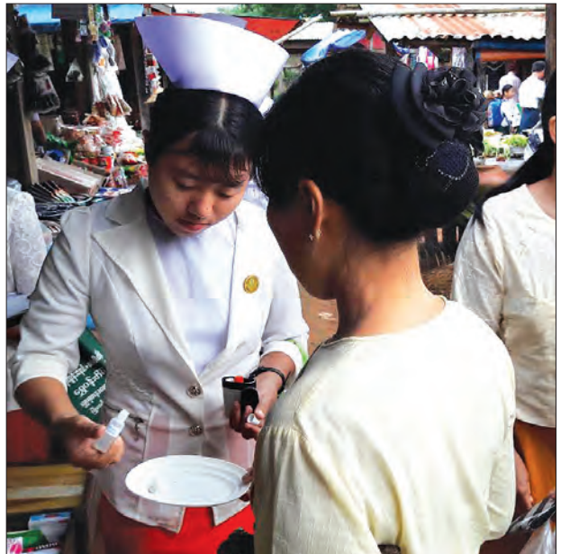
ကသာခရိုင် ပင်လည်ဘူးမြို့စည်ပင်ဈေး၌ မြို့နယ်ကျန်းမာရေးဌာန၊ မြို့နယ်စည်ပင်သာယာရေးကော်မတီအဖွဲ့နှင့် မြို့နယ်မိခင်နှင့်ကလေးစောင့်ရှောက်ရေးအသင်းတို့ ပူးပေါင်း၍ ဩဂုတ် ၁၃ ရက်က ပြည်သူများ နေ့စဉ်စားသုံးနေကြသော ဆားများ ကျန်းမာရေးနှင့် ညီ မညီ အိုင်အိုင်ဒင်းဓာတ်ပြည့်ဝမှု ရှိ မရှိတို့ကို စစ်ဆေးမှုများ ပြုလုပ်စဉ်။ မျိုးလွင် (ပင်လည်ဘူး)

ကျောက်ဖြူခရိုင် ကျောက်ဖြူမြို့နယ်အတွင်း အတက်ကျေးရွာ၊ ဝန်ကဲချိန်၊ ကနီးကျေးရွာများတွင် မိုးစပါးမျိုးသန့်မျိုးစေ့ထုတ်လုပ်သူများအသင်းမှ ဆောင်ရွက်လျက်ရှိသည့် မိုးစပါးမျိုးသန့်မျိုးစေ့ထုတ်လုပ်စိုက်ခင်းများကို ဩဂုတ်လဒုတိယပတ်က ရခိုင်ပြည်နယ် စိုက်ပျိုးရေးဦးစီးဌာန၊ ဦးတိုးဝေ၊ ကျောက်ဖြူခရိုင်စိုက်ပျိုးရေးဦးစီးဌာန၊ ဦးကျော်မိုးဝင်းနှင့် မြို့နယ်စိုက်ပျိုးရေးဦးစီးဌာနနှင့် ဝန်ထမ်းများနှင့်အတူ ကွင်းဆင်းစစ်ဆေးမှုများ ပြုလုပ်ပေးခဲ့ကြသည်။ ပြည်နယ်ဦးစီးဌာနက သဘာဝမြေဩဇာနှင့် ယူရီးယားမြေဩဇာကို အချိုးကျ စေ့စပ်၍ အချိန်ကိုက်သုံးစွဲနိုင်ရေး၊ ပိုးမွှားရောဂါကြိုတင်ကာကွယ်နှိမ်နင်းရေး မျိုးကွဲနှုတ်ပယ်ခြင်းလုပ်ငန်းများ စနစ်တကျလုပ်ကိုင်ဆောင်ရွက်ရေး ညွှန်ကြားခဲ့ကြောင်း သိရသည်။ (၁၅၇)