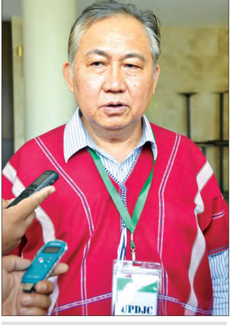
ပဒိုစောကွယ်ထူးဝင်း (UPDJC) ဒုတိယဥက္ကဋ္ဌ

မူဘောင်က အသေမဟုတ်ပါဘူး။ အခုညီလာခံအတွက်ကို အတည်ပြုလိုက်တာပါ။ နောင်လိုအပ်မယ်ဆိုရင် ဒီမူဘောင်ကို