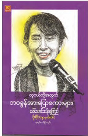
စာပေ၊ ရန်ကုန်မှ ထုတ်ဝေပြီး တန်ဖိုးငွေကျပ် ၂၀၀၀ ဖြစ်သည်။

တစ်ပြည်၏ သယံဇာတများဖြစ်သည့် ကျောင်းသား လူငယ်များအနေဖြင့် တိုင်းပြည်တာဝန်ကို တစ်နိုင်တစ်ပိုင် သယ်ပိုးဆောင်ရွက်နိုင်စေရန် စိတ်ခွန်အားအထောက်အကူဖြစ်စေမည့် စာအုပ်ကောင်းတစ်အုပ်ဖြစ်ကြောင်း စာရေးသူက အမှာစာရေးသားထားသည်။ မဇ္ဈိမ