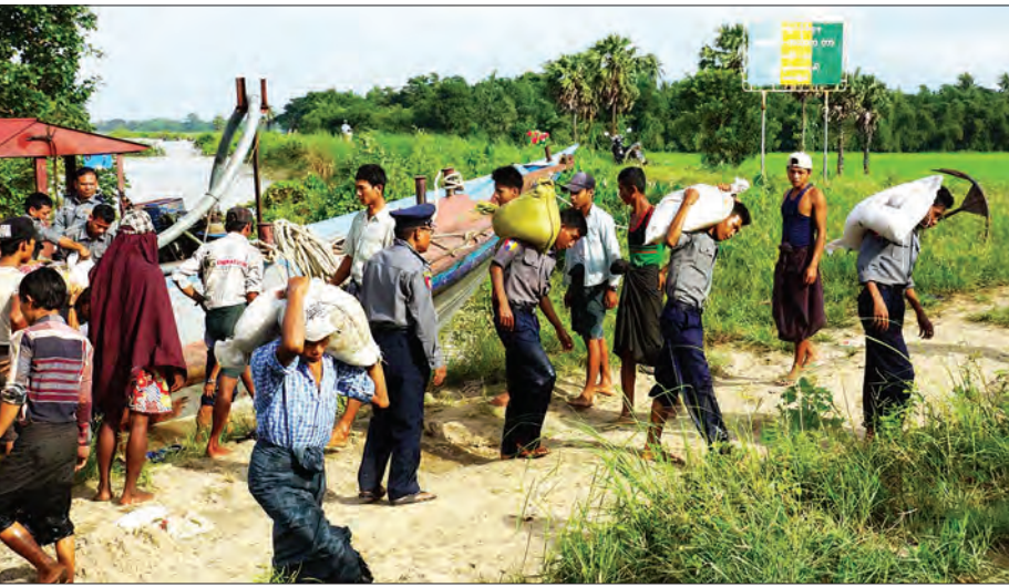
ဩဂုတ် ၁၁ ရက်က ရထားရဲစခန်းမှူး၊ ရဲအုပ်မောင်မောင်တို့နှင့် တပ်ဖွဲ့ဝင်များ ငဝန်တာ အိလျောကျသည့် နေရာများအား သဲအိတ်များဖြင့် ပြင်ဆင်ဆောင်ရွက်စဉ်