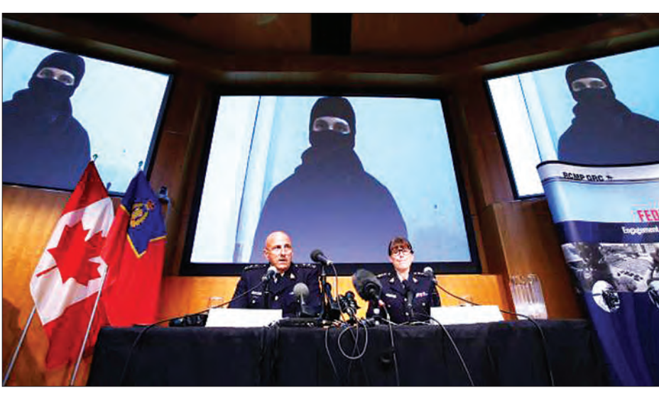
(RCMP) က သတင်းစာရှင်းလင်းပွဲ၌ ပြောကြားခဲ့သည်။ ရဲများက ၎င်းအသုံးပြုသည့် တက္ကစီ ကားနောက်ခန်းတွင် ဖောက်ခွဲပစ္စည်း တစ်ခု ထည့်ဝိတ်ထားခဲ့ရာမှ ပေါက်ကွဲသည့် ကား အပိုင်းအစိတ်အပိုင်းများကို အာဏာပိုင်များက ရရှိခဲ့သည်။ (ရိုက်တာ)

အန်တီယို ဩဂုတ် ၁၂ ဗုဒ္ဓဟူးနေ့က အန်တီယို၌ ကနေဒါ ရဲများ၏ စီးနင်းတိုက်ခိုက်မှုကြောင့် ၎င်း၏ နေအိမ်၌ သေဆုံးခဲ့သည့် အမျိုးသားမှာ အိုင်အက်စ် အစွန်းရောက်အဖွဲ့ကို ထောက်ခံအားပေးသူ တစ်ဦးဖြစ်ပြီး ကနေဒါနိုင်ငံရှိ မြို့ကြီးတစ်ခု၌ ပြည်တွင်း လုပ်လက်ပစ်ခတ်မှုဖြင့် တိုက်ခိုက်မှုလွန်ရန် စီစဉ်ကြံစည်နေသူဖြစ်ကြောင်း ရဲအဖွဲ့က ကြာသပတေးနေ့တွင် ပြောကြားခဲ့သည်။ ကြောက်မက်ဖွယ်ရာ တိုက်ခိုက်မှုကို ကြံစည်နေကြောင်း ဝီဒီယိုဖိုင်တစ်ခု အပါအဝင် အရေးကြီးသည့် သတင်း အချက်အလက်ကို အာဏာပိုင်များထံမှ ရရှိပြီးသည့်နောက် မြို့ငယ်တစ်ခု၌ စတုရက်ထရိုင်ရှိ အာရုံခံခန့်ခွဲရေးအိမ်သို့ ရဲများက သွားရောက်ဖမ်းဆီးခဲ့ကြောင်း တော်ဝင်ကနေဒါရဲတပ်ဖွဲ့