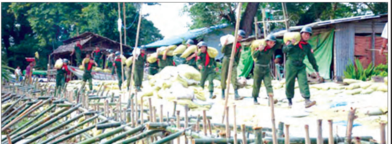
ရန်ကုန်တိုင်းစစ်ဌာနချုပ်မှ တပ်မတော်သားများ ရေတိုက်စားသွားသည့် တာပေါင်များအား သဲအိတ်များဖြင့် တာဖို့ဆောင်ရွက်စဉ်