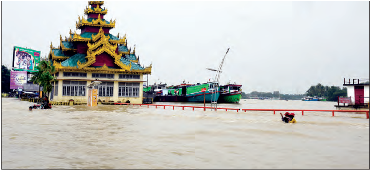
ဝန်ကြီးရေတိုးမှုကြောင့် ပုသိမ်မြို့ကမ်းနားလမ်း ရေကြီးနေမှုကို တွေ့ရစဉ်

ရွက်ရမည့် အစီအမံများကို ဖြည့်စွက် တင်ပြသည်။ ဆက်လက်၍ ပြည်ထောင်စုဝန်ကြီး ဒေါက်တာဝင်းမြတ်အေးက ရေဘေး ကယ်ဆယ်ရေးလုပ်ငန်းများ ထိရောက် မြန်ဆန်စေရန် အထက်မြန်မာပြည်၊ အောက်မြန်မာပြည် နှစ်ပိုင်းခွဲ၍ ဆောင် ရွက်နေမှု၊ ရေဘေးသင့်ပြည်သူများအား ရေကျသည်အထိ ရိက္ခာထောက်ပံ့ပေးနိုင်