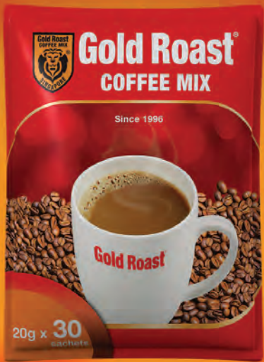
မူလအရသာထက်ပိုမိုလေးနက်သော အရသာသစ် Gold Roast Original