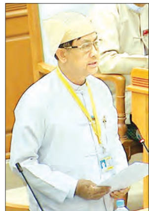
ဦးမောင်မောင်ဝင်း ဒုတိယဝန်ကြီး

နိုင်ငံတော်အနေဖြင့် အရအသုံးဘတ်ဂျက် အနေအထားအရ ပြည်တွင်း ပြည်ပ ကြေးမြီများ တင်လျက်ရှိနေပါကြောင်း၊ နိုင်ငံတစ်ခု၏ စီးပွားရေးဖွံ့ဖြိုးတိုးတက်မှုနှင့် စီးပွားရေးခိုင်မာတောင့်တင်းမှုတို့ကို တိုင်းတာရာတွင် ကြေးမြီအခြေအနေကိုလည်း လေ့လာသုံးသပ်တိုင်းတာလေ့ရှိကြပါကြောင်း၊ နိုင်ငံတော်၏ စီးပွားရေးဖွံ့ဖြိုးတိုးတက်ရေးနှင့် တည်ငြိမ်အေးချမ်းရေးတို့အတွက် ကြေးမြီစီမံခန့်ခွဲမှုကောင်းမွန်ရန်လိုအပ်ကြောင်း၊ စီမံကိန်းနှင့် ဘဏ္ဍာရေးဝန်ကြီးဌာန ဒုတိယဝန်ကြီး ဦးမောင်မောင်ဝင်းက ပြောကြားသည်။