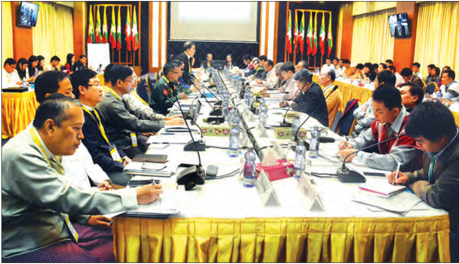
နိုင်ငံရေးဆွေးနွေးမှုဆိုင်ရာမူဘောင် ပြန်လည်သုံးသပ်ခြင်း ဒုတိယနေ့အစည်းအဝေး ကျင်းပစဉ်

ရန်ကုန် ဩဂုတ် ၁၂ ပြည်ထောင်စုငြိမ်းချမ်းရေးညီလာခံ (၂၀)ရာစု ပင်လုံအစည်းအဝေးကြီး အဆင်ပြေစွာကျင်းပနိုင်ရေး နိုင်ငံရေး ဆွေးနွေးမှုဆိုင်ရာမူဘောင် ပြန်လည် သုံးသပ်ခြင်း ဒုတိယနေ့ အစည်း အဝေးကို ယနေ့နံနက် ၁၀ နာရီတွင် ရန်ကုန်မြို့အမျိုးသားပြန်လည်သင့်မြတ် ရေးနှင့် ငြိမ်းချမ်းရေးဗဟိုဌာန (NRPC) ၌ ကျင်းပခဲ့ရာ တစ်နိုင်ငံလုံး ပစ်ခတ်တိုက် ခိုက်မှုရပ်စဲရေးစာချုပ် (NCA) လက်မှတ် ရေးထိုးထားသည့် တိုင်းရင်းသား လက် နက်ကိုင်အဖွဲ့များနှင့် NCA လက်မှတ် ရေးထိုးထားခြင်း မရှိသေးသော တိုင်းရင်းသားလက်နက်ကိုင်အဖွဲ့ ရှစ်ဖွဲ့ အပါအဝင် စုစုပေါင်း ၁၆ ဖွဲ့ တက်ရောက် ဆွေးနွေးခဲ့ကြောင်း သိရသည်။ “အဓိက ဒီနေ့ဆွေးနွေးတာကတော့ အရင်တုန်းက မူဘောင်တွေရေးတဲ့အခါ မှာ နည်းပညာပိုင်းအရ တချို့ကိစ္စတွေမှာ ပြီးပြတ်အောင် မဆွေးနွေးနိုင်ခဲ့တာတွေ ရှိတယ်။ ဒါတွေကို ပြန်လည်ဆွေးနွေး