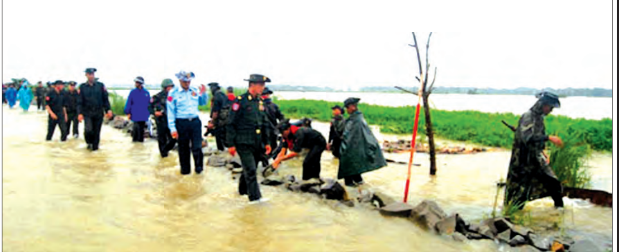
ရန်ကုန်-ပုသိမ်ကားလမ်းရေကျော်မှုအား သဲအိတ်ချခြင်းနှင့် ကျောက်စီခြင်းလုပ်ငန်းကို အနောက်တောင်တိုင်းစစ်ဌာနချုပ်မှ တပ်မတော်သားများက ဆောင်ရွက်ပေးစဉ်