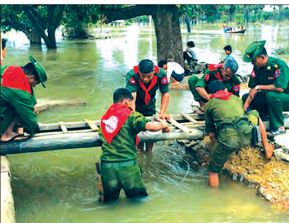
အလယ်ပိုင်းတိုင်းစစ်ဌာနချုပ်မှ တပ်မတော်သားများ ရေတိုက်စားသွားသော တံတားအား ယာယီပြန်လည်တည်ဆောက်ပေးစဉ်