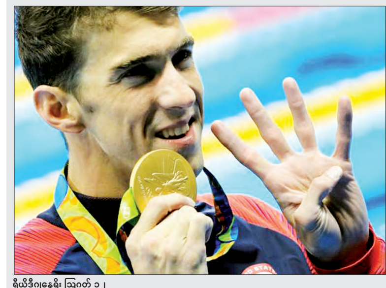
ရီယိုဒီဂျနေရီး ဩဂုတ် ၁၂ အမေရိကန်နိုင်ငံမှ အိုလံပစ်ကစားသမား မိုက်ကယ်ဖဲလ်သည် ၎င်း၏ပြိုင်ပွဲဝင် သက်တမ်းတစ်လျှောက် ၂၂ ခုမြောက် ဆုတံဆိပ်ရရှိခဲ့ပြီးနောက် ကြာသပတေးနေ့က မီတာ ၂၀၀ တစ်ဦးချင်း အလွတ်ရေကူးပြိုင်ပွဲတွင် ရွှေတံဆိပ်ဆုထပ်မံရရှိကာ အားကစားပြိုင်ပွဲလေးခုတွင် ရွှေတံဆိပ်ဆုလေးခုရရှိသည်။ (ရိုက်တာ)

ပထမဆုံးသော ရေကူးချန်ပီယံ ဖြစ်လာခဲ့သည်။ ဂျပန်နိုင်ငံမှ ချန်ပီယံကို ဆုတံဆိပ်ဆုရရှိပြီး တရုတ်နိုင်ငံမှ ပြိုင်ပွဲဝင် ဝမ်ရှန်က ကြေးတံဆိပ်ရရှိခဲ့သည်။ ယခု အနိုင်ရရှိမှုသည် အသက် ၃၁ နှစ်ရှိပြီဖြစ်သည့် ဖဲလ်အတွက် အံ့မခန်းရေကူးယှဉ်ပြိုင်ပွဲဖြစ်သည်။ နှစ်နှစ်ကြာ ဝင်ရောက်ယှဉ်ပြိုင်မှု ရပ်နားထားပြီးသည့် နောက် ၎င်း၏ ဝါးကြိမ်မြောက်အိုလံပစ်ပြိုင်ပွဲဝင်ရောက် ယှဉ်ပြိုင်မှုတွင် တစ်ဦးချင်း ယှဉ်ပြိုင်မှု ရွှေတံဆိပ်ဆုနှင့် အုပ်စုလိုက် ယှဉ်ပြိုင်မှု ရွှေတံဆိပ်ဆုတို့ကို ဆွတ်ခူးရရှိခြင်းဖြစ်သည်။ ဖဲလ်သည် ယခုအခါ ဆုတံဆိပ်ပေါင်း ၂၆ ခုကို လက်ဝယ်ပိုင်ဆိုင်ထားပြီဖြစ်ပြီး ၎င်း၏ ဆုတံဆိပ်များအနက် ရွှေတံဆိပ် ၁၃ ဆုကို တစ်ဦးချင်းပြိုင်ပွဲများမှ ရရှိခဲ့ပြီး ကျန်သည့်ဆုတံဆိပ်များကို အုပ်စုလိုက်ပြိုင်ပွဲများမှ ရရှိခဲ့ခြင်းဖြစ်သည်။ ဖဲလ်က “ပြိုင်ပွဲအပြီးမှာ ကျွန်တော့်တစ်ကိုယ်လုံး နာကျင်ကိုက်ခဲနေပြီး ခြေထောက်တွေလည်း နာကျင်ခဲ့ရပါတယ်” ဟု သတင်းထောက်များသို့ ပြောကြားခဲ့သည်။ ဖဲလ်သည် ၂၀၁၂ ခုနှစ်က လန်ဒန်၌ ရွှေတံဆိပ်လေးခု ဆွတ်ခူးခဲ့ပြီးဖြစ်သော်လည်း ၎င်းအနေဖြင့် ပြင်ဆင်လေ့ကျင့်ခဲ့မှု အပေါ် အားရကျေနပ်မှုမရှိကြောင်း ပြောကြားခဲ့သည်။ (ရိုက်တာ)