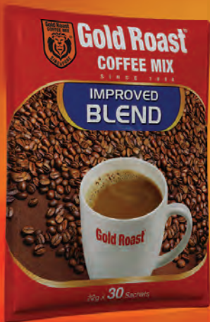
Ground ကော်ဖီအရသာ အပြည့်ပါတဲ့ Gold Roast Improved Blend