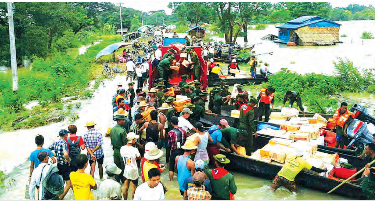
ဩဂုတ် ၁၁ ရက်က ၂၀-အဖျောက် ကားလမ်းရေကျော်စဉ် တပ်မတော်သားများနှင့် လူမှုရေးအဖွဲ့စည်းများက ခရီးသွားပြည်သူများအား ကူညီဆောင်ရွက်ပေးစဉ်