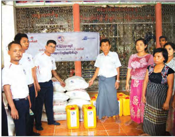
ဩဂုတ် ၁၁ ရက်က ရေဘေးသင့်ပြည်သူများအတွက် ရေအိုးများဖြန့်ဖြူးပေးခြင်း၊ Max Myanmar Holding နှင့် ရေအိုးကုမ္ပဏီတို့က ရေအိုးများကို အခမဲ့အိတ် ၃၀ နှင့် ဆီ ၁၀ ပိဿာဝင် ၁၀ ပုံးစီ ပေးအပ်လှူဒါန်းစဉ်