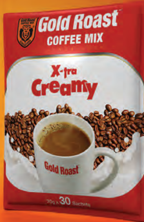
ချိုချိုဆိပ်ဆိပ်လေးနဲ့ကောင်းတဲ့ နို့ကော်ဖီအရသာ Gold Roast X-tra Creamy