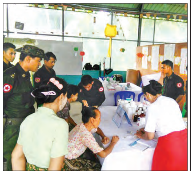
ဩဂုတ် ၁၂ ရက်က အမှတ် (၆) စစ်မြေပြင်ဆေးတပ်ရင်း စစ်ဘက်ရေးရာပါရဂူအဖွဲ့မှ ညောင်တုန်း ရေဘေးရှောင်ပြည်သူများအား အခမဲ့ဆေးကုသဆောင်ရွက်ပေးစဉ်