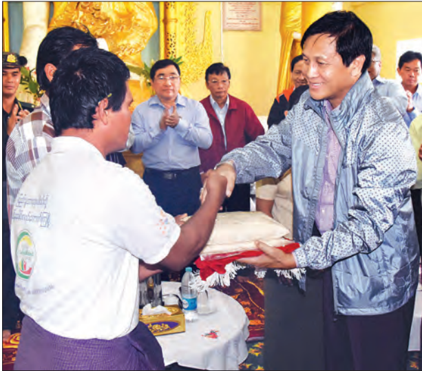
ဒုတိယသမ္မတ ဦးဟင်နရီဗန်ထီးယူ ပုသိမ်မြို့၊ တာဝတီ သာဘုရားဝင်းအတွင်းရှိ ရေဘေး ကယ်ဆယ်ရေးစခန်း၌ ရေဘေးသင့်ပြည်သူတစ်ဦးအား စားသောက်ကုန်ပစ္စည်းများ ပေးအပ်စဉ်

ရေး၊ ထောက်ပံ့ပေးမှုများနှင့်ပစ္စည်းများ ကို ရေဘေးသင့်ပြည်သူများထံ တိုက်ရိုက် ရောက်ရှိရေးနှင့် ပူးပေါင်းဆောင်ရွက်သွား ရမည့် လုပ်ငန်းစဉ်များကို ရှင်းလင်းတင်ပြ ပြီး တိုင်းဒေသကြီးဝန်ကြီးချုပ် ဦးမန်း ဂျော်နီက ကယ်ဆယ်ရေးပစ္စည်းများ ရေဘေးသင့်ပြည်သူများထံ အချိန်မီ ရောက်ရှိရေး ဆောင်ရွက်လျက်ရှိလှည့် အခြေအနေများကို ဖြည့်စွက်တင်ပြသည်။ တင်ပြချက်များအပေါ် ဒုတိယ သမ္မတက ကယ်ဆယ်ရေးပစ္စည်းများ ရေဘေးသင့်ပြည်သူများထံ အချိန်မီ ရောက်ရှိမှုသာ အကျိုးသက်ရောက်မှုရှိ မည် ဖြစ်ကြောင်း၊ ကယ်ဆယ်ရေးပစ္စည်း များကို ရေဘေးသင့်ပြည်သူများထံ အမြန်ဆုံး ရောက်ရှိရေးအတွက် တာဝန်ရှိ သူ အဆင့်ဆင့်က အထူးကြပ်မတ်ဆောင် ရွက်သွားရန်နှင့် ရေဘေးကာကွယ်ရေး အတွက် တာတမံများအား ဦးစားပေး