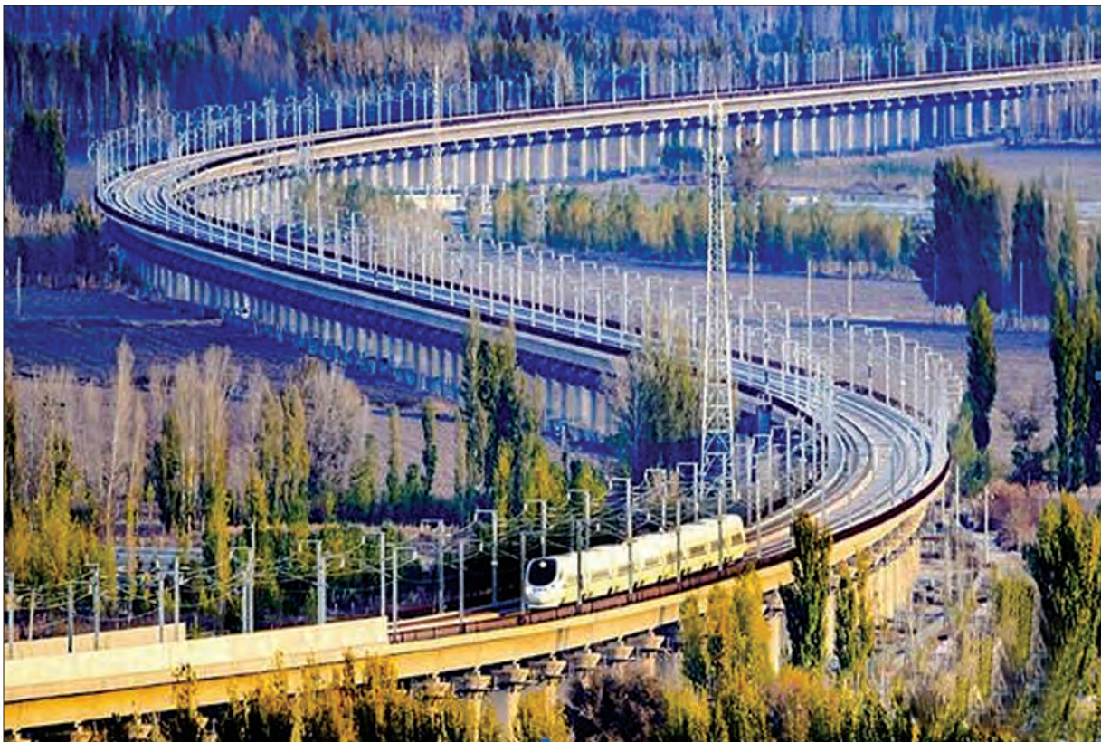
တရုတ်နိုင်ငံ၏ စီးပွားရေးဖွံ့ဖြိုးတိုးတက်မှုဆိုင်ရာပုံစံမှာ ကားလမ်း၊ ရထားလမ်း၊ ဆိပ်ကမ်း၊ လေဆိပ် စသည့် အခြေခံအဆောက်အအုံများ ဖွံ့ဖြိုးတိုးတက်ရေး လုပ်ငန်းများအပေါ်တွင် အများအပြားရင်းနှီးမြှုပ်နှံဆောင်ရွက်ခြင်းဖြစ်သည်။

သို့သော်လည်း ရပ်ဝန်းတစ်ခု လမ်းကြောင်းတစ်ခု အစီအစဉ်ဟာ အောင်မြင်မှု ရရှိမှာလားဆိုတဲ့မေးခွန်းကို မေးမြန်းဖို့လည်း အရေးကြီးတဲ့ အကြောင်းပြချက်တွေ ရှိနေပါတယ်။ အခြေခံ အဆောက်အအုံဖွံ့ဖြိုးတိုးတက်ရေးကို ဦးစားပေးတဲ့ပုံစံဟာ တရုတ်နိုင်ငံမှာ အခုအချိန်အထိ အောင်မြင်မှုရရှိနေတာဟာ တရုတ်အစိုးရအနေနဲ့ နိုင်ငံတွင်းမှာရှိနေတဲ့ နိုင်ငံရေးအနေအထားကို ထိန်းချုပ်ထားနိုင်လို့ဖြစ်ပါတယ်။ ဒီလိုအခြေအနေမျိုးဟာ တရုတ်နိုင်ငံ ပြင်ပမှာနဲ့ တခြားစီဖြစ်ပါတယ်။ နိုင်ငံရေးအရ တည်ငြိမ်မှုမရှိခြင်း၊ ပဋိပက္ခများ ဖြစ်ပွားနေခြင်းနဲ့ လာဘ်ပေးလာတဲ့ယူမှုတွေ ရှိနေတဲ့ နိုင်ငံတွေအတွက် တရုတ်နိုင်ငံရဲ့ ဖွံ့ဖြိုးတိုးတက်မှုပုံစံဟာ မူလရည်ရွယ်ချက်ကို မရောက်ဘဲ လမ်းလွဲသွားစေနိုင်ပါတယ်။ တရုတ်နိုင်ငံဟာ အီကွေဒေါနီ ပင်နီနိုလား နိုင်ငံတွေမှာ ရင်းနှီးမြှုပ်နှံမှုတွေ အမြောက်အမြား ပြုလုပ်ထားသော်လည်း အဲဒီနိုင်ငံတွေမှာ အမြင်မကြည်လင်တဲ့ မိတ်ဖက်တွေ၊ အမျိုးသားရေးပါတီ လွှတ်တော်အမတ်တွေ၊ အပြောင်းအလဲဖြစ်တတ်တဲ့ မိတ်ဆွေတွေကို ရင်ဆိုင်ကြုံ တွေ့ခဲ့ရပြီးဖြစ်ပါတယ်။ တရုတ်နိုင်ငံဟာ နိုင်ငံအနေအထားပိုင်း ရှင်းကျန့်ဝေဂါဒေသ