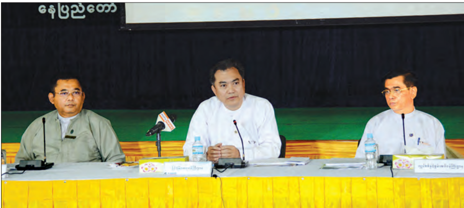
အစိုးရသစ်၏ ပထမ ရက် ၁၀၀ ကာလအတွင်း ဆောင်ရွက်ခဲ့မှုများနှင့်စပ်လျဉ်းသည့် သတင်းစာရှင်းလင်းပွဲတွင် တက်ရောက် ရှင်းလင်းသည့် သက်ဆိုင်ရာ ဌာနတာဝန်ရှိသူများကို တွေ့ရစဉ်

ပုဂ္ဂလိက စက်သုံးဆီအရောင်းဆိုင်များမှ လက်လီရောင်းချရေးများအား ပြည်သူလူထုအတွက် ထိုက်သင့်သည့် ဈေးနှုန်း၊ သတ်မှတ်သည့် အရည်အသွေးနှင့် မှန်ကန်သော အခြေအတွက်ဖြစ်စေ ရေးတိုက်မှု မြန်မာနိုင်ငံ စက်သုံးဆီ တင်သွင်းရောင်းချ ဖြန့်ဖြူးရေးအသင်း (MPTA) နှင့် ပူးပေါင်း၍ ဆောင်ရွက်နိုင်ခဲ့သဖြင့် အရေအတွက်မှန်ကန်ပြီး ဖြစ်သင့်ဖြစ်ထိုက်သော ဈေးနှုန်းဖြင့် ပြည်သူလူထုမှ ဝယ်ယူနိုင်ခဲ့သည့် အကျိုးကျေးဇူး