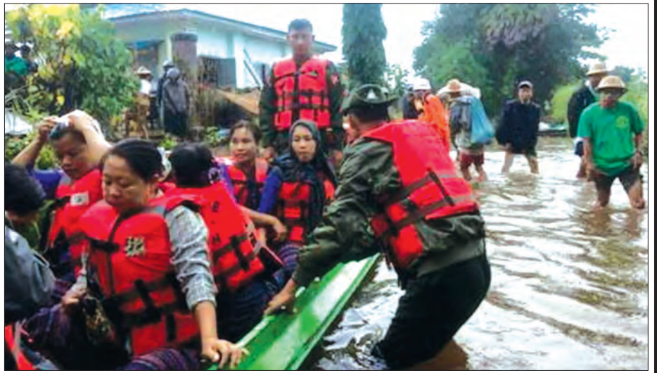
ရန်ကုန်တိုင်းစစ်ဌာနချုပ်မှ တပ်မတော်လှေဖြင့် ရေဘေးသင့်ပြည်သူများအား ကူညီပြောင်းရွှေ့ပေးစဉ်