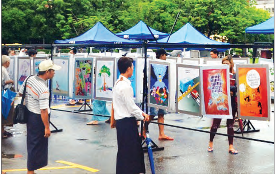
ငြိမ်းချမ်းရေးကာတွန်းပြပွဲတွင် ပြသထားသည့် ကာတွန်းပုံများကို ပြည်သူများ လာရောက်ကြည့်ရှုစဉ်

သတင်း - ရဲခေါင်ညွန့်၊ ဓာတ်ပုံ - ဖိုးထောင်