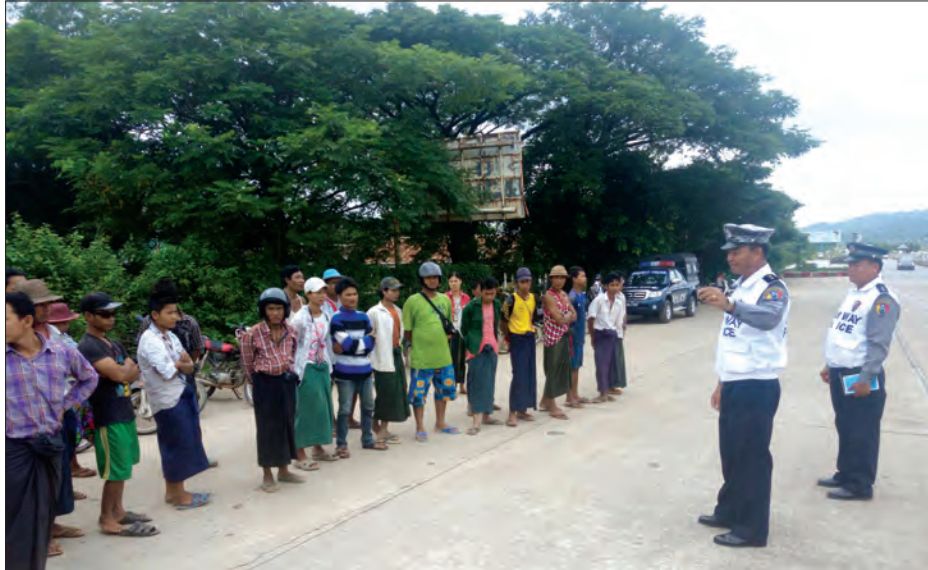
လက်ကမ်းစာစောင်များလည်း ဖြန့်ဝေခဲ့ ကြောင်းသိရသည်။ ဟောပြောပွဲများကို မြို့ချောင်းကျေး ရွာအနီး အမြန်လမ်းမကြီး မိုင်တိုင်အမှတ် (၈၃/၆)၌ ပြုလုပ်ခဲ့ရာတွင် ဆိုင်ကယ် မောင်းနှင်သူ ၃၅ ဦးကိုလည်းကောင်း၊ အမြန်လမ်း မိုင်တိုင်အမှတ်(၉၉/၄) အောင်မင်္ဂလာ-သရက်စိန်လမ်းဆုံ၌ ပြု လုပ်ခဲ့ရာတွင် ဆိုင်ကယ်မောင်းနှင်သူ ၃၀ ဦးကိုလည်းကောင်း အသိပညာပေးဟော ပြောနိုင်ခဲ့ကြောင်း သိရသည်။