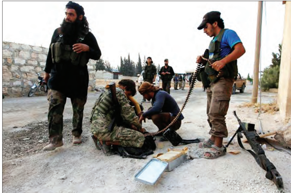
ဆီးရီးယားရှိ သူပုန်အဖွဲ့က ဝိုင်းရံပိတ်ဆို့မှုကို ဖောက်ထွက်ရန် ကြိုးစားခဲ့ကြောင်း ဖော်ပြသည့် ဖုန်းရိုက်ပုံရိပ်

အလက်ပို ဩဂုတ် ၇ ဆီးရီးယားရှိ သူပုန်များသည် စနေနေ့က အလက်ပိုအရှေ့ပိုင်းရှိ ဝိုင်းရံပိတ်ဆို့မှုကို ဖောက်ထွက်ရန် ကြိုးစားခဲ့သည်။