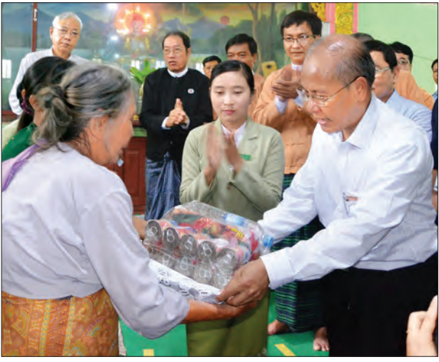
မကွေးတိုင်းဒေသကြီးဝန်ကြီးချုပ် ဒေါက်တာအောင်မိုးညို ရေဘေးသင့်ပြည်သူ တစ်ဦးအား ထောက်ပံ့ပစ္စည်းပေးအပ်စဉ် (သတင်းစဉ်)

ချက်များကို နိုင်ငံတော်အစိုးရအနေဖြင့် ဆက်လက်ကူညီပံ့ပိုးပေးသွားမည်ဖြစ် ကြောင်း ပြောကြားသည်။ မကွေးတိုင်း ဒေသကြီးအတွင်း ၂၀၁၆ ခုနှစ် ဇူလိုင်နှင့် ဩဂုတ်လအတွင်း မိုးသည်ထန်စွာ ရွာသွန်းခြင်းကြောင့် ဖြစ် ပွားခဲ့သည့် ရေကြီးရေလျှံမှုဖြစ်စဉ်များတွင် မြို့နယ်ပေါင်း ၁၅ မြို့နယ်မှ ရပ်ကွက်နှင့် ကျေးရွာ ၃၆၀၊ အိမ်ထောင်စု ၃၄၄၄၀ စု တို့အား ရေဘေးကင်းလွတ်သည့်ကျေးရွာ၊ ဘုန်းတော်ကြီးကျောင်းများနှင့် စာသင် ကျောင်းများသို့ ပြောင်းရွှေ့နေရာ ချထား ပေးခဲ့ပြီး နိုင်ငံတော်အစိုးရနှင့် အလှူရှင် များက ဆန်၊ ဆီ၊ ဆား၊ ငါးသေတ္တာ၊ ပဲ အမျိုးမျိုး၊ ခေါက်ဆွဲခြောက်၊ ရေသန့်နှင့် အလှူငွေအပါအဝင် စုစုပေါင်း တန်ဖိုးငွေ ကျပ်သိန်း ၂၀၀ကျော် ပေးအပ်လှူဒါန်း ခဲ့ပြီးဖြစ်ကြောင်း သိရသည်။ (သတင်းစဉ်)