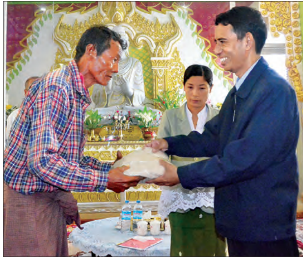
ပြည်ထောင်စုဝန်ကြီး ဒေါက်တာအောင်သူ ရေဘေးသင့်ပြည်သူတစ်ဦးအား ထောက်ပံ့ ပစ္စည်းပေးအပ်စဉ် (သတင်းစဉ်)