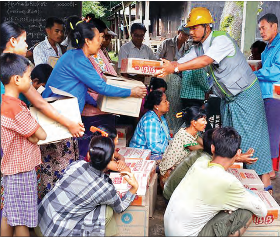
ရေဘေးသင့်ပြည်သူများအား ထောက်ပံ့ပစ္စည်းများ ပေးအပ်စဉ်