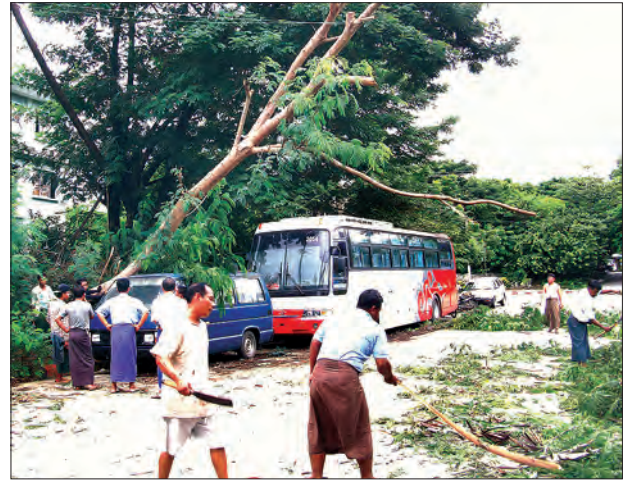
ဩဂုတ် ၆ ရက် ည ၇ နာရီခွဲက မိုးသည်ထန်စွာရွာသွန်းပြီး လေတိုက်ခတ်ရာ နေပြည်တော် မျှော်လင့်မြို့နယ် ဝဏ္ဏသိဒ္ဓိရပ်ကွက် လှထိပ်ခေါင်(၃)လမ်း တိုက်(၅၃၅၄) အနီးရှိ အမြင့်ပေ ၄၀ ခန့် ဘောစကိုင်းပင်တစ်ပင် အမြစ်မှကျွတ်၍ လှုပ်စစ်ခတ်အား ကြိုးများပေါ်နှင့် ရပ်ထားသော ဌာနပိုင်ယာဉ်တစ်စီးပေါ်သို့ လဲကျနေစဉ် ကိုပေါက်(ဥက္ကာမြေ)