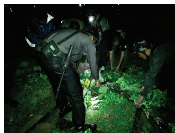
မျိုးဇေယျာ(ပျဉ်းမနား)

ရထားလမ်းပိတ်ဆို့မှုဖြစ်ပွားမှုကြောင့် အမှတ်(၁၀၃)အဆန် ပျဉ်းမနား-တောင်တွင်းကြီး ရထားပေါ်တွင် စီးနင်းလိုက်ပါလာသော ခရီးသည်များ၊ ယင်းရထားဖြင့် လုံခြုံရေးလိုက်ပါလာသော ရထားရဲတပ်ဖွဲ့အမှတ်(၉)တပ်ခွဲ၊ တပ်စု(၂)ပျဉ်းမနားမှ ရဲတပ်ကြပ်ရန်နှင့်ထွန်းနှင့် တပ်ဖွဲ့ဝင်များ၊ သက်ဆိုင်ရာဗီအေအိုင်အဖွဲ့ဝင်များက ပိုင်းဝန်းဖယ်ရှားခဲ့ပြီး ဆက်လက်ထွက်ခွာခဲ့ရာ မိုင်တိုင်အမှတ် (၂၅၆/၁၅-၁၆) အရောက်တွင် ရထားပေါ်သို့ ထပ်မံတောင်ပြိုကျခဲ့ပြီး သစ်ပင်ကန်လန်ဖြတ်လဲကျခဲ့သဖြင့် ရထားအား ရပ်တန့်ထားရှိ၍ ရထားလမ်းပိုင်း ခေတ္တပိတ်ထားခဲ့ရပြီး ဆက်လက်ဖယ်ရှားရှင်းလင်းဆောင်ရွက်ခဲ့ကြရာ ဩဂုတ် ၆ ရက် နံနက် ၆ နာရီကျော်တွင် ဖယ်ရှားပြီးစီးခဲ့သဖြင့် ရထားမှာ တောင်တွင်းကြီးဘက်သို့ ထွက်ခွာခဲ့ကြောင်း သိရသည်။