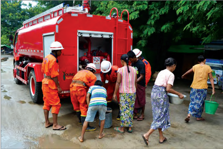
စေတနာရှင်အစုအဖွဲ့များက အစား အသောက်၊ သောက်ရေသန့်၊ ရေသန့် ဆေး၊ ဆေးဝါးများနှင့် လူသုံးပစ္စည်းများ စသည့် အကူအညီများကို ဇူလိုင် ၅ ရက် မှစ၍ လာရောက်ပေးအပ် လှူဒါန်းလျက် ရှိကာ မြို့နယ်မီးသတ်တပ်ဖွဲ့ကလည်း သောက်သုံးရေများကို ကယ်ဆယ်ရေး စခန်းများနှင့် ရေဘေးသင့်ပြည်သူများ စုဝေးနေထိုင်ရာ နေရာများအထိ သွား ရောက်၍ ရေသယံဇာတများဖြင့် ဖြန့်ဝေ ပေးလျက်ရှိကြောင်း သိရသည်။ သိန်းလွင်(ပြန်/ဆက်)

အောင်လံ ဩဂုတ် ၇ အောင်လံမြို့တွင် ရောဂါတစ်ခုဖြစ်ရေ မြင့် တက်မှုကြောင့် မြစ်ကမ်းဘေး ရပ်ကွက် နှင့် ကျေးရွာများမှ ပြည်သူများ ရေဘေး ဒုက္ခကြုံနေရသဖြင့် ကယ်ဆယ်ရေးစခန်း များဖွင့်လှစ်၍ ပြည်သူများအား ကူညီ ထောက်ပံ့ရေးလုပ်ငန်းများ ဆောင်ရွက် ပေးလျက်ရှိကြောင်း သိရသည်။ ကယ်ဆယ်ရေးစခန်း ပင်မရုံးအဖွဲ့ ဖွင့်လှစ်ထားသော မြို့နယ်အထွေထွေ အုပ်ချုပ်ရေးဦးစီးဌာနရုံးတွင် ရေဝင် ရောက်လာသဖြင့် ပြန်ကြားရေးနှင့်ပြည်သူ့ ဆက်ဆံရေးဦးစီးဌာနရုံးသို့ ပြောင်းရွှေ့ ဖွင့်လှစ်ခဲ့ပြီး အမှတ်(၁)ကယ်ဆယ်ရေး စခန်းကို ဈေးကုန်းရပ်ကွက်ရှိ သာသနာ့ ဝံသ ဆွမ်းလောင်းအသင်းတွင်လည်း ကောင်း၊ အမှတ်(၂) ကယ်ဆယ်ရေး စခန်းကို စမ်းချောင်းရပ်ကွက်ရှိ ကုသိနာရုံ ဘုရား စောင်းတန်းတွင်လည်းကောင်း ဖွင့်လှစ်ထားကြောင်း သိရသည်။ ကယ်ဆယ်ရေးစခန်းများမှ ပြည်သူ များအား နိုင်ငံရေးပါတီအဖွဲ့အစည်းများ၊ ပုဂ္ဂလိကအလှူရှင်များ၊ လူမှုရေးအဖွဲ့ အစည်းများနှင့် ရပ်ကွက်ကျေးရွာများမှ