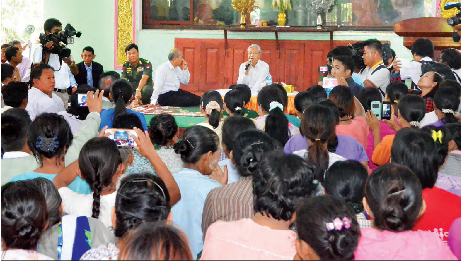
နိုင်ငံတော်သမ္မတ ဦးထင်ကျော် မင်းဘူးမြို့နယ် မှန်ကင်းဘုန်းတော်ကြီးကျောင်း မြသုခဓမ္မာရုံ၌ ရေဘေးသင့်ပြည်သူများအား တွေ့ဆုံအားပေးစကားပြောကြားစဉ် (သတင်းစဉ်)

ရှေးဦးစွာ နိုင်ငံတော်သမ္မတအား လေဆိပ်ဧည့်ခန်းမဆောင်၌ မကွေးတိုင်း ဒေသကြီး ဝန်ကြီးချုပ်က တိုင်းဒေသကြီး အတွင်း ရေကြီးရေလျှံမှုအခြေအနေ၊ ဆည်မြောင်းတာဝန်များအတွင်း ရေ ဝင်ရောက်မှုနှင့် ကူညီကယ်ဆယ်ရေး လုပ်ငန်း ဆောင်ရွက်ထားရှိမှုကို လည်းကောင်း၊ ပြည်ထောင်စုဝန်ကြီးများက သက်ဆိုင်ရာကဏ္ဍများအလိုက် ကူညီ ကယ်ဆယ်ရေးလုပ်ငန်းများ ဆောင်ရွက် ထားရှိမှုနှင့် ဆက်လက်ဆောင်ရွက်သွား မည့် ပြန်လည်ထူထောင်ရေးလုပ်ငန်းများ ကိုလည်းကောင်း ရှင်းလင်းတင်ပြရာ နိုင်ငံတော်သမ္မတက ကူညီကယ်ဆယ်ရေး လုပ်ငန်းများနှင့်ပတ်သက်၍ စာရင်းဇယား များ စနစ်ကျမှန်ကန်ရန်၊ အဖွဲ့အစည်း အသီးသီးမှ ကူညီထောက်ပံ့ပေးသည့် ထောက်ပံ့ရေးပစ္စည်းများကို ရသင့်ရထိုက် သူများထံ အမှန်တကယ် ပြည့်ပြည့်ဝဝ ရောက်ရှိအောင် တာဝန်ရှိသူအဆင့်ဆင့် က စေတနာထားကြပ်မတ်ဆောင်ရွက်ကြ ရန်လိုကြောင်း၊ ကူညီကယ်ဆယ်ရေး လုပ်ငန်းများ ဆောင်ရွက်ရာတွင် သက် ဆိုင်ရာတာဝန်ရှိသူများနှင့် လူမှုအဖွဲ့ အစည်းများ ညှိနှိုင်းပူးပေါင်းဆောင်ရွက် ကြရမည်ဖြစ်ကြောင်း ပြောကြားသည်။