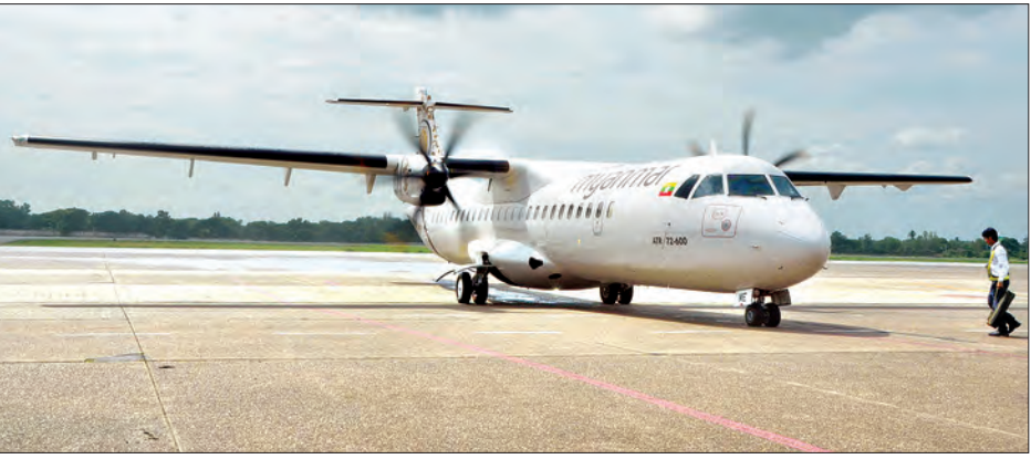
မြန်မာအမျိုးသားလေကြောင်းလိုင်း

နံနက် ၁၁ နာရီ ၃၅ မိနစ်တွင် ပြန်လည် ထွက်ခွာပြီး ရန်ကုန်သို့မန္တလေး ၁၂ နာရီခွဲ တွင်ရောက်ရှိမည်ဖြစ်ကြောင်း၊ ယင်း လေကြောင်းခရီးစဉ်သည် တနင်္လာ၊ ဗုဒ္ဓဟူး၊ သောကြာ သုံးရက်ပြေးဆွဲမည် ဖြစ်ကြောင်း သိရသည်။ ထို့အတူ စက်တင်ဘာ ၅ ရက်တွင် လေကြောင်းခရီးစဉ်အမှတ် UB-017 သည် ရန်ကုန်မြို့မှ ညနေ ၃ နာရီ ၁၀ မိနစ် တွင် ထွက်ခွာပြီး မန္တလေးသို့ ညနေ ၄ နာရီ ၅ မိနစ်တွင် ရောက်ရှိမည်ဖြစ် ကြောင်း၊ ယင်းမှတစ်ဆင့် ညနေ ၅ နာရီ ၅ မိနစ်တွင် ပြန်လည်ထွက်ခွာပြီး ပန်ကောက်သို့ ည ၇ နာရီမိနစ် ၂၀ တွင် ရောက်ရှိမည်ဖြစ်ကြောင်း၊ ယင်းခရီးစဉ် မှာလည်း တနင်္လာ၊ ဗုဒ္ဓဟူး၊ သောကြာ သုံးရက်ပြေးဆွဲမည် ဖြစ်ကြောင်း၊ လေယာဉ်လက်မှတ်များကို မြန်မာနိုင်ငံ နှင့် ထိုင်းနိုင်ငံတို့မှ ဝယ်ယူနိုင်သည့် 1-2-3 ဝန်ဆောင်မှုကိုလည်း အွန်လိုင်းအသုံး ပြုဝယ်ယူနိုင်မည်ဖြစ်ကြောင်း၊ မြန်မာ အမျိုးသား လေကြောင်းလိုင်းသည် ပြည်တွင်း ၂၇ မြို့သို့ ချိတ်ဆက်ပျံသန်း နေကြောင်းသိရသည်။