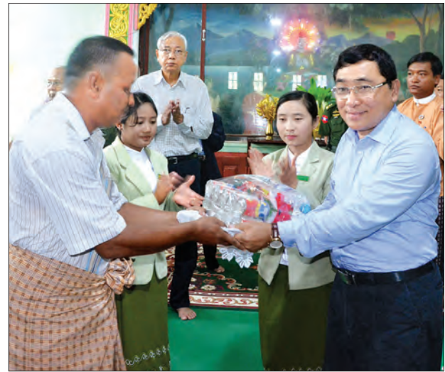
ပြည်ထောင်စုဝန်ကြီး ဒေါက်တာဝင်းမြတ်အေး ရေဘေးသင့်ပြည်သူတစ်ဦးအား ထောက်ပံ့ပစ္စည်းပေးအပ်စဉ် (သတင်းစဉ်)

ထို့နောက် နိုင်ငံတော်သမ္မတနှင့် အဖွဲ့ဝင်များသည် မကွေးမြို့မှ တပ်မတော် ရဟတ်ယာဉ်များဖြင့် မင်းဘူးမြို့သို့ ရောက်ရှိကြပြီး မင်းဘူးမြို့ မှန်ကင်း ဘုန်းတော်ကြီးကျောင်း ပဓာနနာယက ဆရာတော်ဘဒ္ဒန္တသာသနဓဇ အမှုပြု သည့် ဆရာတော် သံဃာတော်များအား ဖူးမြော်ကြည့်ညိ၍ လှူဖွယ်ဝတ္ထုပစ္စည်း များ ဆက်ကပ်လှူဒါန်းသည်။ ယင်းနောက် အဆိုပါကျောင်းတိုက် မြသုခဓမ္မာရုံ၌ ရေဘေးသင့်ပြည်သူများ အား တွေ့ဆုံအားပေးစကားပြောကြားပြီး ထောက်ပံ့ပစ္စည်းများ ပေးအပ်သည်။ ဆက်လက်၍ ပွင့်ဖြူမြို့နယ် ကုန်း ဇောင်းကျေးရွာ ဘုရားကြီးကျောင်းတိုက် သို့ ရောက်ရှိပြီး ကျောင်းတိုက်ပဓာန နာယကဆရာတော် ဘဒ္ဒန္တနန္ဒ အမှုပြု သည့် ဆရာတော် သံဃာတော်များအား