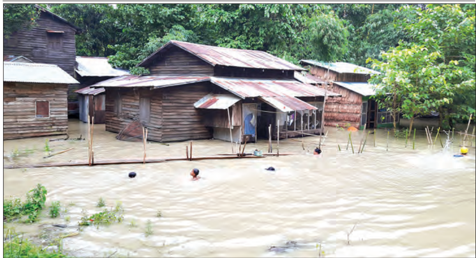
ဧရာဝတီတိုင်းဒေသကြီး ညောင်တုန်းမြို့၌ ဧရာဝတီမြစ်ရေမြင့်တက်လာမှုကြောင့် စိုးရိမ်ရေမှတ်နှင့် အန္တရာယ်ရေမှတ် ၂၄ ဒဿ ၅ ပေအထက်သို့ ကျော်လွန်နေပြီး ဩဂုတ် ၇ ရက် ညနေ ၄ နာရီတွင် ၂၆ ဒဿ ၃၀ ပေအထိ မြင့်တက်လျက်ရှိရာ အမှတ်(၁) ရပ်ကွက် စံအောင်တာအနီး လူနေအိမ်အချို့ရေဝင်နေသည်ကို တွေ့ရစဉ်

အဆိုပါနေရာသို့ မြို့နယ်စီမံခန့်ခွဲမှုကော်မတီဥက္ကဋ္ဌ မြို့နယ်အုပ်ချုပ်ရေးမှူးနှင့်အဖွဲ့ဝင်များ၊ မြို့နယ်ကျေးလက်ဒေသဖွံ့ဖြိုး တိုးတက်ရေးဦးစီးဌာနနှင့် ဝန်ထမ်းများက ကြည့်ရှုစစ်ဆေးကာ သဘာဝဘေးမြေပြုမှု ကြိုတင်ကာကွယ်ရေးအတွက် အရေးကြီး လုပ်ဆောင်ရမည့် နည်းလမ်းများအား ညှိနှိုင်းဆွေးနွေးရာမှကြားခဲ့ပြီး မြို့နယ်စီမံခန့်ခွဲရေးကွယ်လွန်သည့် သဘာဝဘေးအန္တရာယ် ကြိုတင်ကာကွယ်ရေးအတွက် အချိန်နှင့်တစ်ပြေးညီ စောင့်ကြပ်လျက်ရှိကြောင်း သိရသည်။ (မြို့နယ် ပြန်/ဆက်)