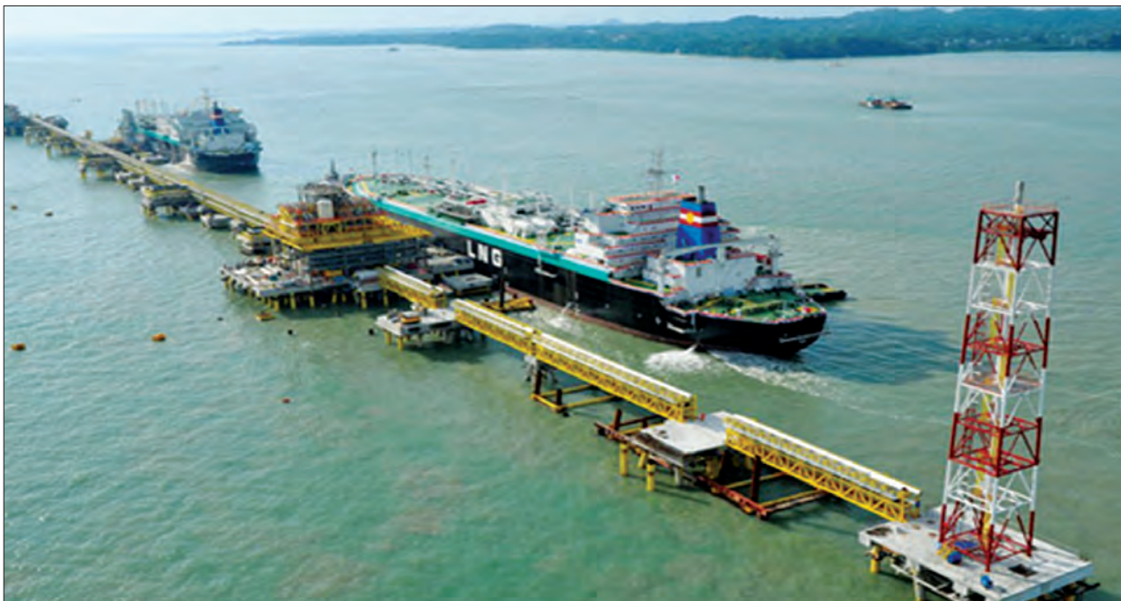
Petronas ကုမ္ပဏီ၏ LNG Terminal

LNG တင်သွင်းလာသည့်အချိန်တွင် အဆိုပါ ပိုက်လိုင်းကွန်ရက်ဖြင့် GT များနှင့် ရန်ကုန်ဒေသရှိ စက်ရုံအလုပ်ရုံများသို့ ပိုမိုဖြန့်ဖြူးနိုင်မည်ဖြစ်ပြီး ရန်ကုန်မြို့ရှိ ပြည်သူများအတွက် လျှပ်စစ်ဓာတ်အား ပိုမိုတိုးမြှင့်ထုတ်လုပ်ဖြန့်ဖြူးပေးနိုင်ခြင်း၊ အလုပ်အကိုင်အခွင့်အလမ်းများ ဖန်တီးပေးနိုင်ခြင်းများကို ဆောင်ရွက်နိုင်