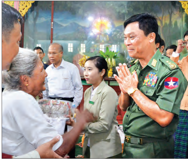
ပြည်ထောင်စုဝန်ကြီး ဒုတိယဗိုလ်ချုပ်ကြီးကျော်ဆွေ ရေဘေးသင့် အဘွားတစ်ဦးအား ထောက်ပံ့ပစ္စည်းပေးအပ်ပြီး နှုတ်ဆက်ဂါရဝပြုစဉ် (သတင်းစဉ်)