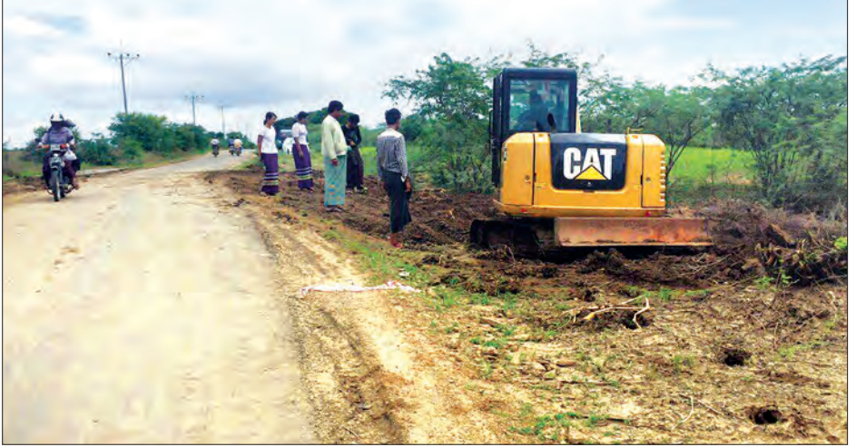
ခဲရာ လမ်းကြောင်းပြတ်တောက်မှု၊ လမ်းရက်တွင် မြို့နယ်ဦးစီးမှူးနှင့် အင်ဂျင်နီယာ လျက်ရှိကြောင်း သိရသည်။ (အပေါ်ပုံ) (မြို့နယ် ပြန်/ဆက်)

ဩဂုတ် ၁ ရက်က မိုးရွာသွန်းမှုကြောင့် ကျေးလက်တံတားပျက်စီးမှုရှိ/မရှိ ကွင်းဆင်းကြည့်ရှုရာ မြင်းခြံ-တလုပ်-ဆီမီးခုံ ကျေးလက်လမ်းပေါ်၌ မိုးသည်းထန်စွာ ရွာသွန်းမှုကြောင့် ကတ္တရာလမ်းပန်းများ ပျက်စီးမှုဖြစ်ပေါ်