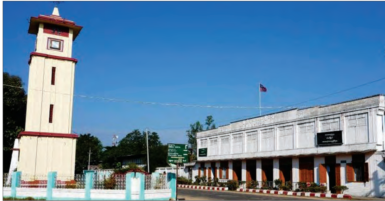
ပန်းမော်မြို့တွင်း တစ်နေရာအား တွေ့ရစဉ်

ကျွန်တော်တို့ပန်းမော်မြို့ရဲ့ကျက်သရေဆောင် ရွှေသိမ်တော်စေတီကို သွားရောက်ဖူးမြော်ခဲ့ကြတယ်။ ရွှေသိမ်တော်စေတီဟာ ခေါင်းလောင်းပုံသဏ္ဍာန်ရှိပြီး ထူးထူးခြားခြားတည်ထားခြင်းဖြစ်လို့ စိတ်ဝင်စားစရာပါပဲ။ ရွှေသိမ်တော်စေတီဟာ ပန်းမော်စော်ဘွားနေမျိုးမင်းလှဘွဲ့ခံ ဦးကံဟာ တရုတ်နိုင်ငံအပြန် ၁၇၉၄ ခုနှစ်က တရုတ်ခေါင်းလောင်းပုံသဏ္ဍာန်စေတီတစ်ဆူကို တည်ထားကိုးကွယ်လိုတဲ့ ဆန္ဒပြင်းပြတာမို့ အဲဒီနှစ်မှာပဲ ရွှေသိမ်တော်စေတီကို တည်ထားကိုးကွယ်ခဲ့ခြင်းဖြစ်ပါတယ်။ လုံးတော်ပြည့် ရွှေချထားတာမို့ ကြည့်ညိသပွယ်စရာကောင်းတဲ့စေတီဖြစ်ပြီး အဝေးက လှမ်းမျှော်ဖူးလို့လည်း မြင်တွေ့ရတဲ့ စေတီဖြစ်ပါတယ်။