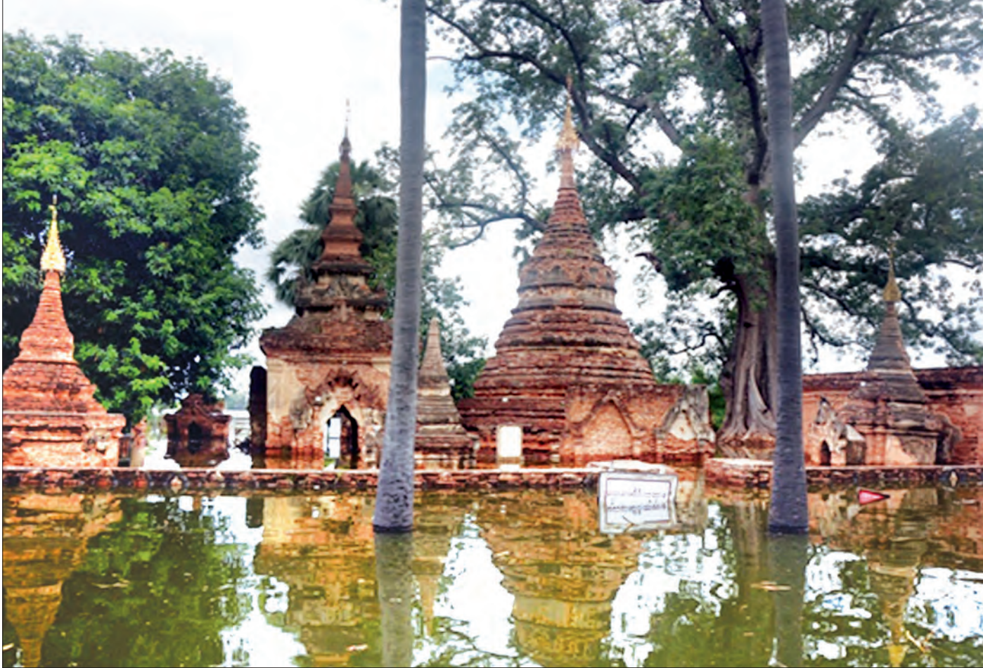
မန္တလေး၊ ဩဂုတ် ၆

မန္တလေးတိုင်းဒေသကြီး တံတားဦးမြို့ မြောက်ဘက် ၂ မိုင် ၄ ဇာလုံ၊ မန္တလေးမြို့ အနောက်တောင်ဘက်မိုင် ၂၀ ခန့်အကွာ၊ ပင်လယ်ရေမျက်နှာပြင်အထက် အမြင့် ၂၅၅ ပေ၊ ဧရာဝတီမြစ်နှင့် ဒုဠဝတီမြစ် (မြစ်ငယ်မြစ်) ဆုံရာတွင်ရှိသည့် အင်းဝမြို့ဟောင်း၌ မြစ်ရေမြင့်တက်မှုများကြောင့် အနိမ့်ပိုင်းနေရာများတွင် ရေဝင်ရောက်မှုများဖြစ်ပေါ်ခဲ့ရာ အချို့ သောရေးဟောင်းစေတီ၊ အဆောက်အအုံများလည်း ရေနစ်မြုပ်မှုများဖြစ်ပေါ်ခဲ့သည်။ (အပေါ်ပုံ)