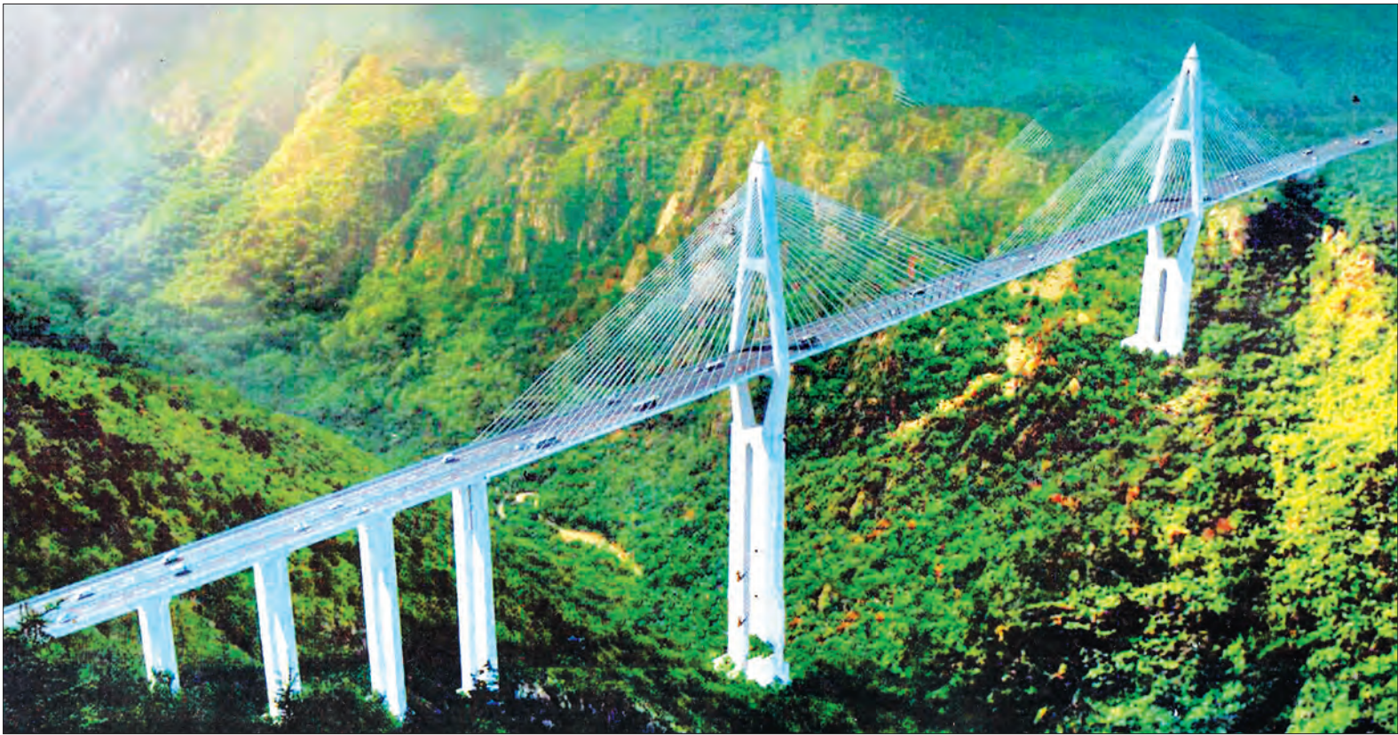
ဂုတ်တွင်းကားလမ်းကို ကျော်ဖြတ်တည်ဆောက်မည့် ဂုတ်တွင်းကွန်ကရစ်တံတားပုံစံကို တွေ့ရစဉ်

နေပြည်တော် ဩဂုတ် ၆ မိုးလေဝသနှင့် ဇလဗေဒညွှန်ကြားမှု ဦးစီးဌာန၏ ယနေ့ထုတ်ပြန်ချက်အရ ရောဂါမြစ်ရေသည် လွန်မြို့၌ ယနေ့ မြန်မာစံတော်ချိန် မွန်းလွဲ ၁၂ နာရီခွဲ တိုင်းထွာချက်အရ ၁၂၇၄ စင်တီမီတာရှိကြောင်း၊ အဆိုပါမြစ်ရေသည် နှစ်ပေါင်း ၃၂ နှစ်အတွင်း အမြင့်ဆုံးရေမှတ်ဖြစ်ကြောင်း၊ လွန်မြို့၏ ယခင်အမြင့်ဆုံးရေမှတ်မှာ ၂၈-၂၀၀၄ ရက်နေ့တွင် တိုင်းတာရရှိသော ၂၇၂ စင်တီမီတာဖြစ်ကြောင်း သိရသည်။ ရောဂါမြစ်ရေသည် ပခုက္ကူမြို့၌ နှစ်ပေခန့်နှင့် ချောက်မြို့၌ တစ်ပေခန့် ယင်းမြို့များ၏ စိုးရိမ်ရေမှတ်အသီးသီးအထက်သို့ ကျော်လွန်နေပြီး နောက်နှစ်ရက်အတွင်း ယင်းမြို့များ၏ စိုးရိမ်ရေမှတ်အသီးသီးအောက်သို့ ပြန်လည်ကျဆင်းနိုင်သည်။ အဆိုပါမြစ်ရေသည် ညောင်ဦးမြို့၌ လေးပေခွဲခန့်၊ မင်းဘူးမြို့၌ လေးပေခန့်၊ မကွေးမြို့၌ သုံးပေခန့်၊ အောင်လံမြို့နှင့် ပြည်မြို့တို့၌ နှစ်ပေခွဲခန့်နှင့် ဆိပ်သာမြို့၌ နှစ်ပေခန့် ယင်းမြို့များ၏ စိုးရိမ်ရေမှတ်အသီးသီးအထက်သို့ ကျော်လွန်နေပြီး နောက်နှစ်ရက်အတွင်း ညောင်ဦးမြို့၌ နှစ်ပေခန့်၊ မင်းဘူးမြို့နှင့် မကွေးမြို့တို့၌ တစ်ပေခွဲခန့်၊ အောင်လံမြို့နှင့် ပြည်မြို့တို့၌ တစ်ပေခန့်နှင့် နောက်သုံးရက်အတွင်း ဆိပ်သာမြို့၌