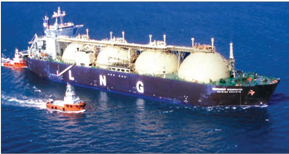
LNG Carrier သင်္ဘောပုံ

ကမ္ဘာ့နိုင်ငံများတွင် ရေအား၊ ဓာတ်ငွေ့အပူစွမ်းအင်၊ နေရောင်ခြည်စွမ်းအင်၊ လေစွမ်းအင်နှင့် ကျောက်မီးသွေး အစရှိသည့် လောင်စာစွမ်းအင်များကိုသုံး၍ လျှပ်စစ်ဓာတ်အားကို ထုတ်လုပ်ဖြန့်ဖြူး သုံးစွဲလျက်ရှိသည်။ ထိုသို့ လျှပ်စစ်ဓာတ်အားကို နည်းလမ်းများစွာဖြင့် ထုတ်လုပ်သုံးစွဲနေကြသော်လည်း ရေအားနှင့် ဓာတ်ငွေ့အားတို့ကိုသုံး၍ ထုတ်လုပ်ခြင်းသည် အထိရောက်ဆုံးနှင့် ပတ်ဝန်းကျင်ထိခိုက်မှုအနည်းဆုံး နည်းလမ်းများဖြစ်ကြောင်း ပညာရှင်များ၏ အဆိုအရ သိရသည်။