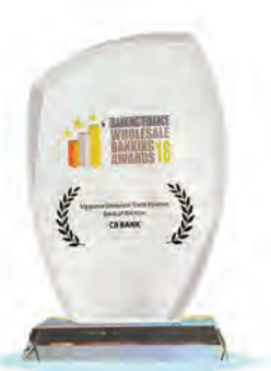
Myanmar Domestic Trade Finance Bank of the Year 2016