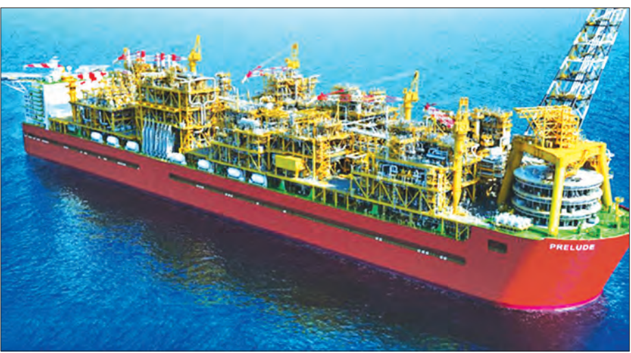
Shell ကုမ္ပဏီ၏ Prelude FLNG ပုံ

ယင်းဓာတ်ငွေ့လိုအပ်ချက်ကို ဖြည့်ဆည်းနိုင်ရန် အခြား ကမ်းလွန်စီမံကိန်းများဖြစ်သော ဇောတိက ကမ်းလွန်စီမံကိန်း သည်လည်း ထုတ်လုပ်နိုင်မှု ပုံမှန်အနေအထားရှိအောင်