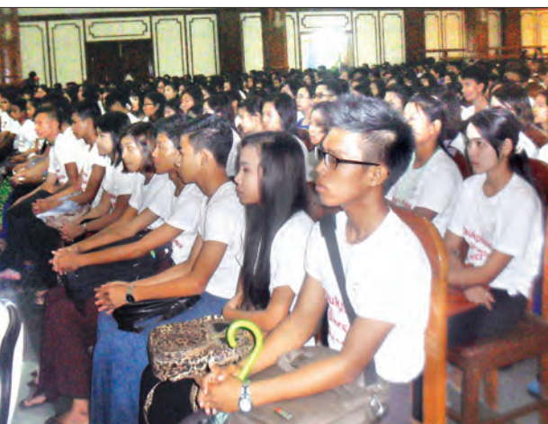
စိစစ်ရွေးချယ်ပေးခဲ့ခြင်း ဖြစ်ကြောင်း လည်း သိရသည်။ အဆိုပါ ပေါက်ဖော်ပညာသင်ဆုကို ယမန်နှစ်က ဒဂုံတက္ကသိုလ်မှ ၂၅ ဦးနှင့် စီးပွားရေးတက္ကသိုလ်မှ ၂၅ ဦး စုစုပေါင်း ၅၀ အား ပထမဆုံးအကြိမ်အဖြစ် ပေးအပ် ခဲ့ရာမှ ယခုနှစ်တွင် ကျောင်းသား ကျောင်းသူအရေအတွက် ၅၅၀ အထိ တိုးမြှင့်ပေးအပ်ခဲ့ကြောင်း သိရသည်။

Mr. Chen Chen ကလည်း “ဒီကနေ့ အခမ်းအနားဟာ မြန်မာကျောင်းသား ကျောင်းသူတွေအတွက် ရည်ရွယ်ပါတယ်။ လူငယ်တွေဟာ ကျွန်တော်တို့ရဲ့အနာဂတ် ဖြစ်ပြီး တရုတ်-မြန်မာချစ်ကြည်ရေးရဲ့မျှော် လင့်ချက်ဖြစ်ပါတယ်” ဟု ပြောကြားသည်။ အဆိုပါ ပေါက်ဖော်ပညာသင်ဆု ရရှိသော ကျောင်းသား ကျောင်းသူများမှာ ရန်ကုန်အရှေ့ပိုင်းတက္ကသိုလ်မှ ၁၀၀၊ အနောက်ပိုင်းတက္ကသိုလ်မှ ၁၀၀၊ ဒဂုံ တက္ကသိုလ်မှ ၁၇၅ ဦးနှင့် စီးပွားရေး တက္ကသိုလ်မှ ၁၇၅ ဦးဖြစ်ကြောင်း၊ ၎င်းတို့ သည် ယခုပညာသင်နှစ်ပထမနှစ်မှစပြီး လေးနှစ်ဆက်တိုက် ပညာသင်ဆုအဖြစ် တစ်ဦးလျှင် တစ်လငွေကျပ် ၃၀၀၀၀ ဖြင့် ပညာသင်နှစ် တစ်နှစ်အတွက် ၁၀ လစာ ငွေကျပ် ၃၀၀၀၀၀ ကို ချီးမြှင့်ပေးအပ် သွားမည်ဖြစ်ကြောင်း သိရသည်။ ယင်း ပညာသင်ဆုကို ငွေကြေးအခက်အခဲ ရှိသော ကျောင်းသား ကျောင်းသူများ၊ မိကွဲဖက်အခြေအနေဖြင့် ကြုံတွေ့ နေရသော ကျောင်းသား ကျောင်းသူများ ကို ၎င်းတို့တက္ကသိုလ်တာဝန်ရှိသူများက