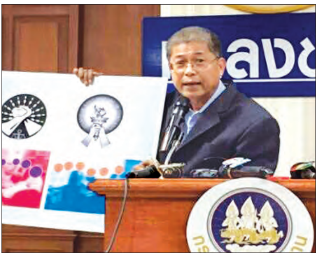
ပြေကြောင်း၊ ထိုင်းနိုင်ငံရောက်မြန်မာ အလုပ်သမားများ ထိတ်လန့်မှုမဖြစ်ကြ စေလိုကြောင်း၊ ပန်ကောက မြို့အနီး တစ်ဝိုက် မြန်မာအလုပ်သမားများ အနေ

ပန်ကောက ဩဂုတ် ၆ ထိုင်းနိုင်ငံရောက် မြန်မာအလုပ်သမား သောင်းနှင့်ချီ ဖမ်းဆီးပြန်ပို့မှု သတင်းမှာ မဟုတ်မမှန်ကြောင်း ထိုင်းအလုပ်သမား ဝန်ကြီးက ဩဂုတ် ၅ ရက်၌ သတင်းစာ ရှင်းလင်းဖွဲ့ပြုလုပ်ကာ ပြန်လည်ချေပ ပြောဆိုခဲ့ကြောင်း သိရသည်။ (ယာပုံ) ထိုင်းအလုပ်သမားဝန်ကြီး မစ္စတာ အာရတ်ဂ်ဇရ်ဇာက ပြန်လည်ချေပ ပြောဆိုရာတွင် တားမြစ်ထားသော ဈေး နှောင်း အလုပ်လုပ်နေသူများကိုသာ လိုက်လံဖမ်းဆီးခြင်းဖြစ်ကြောင်း၊ ဖမ်းဆီး ပြန်ပို့မှုဖြစ်စဉ်များ အမှန်တကယ် ရှိသော်လည်း လူဦးရေသောင်းချီ မဟုတ် ကြောင်း ရာဂဏန်းမျှသာရှိကြောင်း၊ ထိုင်းနိုင်ငံအတွင်း MoU ဖြင့် လာရောက် အလုပ်လုပ်ကိုင်ကြသည့် မြန်မာအလုပ် သမားပြသနာ ဆုံးရှုံးစွာမရှိဘဲ အဆင်