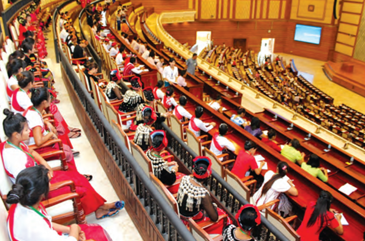
ကချင်၊ ကယား၊ မွန်နှင့်ရခိုင် တိုင်းရင်းသားလေ့လာရေးအဖွဲ့ဝင်များ ပြည်သူ့လွှတ်တော်ကျင်းပနေပုံများကို ကြည့်ရှုလေ့လာစဉ်

ယနေ့အချိန်တွင် တစ်နိုင်ငံလုံး အပစ်အခတ်ရပ်စဲရေးကို နိုင်ငံတော်၊ လွှတ်တော်၊ တပ်မတော်နှင့် ပြည်သူ့လူထုအားလုံးက ကြိုးစားဆောင်ရွက်ရင်း စစ်မှန်သော ဖက်ဒရယ်ကိုအခြေခံသည့် ဒီမိုကရေစီပြည်ထောင်စုတစ်ခု ထူထောင်နိုင်ရေးအတွက် ပြည်ထောင်စုငြိမ်းချမ်းရေးညီလာခံ ၂၁ ရာစုပင်လုံးကို ဩဂုတ်လနောက်ဆုံးပတ်တွင် ကျင်းပပြုလုပ်တော့မည်ဖြစ်သည်။