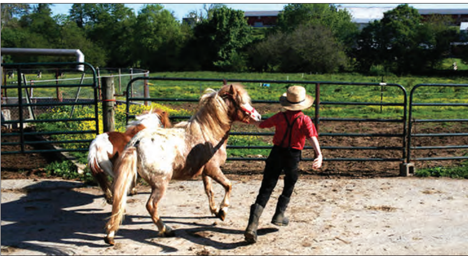
ပန်းနာရောဂါကို ကာကွယ်ပေးနိုင်မည့် အဏုဇီဝပါဝင်ပစ္စည်းတစ်မျိုးကို မွေးမြူရေးတိရစ္ဆာန်များတွင်တွေ့ရှိ

ဆင်တူနေပါတယ်။ အာမိတ်တွေရဲ့ မူလ အစဟာ ဆွစ်ဇာလန်နိုင်ငံကဖြစ်ပြီး ဟတ်ထရိုက်တွေကတော့ ဩစတြီးယား ဟတ်ထရိုက်တွေကတော့ ဩစတြီးယား က ဖြစ်ပါတယ်။ နေထိုင်စားသောက်မှုပုံစံ အားဖြင့်လည်းတူညီပြီး ဆေးလိပ်မီးခိုးငွေ့ နဲ့ ညစ်ညမ်းတဲ့လေထု ထိတွေ့မှုနည်း ပါးကာ အိမ်မွေးတိရစ္ဆာန်မွေးမြူခြင်း လည်း မရှိတဲ့အပြင် အုပ်စုနှစ်ခုလုံးဟာ နေအိမ်သန့်ရှင်းမှုကို အထူးဂရုစိုက်သူတွေ ခွဲကာ လေ့လာလိုက်တဲ့အခါမှာ ထူးခြား တဲ့အချက်တွေကို တွေ့ခဲ့ပါတယ်။ အာမိတ်ရဲ့ လူမျိုးတွေမှာ ပန်းနာရင်ကျပ်ဖြစ်ခဲ့ပြီး လူဦးရေရဲ့ ၂ ရာခိုင်နှုန်းကနေ ၄ ရာခိုင်နှုန်း လောက်သာ တွေ့ရပေမယ့် ဟတ်ထရိုက် တွေမှာတော့ လူဦးရေရဲ့ ၂၀ ရာခိုင်နှုန်း လောက်ထိ ရောဂါဖြစ်ပွားမှုများတာကို သတိပြုမိခဲ့ပါတယ်။ မျိုးနွယ်စုနှစ်ခုရဲ့ မျိုးရိုးဗီဇဆိုင်ရာ နောက်ခံသမိုင်းကြောင်း တွေကလည်း