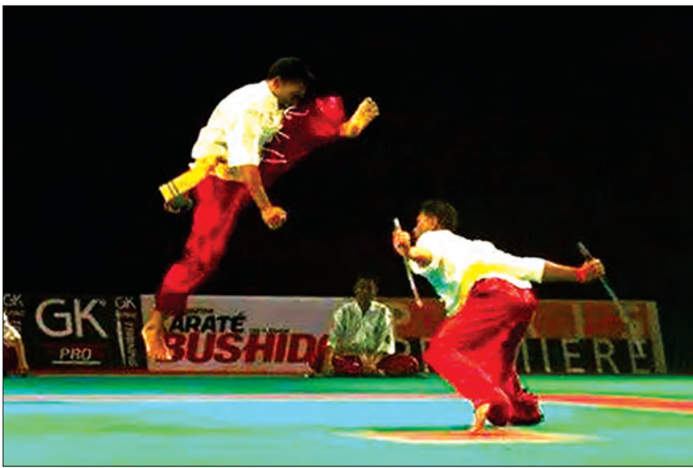
မြန်မာ့ရိုးရာ သိုင်းပြိုင်ပွဲ ကျင်းပစဉ်

ယခုအခါ နိုင်ငံတစ်ဝန်း မြန်မာ့ရိုးရာ အမျိုးသားရေးသိုင်း ပညာကို တတ်ကျွမ်းသည့် ပညာရှင်ဆရာကြီးများက တိုင်း ဒေသကြီးနှင့် ပြည်နယ်အားလုံးတွင် ကျန်းမာရေးနှင့် အားကစားဝန်ကြီးဌာနအောက်ရှိ မြန်မာ့ရိုးရာသိုင်းအဖွဲ့ချုပ်၏ ညွှန်ကြားမှုဖြင့် စည်းရုံး၊ ဖော်ထုတ်၊ လေ့ကျင့် ပြန့်ပွားသည့် အချက်များဖြင့် ဖော်ထုတ်လုပ်ဆောင်လျက်ရှိသည်။ ထို့အပြင် မြန်မာ့ ရိုးရာသိုင်းပညာတစ်ခုဖြစ်သည့် ပန်တိုကို နိုင်ငံတကာသို့ ချပြနိုင်ရန် ဥပဒေပိုင်းဆိုင်ရာကအစ အဖွဲ့ချုပ် အနေဖြင့် အဆင်သင့်ဖြစ်နေပြီဖြစ်ကာ နိုင်ငံတော်နှင့် သက်ဆိုင်ရာ တာဝန်ရှိသူများ၏ ညွှန်ကြားချက်ဖြင့် ဆက်လက်အကောင်အထည် ဖော်ဆောင်ရွက်သွားမည်ဖြစ် ကြောင်းနှင့် (၁၆)ကြိမ်မြောက် ကျင်းပမည့် တိုင်းဒေသကြီးနှင့် ပြည်နယ်ပြိုင်ပွဲများမှ ပြိုင်ပွဲဝင်မျိုးဆက်သစ်များ ပေါ်ထွန်းလာ တော့မည်ဖြစ်၍ တိမ်မြုပ်ပျောက်ကွယ်လုနီးပါးဖြစ်နေသည့် မြန်မာတို့၏ ရိုးရာသိုင်း တစ်ခေတ်ပြန်လည်ဆန်းသစ်လာ တော့မည်လား စောင့်ကြည့်ရတော့မည် ဖြစ်ပါကြောင်း။