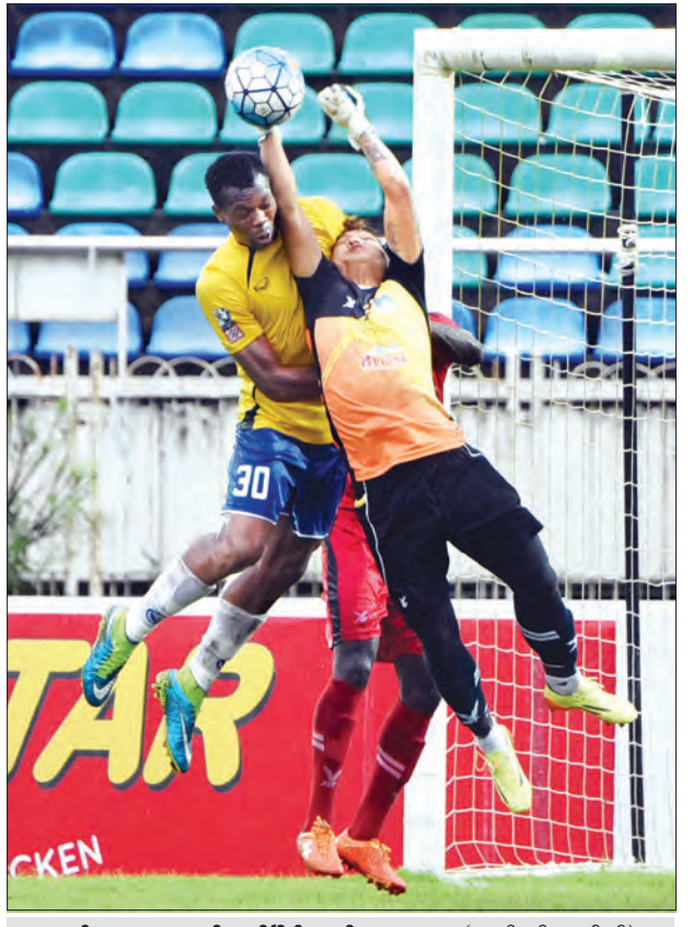
မကွေးနှင့် ရတနာပုံအသင်း ယှဉ်ပြိုင်နေစဉ်

အောင်ဆန်းကွင်း၌ ကျင်းပသောပွဲတွင် ရခိုင်နှင့် ချင်း ယူနိုက်တက်အသင်း တစ်ဂိုးစီ သရေကျခဲ့သည်။ ချင်းအတွက် ဦးဆောင်ဂိုးကို ၂၄ မိနစ်တွင် ဆောင်လမန်က သွင်းယူခဲ့ပြီး ရခိုင်အတွက် ချေပဂိုးကို ၅၆ မိနစ်တွင် အန်ဒရေက သွင်းယူခဲ့