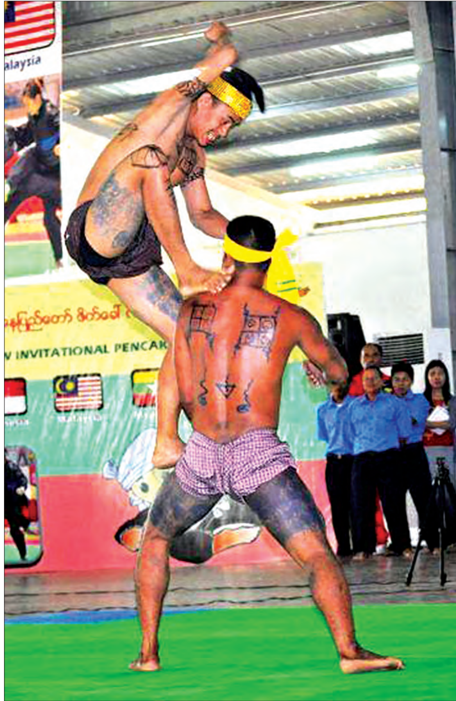
၂၀၁၃ ဆီးဂိမ်းပြိုင်ပွဲတွင် မြန်မာ့ရိုးရာသိုင်းအဖွဲ့သရုပ်ပြဟန်

ယနေ့ခေတ်လူငယ်များကြား သွဲသွဲပြန်လည်လှုပ်ခတ်စပြုလာသည့် မြန်မာ့ရိုးရာသိုင်း။ ယနေ့အချိန်အခါတွင် တိမ်မြုပ်ပျောက်ကွယ်လုနီးပါးဖြစ်နေသည့် မြန်မာ့ရိုးရာသိုင်းပညာသည် မြန်မာ့သမိုင်း တစ်လျှောက် ပြောင်းမြောက်ခဲ့မှုဖြစ်စဉ်များကို ပြန်ပြောင်းကြည့်မှသာ တန်ဖိုးမဖြတ်နိုင်ခဲ့သည့် အမွေအနှစ်များဖြစ်ကြောင်း တွေ့ရမည်ဖြစ်သည်။ သမိုင်းဆိုသည်မှာ လူသားများ၏ အခြေအမြစ် ဖြစ်သလို မြန်မာ့သမိုင်းစဉ်ကြည့်လျှင် မြန်မာ့ရိုးရာသိုင်းသည် တစ်ခေတ်တစ်ခါက တိုင်းပြည်အတွက် အဓိကနေရာကဏ္ဍတစ်ခုပင် ပါဝင်ခဲ့သည်မှာ အထင်အရှားပင်။ ယခုလို မြန်မာပြည်ကြီး တည်တံ့ခိုင်မြဲအောင်၊ မြန်မာနိုင်ငံတော်ဟု ပေါ်ထွန်းလာအောင် လူမျိုး၊ ဘာသာ၊ သာသနာကို စောင့်ရှောက်ခဲ့သည်က ရိုးရာလောကတစ်ခု ဖြစ်ပေသည်။