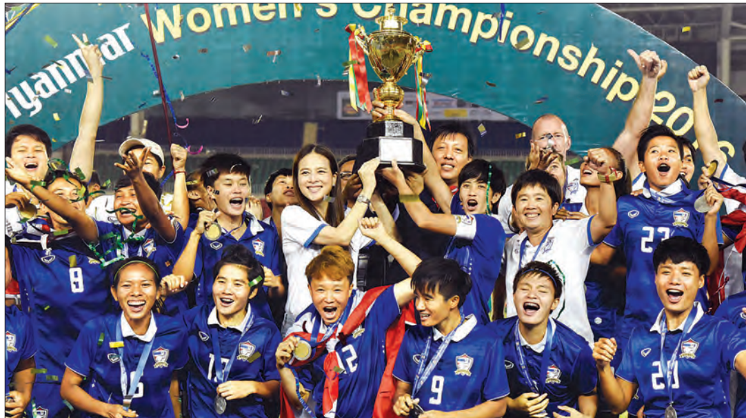
ချန်ပီယံဆုရ ထိုင်းအသင်း ဆုလေး နှင့်အတူ အောင်ပွဲခံ နေစဉ်