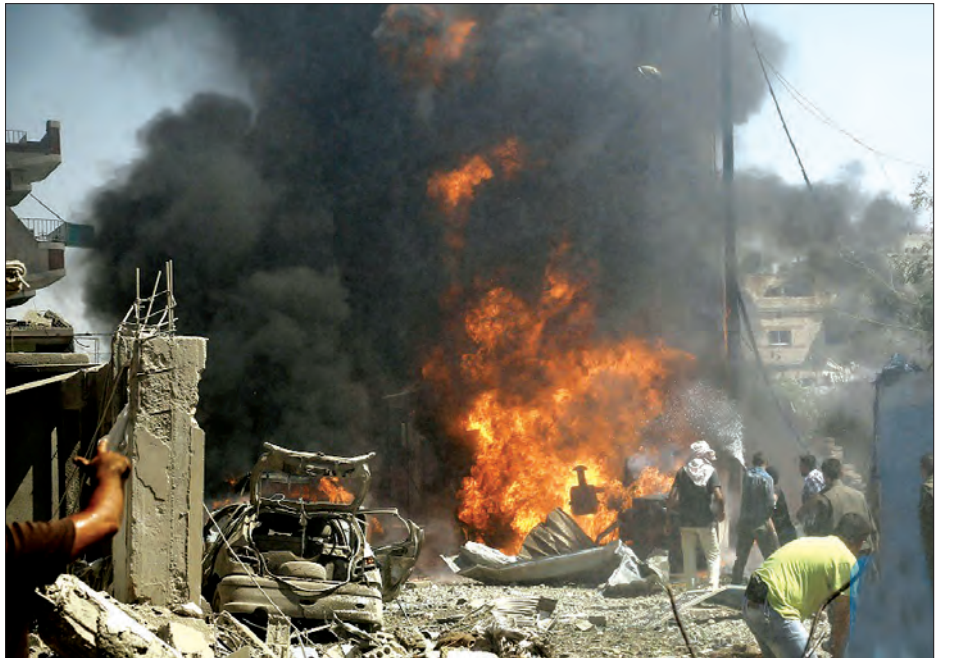
စွပ်စွဲထားကြသည်။ နိုင်ငံပိုင် သတင်းဌာနက အလက်ပိုမြို့အစိုးရထိန်းချုပ်ရာ နယ်မြေအချို့၌ သောင်းကျန်းသူများ၏ ပစ်ခတ်တိုက်ခိုက်မှုကြောင့် လူခုနစ်ဦး သေဆုံးခဲ့ပြီး ၄၁ဦးဒဏ်ရာရရှိခဲ့ကြောင်း ဖော်ပြခဲ့သည်။ အစိုးရတပ်ဖွဲ့ဝင်များက သူပုန်များ ထိန်းချုပ်ရာ နေရာများ၌ တိုက်ပွဲများ ဆင်နွှဲမှုကြောင့် အလက်ပို၌ တိုက်ပွဲများပို၍ ပြင်းထန်လာသည်။ ဗုဒ္ဓဟူးနေ့က အလက်ပိုမြို့ သူပုန်များ ထိန်းချုပ်ရာ နယ်မြေများပေါ်တွင် လေကြောင်း တိုက်ခိုက်မှုအကြိမ် ၁၀၀ ပြုလုပ်ခဲ့ကြောင်း နိုင်ငံပိုင်သတင်းဌာနက ပြောသည်။ (ဆင်ဟွာ)

သောင်းကျန်းသူများဘက်ကလည်း အစိုးရတပ်ဖွဲ့များသည် အင်္ဂါနေ့က သောင်းကျန်းသူများ ထိန်းချုပ်ထားရာ Saraqeb ၌ ကလိုရင်းဓာတ်ငွေ့ ဝှံ့ကြွခဲ့ကြောင်း တုံ့ပြန်စွဲခဲ့သည်။ တိုက်ပွဲ၌ ဓာတုလက်နက်များအသုံးပြုမှုနှင့် ပတ်သက်၍ နှစ်ဖက်စလုံးမှ အပြန်အလှန်