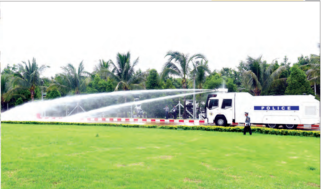
ဒုတိယသမ္မတ ဦးဟင်နရီပန်ထီးယူနှင့်အဖွဲ့ အရေးပေါ်အခြေအနေပေါ်ပေါက်လာပါက အသုံးပြုမည့် ရေအမြောက်မော်တော်ယာဉ် သရုပ်ပြမှုကိုကြည့်ရှုစဉ်