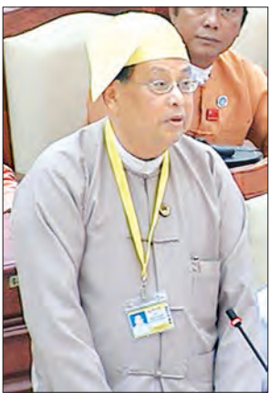
ဆောက်လုပ်ရေးဝန်ကြီးဌာန ပြည်ထောင်စုဝန်ကြီး ဦးဝင်းခိုင်

နေပြည်တော် ဩဂုတ် ၄ ရန်ကုန် - နေပြည်တော် - မန္တလေး အမြန်လမ်းမကြီးတွင် လမ်းအသုံးပြုသူများအား ယာဉ်အန္တရာယ် ကင်းရှင်းစေရေးအတွက် အသိပညာပေး စည်းရုံးပြောဆိုခြင်း၊ လက်ကမ်းစာစောင်များဖြန့်ဝေခြင်းနှင့် ယာဉ်မတော်တဆဖြစ်ပွားမှုများသည့် Black Spot နေရာများတွင် စောင့်ကြည့်ယာဉ် (Road Patrol) များဖြင့် သတ်မှတ်အရှိန်နှုန်းအတိုင်း မောင်းနှင်ကြရန် စောင့်ကြည့်သတိပေးခြင်း စသည့် လုပ်ငန်းများကို ဆောင်ရွက်လျက်ရှိပါကြောင်း ဆောက်လုပ်ရေးဝန်ကြီးဌာန ပြည်ထောင်စုဝန်ကြီး ဦးဝင်းခိုင်က ယနေ့ ကျင်းပသည့် ဒုတိယအကြိမ် ပြည်သူ့လွှတ်တော် ဒုတိယပုံမှန်အစည်းအဝေး အငွေမနေ့တွင် ပြောကြားလိုက်သည်။