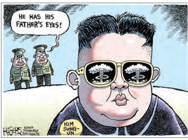
ကင်အီဆွန်းကနေ ကင်ဂျွန်အန်းအထိ မြောက်ကိုရီးယား ကွန်မြူနစ်ခေါင်းဆောင်အဆက်ဆက်တို့ နျူကလီးယားလက်နက်သုံးခြင်းမြောက်ပိုင်းအစွဲအလမ်းကြီးမှုကို သရုပ်ဖော်ထားပုံ

မြောက်ကိုရီးယားနိုင်ငံအပေါ် ဘဏ္ဍာရေးအရ ပိတ်ဆို့အရေးယူမှုတွေဟာ ထိရောက်သင့်သလောက် ထိရောက်ပေမယ့်လည်း ရည်မှန်းထားတဲ့ထိရောက်မှုမျိုးတော့ မရခဲ့ပါဘူး။ စီးပွားရေးပိတ်ဆို့မှုအရေးယူမှု တစ်ခုတည်းနဲ့ မြောက်ကိုရီးယား ကွန်မြူနစ်ပဒေသရာဇ်စနစ်ရဲ့ မူဝါဒတွေပြောင်းလဲအောင် မစွမ်းဆောင်နိုင်သလို နျူကလီးယားလက်နက်တွေ စွန့်လွှတ်လာအောင် ဖိအားမပေးနိုင်တာကတော့ ရှင်းနေပါပြီ။