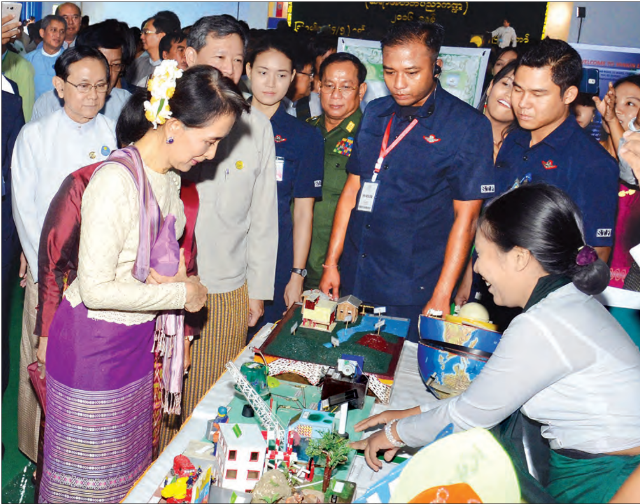
နိုင်ငံတော်၏အတိုင်ပင်ခံပုဂ္ဂိုလ် ဒေါ်အောင်ဆန်းစုကြည် ပညာရေးကော်လံပီများမှ ဆရာသင်ထောက်ကူပစ္စည်းများနှင့် မှတ်တမ်းမှတ်ရာများ ခင်းကျင်းပြသထားမှုကို ကြည့်ရှုစဉ် (သတင်းစဉ်)

တရားသိသော သူတော်ကောင်းတို့သည် တရားနှင့်ဆိုင်သော ပီတိကိုစားသုံး၍ စိတ်နှလုံးကြည်လင်သန့်ရှင်းပြီး ချမ်းသာစွာ နေရ၏။ သူတော်ကောင်းတရား၌လည်း အစဉ်မွေ့လျော်၍နေ၏။ တရား၏အရသာကို ခံစားရသဖြင့် စိတ်နှလုံးသန့်ရှင်းစင်ကြယ်၏။ စိတ်နှလုံးစင်ကြယ်သဖြင့် ချမ်းသာစွာနေရ၏။ ပီတိဟူသမျှတို့တွင် မွေ့ပီတိသည် အမြတ်ဆုံးဖြစ်၏။ ပဏ္ဍိတဝဂ် (ဓမ္မပဒ - ၇၉)