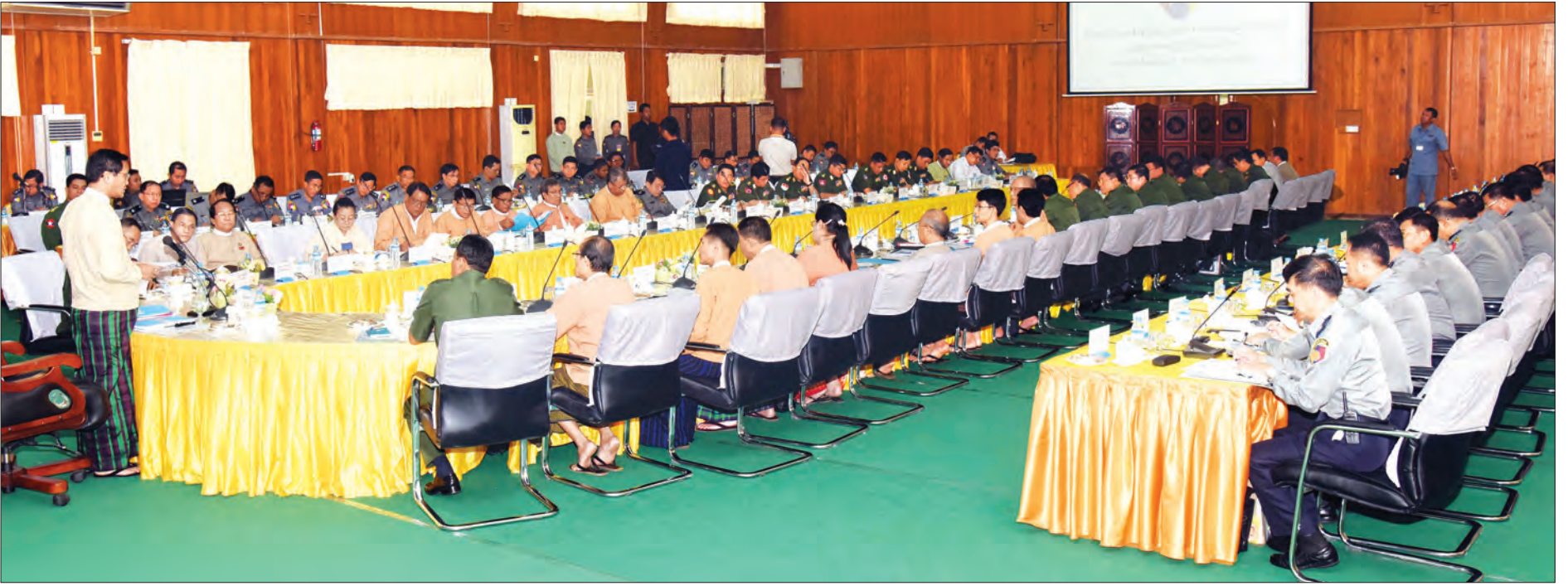
ဒုတိယသမ္မတ ဦးဟင်နရီဗန်ထီးယူ အရေးပေါ်ကာလစီမံခန့်ခွဲရေး ဗဟိုကော်မတီ ညှိနှိုင်းအစည်းအဝေး (၁/၂၀၁၆)တွင် အမှာစကားပြောကြားစဉ်