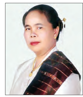
လာအိုပြည်သူ့ဒီမိုကရက်တစ်သမ္မတ နိုင်ငံ သမ္မတ၏ဇနီး မစ္စမိခင် မိမိမိမိ ပိုရာချစ်

မစ္စတာ ဘွန်ညံ ပိုရာချစ်ကို ၁၉၃၇ ခုနှစ် ဩဂုတ်လ ၁၅ ရက်နေ့တွင် လာအိုပြည်သူ့ ဒီမိုကရက်တစ်သမ္မတနိုင်ငံ ဆာဟာနာခတ်ပြည်နယ် သဖန်သောင်မြို့နယ် ဘန်နာရွာ၌ မွေးဖွားခဲ့ပါသည်။ မစ္စတာ ဘွန်ညံ ပိုရာချစ်သည် ၁၉၆၂ ခုနှစ်မှ ၁၉၉၂ ခုနှစ်အထိ ဆာဟာနာခတ်ပြည်နယ်၌ အုပ်ချုပ်ရေးမှူးအဖြစ်လည်းကောင်း၊ ၁၉၉၃ ခုနှစ်မှ ၁၉၉၆ ခုနှစ်အထိ ဝီယင်ကျန်းမြို့တော် စည်ပင်သာယာရေးနယ်မြေ၌ မြို့တော်ဝန်အဖြစ်လည်းကောင်း၊ ၁၉၉၆ ခုနှစ်မှ ၂၀၀၁ ခုနှစ်အထိ လာအိုနိုင်ငံ ဒုတိယဝန်ကြီးချုပ်အဖြစ် လည်းကောင်း တာဝန်ထမ်းဆောင်ခဲ့ပြီး ဒုတိယဝန်ကြီးချုပ်အဖြစ် တာဝန်ထမ်းဆောင်နေစဉ် နိုင်ငံခြားရင်းနှီးမြှုပ်နှံမှုနှင့် ပူးပေါင်းဆောင်ရွက်ရေး ကော်မတီဥက္ကဋ္ဌ၊ မြေယာနှင့် သစ်တောစီမံခန့်ခွဲရေး ဗဟိုကော်မတီဥက္ကဋ္ဌနှင့် ကျေးလက်ဒေသဖွံ့ဖြိုးတိုးတက်ရေး ဗဟိုကော်မတီဥက္ကဋ္ဌ စသည့် တာဝန်များကိုလည်း ထမ်းဆောင်ခဲ့ပါသည်။ မစ္စတာ ဘွန်ညံ ပိုရာချစ်သည် ၂၀၀၁ ခုနှစ်မှ ၂၀၀၆ ခုနှစ်အထိ လာအိုပြည်သူ့ ဒီမိုကရက်တစ်သမ္မတနိုင်ငံဝန်ကြီးချုပ်အဖြစ် လည်းကောင်း၊ ၂၀၀၆ ခုနှစ် ဇွန်လ ၈ ရက်နေ့မှ ၂၀၁၆ ခုနှစ် ဧပြီလ ၁၉ ရက်နေ့အထိ ဒုတိယသမ္မတအဖြစ် လည်းကောင်း အသီးသီး ထမ်းဆောင်ခဲ့ပါသည်။ ၂၀၁၆ ခုနှစ် ဇန်နဝါရီလတွင် လာအိုပြည်သူ့တော်လှန်ရေးပါတီ ဗဟိုကော်မတီ အထွေထွေအတွင်းရေးမှူးအဖြစ် ရွေးချယ်တင်မြှောက်ခြင်းခံခဲ့ရပါသည်။ မစ္စတာ ဘွန်ညံ ပိုရာချစ်သည် ၂၀၁၆ ခုနှစ် ဧပြီလ ၂၀ ရက်နေ့တွင် ကျင်းပသည့် (၈)ကြိမ်မြောက် လာအိုပြည်သူ့ဒီမိုကရက်တစ်သမ္မတနိုင်ငံ အမျိုးသား ညီလာခံ၏ ပထမအကြိမ် စာမျက်နှာ ၃ ကော်လံ ၁ □