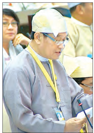
ကျန်းမာရေးနှင့် အားကစားဝန်ကြီးဌာန ပြည်ထောင်စုဝန်ကြီး ဒေါက်တာမြင့်ထွေး

တိုင်းရင်းဆေးပညာဦးစီးဌာနတွင် ဥယျာဉ် ကိုးခုရှိပြီး အဓိကအားဖြင့် မျိုးထိန်းလုပ်ငန်းကို ဆောင်ရွက်လျက်ရှိကြောင်း၊ ဆေးဝါးထုတ်လုပ်ရေးအတွက် လိုအပ်သော ကုန်ကြမ်းအချို့ကို ဥယျာဉ်အချို့မှ ထုတ်လုပ်နိုင်သော်လည်း တစ်ပြည်လုံးရှိ ဆေးရုံ၊ ဆေးခန်းများနှင့် ကွင်းဆင်းလုပ်ငန်းများတွင် အသုံးပြုရန် လိုအပ်သောဆေးဝါးများကို ထုတ်လုပ်