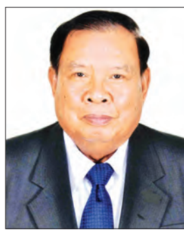
လာအိုပြည်သူ့ ဒီမိုကရက်တစ် သမ္မတနိုင်ငံ သမ္မတ မစ္စတာ ဘွန်ညံ ပိုရာချစ်