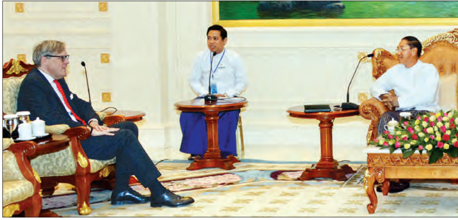
တွေ့ဆုံပွဲသို့ နိုင်ငံတော်အတိုင်ပင်ခံရုံးဝန်ကြီးဌာန ဒုတိယဝန်ကြီး ဦးခင်မောင်တင် နိုင်ငံခြားရေးဝန်ကြီးဌာန တာဝန်ရှိသူများ တက်ရောက်ကြသည်။ (သတင်းစဉ်)

နေပြည်တော် ဩဂုတ် ၄ ပြည်ထောင်စုသမ္မတမြန်မာနိုင်ငံတော် ဒုတိယသမ္မတ ဦးမြင့်ဆွေသည် မြန်မာနိုင်ငံဆိုင်ရာ ဗြိတိန်နိုင်ငံ သံအမတ်ကြီး မစ္စတာ အင်ဒရူးပက်ထရစ်စ် အား နိုင်ငံတော်သမ္မတအိမ်တော် သံတမန်ဆောင်ရွက်ခန်းမ၌ ယနေ့နံနက် ၁၀ နာရီတွင် လက်ခံတွေ့ဆုံသည်။ (ယာဝုံ) ထိုသို့တွေ့ဆုံစဉ် ရင်းနှီးမြှုပ်နှံမှုဆိုင်ရာကိစ္စရပ်များ၊ ငြိမ်းချမ်းရေးဆိုင်ရာကိစ္စရပ်များ၊ လူ့အခွင့်အရေးဆိုင်ရာကိစ္စရပ်များနှင့် မြန်မာ-ဗြိတိန် ပူးပေါင်းဆောင်ရွက်မှုဖြင့်တင်ရေးဆိုင်ရာကိစ္စရပ်များကို ဆွေးနွေးခဲ့ကြသည်။