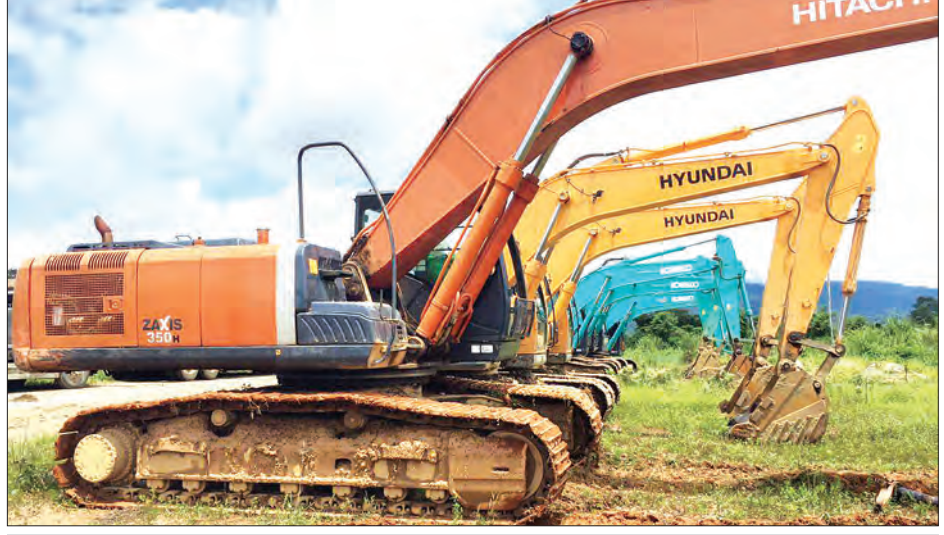
သိမ်းဆည်းရမိသည့် ယာဉ်ယန္တရားများကို တွေ့ရစဉ်

ထိုအတူ ညနေပိုင်းတွင် ဒွန်ဘန်ကျေးရွာနှင့် ရှုဒူဇွပ်ကျေးရွာအကြား လမ်းကြောင်းလုံခြုံရေး ဆောင်ရွက်လျက်ရှိသည့် တပ်မတော်စစ်ကြောင်းအား KIA လက်နက်ကိုင်အဖွဲ့မှ အင်အား သုံးဦးခန့်က ဆွဲမိုင်း လေးလုံးဖြင့် ဖောက်ခွဲတိုက်ခိုက်ခဲ့သဖြင့် တပ်မတော်စစ်ကြောင်းက ပြန်လည်ပစ်ခတ်တိုက်ခိုက်ခဲ့ရာ အရှေ့မြောက်ဘက်သို့ ဆုတ်ခွာထွက်ပြေးသွားခဲ့သည်။ အလားတူ ယနေ့နံနက်ပိုင်းတွင်လည်း ကာမိုင်းမြို့နယ် လမ်းကြောင်းမြောက်ဘက် အနီးတစ်ဝိုက်တွင် နယ်မြေရှင်းလင်း ဆောင်ရွက်လျက်ရှိသည့် တပ်မတော်စစ်ကြောင်းများအား KIA လက်နက်ကိုင်အဖွဲ့မှ အင်အား ၁၅ ဦးခန့်ဖြင့် တိုက်ခိုက်ခြင်း၊ လက်နက်ငယ်များဖြင့် ချောင်းမြောင်းပစ်ခတ်ခြင်း၊ လက်နက်ကြီးများဖြင့် နှောင့်ယှက်ပစ်ခတ်ခြင်းတို့ လုပ်ဆောင်ခြင်းကြောင့် ထိမိတိုက်ပွဲဖြစ်ပွားမှု သုံးကြိမ်ဖြစ်ပွားပြီး ယင်းအဖွဲ့များ အရှေ့ဘက်သို့ ဆုတ်ခွာထွက်ပြေးသွားခဲ့သည်။ အထက်ပါ တရားမဝင်ရွှေတူးဖော်မှုများကြောင့် နိုင်ငံတော်ပိုင် အဖိုးတန်သယံဇာတများ နှစ်နာဆုံးရှုံးရသည့်အပြင် စက်ယန္တရားများ အသုံးပြုရွှေတူးဖော်မှုကြောင့် မိုးကောင်းချောင်းပါ တိမ်ကော၍ သဘာဝပတ်ဝန်းကျင်အား ထိခိုက်ပျက်စီးခြင်း၊ လယ်ယာမြေများ ပျက်စီးဆုံးရှုံးခြင်းတို့ ဖြစ်ပေါ်နေကြောင်း သိရှိရသည်။ တပ်မတော်စစ်ကြောင်းများအနေဖြင့် ယင်းနယ်မြေအတွင်းရှိ တရားမဝင် ရွှေတူးဖော်မှုများ၊ ၎င်းအဖွဲ့များကို စောင့်ရှောက်အကာအကွယ်ပေးနေမှုများအား ဆက်လက် ရှင်းလင်းလျက်ရှိကြောင်း သတင်းရရှိသည်။ (မြဝတီ)