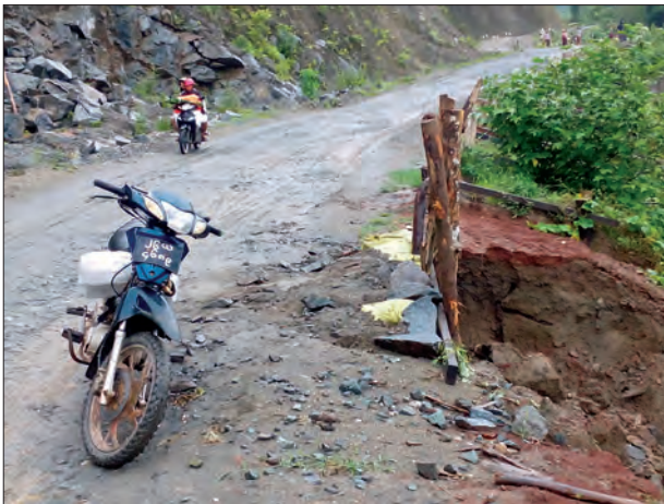
စစ်ကိုင်းတိုင်းဒေသကြီး ဝန်းမောက်မြို့နယ် ပင်းဟင်းခါးတောင်လမ်းမှာ မြေများပြိုကျ ခြင်း၊ ချိုင့်ခွက်ကြီးဖြစ်ပေါ်ခြင်း၊ ရေတိုက်စား၍ လမ်းမြေများလျော့ကျခြင်းများ ဖြစ် ပေါ်လျက်ရှိကြောင်း သိရသည်။ မိုးများအဆက်မပြတ်ရွာသွန်းခဲ့သောကြောင့် လမ်း ဘေးရှိ ရေနုတ်မြောင်းများမှာ တောင်ကျရေများ ကမ်းပါးများမှ လျော့ကျလာသော

ရေများကြောင့် ချောက်ကြီးများဖြစ်ကာ လမ်းကိုတိုက်စားလာခြင်း၊ လမ်းတစ်ဖက်ရှိ တောင်ခြေများသို့ လမ်းမြေများ မိုးရေစီးကြောင်းများနှင့်အတူ လျော့ကျလာခြင်း တို့ကြောင့် လမ်းမှာတဖြည်းဖြည်းကျဦးမြောင်းလာလျက်ရှိသည်။