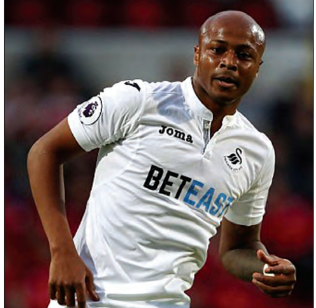
ကောင်းမြတ်သူ - စုစည်းသည်။

ဝက်စ်ဟမ်းအသင်းနည်းပြ ဆလေးဗင် ဘီလစ်ဟာ ဆွမ်ဆီးတိုက်စစ်မှူး အင်ဒရီအာယောကို ပေါင်သန်း ၂၀ နဲ့ ခေါ်ယူဖို့ ပစ်မှတ်ထားနေတယ်လို့ ဆိုပါတယ်။ လိုင်ယွန် တိုက်စစ်မှူး လက်ကာဇတ်တီကို လုပ်ခလစာပုံအောပေးပြီး ခေါ်ယူမှုကို လိုင်ယွန်က ငြင်းပယ်လိုက်ပြီးနောက် အာယောကို ခေါ်ယူဖို့ ဘီလစ်က ဆုံးဖြတ်လိုက်တယ်လို့ ဆိုပါတယ်။ ဝက်စ်ဟမ်းအသင်းအနေနဲ့ ဂါနာတိုက်စစ်မှူး အာယောကို ပေါင် ၁၆ သန်းနဲ့ အရခေါ်ယူဖို့ ပြင်ဆင်နေတယ်လို့ ဆိုပါတယ်။ သို့သော်လည်း ဆွမ်ဆီးက အလိုရှိတဲ့အတိုင်း ပေါင်သန်း ၂၀ အပြည့်အဝပေးပြီး ခေါ်ယူရဖွယ်ရှိနေပါတယ်။ တိုက်စစ်မှူး အာယောဟာ ပြီးခဲ့တဲ့ ရာသီက ဆွမ်ဆီးအတွက် ၁၂ ဂိုးသွင်းယူပေးခဲ့သူဖြစ်ပါတယ်။ ဝက်စ်ဟမ်းအနေနဲ့ အာယောကို အရခေါ်ယူနိုင်မယ်ဆိုရင်တော့ လာမယ့်ရာသီမှာ အဓိက ကစားသမားတစ်ဦးဖြစ်လာနိုင်ပါတယ်။ အာယောဟာ ရာသီအကြိုပွဲတွေမှာတော့ ဆွမ်ဆီးအသင်းနဲ့အတူ ဥရောပခရီးစဉ်တွေမှာ သွားရောက်ကစားနေပါတယ်။ အာယောဟာ အရည်အချင်းပြည့်ဝတဲ့ တိုက်စစ်မှူးဖြစ်လို့ လင်းလက်တောက်ပလာမယ့် ကစားသမားတစ်ဦးလို့ ဆိုနိုင်ပါတယ်။