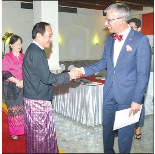
ဩဂုတ် ၁ ရက်က ဆွစ်ဇာလန်နိုင်ငံ၏ အမျိုးသားနေ့ ညှိနှိုင်းအခမ်းအနား တက်ရောက်လာသော ကျန်းမာရေးနှင့် အားကစားဝန်ကြီးဌာန ပြည်ထောင်စု ဝန်ကြီး ဒေါက်တာမြင့်ထွေးနှင့် ဇနီးတို့အား မြန်မာနိုင်ငံဆိုင်ရာ ဆွစ်ဇာလန် နိုင်ငံ သံအမတ်ကြီး H.E.Mr.Paul R.Seger ကြိုဆိုနှုတ်ဆက်စဉ် (သတင်းစဉ်)

သတင်း-ဇော်ကြီး(ပဏီတ)