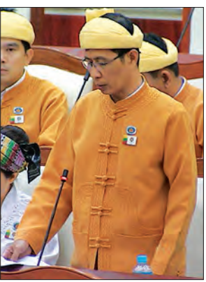
သီပေါမြို့နယ် ပြည်သူ့လွှတ်တော်ကိုယ်စားလှယ် ဦးစိုင်းသန်းဇင်

ဗန်းမောက်မဲဆန္ဒနယ်မှ ဦးကျော်စိုး၏ ဗန်းမောက်မြို့နယ်အတွင်းရှိ ကြီးပိုင်း၊ ကြီးပြင်ကာကွယ်တောအတွင်း ကျရောက်နေသော လယ်မြေ၊ ယာမြေများကို စွန့်လွှတ်ပေးရန် မည်သို့ဆောင်ရွက်ပေးမည်ကို သိရှိလိုကြောင်း မေးခွန်းနှင့် စပ်လျဉ်း၍ သယံဇာတနှင့် သဘာဝပတ်ဝန်းကျင်ထိန်းသိမ်းရေးဝန်ကြီးဌာန ပြည်ထောင်စုဝန်ကြီး ဦးအုန်းဝင်းက စစ်ကိုင်းတိုင်းဒေသကြီး ကသာခရိုင် ဗန်းမောက်မြို့နယ်တွင် သစ်တောကြီးပိုင်း ၂၁ ခု၊ ဧရိယာ ၃၆၄၃၄၅ ဧကနှင့် ကြီးပြင်ကာကွယ်တော ခုနစ်ခု၊ ဧရိယာ ၁၈၄၉၂၅ ဧက စုစုပေါင်း သစ်တောမြေ ၅၄၉၂၇၀ ဧကရှိပါကြောင်း၊ ဗန်းမောက်မြို့နယ်အတွင်းရှိ သစ်တောနယ်မြေအတွင်း ပြန်ကျအိမ်စုမှ ရွာမြေဧရိယာ ၀ ဒသမ ၀၃ ဧက၊ လယ်မြေ ၄၄၉ ဒသမ ၁၆ ဧက၊ ပြင်ပကျူးလယ်မြေ ၂၆၅၄ ဒသမ ၈၈ ဧက၊ သာသနာ့/ အများပိုင် ၇၁ ဒသမ ၅ ဧက၊ စုစုပေါင်း ၃၀၇၅ ဒသမ ၅၇ ဧကအား အိမ်မြေ ၅၀ အောက် ပြန်ကျအိမ်စုများနှင့် ပြင်ပကျူးကျော်သည့် ရွာမြေ၊ လယ်မြေများကို သစ်တောနယ်မြေအဖြစ်မှ ပယ်ဖျက်ပေးသွားမည် ဖြစ်ပြီး ကျန်ရှိ စုစုပေါင်းယာမြေ ၄၀၆ ဒသမ ၆၈ ဧကအား သစ်တောမြေမှ