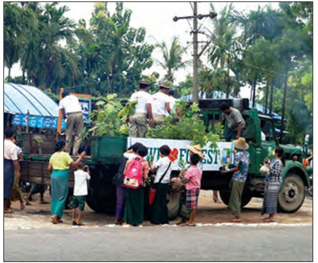
သစ်တောဦးစီးဌာနက ကျေးရွာများအရောက်

အလားတူ အသိပညာပေးဟောပြောပွဲကို မိုင်းဆတ်မြို့နယ် ကျယ်ကျေးရွာတွင် လည်း နေ့လယ်ပိုင်း၌ ဆက်လက်ပြုလုပ်ခဲ့ပြီး ဒေသခံပြည်သူများအား ပညာပေး ဟော ပြောခဲ့ကြောင်း သိရသည်။ (ခရိုင် ပြန်/ဆတ်)