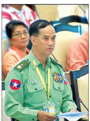
ဒုတိယဝန်ကြီး ဝိုလ်ချုပ်အောင်စိုး

ဒုတိယဝန်ကြီးက ယစ်မျိုးခွန်နှုန်းထားများကို သက်ဆိုင်ရာ နေပြည်တော်၊ တိုင်းဒေသကြီးနှင့် ပြည်နယ်အလိုက် တိုးမြှင့်သတ်မှတ်ထားပြီး ၂၀၁၆-၂၀၁၇ ခုနှစ် ဘဏ္ဍာရေးနှစ်စတင်သည့် ဧပြီလ တစ်ရက်နေ့မှစ၍ ကောက်ခံလျက်ရှိသည့် အတွက် လတ်တလော အခွန်နှုန်းထားများ တိုးမြှင့်ပြင်ဆင်ရန် မရှိပါကြောင်း၊ ကျန်းမာရေးနှင့် အားကစားဝန်ကြီးဌာနမှလည်း အရက်ဆိုးကျိုး ကျန်းမာရေးပညာပေးမှုကို တစ်နိုင်လုံး ကျယ်ပြန့်စေရန်အတွက် ပြည်သူ့ကျန်းမာရေး ဦးစီးဌာန၊ ကျန်းမာပညာနှင့် ကုသရေး ဦးစီးဌာနမှ အရက်စွဲရောဂါကုသရေး စီမံချက်တို့ဖြင့် ပေါင်းစပ်ညှိနှိုင်းဆောင်ရွက်သွားမည်ဖြစ်ကြောင်း ပြောကြားသည်။