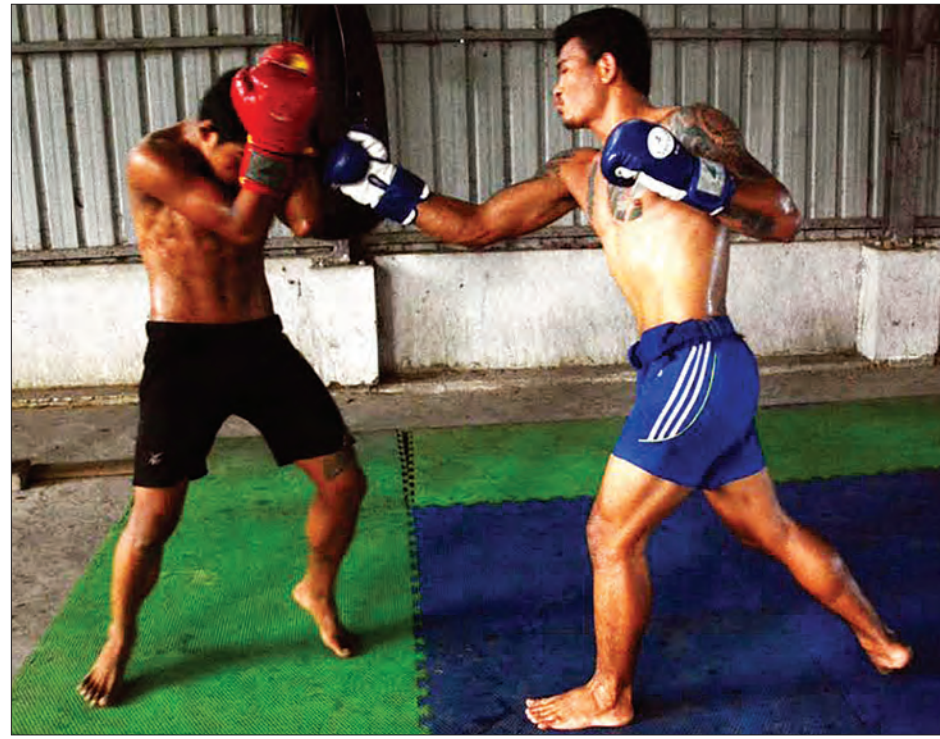
တူးတူးနှင့် နဂါးမာန်ကလပ်မှ ထွန်းထွန်းမင်းတို့ လေ့ကျင့်ကစားနေစဉ်

ဘယ်လက်ဝှေ့သမားမဆို အလွတ်တန်း ချန်ပီယံတော့ဖြစ်ချင်ကြတာပဲ။ ဒါပေမယ့် ခုတော့ မြန်မာပြည် အလွတ်တန်း ချန်ပီယံ က ကျွန်တော်သူငယ်ချင်းဖြစ်နေတော့ ချန်ပီယံဖြစ်ရေးအိပ်မက်ကို ခဏရပ်ဆိုင်း ထားရသလိုမျိုး ဖြစ်နေတယ်။ ဒါပေမယ့် အသက်အပိုင်းအခြားကလည်း စကားပြော လာပြီဖြစ်တာကြောင့် ချန်ပီယံဖြစ်ရေး စိတ်ကူးအိပ်မက်ကို စတင် အကောင် အထည်ဖော်ရတော့မှာပါ