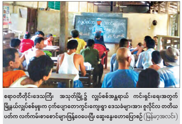
ရောဂါတိုင်းဒေသကြီး အသုတ်မြို့၌ လျှပ်စစ်အန္တရာယ် ကင်းရှင်းရေးအတွက် မြန်မာ့လျှပ်စစ်ဓာတ်အားကုန်သွယ်ရေးကွင်းကျေးရွာ ဒေသခံများအား ဇူလိုင်လ တတိယပတ်က လက်ကမ်းစာစောင်များဖြန့်ဝေပေးပြီး ဆွေးနွေးဟောပြောစဉ် (မြန်မာ့အလင်း)