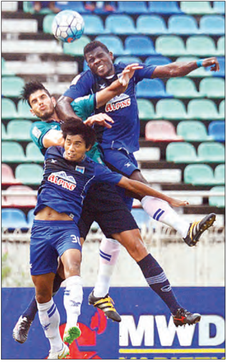
ရန်ကုန်နှင့် ရတနာပုံအသင်း ယှဉ်ပြိုင်စဉ်

နိုင်ခဲ့ပြီး ရတနာပုံပိုင်းပေါက်ကို ခြိမ်းခြောက်လာနိုင် သည်။ ၃၄ မိနစ်တွင် ရတနာပုံအသင်းမှ မာတူနာ နှင့် အောင်သူတို့ အပိုင်ကန်ခွင့်ရခဲ့သော်လည်း အသုံးမချနိုင်ခဲ့ပေ။ ၄၃ မိနစ်တွင် ရန်ကုန်အသင်း ပိုင်းစရခဲ့ပြီး မာဆယ်လိုက သွင်းယူခဲ့ခြင်းဖြစ်သည်။ ဒုတိယပိုင်းအစတွင် ရတနာပုံအသင်း ချေပပိုင်းပြန်ရ ခဲ့ပြီး တိုက်စစ်မှူး မာတူနာက သွင်းယူခဲ့ခြင်းဖြစ်သည်။ ယင်းနောက်ပိုင်းတွင် နှစ်သင်းစလုံး အနိုင်ရရှိရေး အတွက် ကစားသမား အပြောင်းအလဲပြုလုပ်ကာ တိုက်စစ်ဖြင့်ခဲ့သည်။ မိနစ် ၇၀ နောက်ပိုင်းတွင် ရတနာပုံအသင်းက သရေရလဒ်ကို ထိန်းကစား သွားခဲ့ပြီး ရန်ကုန်အသင်း အခွင့်အရေးပိုရခဲ့သည်။ မိနစ် ၈၀ ကျော်တွင် ရန်ကုန်အသင်း ပိုင်းရနိုင်သည့် အခွင့်အရေး နှစ်ကြိမ်ရရှိခဲ့သော်လည်း ဒေးပစ်ဒန်း အသုံးမချနိုင်ခဲ့၍ သရေရလဒ်ဖြင့် ပြီးဆုံးခဲ့ခြင်း ဖြစ်သည်။ ယနေ့၌ ရုံး / ထွက် ဆီမီးပိုင်းပွဲကို သုဝဏ္ဏကွင်း၌ မကွေးအသင်းနှင့် ဇွဲကပင်အသင်းတို့ ယှဉ်ပြိုင်ကစားမည်ဖြစ်သည်။