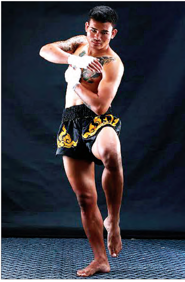
တူးတူးလေ့ကျင့်နေစဉ်

ဖြေ။ ။ ဟုတ် အရင်နှစ်ကနဲ့တူတယ်။ ကျွန်တော်နဲ့ ခုလက်ရှိချန်ပီယံထွန်းထွန်းမင်း နဲ့ပွဲစဉ်ပေးဖို့ စီစဉ်တဲ့သူကလာပြောပါတယ်။ ဒါပေမယ့် နှစ်ဦးစလုံးက ငြင်းဆန်ခဲ့တာပါ။ ကျွန်တော်တို့က သူငယ်ချင်းတွေ၊ မထိုးဘူးဆိုပြီးတော့၊ အဲဒီလို