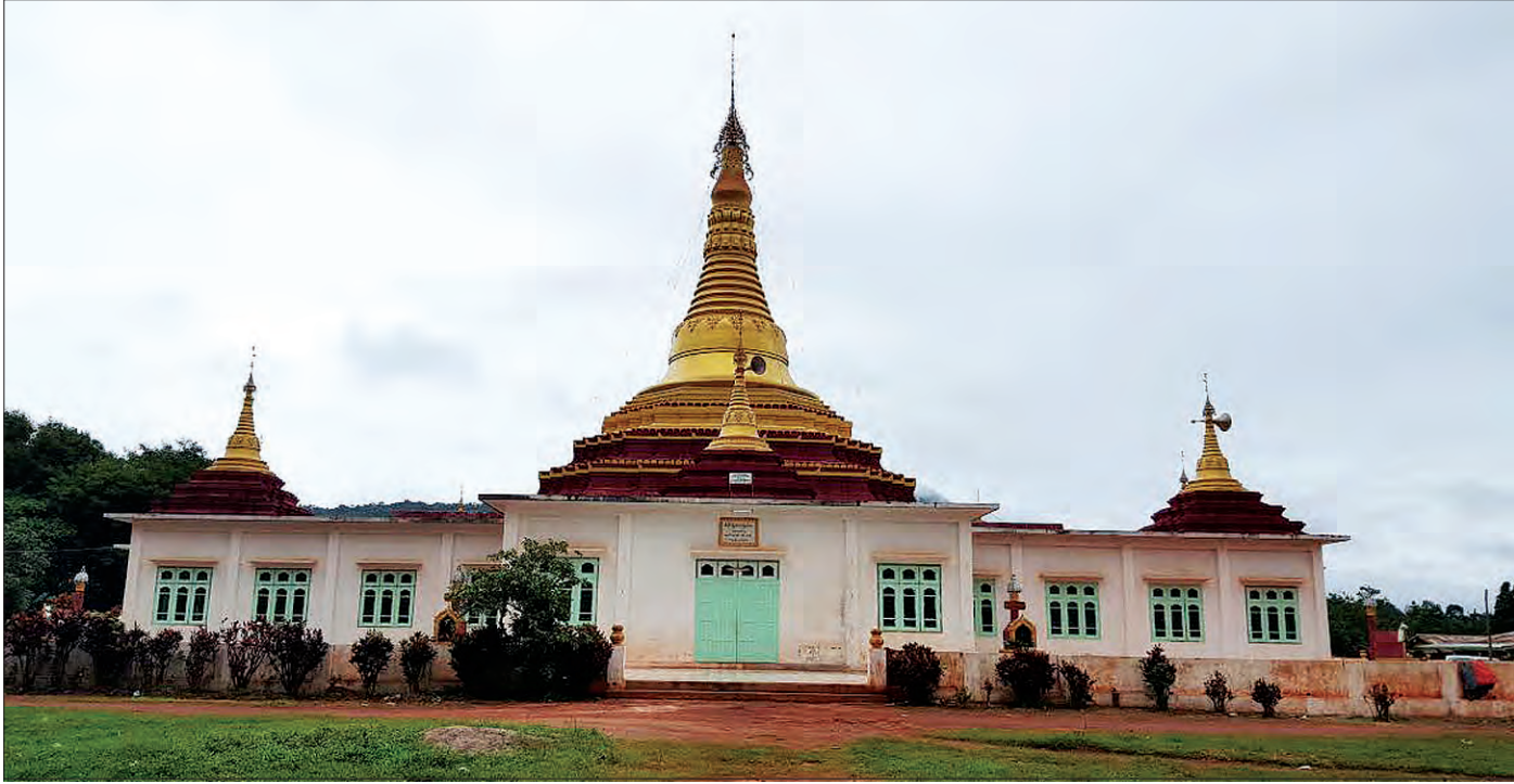
ဆီဆိုင်မြို့အထက်နားဆီက တောင်ကုန်းလေးပေါ်တွင် တည်ထားသည့် မေ့တော်စေတီအား ဖူးတွေ့ရစဉ်