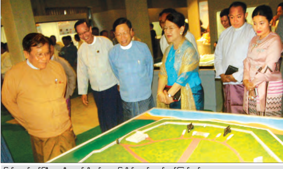
ပြည်ထောင်စုဝန်ကြီး သူရဦးအောင်ကို ယဉ်ကျေးမှုပြတိုက်အတွင်း လှည့်လည်ကြည့်ရှုစဉ် အပါအဝင် ပြတိုက်တွေကို အဆင့် ပြသနိုင်အောင် ဆောင်ရွက်နေပါတယ်” မြှင့်တင်ပြီး စံနှုန်းနဲ့ညီစွာ ခင်းကျင်း ဟု ဖွင့်ပွဲအခမ်းအနားတွင် ပြည်ထောင်စု ဝန်ကြီးက ပြောသည်။

မန္တလေးမြို့ လမ်း ၈၀ နှင့် ၂၄ လမ်းရှိ ယဉ်ကျေးမှုပြတိုက်နှင့် စာကြည့်တိုက် (မန္တလေး) အဆင့်မြှင့်တင်ဖွင့်လှစ်ပွဲကို ယနေ့နံနက် ၈ နာရီက ကျင်းပရာ သာသနာရေးနှင့် ယဉ်ကျေးမှုဝန်ကြီးဌာန ပြည်ထောင်စုဝန်ကြီး သူရဦးအောင်ကို တက်ရောက်ဖွင့်လှစ်ပေးသည်။