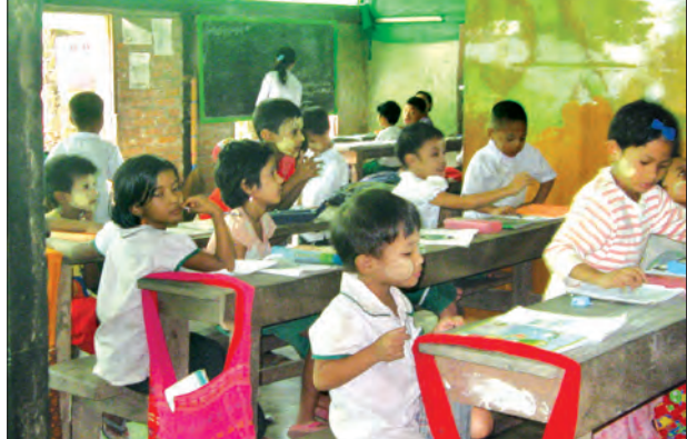
စားဝတ်နေရေးများကို ဘက်ပေါင်းစုံမှ တာဝန်ယူစောင့်ရှောက်ကာ ပညာရေးကို KG တန်းမှ အဋ္ဌမတန်းအထိ ဘုန်းတော်ကြီး (ဘ-က)ကျောင်းတွင် လည်းကောင်း၊ အလယ်တန်းပညာကို ဖြူးမြို့ရှိ အထက(၂)သို့လည်းကောင်း ပညာသင်ကြားလျက်ရှိသည်။

ဖြူး ဇူလိုင် ၃၀ ပဲခူးတိုင်းဒေသကြီး တောင်ငူခရိုင်ဖြူးမြို့နယ် ဖြူးအရှေ့ဘက် ဖြူးအုတ်ဖြတ်ကားလမ်း ညောင်ပင်သာကျေးရွာမြောက်ဘက် တစ်မိုင်ခန့်အကွာ တံခွန်တိုင်ကျေးရွာအုပ်စု သပြေသာကျေးရွာ (ရွှေသပြေသာ ဘုန်းတော်ကြီး) (ဘ-က)ဘုန်းတော်ကြီးသင် ပညာရေးမူလတန်းကျောင်းသို့ ဧပြီ ၅ ရက်က ရှမ်းပြည်နယ်တောင်ပိုင်း တောင်ကြီးမြို့နယ် ကျောက်တစ်လုံးကြီးဒေသ နောင်တိုင်းကြီးကျေးရွာမှ မိဘမဲ့အများစုပါဝင်သော ကျောင်းသား ကျောင်းသူ ၂၈ ဦးတို့သည် ဘုန်းတော်ကြီးတစ်ပါး၏ ဆက်သွယ်ပေးမှုဖြင့် ရောက်ရှိလာခဲ့သည်။ ယင်းသို့ ရောက်ရှိလာခဲ့ကြသော ကျောင်းသား ကျောင်းသူ ကလေး ၂၈ ဦးသည် ဘုန်းတော်ကြီးအဖွဲ့အစည်းတွင် လည်းကောင်း၊ အလယ်တန်းပညာကို ဖြူးမြို့ရှိ အထက(၂)သို့လည်းကောင်း ပညာသင်ကြားလျက်ရှိသည်။ မူလတန်းအဆင့်ရှိ ကျောင်းသား ကျောင်းသူလေးများအား ဘုန်းတော်ကြီး မူလတန်းကျောင်းတွင်ပင် ဆရာမ