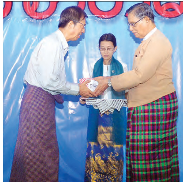
အမျိုးသားဒီမိုကရေစီအဖွဲ့ချုပ် နာယက သူရဦးတင်ဦး စာတမ်းရှင် ဦးအေးမောင် (အေးမောင်ကျော်) အား ဉာဏ်ပူဇော်ခ ပေးအပ်ချီးမြှင့်စဉ်