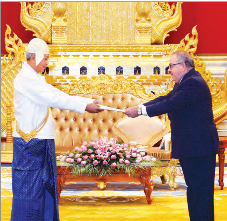
နိုင်ငံတော်သမ္မတ ဦးထင်ကျော်ထံ မက္ကဆီကို ပြည်ထောင်စု နိုင်ငံသံအမတ်ကြီး မစ္စတာ ရိုဂယ်လီရိုဂရန် ဂေလ်ဟုမ်း မော်ဖင်း ၎င်း၏ သံအမတ်ခန့်အပ်လွှာကို ပေးအပ်စဉ်