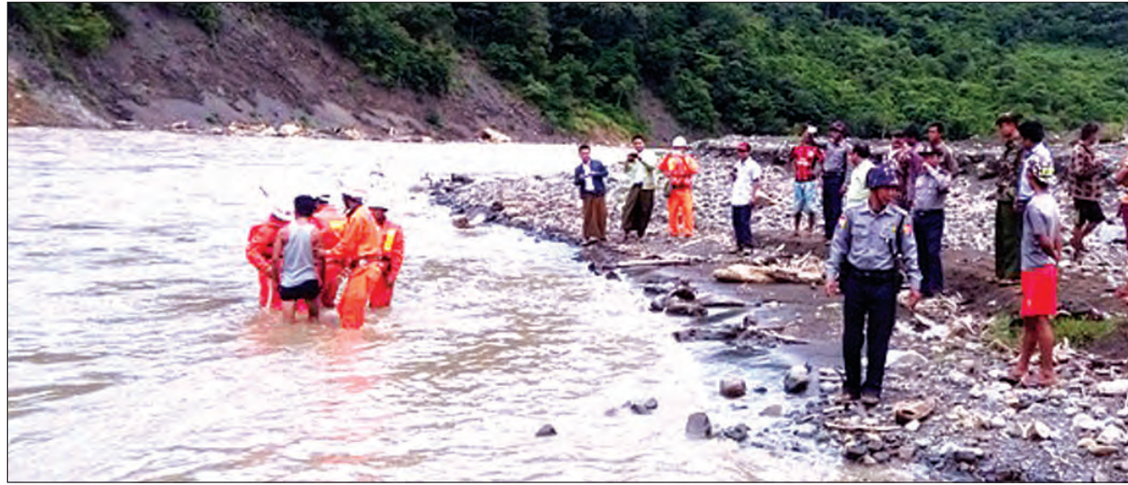
ချင်းပြည်နယ် တွန်းခံမြို့နယ် နတ်ဇန် ရွာသစ်ကျေးရွာတွင် ဇူလိုင် ၂၆ ရက်က အသက်ကယ် အင်္ကျီပေးအပ်ခြင်းနှင့် သဘာဝဘေးအန္တရာယ်ဖြစ်ပွားလာပါက ကြိုတင်ကာကွယ်ရေး နည်းလမ်းများကို ကျေးရွာနေပြည်သူများအား သရုပ်ပြလေ့ကျင့်သင်ကြားပေးခြင်းများ ပြုလုပ်နေစဉ်။ (မြို့နယ် ပြန်/ဆက်)

မြန်မာနိုင်ငံရဲတပ်ဖွဲ့ရဲချုပ် ရဲချုပ်ဇော်ဝင်းက အမှာစကားပြောကြားရာတွင် ပြီးခဲ့သော ငါးနှစ်စီမံကိန်းတွင် မည်သည့်လုပ်ငန်းများ အကောင်အထည်ဖော်ဆောင်ရွက်နိုင်သည်ကို သုံးသပ်ရာတွင် ပထမအချက်အနေဖြင့် အမေရိကန် TIP Report က ထောက်ပြသော အချက် ၁၄ ချက်ကို ထည့်သွင်းစဉ်းစားဆွေးနွေးပေးစေလိုကြောင်း၊ ဒုတိယအချက်အနေဖြင့် နိုင်ငံခြားကျော်မှုခင်းများနှင့်စပ်လျဉ်း၍ UNODC နှင့် ဆောင်ရွက်နေသည့် Country Program ရှိနေပြီး Regional Program ဆောင်ရွက်ချက်နှင့်ချိတ်ဆက်နေသဖြင့် Country Program ဆောင်ရွက်ချက်နှင့်တတိယ ငါးနှစ်စီမံကိန်းအကောင်အထည်ဖော်ဆောင်ရွက်မှုများ ချိတ်ဆက်မှုရှိရန်လိုကြောင်း ပြောကြားပြီး International Organization for Migration (မြန်မာ)မှ Chief of Mission, Mr. Kien Gonmar -Best က အမှာစကားပြောကြားသည်။ ဆွေးနွေးပွဲပထမနေ့တွင် ငါးနှစ်စီမံကိန်းပါ လုပ်ငန်းကဏ္ဍငါးရပ်အနက် မူဝါဒနှင့် ပူးပေါင်းဆောင်ရွက်ရေးကဏ္ဍ၊ ကြိုတင်တားဆီးကာကွယ်ရေးကဏ္ဍနှစ်ရပ်ကို ကဏ္ဍတစ်ခုချင်းအလိုက် လူကုန်ကူးမှုတားဆီးနိမ်နင်းရေးရဲတပ်ဖွဲ့က ရှင်းလင်းဆွေးနွေးပြီး တက်ရောက်လာသူများက အဖွဲ့ငါးဖွဲ့ခွဲ၍ဆွေးနွေးခြင်းများ ဆောင်ရွက်ခဲ့သည်။ မင်းမင်းလတ်(မန်းတက္ကသိုလ်)