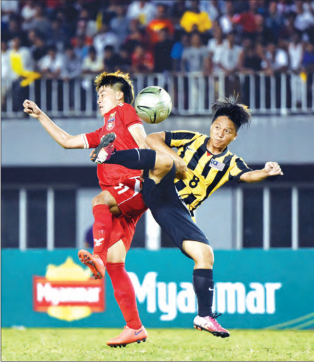
အိမ်ရှင်မြန်မာအသင်းနှင့် မလေးရှားအသင်းတို့ အကြိတ်အနယ်ယှဉ်ပြိုင်နေစဉ်