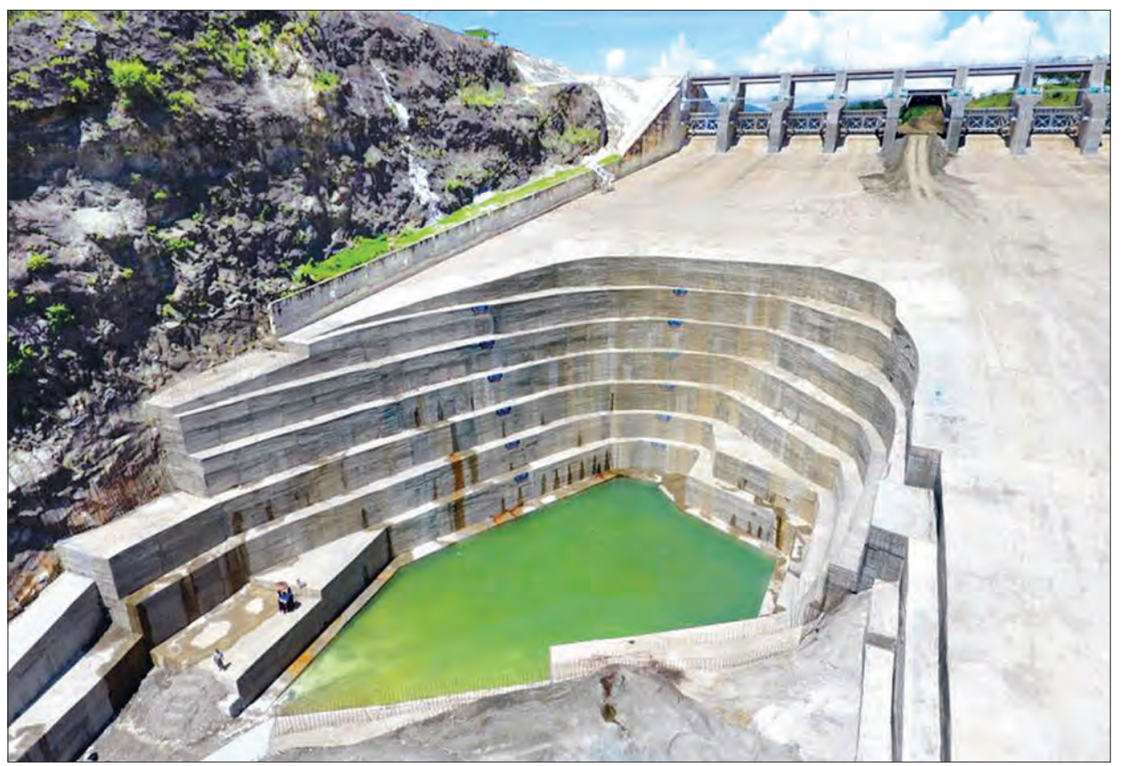
ကြီးအုံ-ကြီးဝ ရေလှောင်တံခံအား ပြန်လည်ပြင်ဆင်ထားမှုကို တွေ့ရစဉ်

တင်ထွန်းဦး(မင်းဘူး) မင်းဘူး ဇူလိုင် ၂၉ မကွေးတိုင်းဒေသကြီး မင်းဘူးခရိုင် ပွင့်ဖြူမြို့နယ် ဝန်လိုကျေးရွာအနီးရှိ ကြီးအုံ-ကြီးဝ ရေလှောင်တံခံအား ၂၀၁၅ ခုနှစ် ဇူလိုင်လအတွင်း ရေကြီးစဉ်က ပျက်စီးခဲ့မှုများကို အချိန်မီပြုပြင်ဆောင်ရွက်နိုင်ခဲ့သဖြင့် ယခုနှစ်တွင် တံခံမှ ရေကြီးရေလျှံမှုများ ဖြစ်ပွားမည်ကို ကာကွယ်နိုင်မည်ဖြစ်သည်။ ကြီးအုံ-ကြီးဝ ရေလှောင်တံခံသည် စေတုတ္ထရာမြို့နယ် မုန်းချောင်းတံခံမှ စီးဆင်းလာသော မုန်းချောင်း၊ ဆီးမီးချောင်းနှင့် မိုးတွင်းကာလတွင်သာ စီးဆင်းသော ကြီးချောင်းတို့မှ ရေကို သိုလှောင်ထားရှိပြီး ပွင့်ဖြူမြို့နယ်အတွင်းရှိ မဲလီရေလွှဲဆည်မှ တောင်မုန်းမြောင်းမကြီးနှင့် မြောက်မုန်း မြောင်းမကြီး နှစ်သွယ်မှ စိုက်ပျိုးရေးများ ဖြန့်ဝေပေးရာ နေ့စပါး၊ မိုးစပါးစေ ၉၆၀၀၀ ကျော်ကို စိုက်ပျိုးရေး ပြည့်ဝစွာ ပေးဝေနိုင်သည့်အပြင် လျှပ်စစ်ဓာတ်အား ၇၄ မဂ္ဂါဝပ်ကိုလည်း ထုတ်လွှတ်ပေးလျက်ရှိသည်။ ဇန်နဝါရီလအမျိုးအစားဖြစ်ပြီး စာမျက်နှာ ၆ ကော်လံ ၁ ❀