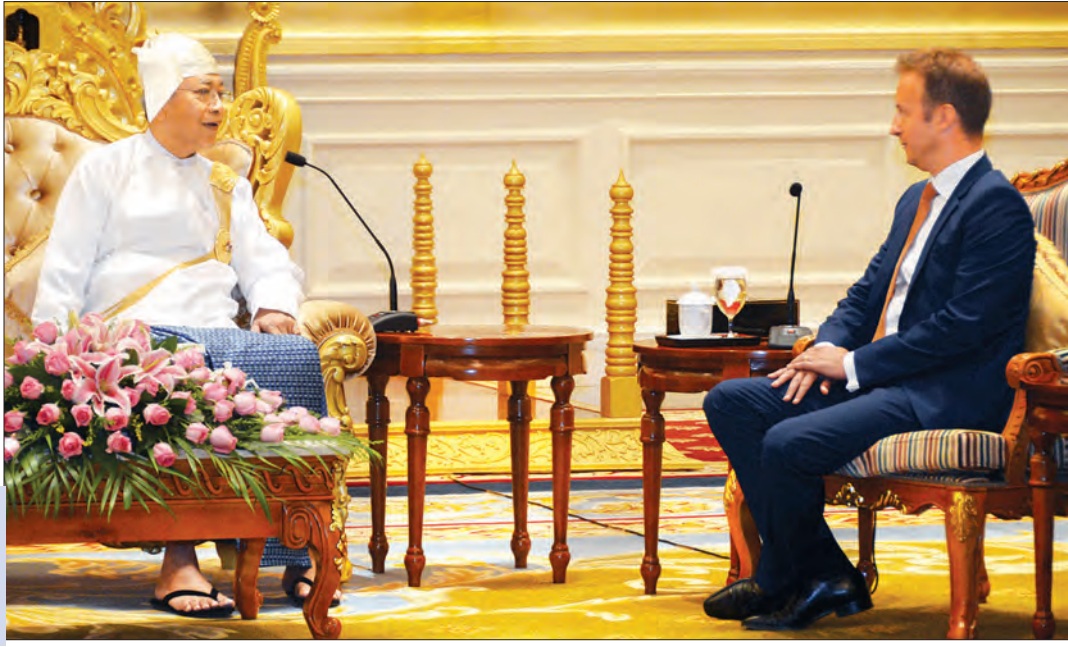
နိုင်ငံတော်သမ္မတ ဦးထင်ကျော်နှင့် နယ်သာလန် နိုင်ငံ သံအမတ်ကြီး မစ္စတာ ဝေါင်တာ ရောဘတ် မာရီရာဂန်စ် တို့ တွေ့ဆုံစဉ်