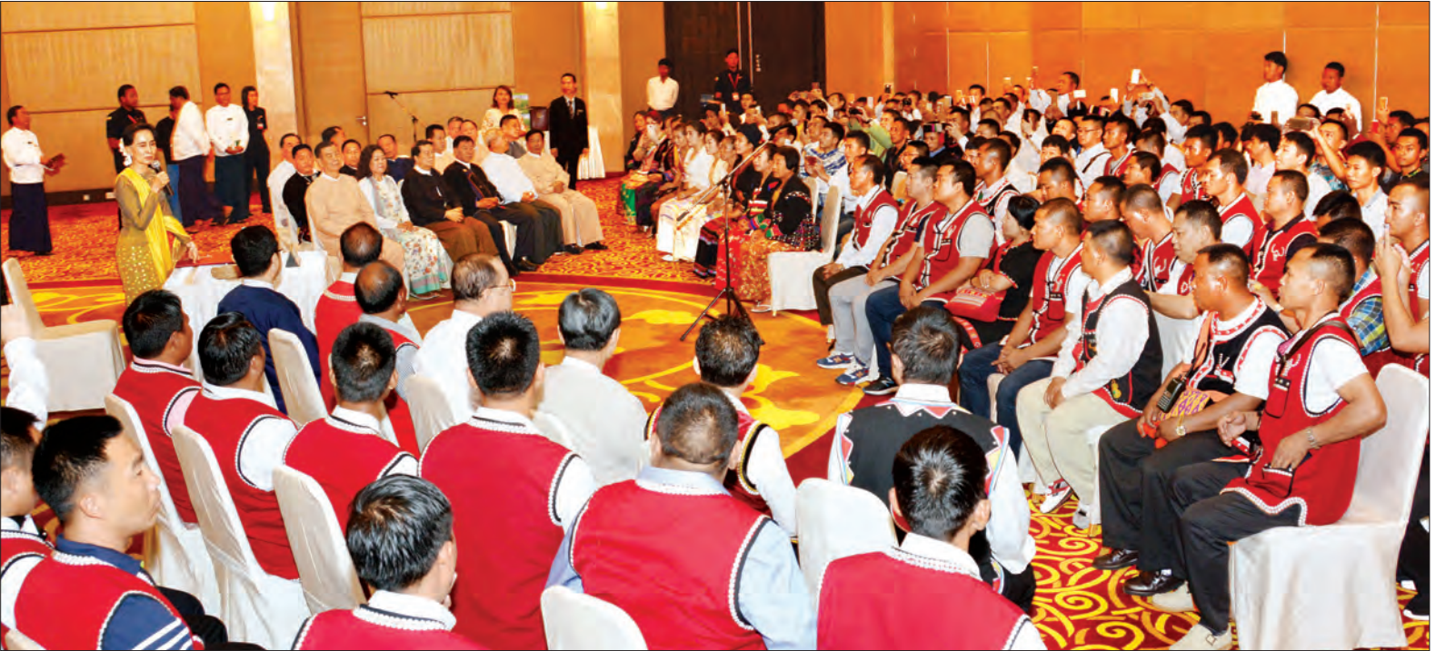
နိုင်ငံတော်၏ အတိုင်ပင်ခံပုဂ္ဂိုလ် ဒေါ်အောင်ဆန်းစုကြည် “ဝ” အထူးဒေသ(၂) နှင့် အထူးဒေသ (၄) မိုင်းလားမှ အဖွဲ့ဝင်များ၊ လူငယ်များနှင့် အမျိုးသမီးငယ်များအား တွေ့ဆုံစဉ်

ထို့ပြင် “ဝ” အထူးဒေသ (၂)နှင့် အထူးဒေသ (၄) မိုင်းလားနှစ်ဖွဲ့စလုံးက မကြာမီကျင်းပမည့် ပြည်ထောင်စုငြိမ်းချမ်းရေးညီလာခံ (၂၁) ရာစုပင်လုံကို ကြိုဆိုထောက်ခံကြောင်း ပြောကြားခဲ့ကြသည်။