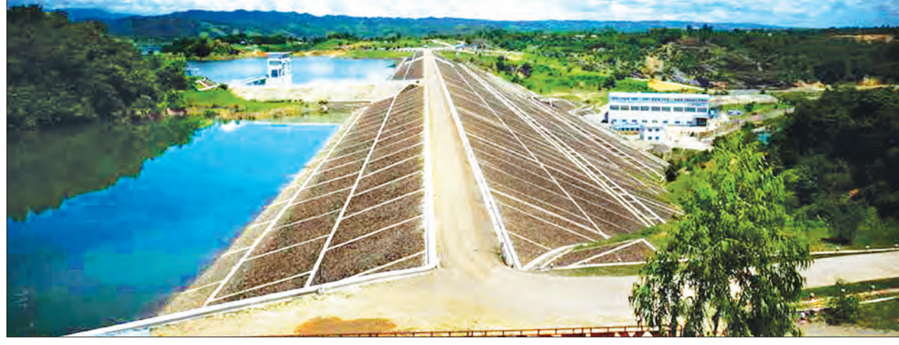
ကြီးအုံ-ကြီးဝ ရေလှောင်တံမံကို တွေ့ရစဉ်