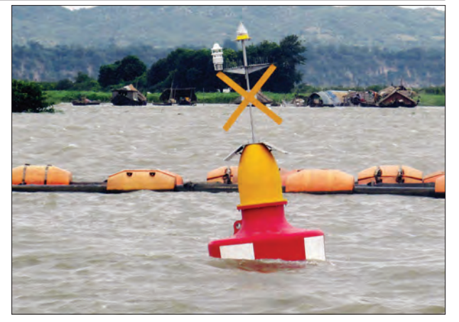
အဆိုပါတိုင်းတာရေးကိရိယာများမှတစ်ဆင့် သတင်းအချက်အလက်များရယူလိုသောပြည်သူများအနေဖြင့် www.envault.com.au ဝက်ဘ်ဆိုက်တွင် user name=dwir နှင့် p.w>dwir တို့တွင် အခမဲ့ရယူသုံးစွဲနိုင်ကြောင်း သိရသည်။ ယင်းစက်ကိရိယာများ တပ်ဆင်အသုံးပြုနိုင်ခြင်းဖြင့် ရာဝတီမြစ် ရေအရင်းအမြစ် စီမံခန့်ခွဲမှု၊ သယ်ယူပို့ဆောင်ရေးကဏ္ဍနှင့် ရာသီဥတုအချက်အလက်များ စုစည်းမှုတို့ကို များစွာအထောက်အကူပြုမည်ဖြစ်ကြောင်း သိရသည်။ သတင်း-မြင့်မောင်စိုး၊ ဓာတ်ပုံ-တင်စိုး(မြန်မာ့အလင်း)

ရာဝတီမြစ်ကြောင်းတစ်လျှောက် ပြည်ပအကူအညီဖြင့် တိုင်းတာရေးကိရိယာများတပ်ဆင်