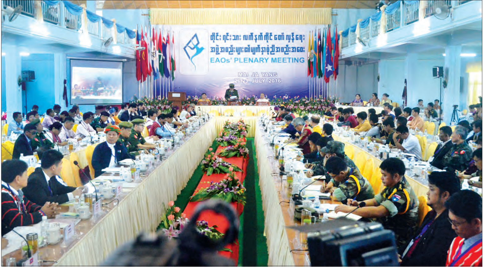
စာမျက်နှာ ၅ ကော်လံ ၁ *

မိုင်ဂျာယန် ဇူလိုင် ၂၆ တိုင်းရင်းသား လက်နက်ကိုင်အဖွဲ့အစည်းများ၏ မျက်နှာစုံညီအစည်းအဝေးကို ယနေ့နံနက် ၈ နာရီခွဲက ကချင်ပြည်နယ် မိုင်ဂျာယန်၌ စတင်ကျင်းပသည်။ (ယာပုံ) အစည်းအဝေးနှင့် စပ်လျဉ်းသည့် ထုတ်ပြန်ချက်တစ်ရပ်၌ အစည်းအဝေး၏ တရားဝင်ခေါင်းစဉ်အမည်သည် တိုင်းရင်းသားလက်နက်ကိုင် တော်လှန်ရေး အဖွဲ့အစည်းများ မျက်နှာစုံညီအစည်းအဝေးဖြစ်ကြောင်း ဖော်ပြထားသည်။ အစည်းအဝေး သဘာပတိ ညီညွတ်သော တိုင်းရင်းသားလူမျိုးစု ဖက်ဒရယ်ကောင်စီ (UNFC) ဥက္ကဋ္ဌဦးအင်ဘန်လက နိုင်ငံတော်၏ အတိုင်ပင်ခံပုဂ္ဂိုလ် ဒေါ်အောင်ဆန်းစုကြည်နှင့် မိမိတို့ UNFC ခေါင်းဆောင်များ လွန်ခဲ့သည့် အပတ် တွေဆုံခဲ့စဉ်တွင်လည်း တိုက်ပွဲကိစ္စများ ဖြေရှင်းသွားရန် တင်ပြခဲ့ကြောင်း၊ ထို့အပြင် (၂၁) ရာစု ပင်လုံညီလာခံသည် ဝိုင်းရံပိတ်ဆို့မှုနှင့် တိုင်းရင်းသားခေါင်းဆောင်များ အကြားတွင် ထားရှိခဲ့ကြသည့် နိုင်ငံရေးပဋိညာဉ်ကို