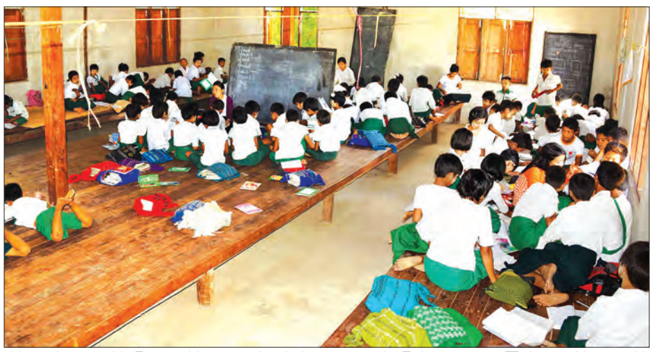
အိမ်ထောင်စု ၃၂၀၊ အိမ်ခြေ ၂၅၅ အိမ်၊ လူဦးရေ ၁၃၀၀ ကျော်နေထိုင်သည့် ရေလယ်ကျွန်းရွာဖြစ်သည်။ ကျေးရွာနေပြည်သူအများစု၏ အသက်မွေးဝမ်းကျောင်းလုပ်ငန်းမှာ ကျွန်းမြေကို လာသောကြောင့် လူနေအိမ်များနေထိုင်အသုံးပြု၍ စိုက်ပျိုးရေးလုပ်ငန်းဖြစ်ရာ ရန်ပင် အခက်အခဲဖြစ်လာကြောင်း သိရသည်။

နေထိုင်ရန် အခက်အခဲရှိလာသဖြင့် ဖြိုချဖျက်သိမ်းကာ တစ်ဖက်ကမ်းရှိ ညောင်ဦးမြို့နယ် တောင်ဘီလယ်ယားကျေးရွာရှိ နတ်ထောင့်၊ ကမ္မ မြို့ထောင့်၊ ရတနာမာန်အောင်ရွှေကျောင်း၊ မြသီတာစသည် ဘုန်းကြီးကျောင်းခြောက်ကျောင်း၌ ယာယီတည်းခိုခန်းများ နေထိုင်နေရကြောင်း သိရသည်။ “မြစ်ရေ မတက်ခင်ကတည်းက ကမ်းပါးတွေက တဖြည်းဖြည်းပြိုကျနေတာ၊ အခုရေတက်လာပြီဆိုတော့ အခြေအနေပိုဆိုးပြီ အခုဆိုရင် ရွာက ကမ်းပါးခြေက အိမ်ခြေ ၅၀ လောက်ပဲ ကျန်တော့တယ်။ ရေပြန်ကျရင် ဒီထက်လျော့သွားဖို့ပဲရှိတယ်” ဟု အရှေ့ဆယ်လံကျေးရွာနေ ပြည်သူတစ်ဦးက ၎င်းတို့၏အခက်အခဲကို ပြောသည်။ အရှေ့ဆယ်လံ ကျေးရွာသည်