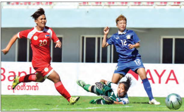
ထိုင်းအသင်းနှင့် ဗီယက်နမ်အသင်းတို့ ယှဉ်ပြိုင်ကစားနေစဉ်

မြန်မာနိုင်ငံက အိမ်ရှင်အဖြစ် လက်ခံကျင်းပသည့် ၂၀၁၆ အာဆီယံအမျိုးသမီးဘောလုံးပြိုင်ပွဲအုပ်စု (က) ပထမနေ့ပွဲများကို ယနေ့ညနေပိုင်းက မန္တလေးမြို့ရှိ မန္တလေးသီရိကင်း၌ ကျင်းပရာ လက်ရှိချန်ပီယံ ထိုင်းနှင့် ဗီယက်နမ်အသင်းတို့ပြတ်အနိုင်ရရှိခဲ့သည်။