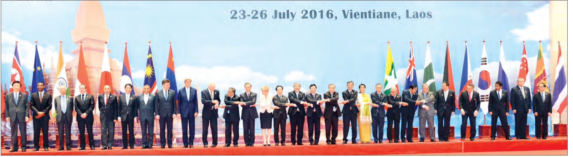
အာဆီယံနိုင်ငံခြားရေးဝန်ကြီးများအစည်းအဝေးနှင့် ဆက်စပ်အစည်းအဝေးများသို့ တက်ရောက်လာသည့် နိုင်ငံခြားရေးဝန်ကြီးများ စုပေါင်းမှတ်တမ်းတင်ဓာတ်ပုံရိုက်စဉ် (သတင်းစဉ်)