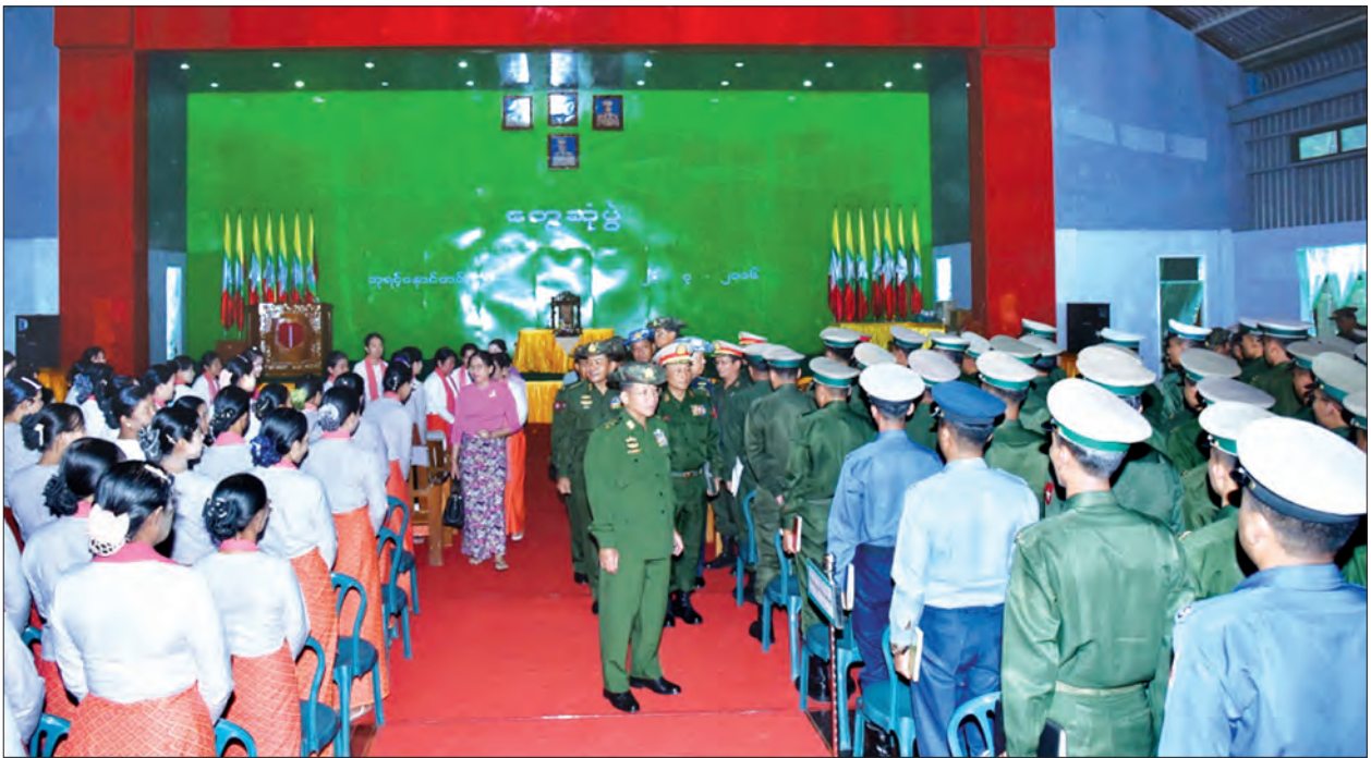
တပ်မတော်ကာကွယ်ရေးဦးစီးချုပ် ဗိုလ်ချုပ်မှူးကြီးမင်းအောင်လှိုင် သံတောင်ကြီးတပ်နယ်မှ အရာရှိ၊ စစ်သည်မိသားစုများနှင့် သင်တန်းသားများအား ရင်းရင်းနှီးနှီးနွဲ့နွဲ့ဆက်စဉ် (သတင်းစဉ်)

တွေ့ဆုံပွဲအပြီးတွင် တပ်နယ်မှ အရာရှိ၊ စစ်သည်၊ မိသားစုဝင်များအတွက် တပ်မတော်ကာကွယ်ရေးဦးစီးချုပ်က သုတရသစာအုပ်၊ စာစောင်များနှင့် စားသောက်ဖွယ်ရာများကိုလည်းကောင်း၊ တပ်မတော်ကာကွယ်ရေးဦးစီးချုပ်နှင့် ဇနီးဒေါ်ကြူကြူလှတို့က ပန်းပေါင်းစုံဘုရားဆင်းတုတော်များအားလည်းကောင်း ပေးအပ်လှူဒါန်းကြ