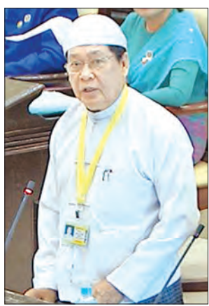
ဦးသိန်းဆွေ ပြည်ထောင်စုဝန်ကြီး

ပြည်ထောင်စုဝန်ကြီးက လက်ရှိတွင် မြန်မာနိုင်ငံမှ ပြည်ပသို့ အလုပ်သမားများ တရားဝင်စေလွှတ်နိုင်ရန် မှတ်ပုံတင်ခွင့်ပြု ထားသည့်အေဂျင်စီပေါင်း ၂၄၃ ခုရှိပြီး မြန်မာပြည်ပအလုပ်အကိုင်ဝန်ဆောင်မှု လုပ်ငန်းရှင်များအဖွဲ့ချုပ်ကိုလည်း ဖွဲ့စည်း ပေးထားပါကြောင်း၊ ပြည်ပနိုင်ငံများသို့ သွားရောက်အလုပ်လုပ်ကိုင်ကြမည့် မြန်မာ