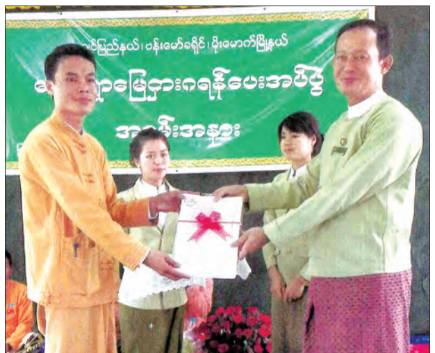
ထောက်ကျေးရွာ အုပ်စု ဖွံ့ဖြိုးရေးအဖွဲ့တွင် မြေငှားဂရန် ၉၉ ခု၊ ရွှေကျမြို့နယ် ငှက်တံတားကျေးရွာတွင် မြေငှားဂရန် ၆၃ ခုတို့ကို ပေးအပ်ခဲ့ကြောင်း သိရ သည်။ (ပြည်နယ် ပြန်/ဆက်)