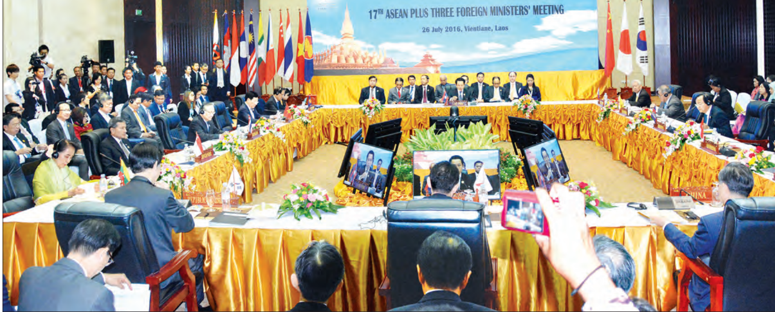
(၁၇)ကြိမ်မြောက် အာဆီယံ+၃ နိုင်ငံခြားရေးဝန်ကြီးများ အစည်းအဝေးကျင်းပစဉ် (သတင်းစဉ်)

ပိုမိုတိုးတက်စေရန် လုပ်ဆောင်သွားမည်ဟု ဝန်ကြီးများက ထပ်လောင်းပြောကြားခဲ့သည်။ ထို့ပြင် အာဆီယံဥက္ကဋ္ဌအဖြစ် ဆောင်ရွက်သော လာအိုနိုင်ငံက အဆိုပြုထားပြီး (၁၁)ကြိမ်မြောက် အရှေ့အာရှ ထိပ်သီးအစည်းအဝေးက အတည်ပြုချမှတ်မည့် အရှေ့အာရှအတွင်း အခြေခံအဆောက်အအုံ ဖွံ့ဖြိုးတိုးတက်မှု ပူးပေါင်းဆောင်ရွက်ရေးဆိုင်ရာ ဝီယံကျန်း ကြေညာချက်မူကြမ်းကို ထောက်ခံခဲ့ကြသည်။ ထို့နောက် ဝန်ကြီးများက ဒေသတွင်းနှင့် နိုင်ငံတကာရေးရာကိစ္စရပ်များအပေါ် အမြင်ချင်းဖလှယ်ခဲ့ကြသည်။