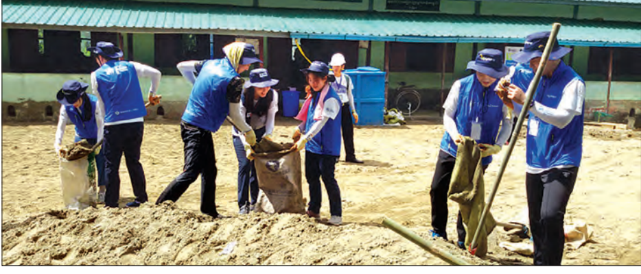
ကျောင်းမှာ လာရောက်လှူဒါန်းပေးတာဖြစ်ပါတယ်။ ရေသန့်စက်တစ်လုံးရယ်၊ ကျောင်းစာကြည့်အတွက်က အခန်းကို ပြုပြင် ပေးတယ်။ ပရိဘောဂတွေနဲ့ စာအုပ်စာတမ်းတွေကို ဖြည့်စွက်လှူဒါန်းဆောင်ရွက်ပေးခဲ့တာ ဖြစ်ပါတယ်” ဟု ကျောင်းအုပ် ဆရာမကြီး ဒေါ်တင်တင်အေးက ပြောသည်။ သတင်း-သန်းဌေး(ဒလ)

ဒလ ဇူလိုင် ၂၅ ဒလမြို့နယ် ၁၁/၁၄ ရပ်ကွက်ရှိ အမှတ် (၁) အခြေခံပညာမူလတန်းကျောင်းတွင် တောင်ကိုရီးယားနိုင်ငံ Shinhan Card Volunteers အဖွဲ့အစည်းမှ ရန်ကုန် အခြေစိုက် Habitat for Humanity အဖွဲ့ကကိုရီးယားလူငယ် ၂၀ ခန့်တို့သည် ဇူလိုင် ၂၂ ရက်က ရန်ကုန်မြို့၊ Share Mercy (မျှဝေကရုဏာ)အသင်း၏ ကူညီဆက်သွယ်ပေးမှုအရ ဒလ အမက (၁) ကျောင်းတွင် ငွေကျပ်သိန်း ၁၆၀ ကျော်ကုန်ကျခံ၍ ရေသန့်စက်၊ ကျောင်း စာကြည့်တိုက်နှင့် အားကစားကွင်းတို့ကို လာရောက် ဆောင်လုပ်လှူဒါန်း ဆောင်ရွက်ပေးကြောင်း သိရသည်။ “မျှဝေကရုဏာအသင်းရဲ့ချိတ်ဆက် ကူညီမှုနဲ့ ကိုရီးယားအဖွဲ့က ကျွန်ုပ်တို့