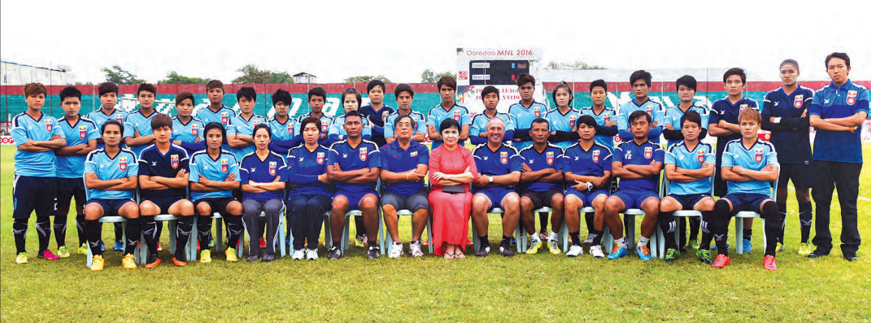
အာဆီယံအမျိုးသမီးပြိုင်ပွဲ ယှဉ်ပြိုင်မည့် မြန်မာအမျိုးသမီးအသင်းအား အုပ်ချုပ်သူ၊ နည်းပြအဖွဲ့နှင့်အတူ တွေ့ရစဉ်

ဩစတြေးလျ ယူ-၂၀ အသင်းနည်းပြချုပ်ဒန်းနစ်က “ကျွန်တော်တို့ပါတဲ့ အုပ်စုမှာ မြန်မာအသင်းနဲ့ အဓိကယှဉ်ပြိုင်ရမှာဖြစ်ပေမယ့် အခြားအသင်းတွေကို လျော့မတွက်ပါဘူး။ မြန်မာအသင်းအကြောင်း သေချာမသိပေမယ့် လေးလေးစားစား ယှဉ်ပြိုင်သွားမှာပါ” ဟု ပြောကြားခဲ့သည်။ ထိုင်းအသင်းနည်းပြချုပ် ဂျက်စတင်ပီရာက “ပြိုင်ပွဲမှာ အကောင်းဆုံးယှဉ်ပြိုင်နိုင်အောင် ပြင်ဆင်ထားပါတယ်။ ပြိုင်ပွဲစတင်ခင်မှာ မြန်မာအသင်းနဲ့ ခြေစမ်းကစားခဲ့တဲ့ ပွဲထွက်လူစာရင်းကတော့ အပြောင်းအလဲရှိမှာဖြစ်ပြီး ကစားကွက်လည်း ပြောင်းလဲဖို့ရှိပါတယ်” ဟု ပြောကြားခဲ့သည်။ ဝီယက်နမ်အသင်းနည်းပြချုပ် မိုင်ဒူချန်က “ချန်ပီယံဆုလေးရယူနိုင်ဖို့ ကြိုးပမ်းနေပါတယ်။ ဝီယက်နမ်ပရိသတ်တွေအတွက် အောင်မြင်မှုရယူပေးလိုပါတယ်” ဟု ပြောကြားခဲ့သည်။ ပြိုင်ပွဲဝင်အသင်းများအနက် တီမောအသင်းသည် လေယာဉ်လက်မှတ်အခက်အခဲကြောင့် ရောက်ရှိလာခြင်းမရှိသေးဘဲ ဇူလိုင် ၂၆ ရက်အထိ စောင့်ကြည့်သွားမည်ဖြစ်ကာ ပြိုင်ပွဲဝင်ခွင့်ပြု မပြုကို အာဆီယံဘောလုံးအဖွဲ့ချုပ်က ဆုံးဖြတ်သွားမည်ဖြစ်သည်။ အာဆီယံအမျိုးသမီးပြိုင်ပွဲကို ဇူလိုင် ၂၆ ရက်မှ စတင်ကာ မန္တလေးမြို့ရှိ မန္တလေးသီရိကွင်း၌ ကျင်းပမည်ဖြစ်သည်။ အုပ်စုအဖွဲ့ပွဲအဖြစ် ညနေ ၃ နာရီတွင် လက်ရှိချန်ပီယံ ထိုင်းအသင်းနှင့် ဖိလစ်ပိုင်အသင်း၊ ညနေ ၆ နာရီတွင် ဝီယက်နမ်အသင်းနှင့် စင်ကာပူအသင်းတို့ ယှဉ်ပြိုင်ကစားမည်ဖြစ်သည်။ ကွင်းဝင်ကြေးအဖြစ် အထူးတန်း ငွေကျပ် ၃၀၀၀၊ ရိုးရိုးတန်း ငွေကျပ် ၁၀၀၀ သတ်မှတ်ထားသည်။ သတင်း- ညိုမြတ်သော်၊ ဓာတ်ပုံ- ဦးသော်ဇင်