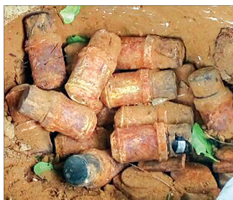
မရှိဖို့ ပြောထားရတယ်။ နောက်ထပ် ဗုံးသီးတွေ ကျောင်း ကျောင်းထိုင်ဆရာတော်က မိန့်သည်။ ဒီနေရာတစ်ဝိုက်ရှိနိုင်သေးတယ်”ဟု သရက် (၀၇၇)

အဆိုပါတွေ့ရှိသည့် စစ်အတွင်းက ဗုံးသီးအဟောင်းများဖြစ်နိုင်ကြောင်း အတည်ပြုနိုင်ရန် နယ်မြေခံတပ်မှ ဗိုလ်ကြီးအကာဦးစီးအဖွဲ့က စစ်ဆေးရာ ဗုံးသီးအမျိုးအစား NO-77 MK 1 မီးခိုးလက်ပစ်ဗုံးဖြစ်ကြောင်း သိရသည်။ “ဘုန်းကြီး ၁၀ ပါလောက်က ဒီနေရာတစ်ဝိုက်မှာ ဗုံးသီးအဟောင်းတွေ ထန်းခေါက်တောင်းတစ်လုံးစာလောက် မြေကြီးထဲကရလို သက်ဆိုင်ရာ ရဲစခန်းကို ပေးခဲ့တယ်။ ဘုန်းဘုန်းကျောင်းမြောက်ဘက်ထဲ ကျည်ဆန်အဟောင်းတွေ ခဏခဏရလို ကိုရင်တွေ ဦးစင်းတွေ အမှိုက်မီး