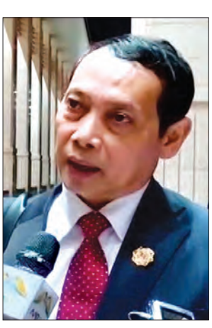
အမြဲတမ်းအတွင်းဝန် ဦးအောင်လင်း

ပြောလာပါတယ်။ ဒီနေ့မနက်မှာတော့ အာဆီယံ နိုင်ငံခြားရေးဝန်ကြီးများ မျက်နှာစုံညီ အစည်းအဝေးပြုလုပ်ခဲ့ပါတယ်။ မွန်းလွဲ ပိုင်းမှာတော့ သီးသန့်အစည်းအဝေး ပြုလုပ်ခဲ့ပါတယ်။ ကျွန်တော်တို့ရဲ့ ပြည်ထောင်စုဝန်ကြီးအနေနဲ့ အာဆီယံ အစည်းအဝေးကိုတက်တဲ့အထဲမှာ သူ့ရဲ့ ပထမဦးဆုံး အစည်းအဝေးဖြစ်ပါတယ်။ အဲဒီအတွက်ကြောင့် အာဆီယံရဲ့ အနာဂတ်ကို သူ့ဘယ်လိုမြင်တယ် ဆိုတာကို အဓိကထားပြီး ပြောသွား ပါတယ်။ အာဆီယံအနေနဲ့ အားလုံးစည်းလုံး ညီညွတ်ဖို့ လိုအပ်တယ်။ စည်းလုံးညီညွတ် မှသာ အာဆီယံရဲ့ပုံရိပ်ဟာ ကမ္ဘာ့နိုင်ငံ တွေနဲ့ဆက်ဆံတဲ့အခါမှာ လေးစားမှုကို ခံယူရရှိမှာဖြစ်တယ်။ ခံယူနိုင်မယ်ဆို တာကို အလေးထားပြောသွားပါတယ်။ ဒီနေ့အစည်းအဝေးမှာ မြန်မာနိုင်ငံဟာ အာဆီယံနိုင်ငံရဲ့ အဖွဲ့ဝင်နိုင်ငံ ဖြစ်တဲ့