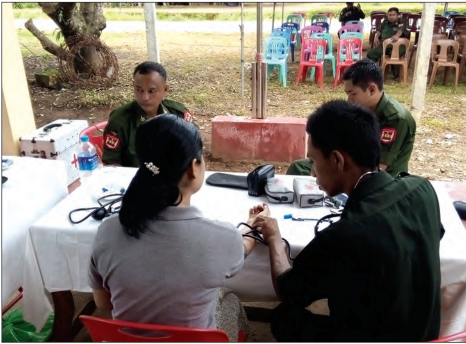
တပ်မတော် နယ်လှည့်ဆေးကုအဖွဲ့ အနေဖြင့် ပြည်ခြားကျေးရွာ အုပ်ချုပ်ရေးမှူးရုံး၌ နှစ်ရက်ကြာ ကျန်းမာရေးစောင့်ရှောက်မှုများ ဆောင်ရွက်ပေးပြီးနောက် ပလောက်မြို့ ကျောက်လုံးကြီးကျေးရွာအုပ်စုအတွင်းမှ ဒေသခံပြည်သူများကိုလည်း ကျောင်တောင်ကျေးရွာဘုန်းကြီးကျောင်း၌ အခြေပြု၍ ဆေးကုသမှုများ ဆက်လက်ဆောင်ရွက်ပေးသွားမည်ဖြစ်ကြောင်း နယ်လှည့်ဆေးကုအဖွဲ့ တာဝန်ရှိသူတစ်ဦးထံမှ သိရသည်။ (မြို့နယ် ပြန်/ဆက်)

ပလောက် ဇူလိုင် ၂၅ တနင်္သာရီတိုင်းဒေသကြီး၊ မြိတ်ခရိုင် ပလောက်မြို့ပြည်နယ်ကျေးရွာမှ ဒေသခံ ပြည်သူများအား ကျန်းမာရေးစစ်ဆေးခြင်းနှင့် အခမဲ့ကျန်းမာရေးစောင့်ရှောက်မှုများကို မြိတ်မြို့ အမှတ်(၅/၁၀၀) တပ်မတော်ဆေးရုံရှိ တပ်မတော် နယ်လှည့်ဆေးကုအဖွဲ့က ဇူလိုင် ၂၂ ရက်မှ ၂၃ ရက်အထိ ဆောင်ရွက်ပေးခဲ့ကြောင်း သိရသည်။