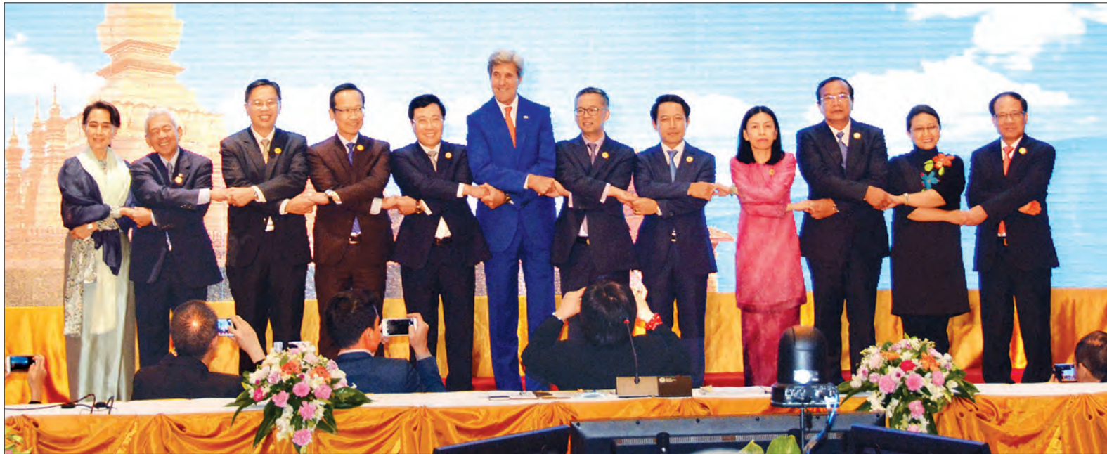
ပြည်ထောင်စုဝန်ကြီး ဒေါ်အောင်ဆန်းစုကြည် အာဆီယံ-တရုတ် ဝန်ကြီးအဆင့် အစည်းအဝေးသို့ တက်ရောက်စဉ် (သတင်းစဉ်)