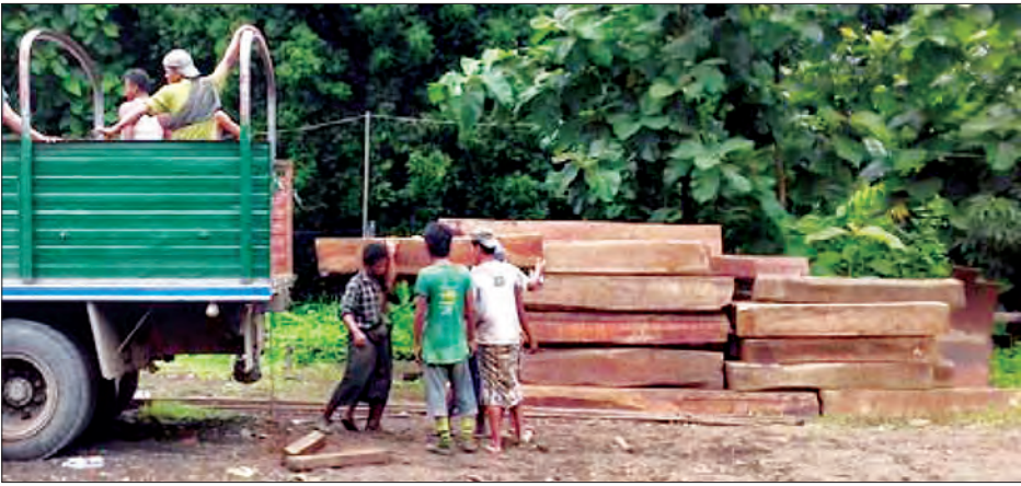
သိမ်းဆည်းရမိခဲ့သည်။ (အပေါ်ပုံ) လာသူများအား သစ်တောဦးစီးဌာန လျက်ရှိကြောင်း သိရသည်။ (အောက်ပုံ) တရားမဝင်သစ်များ သယ်ဆောင် က အရေးယူနိုင်ရန် စီစဉ်ဆောင်ရွက် (မြို့နယ် ပြန်/ဆက်)

ပန်းတောင်း ဇူလိုင် ၂၅ ပဲခူးတိုင်းဒေသကြီး ပြည်ခရိုင် ပန်းတောင်းမြို့နယ်၌ မြို့နယ်သစ်တော ဦးစီးဌာန ဦးစီးမှူးနှင့် ဝန်ထမ်းများသည် ပန်းတောင်းမြို့နယ်အတွင်း တရားမဝင် သစ်များကို ရှာဖွေဖမ်းဆီးလျက်ရှိရာ ဇူလိုင် ၂၅ ရက် နံနက် ၄ နာရီခွဲက ပုသိမ်- မုံရွာလမ်း မြေဝါကျန်းကျေးရွာအနီး မိုင်တိုင်အမှတ် (၁၆၇/၆)တွင် ၁၂ ဘီး ယာဉ်တစ်စီးအား သတင်းအရ လိုက်လံ ဖမ်းဆီးရာ ယာဉ်ကိုရပ်၍ ယာဉ်မောင်းနှင့် ယာဉ်နောက်လိုက်မှာ ထွက်ပြေးသွားပြီး အဆိုပါ ၁၂ ဘီးယာဉ်အား ရှာဖွေစစ်ဆေး ရာ တရားမဝင် ပိတောက်တုံး ၁၁၀ (၁၀ တန်ကျော်ခန့်)ကို ပိုင်ရှင်မဲ့