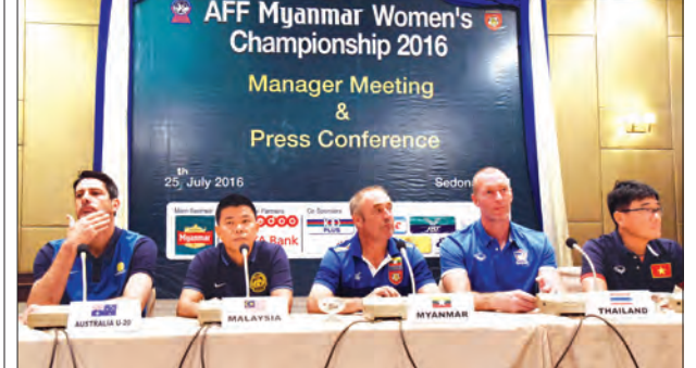
ပွဲကြိုသတင်းစာရှင်းလင်းပွဲတက်ရောက်ခဲ့သည့် နည်းပြချုပ်များအား တွေ့ရစဉ်

ဇူလိုင် ၃၀ ရက်တွင် ဩစတြေးလျ ယူ-၂၀ အသင်းတို့နှင့် ကစားရမည်ဖြစ်သည်။ မြန်မာအမျိုးသမီးဘောလုံးအသင်းသည် ပြိုင်ပွဲတွင်မီ တောင်ကိုရီးယားလက်ရွေးစင်၊ ထိုင်းလက်ရွေးစင်အသင်းအပါအဝင် ဂျပန်ကလပ်အသင်းများနှင့် ခြေစမ်းပွဲရရှိဖို့ ယှဉ်ပြိုင်ကစားထားသည်။ သတင်း-ရဲရင့်ရှိုင်း