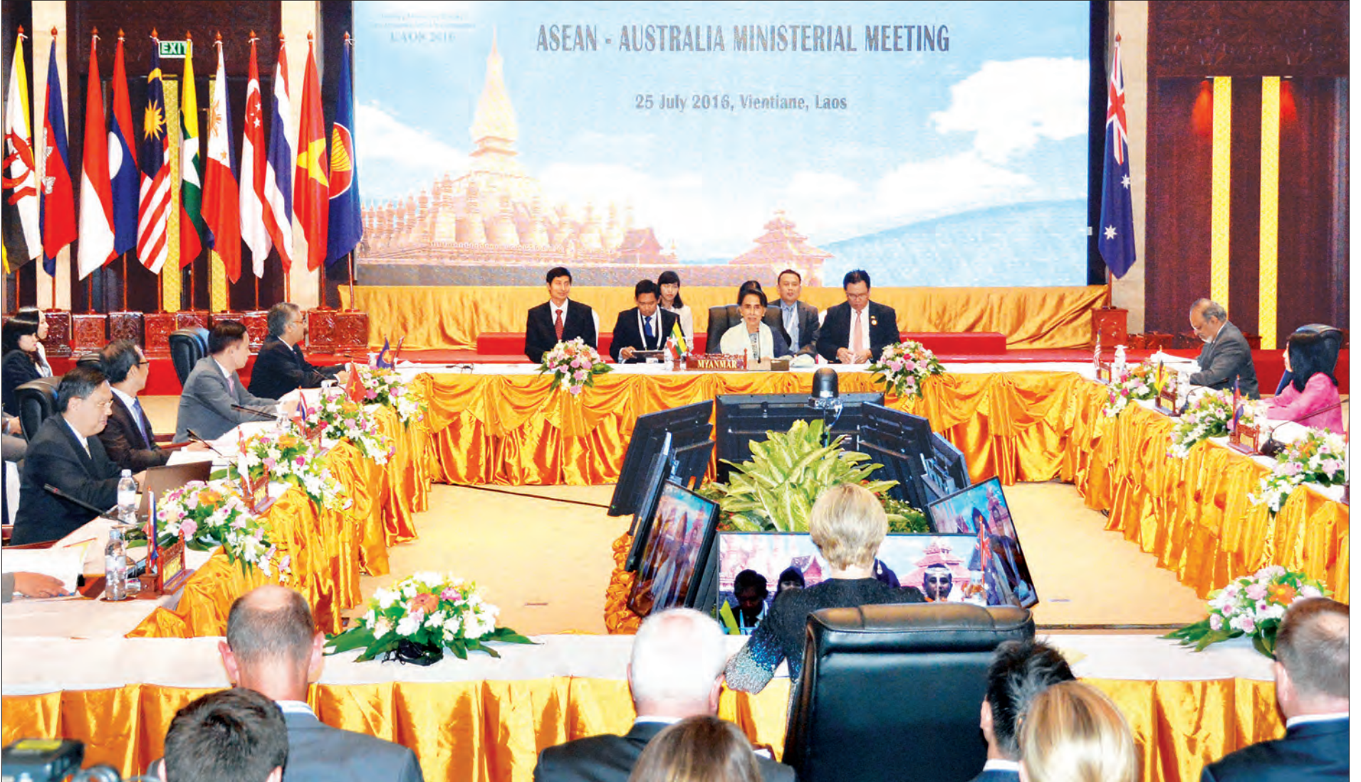
ပြည်ထောင်စုဝန်ကြီး ဒေါ်အောင်ဆန်းစုကြည် အာဆီယံ- လွှဲစကြေးလျှ ဝန်ကြီးအဆင့်အစည်းအဝေးတွင် ပူးတွဲသဘာပတိအဖြစ် ဆောင်ရွက်စဉ် (သတင်းစဉ်)