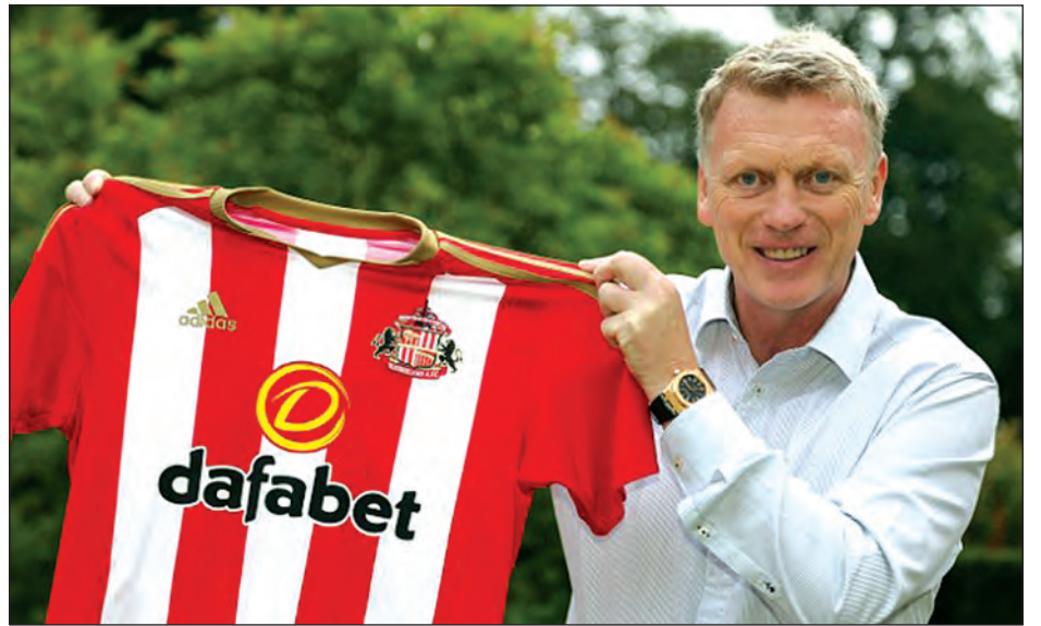
တဲ့ နည်းပြတစ်ဦးလည်း ဖြစ်ပါတယ်။ အသင်းကို အကောင်းဆုံးအနေအထား မယ်လို့ မျှော်လင့်ပါတယ်” လို့ မိုယာကီစ် “ကျွန်တော့်အနေနဲ့ လာမယ့်ရာသီမှာ တစ်ရပ်ကိုရောက်အောင် လုပ်ပေးနိုင် က ဆိုပါတယ်။