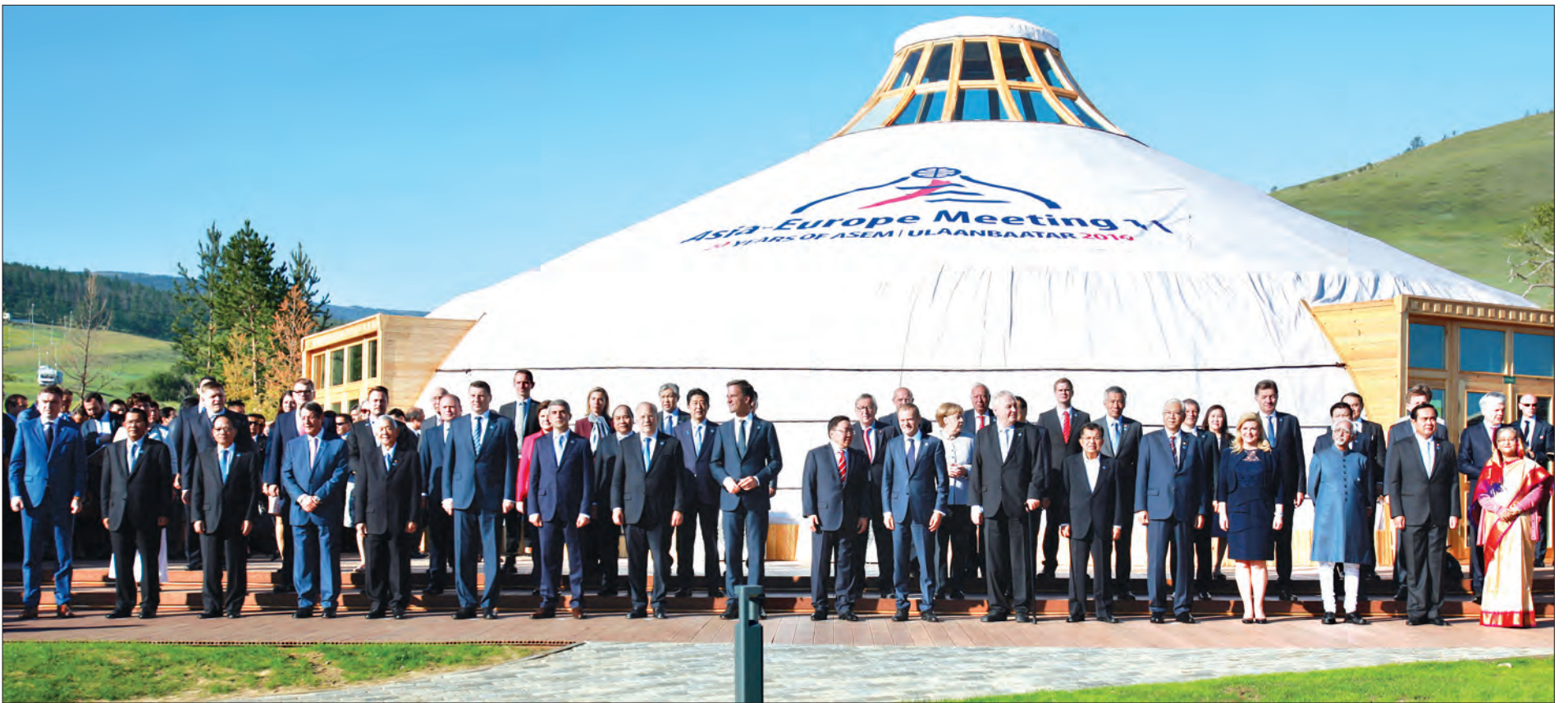
နိုင်ငံတော်သမ္မတ ဦးထင်ကျော် အာရှ-ဥရောပနိုင်ငံများမှ ခေါင်းဆောင်များနှင့်အတူ အေဆမ်ဗီလာရှိ မွန်ဂိုလီးယား ချွန်ဂိုရီးရာ ရွက်ထည်တဲရေ၌ စုပေါင်းမှတ်တမ်းတင်ဓာတ်ပုံရိုက်စဉ် (သတင်းစဉ်)