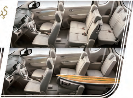
မြန်မာနိုင်ငံအတွက် မြန်မာနိုင်ငံအစုအဝေးအတွက်