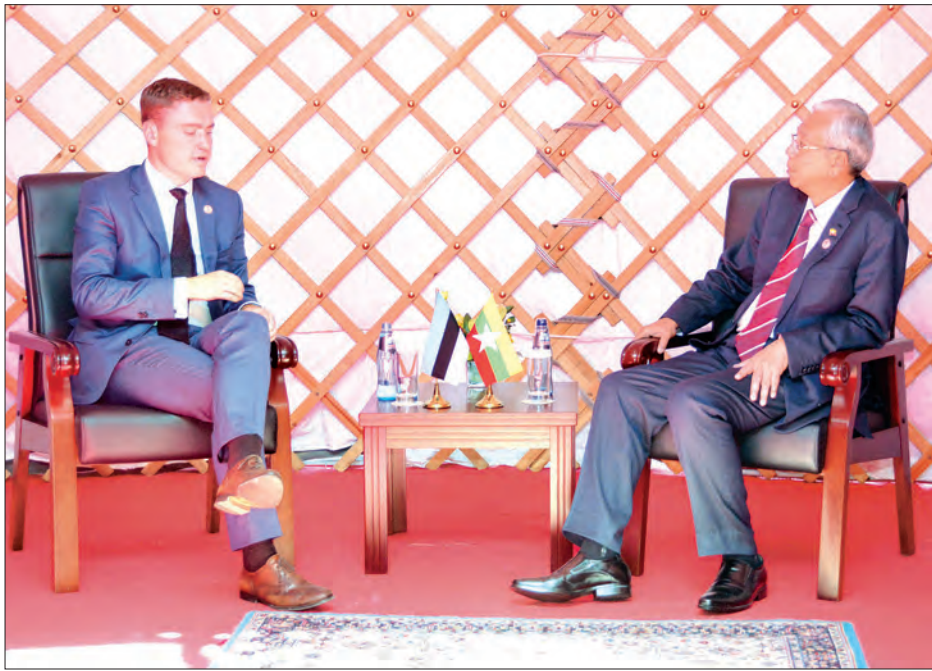
နိုင်ငံတော်သမ္မတ ဦးထင်ကျော်နှင့် အက်စတိုးနီးယားနိုင်ငံ ဝန်ကြီးချုပ် တဲဗီ ရိုအိဗက်စ်တို့ တွေ့ဆုံဆွေးနွေးစဉ် (အပေါ်ပုံ)နှင့် နိုင်ငံတော်သမ္မတ ဦးထင်ကျော်နှင့် ဖင်လန်နိုင်ငံဝန်ကြီးချုပ် ယူဟာ စီပီလာတို့ ရင်းနှီးနှီးဆက်ဆံစဉ် (ယာဝုံ)