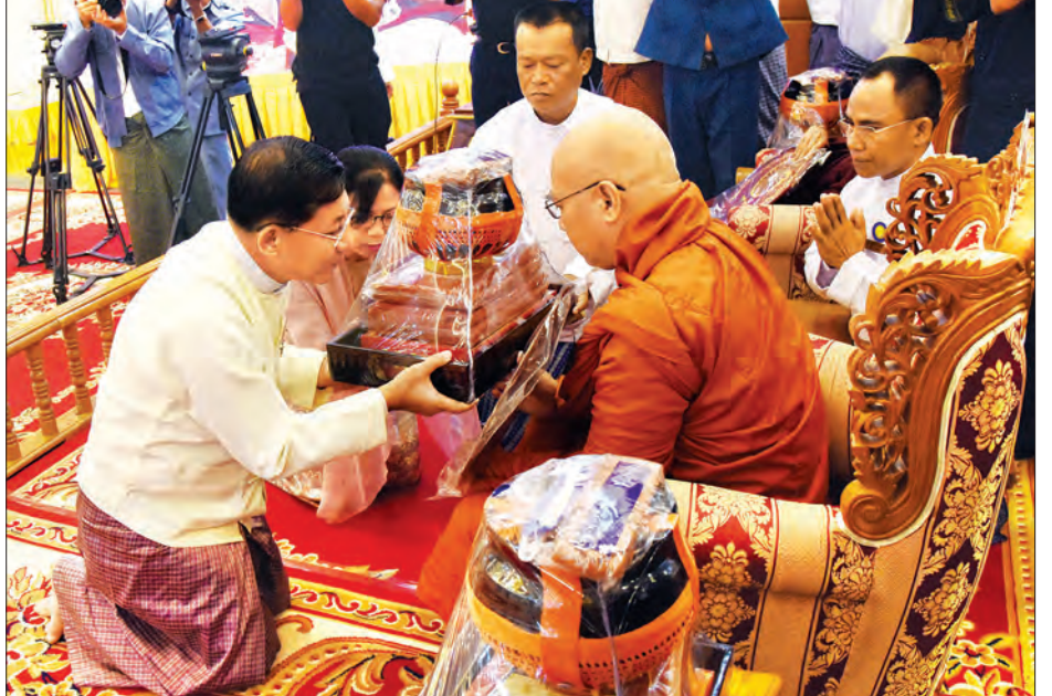
တပ်မတော်ကာကွယ်ရေးဦးစီးချုပ် ဗိုလ်ချုပ်မှူးကြီး မင်းအောင်လှိုင်နှင့် ဇနီး ဒေါ်ကြူကြူလှတို့ နိုင်ငံတော်သံဃမဟာနာယကအဖွဲ့ ဒုတိယဥက္ကဋ္ဌ လှိုင်လင်ဆရာတော်ထံ ဝါဆိုသင်္ကန်းနှင့် လှူဖွယ်ပစ္စည်းများ ဆက်ကပ်လှူဒါန်းစဉ်