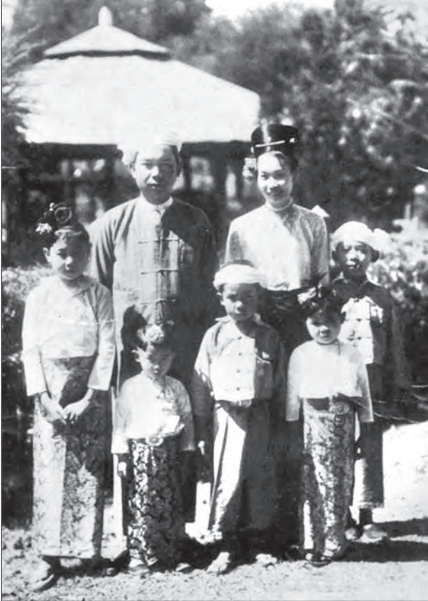
အာဇာနည်ခေါင်းဆောင် မိုင်းပွန်စော်ဘွားကြီး စစ်စံထွန်းနှင့် ဇနီး မဟာဒေဝီသီရိစန္ဒြာ စစ်ခင်သောင်းနှင့် သားသမီးများ မှတ်တမ်းဓာတ်ပုံ

“ရန်ကုန် ဝင်ဒါမီယာမှာနေပြီး ဦးကြီးစစ်ဝန်ချိုက ကျောင်းထားပေးတယ်။ အင်းစိန် တိုက်ပွဲဖြစ်တော့ လုံခြုံရေးအရဆိုပြီး သမ္မတကြီး စစ်ရွှေသိုက်ရဲ့ သမ္မတအိမ်တော်မှာ နေရတယ်။ အစ်ကိုက နိုင်ငံခြားရောက်နေတယ်။ သမ္မတကြီးရဲ့အိမ်မှာ နေပြီးနောက်ပိုင်း အိန္ဒိယမှာ ကျောင်းသွားတက်ခဲ့တယ်။ အိန္ဒိယက ပြန်လာပြီး တောင်ကြီးမှာ ဖေဖေတက်ခဲ့တဲ့ ရှမ်းစော်ဘွားများကျောင်းမှာတက်တယ်။ အဲဒီကနေ အစ်ကိုရယ်၊ ကျွန်တော်ရယ် ဆယ်တန်းအောင်ပြီး ရန်ကုန်တက္ကသိုလ်တက်ခဲ့တယ်။