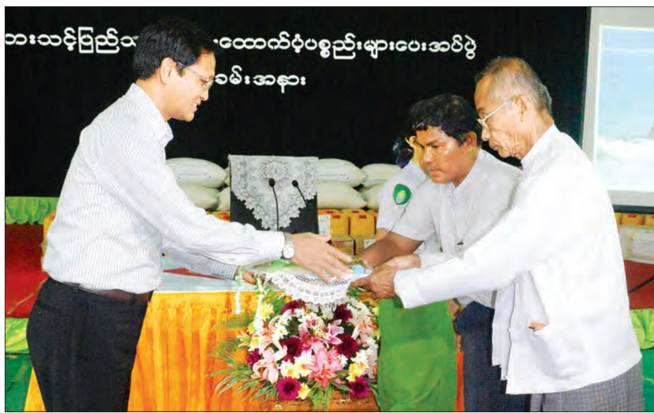
ထိုနောက် ဒုတိယသမ္မတ၊ ပြည်ထောင်စုဝန်ကြီး၊ ပြည်နယ်ဝန်ကြီးချုပ်၊ ဒုတိယဝန်ကြီးများနှင့် တာဝန်ရှိသူများက ရေဘေးသင့်ပြည်သူများအတွက် စားသောက်ဖွယ်ရာများနှင့် ထောက်ပံ့ပစ္စည်းများကို တာဝန်ရှိသူများထံပေးအပ်ကြသည်။

ယင်းနောက် အမ်းမြို့နယ်အုပ်ချုပ်ရေးမှူးနှင့် သံတွဲခရိုင်အုပ်ချုပ်ရေးမှူးတို့က အမ်းမြို့နယ်နှင့် သံတွဲခရိုင်အတွင်း ရေကြီးရေလျှံ ဖြစ်ပွားခဲ့မှု၊ ကယ်ဆယ်ရေးလုပ်ငန်းများ ဆောင်ရွက်ထားမှုနှင့် ဒေသဖွံ့ဖြိုးရေးလိုအပ်ချက်များကို ရှင်းလင်းတင်ပြကြသည်။