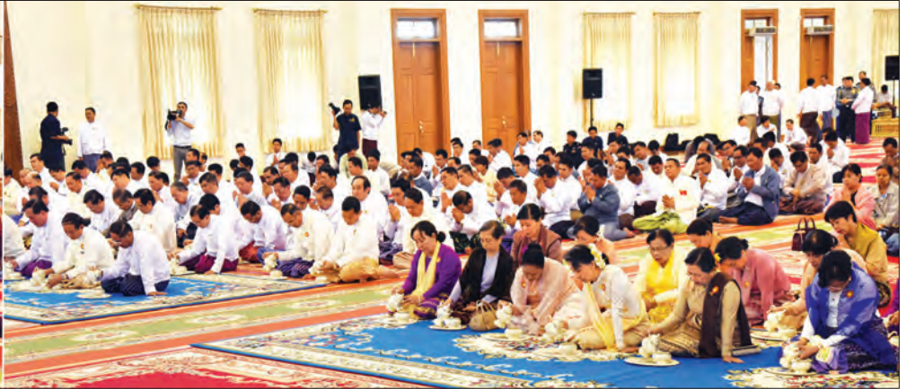
နိုင်ငံတော်သံဃမဟာနာယကအဖွဲ့ အကျိုးတော်ဆောင် သန်လျင်မင်းကျောင်း ပထမပြန်စာသင်တိုက် ပဓာနနာယကဆရာတော်ထံမှ အနုမောဒနာတရားနာယူကြပြီး ရေစက်သွန်း၍ အမျှပေးဝေကြစဉ်

ကျောစုံမှ ပြည်သူ့လွှတ်တော်ဥက္ကဋ္ဌ ဦးဝင်းမြင့်နှင့် ဇနီး ဒေါ်ချိုချိုတို့က နိုင်ငံတော်သံဃမဟာနာယကအဖွဲ့ ဒုတိယဥက္ကဋ္ဌ ဆင်ဖြူကျွန်းဆရာတော် ဘဒ္ဒန္တဏီကာဘိဝံသ လည်းကောင်း၊ အမျိုးသားလွှတ်တော်ဥက္ကဋ္ဌ၏ ဇနီး ဒေါ်နန်းကြင်ကြည်က နိုင်ငံတော်သံဃမဟာနာယကအဖွဲ့ ဒုတိယဥက္ကဋ္ဌ ဆင်မင်းဆရာတော် ဘဒ္ဒန္တဩဘာသာဘိဝံသ ထံလည်းကောင်း၊ ပြည်ထောင်စုတရားသူကြီးချုပ် ဦးထွန်းထွန်းဦးက နိုင်ငံတော် သံဃမဟာနာယကအဖွဲ့ ဒုတိယဥက္ကဋ္ဌ ရေဦးဆရာတော် ဘဒ္ဒန္တဥက္ကမ္မဏာဘိဝံသထံ လည်းကောင်း၊ တပ်မတော် ကာကွယ်ရေးဦးစီးချုပ် ဗိုလ်ချုပ်မှူးကြီး မင်းအောင်လှိုင်နှင့်ဇနီး ဒေါ်ကြူကြူလှတို့က နိုင်ငံတော်သံဃမဟာနာယကအဖွဲ့ ဒုတိယဥက္ကဋ္ဌ လှိုင်လင်ဆရာတော် ဘဒ္ဒန္တပညာနန္ဒထံလည်းကောင်း၊ နိုင်ငံတော်ဖွဲ့စည်းပုံအခြေခံဥပဒေဆိုင်ရာ ရုံးဥက္ကဋ္ဌ ဦးမျိုးညွန့်နှင့်ဇနီး ဒေါ်ဌေးရီတို့က နိုင်ငံတော် သံဃမဟာနာယကအဖွဲ့ တွဲဖက်အကျိုးတော်ဆောင် ရေတာရှည်