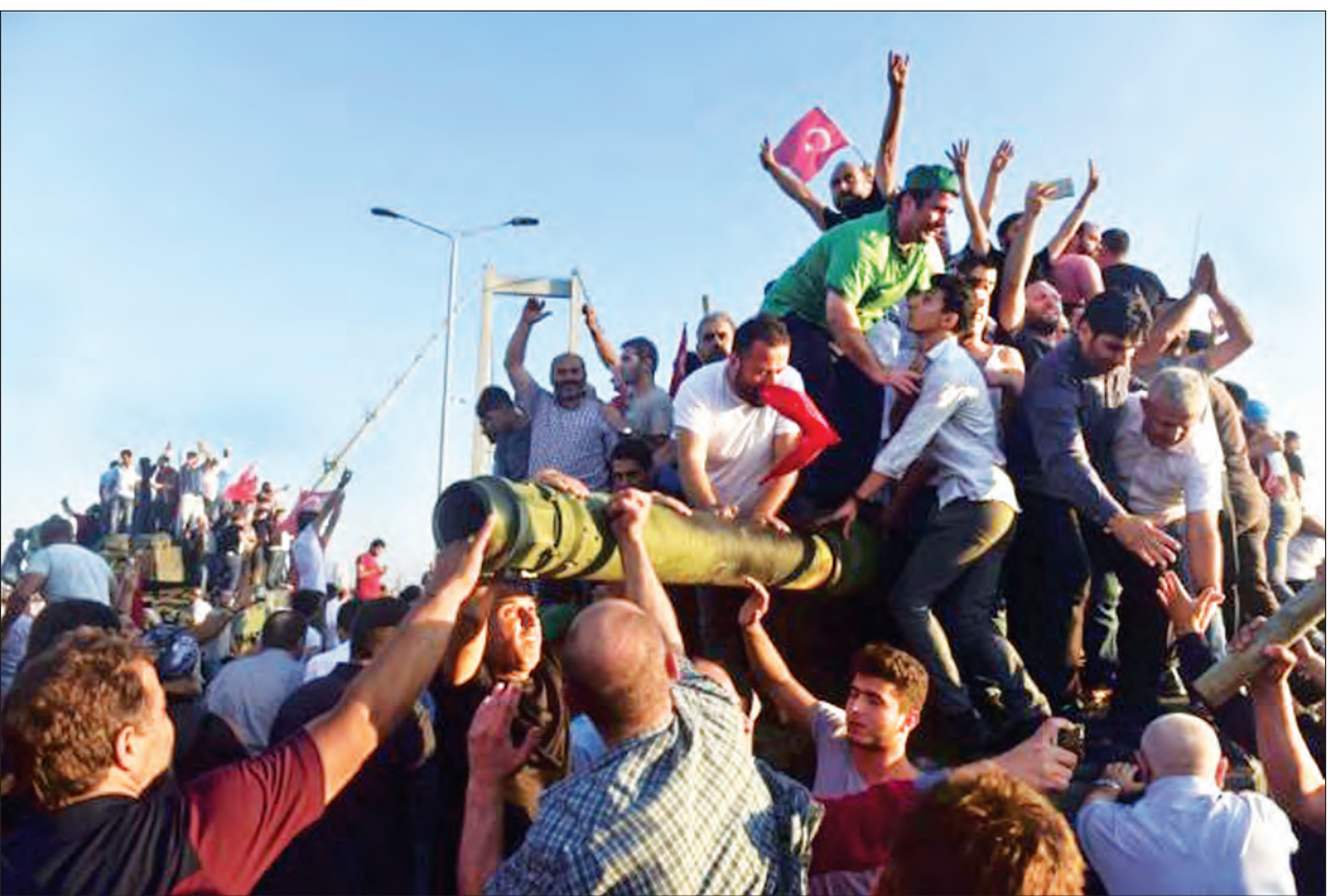
သူတို့တွေ ဝမ်းသာကြတော့တာပဲ။ သူတို့တွေထင်ပုံရတယ်”ဟု အာဒိုဂန်က ကျွန်တော် အိမ်မှာ ရိုသေသောတယ်လို့ ပြောခဲ့သည်။ အာဏာသိမ်းမှုကြောင့် သေဆုံးသူ ဦးရေမှာ ၁၆၀ ဦးအထိ ရှိသွားပြီဖြစ်ကြောင်း သိရပြီး ၁၀၅၄ (ရိုက်တာ)

လက်နက်ကိုင်တပ်ဖွဲ့ဝင် ၁၅၀၀ ကျော်ကို ဖမ်းဆီးထိန်းသိမ်းပြီးဖြစ်ကြောင်း သက်ဆိုင်ရာတာဝန်ရှိသူများက ပြောသည်။ သူပုန်များ ဖမ်းဆီးခံထားရသော ကာကွယ်ရေးဦးစီးချုပ် ဟူလူစီအာကာကိုလည်း သူပုန်များလက်မှပြန်လည်ကယ်တင်နိုင်ခဲ့ကြောင်း အာဏာပိုင်တစ်ဦးက ပြောသည်။ တူရကီကို ၂၀၀၃ ခုနှစ်ကတည်းက အုပ်ချုပ်ခဲ့သော အာဒိုဂန်သည် ဆူပူအုံကြွမှုကို ကောင်းမွန်စွာ ထိန်းသိမ်းနိုင်ခဲ့သော်လည်း ယင်းဂယက်ရိုက်မှုသည် နေတိုးအဖွဲ့ဝင်များနှင့် ဆီးရီးယားနိုင်ငံတစ်ဝန်း ပျံ့နှံ့သွားခဲ့ကြောင်း သိရသည်။ အာဏာသိမ်းမှု ဖြစ်ပေါ်စဉ်အတွင်း အာဒိုဂန်သည် အနောက်တောင်ကမ်းရိုးတန်းသို့ အားလပ်ရက်ခရီးထွက်နေကြောင်း သိရသည်။ အာဏာသိမ်းခြင်းကိုသိသိချင်း အစွတန်ဘူလ်သို့ လေယာဉ်ဖြင့်ရောက်ရှိလာပြီး လေဆိပ်တွင် အလံများတော်ထင်မြင်သော ထောက်ခံသူများကို အစိုးရအနေဖြင့် ဆူပူအုံကြွမှုအခြေအနေကို ထိန်းသိမ်းနိုင်သော်လည်း အန်ကာရာတွင် အနောင်အယုက်များ ဆက်လက်ကျန်ရှိနေသေးကြောင်း အာဒိုဂန်က ပြောကြားခဲ့သည်။ “ကျွန်တော် ထွက်သွားတာနဲ့