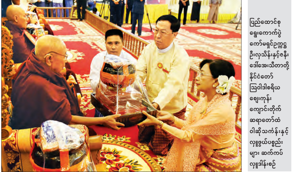
ပြည်ထောင်စုရွေးကောက်ပွဲကော်မရှင်ဥက္ကဋ္ဌ ဦးလှသိန်းနှင့်ဇနီး ဒေါ်အေးသီတာတို့ နိုင်ငံတော် ဩဝါဒါစရိယ ဈေးကုန်းကျောင်းတိုက်ဆရာတော်ထံ ဝါဆိုသင်္ကန်းနှင့် လှူဖွယ်ပစ္စည်းများ ဆက်ကပ်လှူဒါန်းစဉ်