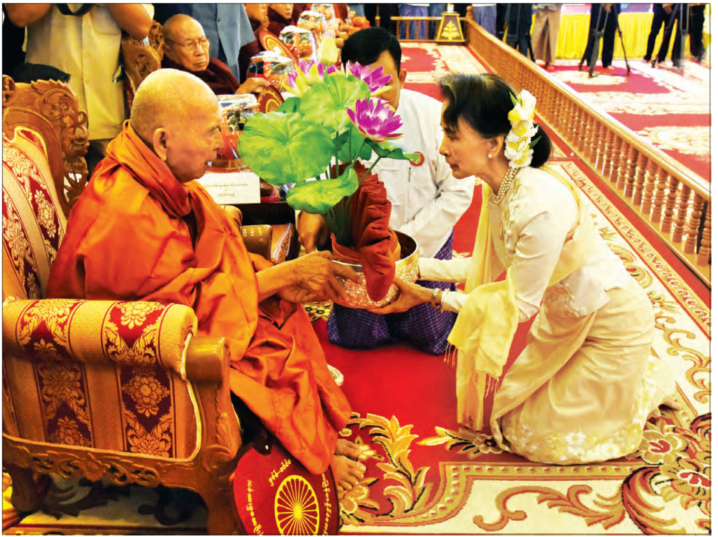
နိုင်ငံတော်၏အတိုင်ပင်ခံပုဂ္ဂိုလ် ဒေါ်အောင်ဆန်းစုကြည် မန္တလေးမြို့ ဗန်းမော်ကျောင်းတိုက်ဆရာတော်ထံ ဝါဆိုသင်္ကန်းဆက်ကပ်လှူဒါန်းစဉ် (သတင်းစဉ်)