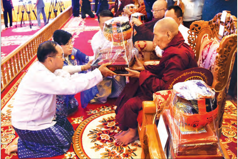
ဒုတိယသမ္မတ ဦးမြင့်ဆွေနှင့် ဇနီး ဒေါ်ခင်သက်ဌေးတို့ နိုင်ငံတော်သံဃမဟာနာယကအဖွဲ့ ဒုတိယဥက္ကဋ္ဌ ကုန်းသာဆရာတော်ထံ ဝါဆိုသင်္ကန်းနှင့် လှူဖွယ်ပစ္စည်းများ ဆက်ကပ်လှူဒါန်းစဉ်

ဓမ္မရောင်ခြည်ဆရာတော် ဘဒ္ဒန္တအဂ္ဂဓမ္မထံလည်းကောင်း၊ ဥပဒေရေးရာနှင့် အထူးကိစ္စရပ်များ လေ့လာဆန်းစစ်ရေးကော်မရှင်ဥက္ကဋ္ဌ သူရဦးရွှေမန်းနှင့် ဇနီးတို့က နိုင်ငံတော် သံဃမဟာနာယကအဖွဲ့ တွဲဖက်အကျိုးတော်ဆောင် ဝါးတန်းဆရာတော် ဘဒ္ဒန္တသီလာစာရာဘိဝံသထံ လည်းကောင်း၊ ပြည်ထောင်စုဝန်ကြီးများနှင့် ဇနီးများနှင့် တာဝန်ရှိသူများက နိုင်ငံတော် သံဃမဟာနာယကအဖွဲ့ အဖွဲ့ဝင်ဆရာတော်ကြီးများ၊ တိပိဋကဆရာတော်ကြီးများနှင့် ဒေသခံဆရာတော်ကြီးများထံလည်းကောင်း ဝါဆိုသင်္ကန်းနှင့် လှူဖွယ်ပစ္စည်းများ ဆက်ကပ်လှူဒါန်းကြသည်။ ထို့နောက် နိုင်ငံတော်သံဃမဟာနာယကအဖွဲ့ အကျိုးတော်ဆောင် သန်လျင် မင်းကျောင်းပထမပြန်စာသင်တိုက် ပဓာနနာယကဆရာတော် အဂ္ဂမဟာပဏ္ဍိတ ဘဒ္ဒန္တဓိမာဘိဝံသထံမှ အနုမောဒနာတရားနာယူကြပြီး ရေစက်သွန်း၍ အမျှပေးဝေကြသည်။ အခမ်းအနားအပြီးတွင် နိုင်ငံတော်၏အတိုင်ပင်ခံပုဂ္ဂိုလ်နှင့် ဧည့်ပရိသတ်များသည် ဆရာတော်၊ သံဃာတော်များအား နေဆွမ်းဆက်ကပ်လှူဒါန်းကြသည်။ (သတင်းစဉ်)