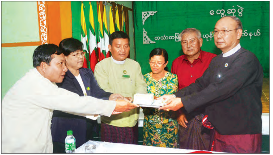
ပြည်ထောင်စုလွှတ်တော်နာယက အမျိုးသားလွှတ်တော်ဥက္ကဋ္ဌ မန်းဝင်းခိုင်သန်း ယုန်သလင်းအခြေခံပညာ အထက်တန်း ကျောင်းအတွက် အလှူငွေပေးအပ်စဉ်

အမှန်တကယ်နှစ်နာမှုများကို မိမိတံ တိုက်ရိုက် တိုင်ကြားနိုင်ပါကြောင်း၊ တိုင်ကြားရာတွင် တိုင်ကြားချက်များ သည် တိကျမှန်ကန်ရန် လိုအပ်ကြောင်း ပြည်ထောင်စုလွှတ်တော် နာယက က ဆက်လက်ပြောကြားသည်။ ထို့ပြင် ပြည်ထောင်စုလွှတ်တော် နာယက က လွှတ်တော်ကိုယ်စားလှယ် များသည် ပြည်သူ့ကဏ္ဍမှ ချွမ်းသာတင်မြှောက် ထားသည့် ပြည်သူ့ကိုယ်စားလှယ်များ ဖြစ်ပြီး အဓိကတာဝန်မှာ ဥပဒေပြုရေး တာဝန်ပင်ဖြစ်ပါကြောင်း၊ အုပ်ချုပ်ရေး ပိုင်းတွင် ဝင်ရောက်စွက်ဖက်ခြင်း မပြု စေလိုကြောင်း၊ ပြည်သူ့အကျိုးစီးပွား အတွက် ညှိနှိုင်းပူးပေါင်းဆောင်ရွက် ကြရမည်ဖြစ်ကြောင်း၊ ပြောင်းလဲနေသည့် ခေတ်စနစ်နှင့်အညီ ပြည်သူ့ဝန်ထမ်း များသည်လည်း ပြုပြင်ပြောင်းလဲကြရမည်