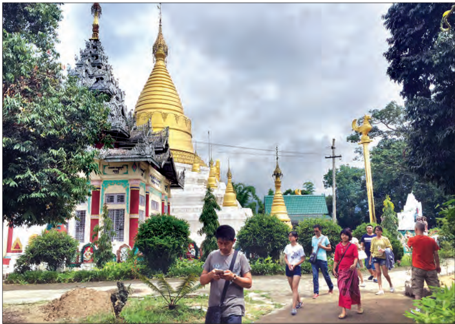
ရောက်လည်ပတ်သူများရှိနေကြသည်။ အထူးသဖြင့် မြို့အဝင်နားရှိ အလောင်း စည်သူမင်းလက်ထက်က တည်ထားကိုးကွယ်ခဲ့သော မန့်ခမ်းစေတီတော်နှင့် မြို့လယ်ရှိ မြို့လယ်မဟာမုနိဘုရားကြီးတို့မှာ ပျက်စီးထိခိုက်မှုမရှိ၍ စိတ်ဝင်စားမှုပိုများကာ နေ့စဉ်လာရောက်လည်ပတ်မှုများရှိနေကြကြောင်း သိရသည်။

နမ့်ခမ်း ဇူလိုင် ၁၀ ရှမ်းပြည်နယ် မြောက်ပိုင်း မူဆယ်ခရိုင် နမ့်ခမ်းမြို့သည် ရှေးဟောင်းနယ်စပ်မြို့ ဖြစ်သည်နှင့်အညီ တရုတ်ပြည်သူ့သမ္မတ နိုင်ငံမှ ခရီးသွားဧည့်သည်များ စိတ်ဝင် စားမှုများပြားပြီး နေ့ချင်းပြန်ညွှန်သည် များနေစဉ်လာရောက်လည်ပတ်လျက်ရှိ ကြောင်း သိရသည်။(ယာပုံ)