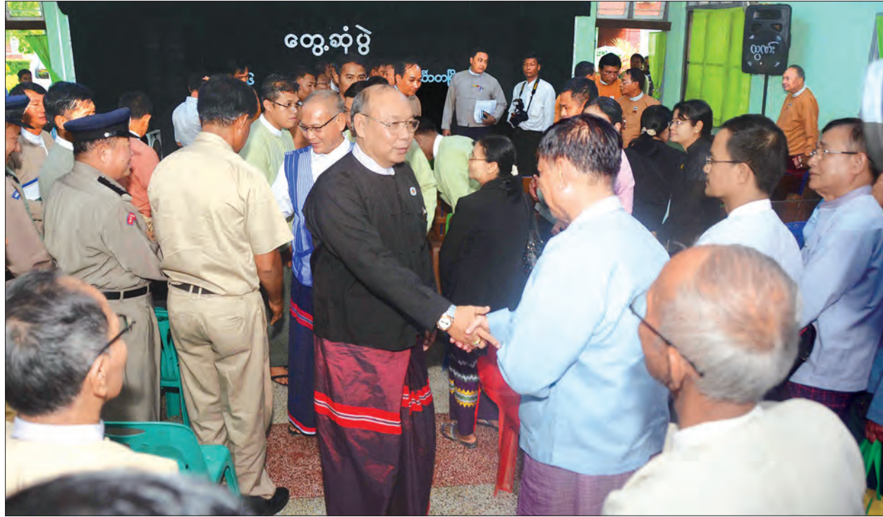
ပြည်ထောင်စုလွှတ်တော်နာယက အမျိုးသားလွှတ်တော်ဥက္ကဋ္ဌ မန်းဝင်းခိုင်သန်း ဟင်္သာတဒေသခံပြည်သူများအား ရင်းရင်းနှီးနှီး နှုတ်ဆက်စဉ်