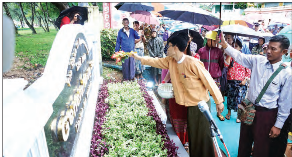
ဆိုင်ရာများ၊ အဆင့်မြှင့်တင်ရေးကော်မတီဝင်များ၊ ဖိတ်ကြား ထားသော စည်သူတော်များနှင့် မြို့မမြို့ဖများက ဗိုလ်ချုပ် အောင်ဆန်းနှင့်တကွ ကျဆုံးလေပြီးသော အာဇာနည်အပေါင်း တို့အား အလေးပြုခဲ့ကြောင်း သိရသည်။ (ခရိုင် ပြန်/ဆက်)

ဆက်လက်၍ ဗိုလ်ချုပ်အောင်ဆန်းရုပ်တု အဝင်မုခ်ဦးနှင့် လျှောက်လမ်းအား အောင်သပြေ အောင်နိမိတ်ဖြင့် ရွှေရည်၊ ငွေရည်ဖျန်းပတ်၍ ဖွင့်လှစ်ပေးခဲ့ပြီး ပြည်နယ်ဝန်ကြီးချုပ်၊ လွှတ်တော်ဥက္ကဋ္ဌ ပြည်နယ်အစိုးရအဖွဲ့ဝန်ကြီးများ၊ ဌာန