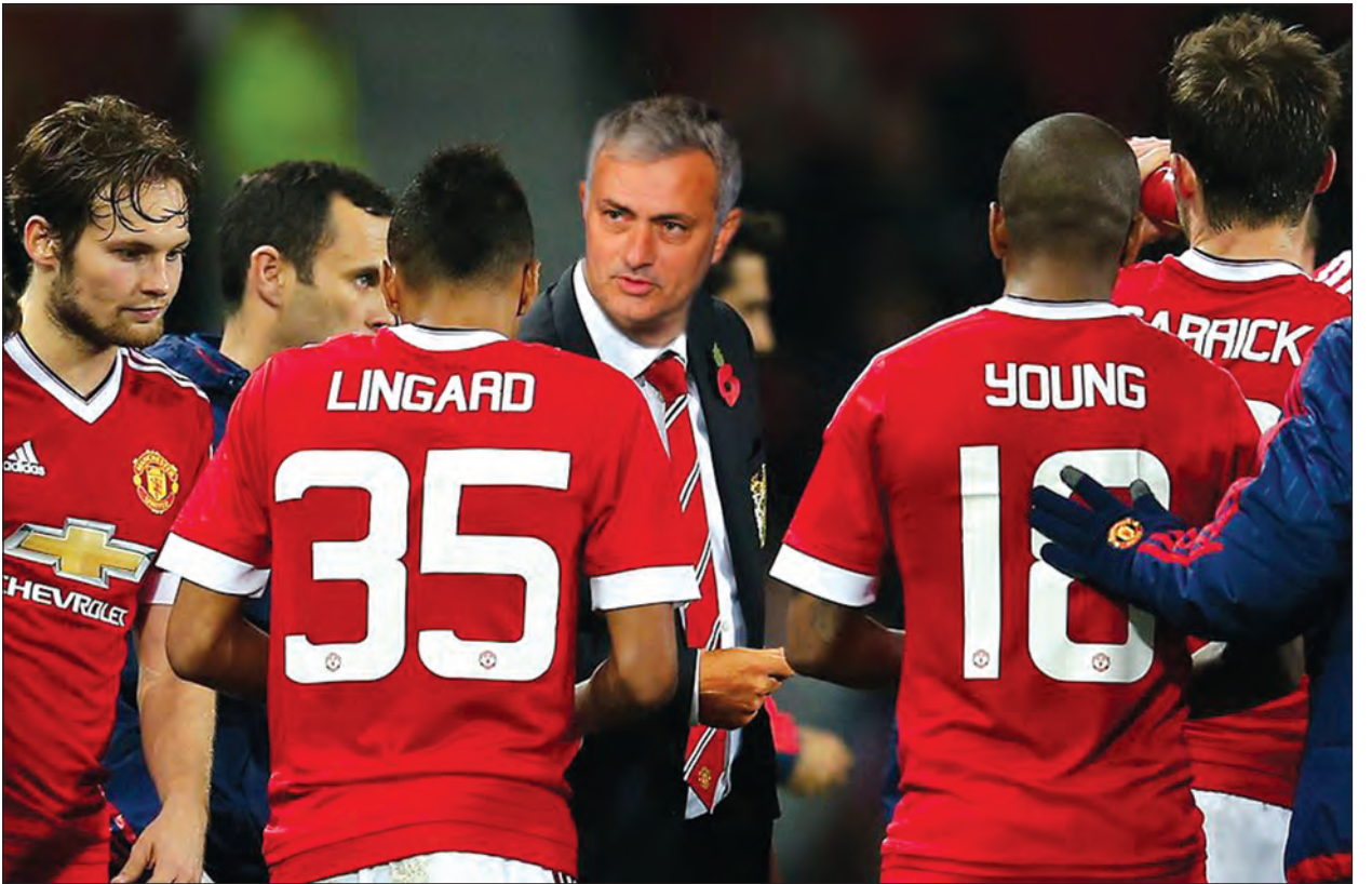
ချန်ပီယံ လက်စတာအသင်းနဲ့ ရာသီအကြံပြုစဉ်ကွန်မြူနတီဒိုင်းပွဲစဉ်အဖြစ် ရင်ဆိုင်ရမယ့်ပွဲ ရှိပါတယ်။ ဒါကြောင့် ရာသီအကြံပြုစဉ်တွေမှာ မန်ယူရဲ့ ဗျူဟာအခင်းအကျင်း ကစားသမား နေရာချမှုတွေပြောင်းလဲသွားမလားဆိုတာ စောင့်ကြည့်ရမှာဖြစ်သလို မော်ရင်ဟို

အဲဒီပွဲပြီးရင်တော့ မန်ယူဟာ ဇူလိုင် ၃၀ မှာ ဂါလာတာစာရေးအသင်းနဲ့ ဆွီဒင်နိုင်ငံ Nya Ullevi ကွင်းမှာ သွားရောက်ကစားရမှာဖြစ်ပါတယ်။ ဩဂုတ် ၃ ရက်မှာတော့ အဲဘတန်အသင်းနဲ့ အင်္ဂလန်နိုင်ငံ အိုးထရက်ဖို့ဒ်ကွင်းမှာ ကစားရဖို့ရှိနေပါတယ်။ ဩဂုတ် ၇ ရက်မှာတော့ အက်စ်အေဖလားချန်ပီယံဖြစ်တဲ့ မန်ယူက ပရီမီယာလိဂ်