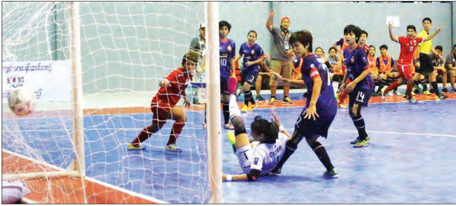
အမျိုးသမီးပြိုင်ပွဲတွင် မြန်မာကလပ် WF.C နှင့် ဂျာရာကန်ဆီနာအသင်း ယှဉ်ပြိုင်စဉ်

နေပြည်တော် ဇူလိုင် ၁၀ မြန်မာနိုင်ငံက အိမ်ရှင်အဖြစ် လက်ခံကျင်းပနေသည့် ၂၀၁၆ အာဆီယံ ဖူဆယ်ကလပ်ပြိုင်ပွဲ ပထမနေ့ပွဲစဉ်များနှင့် ဖွင့်ပွဲအခမ်းအနားကို ယနေ့နံနက်ပိုင်း မှစတင်ကာ နေပြည်တော်ရှိ ဝဏ္ဏသိန္နိ ဖူဆယ်အားကစားရုံ၌ ကျင်းပပြီး ပြိုင်ပွဲပထမနေ့တွင် မြန်မာကလပ်အသင်းများ နိုင်ပွဲပျောက်ဆုံးခဲ့သည်။