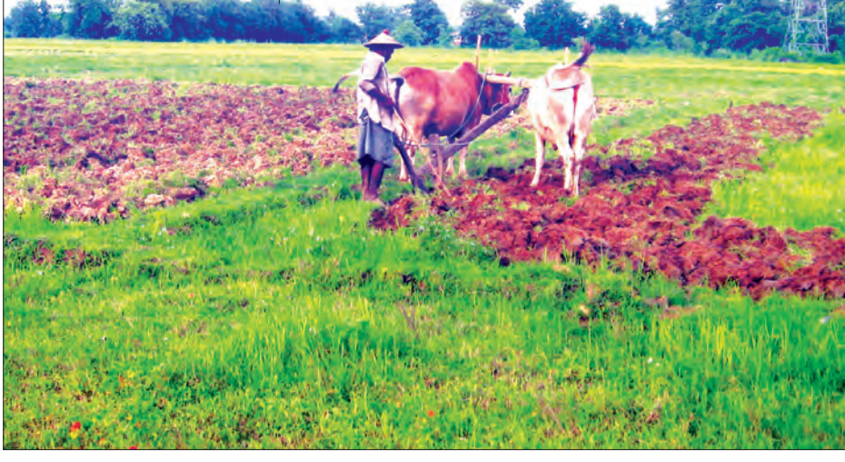
(ဖြူးမြို့နယ်)

ဖြူး ဇူလိုင် ၁၀ ဖြူးမြို့နယ်သည် တောင်ငူခရိုင် မြောက်မြို့နယ်အတွင်း ဆောင်းသီးနှံပျိုးစုံနှင့် မိုးစပါးများကို အများဆုံး စိုက်ပျိုးထုတ်လုပ်လျက်ရှိသော မြို့နယ်တစ်ခုဖြစ်ပြီး ယခု ၂၀၁၆-၂၀၁၇ မိုးရာသီတွင် မိုးစပါး ၁၅၁၄၄၅ ဧက စိုက်ပျိုးသွားရန် သတ်မှတ်လျာထားခဲ့သည်။ အဆိုပါသတ်မှတ်လျာထားသော မိုးစပါးများကို ဖြူးမြို့နယ်အတွင်းရှိ ကျေးရွာအုပ်စု ၅၉ အုပ်စုနှင့် မြို့ပေါ်ရပ်ကွက်အချို့များမှ တောင်သူများက ရာသီအစီစိုက်ပျိုးသွားနိုင်ရေးအတွက် မိုးရွာသွန်းမှုအပေါ်တည်၍ မိုးရေရရှိမှုနှင့်အညီ ဇွန်လဒုတိယအပတ်မှစတင်၍ လယ်ယာလုပ်ငန်းခွင်သို့ ဝင်ရောက်လုပ်ကိုင်နေကြပြီဖြစ်သည်။ ယင်းသို့ လယ်ယာလုပ်ငန်းခွင်ဝင်ရောက်လုပ်ကိုင်ဆောင်ရွက်နေကြသော်လည်း လွန်ခဲ့သည့် ၁၀ နှစ်ခန့်မှစ၍ လယ်ယာလုပ်သား ရှားပါးမှုပြဿနာနှင့် တွေ့ကြုံနေကြရသဖြင့် အချို့ကျေးရွာများရှိ လယ်မြေများတွင် စပါးဧက ကြိုခင်းစနစ်ဖြင့်စိုက်ပျိုးလျက်ရှိ နေကြသည်။ “ပျိုးထောင်တော့ဘဲ ကြိုခင်းစနစ်နဲ့ ကြွပ်စိုက်ပျိုးသူတွေအနေနဲ့ ကောက်စိုက်သမ မလိုအပ်တော့ဘဲ ကောက်စိုက်ခ တစ်ဧက ငွေကျပ်ငါးသောင်း သက်သာတော့ အထွက်နှုန်းလျော့ခြင်းအပေါ် ကာမိပါတယ်” ဟု ဒေသခံတောင်သူ တစ်ဦးက ပြောသည်။