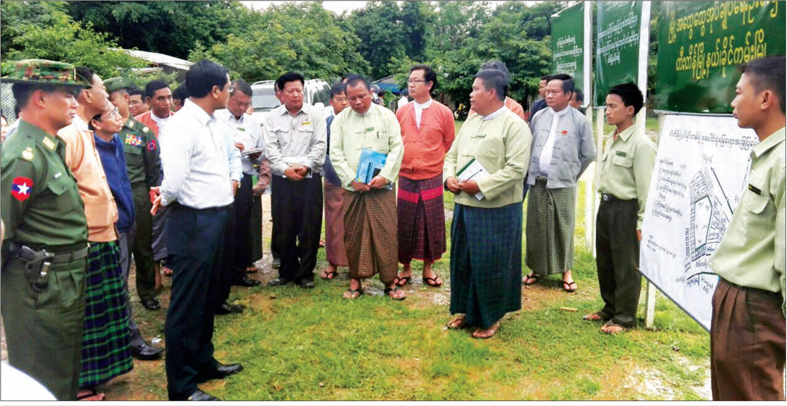
ဒုတိယသမ္မတ ဦးဟင်နရီဝန်ထီးယူ ခိုင်ကမ်းမြို့၊ မြို့နယ်စုပေါင်းရုံး တည်ဆောက်မည့်မြေနေရာအား ကြည့်ရှုစစ်ဆေးစဉ် (သတင်းစဉ်)

ရာဇဂြိုဟ် ရေလျှောင့်တစ်ခုသည် စစ်ကိုင်းတိုင်းဒေသကြီး၊ ကလေးမြို့နယ် ရာဇဂြိုဟ်ကျေးရွာ၏ မြောက်ဘက် နှစ်မိုင် ခန့်အကွာ နေရာချောင်ပေါ်၍ တည်ရှိ