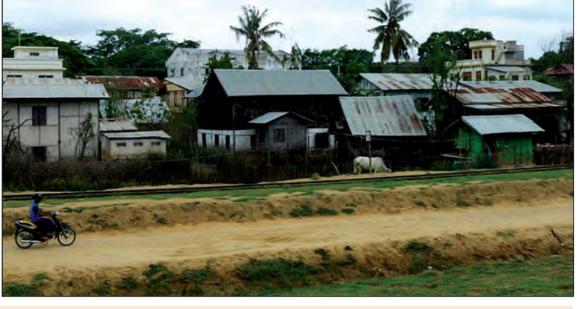
မိုးရေလျှံတက်ဝင်ရောက်လေ့ရှိသည့် နန်းတော်ကုန်းရပ်ကွက်တစ်နေရာ

မိတ္ထီလာ ဇူလိုင် ၈ မိတ္ထီလာမြို့နယ် နန်းတော်ကုန်းရပ်ကွက်ရှိ နယ်မြေအချို့မှ လူနေအိမ်များအတွင်း ယခင်နှစ်များက မိုးအဆက်မပြတ်ရွာသွန်းချိန်တွင် မိုးရေလျှံတက်ဝင်ရောက်လေ့ရှိရာ ယခုနှစ်တွင် ရေဝင်ရောက်မှုကင်းဝေးစေရန်အတွက် ယင်းရပ်ကွက်နယ်မြေအနီးတွင် မိုးရေစုကန်တစ်ကန်ကို တူးဖော်သွားမည်ဖြစ်ကြောင်း သိရသည်။ “မိတ္ထီလာမှာ မိုးအဆက်မပြတ်ရွာသွန်းချိန်ဆို နန်းတော်ကုန်းရပ်ကွက် နယ်မြေ(၆)နဲ့ နယ်မြေ(၇)ဘက် လူနေအိမ်ခြေ ၇၀ ခန့်ထက် မိုးရေထွက်ဝင်ရောက်ပြီးတော့ ရေထွက်ပေါက်မရှိလို့ မိုးရေလျှံတက်တာမျိုး