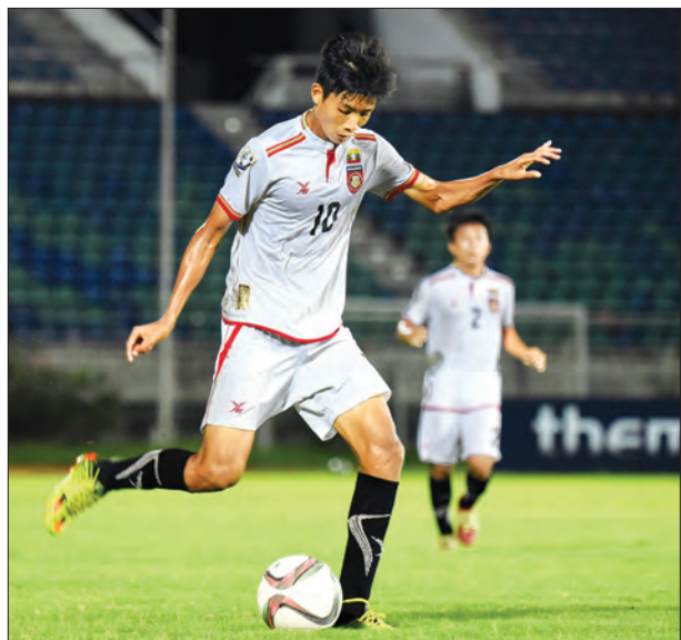
အာဆီယံ ယူ-၁၆ ပြိုင်ပွဲဝင် မြန်မာဘောလုံးအသင်းမှ လူငယ်ကစားသမားတစ်ဦး

သတင်း - ညီမြတ်သော်တာ၊ ဓာတ်ပုံ - ဖိုးသော်ဇင် နေပြည်တော် ဇူလိုင် ၈ အာဆီယံဘောလုံးအဖွဲ့ချုပ်ကကြီးမှူးကျင်းပမည့် ၂၀၁၆ အာဆီယံ ယူ -၁၆ ဘောလုံးပြိုင်ပွဲကို ဇူလိုင် ၁၀ ရက်မှစတင်ကာ ကမ္ဘောဒီးယားနိုင်ငံ ဖနောင်ပင်မြို့၌ ကျင်းပမည်ဖြစ်ပြီး မြန်မာလူငယ်အသင်း ဝင်ရောက်ယှဉ်ပြိုင်မည် ဖြစ်သည်။ အာဆီယံ ယူ-၁၆ ပြိုင်ပွဲကို ဇူလိုင် ၁၀ ရက်မှ ၂၃ ရက်အထိ ကျင်းပမည်ဖြစ်ပြီး အသင်း ၁၁ သင်းယှဉ်ပြိုင်မည်ဖြစ်သည်။ ပြိုင်ပွဲကို အုပ်စုနှစ်ခုခွဲ၍ ကျင်းပမည်ဖြစ်ပြီး မြန်မာအသင်းသည် အုပ်စု(က)တွင် ဩစတြေးလျ၊ မလေးရှား၊ ဝီယက်နမ်၊ စင်ကာပူ၊ ဖိလစ်ပိုင်တို့နှင့် တစ်အုပ်စုတည်းကျရောက်နေသည်။ အုပ်စု(ခ)တွင် ထိုင်း၊ လာအို၊ ကမ္ဘောဒီးယား၊ တီမော၊ ဘရူနိုင်းအသင်းတို့ ပါဝင်လျက်ရှိသည်။ မြန်မာအသင်းသည် အုပ်စုစဉ်များအဖြစ် ဇူလိုင် ၁၀ ရက်တွင် ဩစတြေးလျအသင်း၊ ဇူလိုင် ၁၂ ရက်တွင် စင်ကာပူအသင်း၊ ဇူလိုင် ၁၄ ရက်တွင် ဝီယက်နမ်အသင်း၊ ဇူလိုင် ၁၆ ရက်တွင် မလေးရှားအသင်း၊ ဇူလိုင် ၁၈ ရက်တွင် ဖိလစ်ပိုင်အသင်းတို့နှင့် ယှဉ်ပြိုင်ကစားရမည် ဖြစ်သည်။ မြန်မာအသင်းသည် ခြောက်သင်းအုပ်စုတွင် ပါဝင်နေပြီး ခြေစွမ်းမြင့်မားသည့် ဩစတြေးလျ၊ ဝီယက်နမ်၊ မလေးရှားတို့နှင့် တစ်အုပ်စုတည်းကျရောက်နေသောကြောင့် နောက်တစ်ဆင့် တက်ရောက်ရန် ကြိုးစားရန်ကန်ရဖွယ်ရှိနေသည်။ စာမျက်နှာ ၁၄ ကော်လံ ၅