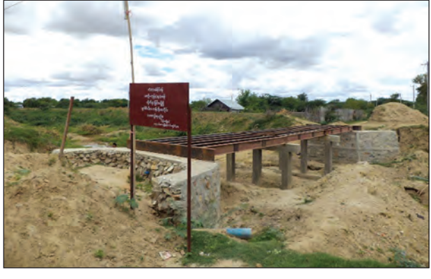
ကျေးရွာ ၄၀ ခန့် အားထားအသုံးပြုနေရသည့် ကျောက်ဖူးတံတားကို ဇူလိုင်လကုန်အပြီးတည်ဆောက်မည်