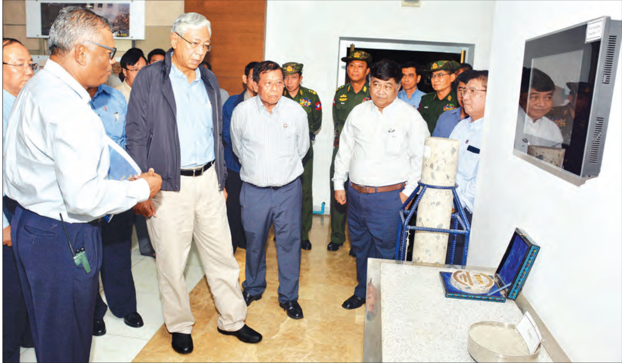
နိုင်ငံတော်သမ္မတ ဦးထင်ကျော်အား ဓာတ်အားပေးစက်ရုံ မှတ်တမ်းပြခန်း၌ ရေအားလျှပ်စစ်အကောင်အထည်ဖော်ရေးဦးစီးဌာန ဒုတိယညွှန်ကြားရေးမှူးချုပ် ဦးစန်းဌေက စက်ရုံတည်ဆောက်ခဲ့မှု အဆင့်ဆင့်အား ရှင်းလင်းတင်ပြစဉ်