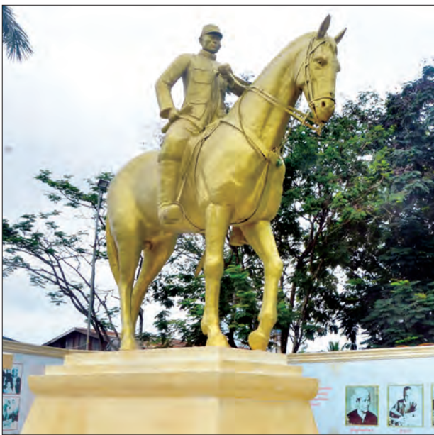
ကန်သာယာပန်းခြံအတွင်းရှိ ဗိုလ်ချုပ်မြင်းစီးရုပ်တုကို တွေ့ရစဉ် ဖြစ်သည်။ ပန်းခြံအတွင်း ဗိုလ်ချုပ်မြင်းစီးရုပ်တုနှင့် အာဇာနည်နေ့တွင် ကန်သာယာ အာဇာနည်ခေါင်းဆောင်ကြီးများအား