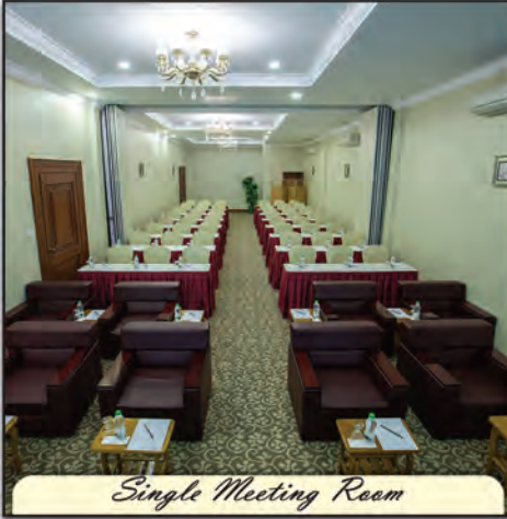
Single Meeting Room