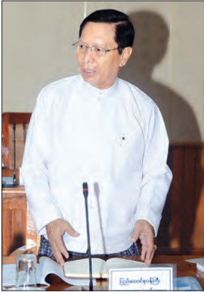
ပြည်ထောင်စုဝန်ကြီး သူရဦးအောင်ကို

ဥက္ကဋ္ဌ ပြည်ထဲရေးဝန်ကြီးဌာန ဒုတိယ ဝန်ကြီး ဗိုလ်ချုပ်အောင်စိုးက အာဇာနည် ဗိမာန်၊ ဗိုလ်ချုပ်အောင်ဆန်းပြတိုက်တို့ နှင့်စပ်လျဉ်း၍ လုံခြုံရေးဆန်းစစ်ချက် များ၊ လေ့လာတွေ့ရှိချက်များ၊ လုံခြုံရေး အကြံပြုချက်များကို ရှင်းလင်းတင်ပြ သည်။ ဆက်လက်၍ အခမ်းအနားသို့ တက်ရောက်လာကြသူများက မိမိတို့ သက်ဆိုင်ရာကဏ္ဍများအလိုက် ရှင်းလင်း တင်ပြကြသည်။ ထို့နောက် ဒုတိယသမ္မတက ရှင်းလင်းတင်ပြချက်များနှင့် စပ်လျဉ်း၍ ပေါင်းစပ်ညှိနှိုင်းပေးပြီး နိဂုံးချုပ်ပြောကြား ကာ အခမ်းအနားကို ရုပ်သိမ်းလိုက်သည်။ (သတင်းစဉ်)