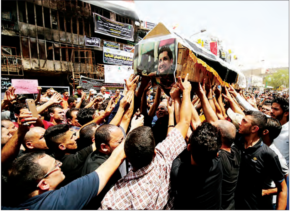
လက်ချက်ဟုယူဆရသည့် လူအသေအပျောက်အများဆုံး တိုက်ခိုက်မှုဖြစ်ပြီး လူနှစ်ရာထိခိုက်ဒဏ်ရာရရှိခဲ့သည်။ ဒဏ်ရာရရှိသူအများစုမှာ ပြန်လည်ကောင်းမွန်လာပြီဖြစ်ပြီး ၂၃ ဦးမှာ ဆေးရုံ၌ ကုသမှုခံယူနေဆဲဖြစ်ကြောင်း သိရသည်။ (ဆင်ဟွာ)

ဘဂ္ဂဒက်တောင်ပိုင်းရှိ ရောင်းဝယ်ဇောက်ကားမှ အချက်အချာနေရာဖြစ်သည့် ဈေးဝယ်စင်တာ အနီးရှိ မျက်နှာစာတွင် အသေခံပုံးခွဲတိုက်ခိုက်မှု ဖြစ်ပွားခဲ့ကြောင်း မွန်လာပြီဖြစ်ပြီး ၂၃ ဦးမှာ ဆေးရုံ၌ ကုသမှုခံယူနေဆဲဖြစ်ကြောင်း သိရသည်။ (ဆင်ဟွာ)