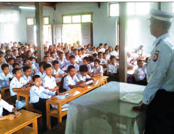
ပျဉ်းမနားမြို့၊ ကန်နားအခြေစိုက်ပညာအထက်တန်းကျောင်း(ခွဲ) ကျောင်းအုပ်ကြီး၊ ဆရာ ဆရာမများနှင့် ကျောင်းသား ကျောင်းသူများအား အမှတ်(၆) ယာဉ်ထိန်းရဲတပ် တပ်ဖွဲ့စု(ပျဉ်းမနား) မြို့နယ်မှ ဒုတိယရဲမှူး၊ မင်းသူက ယာဉ်စည်းကမ်း၊ လမ်းစည်းကမ်း အသိပညာပေးဟောပြောစဉ် (သတင်းစဉ်)

ဆက်တွေနဲ့လည်း အသုံးပြုနိုင်မယ့် အနေအထားရှိတယ်လို့ ကျွန်တော်တို့ သိရှိထားပါတယ်။ အနာဂတ်မှာတော့ အခြား 4G ဝန်ဆောင်မှုတွေကို ပိုမိုကြည့်လင်ပြတ်သားတဲ့ အသံနဲ့ မက်ဆေ့ပို့လိုရမယ့် အတွေ့အကြုံသစ်တွေနဲ့ ဝန်ဆောင်မှုပေးနိုင်ပါလိမ့်မယ်” ဟု အမှုဆောင်အရာရှိချုပ်က ဆက်လက်ပြောကြားသည်။ တယ်လီနောအနေဖြင့် လက်ရှိအချိန်တွင် မြန်မာနိုင်ငံအတွင်း တာဝါတိုင်ပေါင်း ၅၈၀၀ ကျော်နှင့် တိုင်းဒေသကြီးနှင့် ပြည်နယ်အားလုံးသို့ မိုဘိုင်းနှင့် အင်တာနက် ဝန်ဆောင်မှုများ ပေးလျက်ရှိကာ သုံးစွဲသူပေါင်း ၁၆ သန်းကျော်ရှိပြီဖြစ်ကြောင်း သိရသည်။ 4G အင်တာနက်ဝန်ဆောင်မှုကို မြန်မာနိုင်ငံတွင် အုရီဒူမြန်မာက မေလအတွင်းက စတင်၍မိတ်ဆက်ခဲ့ပြီးနောက် ယခုအခါ တယ်လီနောကလည်း နေပြည်တော်တွင် စတင်မိတ်ဆက်ပေးပြီဖြစ်ရာ ပြည်တွင်းမှ မိုဘိုင်းအင်တာနက်အသုံးပြုနေသူများအနေဖြင့် 4G ဝန်ဆောင်မှုကို အော်ပရေတာနှစ်ခုထဲမှ ရရှိနိုင်ပြီဖြစ်သည်။ သူရဦး