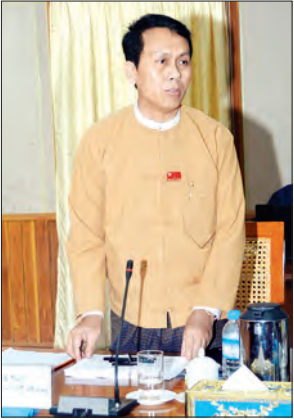
ရန်ကုန်တိုင်းဒေသကြီး ဝန်ကြီးချုပ် ဦးမြိုးမင်းသိန်း