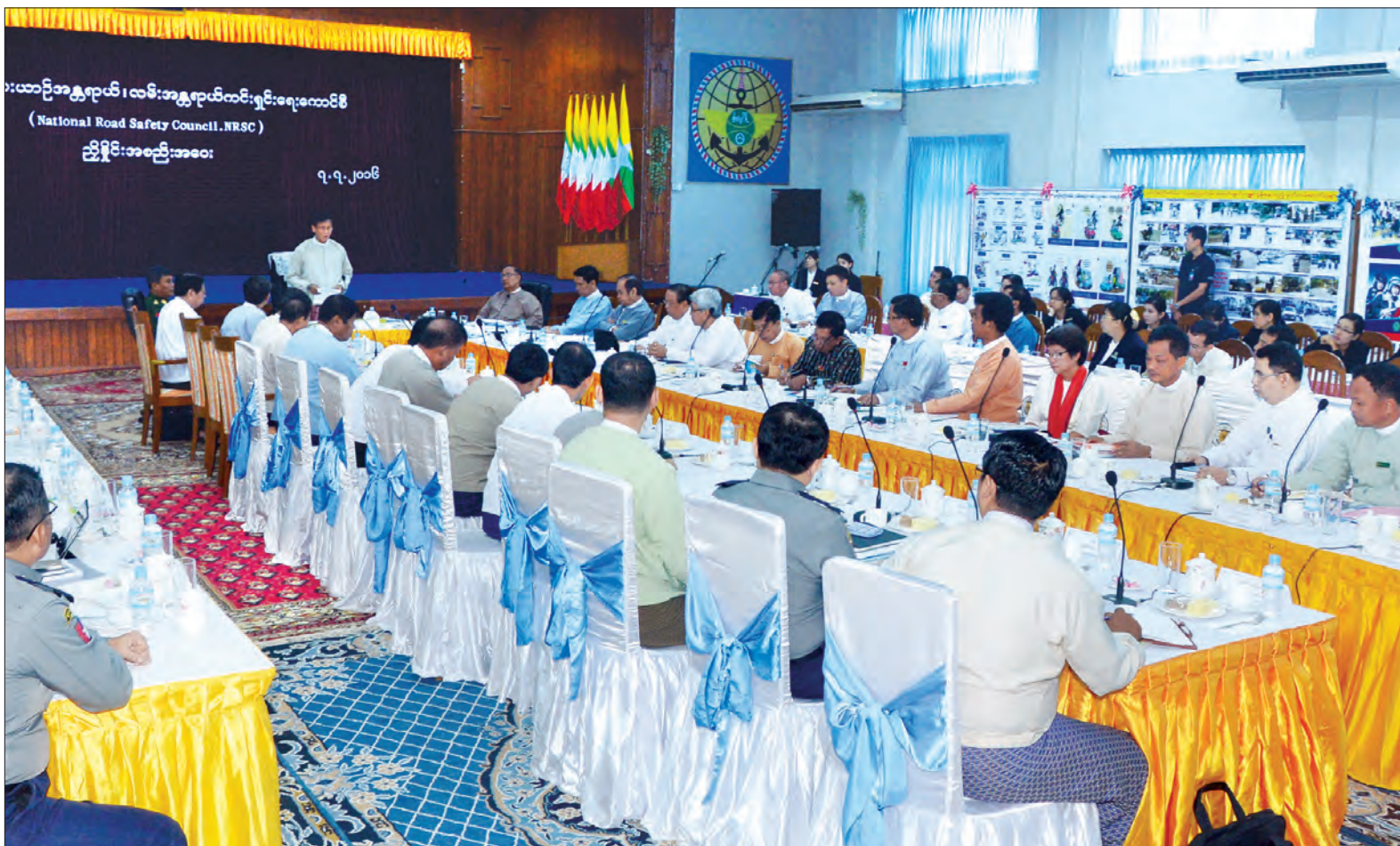
ဒုတိယသမ္မတ ဦးဟင်နရီစန်ထီးယူ အမျိုးသားယာဉ်အန္တရာယ်၊ လမ်းအန္တရာယ် ကင်းရှင်းရေးကောင်စီ ညှိနှိုင်းအစည်းအဝေးတွင် အမှာစကားပြောကြားစဉ် (သတင်းစဉ်)