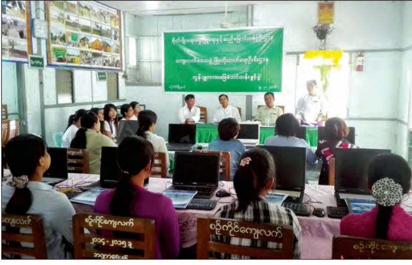
သင်တန်းကို ကျေးလက်နေလူငယ်များ နည်းပညာဆိုင်ရာ ပဟုသတများရရှိလာရန်နှင့် စွမ်းဆောင်ရည်များ တိုးတက်လာစေရန်၊ အလုပ်အကိုင်အခွင့်အလမ်းများ ပိုမိုရရှိလာစေရန်နှင့် ကျေးလက်နေပြည်သူများ၏ ဆင်းရဲမှုလျော့ချရေးတွင် အထောက်အကူဖြစ်စေရန် ရည်ရွယ်၍ ဖွင့်လှစ်ခြင်းဖြစ်ကြောင်း မြို့နယ် ကျေးလက်ဒေသဖွံ့ဖြိုးတိုးတက်ရေးဦးစီးဌာနမှူးက ပြောကြားသည်။

စဉ့်ကိုင် ဇူလိုင် ၇ မန္တလေးတိုင်းဒေသကြီး စဉ့်ကိုင်မြို့နယ်အတွင်း ရပ်ကွက်ကျေးရွာများမှ ပြည်သူများ၏ အသက်မွေးဝမ်းကျောင်းအတွက် အထောက်အကူဖြစ်စေရန်ရည်ရွယ်၍ အခြေခံကွန်ပျူတာသင်တန်းကို စဉ့်ကိုင်မြို့နယ် ကျေးလက်ဒေသဖွံ့ဖြိုးတိုးတက်ရေးဦးစီးဌာနက ဇူလိုင် ၄ ရက်က စတင်ဖွင့်လှစ်သင်ကြားပေးလျက်ရှိကြောင်း သိရသည်။ စဉ့်ကိုင်မြို့နယ် ကျေးလက်ဒေသဖွံ့ဖြိုးတိုးတက်ရေးဦးစီးဌာနရုံးတွင် ဖွင့်လှစ်ထားသည့် အဆိုပါ အသက်မွေးဝမ်းကျောင်းအထောက်အကူပြု အခြေခံကွန်ပျူတာသင်တန်းတွင် မြို့နယ်အတွင်းရှိ ကျေးရွာ ၁၀ ရွာမှ သင်တန်းသား ၁၀ ဦးအား MCC Computer Training Center မှ သင်တန်းနည်းပြ ဆရာ ဆရာမများက သင်ကြားပေးလျက်ရှိကာ အခြေခံကွန်ပျူတာဘာသာရပ်အပြင် Integrated Farming ဘာသာရပ်၊ စိုက်ပျိုးရေးဆိုင်ရာအသိပညာများ၊ မွေးမြူရေးနှင့် ကုသရေးဆိုင်ရာ အသိပညာပဟုသတများကိုလည်း တွဲဖက် သင်ကြားပေးသွားမည်ဖြစ်ကြောင်း၊ ဘာသာရပ်အားလုံးကို အခမဲ့ သင်ကြားပေးသွားမည်ဖြစ်ပြီး သင်တန်းကာလမှာ သြဂုတ် ၃ ရက်အထိ တစ်လကြာ မြင့်မည်ဖြစ်ကြောင်း သိရသည်။