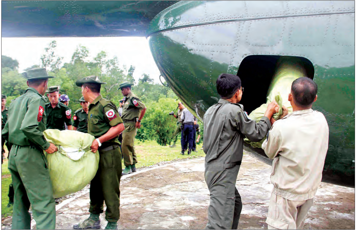
တပ်မတော် ရဟတ်ယာဉ်ဖြင့် ထောက်ပံ့ရေးပစ္စည်းများ သယ်ယူပို့ဆောင်ပေးစဉ်