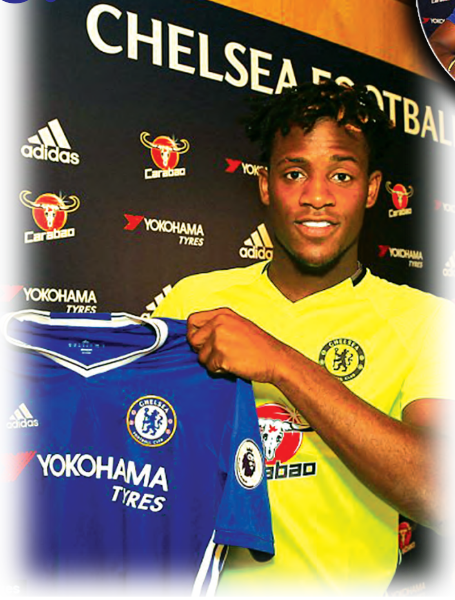
ခြေစွမ်းပြကစားကာ တစ်ရိုးသွင်းယူထားနိုင်ခဲ့သူ ဖြစ်ပါတယ်။

ဘက်ရှူးဟာ ကွန်ဂိုနွယ်ဖွားဖြစ်တာကြောင့် ကွန်ဂို လက်ရွေးစင်အသင်းမှာ ကစားခွင့်ရှိပေမယ့် ဘယ်လ်ဂျီယံ လက်ရွေးစင်အသင်းမှာပဲကစားဖို့ ရွေးချယ်ခဲ့ပါတယ်။ သူဟာ ဘယ်လ်ဂျီယံ ၂၀ အသင်းမှာ စတင်ပါဝင်ကစားခဲ့ပြီး ၁၃ ပွဲ ကစားကာ ခုနစ်ရိုးသွင်းယူပေးထားသူဖြစ်ပါတယ်။ သူဟာ ဘယ်လ်ဂျီယံ လက်ရွေးစင်အသင်းနဲ့အတူ ၂၀၀၅ မှာ တော့ စတင်ပါဝင်ကစားခွင့်ရရှိခဲ့ပါတယ်။ ပြီးခဲ့တဲ့ ယူရို ၂၀၁၆ မှာတော့ ဘက်ရှူးဟာ ဘယ်လ်ဂျီယံအသင်းနဲ့အတူ အကောင်းဆုံး