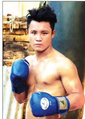
ဗျံသွေး(မြန်မာ)