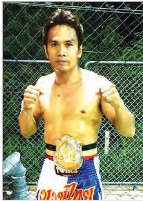
ဆူတာဝမ်(ထိုင်း)