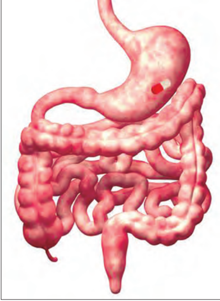
စေနိုင်ပါတယ်။

NSAID အကိုက်အခဲပျောက်ဆေးမှရရှိသောဆိုးကျိုးများ NSAID အကိုက်အခဲပျောက်ဆေးတွေဟာ အထက်ဖော်ပြပါကောင်းကျိုးတွေသာမက ဆိုးကျိုးတွေကိုလည်း ရရှိ