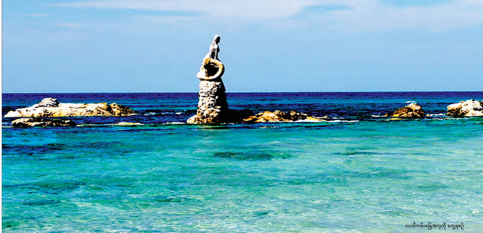
ငပလီကမ်းခြေအလှကို တွေ့ရစဉ်

ကျွန်တော်တို့မြို့တော်ခန်းမတည်ဆောက်နေမှုကို ကြည့်ရှုလေ့လာပြီးနောက် သံတွဲမြို့၊ အမှတ်(၈)ရပ်ကွက်တွင် တည်ထားသောအံတော်စေတီရှိရာသို့ ထွက်လာခဲ့ကြသည်။ သံတွဲမြို့တွင် ဝုဒ္ဓဘုရား၏ နံရိုးစေတီကို ဌာပနာသွင်း စေတီတည်ထားသော နံတော်စေတီ၊ မြတ်စွာဘုရား၏အံတော်ကို ဌာပနာသွင်းတည်ထားသော အံတော်စေတီနှင့် မြတ်စွာဘုရား၏ဆံတော်ကို ဌာပနာ