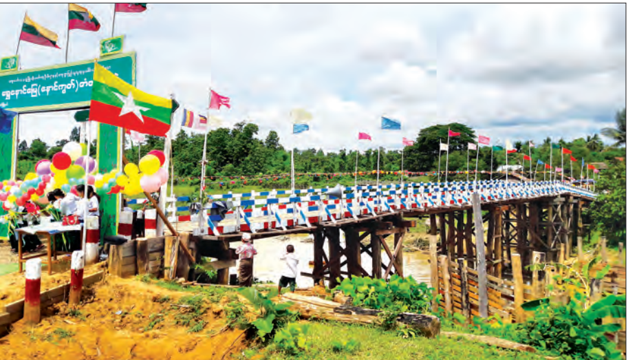
ဆောက်လုပ်ပြီးစီးခဲ့သဖြင့် ဒေသပညာရေး၊ စီးပွားရေး၊ လူမှုရေးတို့တွင် ဖြစ်ကြောင်း သိရသည်။ အတွင်း ဆက်သွယ်သွားလာရေး၊ များစွာ ဖွံ့ဖြိုးတိုးတက်လာနိုင်တော့မည် နိတိုး

အဆိုပါတံတားမှာ အလျား ၂၅၂ ပေ၊ အကျယ် ၁၆ ပေ၊ အမြင့် ၃၂ ပေ ရှိပြီး တံတားဖြစ်မြောက်ရေးအတွက် ၂၀၁၃ ခုနှစ်မှ စတင်အကောင်အထည်ဖော်ဆောင်ရွက်ခဲ့ပြီး တံတားကို ဇန်နဝါရီ ၂၅ ရက်က စတင်ဆောက်လုပ်ခဲ့ရာ နိုင်ငံတော်မှ ပံ့ပိုးငွေ ကျပ် သိန်း ၂၇ သိန်း၊ ဒေသခံများမှ စုပေါင်း ထည့်ဝင်ငွေကျပ် ၁၅ သိန်းဖြင့် အကုန်အကျခံ တည်ဆောက်ခဲ့ကြောင်း၊ တံတား