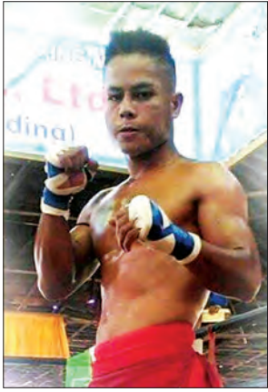
စောဒါဝိတ်