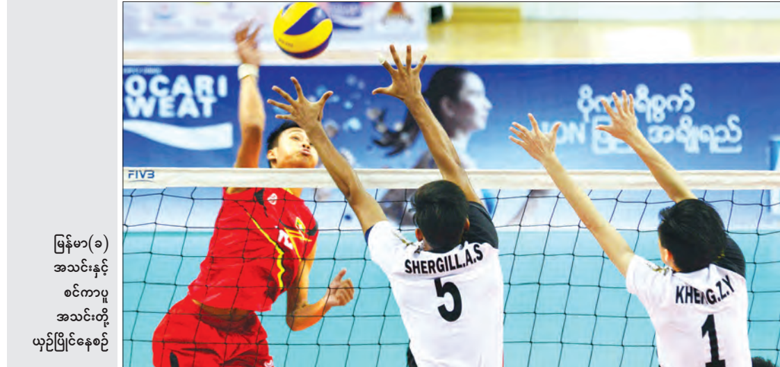
မြန်မာ(ခ) အသင်းနှင့် စင်ကာပူ အသင်းတို့ ယှဉ်ပြိုင်နေစဉ်

ပထမနေ့ပွဲစဉ်များ ဆက်လက်ကျင်းပရာ မြန်မာ(ခ)၊ ထိုင်းနှင့် အင်ဒိုနီးရှားအသင်းတို့ အနိုင်ရရှိခဲ့သည်။ မြန်မာ(ခ)အသင်းသည် အုပ်စု(က)တွင် ပါဝင်နေပြီး စင်ကာပူအသင်းနှင့် ပွဲဦးထွက်ပွဲစဉ် ယှဉ်ပြိုင်ကစားခဲ့ရာ သုံးပွဲပြတ်အနိုင်ရခဲ့ခြင်းဖြစ်သည်။ မြန်မာအသင်းသည် စင်ကာပူအသင်းကို ၂၅-၁၅ မှတ်၊ ၂၅-၂၃ မှတ်၊ ၂၅-၁၄ မှတ်တို့ဖြင့် သုံးပွဲပြတ်အနိုင်ရခဲ့ခြင်းဖြစ်သည်။ အခြားပွဲစဉ်တွင် ထိုင်းအသင်းက နယူးဇီလန်အသင်းကို ၂၅-၇၊ ၂၅-၂၂ မှတ်(၂၅-၉)ဖြင့် သုံးပွဲပြတ်၊ အင်ဒိုနီးရှားအသင်းက မော်လ်ဒိုက်အသင်းကို ၂၅-၁၆၊ ၂၅-၉၊ ၂၅-၆ မှတ်တို့ဖြင့် သုံးပွဲပြတ်ဖြင့် အနိုင်ရရှိခဲ့ကြောင်း သိရသည်။