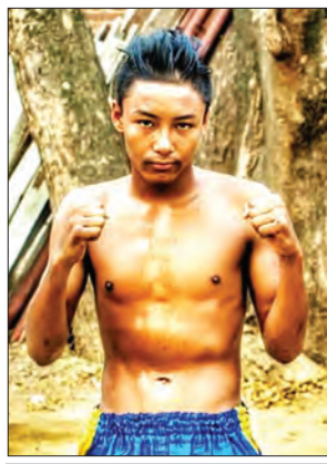
စွမ်းထက်နိုင်

ဖိုက်တာ တိမ်တိုက်သည် ကောင်တာဖြင့် ကစားသွားသည့် စွမ်းထက်နိုင်ကို ဝါးချီပြည့် လိုက်လံယှဉ်ပြိုင်ထိုးသတ်နိုင်ခဲ့သော်လည်း အမှတ်ဖြင့် ရှုံးနိမ့်ခဲ့ရသည်။ တိမ်တိုက်ကြိုးစားသမျှ ရင်ကွပ်ကလက်ဖြစ်ခဲ့သည်။ ၅၁ ကီလိုတန်းတွင် ရွှေခါးပတ် ချန်ပီယံဖြစ်ရမည်ဟု ၎င်းကိုယ်တိုင်ရည်မှန်းကြိုးစားလေ့ကျင့်ခဲ့ပြီး ရိုးရာလက်ဝှေ့ချစ်ပရိသတ်များကလည်း ရာနှုန်းပြည့်မှန်းထားကြသည်။