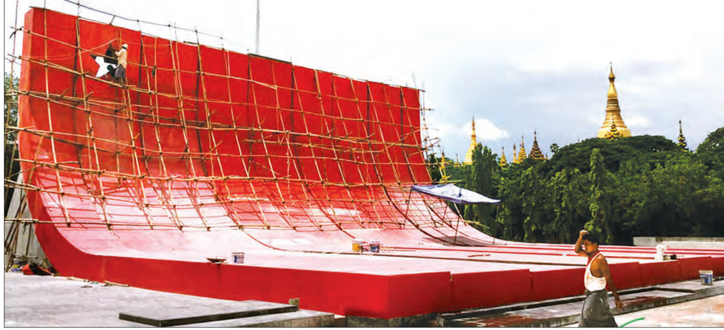
အာဇာနည်ပိမာန်ကို ပြုပြင်မွမ်းမံနေစဉ်