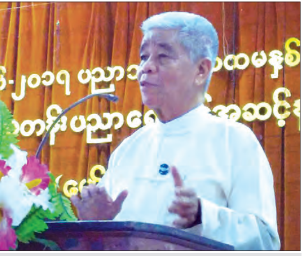
မြန်မာနိုင်ငံစာတတ်မြောက်ရေး အထောက်အကူပြုပင်မဌာန ဒုတိယဥက္ကဋ္ဌ ဒေါက်တာတင်ညို ရှင်းလင်းပြောကြားစဉ်

ချက်၊ အားနည်းချက်များ၊ လက်ရှိအခြေအနေနှင့် ရှေ့ဆက်ဆောင်ရွက်ရမည့် လုပ်ငန်းများ ဆွေးနွေးခဲ့ကြသည်။ မြန်မာရွှေ့ပြောင်းလုပ်သား မိသားစုများ မြန်မာနိုင်ငံသို့ ပြန်လည်ဝင်ရောက်သည့်အခါ ကျောင်းပြင်ပမူလတန်းပညာရေးစနစ်တို့ဖြင့် မူလတန်းပညာပြီးမြောက်ခဲ့သော ၎င်းတို့၏ သားသမီးများကို ပညာရေးဝန်ကြီးဌာနအောက်ရှိ အခြေခံပညာကျောင်းများသို့ ဆက်လက်အပ်နှံကာ ပညာရေးတန်းညီ အစီအစဉ်အရ အလယ်တန်းပညာကို ဆက်လက်သင်ယူလျက်ရှိသည်။ ကျောင်းပြင်ပ မူလတန်းပညာရေး အစီအစဉ်ကို ပညာရေးဝန်ကြီးဌာန၊ ယူနီဆက်နှင့် အလှူရှင်နိုင်ငံများက ပူးပေါင်းကာ ၂၀၀၈-၂၀၀၉ ပညာသင်နှစ်တွင် ဝါးမြို့နယ်ဖြင့်စတင်ခဲ့ရာ ၂၀၁၆-၂၀၁၇ ယခု ပညာသင်နှစ်တွင် မြို့နယ်ပေါင်း ၁၀၅ မြို့နယ်တွင် မူလတန်းအဆင့်ကိုလည်းကောင်း၊ ကျောင်းပြင်ပ အလယ်တန်းပညာရေးကို အစပျိုး မြို့နယ်အဖြစ် လေးမြို့နယ်တွင်လည်းကောင်း စတင်