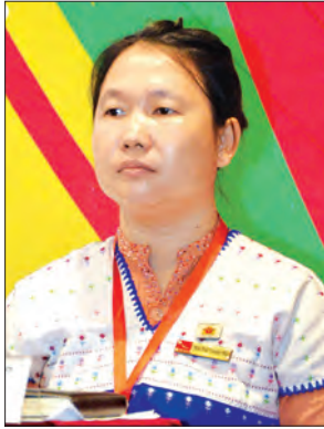
နော်ပန်းသဏ္ဍာမျိုး ကရင်တိုင်းရင်းသားလူမျိုးရေးရာဝန်ကြီး

နိုင်ငံတော်တည်ဆောက်ရေးမှာ အမျိုးသမီးတွေရဲ့ အခန်းကဏ္ဍက အင်မတန်အရေးပါပါတယ်။ ကျွန်ုပ်တို့နိုင်ငံမှာ စီမံခန့်ခွဲမှုက အရေးကြီးပါတယ်။ အမျိုးသမီးတွေ စီမံခန့်ခွဲတဲ့နေရာတွေမှာ ပါဝင်လာမယ်ဆိုရင် အများကြီးပြောင်းလဲလာဖို့ရှိပါတယ်။ အခုဆိုရင် နိုင်ငံရေး၊ စီးပွားရေး၊ လူမှုရေး စတဲ့ကဏ္ဍစုံတွေမှာ အမျိုးသမီးတွေ အရင်က ထက်ပိုပြီး ပူးပေါင်းပါဝင်လာကြပါပြီ။ ဦးထက်ပိုပြီး ပါဝင်ဖို့လည်း လိုအပ်ပါတယ်။ အဲဒီလိုဖြစ်ဖို့ဆိုရင် အမျိုးသား၊ အမျိုးသမီး ခွဲခြားမှုမရှိဘဲ အခွင့်အရေးတွေပေးရပါမယ်။ များသောအားဖြင့် ရိုးရာယဉ်ကျေးမှုတွေအရ အမျိုးသမီးတွေဟာ ထက်မြက်ပေမယ့် ရှေ့ထွက်ဖို့ကြောက်ရွံ့နေကြ၊ ဝန်လေးနေကြတယ်။ ရှေ့ထွက်ရဲလာအောင် သတ္တိတွေရှိလာအောင် အသိပညာပေးမှုတွေကို ကျေးလက်တွေအထိ သွားပြီးလုပ်ဆောင်ပေးနိုင်မယ်ဆိုရင် ခေါင်းဆောင်တွေ၊ လုပ်ရည်ကိုင်ရည်ရှိတဲ့အမျိုးသမီးတွေ အများကြီး ထွက်လာမှာ ဖြစ်ပါတယ်။ ကျွန်ုပ်တို့ ပုဂံကဲ့သို့ လက်တွေ့က ကမ္ဘာကို တုန်လှုပ်နိုင်တယ်ဆိုတာ ရာဇဝင်တွေ၊ သမိုင်းတွေမှာလည်း ရှိခဲ့ပါတယ်။ နိုင်ငံတော်ရဲ့ အတိုင်ပင်ခံပုဂ္ဂိုလ် ဒေါ်အောင်ဆန်းစုကြည်၊ ဂျာမနီ ဝန်ကြီးချုပ်တို့ဟာ တစ်ကမ္ဘာလုံးကလေးစားရတဲ့ ပုဂ္ဂိုလ်တွေဖြစ်ပါတယ်။ ကျွန်ုပ်တို့ အမျိုးသမီးတွေလည်း သူတို့ရဲ့ နေထိုင်မှုအကျင့်စရိုက်တွေ၊ တွေးခေါ်မှုပုံစံတွေကို စံနမူနာထား အားကျဂုဏ်ယူပြီး ကိုယ့်ကိုကိုယ် မြှင့်တင်ဖို့ ကြိုးစားဖို့လိုပါတယ်။ ကျွန်ုပ်တို့နိုင်ငံမှာ အမျိုးသမီး၊ အမျိုးသားခွဲခြားမှုတွေကို တတ်နိုင်သမျှ လျော့ကျ သွားစေချင်တယ်။ ကျွန်ုပ်တို့နိုင်ငံမှာ ပြုပြင်ပြောင်းလဲရမယ့် ကဏ္ဍတွေ အများကြီးရှိနေပါသေးတယ်။ ရိုးရာယဉ်ကျေးမှုအရလည်း အမြင်တွေကို