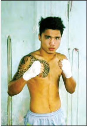
စိုးလပြည်