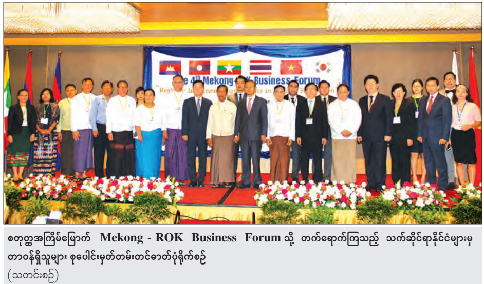
စတုတ္ထအကြိမ်မြောက် Mekong - ROK Business Forum သို့ တက်ရောက်ကြသည့် သက်ဆိုင်ရာနိုင်ငံများမှ တာဝန်ရှိသူများ စုပေါင်းမှတ်တမ်းတင်ဓာတ်ပုံရိုက်စဉ် (သတင်းစဉ်)