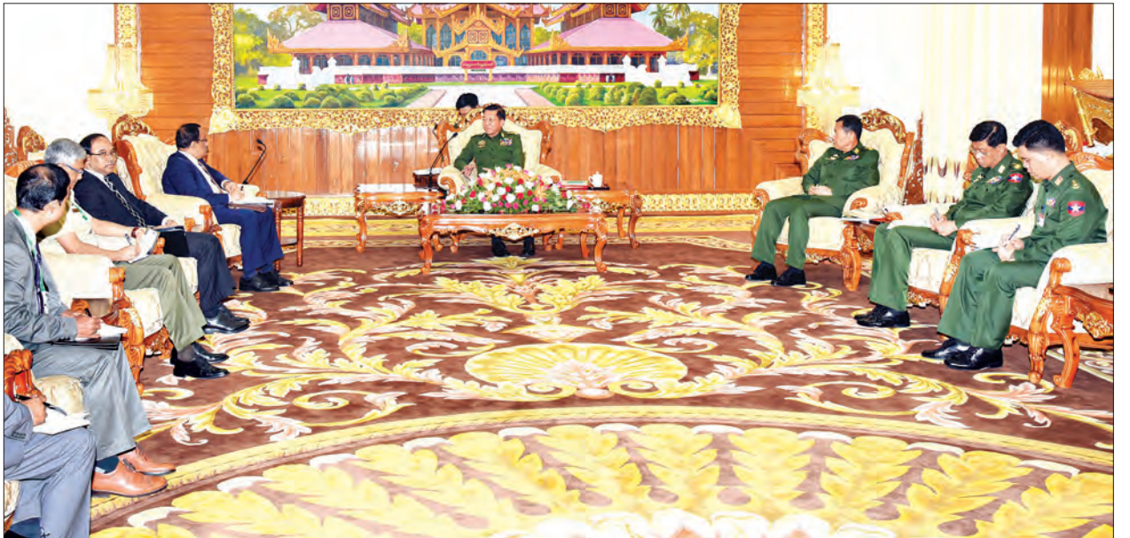
ဆက်လက်၍ နှစ်နိုင်ငံတပ်မတော် နှစ်ရပ်အကြား ဆက်ဆံရေးတိုးမြှင့်နိုင်ရေး၊ နယ်စပ်ဒေသလုံခြုံရေးနှင့် တည်ငြိမ်အေးချမ်းရေးအတွက် နှစ်ဖက်တပ်များနှင့် လုံခြုံထိန်းသိမ်းရသည့် အဖွဲ့အစည်းများ ပိုမိုထိတွေ့ ပူးပေါင်းဆောင်ရွက်နိုင်မည့် အခြေအနေများအား ဆွေးနွေးကြသည်။ (သတင်းစဉ်)

နှစ်ဖက်နိုင်ငံသားများ၊ သက်ဆိုင်ရာဌာန တာဝန်ရှိသူများအနေဖြင့်လည်း မိမိနိုင်ငံ သမိုင်းကြောင်းနှင့် အခြေအနေများကို သိရှိနားလည်ရန်လိုကြောင်း၊ တစ်ဦးနှင့် တစ်ဦးနားလည်မှုရှိပြီး ဖြစ်စဉ်အမှန်ကို လက်ခံနိုင်ရန်မှာ အရေးကြီးကြောင်း၊ နှစ်ဦးနှစ်ဖက်အပြုသဘောဆောင်သော လုပ်ဆောင်မှုများသည် နှစ်နိုင်ငံချစ်ကြည် ရင်းနှီးမှုအတွက် များစွာ အထောက်အကူရစေမည်ဟု ယုံကြည်ကြောင်း တပ်မတော်ကာကွယ်ရေးဦးစီးချုပ်က ဆက်လက်ပြောကြားသည်။