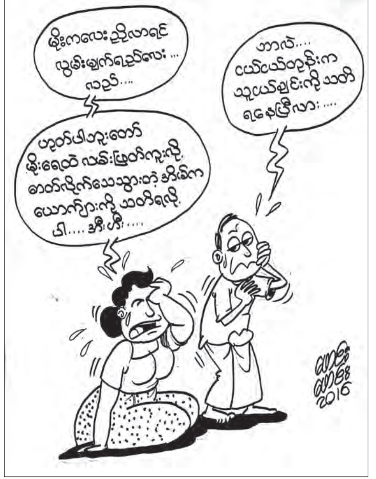
မိုးကလေး ညိုလာရင် လွမ်းချက်ရည်လေး... ဂသည်... တာလဲ... ငယ်ငယ်တုန်းက သူငယ်ချင်းကို သတိ ရစေဖို့လား... ယုတ်ပါယုတ်လောက် မိုးရေထဲ လမ်းဖြတ်ကူးလို့ ဓာတ်လျှောက်သေသွားတဲ့ ဒေါ်ခင်မာ ယောက်ျားကို သတိရလို့ ပါ... ဒါ... ဒါ... ဒါ... 2016