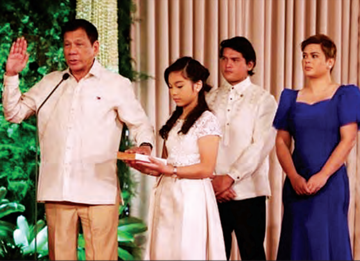
နှင့်ပြည်သူများ၏ ဘဝများပိုမိုကောင်းမွန်လုံခြုံကြောင်း ပြောခဲ့သည်။ စေရေး။ ကျန်းမာစေရေးဆောင်ရွက်ရမည်ဖြစ် (ဘီဘီစီ)

မေလက ရွေးကောက်ပွဲအနိုင်ရရှိပြီးနောက် ရီဒိုဂို ဇူးတုတ်သည် ဖိလစ်ပိုင် သမ္မတအဖြစ် ဇွန် ၃၀ ရက်တွင် ကျမ်းသစ္စာဆိုခဲ့သည်။ အသက် ၅၁ နှစ်အရွယ် ဒါတာအိုမြို့တော် ဝန်ထောက်အဖြစ် အကျင့်ပျက်ခြစားမှုနှင့် ရာဇဝတ်မှုများကို အပြတ်အသတ် နှိမ်နင်းမည်ဟု ကတိပြုပြီး နိုင်ငံရေးတည်ဆောက်မှုကို မြှင့်တင်မည်ဟု ၎င်း၏ ရာထူးအပ်နှင်းပွဲအခမ်းအနား မိန့်ခွန်းတွင် ကတိပေးပြောကြားခဲ့သည်။ “ဒီနိုင်ငံရဲ့ ခေါင်းဆောင်တွေအပေါ် ပြည်သူတွေရဲ့ ယုံကြည်မှု တစ်စတစ်စယုတ်လျော့လာတာကို တွေ့နေရတယ်” ဟု ၎င်းကပြောသည်။ တရားရေးစနစ်တွင်လည်း အမှန်တရားတိုက်စားခံနေရကြောင်း၊ ယုံကြည်မှုကိုတည်ဆောက်ယူပြီး ပြည်သူ့ဝန်ထမ်းများ၏ စွမ်းရည်