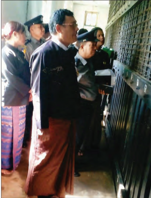
ပဲခူးတိုင်းဒေသကြီး တရားလွှတ်တော် တရားသူကြီးချုပ် ဦးမောင် မောင်ရွှေက တိုင်းဒေသကြီးအတွင်းရှိ အကျဉ်းထောင်များ၊ ရဲဘက်စခန်းနှင့် အချုပ်ခန်းများအား စစ်ဆေးရေးစီမံချက်အရ ဇွန် ၂၀ ရက်က ကျောက်တံခါးရဲစခန်း အချုပ်ခန်းအား ကြည့်ရှု စစ်ဆေးစဉ် သန့်စင် (ပဲခူး)

မြန်မာနိုင်ငံအနေဖြင့် ရာစုနှစ်၏ လေးပုံသုံးပုံလောက် ပြည်တွင်း ပဋိပက္ခများဖြင့် နှစ်စဉ်နေချိန်တွင် ကမ္ဘာကြီးက လျင်မြန်စွာတိုးတက် သွားခဲ့သည်။ ထို့ကြောင့်ပင် နိုင်ငံတော်၏အတိုင်ပင်ခံပုဂ္ဂိုလ်က နောက်မျိုး ဆက်များအတွက် ထားပစ်ခဲ့ရမည့် အကောင်းဆုံးအမွေမှာ ငြိမ်းချမ်းရေး ပင်ဖြစ်ကြောင်း ပြောကြားခဲ့သည်။ ငြိမ်းချမ်းမှု တိုးတက်နိုင်မည် မငြိမ်း ချမ်းသည့်နိုင်ငံ တိုးတက်သည်ဆိုသည်မှာ ဘယ်တုန်းကမှ မဖြစ်နိုင် ကြောင်း အလေးအနက် ပြောကြားသွားခဲ့ခြင်းဖြစ်ပေသည်။ ။