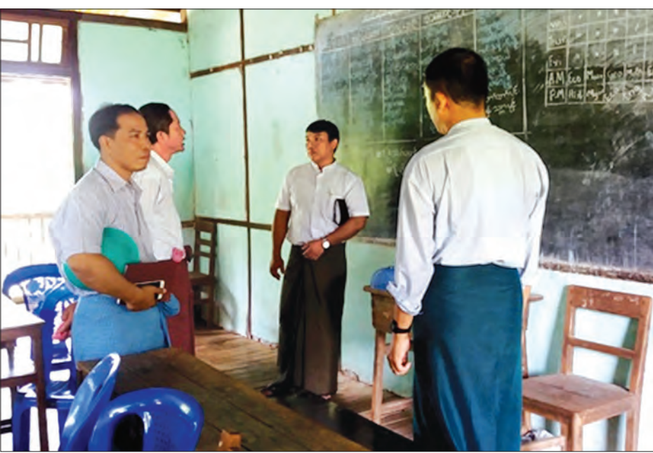
ညွှန်ကြားမှုတိုင်းဒေသကြီး ကျောင်းကို နေ့စဉ် စောင့်ကြည့်ခြင်းနှင့် ဖြစ်ပွားသည့် အကြောင်းရင်းကို ရှာဖွေသွားမည်ဖြစ် ဦးစီးဌာနမှူး ဒေါက်တာ မောင်မောင်ချစ် က ပြောသည်။ ဝင်းဗိုလ်(ပြန်/ဆက်)

ကျောင်းသန့်ရှင်းရေးအခြေအနေနှင့် နဝမတန်း၊ ဒသမတန်းတို့၏သောက်ရေ သန့်ရှင်းမှု ရှိ မရှိတို့ကို စစ်ဆေး၍ ဇွန် ၂၀ ရက်က အင်ပင်တိုက်နယ်ဆေးရုံတွင် တက်ရောက်ကုမူခံယူနေသော ကျောင်း သား ကျောင်းသူများ၏ ကျန်းမာရေး အခြေအနေကို ကြည့်ရှုစစ်ဆေးခဲ့ကြ ကြောင်း သိရှိရသည်။ မြန်အောင်မြို့နယ် အထကအင်ပင်မှ ကျောင်းသား ကျောင်းသူအချို့ မူးဝေမောပန်း ရင်ကျပ်ခြင်းဝေဒနာ ဖြစ်ပွားသည့် အကြောင်းရင်းကို သိပ္ပံနည်းကျ ဖော်ထုတ်ရာတွင် အထောက်အကူဖြစ် စေရန် အထကအင်ပင်မှ သောက်ရေနှင့် ရောဂါဝေဒနာခံစားရသော ကျောင်းသား ကျောင်းသူတို့၏ ဆီး၊ ဝမ်း နမူနာတို့ကို NHL(အမျိုးသား ကျန်းမာရေးဓာတ်ခွဲ ဌာန)သို့ပို့ဆောင်ပြီး စစ်ဆေးလျက်ရှိ ကြောင်းနှင့် မြို့နယ်ပြည်သူ့ကျန်းမာရေး ဦးစီးဌာနသည် တိုင်းဒေသကြီး အစား အစာနှင့်ဆေးဝါးဌာန၊ တိုင်းဒေသကြီး ပြည်သူ့ကျန်းမာရေး ဦးစီးဌာနတို့၏