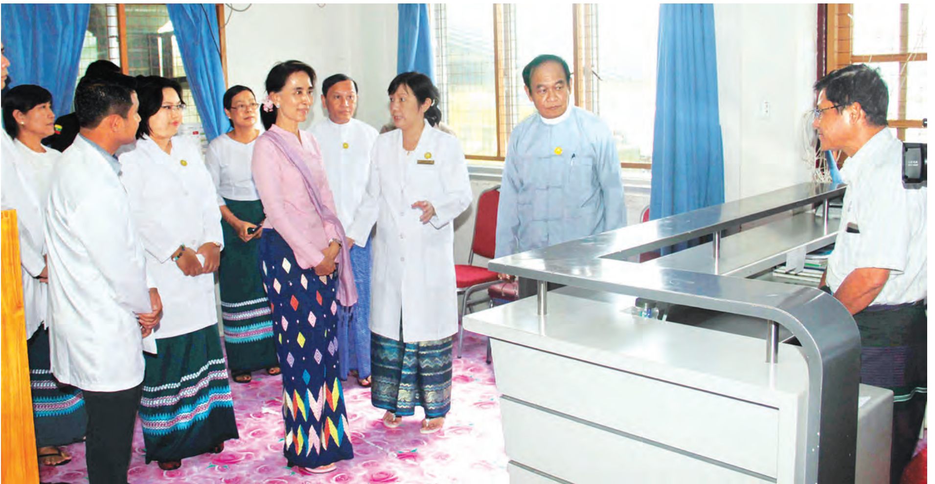
နိုင်ငံတော်၏ အတိုင်ပင်ခံပုဂ္ဂိုလ် ဒေါ်အောင်ဆန်းစုကြည် အားကစားသမားများအတွက် ကျန်းမာရေးစောင့်ရှောက်မှုဆောင်ရွက်လျက်ရှိသော Sports Medical Center နှင့် ကြည့်ရှုစစ်ဆေးစဉ်

နိုင်ငံတော်၏ အတိုင်ပင်ခံပုဂ္ဂိုလ် ဒေါ်အောင်ဆန်းစုကြည် နေပြည်တော်ရှိ အားကစားတက္ကသိုလ်နှင့် အားကစားလေ့ကျင့်ရေးစခန်းများအား ကြည့်ရှုစစ်ဆေး