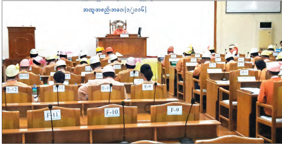
မန္တလေး ဇွန် ၃၀

ဒုတိယအကြိမ် မန္တလေးတိုင်းဒေသကြီး လွှတ်တော်အထူးအစည်းအဝေး ၁/၂၀၁၆ ကို ဇွန် ၃၀ ရက် နံနက်ပိုင်းက