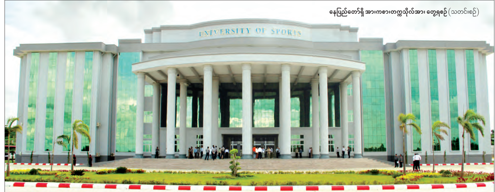
နေပြည်တော်ရှိ အားကစားတက္ကသိုလ်အား တွေ့ရစဉ် (သတင်းစဉ်)

ထို့နောက် နိုင်ငံတော်၏ အတိုင်ပင်ခံ ပုဂ္ဂိုလ်သည် အားကစားသမားများ အတွက် ကျန်းမာရေးစောင့်ရှောက်မှု ဆောင်ရွက်လျက်ရှိသော Sports Medical Center သို့ ရောက်ရှိပြီး ပြင်ပလူနာကုသရေးဌာန၊ Physiotherapy ဌာန၊ အကြောပြင်ဌာန၊ ကိုယ်ခန္ဓာ အချိုးအစားတိုင်းတာရေးဌာန၊ အဆုတ် နှင့်နှလုံးကြံ့ခိုင်မှုဆန်းစစ်ရေး ဌာနတို့၌ ခေတ်မီစက်ကိရိယာများဖြင့် အားကစား အထောက်အကူပြု စစ်ဆေးကုသမှုများ ကို ကြည့်ရှုစစ်ဆေးရာ အားကစားနှင့် ဆေးဘက်ဌာနခွဲ တာဝန်ခံညွှန်ကြားရေး မှူးက လိုက်လံရှင်းလင်းပြသသည်။ ဆက်လက်၍ နိုင်ငံတော်၏ အတိုင်ပင်ခံပုဂ္ဂိုလ်သည် နိုင်ငံတကာ အားကစားသမားများ လာရောက် ယှဉ်ပြိုင်ရာတွင် တည်းခိုနေထိုင်သည့် Cluster 5 အား သွားရောက်ကြည့်ရှု စစ်ဆေးခဲ့သည်။ (သတင်းစဉ်)