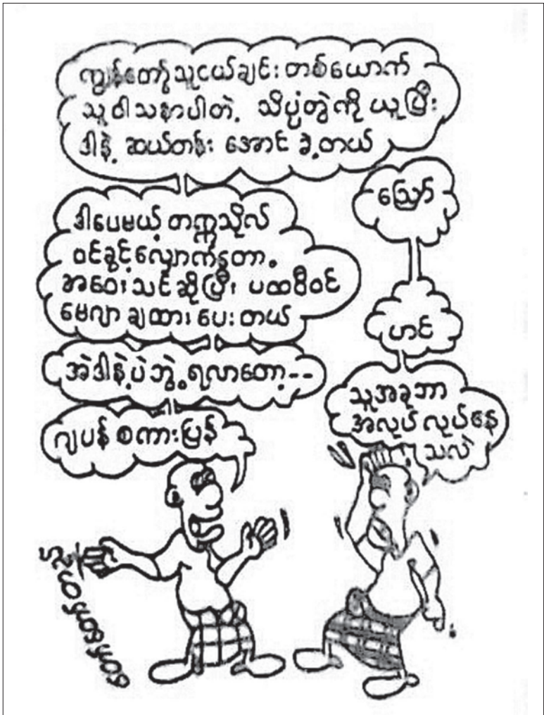
ထင်သန်သောပြုပြင်စရာ