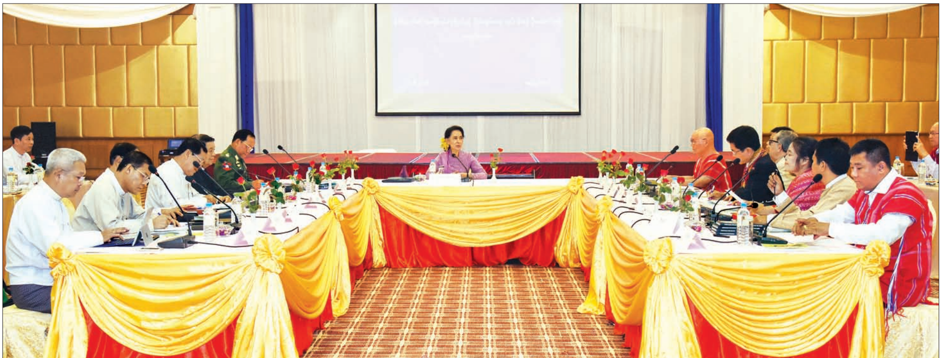
နိုင်ငံတော်၏အတိုင်ပင်ခံပုဂ္ဂိုလ် ဒေါ်အောင်ဆန်းစုကြည်နှင့် ငြိမ်းချမ်းရေးလုပ်ငန်းစဉ် ဦးဆောင်အဖွဲ့တို့ တွေ့ဆုံဆွေးနွေးစဉ်