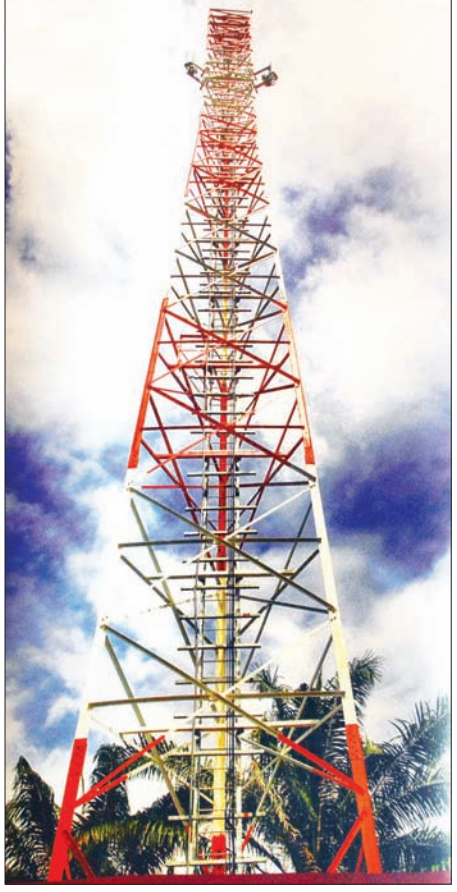
နိုင်ငံတစ်ဝန်းတည်ဆောက်မည့် အဆင့်မြင့်တာဝါတိုင်ပုံစံကို တွေ့ရစဉ်