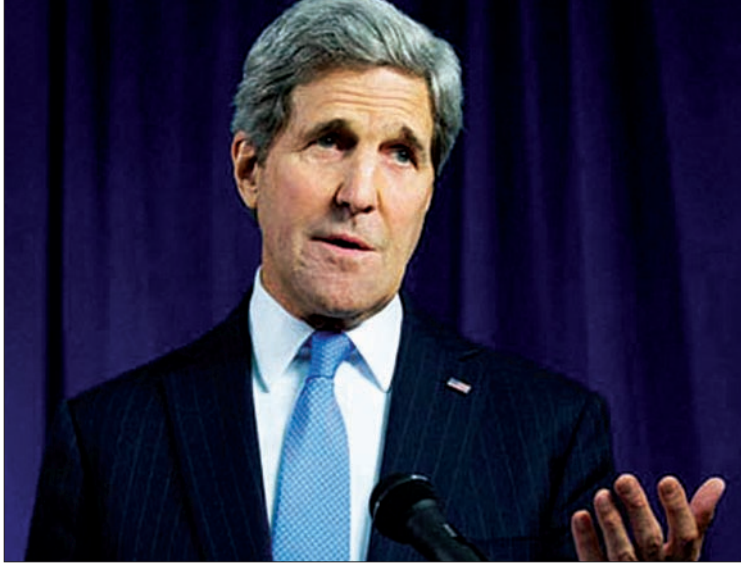
ဘရပ်ဆဲလ် ဇွန် ၂၈

ပြီတီအိုင် အီးယူအဖွဲ့ဝင် ဆန္ဒခံယူပွဲနှင့်စပ်လျဉ်း၍ ဥရောပအရာရှိများနှင့် တွေ့ဆုံဆွေးနွေးရန်နှင့် အမေရိကန်-အီးယူပူးပေါင်းမှုတွင် ဒေသတွင်းနှင့် ကမ္ဘာလုံးဆိုင်ရာအခက်အခဲများကို ဖြေရှင်းရန် အမေရိကန်နိုင်ငံခြားရေးဝန်ကြီး ဝှန်ကယ်ရီသည် တနင်္လာနေ့က ဘရပ်ဆဲလ်သို့ လာရောက်ခဲ့ သည်။