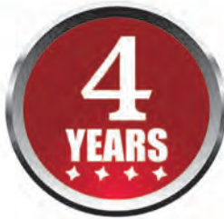
4 YEARS PERFORMANCE

အရည်အသွေးကောင်းမွန်သော ORIENT Professional ကို ကွန်ကရစ်၊ ပလတ်စတာနှင့် အင်္ဂါတေမျက်နှာပြင်များပေါ်တွင် အလှဆင်ရန်အတွက်အသုံးပြုနိုင်ပါသည်။