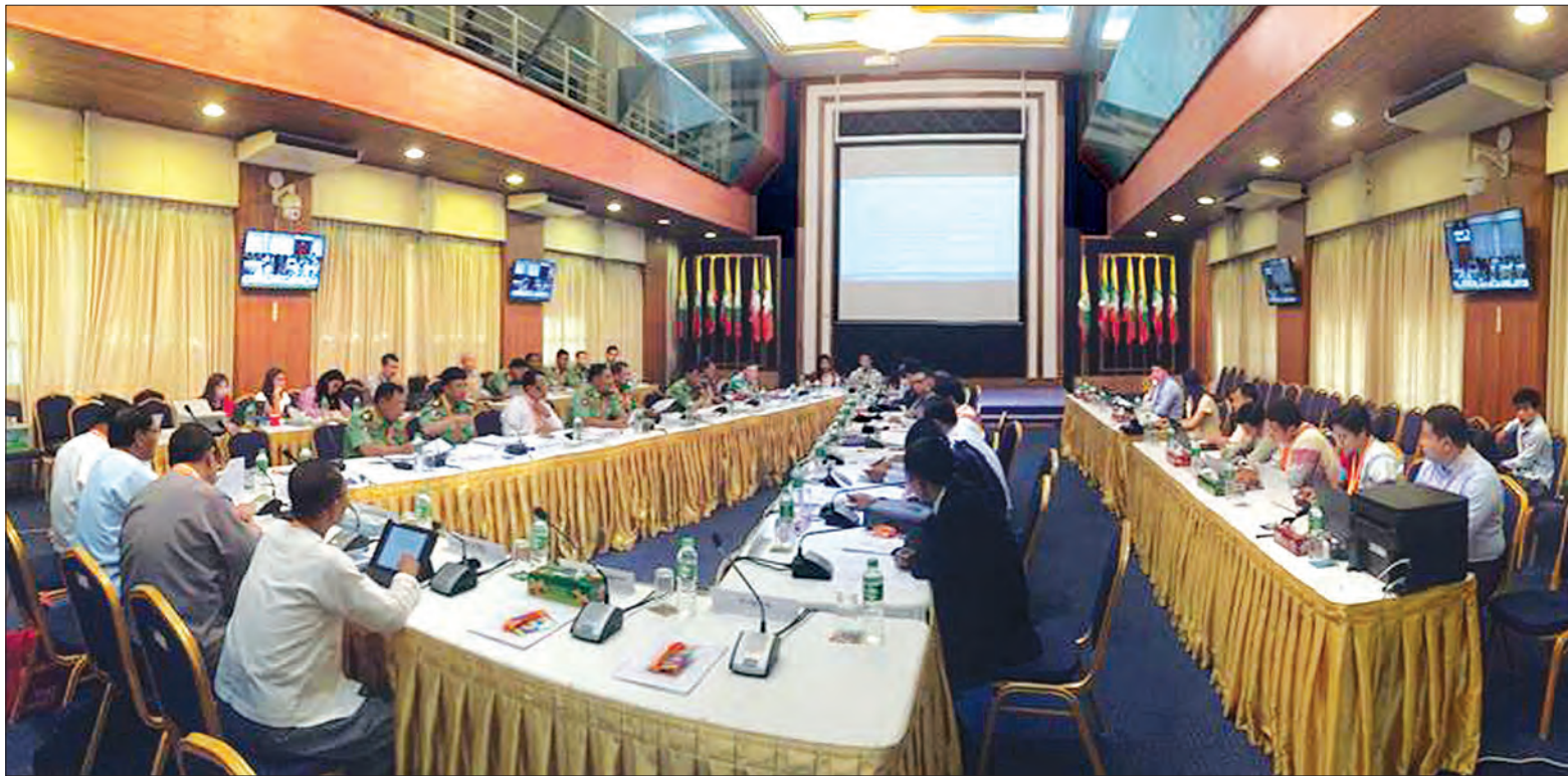
ပြည်ထောင်စုအဆင့် ပစ်ခတ်တိုက်ခိုက်မှုရပ်စဲရေး ပူးတွဲစောင့်ကြည့်ရေးကော်မတီ (JMC-U) ၏ ဆဋ္ဌမအကြိမ် အစည်းအဝေးကျင်းပစဉ်