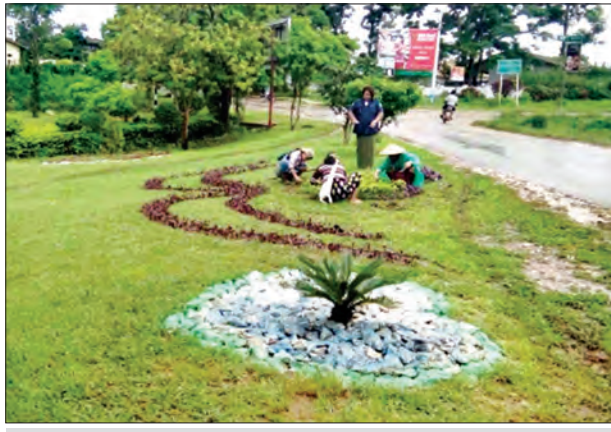
ရုန်းပြည်နယ်တောင်ပိုင်း လွိုင်လင်ခရိုင် လွိုင်လင်မြို့မြို့နယ်သားပန်းခြံရွှေ၌ မြို့နယ် စည်ပင်သာယာရေးဌာန ရက် ၁၀၀ စီမံချက်အရ မြို့သာယာရေးလုပ်ငန်းအဖြစ် မြေယာရှင်းအလှူ ဆောင်ရွက်နေမှုကို ဇွန် ၂၇ ရက်တွင် တာဝန်ခံအင်ဂျင်နီယာက ကြီးကြပ်ဆောင်ရွက်နေစဉ်