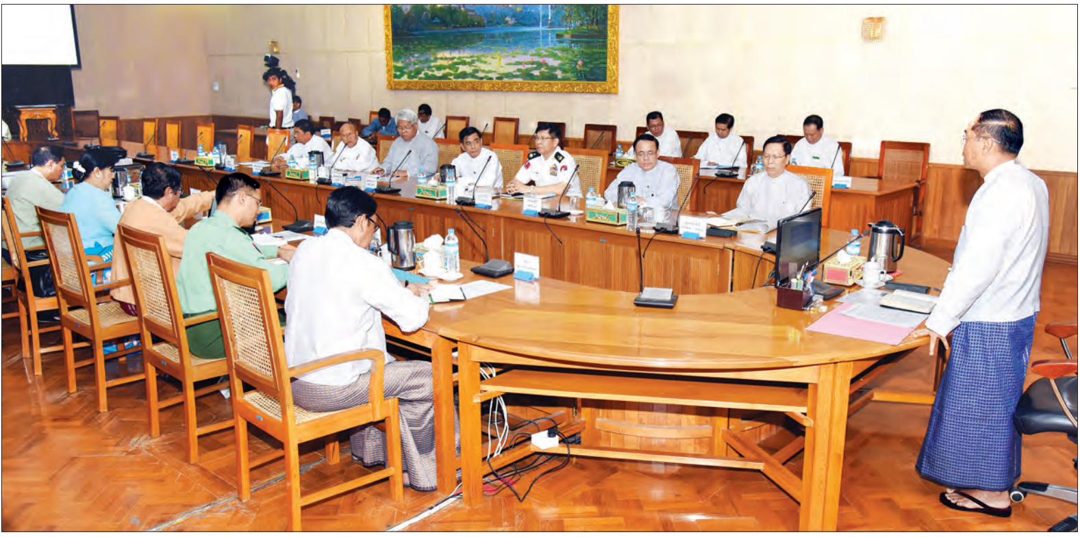
ဒုတိယသမ္မတ ဦးမြင့်ဆွေ ၂၀၁၆ ခုနှစ် (၆၉)နှစ်မြောက် အာဇာနည်နေ့အခမ်းအနား အောင်မြင်စွာကျင်းပနိုင်ရေး ညှိနှိုင်းအစည်းအဝေးတွင် အမှာစကားပြောကြားစဉ် (သတင်းစဉ်)

ဆက်လက်၍ ဒုတိယသမ္မတက (၆၉)နှစ်မြောက် အာဇာနည်နေ့ အခမ်းအနား အောင်မြင်စွာ ကျင်းပနိုင်ရေးအတွက် ဝန်ကြီးဌာနများနှင့် ကော်မတီများအလိုက် ဆောင်ရွက်သွားရမည့် စာမျက်နှာ ၃ ကော်လံ ၂ *