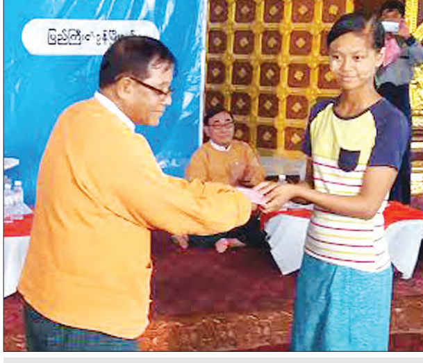
မန္တလေးတိုင်းဒေသကြီး အမျိုးသားမှတ်ပုံတင်နှင့် နိုင်ငံသားဌာနခွဲမှ ပြည်ကြီး တံခွန်မြို့နယ် ရပ်ကွက်/ကျေးရွာများပူးပေါင်း၍ ဇွန် ၂၇ရက်က ပြည်ကြီး တံခွန်မြို့နယ် မျိုးသိန်းမဗ္ဗာရုံ တံခွန်တိုင်းလေးမျက်နှာဘုရား၌ ရက် ၁၀၀ သစ္စာ စီမံချက်ဖြင့် တိုင်းရင်းသား ၄၂၇ ဦးအား နိုင်ငံသားစိစစ်ရေးကတ်ပြား အခမဲ့ ကွင်းဆင်းပြုလုပ်ပေးအပ်စဉ် အောင်ရဲသွင်

အမှတ်(၁)ယာဉ်ထိန်းရုံ ဒုတိယဦးစီး(နေပြည်တော်)မှ ပြည်ထောင်စုနယ်မြေ နေပြည်တော်အတွင်း ယာဉ်မတော်တဆမှုများ လျော့နည်းကျဆင်းရေးအတွက် ယာဉ်မောင်းများနှင့် ဆိုင်ကယ်စီးနင်းသူများကို ယာဉ်စည်းကမ်း၊ လမ်းစည်းကမ်း အသိပညာပေးဟောပြောဆောင်ရွက်မှုအား ဇွန် ၂၇ ရက်က ဥက္ကဋ္ဌသီရိမြို့နယ် မင်းကုန်း အုတ်စက်လမ်းဆုံ၊ ဒက္ခိဏသီရိမြို့နယ် ကံကော်ပန်းအပိုင်းနှင့် ပျဉ်းမနားမြို့နယ် ဘောဂသီရိကားကွင်းများတွင် ဟောပြောဆောင်ရွက်ကြသည်။ ယာဉ်ထိန်းရုံအရာရှိများက တာဝန်ကျရာ ဌာနများတွင်ဟောပြောရာ အပြည်ပြည် ဆိုင်ရာ ယာဉ်ထိန်းသိမ်းခြင်းနည်းစနစ်ငါးမျိုး၊ ခြေကျင်လမ်းလျှောက်သူ၊ အနေးယာဉ်၊ မော်တော်ယာဉ်၊ မော်တော်ဆိုင်ကယ်စီးနင်းသူများ လိုက်နာရန်စည်းကမ်းချက်များ၊ လမ်းညွှန်ဆေးရေးအမှတ်သားများ၊ မီးပွိုင့်နှင့်အပိုင်းတွင် လိုက်နာရမည့်စည်းကမ်းချက် များ၊ ယာဉ်အန္တရာယ်၊ လမ်းအန္တရာယ်ကင်းရှင်းရေး အမှားအမှန်သရုပ်ပြပုံများ၊ မော်တော်ယာဉ်ဥပဒေ၊ နည်းဥပဒေနှင့် ပြစ်မှုဆိုင်ရာဥပဒေများကို အသေးစိတ် ချပြ ရှင်းလင်းဆွေးနွေးဟောပြောခဲ့ပြီး ယာဉ်စည်းကမ်း၊ လမ်းစည်းကမ်း အသိပညာပေး လက်ကမ်းစာစောင် ၆၅ စောင်အား ဝေငှခဲ့သည်။ (သတင်းစဉ်)