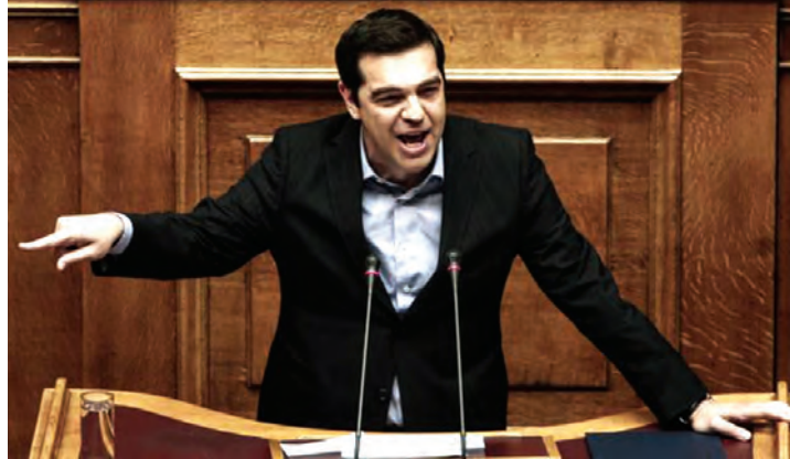
လက်ဝဲသမား ဂရိဝန်ကြီးချုပ် Alexis Tsipras

မွန်းကျပ်နေတော့တာပါပဲ” လို့ သူ့ရဲ့ ထင်မြင်ယူဆ ချက်တွေကို ပြောပြပါတယ်။ ဒါပေမယ့် ဒီအချက်တွေဟာ သာမန်ကြုံတွေ့ နေရတဲ့ အကျပ်အတည်းအခက်အခဲတွေပါပဲ။ ဂရိအစိုးရအပါအဝင် ဂရိပြည်သူအများစုကတော့ အီးယူရဲ့အဖွဲ့ဝင် နိုင်ငံတစ်နိုင်ငံဖြစ်နေတာကို နှစ်သက်ဆဲပါ။ ပြိတိန်အီးယူကနေ လျင်လျင်မြန် မြန်ကြီးထွက်ခွာဖို့ ဆုံးဖြတ်လိုက်ခြင်းဟာ ဂရိနိုင်ငံ အနေနဲ့ ဥရောပဇန်ကနေ ခွဲထွက်ဖို့ဆိုတဲ့ အချက်ကို ဆက်လက်တည်ရှိစေပါတယ်။ ပြိတိန်မှာ လူထုဆန္ဒခံယူပွဲကျင်းပပြီး ရလဒ်များကို သောကြာနေ့က ကြေညာခဲ့အပြီးမှာတော့ ကမ္ဘာ တစ်ဝန်းလုံးမှာရှိတဲ့ စတော့ဈေးကွက်တွေ တစ်ဟုန် ထိုးကျဆင်းသွားသလို ပေါင်တန်ဖိုးဟာလည်း ကျဆင်းသွားပါတယ်။ အေသင်မြို့က စတော့ အိတ်ချိန်းကိုလည်း ရိုက်ခတ်လာပါတယ်။ နိုင်ငံ ခြားရင်းနှီးမြှုပ်နှံသူအချို့ဟာလည်း ထိခိုက်မှုများ နိုင်တယ်လို့ ယူဆရတဲ့။ ဂရိနိုင်ငံမှာရှိတဲ့ သူတို့ရဲ့