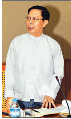
ပြည်ထောင်စုဝန်ကြီး သူရဦးအောင်ကို

ကော်မတီဥက္ကဋ္ဌ ပြည်ထဲရေးဝန်ကြီးဌာန ဒုတိယ ဝန်ကြီး ဗိုလ်ချုပ်အောင်စိုးက လုံခြုံရေးဆိုင်ရာ အစီ အမံများကိုလည်းကောင်း၊ နိုင်ငံခြားရေးဝန်ကြီး ဌာန ဒုတိယဝန်ကြီး ဦးကျော်တင်က သံတမန်များနှင့် ကုလသမဂ္ဂ လက်အောက်ခံ အဖွဲ့အစည်းများထံ ဖိတ်ကြားရေးဆိုင်ရာ ကိစ္စရပ်များကိုလည်းကောင်း ရှင်းလင်းတင်ပြကြသည်။ ဆက်လက်၍ သာသနာရေးနှင့် ယဉ်ကျေးမှု ဝန်ကြီးဌာန၊ ပညာရေးဝန်ကြီးဌာနနှင့် ပြန်ကြားရေး ဝန်ကြီးဌာနတို့မှ တာဝန်ရှိသူများက ဝန်ကြီးဌာန အလိုက် ဆောင်ရွက်သွားမည့် အစီအမံများကို ရှင်းလင်းတင်ပြကြသည်။ ထို့နောက် အစည်းအဝေးသို့ တက်ရောက်လာ ကြသူများက အထွေထွေကိစ္စရပ်များကို ဆွေးနွေး ကြပြီး ဒုတိယသမ္မတက လိုအပ်သည်များကို ဖြည့်စွက်ဆွေးနွေး မှာကြားသည်။ (သတင်းစဉ်)