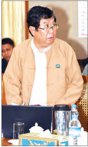
ရန်ကုန်မြို့တော်ဝန် ဦးမောင်မောင်စိုး

* ရှေ့မှ လုပ်ငန်းပိုင်းဆိုင်ရာများနှင့်စပ်လျဉ်း၍ ဆွေးနွေး ပြောကြားသည်။ ယင်းနောက် (၆၉)နှစ်မြောက် အာဇာနည်နေ့ အခမ်းအနားကျင်းပရေး ဗဟိုကော်မတီဥက္ကဋ္ဌ သာသနာရေးနှင့် ယဉ်ကျေးမှုဝန်ကြီးဌာန ပြည်ထောင်စုဝန်ကြီး သူရဦးအောင်ကို အာဇာ နည်နေ့အခမ်းအနား အောင်မြင်စွာ ကျင်းပရေး အတွက် ကော်မတီများဖွဲ့စည်းခြင်းနှင့် ကြိုတင် ပြင်ဆင်ဆောင်ရွက်ထားသည့် လုပ်ငန်းကိစ္စများကို ရှင်းလင်းတင်ပြသည်။ ထို့နောက် (၆၉)နှစ်မြောက် အာဇာနည်နေ့ အခမ်းအနားကျင်းပရေး လုပ်ငန်းကော်မတီ ဥက္ကဋ္ဌကိုယ်စား အတွင်းရေးမှူး ရန်ကုန်မြို့တော်ဝန် ဦးမောင်မောင်စိုးက လုပ်ငန်းကော်မတီနှင့် ဆပ် ကော်မတီများအလိုက် ဆောင်ရွက်သွားမည့် အစီ အမံများနှင့် စပ်လျဉ်း၍လည်းကောင်း၊ လုံခြုံရေး