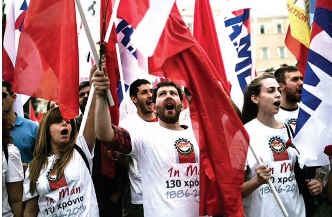
အလုပ်နေရာများနှင့် သက်သာချောင်ချိရေး ရန်ပုံငွေများ ဖြတ်တောက်ခံရသည့်အတွက် ဂရိအလုပ်သမားသမဂ္ဂမှ စုဝေးဆန္ဒပြစဉ်

ဂရိနိုင်ငံဟာ ရှေ့တန်းကနေပါဝင်ခဲ့ရပြန်ပါတယ်။ တစ်ဆင့်လျှောက် အီးယူအဖွဲ့ဝင်နိုင်ငံတွေက ဒုက္ခ သည် ပြဿနာမှာ ဂရိကို စိတ်ပျက်စေခဲ့ပါတယ်။ လွန်ခဲ့တဲ့ ၁၈ လအတွင်း ဂရိကမ်းခြေကို ရောက် လာတဲ့ ဒုက္ခသည်တစ်သန်းကျော်ရဲ့အရေးကို ဖြေရှင်းနိုင်ဖို့ ဂရိအစိုးရဟာ ရုန်းကန်မှုတွေအများ ကြီး လုပ်ခဲ့ရပါတယ်။ ဒါနဲ့ပတ်သက်ပြီးတော့လည်း ဂရိဟာ အီးယူကို အခဲမကျေပါဘူး။ ယခုလအတွင်း ပြူး သုတေသနစင်တာရဲ့ ဥရောပတစ်ခွင်လုံး စစ်တမ်းကောက်ယူချက်