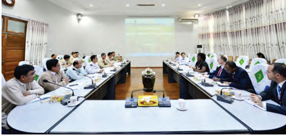
နေပြည်တော် ဇွန် ၂၃ စိုက်ပျိုးရေးကဏ္ဍ အထောက် အကူပြုစီမံကိန်းအရ မြန်မာနိုင်ငံ၏