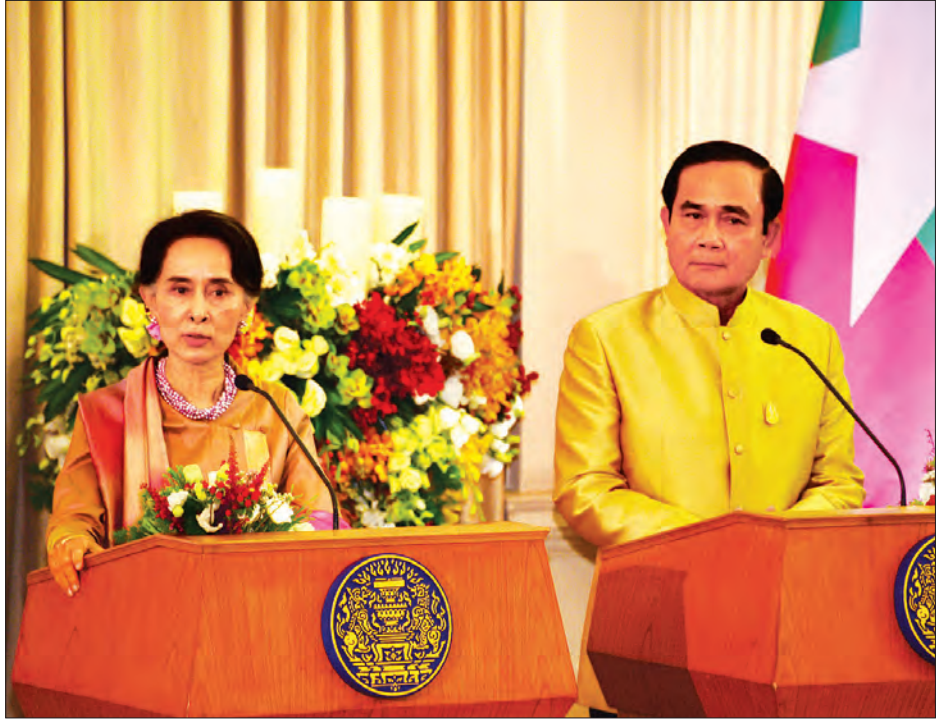
နိုင်ငံတော်၏ အတိုင်ပင်ခံပုဂ္ဂိုလ် ဒေါ်အောင်ဆန်းစုကြည်နှင့် ထိုင်းနိုင်ငံဝန်ကြီးချုပ် ဝိုလ်ချုပ်ကြီး ပရာယုဒ် ချန်အိုချာ (ငြိမ်း)တို့ ပူးတွဲသတင်းစာရှင်းလင်းပွဲတစ်ရပ် ပြုလုပ်စဉ် (သတင်းစဉ်)

အချင်းချင်း ပူးပေါင်းဆောင်ရွက်သွား မည်ဖြစ်ကြောင်း၊ ၎င်းတို့၏ နေရပ်တွင် အလုပ်အကိုင်အခွင့်အလမ်းများ၊ လူမှု ရေး၊ ကျန်းမာရေးအခြေအနေများကို ဖော်ထုတ်ပေးပြီးသည့်အချိန်တွင် ပြန် လည်ပို့ဆောင်ရေးလုပ်ငန်းများကို စတင် သွားမည်ဖြစ်ကြောင်း၊ နယ်စပ်ကုန် သွယ်ရေးအပါအဝင် နှစ်နိုင်ငံကုန်သွယ် ရေး ဖွံ့ဖြိုးတိုးတက်ရန်အတွက် အစိုးရ ချင်းသာမက အခြေခံလူမှုအဖွဲ့အစည်း များအနေဖြင့်လည်း ပူးပေါင်းဆောင် ရွက်သွားမည်ဖြစ်ကြောင်း ပြန်လည် ပြောကြားသည်။