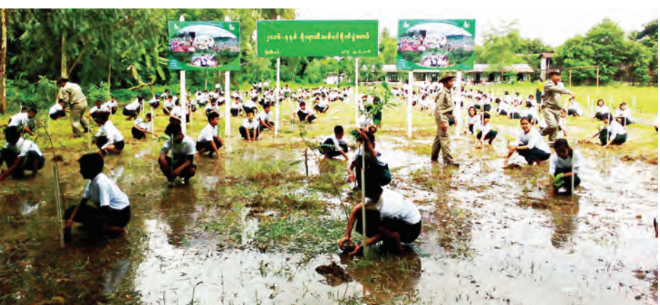
ပဲခူးတိုင်းဒေသကြီး တောင်ငူခရိုင် ဖြူးမြို့နယ် အမှတ် (၂) အခြေခံပညာအထက်တန်းကျောင်းဝင်းတွင် ဇွန် ၂၃ ရက်က ကျွန်းအပါအဝင် အခြားသစ်မာယိုးပင် ၅၀၀ ကို ကျောင်းသား ကျောင်းသူများ စုပေါင်းစိုက်ပျိုးခဲ့ကြစဉ်။

မုဒုံ ဇွန် ၂၃ မွန်ပြည်နယ် မုဒုံမြို့အမှတ် (၂) အခြေခံ ပညာ အထက်တန်းကျောင်းခန်းမ၌ ယာဉ်စည်းကမ်း၊ လမ်းစည်းကမ်းနှင့် မူးယစ်ဆေးဝါးဆိုင်ရာ အသိပညာပေး ဟောပြောပွဲကို ဇွန် ၂၁ ရက်က ကျင်းပ သည်။