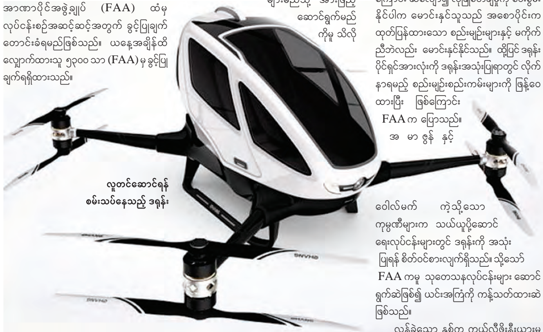
လူတင်ဆောင်ရန် စမ်းသပ်နေသည့် ဒရုန်း

အကယ်၍ တောင်းဆိုချက်မှာ ကျိုး ကြောင်း ဆီလျော်၍ လုံခြုံစိတ်ချမှုကို ပေးစွမ်း နိုင်ပါက မောင်းနှင်သူသည် အစောပိုင်းက ထုတ်ပြန်ထားသော စည်းမျဉ်းများနှင့် မကိုက် ညီဘဲလည်း မောင်းနှင်နိုင်သည်။ ထို့ပြင် ဒရုန်း ပိုင်ရှင်အားလုံးကို ဒရုန်းအသုံးပြုရာတွင် လိုက် နာရမည့် စည်းမျဉ်းစည်းကမ်းများကို ဖြန့်ဝေ ထားပြီး ဖြစ်ကြောင်း FAA က ပြောသည်။ အ မာ ဇွန် နှင့်