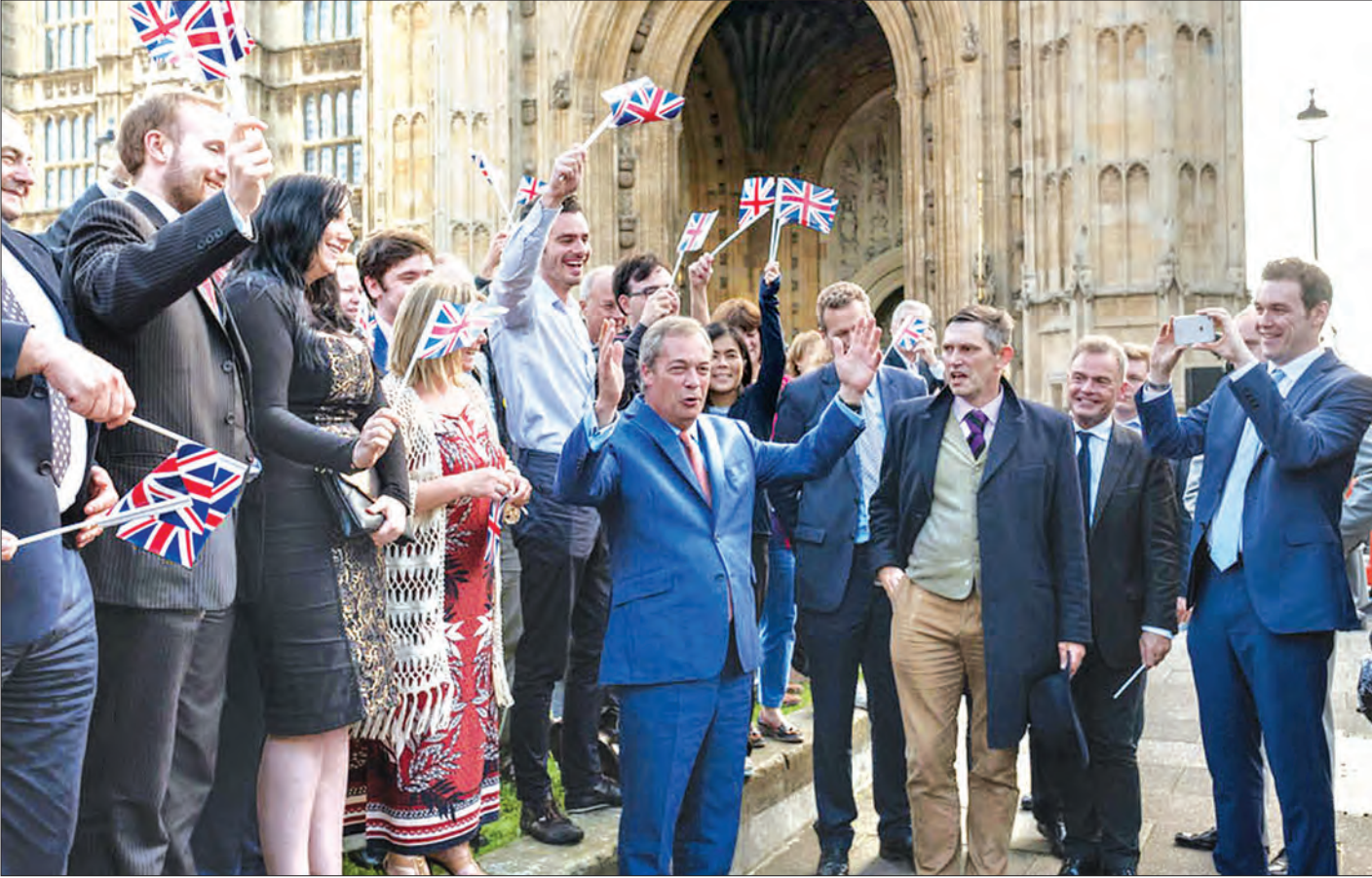
အီးယူမှ ပြိတိန်ခွဲထွက်ရေး အဓိကထောက်ခံခဲ့သော လွတ်လပ်ရေးပါတီ (Independence Party) မှ ခေါင်းဆောင်ဖြစ်သူ နိုင်ဂျယ်ဇရက်ဂျီ(အလယ်)ကို ထောက်ခံသူများနှင့်အတူ တွေ့ရစဉ်